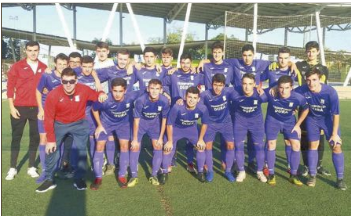
Alineación del Castalla Juvenil, temporada 2019-2020

I l'assumpte no era gens fàcil, ja que més enllà de l'aleatòria sort substancial a qualsevol competició, sabem que per vèncer també hi cal una exitosa dosificació de treballs planificats molt diversos: disciplina, tàctica, potència física, estratègies de pisarra, riscos, entrenaments individuals, visió grupal, gestió d'emocions i empatia... i d'afegit tot allò extradeportiu que sovint