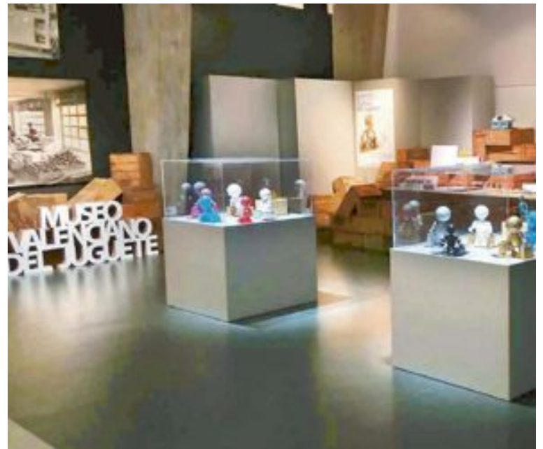
Museo del Juguete