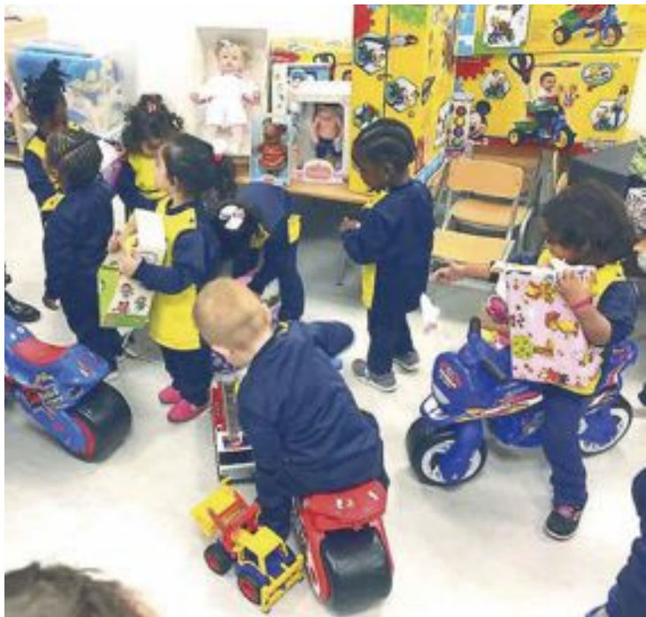
En esta edición, los juguetes se repartirán en España, Jordania, Ecuador, Marruecos, Honduras, Paraguay, El Salvador, Nicaragua y Perú