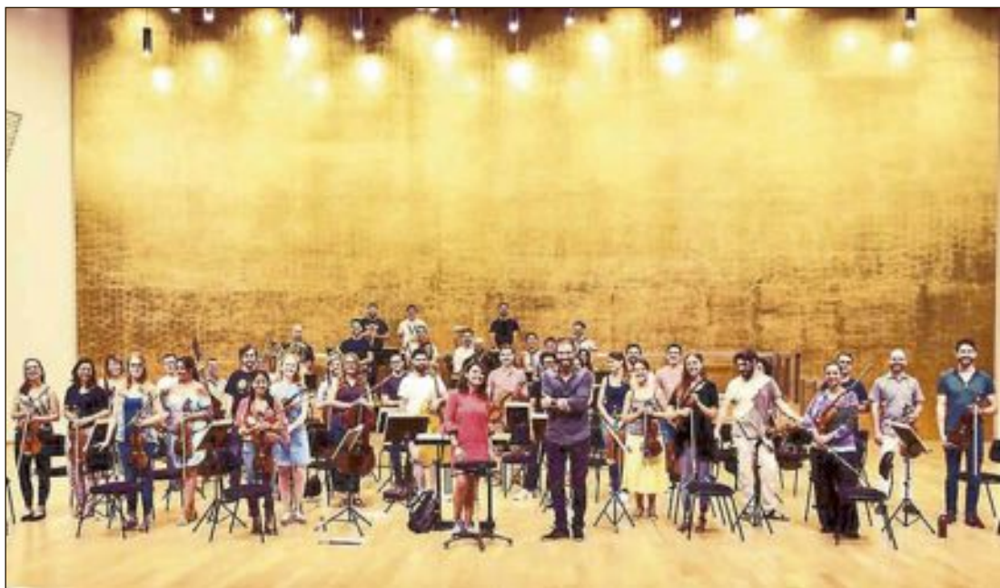
Desde la dirección del auditorio se han iniciado los preparativos para posibilitar que ADDA-Sinfónica pueda comenzar la actividad presencial, previsiblemente en junio

Desde la dirección del auditorio se han iniciado los preparativos para posibilitar que ADDA-Sinfónica pueda comenzar la actividad presencial con un ciclo pionero adaptado a la situación que garantice todas las medidas de protección para el público y los músicos. Previsiblemente en junio se abrirá el aforo a un tercio de la capacidad. Los conciertos serán gratuitos, con entradas numeradas.