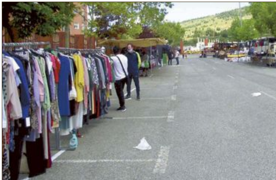
Los comerciantes destacan la comodidad a la hora de montar y desmontar los puestos