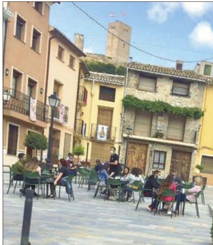
El Ayuntamiento anuncia que cada caso se abordará y se estudiará de manera particular y la ampliación se autorizará tras un previo estudio

La ampliación de la superficie se autorizará tras un previo estudio en cada caso concreto de la viabilidad por los servicios técnicos municipales y Policía Local. De esta forma, se permite a los hosteleros recuperar el número de mesas que podían instalar en el espacio público, antes de que se decretase una distancia de dos