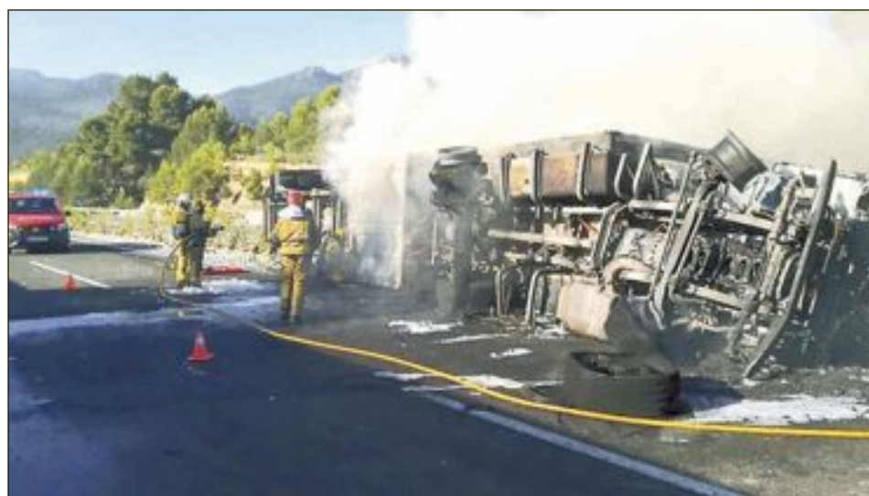
El camión, que transportaba hortalizas, volcó sin implicar a ningún otro vehículo