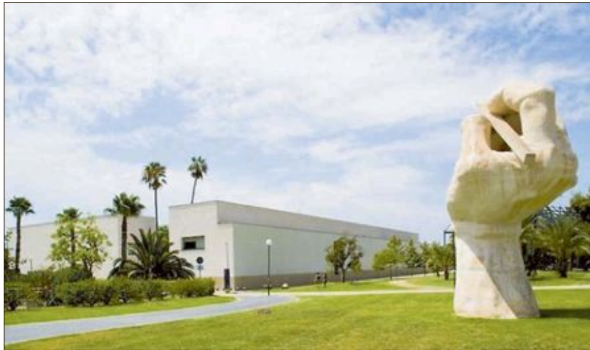
Instalaciones de la Universidad de Alicante

Sin embargo, la oposición no dejó de expresar su extrañeza y hasta sorpresa por esta moción,