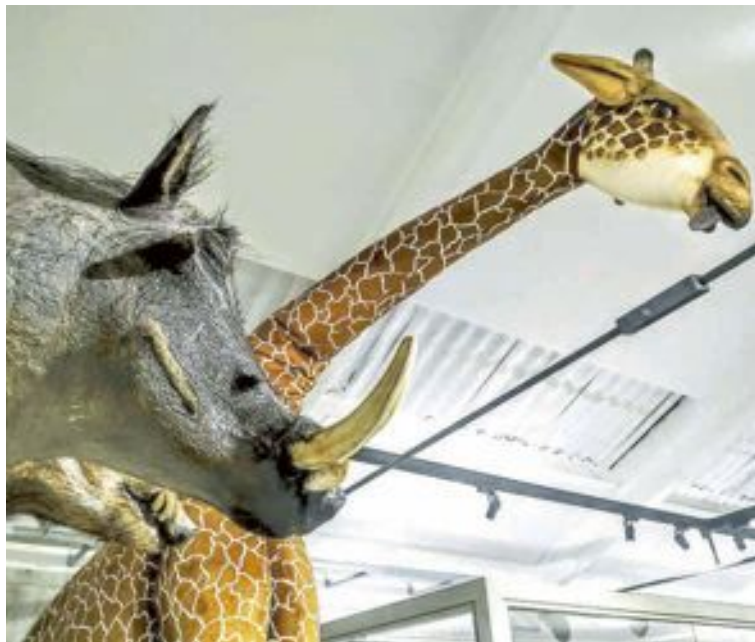
Museo de la Biodiversidad