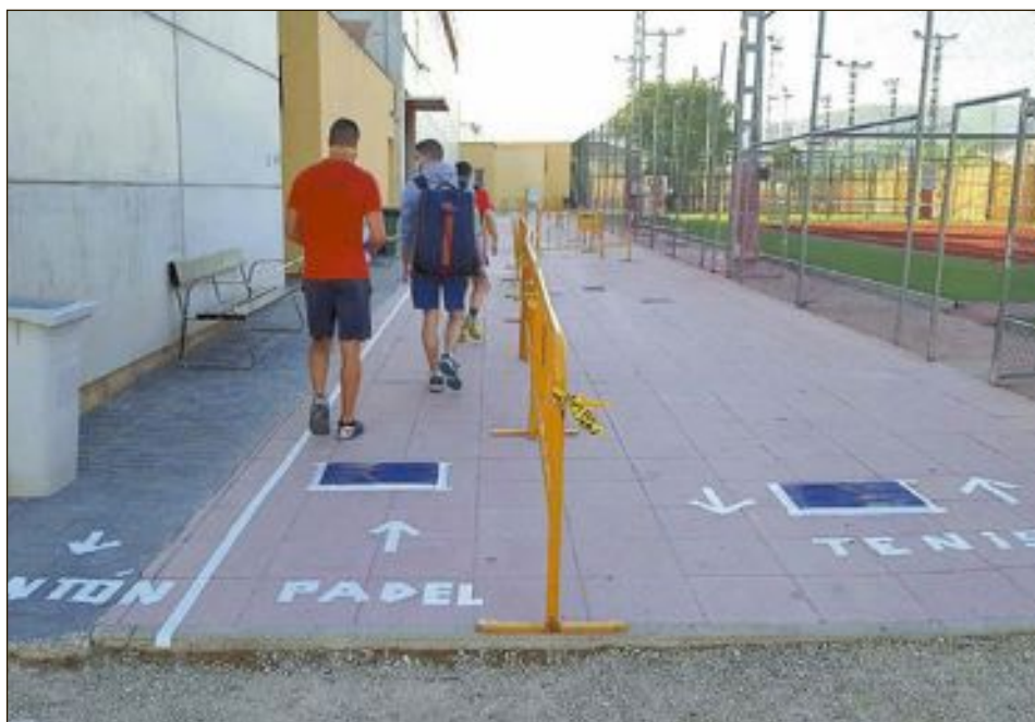
Els usuaris han de passar per una sèrie de mesures de protecció