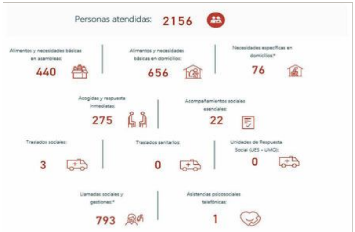
Gráfico de las atenciones llevadas a cabo por la asamblea local de Cruz Roja hasta el momento

Para realizar tareas administrativas, como renovar recetas, recoger analíticas o partes de confirmación, llamar al centro de salud, el personal resolverá estos trámites. No es necesario desplazarse personalmente.