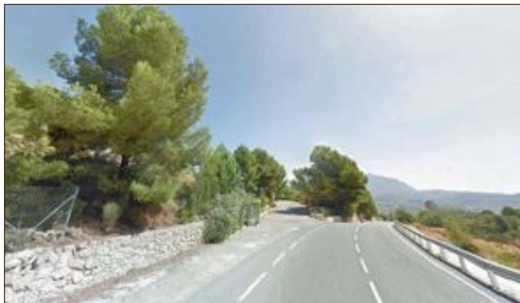
Acceso a la urbanización Pinares de Meclí

Del juzgado de lo Contencioso nº 3 de Alicante