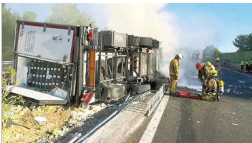
Actuaron efectivos de los parques de bomberos de Ibi y San Vicente

De hecho, ya han llegado a los departamentos municipales algunas peticiones para la ampliación de las terrazas.