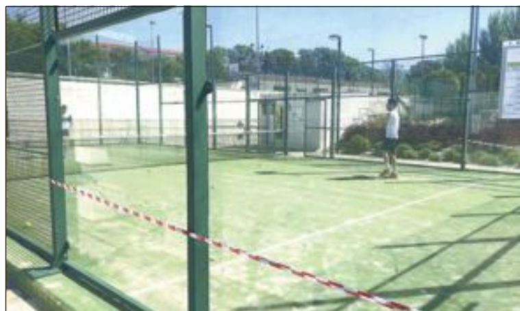
Dos jugadores practican pádel en una de las pistas del polideportivo

Envía la información de tu equipo, club o logros deportivos personales a: deportes@escaparedigital.com