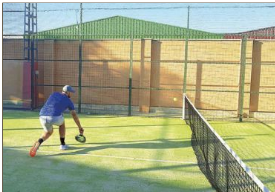
Les zones d'esport de raqueta són les primeres a recuperar la normalitat