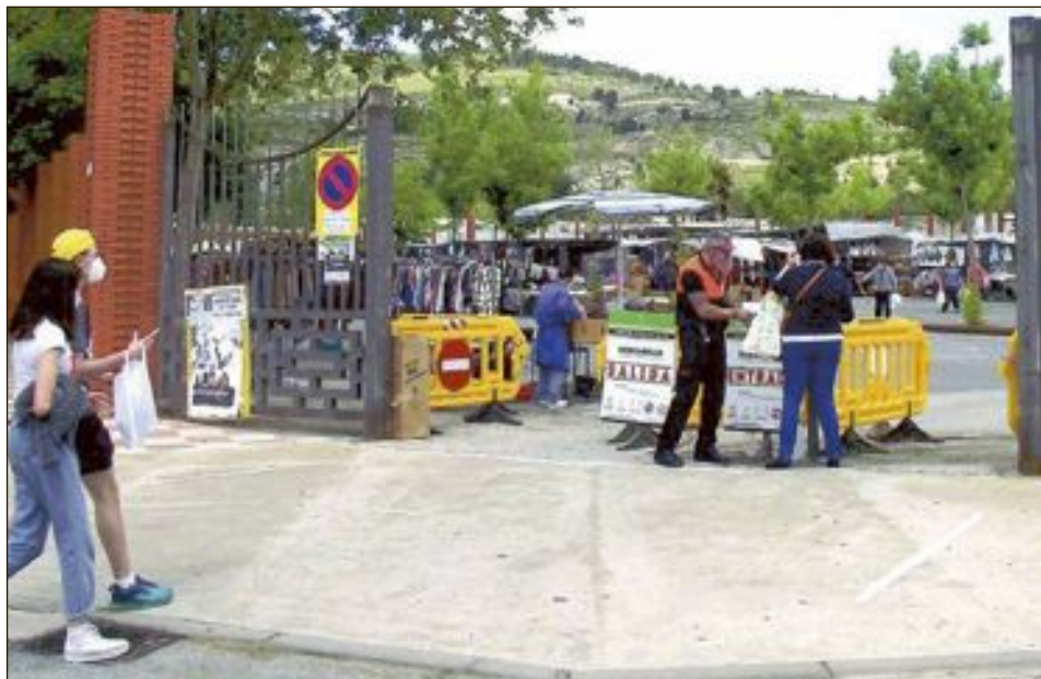
Una de las entradas al mercadillo, donde el cliente debe ponerse gel y guantes