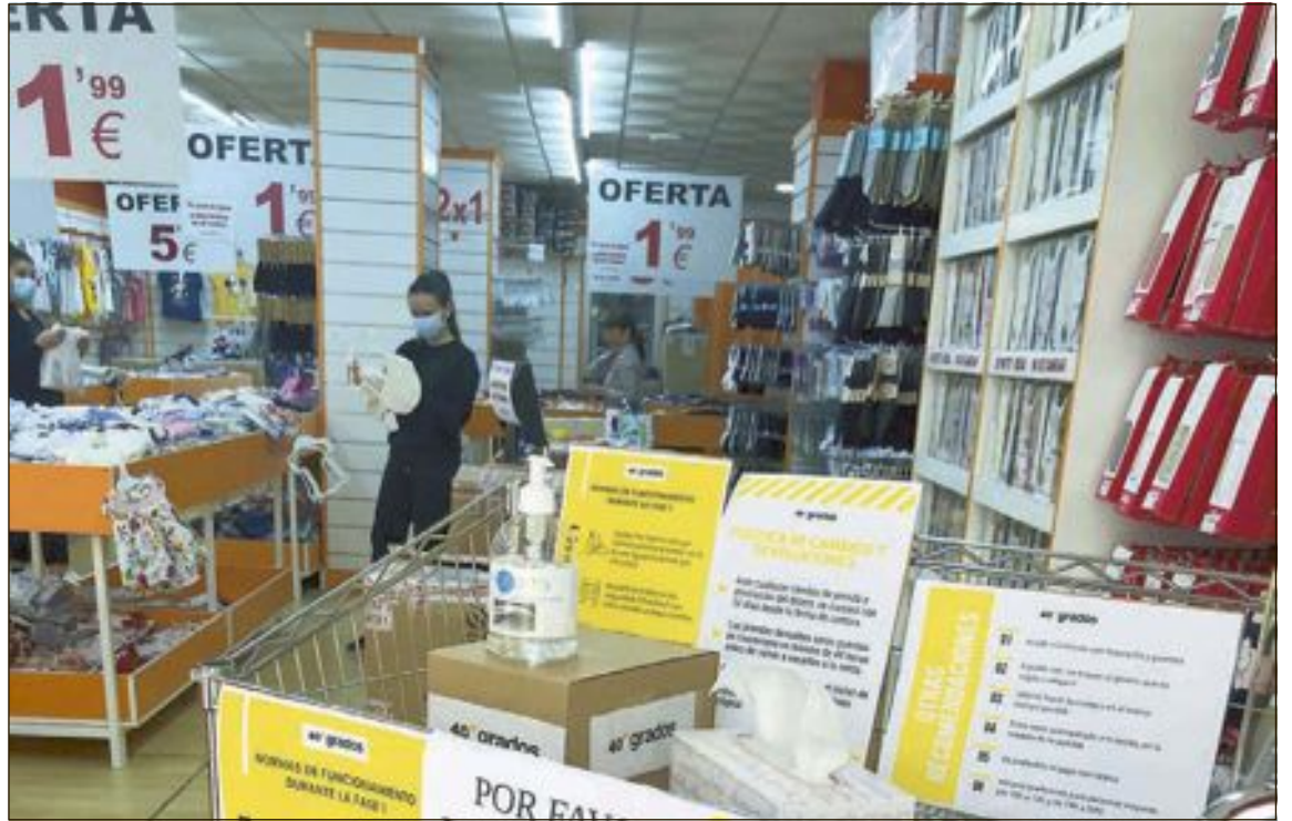
Se tendrá en cuenta el padrón municipal para que todas las familias puedan beneficiarse de esta ayuda directa