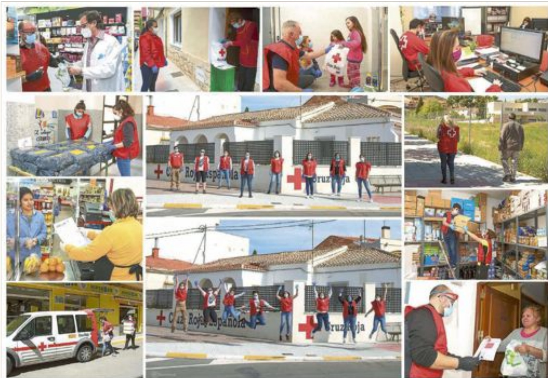
REPORTAJE: MANOLO FOTÓGRAFOS

¿Quieres colaborar con tu asamblea local?