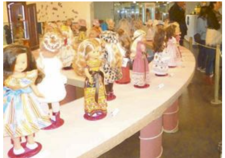
Museo de la Muñeca

Por su parte, el Museo de la Muñeca de Onil ya propuso hace un mes rendir un pequeño homenaje a todos los artesanos y profesionales del sector de la muñeca, apotando fotografías relacionadas con este sector, para que pasen a formar parte del archivo del Museo y realizar una futura exposición gráfica.