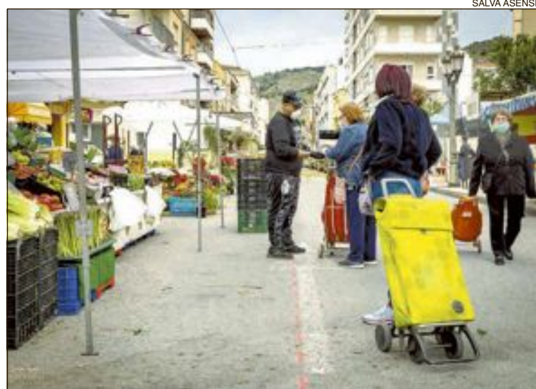
El mercado ambulante se instaló en la calle Constitución, frente al polideportivo

El papel de los agentes, en las circunstancias actuales, se torna más relevante y complejo si cabe, dada la cercanía y proximidad con los ciudadanos.