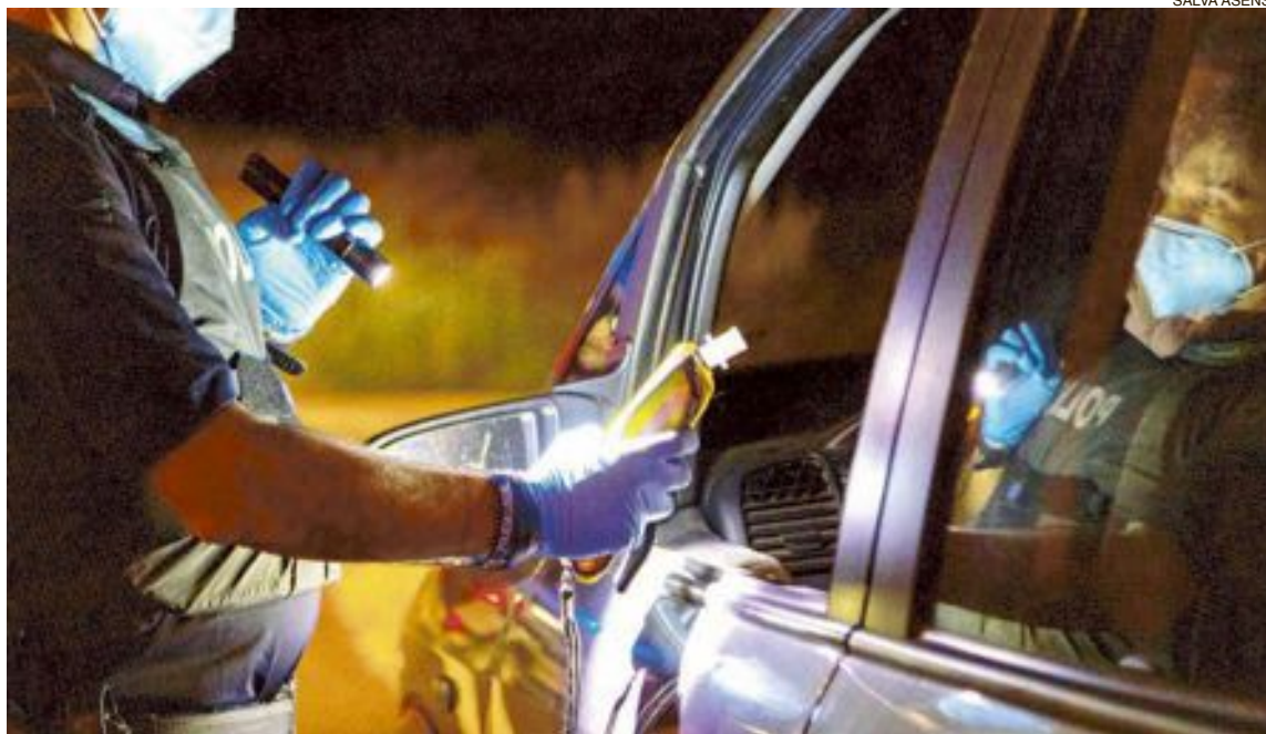
Un agente de la Policía Local de Onil realizar la prueba de alcohemia a un conductor

Por este motivo, los agentes van a incrementar el control de los accesos al casco urbano y la movilidad dentro de este, así como los horarios de salida a la calle de niños y adultos. También se vigilará los aforos de las terrazas y el uso de la mascarilla en los lugares que sea de obligado uso.