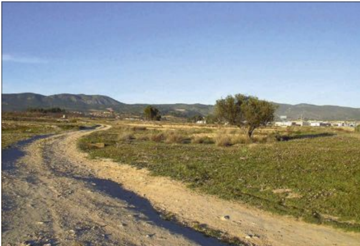
La nueva área industrial tiene una superficie total de 1.086.000 metros cuadrados