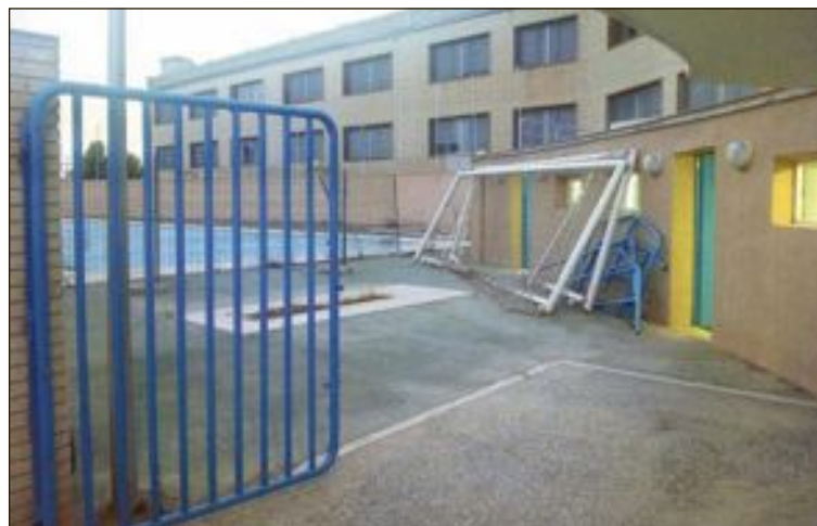
Los socialistas piden que la piscina y los vestuarios se rehabiliten

Según la edil, “este inconveniente responde más a la limitación de la capacidad económica del proyecto que a la lógica ubicación que podían haber tenido”.