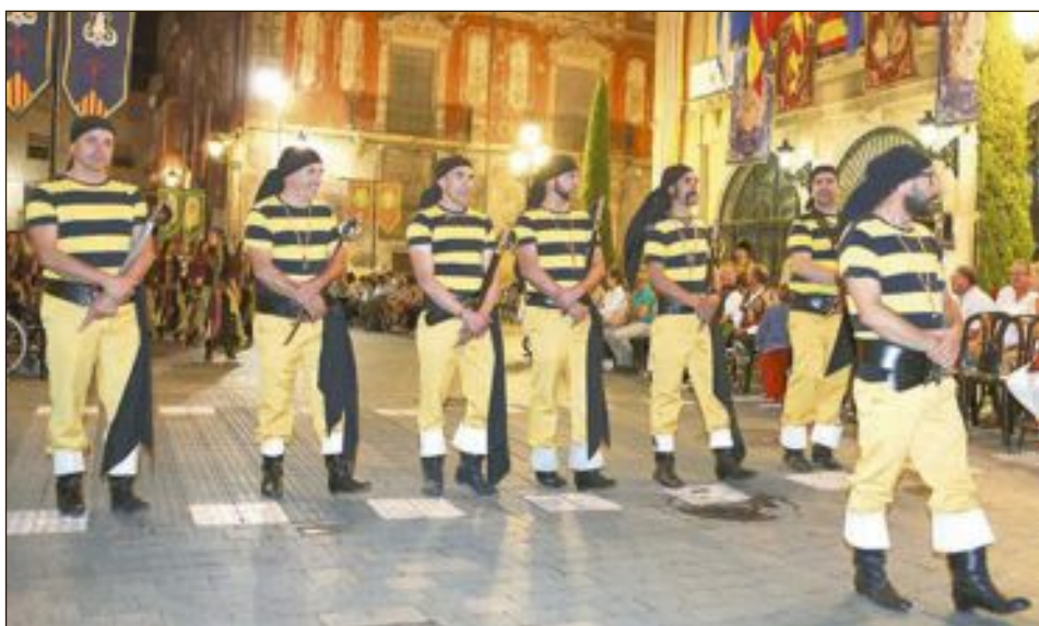
Procesión del Passeig