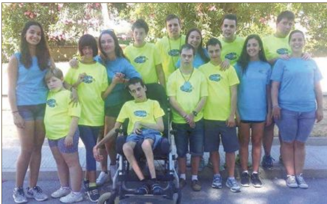
Algunos de los alumnos y monitoras de la asociación colivenca Luz y Vida

-Sábado 24 de septiembre: Fiesta de Luz y Vida en el local de la asociación. A las 16:30 horas, talleres, juegos, merienda y sorteos. A las 21:00 horas, cena para socios, colaboradores y asistentes, con sorteo de regalos.