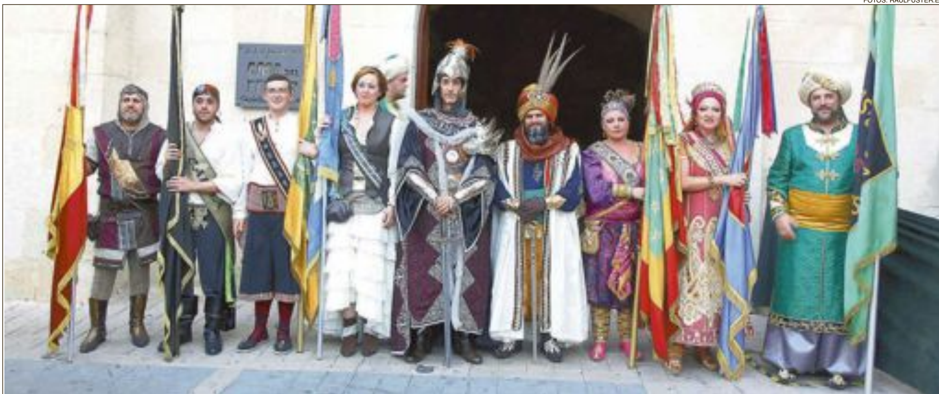
Capitanes y embajadores de las Fiestas de Moros y Cristianos de Castalla 2016, a las puertas de la Casa del Fester