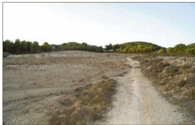
Aspecto actual de la finca de Santa María

Los trámites administrativos se iniciaron en junio de 2015, fueron aprobados en septiembre de ese mismo año y el Ayuntamiento de Ibi instó a los técnicos responsables a supervisar todas las obras efectuadas.