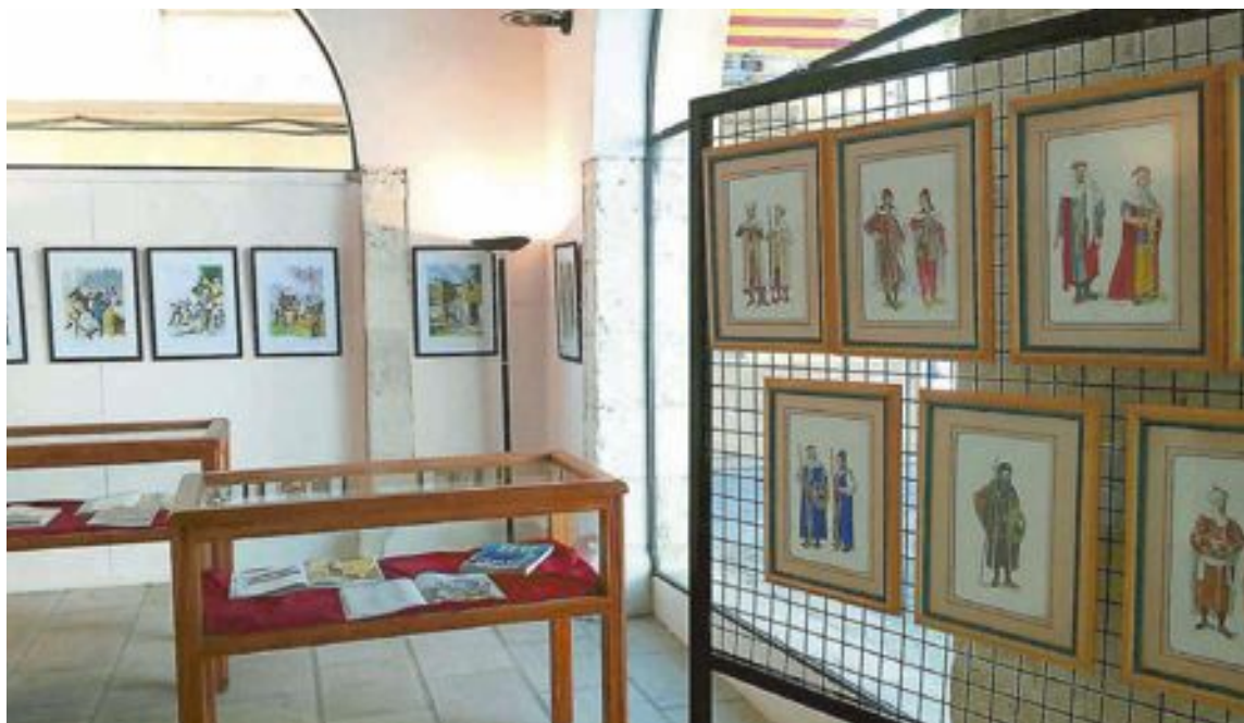
La muestra podrá visitarse durante las fiestas y hasta el 30 de septiembre