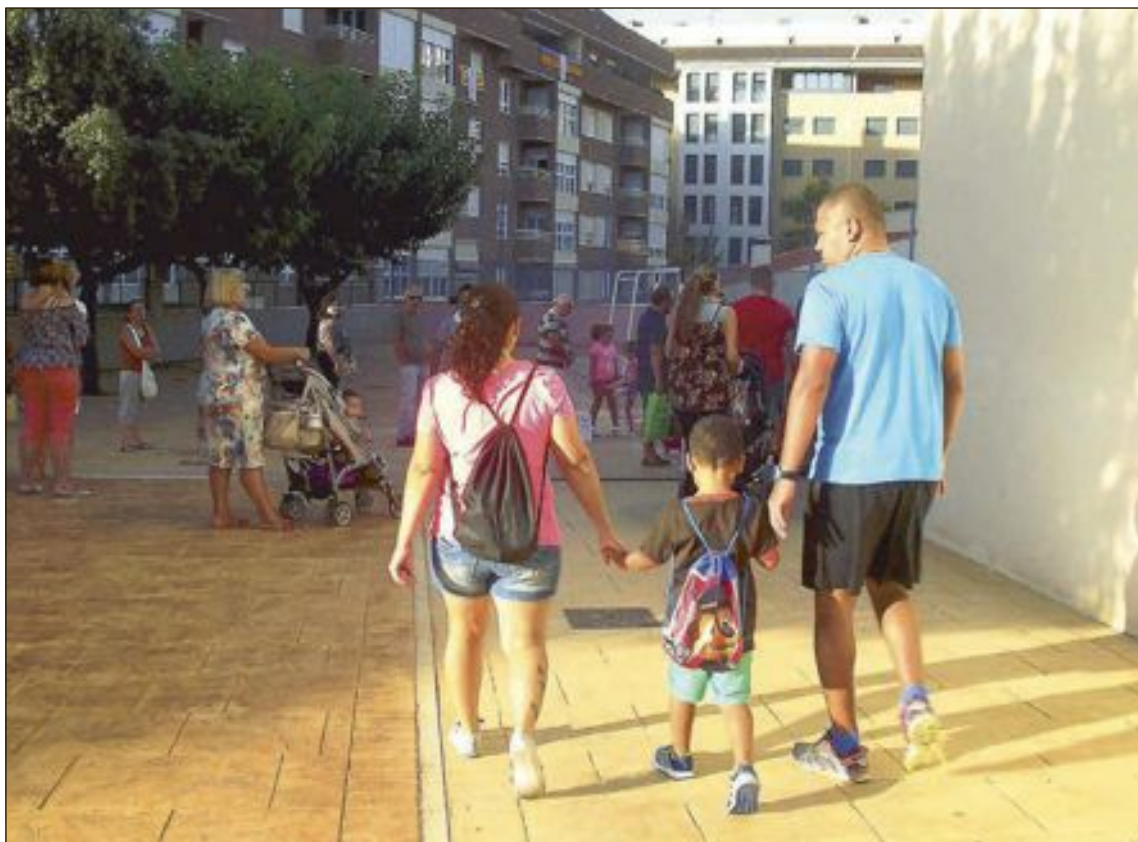
Las clases comenzaron en los colegios e institutos de la comarca el jueves 8 de septiembre