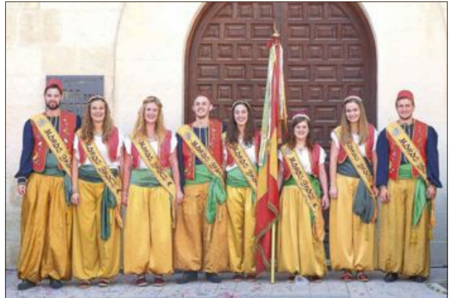
Capitanía Moros Grocs: Escuadra Sembrel.la