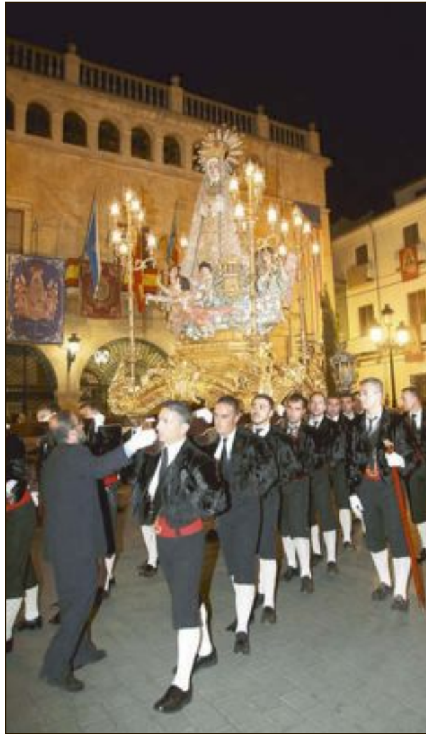
La Virgen de la Soledad, patrona de Castalla, en la plaza Mayor