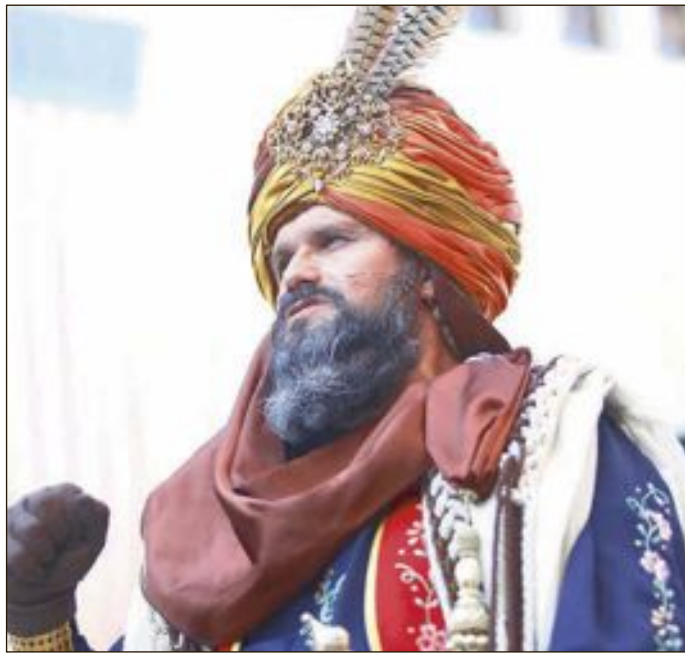
Los representantes de los bandos cristiano y moro, en plena Embajada