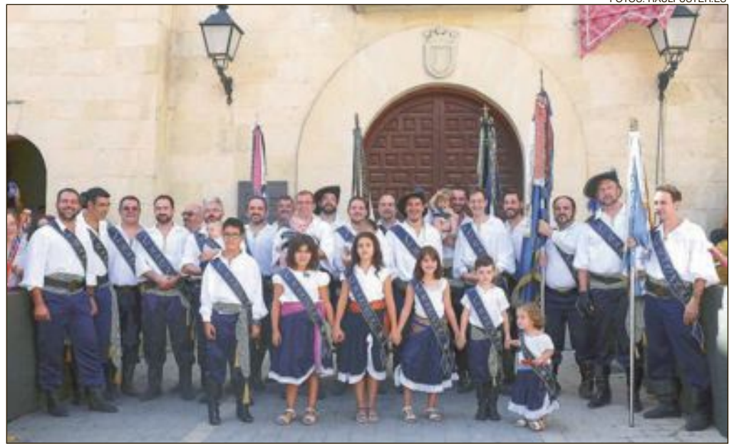
Capitanía Mariners: Escuadra Simbad i els Marinos