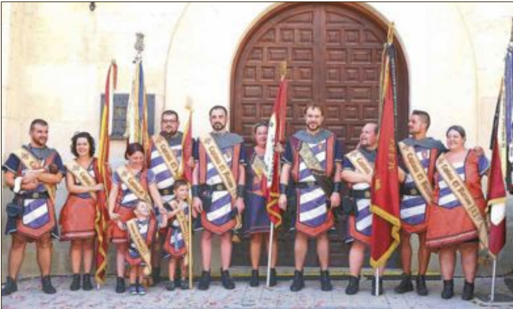
Capitanía Cristians: Escuadra El Barranc