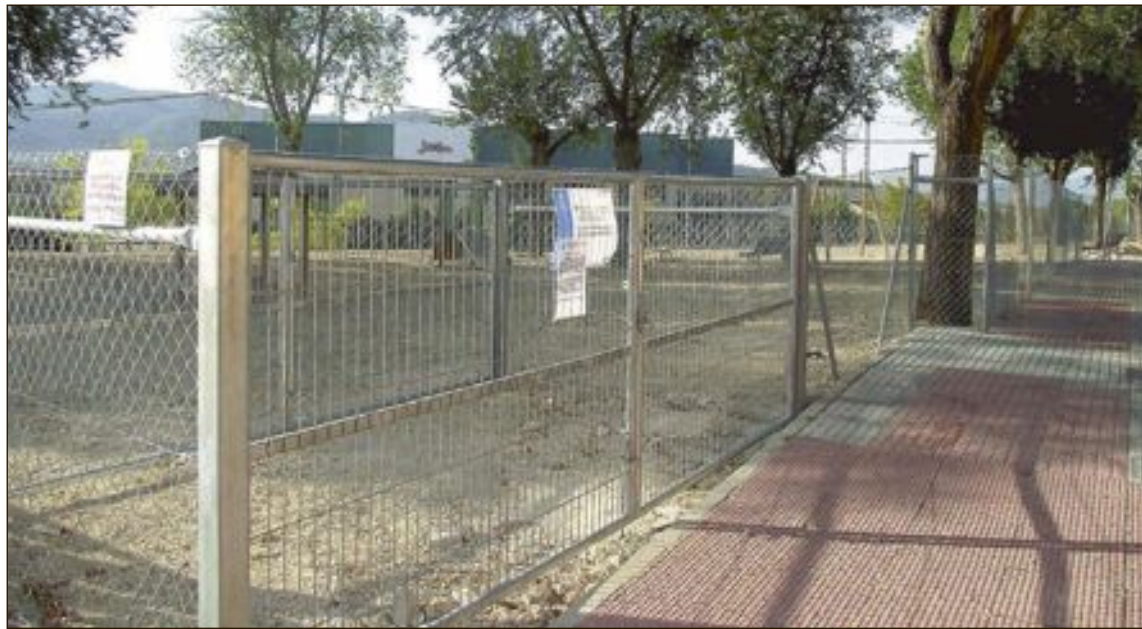
La glorieta Félix Rodríguez de la Fuente fue elegida inicialmente por el Ayuntamiento para ubicar el parque canino

En este encuentro, volvieron a ponerse sobre la mesa las posibles opciones que existen: mantener la ubicación elegida, trasladar el parque a otra zona, o bien, crear más espacios simultá-