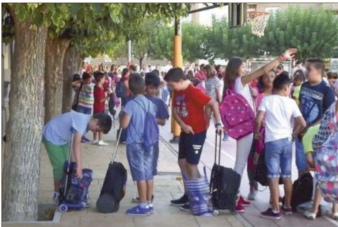
Las clases comenzaron el 8 de septiembre, por primera vez para todos los niveles educativos