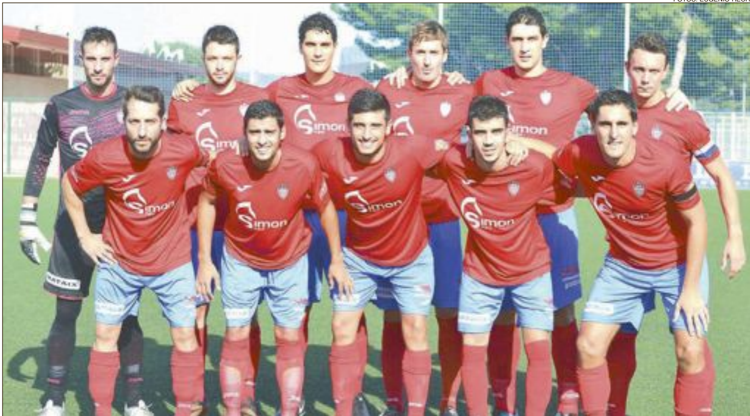
Once inicial del Rayo Ibense en el partido disputado la pasada jornada en Muro