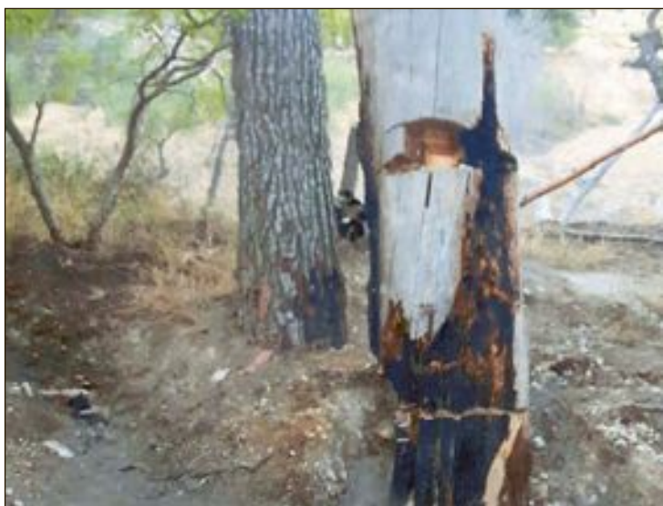
Las llamas alcanzaron a uno de los árboles de la finca