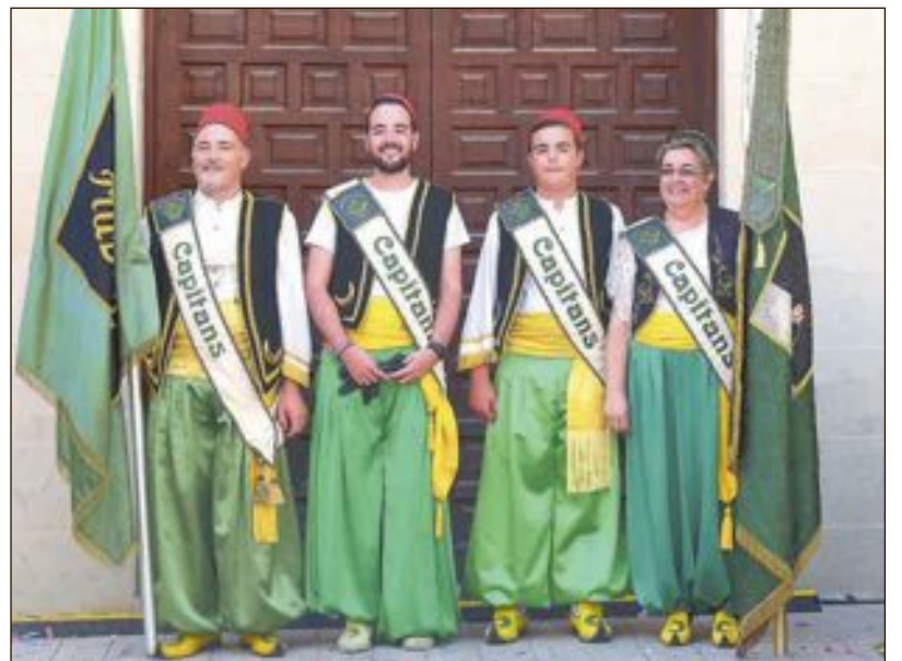
Capitanía Moros Mudéjares: Familia Rico-Sánchez