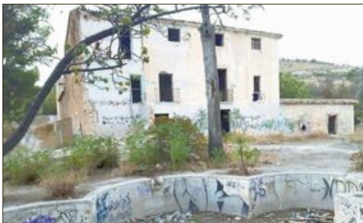
La finca está en situación de abandono y es frecuentada por jóvenes