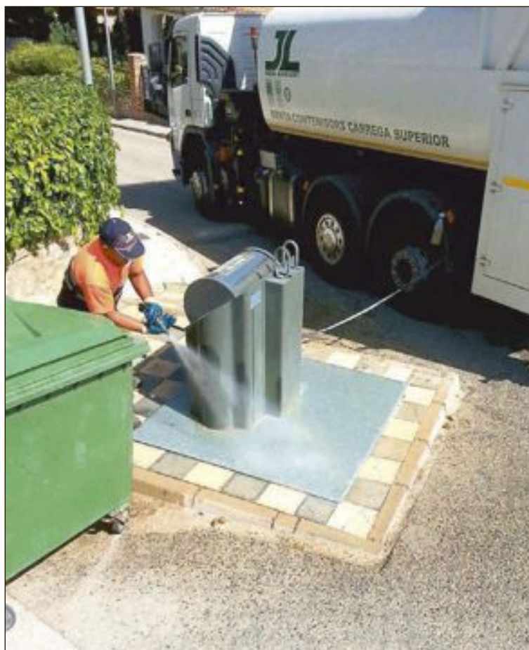
Las tareas de limpieza se realizaron el miércoles 7 de septiembre

La concejal se mostraba satisfecha con el contrato del servicio de basura en Biar y con el estricto cumplimiento por parte de la empresa concesionaria.