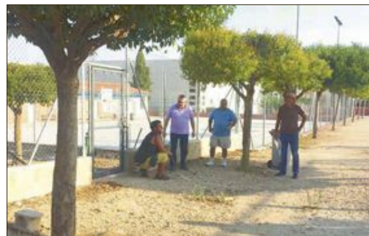
El alcalde y el edil de Deportes se reunieron el martes con la empresa

La cooperativa eléctrica de Biar otorgará uno de los trofeos de la jornada.