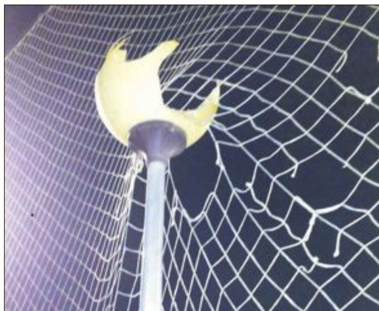
También solicitan que se solucionen los problemas de iluminación