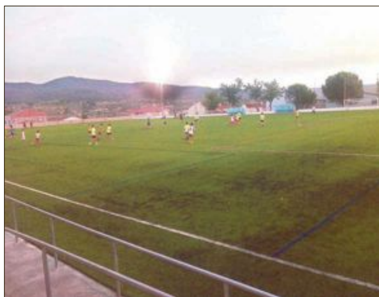
Las obras del Climent han consistido en la colocación de césped artificial