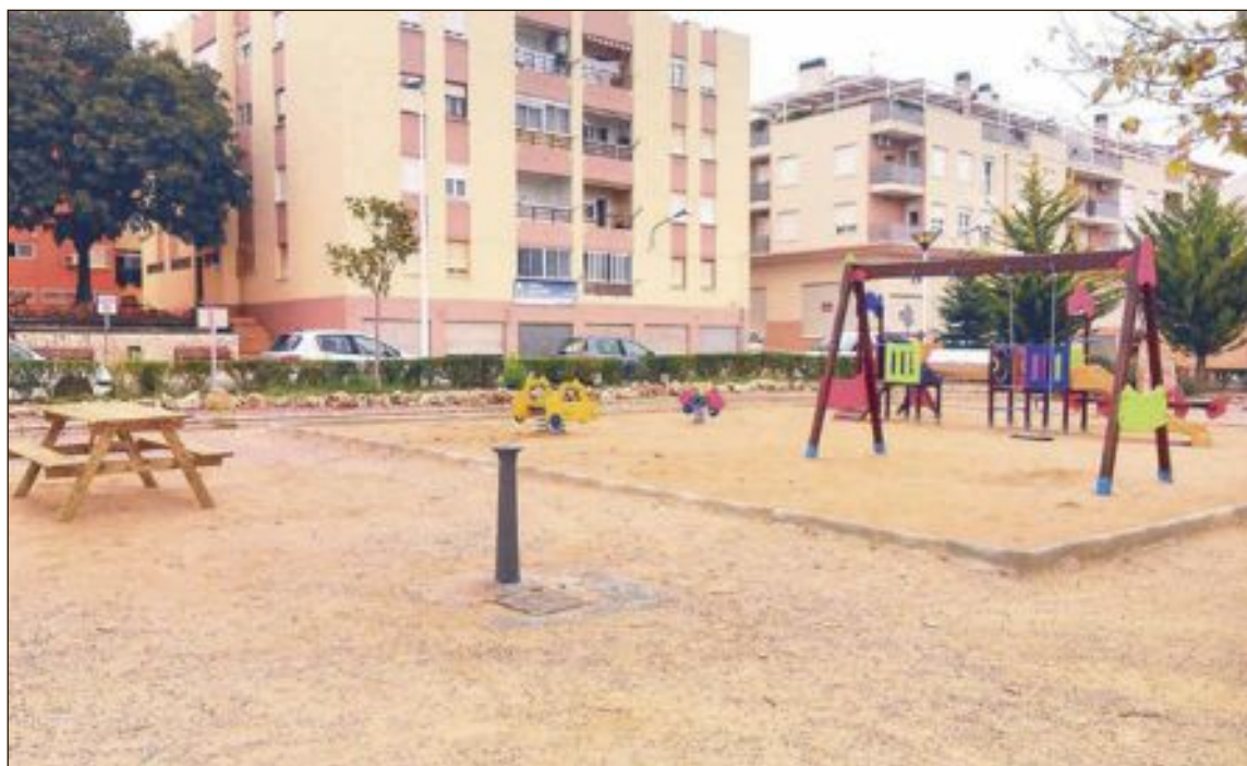
Parque Cavanilles, situado en la parte suroeste de Onil

Podrán participar niños de entre tres y seis años (Infantil y 1º de Primaria). Recogida de tiques a partir del lunes día 19 en la Biblioteca.