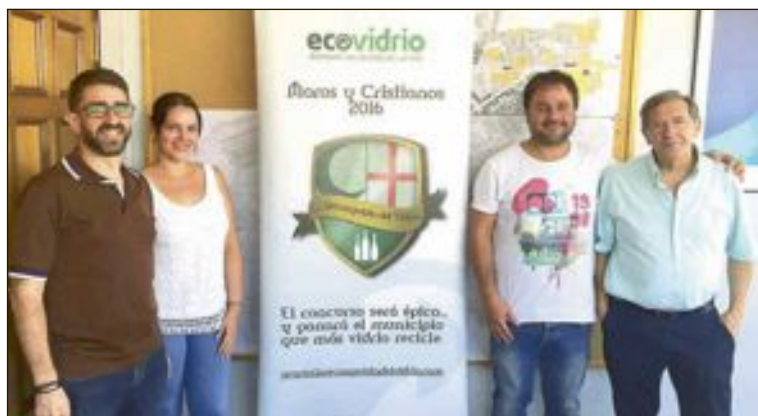
Participan las concejalías de Fiestas y Servicios Públicos y la Comisión