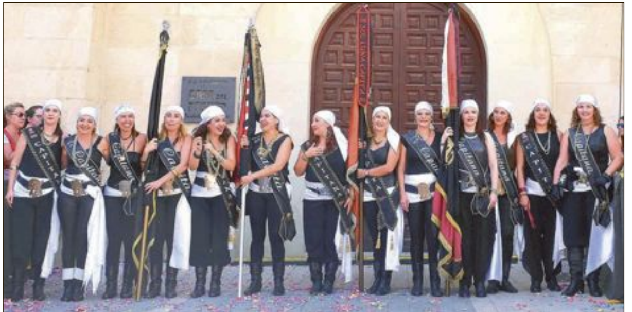
Capitanía Pirates: Escuadra Bucaneres