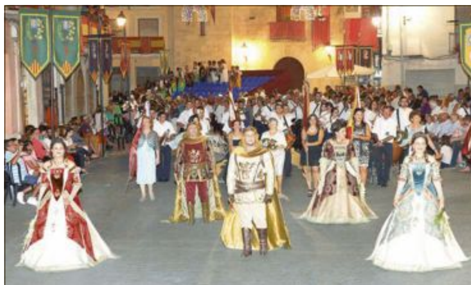
Ofrenda de flores a la Mare de Déu de la Soledat Gloriosa , patrona de Castalla