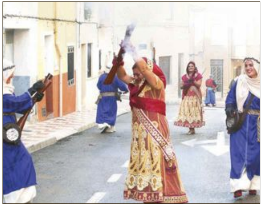
Un momento de la Guerrilla