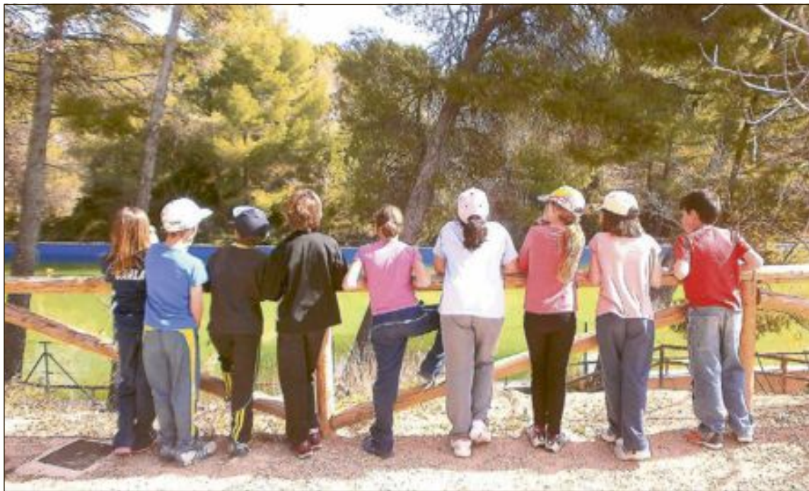
El curso pasado participaron en esta iniciativa más de 6.200 alumnos de toda la provincia de Alicante

Las visitas guiadas y las jornadas técnicas son gratuitas y en