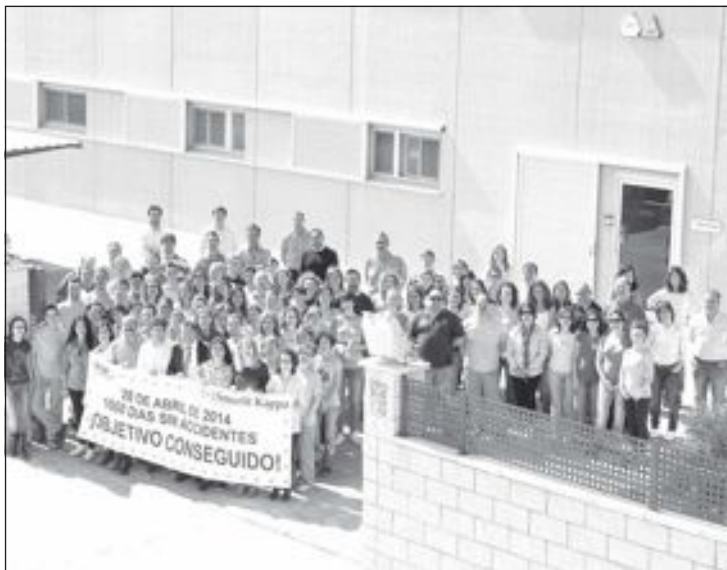
Plantilla de la empresa la jornada de conmemoración