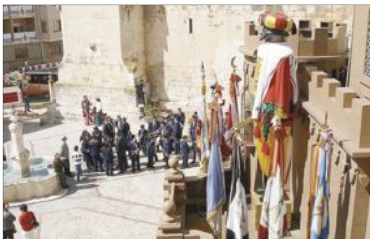
Imagen de la Mahoma en el castillo de fiestas