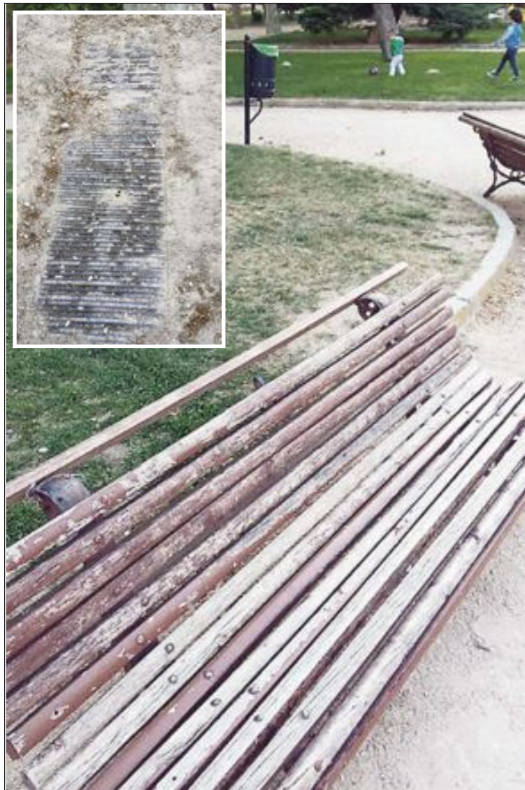
Estado de uno de los bancos y de las arquetas del parque (detalle superior)

Debido a esta situación, el PSOE ha solicitado que se redacte un proyecto de reforma integral del parque, que incluya la posibilidad de pavimentar las zonas de paseo, arreglo de fuentes y el cambio de mobiliario