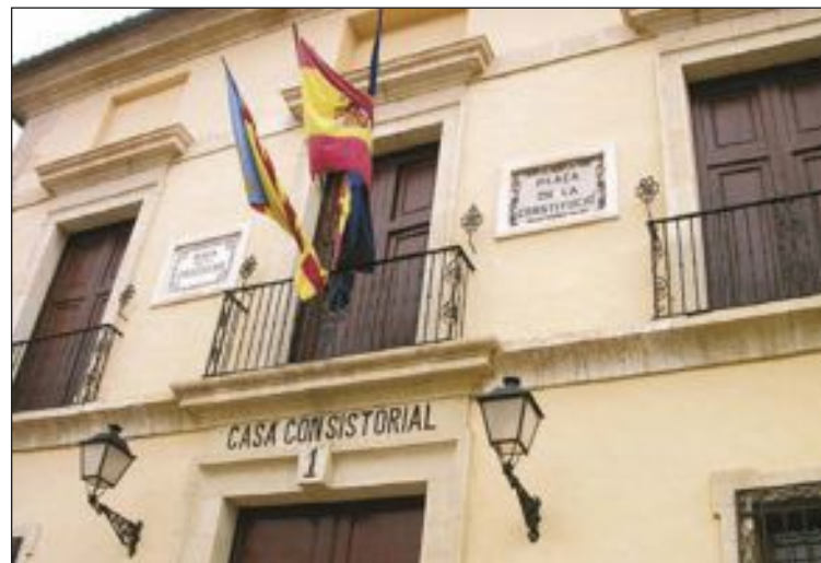
Unos 50 trabajadores municipales se beneficiarán de la medida