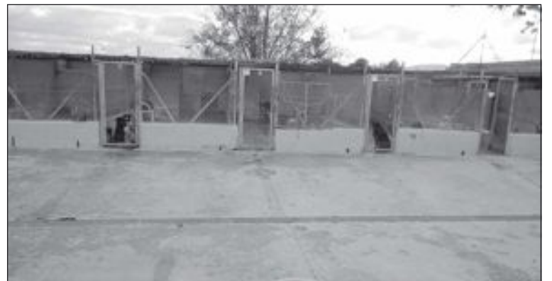
El albergue de animales está gestionado por la Protectora de Animales

Esta acción va dirigida a que los alumnos desarrollen conductas responsables con los animales de compañía, que los conozcan, sus necesidades, así como los tipos de mascotas y los cuidados que necesitan. Los alumnos desarrollarán las acciones de esta campaña en las asignaturas de