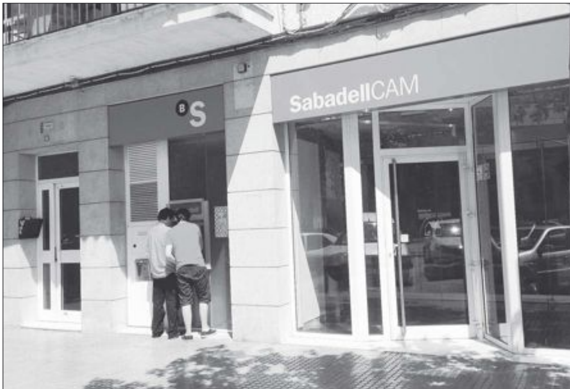
La víctima fue atracada frente a una oficina del Banco Sabadell

Talleres Gis-Ver, en la avenida de la Provincia de Ibi, ya dispone, para toda la comarca, de todos los modelos de la gama Infiniti (Q-50, Q-60, M, EX y FX). Infiniti es la gama alta de la alianza entre las firmas automovilísticas Renault y Nissan . El personal de Talleres Gis-Ver estará encantado de mostrar las prestaciones de estos nuevos modelos a todos los interesados que se acerquen a sus instalaciones.