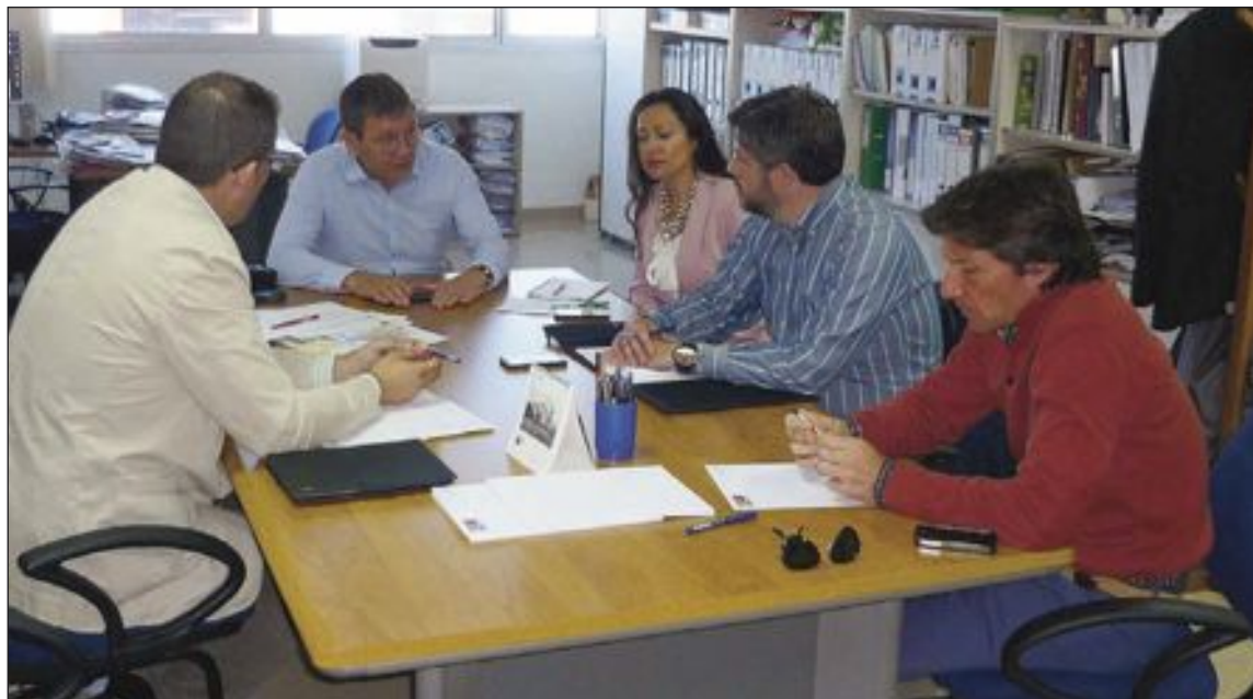
Reunión de representantes de la Plataforma por la Reindustrialización celebrada el 25 de abril

La Plataforma por la Reindustrialización Territorial considera que en la situación actual con