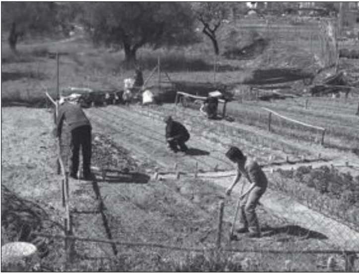
Personas trabajando en uno de los 44 huertos urbanos ya existentes