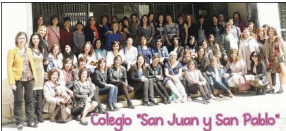
El 12 de abril se celebró la reunión de exalumnas en el colegio acompañadas de sus profesoras