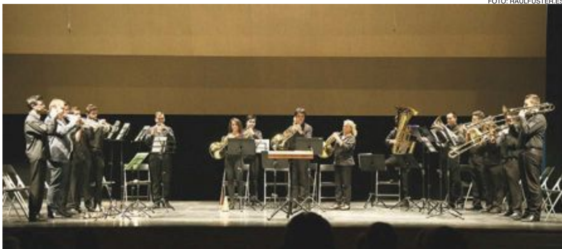
La Brass Academy Alicante actuó el domingo 27 de abril en el Auditorio de Castalla