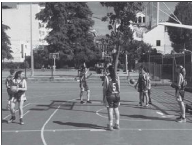
Un calentamiento del Teixereta Júnior Femenino en Granada