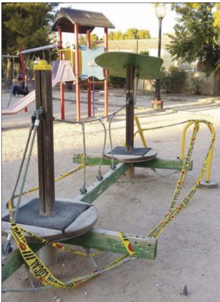
Uno de los juegos del parque ha tenido que ser precitando por su estado

Un vecino de Castalla dona al Ayuntamiento un billete que se usó a nivel local durante la Guerra Civil