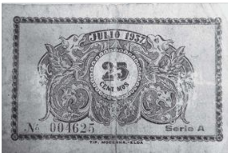
Arriba, anverso del billete que sólo se usaba en Castalla. Abajo, el reverso