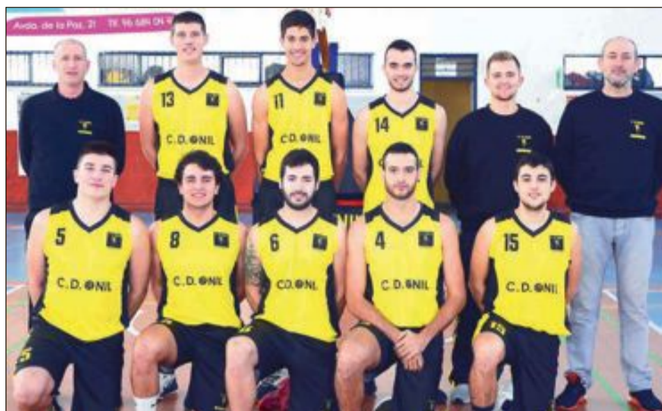
CD Onil Sénior Preferente