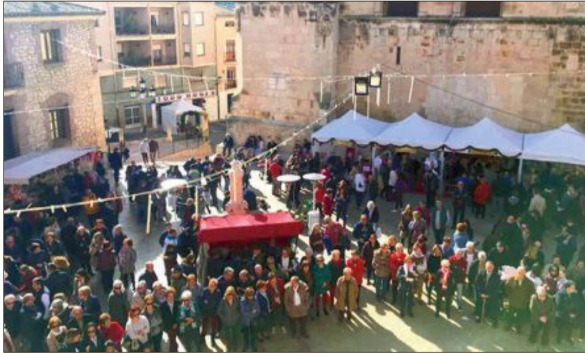
La quarta edició del mercat nadalenc 'Biar, un conte de Nadal' va ser un èxit d'assistència de visitants