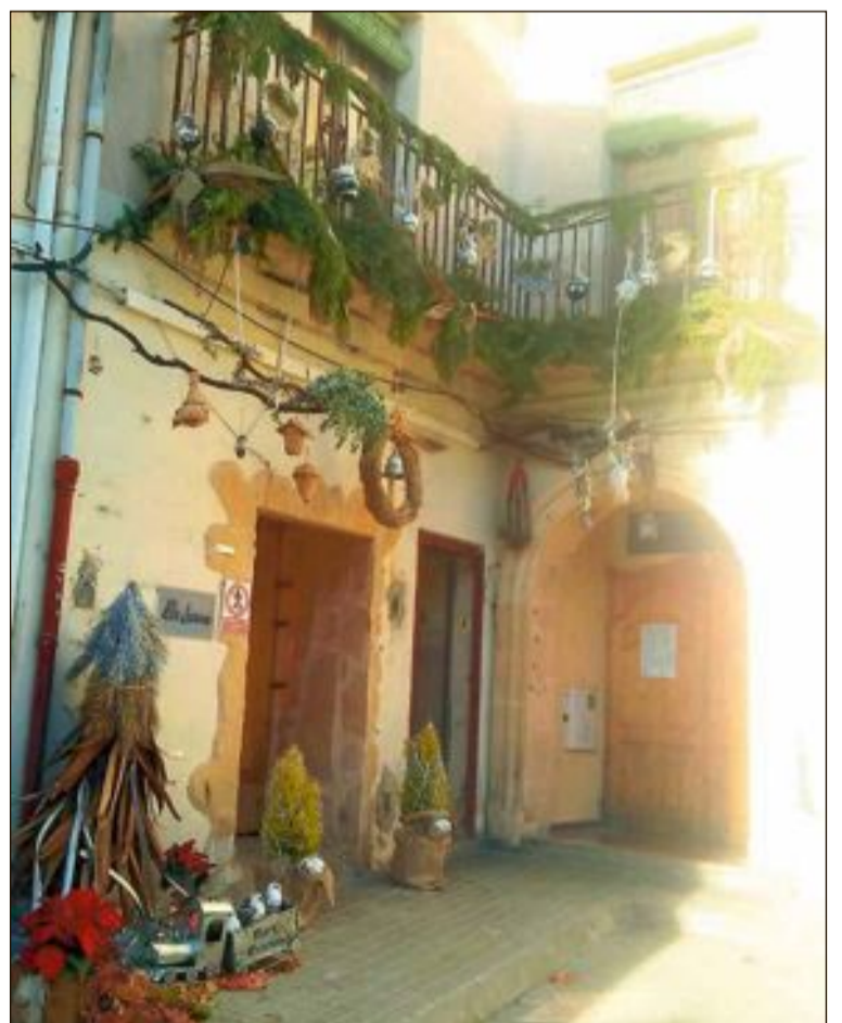
En el concurs de decoració de façanes, la guanyadora va ser la dels Jovens, que com a premi serà la portada del cartell del mercat de l'any que ve

Jove, contes, partida de pilota, jocs de taula, la Dolça Parranda i la lectura del manifest del Dia Internacional de les Persones amb Discapacitat.