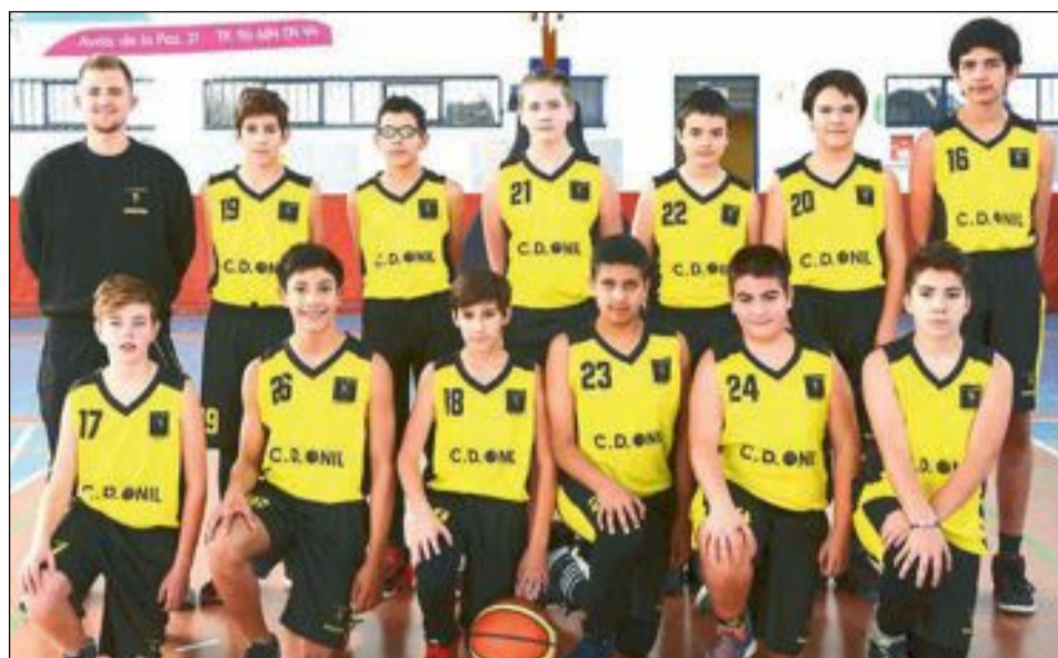
CD Onil Infantil 'B'