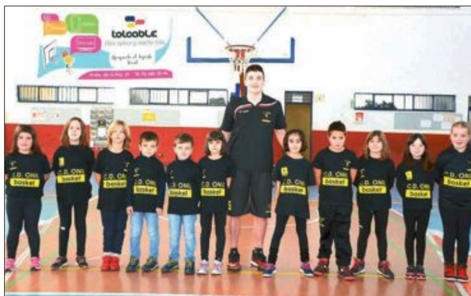
CD Onil Prebenjamín