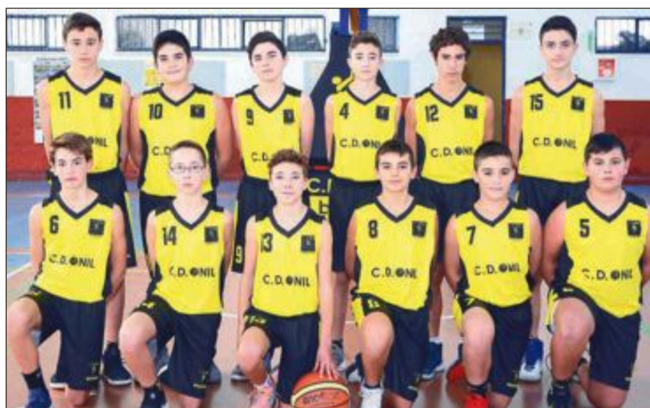
CD Onil Infantil 'A'