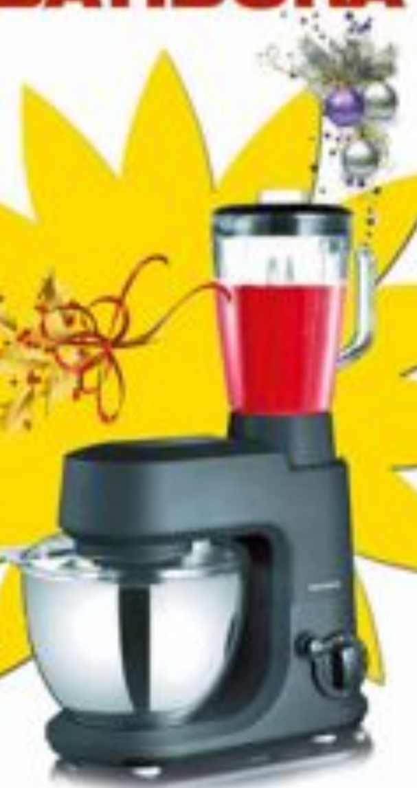
Amasadora-Batidora Severin KM3000

Características: Capacidad del cuenco: 4L / Potencia: 1000W Tipo de control: Control / Batido: 5 Fuente de impulsos: 6 / Base antideslizante: 6 Número de velocidades: 6 / Varillas batidoras: 6 Color del producto: Negro / Material del cuenco: Acero inoxidable