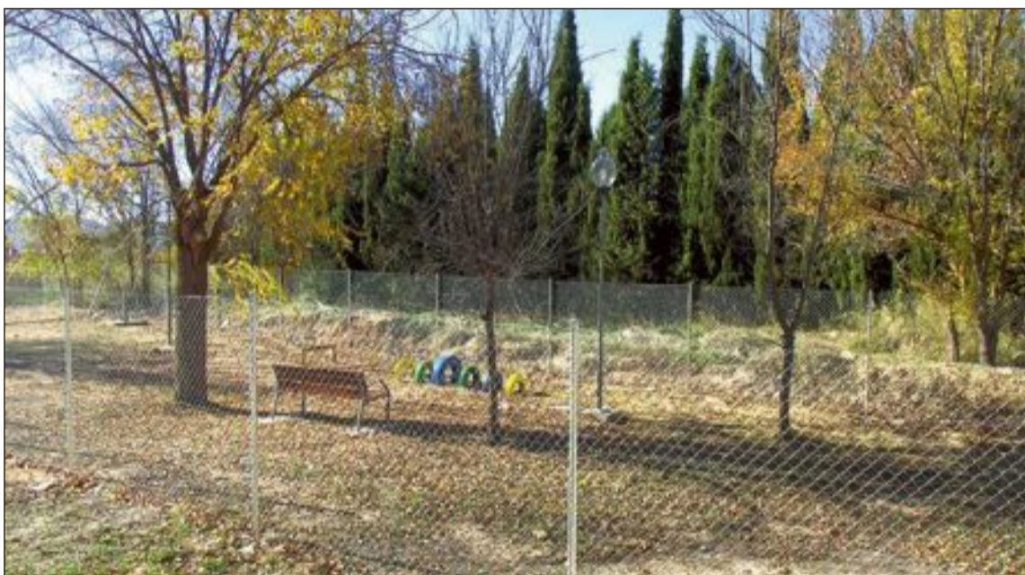
El otro parque canino está situado junto al cementerio municipal