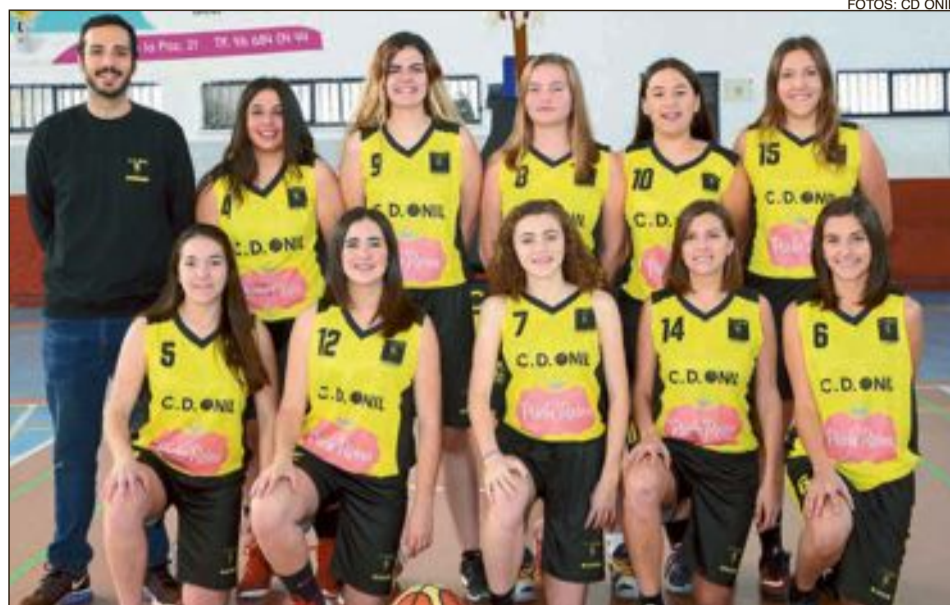
CD Onil Sénior Femenino