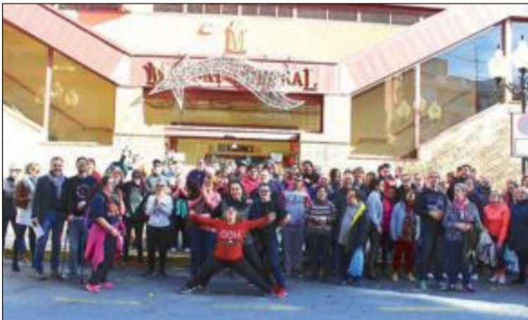
El grupo 'A danzar' del Centro Ocupacional San Pascual ofreció el 3 de diciembre una actuación frente al mercado central

Villaplana subraya que "nuestro objetivo con el proyecto Moulvet es recuperar y recopilar este conocimiento y lograr transmitirlo a personal en activo y nuevas generaciones, ya que según agrega, "la creación de nuevas generaciones de moldistas es un reto estratégico de cara al futuro de la actividad industrial de la comarca y es vital poner en valor el oficio y que la gente joven apueste por desarrollar una vida profesional de futuro y trabajo seguro".