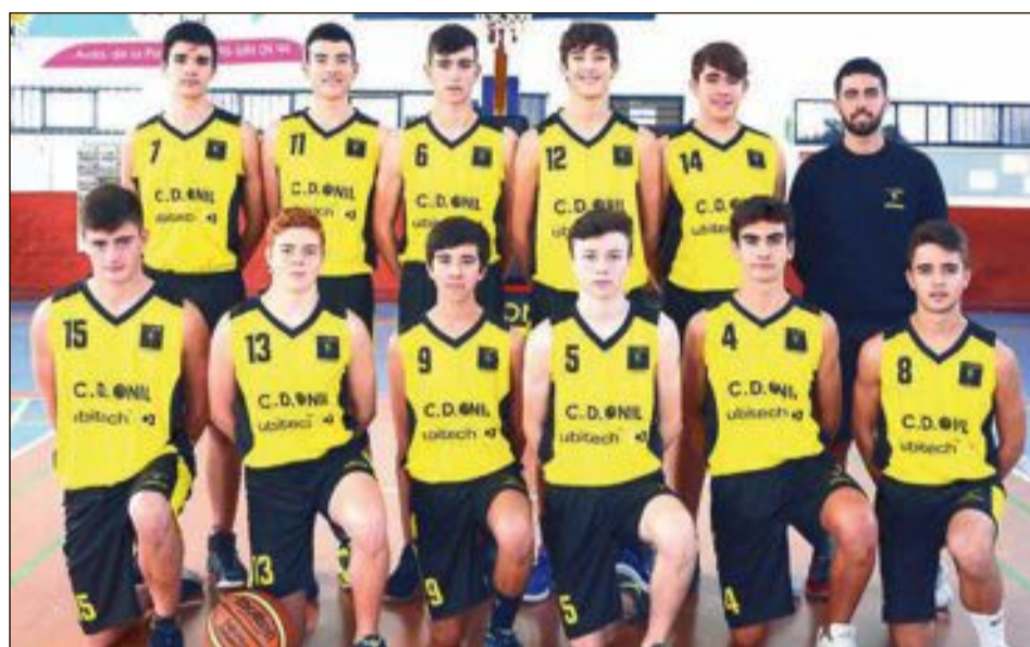
CD Onil Júnior Preferente