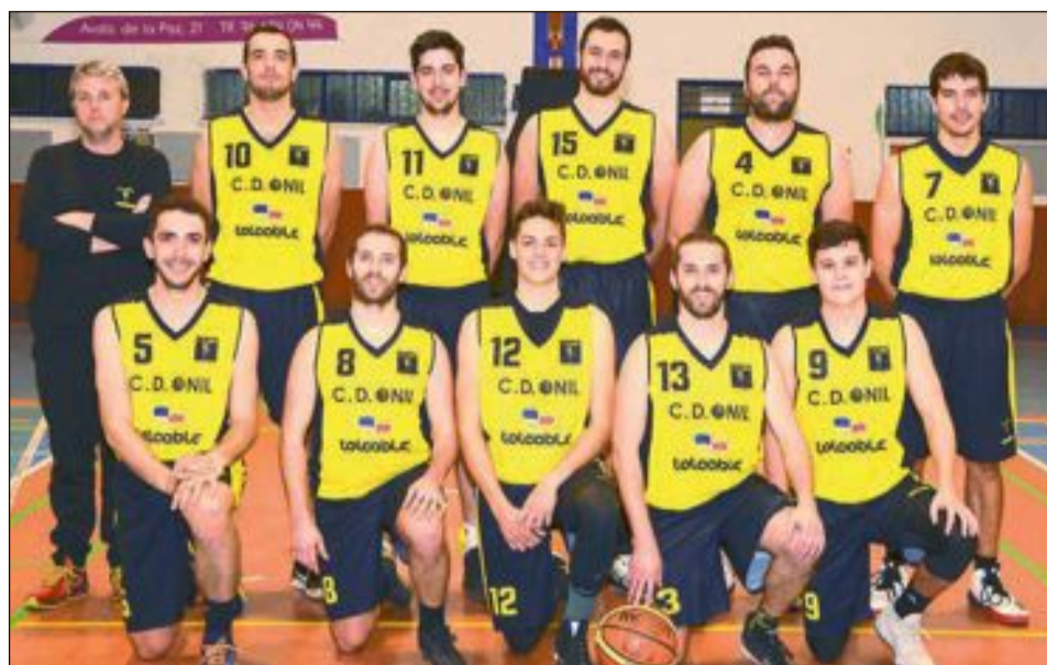
CD Onil Sénior Autonomico