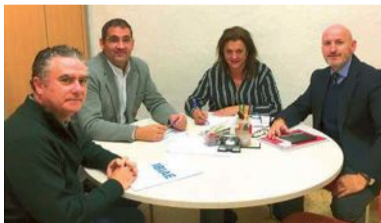
El presidente y el director de IBIAE en la reunión que mantuvieron con el concejal de Industria y la técnica del departamento municipal

Por otro lado, una serie de trabajos con un plan económico anual posibilitarían mantener en óptimas condiciones estructurales y estéticas los elementos identificativos de la urbanización de los polígonos. Nuestro escaparate estético es la primera impresión de solvencia para clientes, inverso-