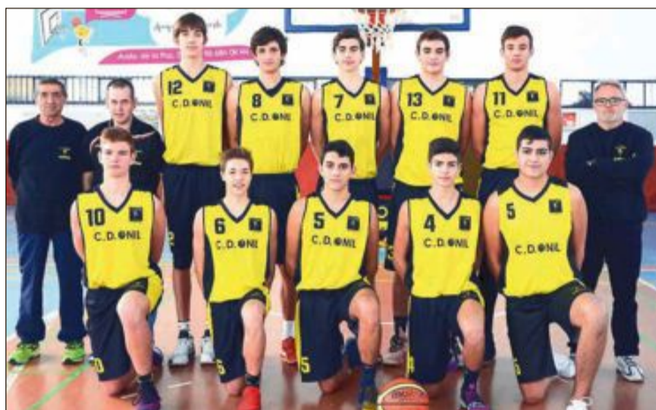
CD Onil Júnior Autónomo