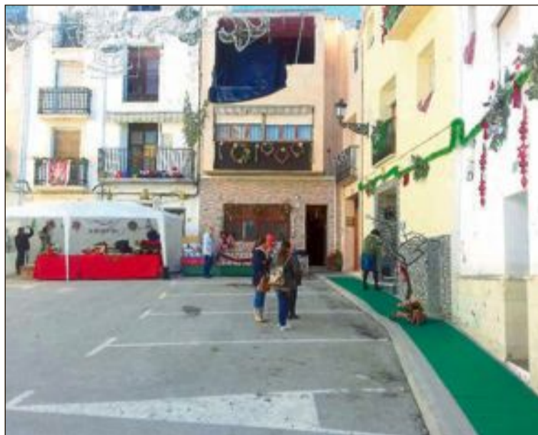
El mercat va ser organitzat per l'Ajuntament, l'associació local contra el Càncer i l'associació de persones amb discapacitat de Tibi (Adistibi)

Amb motiu d'este mercat es va organitzar un concurs de decoració de façanes, amb destacada participació de veïns i penyes. L'últim dia es van fallar els premis, sent el primer per a la façana dels Jovens. Com a premi, serà la portada del cartell anunciador de mercat de l'any pròxim.