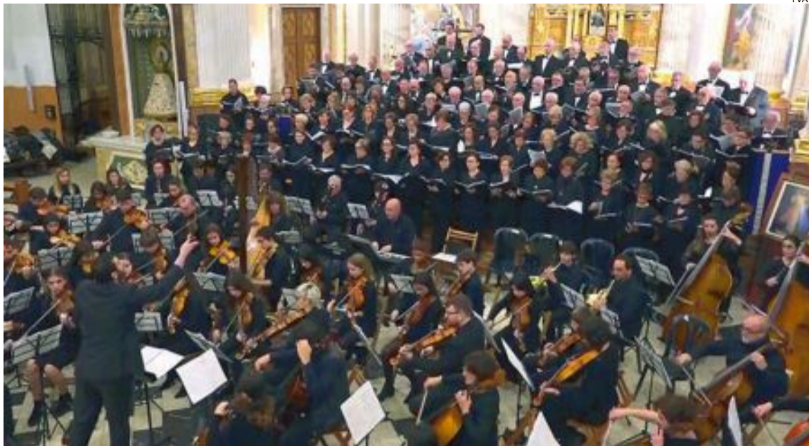
Les tres corals i l'orquestra simfònica de Sant Joan, en l'Església de la Transfiguració del Senyor d'Ibi