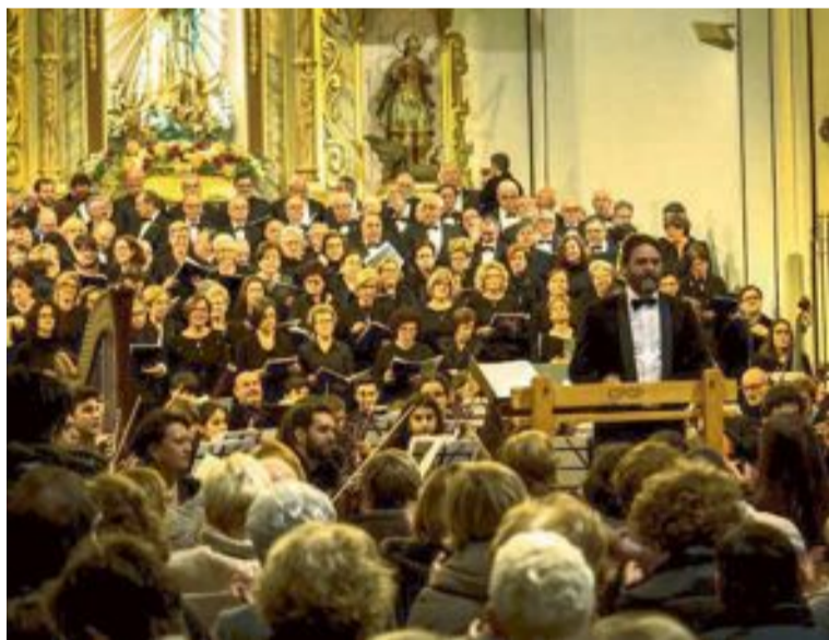
Un moment de l'actuació en el Convent d'Onil

El Rèquiem de Gabriel Fauré va ser escrit entre 1886 i 1888 i