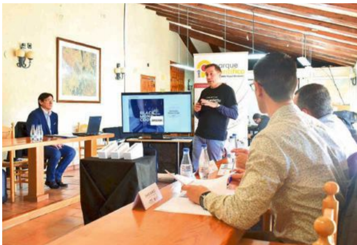
Los proyectos finalistas del segundo programa Castalla Emprende fueron presentados el miércoles 28 de noviembre en el salón de plenos del Ayuntamiento