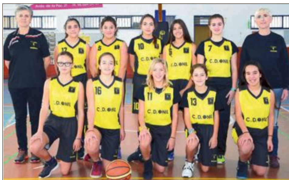
CD Onil Infantil Femenino