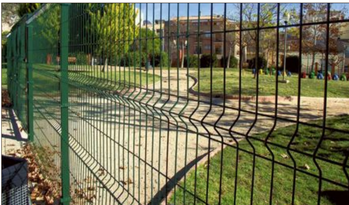
Parque canino ubicado en el parque Les Hortes

Por otro lado, la nueva ordenanza municipal de tenencia de animales, ya recoge el funcionamiento de estos espacios que define como “reservados para el recreo, la socialización y la realización de sus necesidades fisiológicas en condiciones correctas de higiene”. En estos espacios, agrega la ordenanza, los animales de compañía “podrán pasear sueltos; no obstante, la persona propietaria poseedora o tenedora deberá vigilar a sus animales y evitar molestias, respetando en todo momento las normas del recinto”.