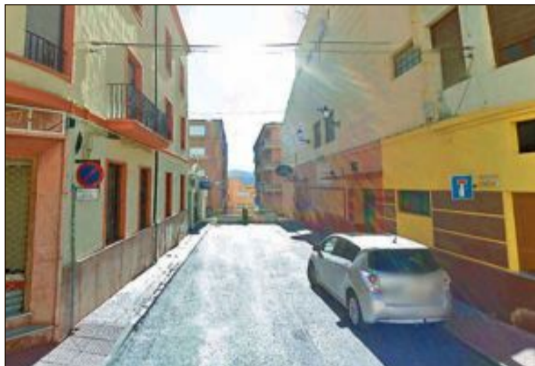
Calle Jorge Juan vista desde la avenida de la Constitución; a la derecha, las escaleras que conectan esta calle con Cardenal Payá

-El tramo intermedio, con pavimento de adoquín de hormigón, con la plantación de cuatro