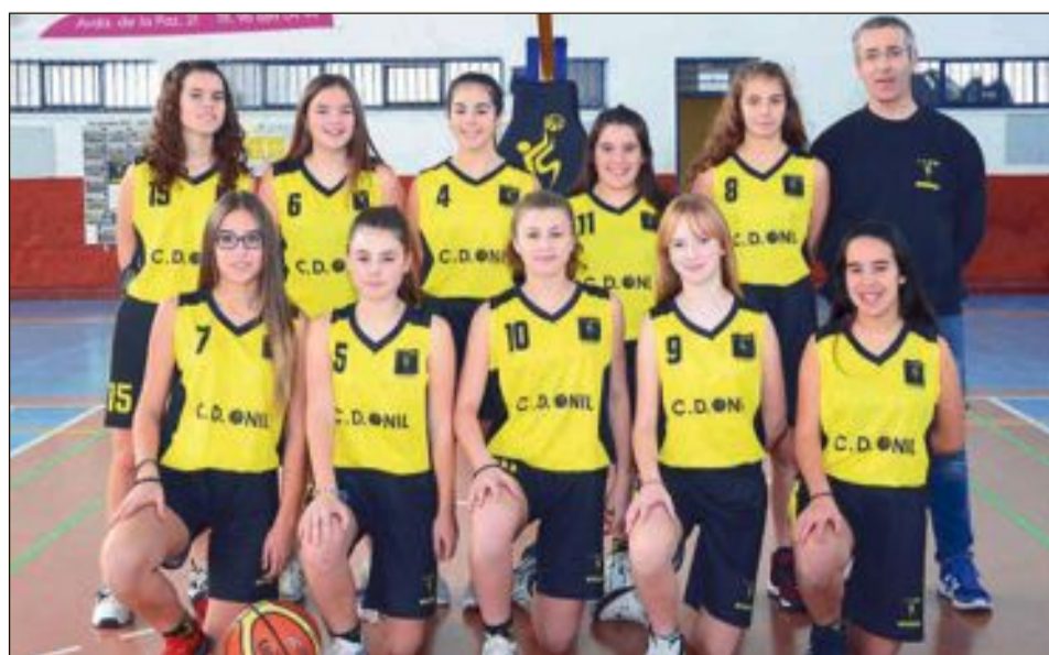
CD Onil Cadete Femenino 'B'