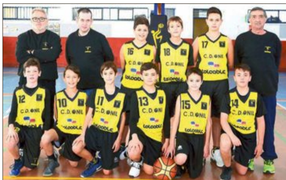
CD Onil Alevín Totcable