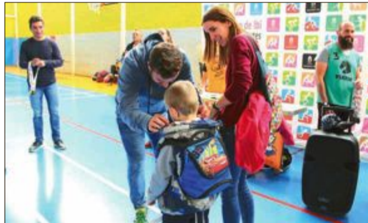
La jornada de deporte adaptado se celebró el miércoles 5 de diciembre en el Polideportivo municipal