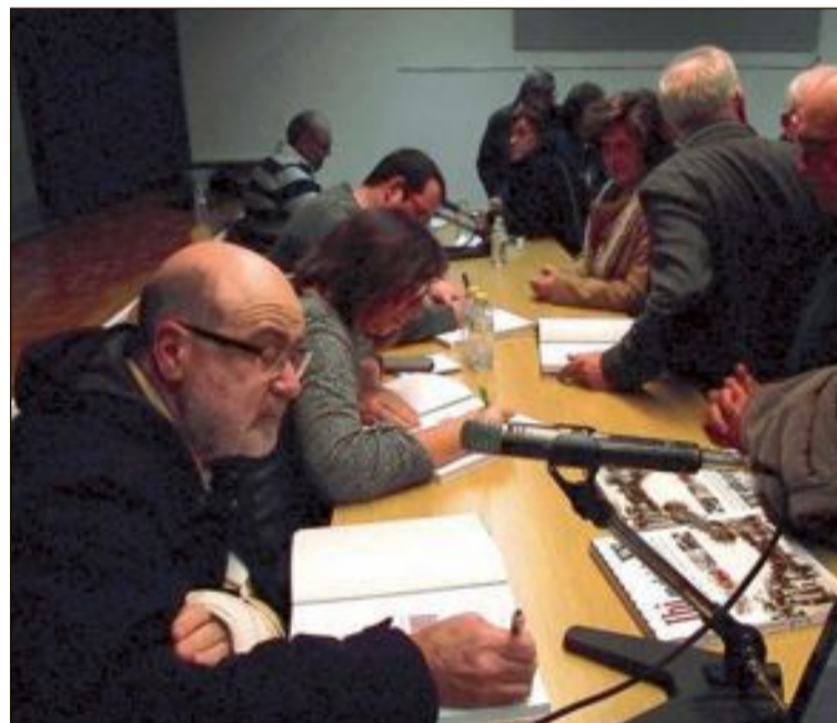
Firma de ejemplares del libro por parte de sus autores

Está ya a la venta en librerías y quioscos, al precio de 21'50 euros.