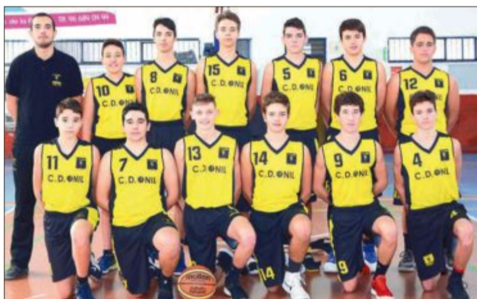
CD Onil Cadete Masculino