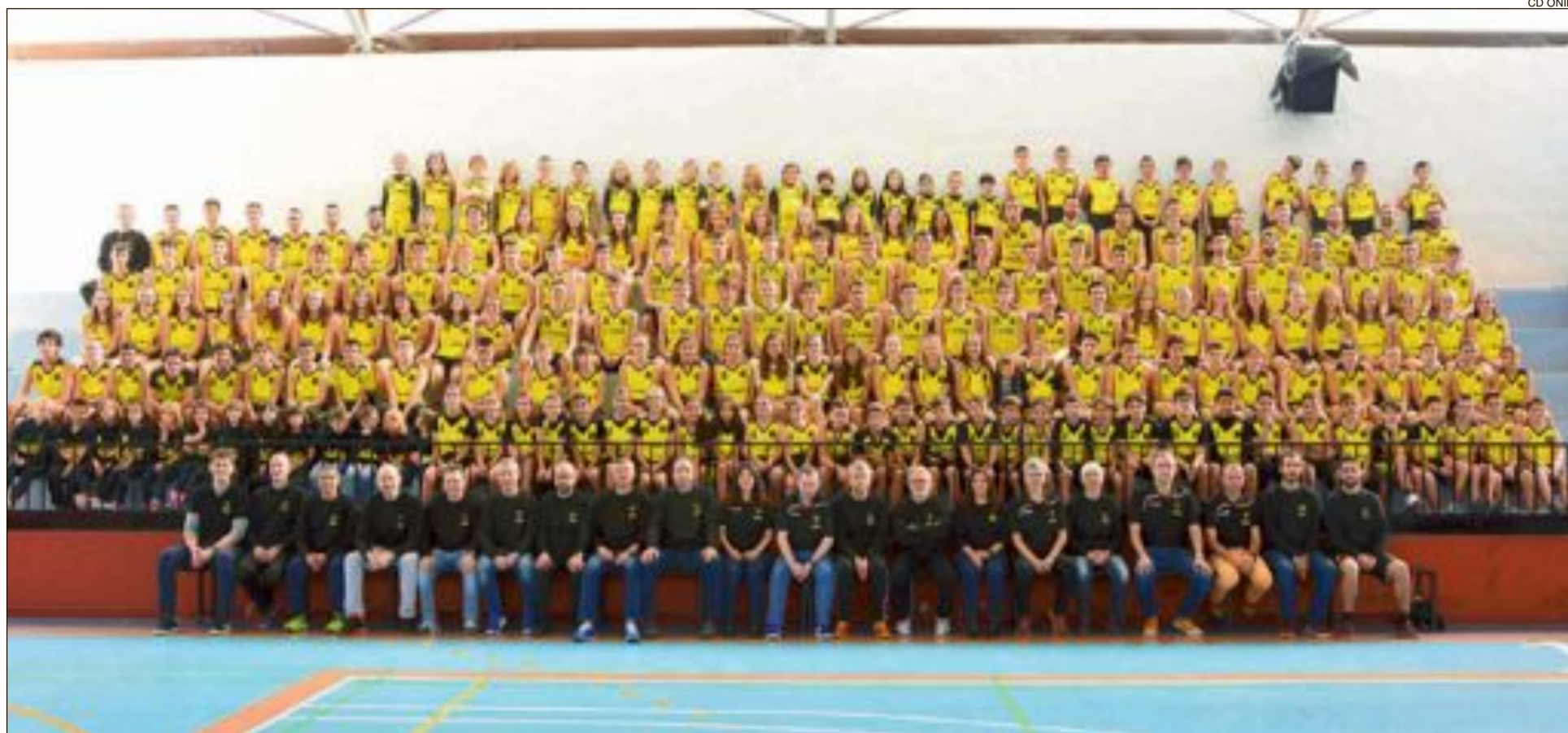
Jugadores, técnicos y directivos del Club Deportivo Onil, en las gradas del pabellón del Polideportivo colivenc durante la presentación oficial de la presente temporada, el domingo 2 de diciembre