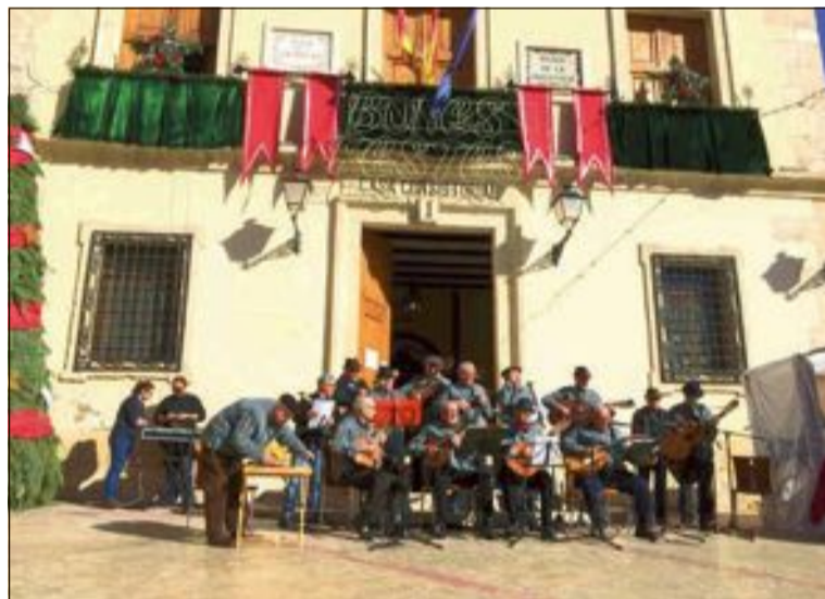
La Rondalla va interpretar nades