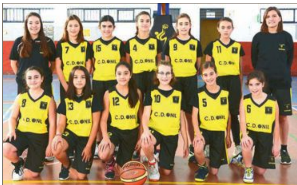
CD Onil Alevín Femenino