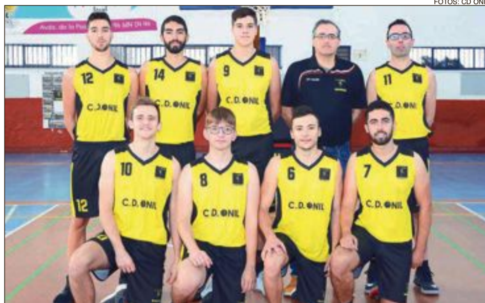
CD Onil Sénior Zonal