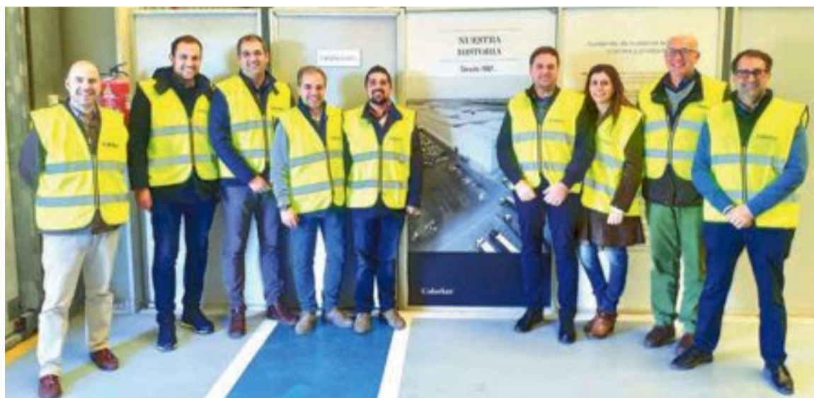
Empresarios asociados a IBIAE durante su visita a la empresa castallonense Colorker

La planta de Xilxes (Castellón) cuenta con sensores de humedad destinados al control automático de la prensa y también de un dispositivo no destructivo de medida de la densidad aparente de las baldosas cerámicas. Estos sistemas proporcionan una información rápida, segura y más fiable que los métodos tradicionales. Para reducir el consumo energético en las etapas de secado y cocción poseen sistemas de recuperación de calor procedentes de los hornos que destinan a los secaderos, optimizando así el consumo de energía. El sistema de trazabilidad de la producción transforma el producto final en inteligente y de máxima calidad. Un código QR (impreso en la superficie no esmaltada del azulejo) identifica cada baldosa cerámica y especifica cómo ha sido fabricada.