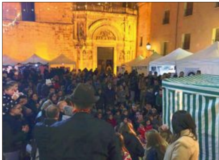
Les titelles van tindre una gran acceptació entre els xiquets i xiquetes