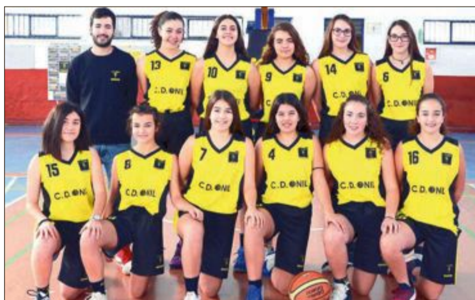
CD Onil Cadete Femenino 'A'