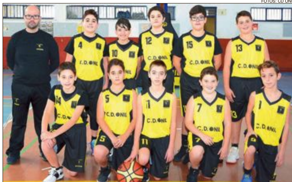
CD Onil Infantil 'C'