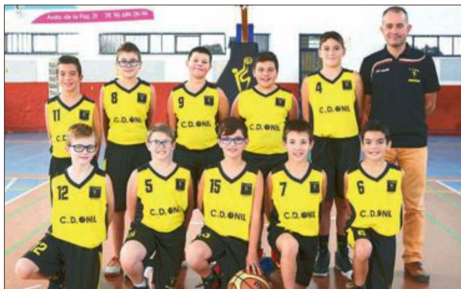
CD Onil Alevín Escolar