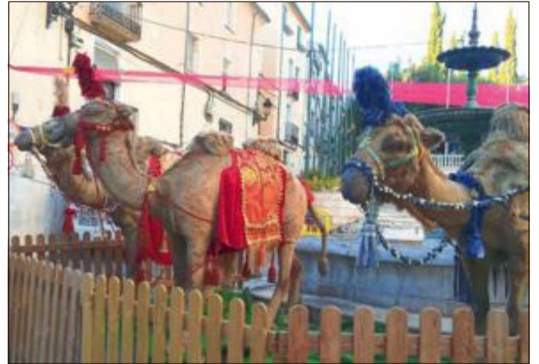
El Mercado Navideño ofrecerá una cuidada y navideña imagen, unificando la estética de los diferentes espacios con ambientación musical y luces

La feria con las atracciones infantiles se instalará en la plaza