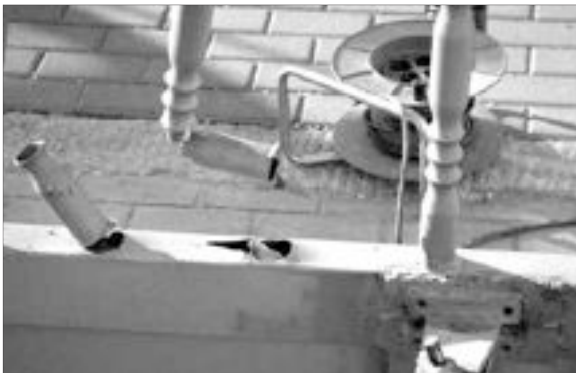
Estado en el que quedó la reja del comercio