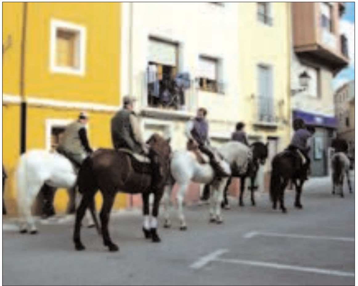
Gran participación de jinetes con sus caballos