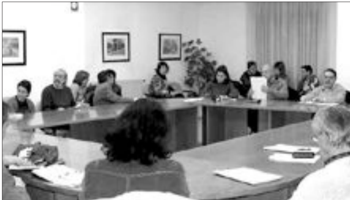
Consejo Escolar celebrado el jueves día 18 de enero

Granero ha explicado que las AMPA's habían mantenido reuniones previas con sus miembros antes del encuentro realizado con el equipo de gobierno y ya habían establecido su petición de mantener el mapa escolar, es decir, la permanen-