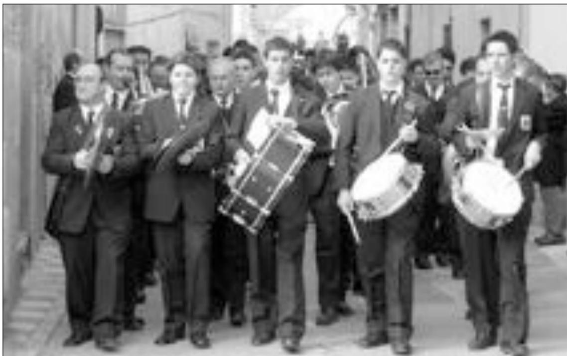
La banda de música local participó en la fiesta