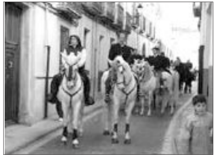
Caballos, jinetes y amazonas lucen sus mejores galas en San Antón