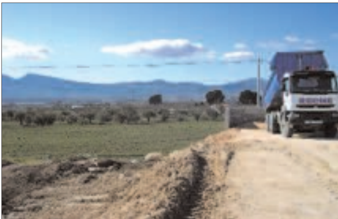
El nuevo polígono colindará con el Alfaç III, en dirección a Castalla