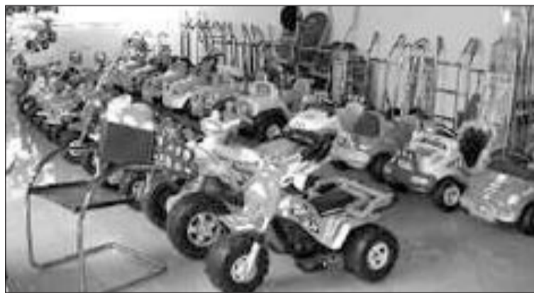
Las exportaciones a México han crecido un 16,26% en 2005

La exposición está dirigida principalmente al mercado mexicano que actualmente con 100 millones de habitantes tiene cada vez un mayor nivel de compra. Además las cuotas compensatorias del 351% que gravan las importaciones de juguetes chinos, favorecen la penetración de los productos españoles.