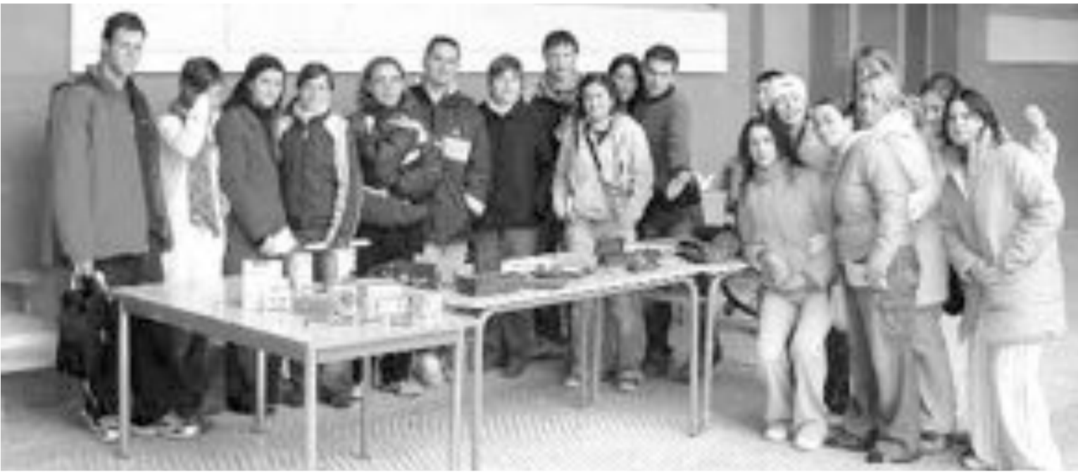
Durante las jornadas, la ONG Intermón Oxfam montó un stand de productos de comercio justo