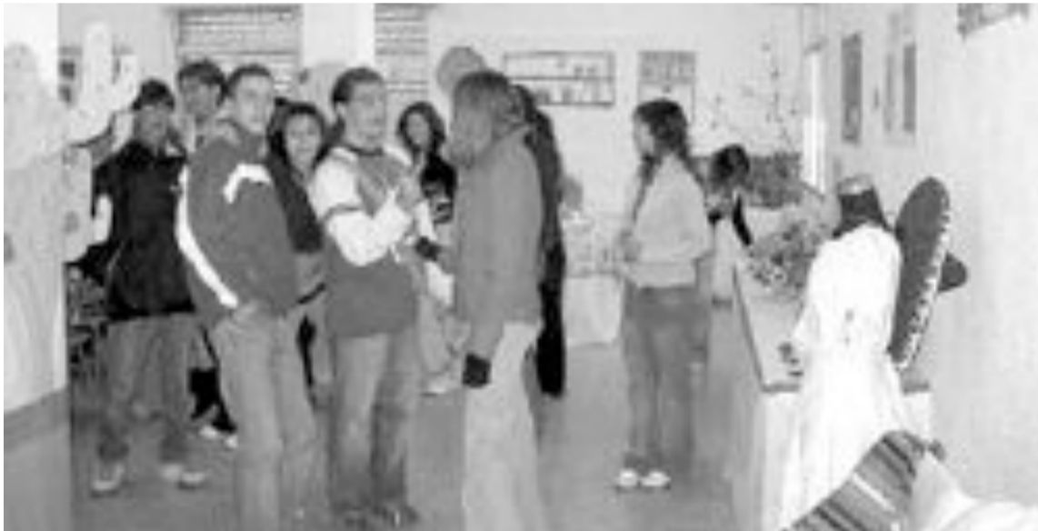
La clase de 4º V de la ESO ganó el concurso con la recreación de la Navidad en México

Durante dos semanas, según explica la tutora, estuvieron investigando sobre este país para conocer de primera mano cómo pasan sus habitantes