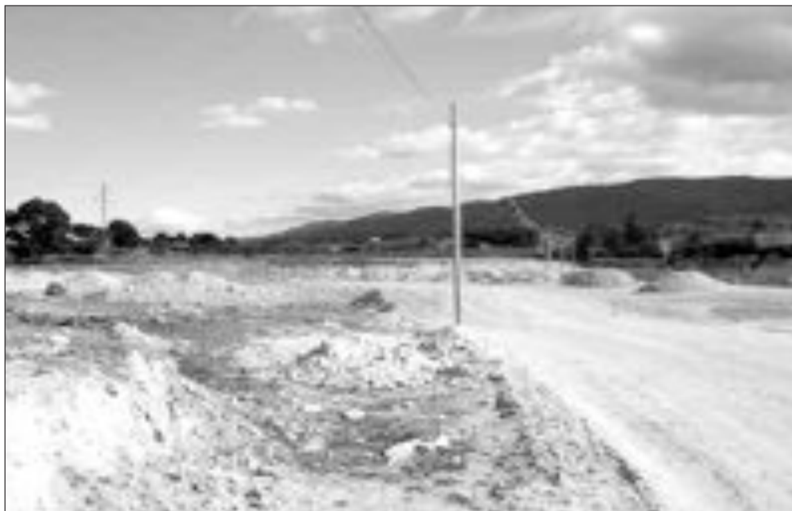
Las máquinas vuelven a trabajar en la zona de ocio