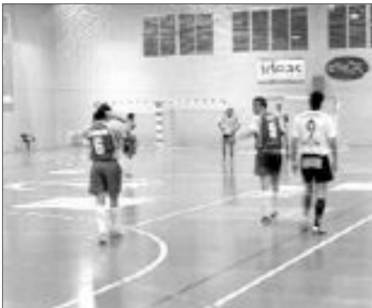
Este fin de semana no habrá jornada de liga en fútbol sala