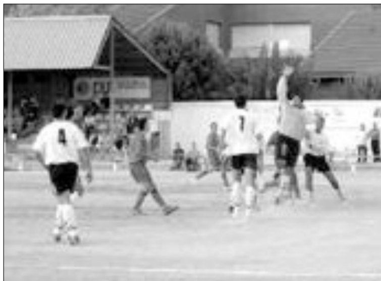
El partido de esta semana se celebrará de nuevo el domingo

La primera parte fue bastante competida, aunque los locales fueron superiores y tuvieron ocasiones claras que no supieron aprovechar. En la segunda mitad no dejaron de atacar y crear ocasiones de gol, pero siguieron sin estar finos de cara a puerta.