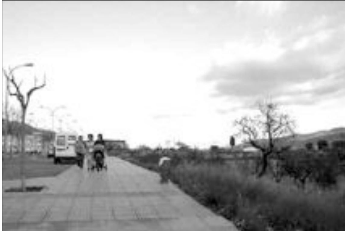
El PAI afecta a los 240.000 metros, entre el colegio Felicidad Bernabeu y el estadio Climent

Para los socialistas, el que el PP publique en el DOGV este plan y lo tramite "pone de manifiesto la incompetencia en la gestión de nuestros actuales