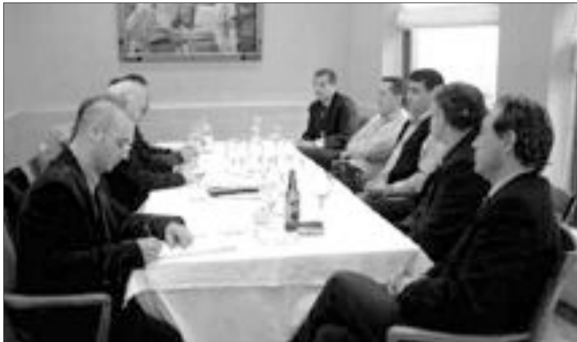
Miembros de la Directiva de la UCEF reunidos el martes en el restaurante Cassana de Castalla

Los miembros de la Directiva, durante la reunión mantenida el martes en Castalla, mostraron su preocupación por la falta de seguridad y se hicieron eco de los dos últimos atracos perpetrados en el polígono de Ibi este fin de sema-