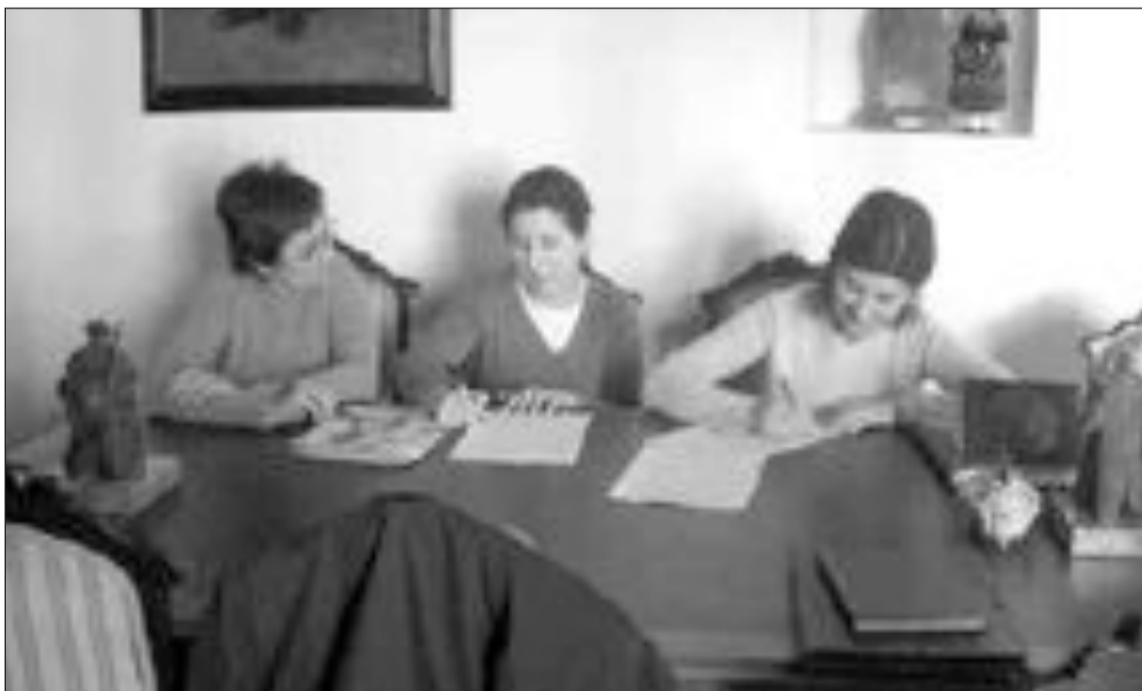
La alcaldesa y la responsable de la ONG en la Comunidad, firman el convenio de colaboración