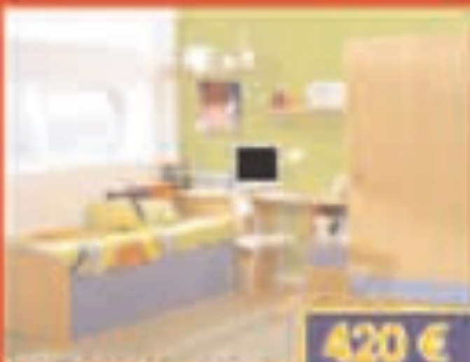
Juveniles igual foto: color a elegir