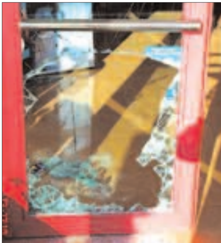
Cristal roto de la puerta de Sola Decoración tras el robo del viernes