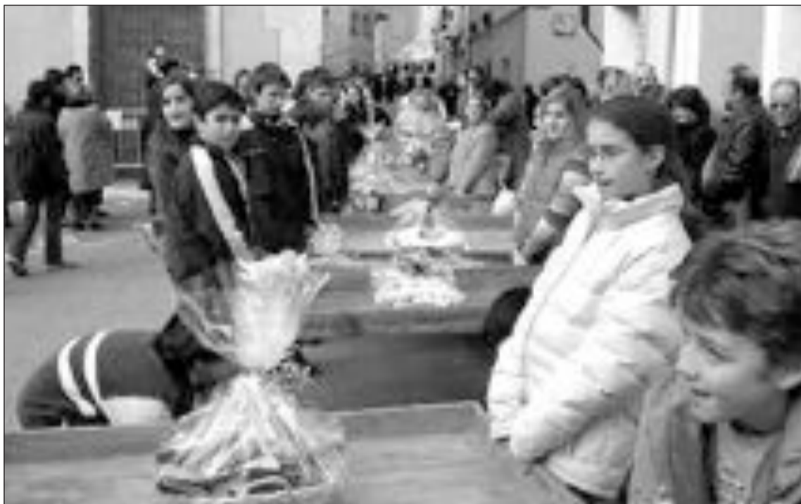
La Cofradía de San Antonio organiza una subasta para recaudar fondos para la fiesta

Una cordà el sábado anterior a San Antón, sirve para anunciar estas fiestas.