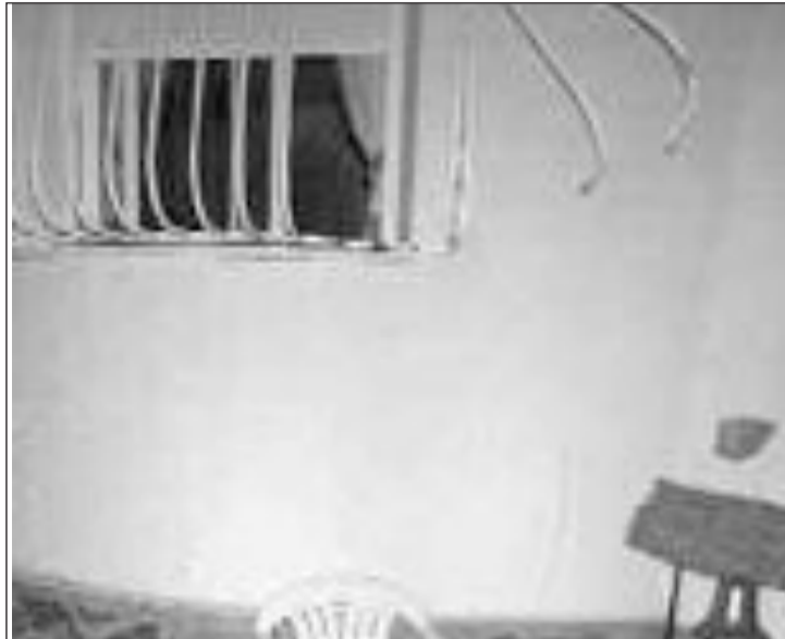
Imagen de uno de los robos perpetrados la semana pasada

Por otro lado, explica, la respuesta a esta decisión ha sido unánime e incluso se mejora la propuesta del Grupo popular municipal en la que, a través de una moción, pedía la creación de una plaza de policía y la baja de un operario municipal.