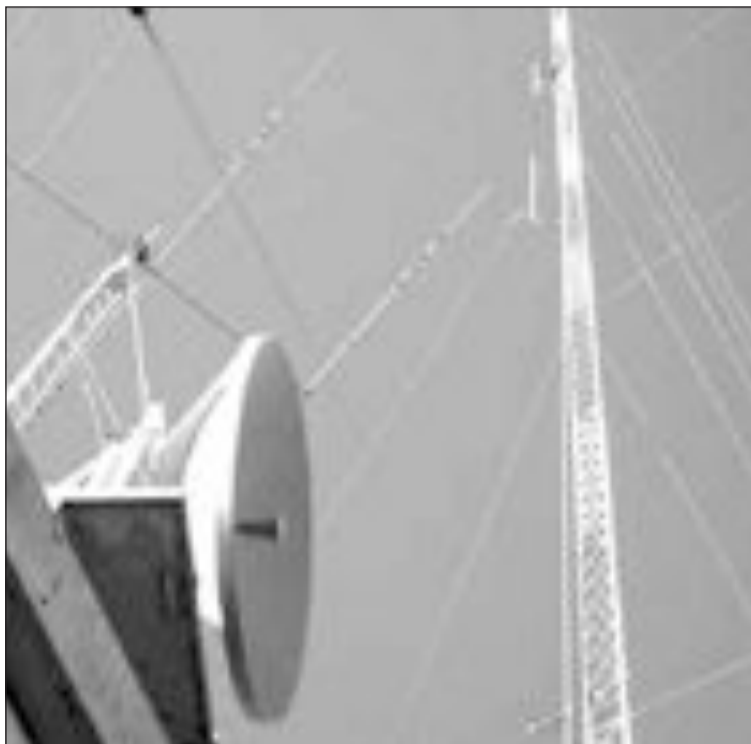
Repetidor de antena de televisión

De todos modos, aclara, la oferta de canales de la Televisión Digital Terrestre es mucho menor que la de los otros distribuidores digitales. "Hay una gran confusión sobre este tema porque la gente piensa que podrá ver los mismos canales y nada más lejos de la realidad". En la TDT se verán las televisiones generalistas (TVE, La 2, Antena 3, Tele 5 y las autonómicas) y los nuevos canales creados recientemente por estas televisiones que se nutren de