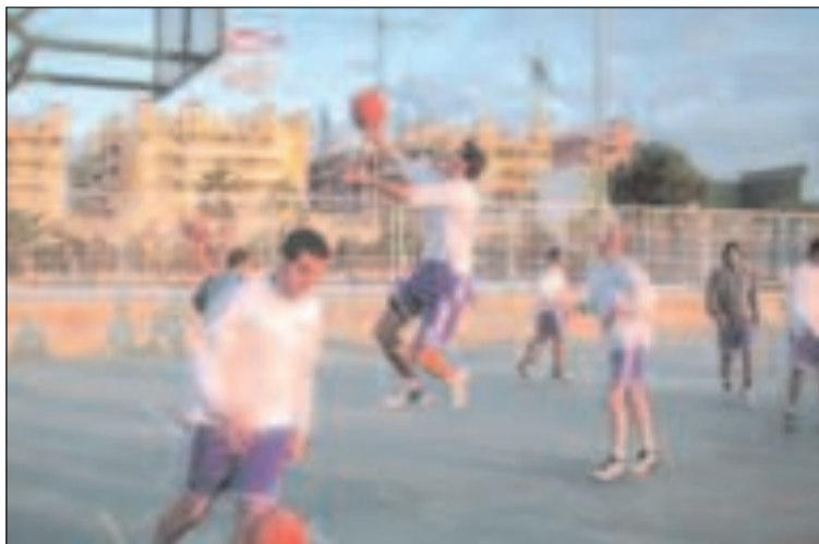
El Teixereta suele realizar sus entrenamientos en el Polideportivo ibense

Nadie contaba con una salida a pista tan mala en el primer cuarto, donde las ibenses no realizaron nada de lo preparado y acordado para este partido. Las locales (del Elda) se pusieron en 22-2. Con sufrimiento y esfuerzo fueron lentamente recortando distancias en