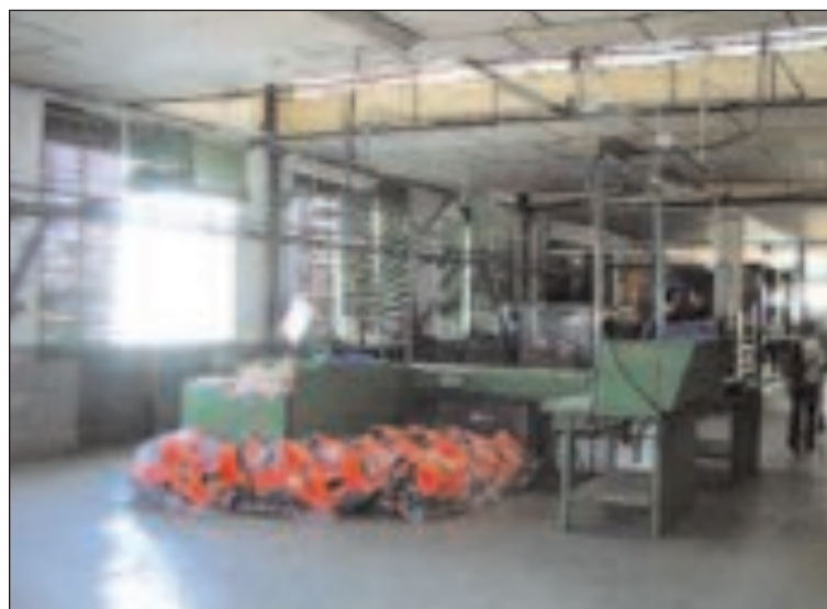
El sector industrial ha sido el más afectado por el paro en 2005

Para los cuerpos de seguridad, esta comarca sigue ocupando los niveles más bajos de siniestralidad, respecto a otras zonas de la provincia de Alicante