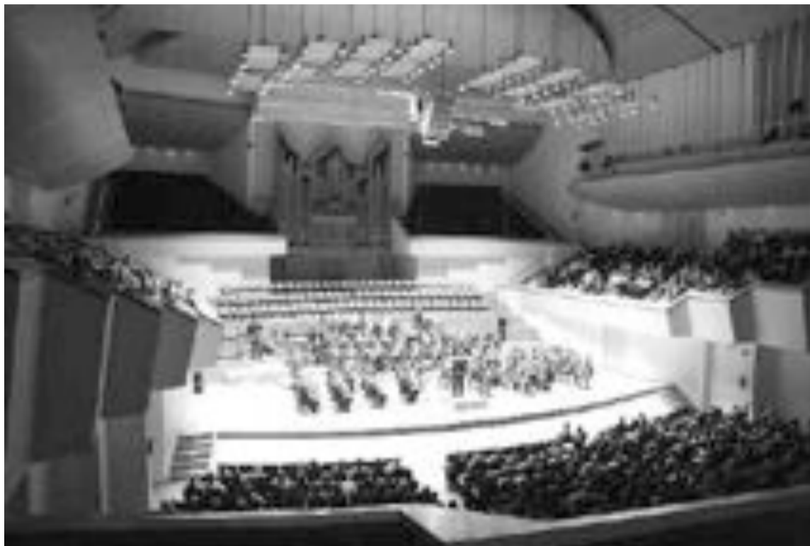
El CIMO interpretó siete piezas ante un auditorio prácticamente completo de público