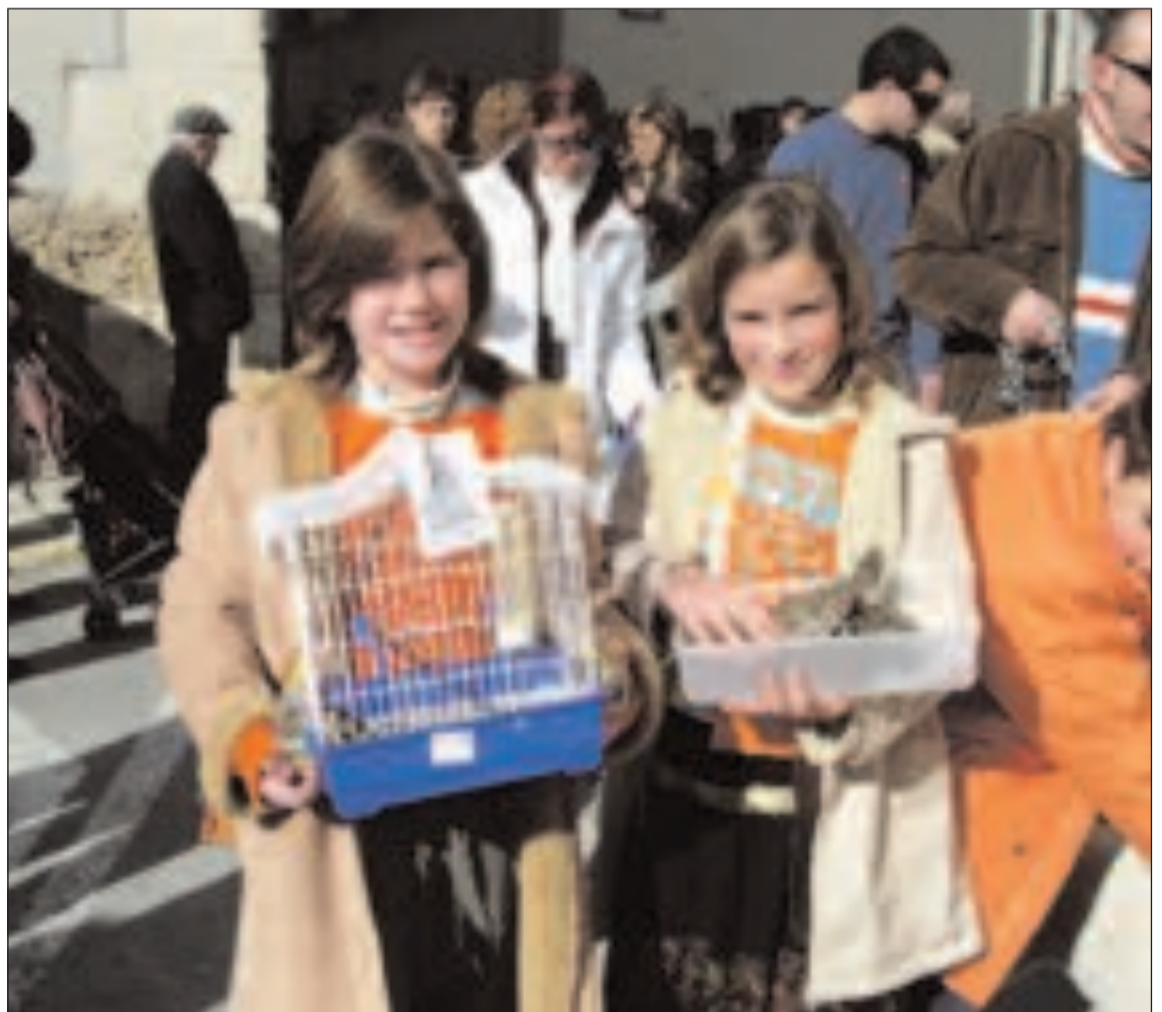
Dos niñas muestran orgullosas sus animales

La agradable temperatura de la jornada propició la asistencia masiva a este acto que, en Biar además, se celebra junto al tradicional paseo del Rei Pàixaro. Los biarenses disfrutaron de esta tradición con el que concluyen las fiesta.