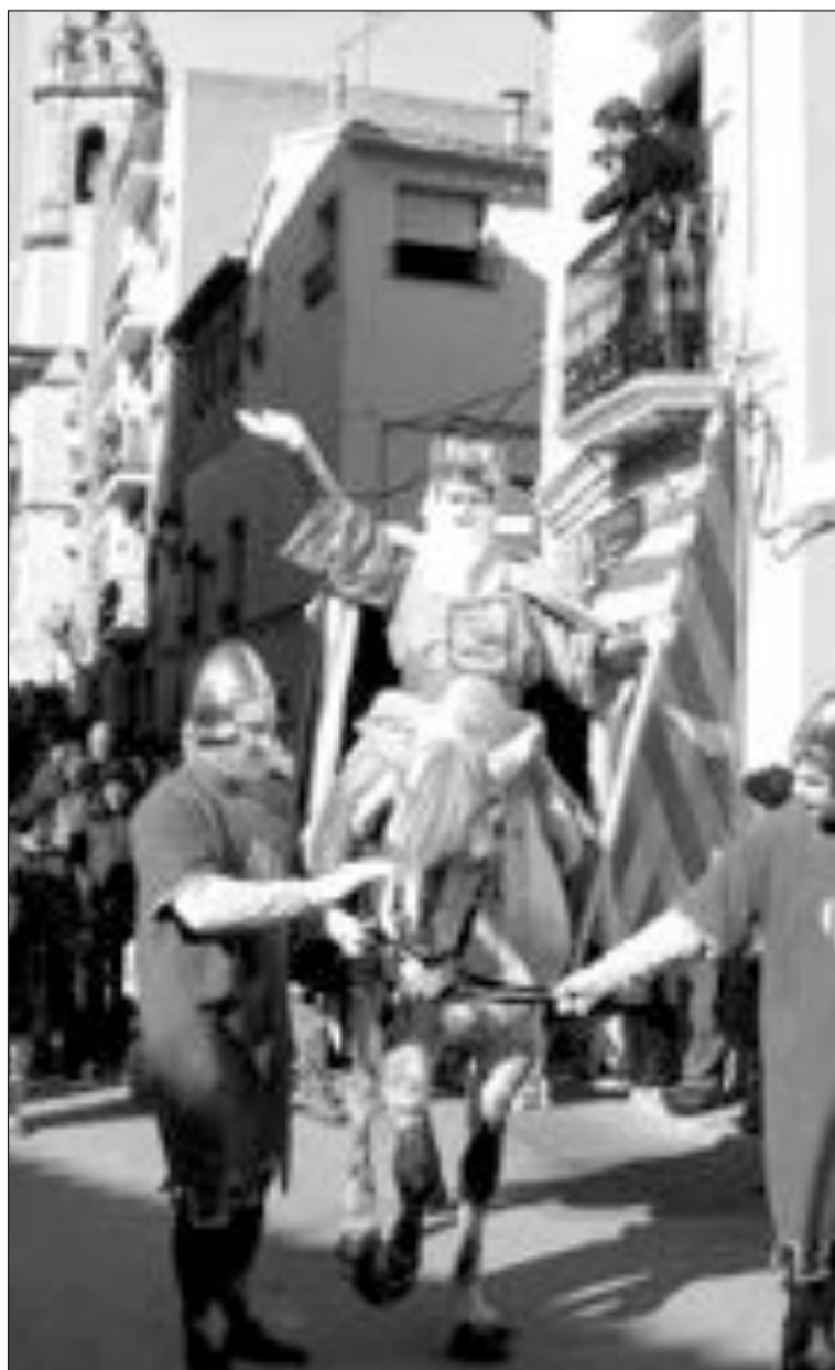
El Paixaro saluda al público