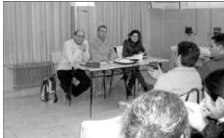
Miembros de la Plataforma provincial a favor de la Religión

Defienden una formación integral de la persona "para que sepa decidir" y el derecho de los padres a la educación de Religión.