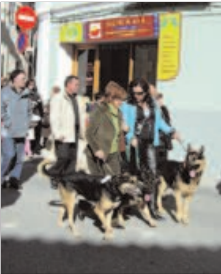
Los perros fueron las mascotas más numerosas