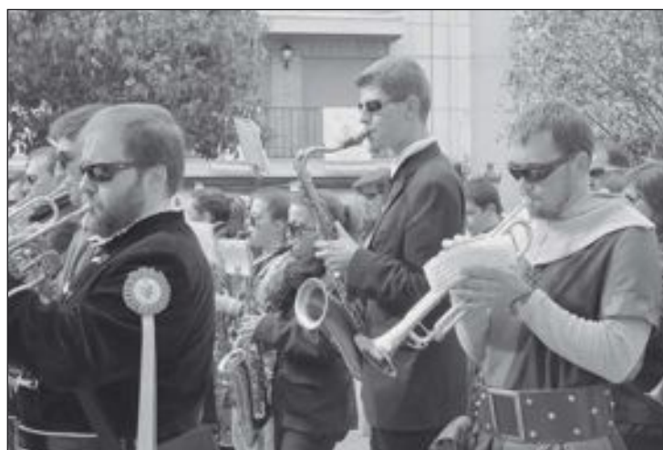
La Fiesta de Moros y Cristianos no podría existir sin los músicos