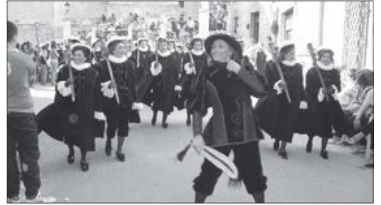
Comparsa de Estudiantes

Es el inicio del día grande de las fiestas biarenses que congrega a numerosos vecinos.