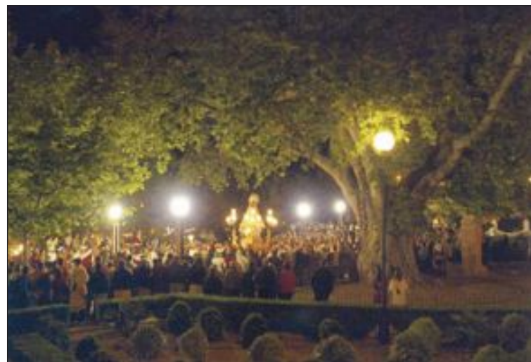
Uno de los actos más multitudinarios es la bajada de la Virgen del Santuario

La hospitalidad de sus gentes y el ambiente festivo que ofrecen es una excelente oportunidad para visitar esos días el municipio.