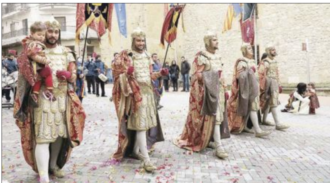
Comparsa Vizcainos (Capitanía)