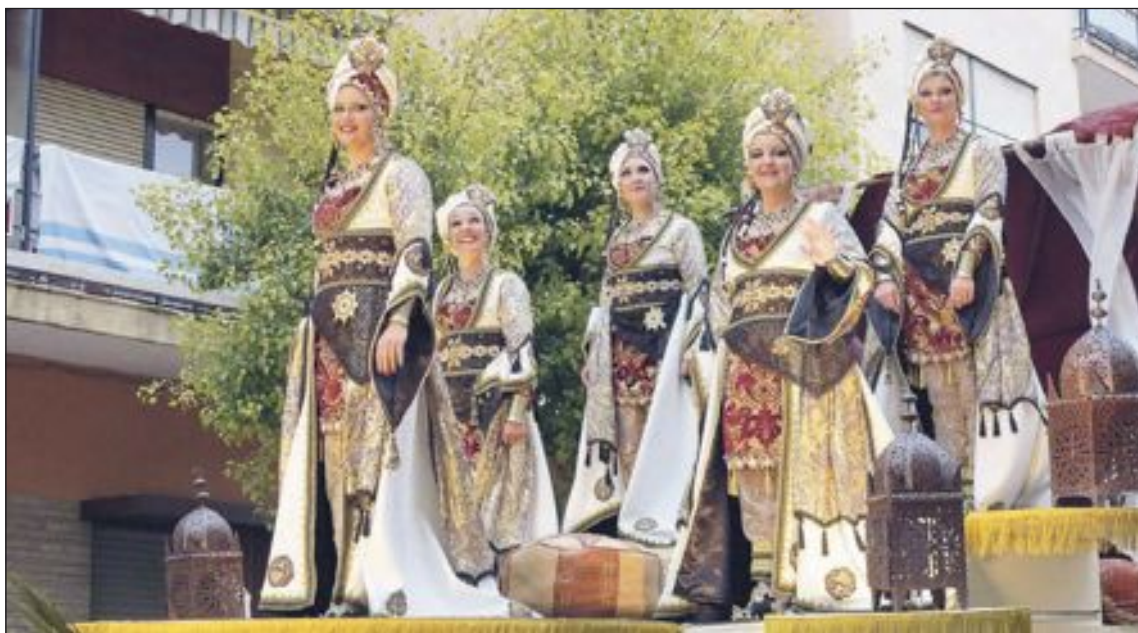
Comparsa Moros Artistas (Capitanía)