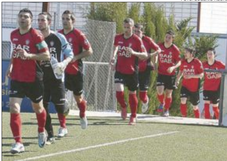
Los jugadores del Rayo Ibense saltan al terreno de juego