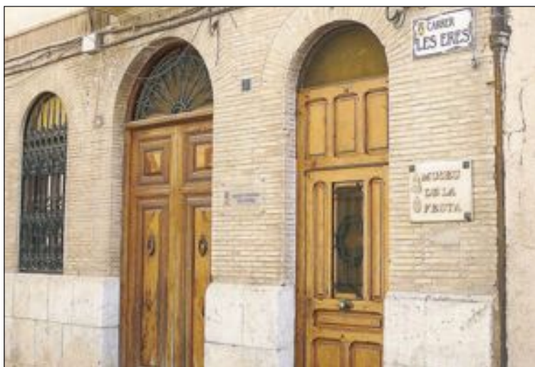
El acceso a la segunda planta del Museo de la Fiesta es más complicado

Pese a ello, manifestó que se buscarán las soluciones necesarias para que el Museo de la Fiesta sea accesible.