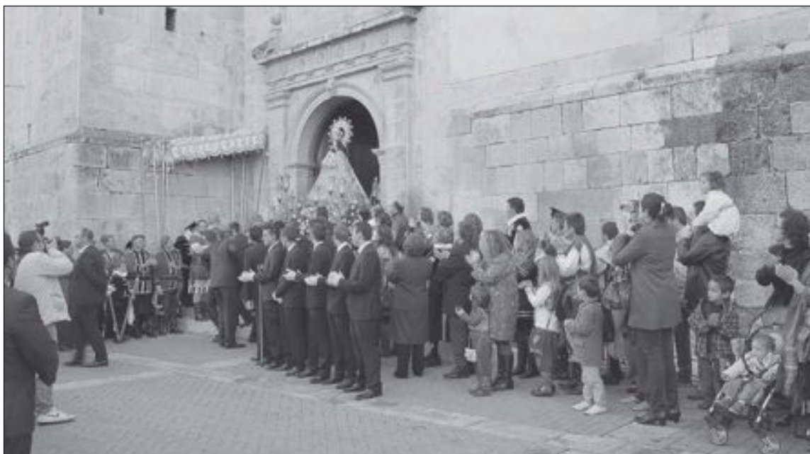
La Virgen de la Salud sale de la Iglesia Parroquial para dirigirse a la plaza Mayor, el último día de Fiestas