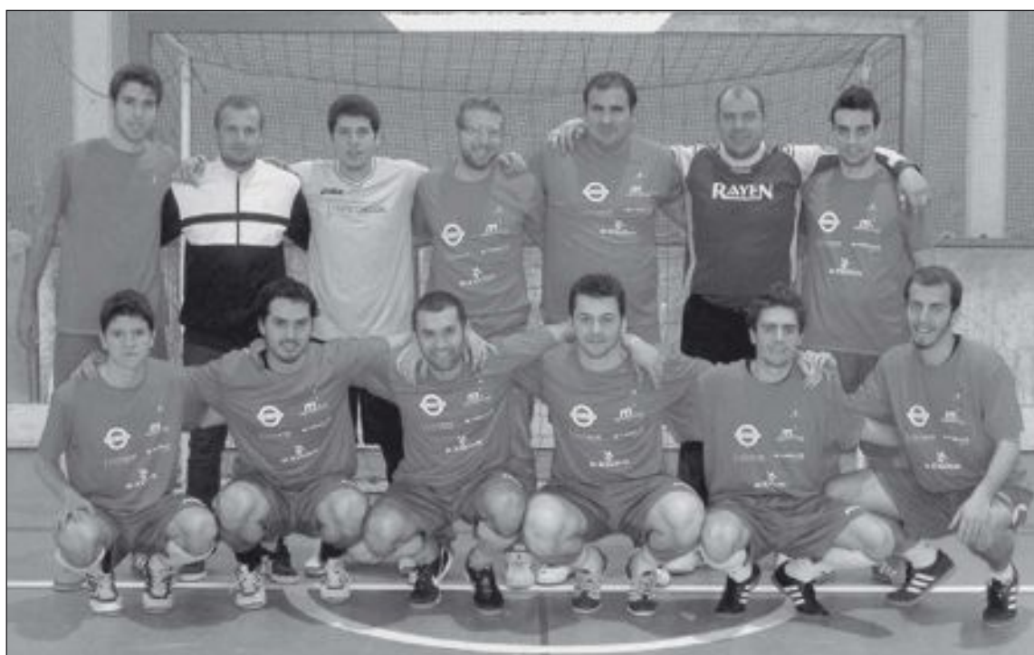
Selección de jugadores ibenses que participó en este campeonato comarcal disputado en Cocentaina

La selección ibense empataba el primer partido a tres tantos contra el Muro, ganaba el segundo partido por 6-1 contra el barrio San Rafael d'Ontinyent y se imponía por un contundente 8-2 al Trabe FS (de Castelló de Rugat). Así, la selección ibense pasaba a la final por mejor gola-