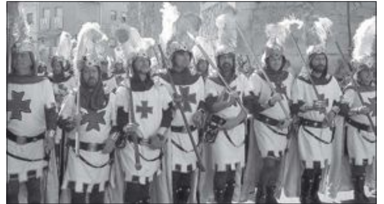
Comparsa de Blanquets