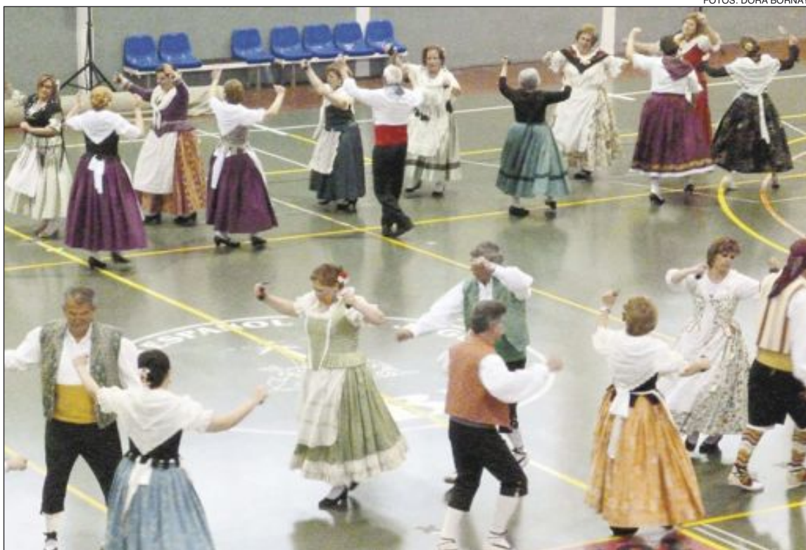
La escuela municipal de danzas y el colectivo Amics de les Muntanyes participaron en el festival

Celebrado el sábado 27 de abril en el Polideportivo