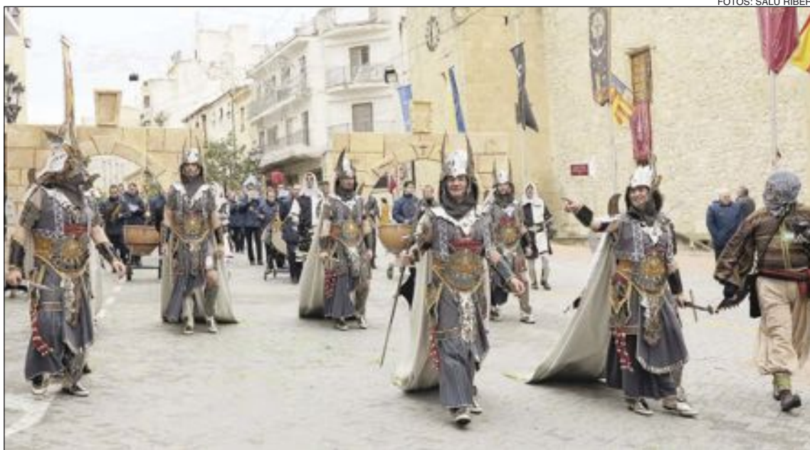
Comparsa Cristianos (Capitanía)