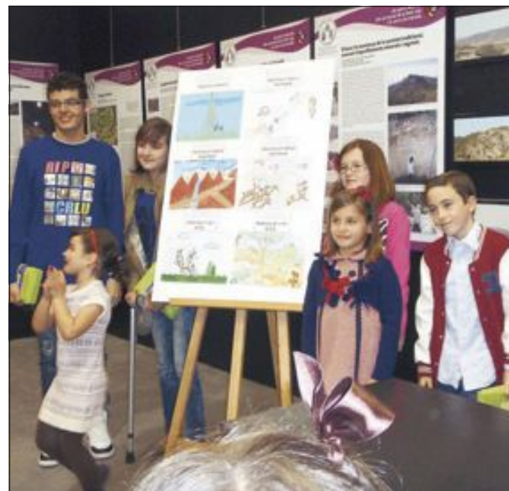
Alumnos premiados en el concurso de dibujo ecológico

Elita, la asociación de ballet Letca, el ballet Ana Sarabia, la escuela municipal de Danza, Amics de les Muntanyes , el grupo de Danzas, gimnasio Energy y joyería Ramírez.