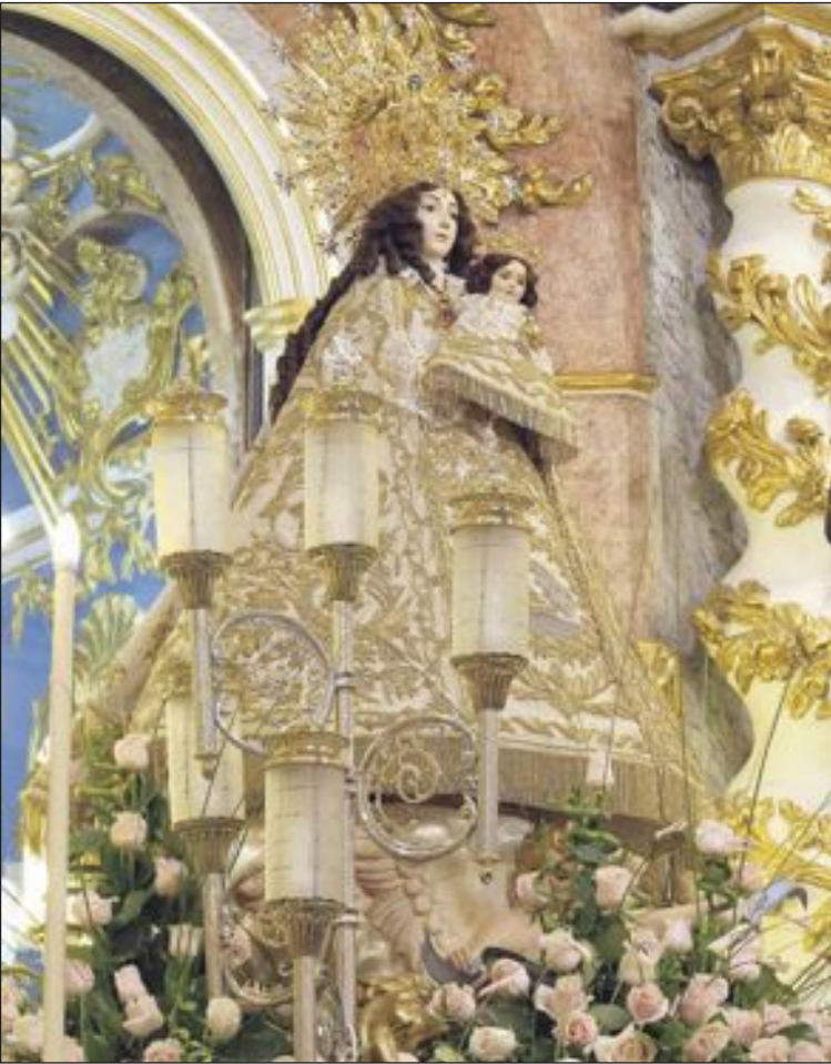
La patrona de Onil vuelve a descansar en su Ermita tras las Fiestas