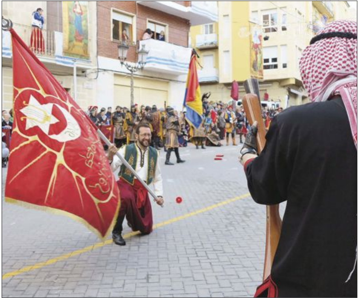
Espectacular Ballà de Banderes en la plaza Mayor