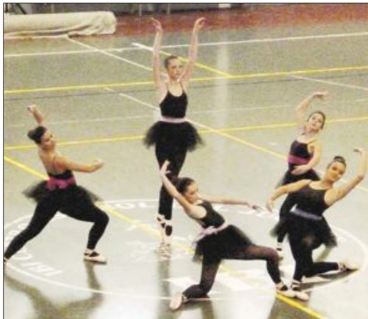
Gimnasios y grupos de ballet también colaboraron en este proyecto

El importe total de este hogar es de 63.513 euros y todos los donativos que recaude este año Manos Unidas, en toda España, se destinarán a este proyecto.