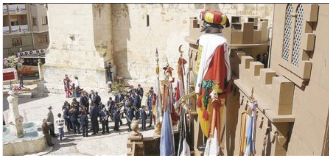
La Mahoma presidiendo el castillo de fiestas