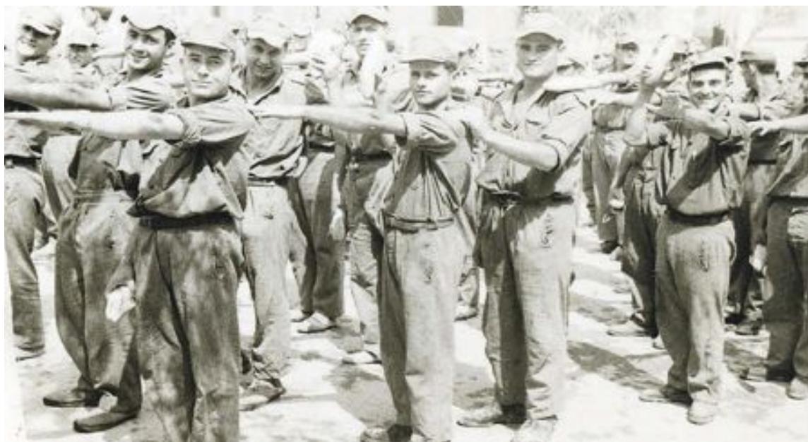
Foto que ilustra el cartel de la exposición sobre el servicio militar

VIDEO CLUB C/. Tíbi, 8 - Tel. 96 633 82 09 - IBI www.mundocineibi.com