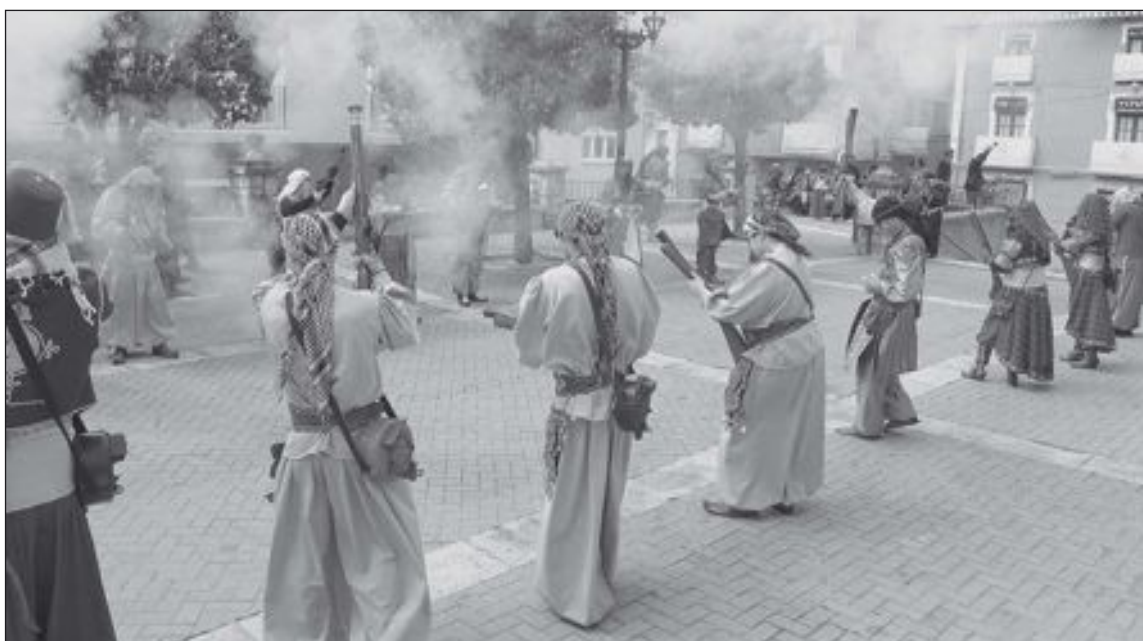
Salvas de arcabucería en la plaza del Carmen, el martes 30 de abril