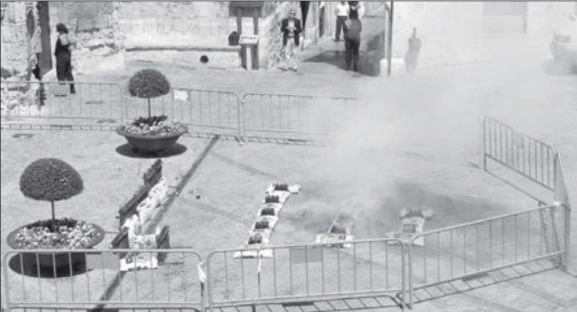
Hasta ahora la mascletà se disparaba en la plaza de la Constitución, tras el rezo del Ángelus

Para cumplir con el nuevo reglamento de pirotecnia