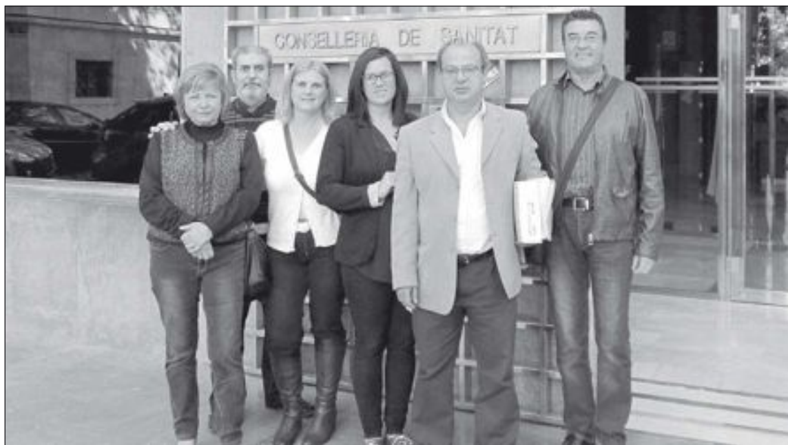
Miembros de la plataforma pro-ambulancia ante la sede de la conselleria de Sanidad antes de la entrega de firmas

Los convocantes exigen que se restablezca el servicio de 24 horas que había en Ibi antes del 1 de marzo, fecha en la que entró en vigor el recorte aplicado por la Generalitat.