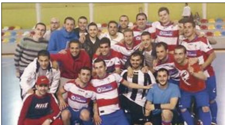
Equipo La Casa FS (y amigos)