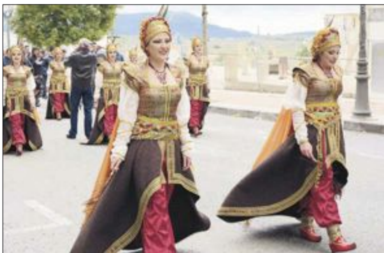
Comparsa Moros Marrocs (Capitanía)