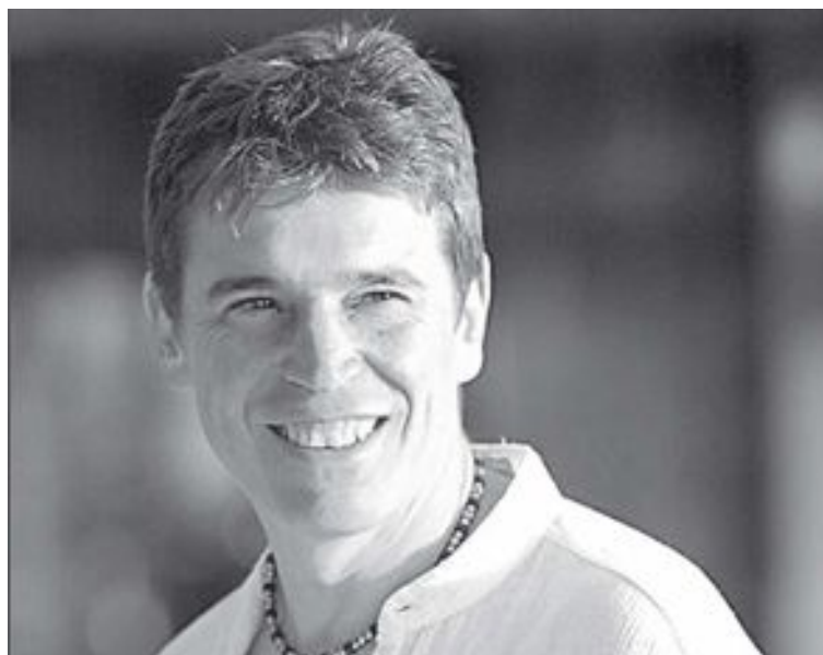
El cantante malagueño Javier Ojeda es el líder de Danza Invisible

-¿A qué tipo de público va destinada esta actuación?