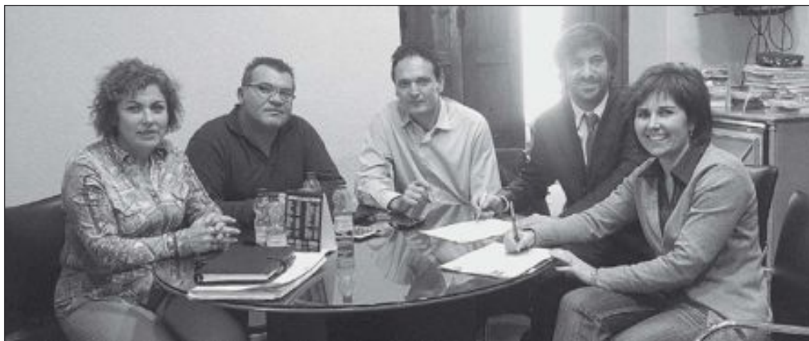
Firma del convenio entre Las Torres Solar y el Ayuntamiento de Castalla, en diciembre de 2012

ra de revisar este punto para volver a votar el convenio y, previsiblemente, poder aprobarlo, el voto en contra de PP y UCiD sólo sirve para retrasar la puesta en marcha de todo el proceso que desembocará en la puesta en marcha de una instalación que estará ubicada en una parcela de 700 hectáreas al sureste del término municipal castallense y será capaz de suministrar energía a unas 70.000 viviendas, según el equipo de Gobierno.