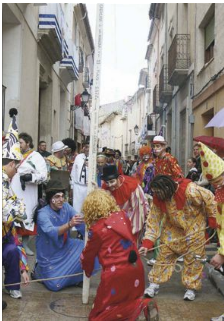
Medició dels espies