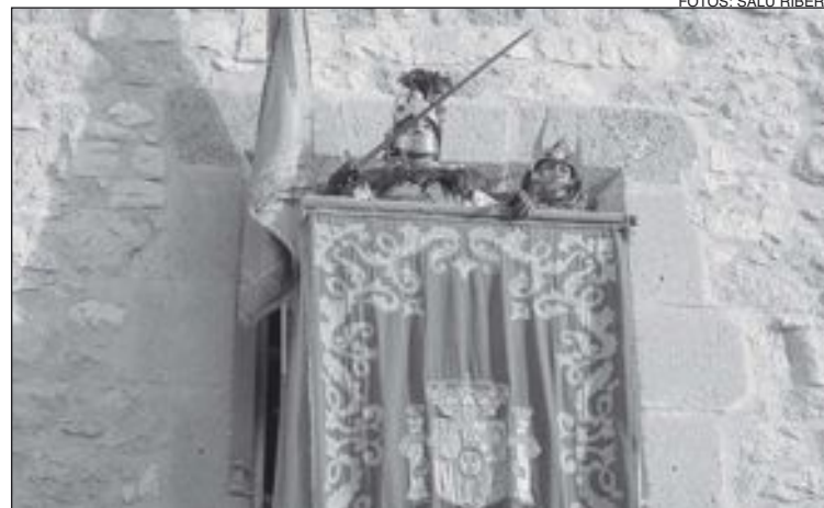
Intervención del embajador cristiano desde el Palacio del Marqués de Dos Aguas