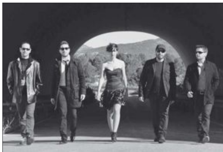
Imagen promocional del grupo Suite Poemia