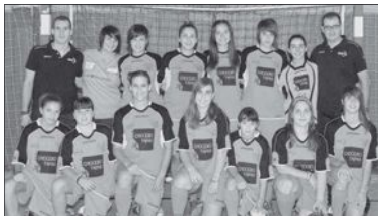
Equipo Kiwibi en categoría Sénior

Desde la Directiva animan a los aficionados a que asistan al partido de vuelta contra el Santa Rosa, el domingo 5 a las 12:30 horas en Alcoy, o que vayan a despedir a las jugadoras al Chocero a las 10:30, cuando saldrán con un bus de JJDeLuxe .