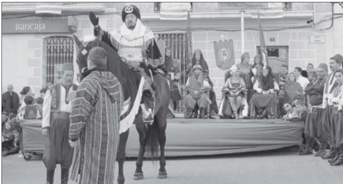
El embajador moro se dirige, desde su caballo, al embajador cristiano, situado en una ventana del Palacio