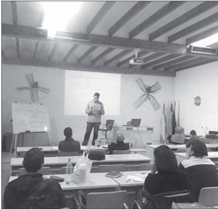
A las jornadas asistieron un total de 22 personas

Por su parte, el presidente de ATIF se encargó de las charlas sobre internet y redes sociales, así como de la ponencia: 'La comunicación como vía de