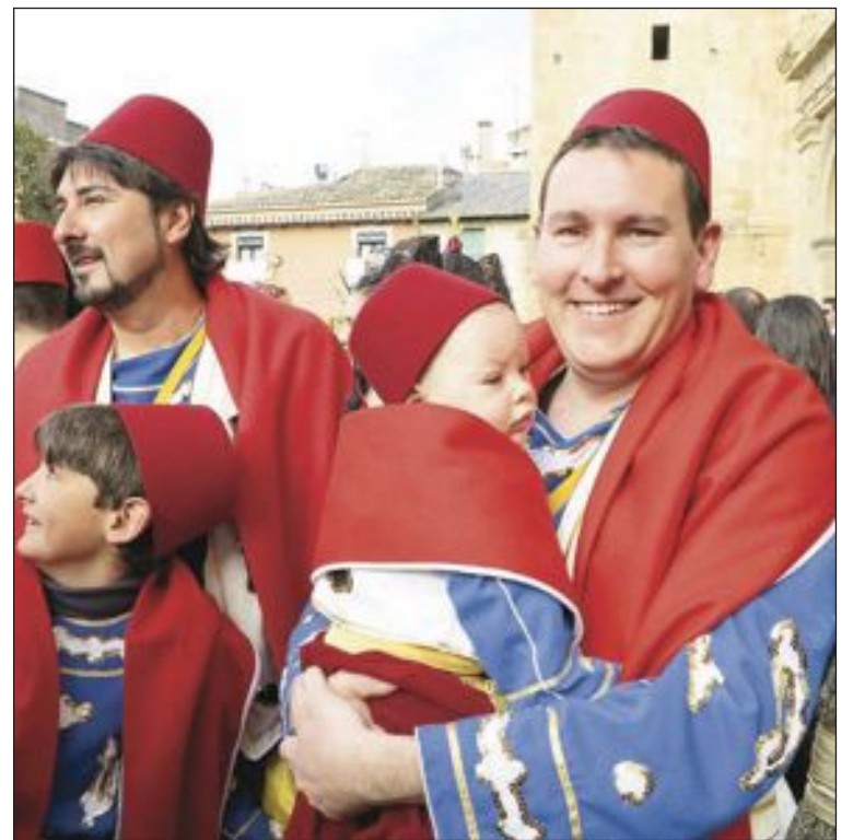
Con apenas unos meses de edad, este bebé ya milita en la comparsa Moros

Sin embargo, la Virgen de la Salud, patrona de Onil, arrojó con su manto a la villa muñequera y no permitió que la nefasta meteorología desluciera ninguno de los actos principales de estas Fiestas. Aunque con un frío inusual para esta época del año, festeros, vecinos y visitantes siguieron el guión previsto, que apenas sufrió alteraciones, y vivieron intensamente los días grandes de esta ancestral tradición, disfrutando tanto de los actos festeros como de la feria.