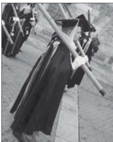
Desfile de la comparsa Estudiantes