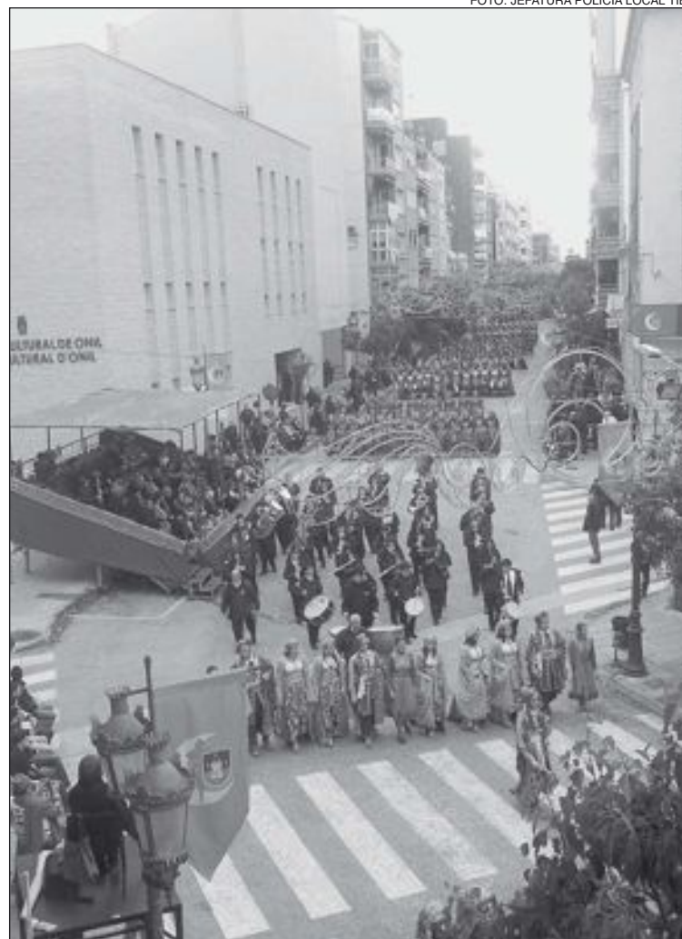
Vista general de la avenida de la Constitución durante la Entrada Mora