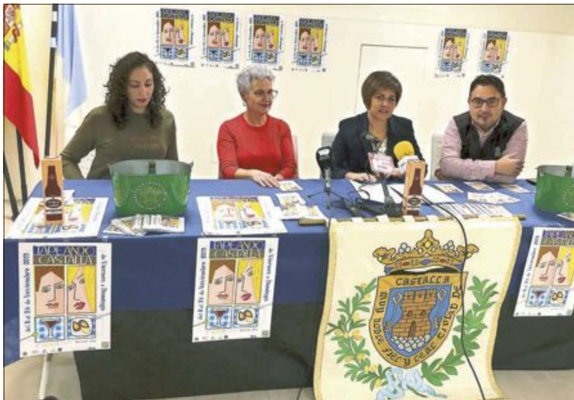
Presentación de la ruta de tapas el martes 5 de noviembre, en el Ayuntamiento

El Ayuntamiento ha efectuado una campaña informativa durante la semana previa a la cita electoral para que todos los ciudadanos que vayan a votar tengan claro dónde acudir.