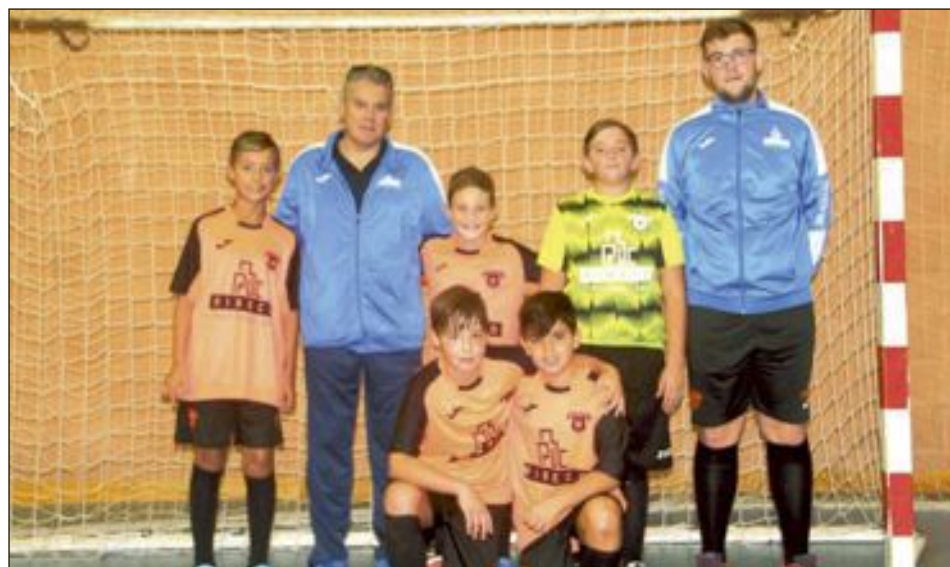
C.F.S. Ribeco Castalla Alevín