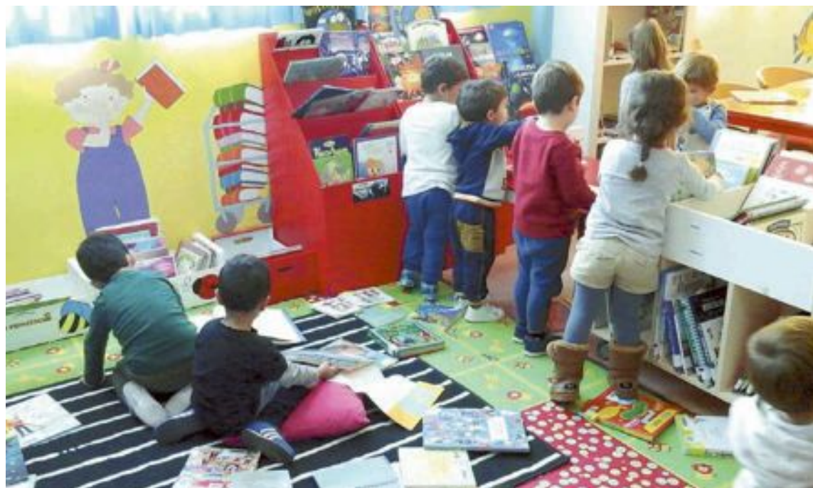
L'activitat va tindre lloc el dimarts 5 de novembre i van assistir els alumnes de 3 i 4 anys del col·legi Sant Jaume

Dentro de la programación 'Rutas mágicas por Ibi y su alrededores', el 16 de noviembre está prevista la visita a Santa Marieta-Les donzelles. La excursión será a pie y comenzará a las 9 horas desde el Museo de la Biodiversidad. Se visitará el Castell Vell y el Pi de les Revoltes.