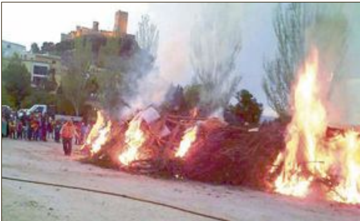
Foguera de la Verge dels Dolors

L'Ajuntament ha demanat al Consell que les Festes de Moros i Cristians i la Foguera de la Verge dels Dolors siguin declarades d'Interés Turístic Local. La mesura va ser aprovada en el ple extraordinari del 7 de novembre i persegueix protegir la realització de la tradicional foguera del divendres anterior al Diumenge de Rams i també les fogueres del 10 de maig que acompanyen la Patrona durant la seua baixada al poble.