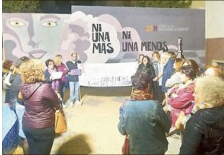
La asociación Mariana Pineda volvió a organizar una concentración el 4 de noviembre por el último asesinato machista y contra la sentencia de la manada de Manresa

Estas violencias, se indica en la moción, “tienen su origen y núcleo en la pervivencia de un sistema patriarcal, presente en todas las estructuras de la sociedad, que asume como natural la desigualdad, organiza la sociedad