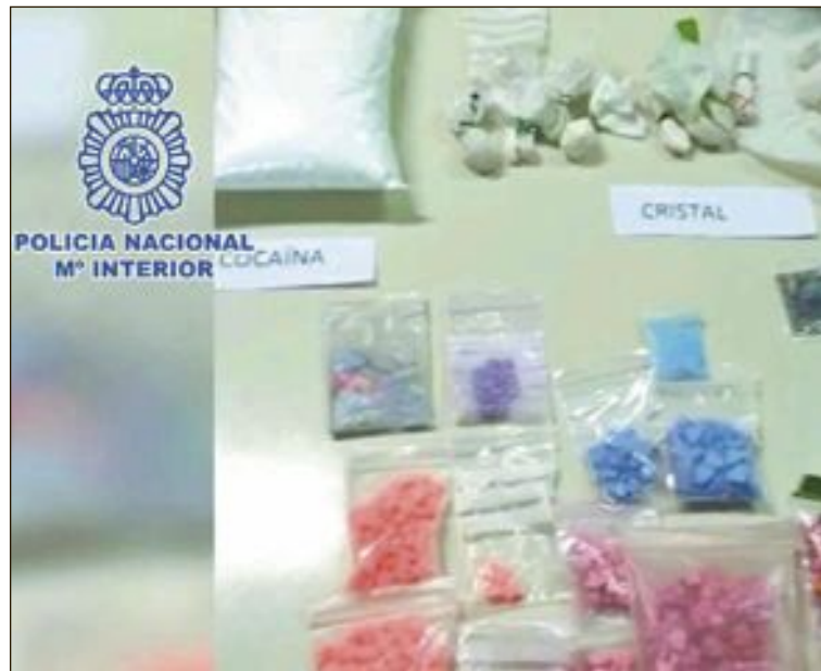
Les fue incautada marihuana, hachís, speed, ketamina y más de 600 pastillas de éxtasis, además de un táser y dos pistolas de airsoft

cena de gala, donde hubo intercambio de regalos, y los peñistas pudieron disfrutar de una gran velada compartiendo con compañeros de otros municipios su misma pasión por los colores del club blaugrana.