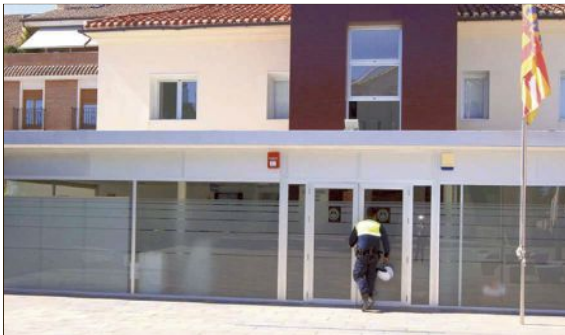
Retén de la Policía Local de Ibi

Tras gestiones llevadas a cabo por los agentes de Ibi con otras fuerzas y cuerpos de Seguridad y con la propia entidad banca-