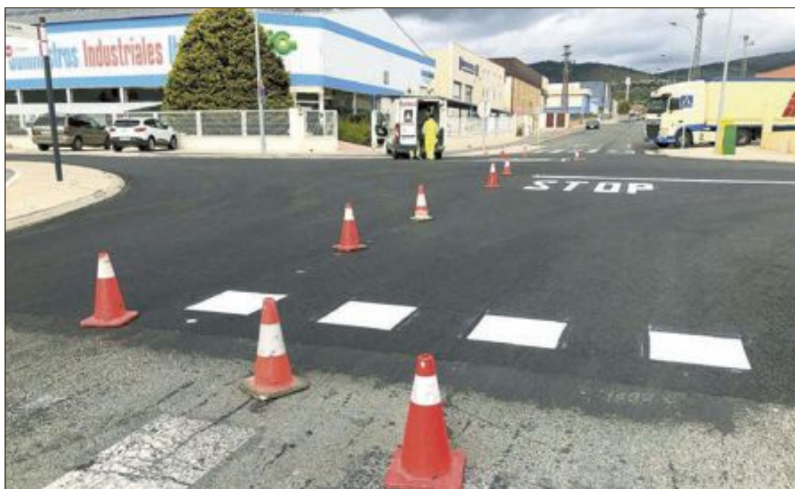
Obras de asfaltado y señalización en uno de los polígonos industriales

Desde hace unos días y durante las próximas semanas se llevarán a cabo obras de mejora en los polígonos de Ibi, algunas actuaciones subvencionadas por el IVACE y otras gestionadas directamente desde el Ayuntamiento de Ibi. El planteamiento de las mejoras ha surgido de las reuniones del grupo de trabajo formado por IBIAE y las áreas de Urbanismo e Industria del Consistorio ibense; como objetivo aumentar la competitividad