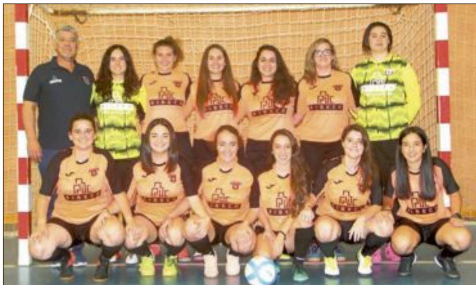
C.F.S. Ribeco Castalla Sénior Femenino