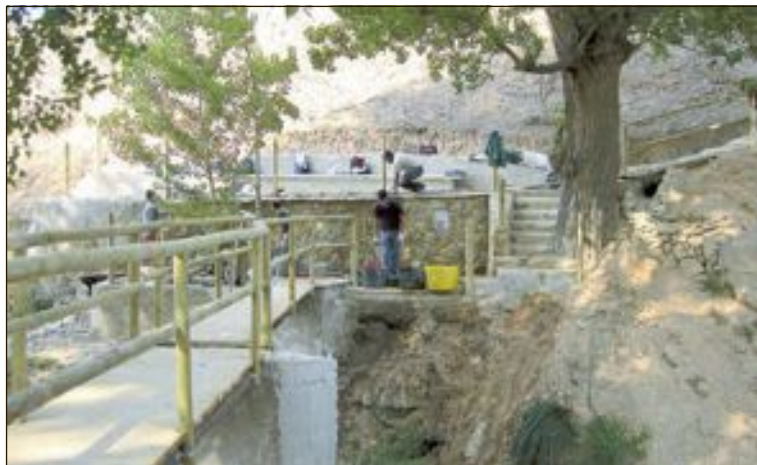
Serán dos oficiales y un peón de albañilería y un oficial electricista