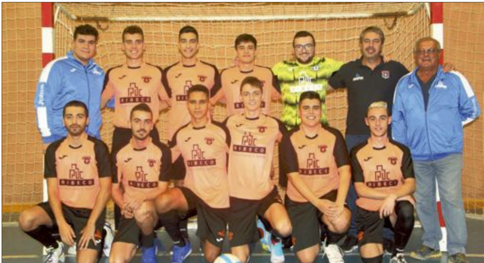
C.F.S. Ribeco Castalla Sénior Masculino