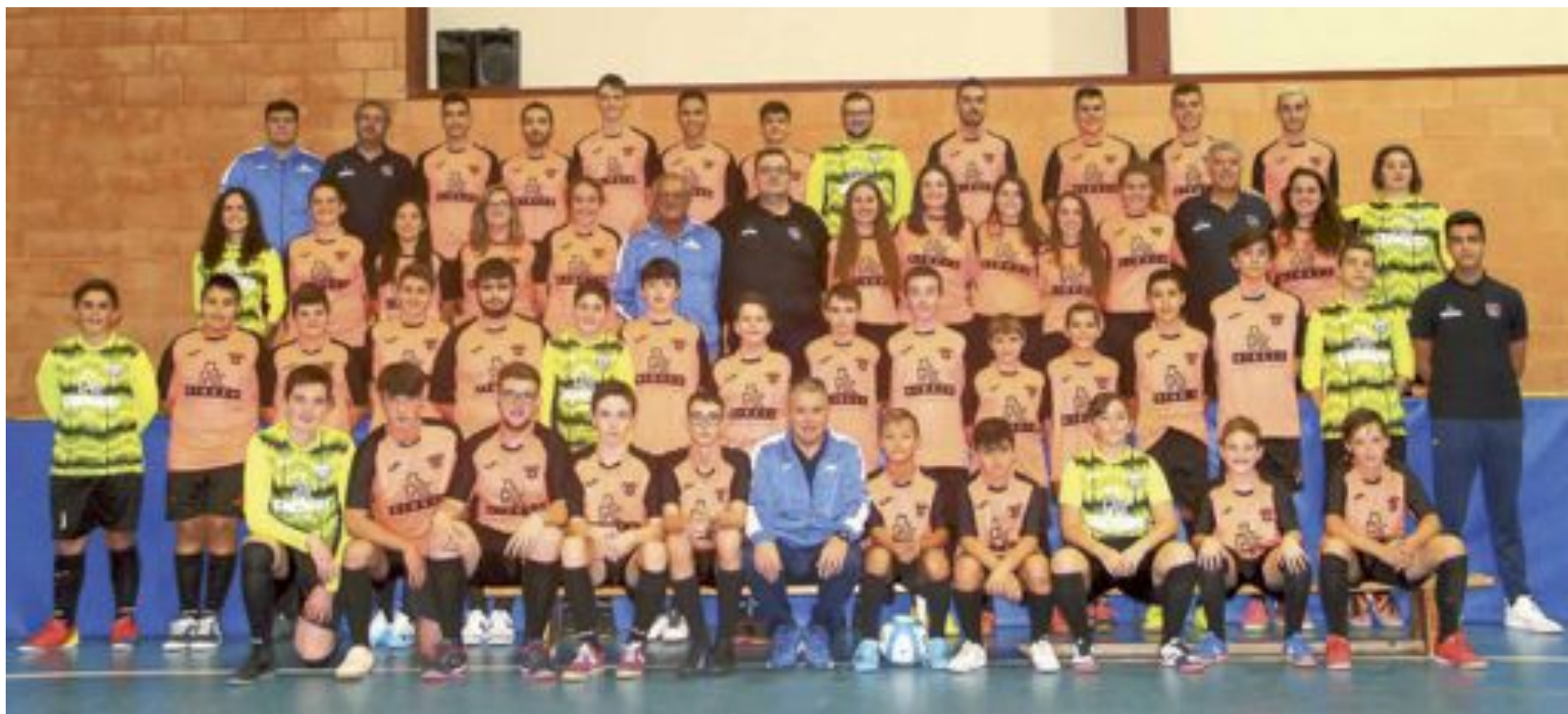
Foto de familia, con todos los jugadores, técnicos y patrocinadores del C.F.S. Ribeco Castalla

PRESENTACIÓN CFS RIBECO CASTALLA TEMPORADA 2019-2020