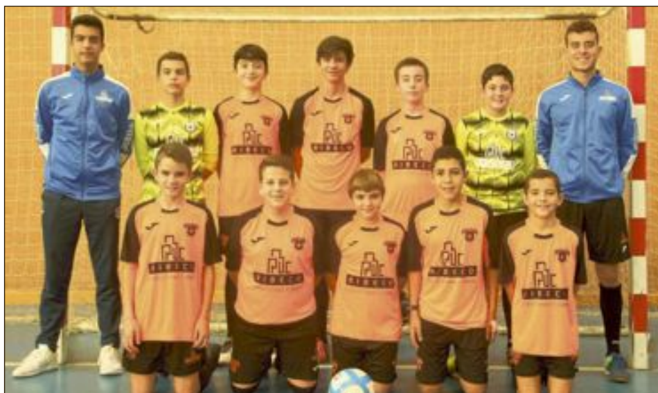
C.F.S. Ribeco Castalla Infantil