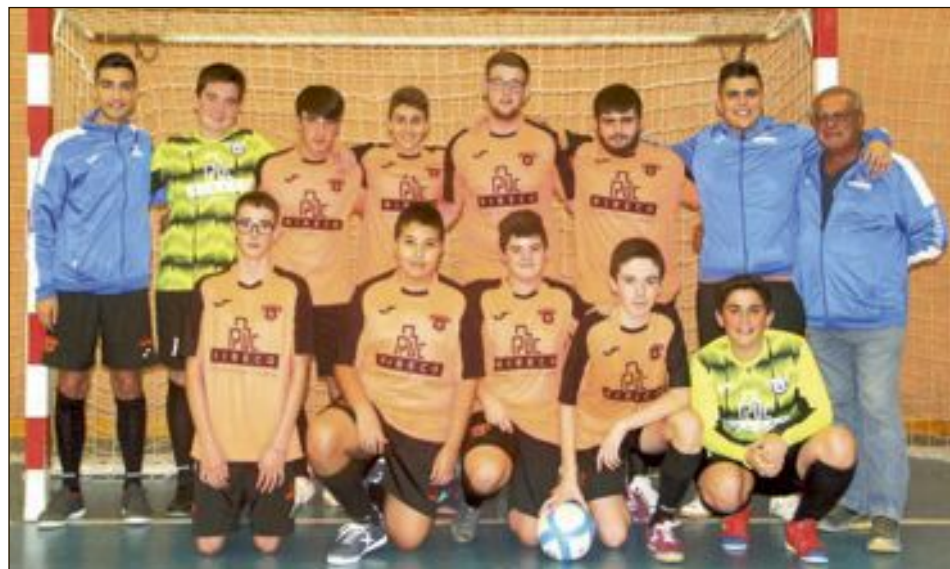
C.F.S. Ribeco Castalla Cadete