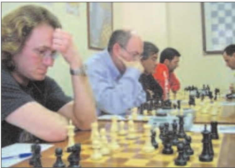
Miembros del equipo del Club de Ajedrez Ibi durante una partida

El equipo del Club de Ajedrez Ibi se clasificó en la sexta posición en la segunda prueba del IV Circuito por Equipos de la Comunidad Valenciana, que se celebró el pasado domingo en Dénia.