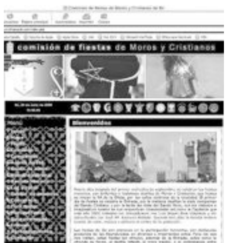
Aspecto de la portada de la página web de la Comisión de Fiestas

La Comisión de Fiestas, aprovechando la puesta en marcha de esta página web, va a adecuar el sistema de información interno y externo para poder recibir correos y facilitar la descarga de bases y formularios sobre concursos.