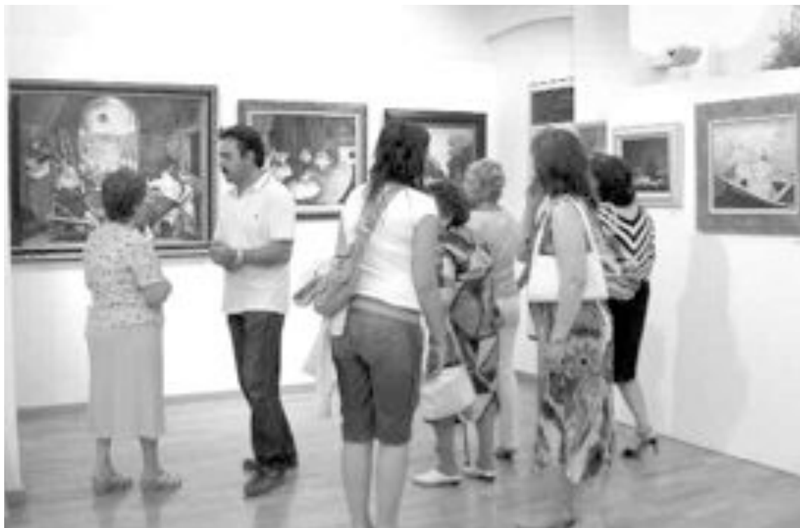
Un total de 67 obras se exponen en la ermita de San Vicente

Inaugurada el viernes en la ermita de San Vicente