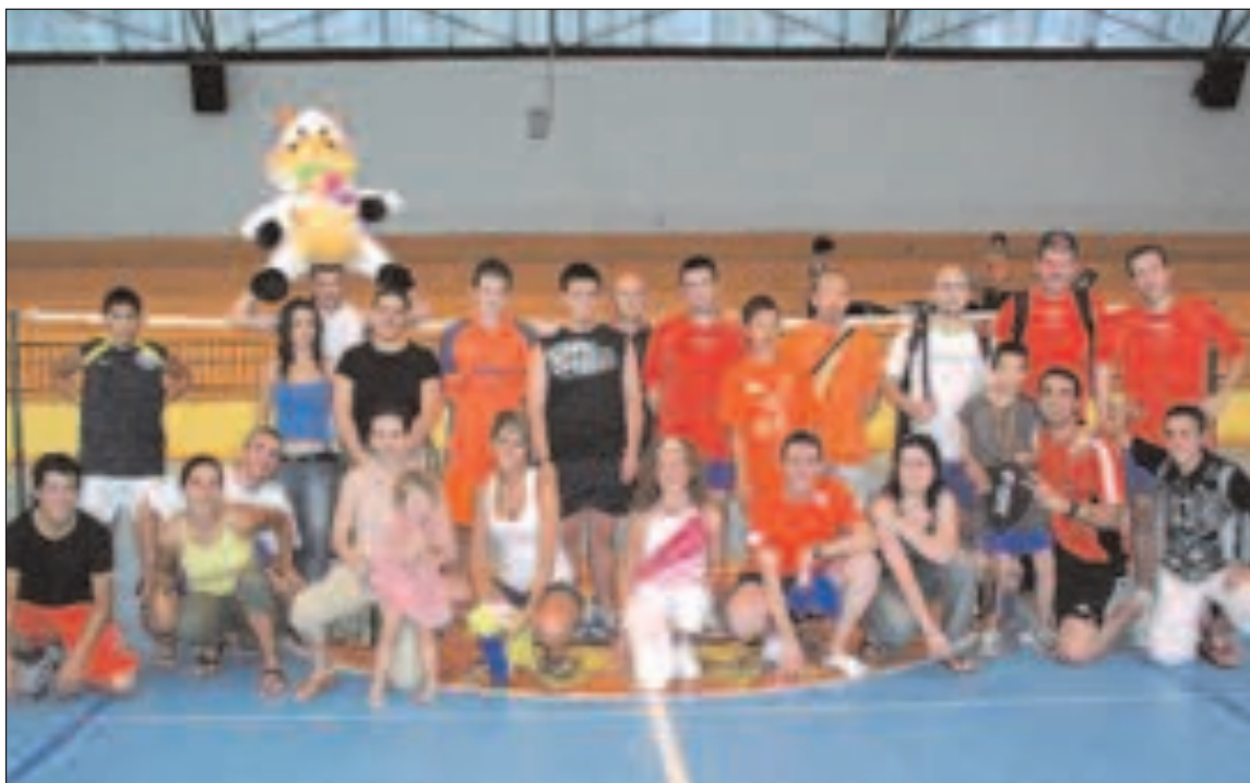
Participantes en el XIII torneo de bádminton 'Villa de Onil'