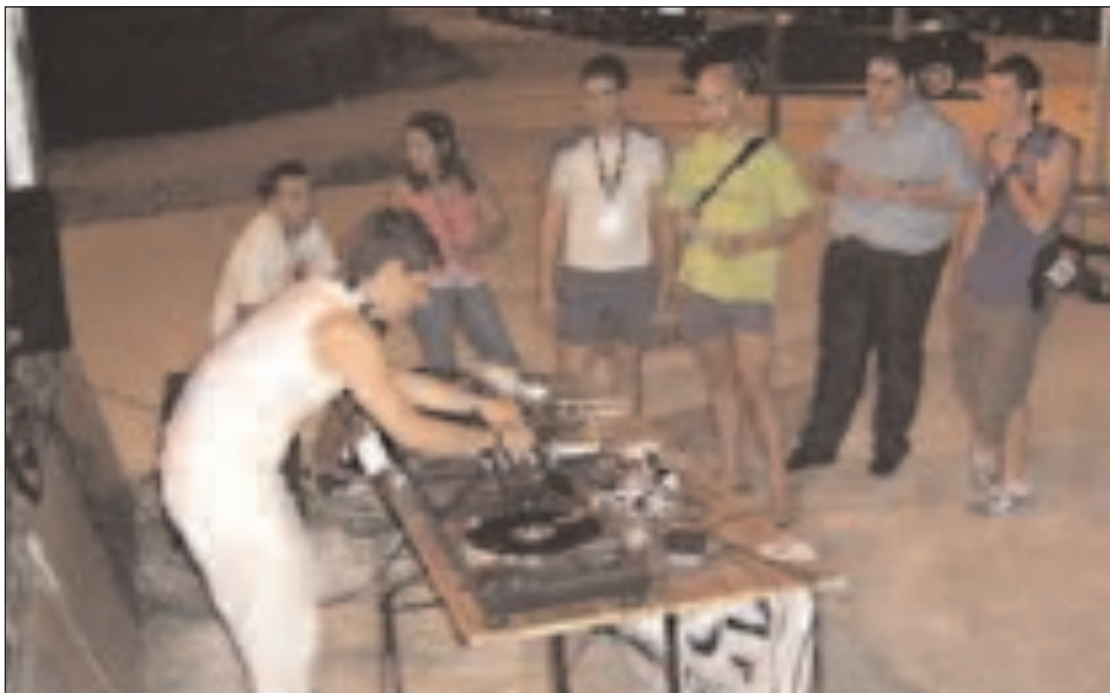
Por la noche, tuvo lugar la final de Dj's, en la carpa montada para la ocasión