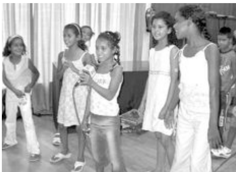
Algunas niñas interpretaron canciones saharauis durante la recepción

informática y han visitado el centro de Alzheimer y los museos del Juguete y la Biodiversidad. También han asistido a clases de teatro y, el último día, representaron una obra.