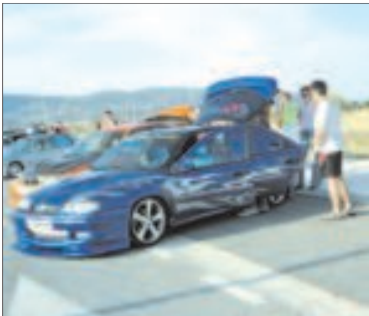
Más de cincuenta coches participaron en la concentración de tuning