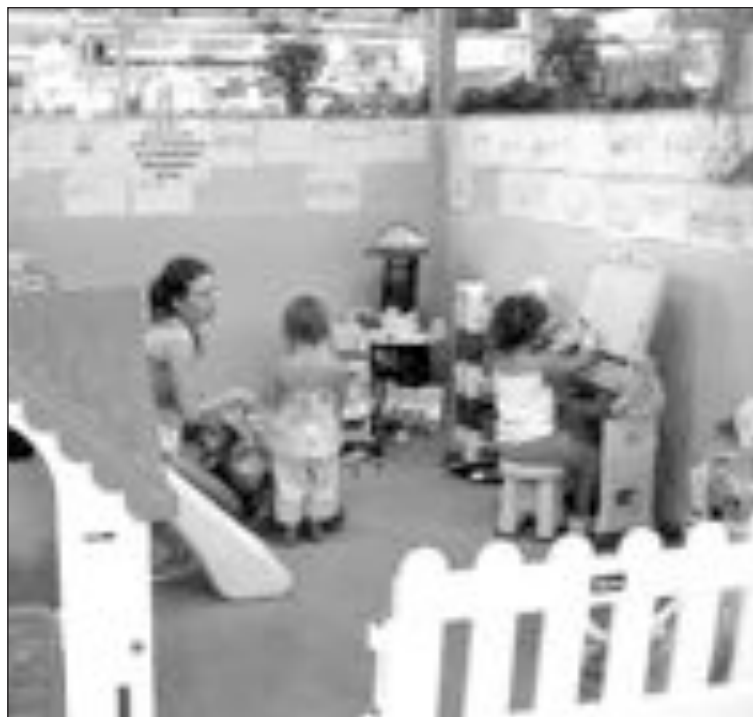
La ludoteca permite a los padres comprar más tranquilamente

De lunes a sábado, la ludoteca estará abierta de 10h a 12h de la mañana en julio, agosto y septiembre. Después de fiestas, dará servicio los viernes por la tarde y el sábado por la mañana. La empresa Super Juguete colabora en este proyecto.