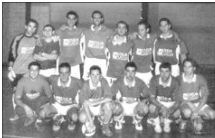
El Edelplast Hermanos Guill ganó las competiciones de fútbol sala

Como nota negativa de la jornada, no se pudo celebrar el primer cross urbano, que iba a contar con un recorrido de 3.500 metros, avituallamiento y regalos para todos los participantes, y trofeos para los tres primeros de cada categoría. Lamentablemente, motivos ajenos al Club d'Atletisme Castalla, organizador de la prueba, impidieron que ésta se pudiera llevar a cabo.