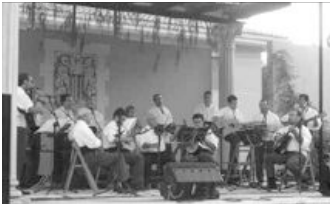
Actuación de la Dolça Parranda en el parque de la Era del Teular

participó este año, la Unión Musical 'Ciudad de Asís' de Alicante que interpretó las piezas: Otto y Mezzo; El Padrino y la zarzuela El Bateo. Por su parte, la Sociedad Musical La