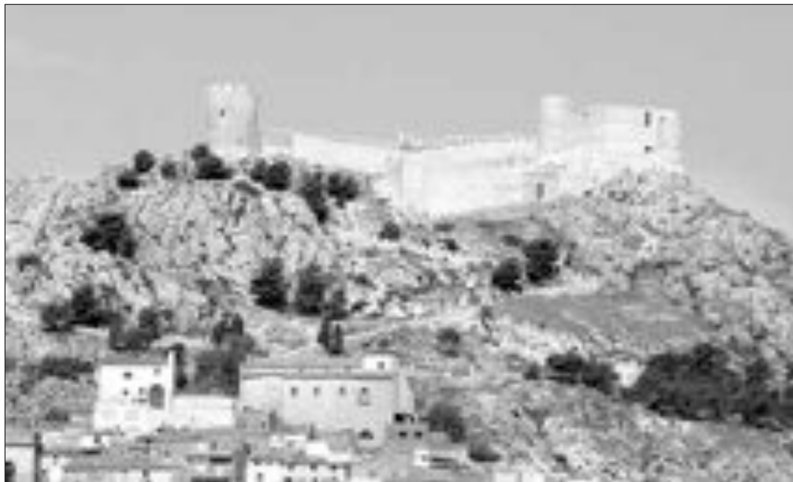
Esta semana ha sido retirada la grúa que estaba instalada en el Castillo

El punto álgido del día será el desfile oficial de Sant Jaume , que comenzará a las siete de la tarde. Una vez finalizado el desfile se procederá a la tradicional y espectacular Ballà de Banderes , en la plaza Mayor.