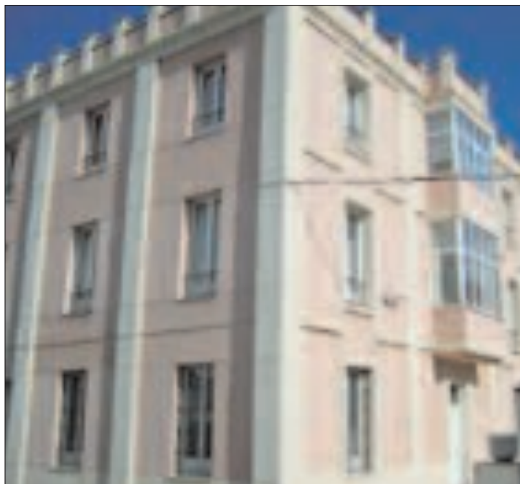
La Casa Molina está incluida en la recalificación solicitada por Famosa

Las contraprestaciones sociales que Famosa aporta todavía no han sido reveladas aunque en breve está previsto que la compañía muñequera y el