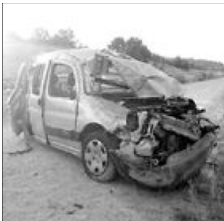
El vehículo dio varias vueltas de campana y perdió el eje trasero de las ruedas

Afortunadamente, todo quedó en un susto y el servicio de grúas se encargó de la retirada del coche.