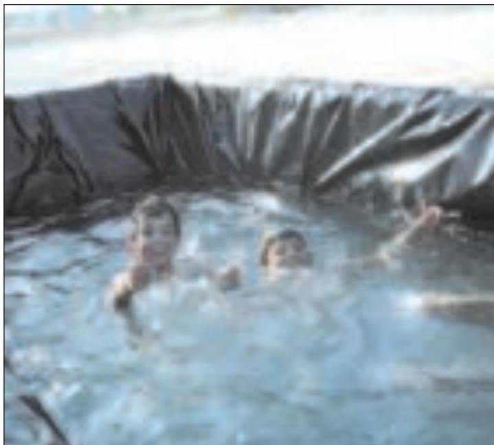
Los niños se refrescaron en las 'bañeras' puestas para la ocasión