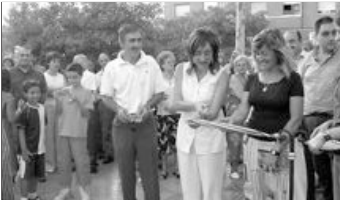
La alcaldesa acompañada de numerosos vecinos entran en el pasaje tras el corte de la cinta inaugural

Ante el anuncio hecho público por el vecino afectado de una posible demanda con-