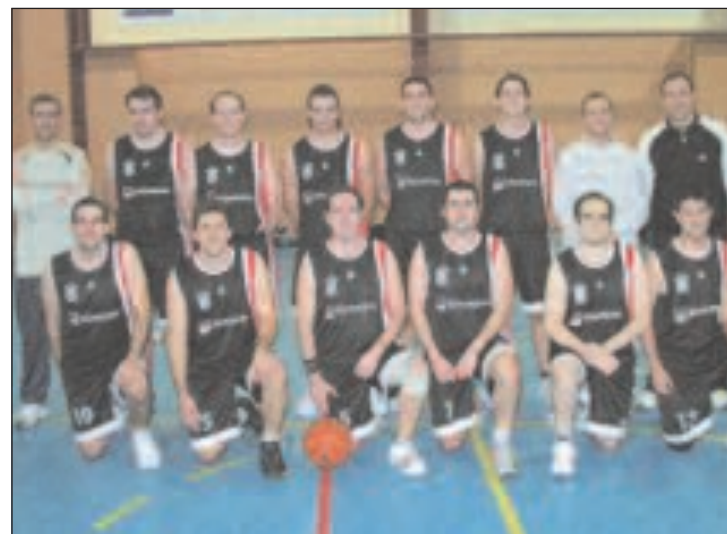
Plantilla del CB Castalla en el pabellón municipal