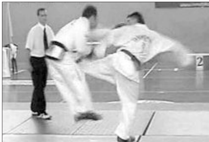
Momento de uno de los combates

80 competidores, procedentes de Ibi, Alcoy, Benissa, Valencia, Almería y Madrid, entre otras ciudades, y estuvieron presentes los presidentes de la Federación Española de Taekwondo y de las federaciones regionales de la Comunidad Valenciana, Andalucía, Murcia y Madrid. Las pruebas consistieron en combates y