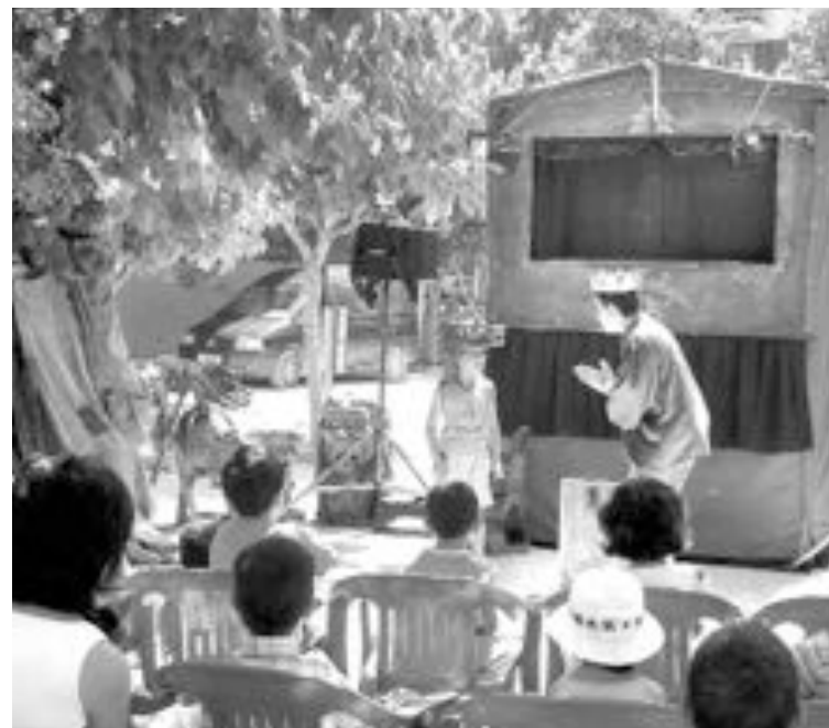
Los más pequeños estuvieron atentos en todo momento a la representación de la obra 'El dragón y Tragaldabas'