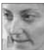
Convergencia Reche, ama de casa

La prensa no la leo por Internet, me gusta más leer los titulares de los periódicos en el teletexto. También lo uso para descargar música y películas, pero no para chatear porque no me gusta”.