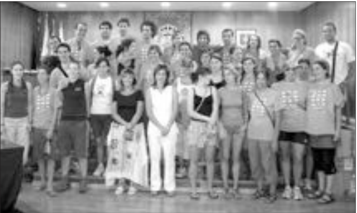
La alcaldesa y la concejal de Deportes recibieron al grupo de voluntarios en el salón de Plenos del Ayuntamiento

Un grupo de 28 jóvenes participa en la cuarta edición del campo de trabajo internacional que se desarrolla durante 15 días en la Finca Torretes. La mitad de ellos procede de países europeos como la República Checa, Francia y Turquía mientras que el resto han viajado desde distintas comunidades. Algunos incluso repiten la experiencia después del buen resultado del verano pasado. Por la mañana, realizan trabajos de carácter medioambiental en el paraje de Torretes mientras que aprovechan la tarde para ir de visita turística por la provincia. También participarán en las danzas populares que se organizan en la Plaza la Palla por la noche.