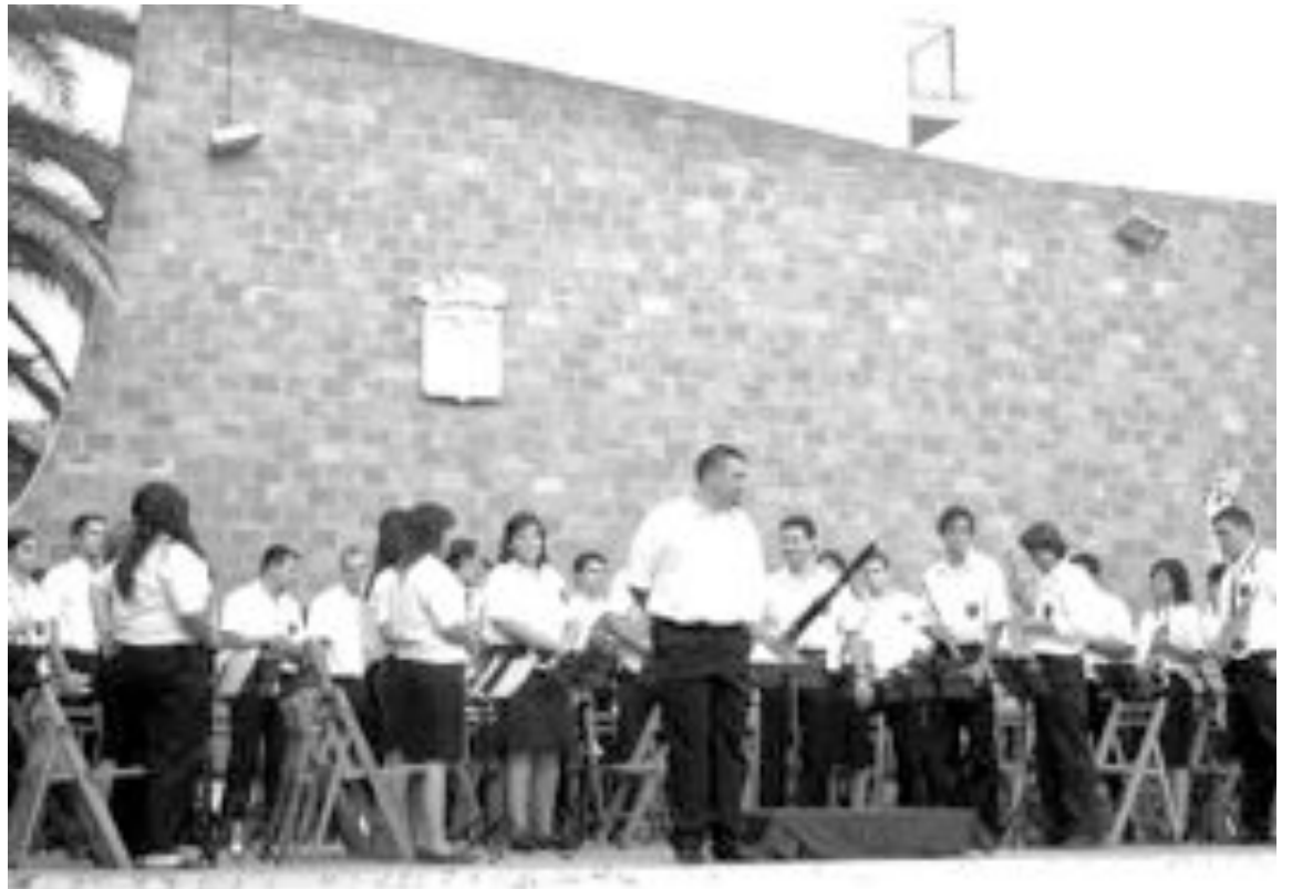
Actuación de la banda de Altea la Vella en el escenario de los jardines de la Casa Gran

En la segunda parte, actuó la Unión Musical de Ibi con un