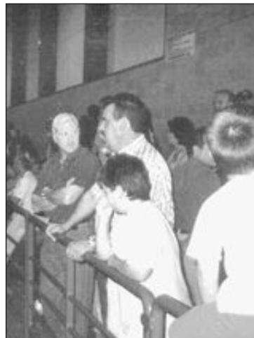
Numeroso público asistió al evento