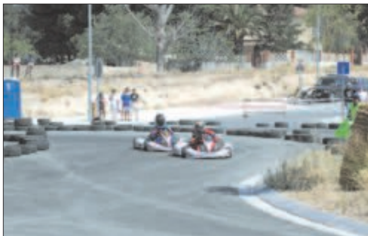
El circuito de karts fue habilitado en el polígono Alfaç 3