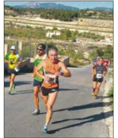
La mañana del domingo 26 de octubre fue bastante calurosa