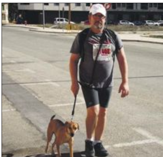
Algunos caminantes cubrieron el recorrido (27'5 kilómetros) acompañados por sus perros