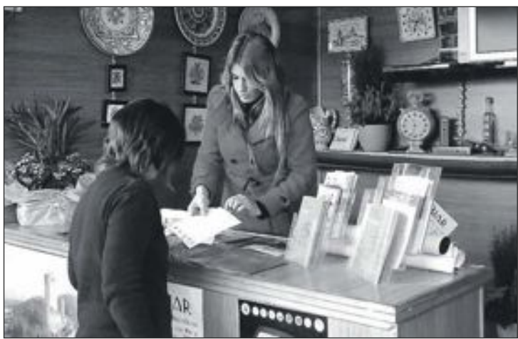
Stand de Biar en las pasadas ediciones de la Fira