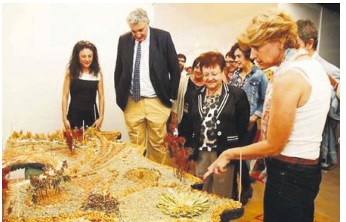
El invitado de este año a esta edición de Expocretiva ha sido el ex jugador de baloncesto Fernando Romay

El premio está dotado con un premio en metálico de 2.400 euros y los autores del trabajo también recibieron un obsequio a nivel individual.