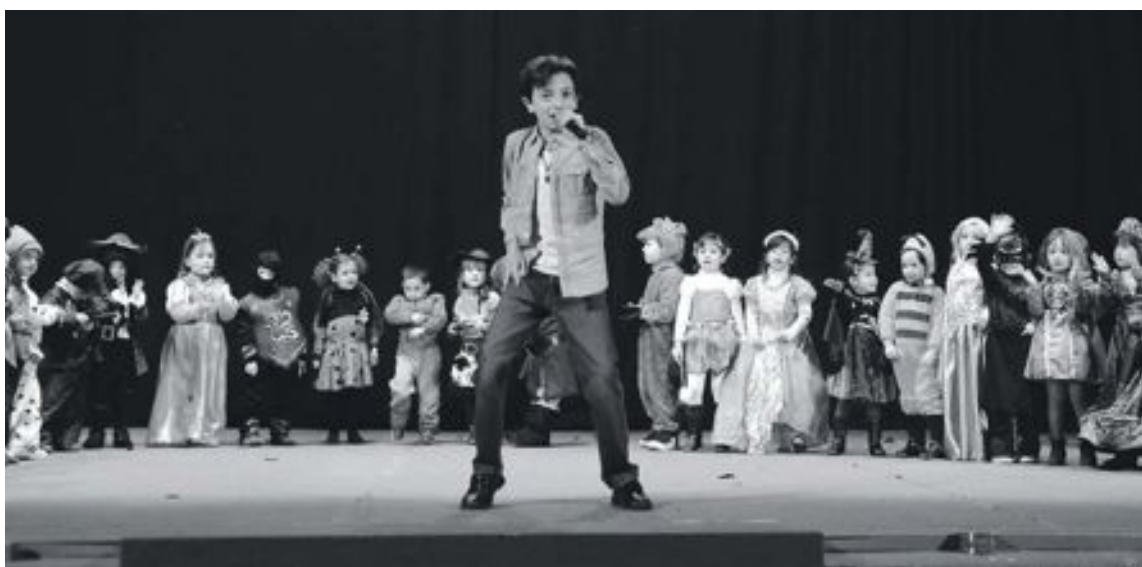
El joven cantante de 14 años visitó el colegio en febrero con motivo del Carnaval e interpretó tres canciones

Tras la visita guiada, los más pequeños realizaron talleres en el propio herbario, elaborando divertidas creaciones realizadas con las hojas que encontraron durante el recorrido, dando muestras de su creatividad y originalidad.