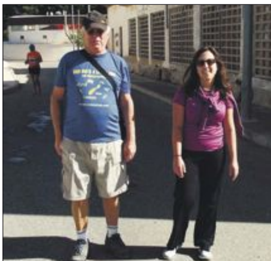
A pesar del cansancio y el calor, los participantes no perdieron en ningún momento el buen humor