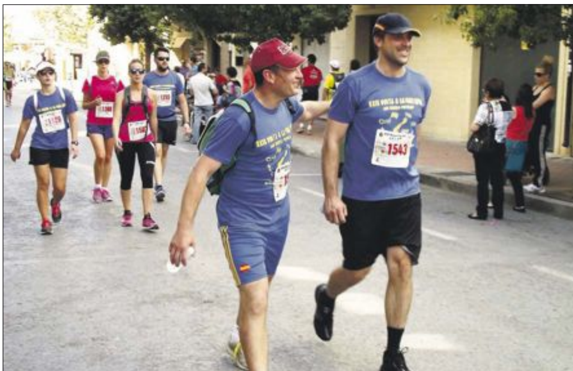
Los participantes se dan ánimos en el último tramo de la prueba, muy cerca ya de la meta, en Onil