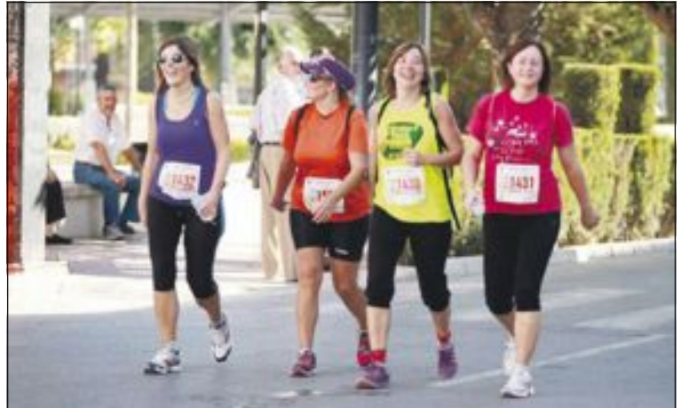
Un grupo de marchadoras a su paso por Castalla