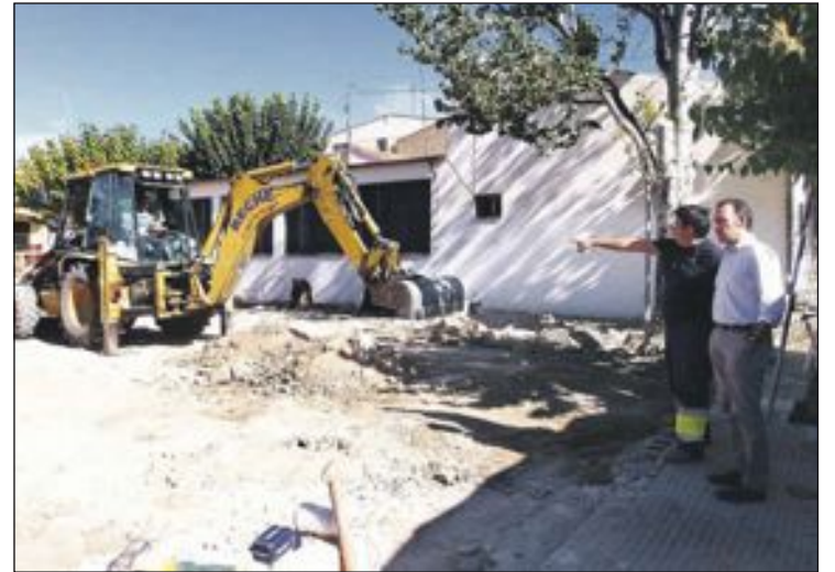
Las obras durarán un mes y su presupuesto es de 27.000 euros