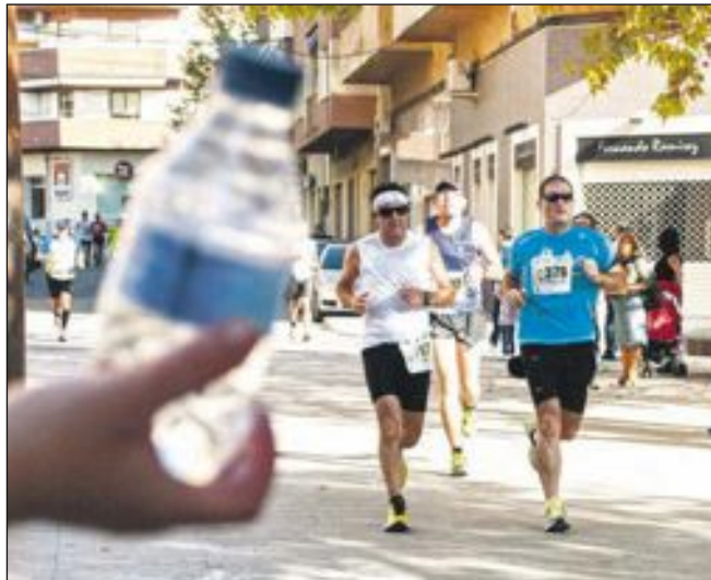
Más de 200 voluntarios colaboraron activamente para que la prueba estuviera controlada y no faltara agua a los participantes