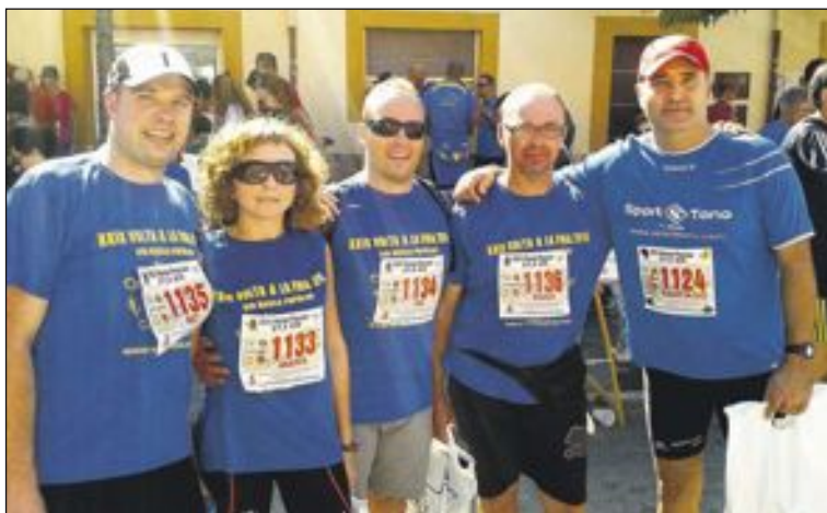
Un grupo de atletas colivencs muestra su satisfacción al acabar la prueba