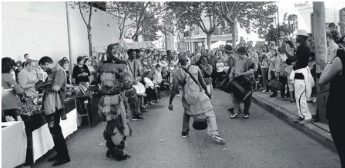
Actuación del grupo africano de danza y percusión 'Luna de África' durante la jornada conmemorativa