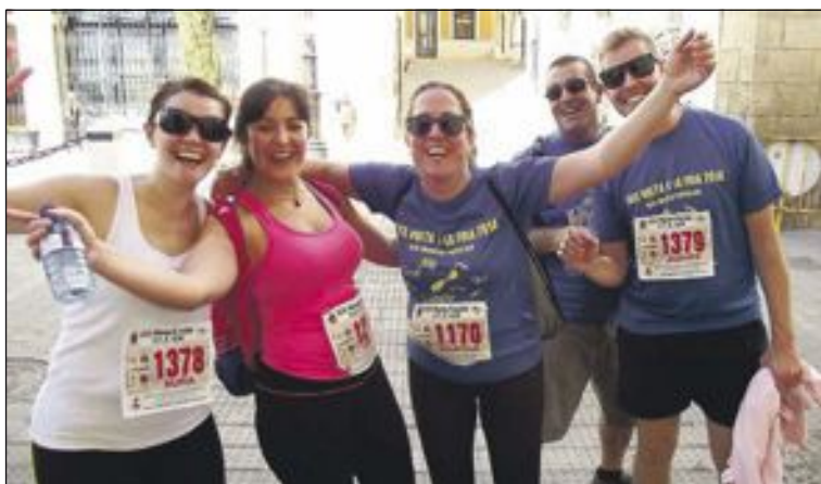
Siempre se ha dicho que los últimos serán los primeros; en este caso, los últimos demuestran su buen humor ante el Ayuntamiento de Castalla