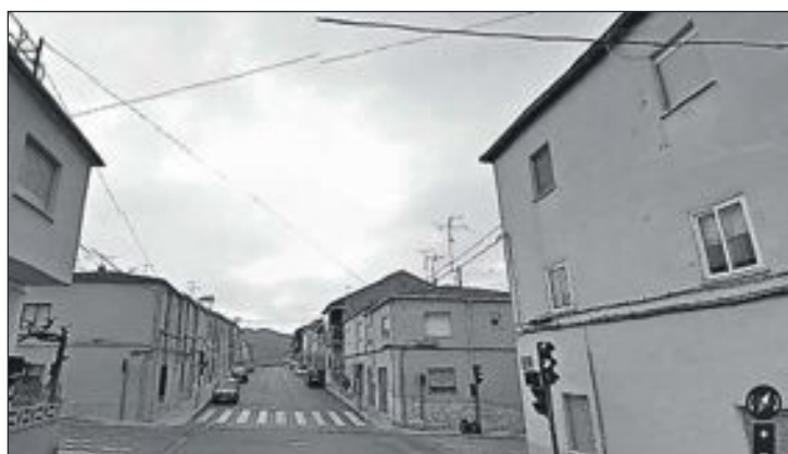
El cuerpo fue encontrado en una vivienda de la calle Felipe II

EU ha convocado una nueva asamblea abierta para el 13 de noviembre, en el Centro Social Polivalente, donde serán los ciudadanos "quienes presenten sus propuestas y transmitan sus inquietudes y necesidades del pueblo".