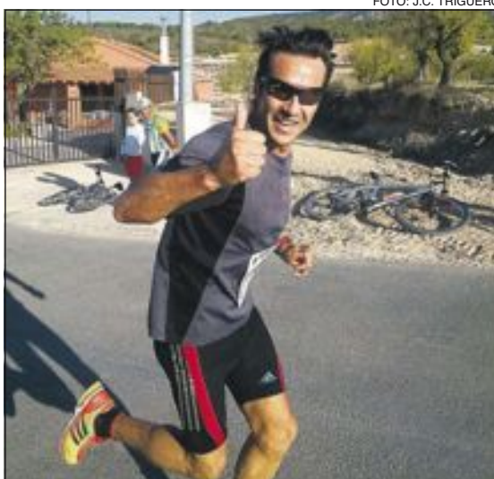
Un corredor saluda a cámara en uno de los tramos rurales de esta dura prueba