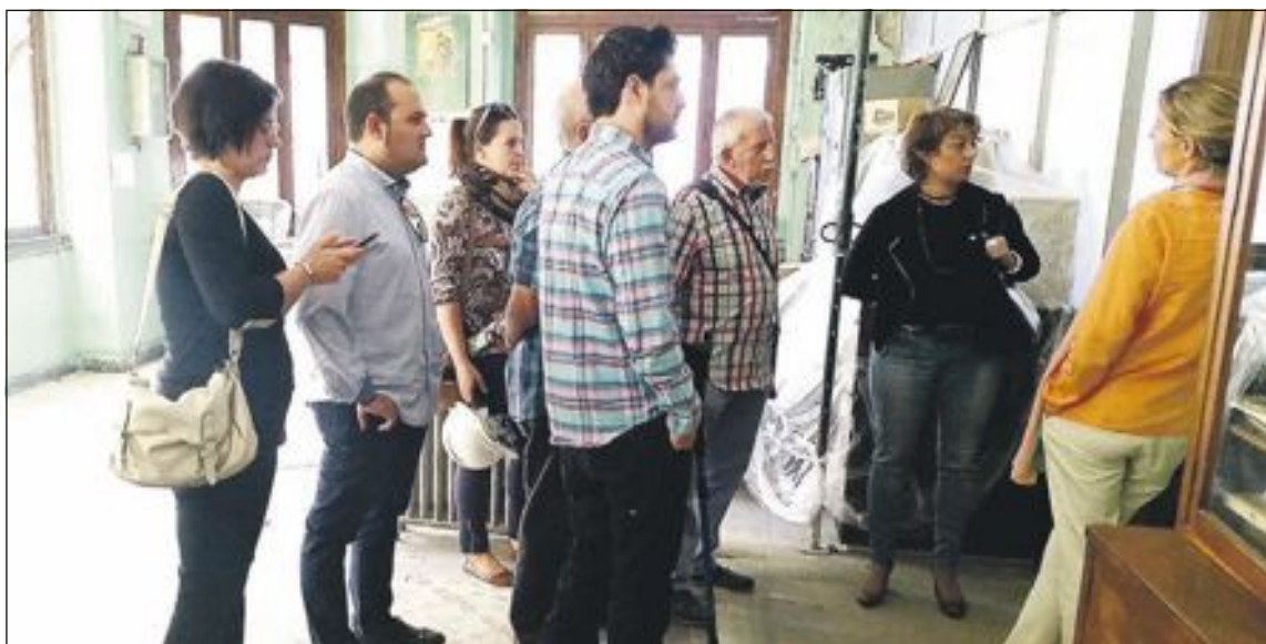
El edificio está apuntalado y las filtraciones de agua han provocado el desplome de parte de la cubierta