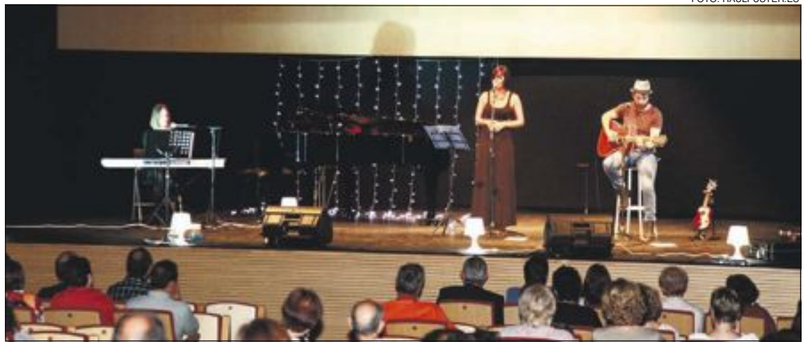
Un momento de la actuación del grupo comarcal Suite Poemia en la Gala de la Fibromialgia