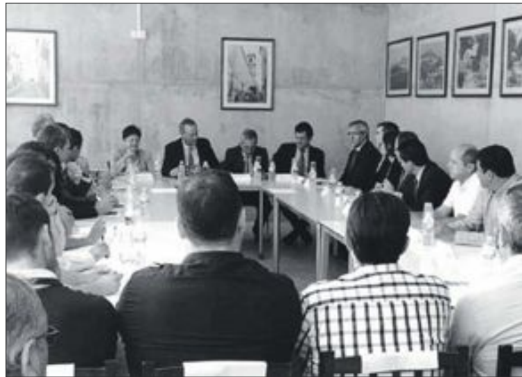
Alberto Fabra se reunió con empresarios de la localidad

Tres empresas se han acogido, de momento, a la fórmula de comercialización de Arrendamiento Ad Aedificandum , que la Generalitat aprobó en junio de 2013 para ceder terrenos sin coste de canon ni alquiler, por un plazo de hasta 99 años con la finalidad de que se realicen construcciones a costa del arrendatario, pudiendo utilizar las mismas hasta la expiración del