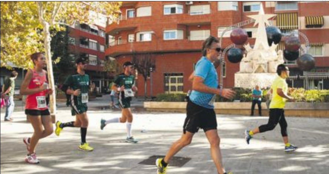
Los participantes cruzaron Ibi pasando por el emblemático monumento dedicado a los Reyes Magos