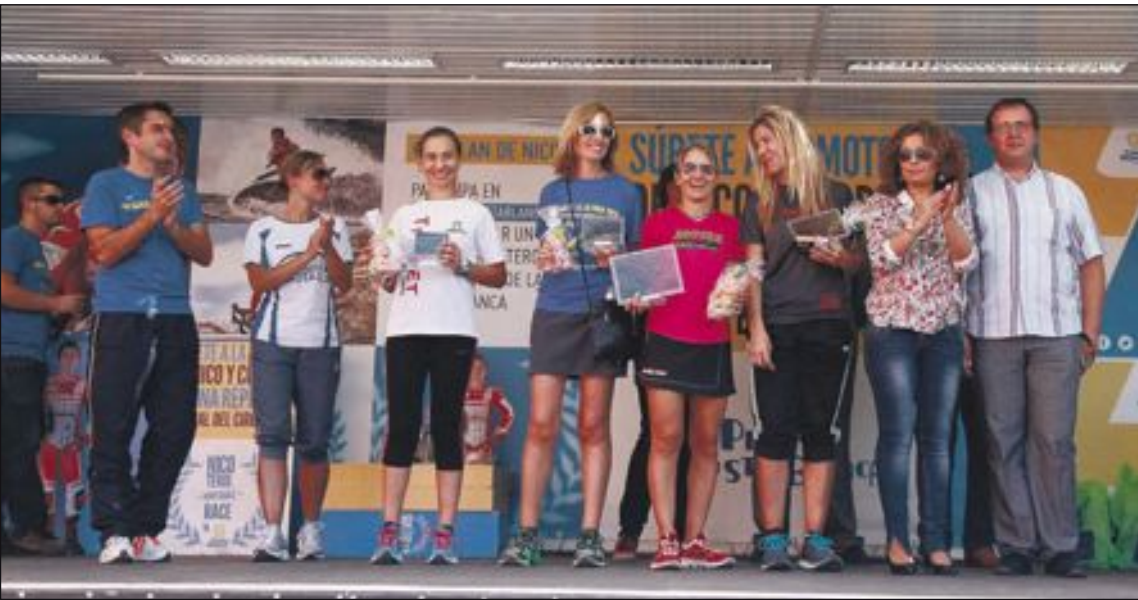
Las campeonas de la Foia, junto al presidente del C.E. Colivenc y los concejales de Deportes de Onil y Castalla