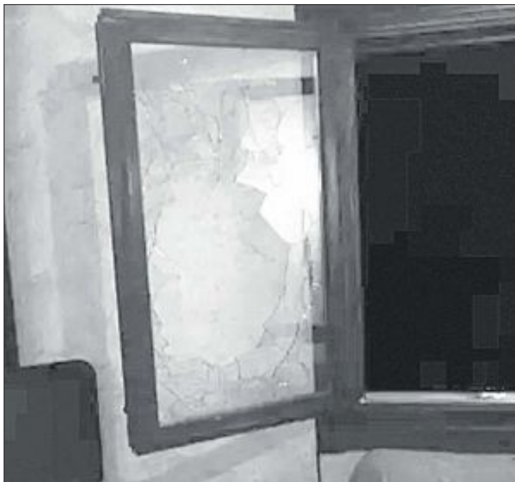
En uno de los robos, los cacos rompieron una ventana para acceder al interior de la vivienda

Por otra parte, vecinos de Castalla han manifestado su indignación por la falta de seguridad y de efectivos en el término municipal ya que se están produciendo estos sucesos con mucha frecuencia y no descartan recoger firmas para solicitar refuerzos en los cuerpos de seguridad.