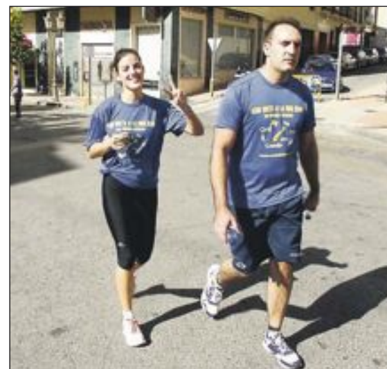
El último tramo de la prueba fue uno de los más duros, con la subida por la avenida de la Constitución