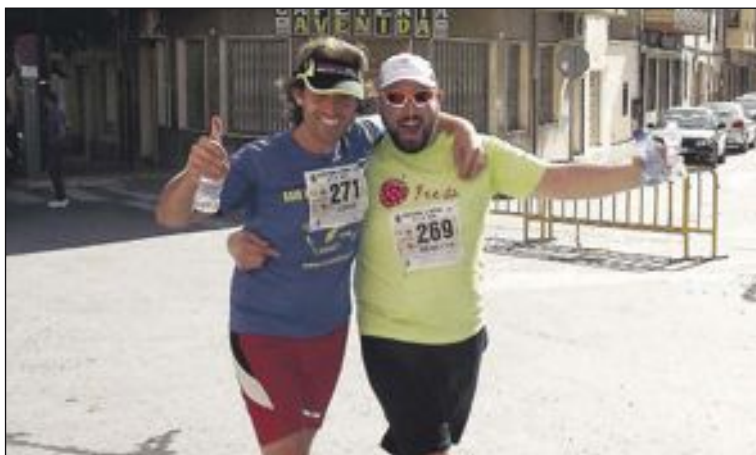
Dos caminantes pasan por una de las arterias principales de Castalla