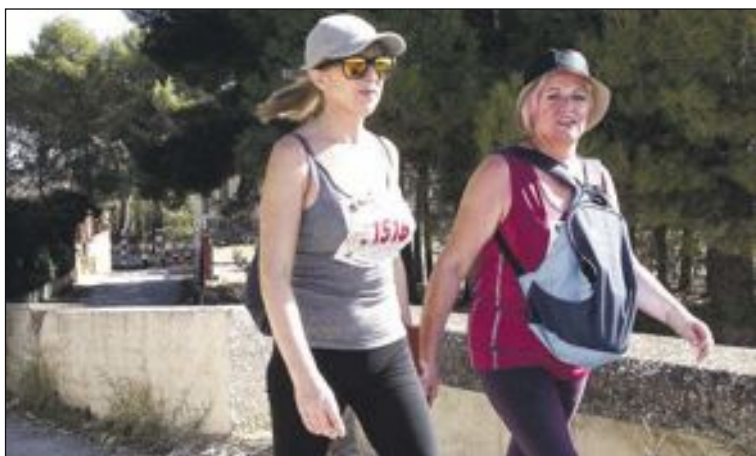
El puente centenario de Castalla formó parte del recorrido