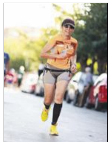
Corredores a su paso por la ciudad de Castalla