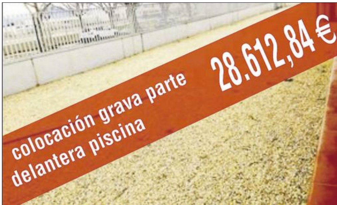
Uno de los trabajos presuntamente facturados de manera irregular

Como ha adelantado este periódico, los informes policiales que figuran en el sumario de la investigación desvelaron decenas de contratos ilegales entre empresas y Ayuntamiento, detallaron la vinculación familiar y de partido de algunas de estas empresas y la inexistencia, en otros casos, de