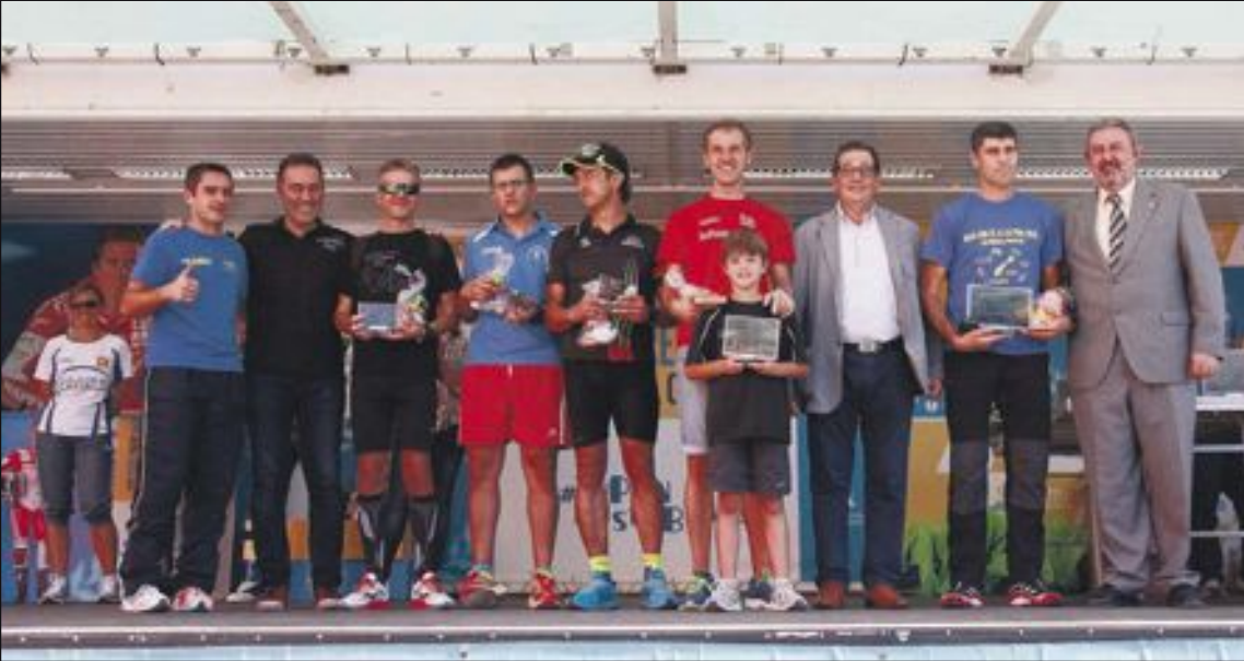
Los campeones de la Foia, junto a los alcaldes de Onil, Ibi y Castalla y el presidente del C.E. Colivenc