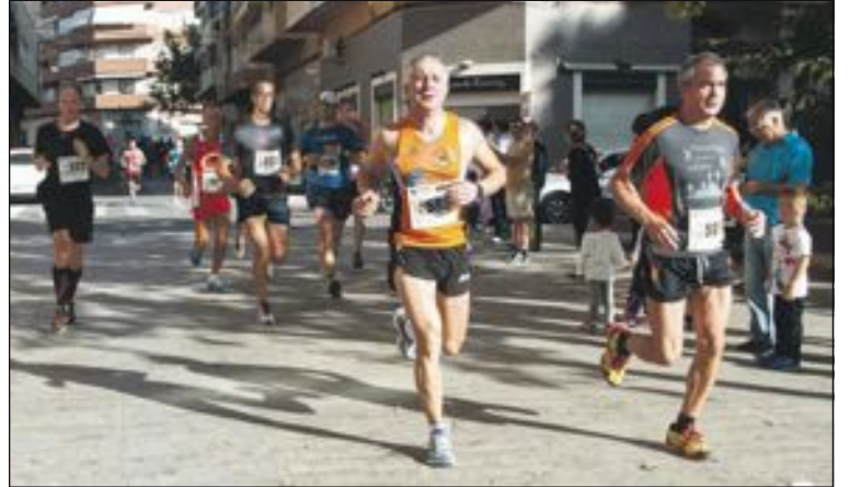
Entre corredores y marchadores compitieron más de 1.200 personas; en la foto, a su paso por Ibi