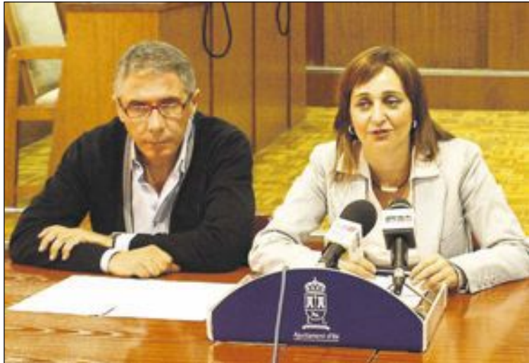
El exsecretario junto a la exalcaldesa

En 2012, la oposición ya presentó una moción para que no se asignara la defensa letrada a quien ostentaba la secretaría municipal ya que sus informes podían derivar en contenciosos, como estaba ocurriendo, y que se creara, con carácter de urgencia, una bolsa de letrados que ofreciera sus servicios jurídicos al Ayuntamiento.