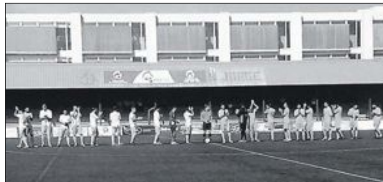
El partido se disputó en el Estadio Francisco Vilaplana Mariel

La próxima jornada, un partido de gran rivalidad: el derbi local entre la Peña Madridista de Ibi y el Ibi Racing, el domingo 2 de noviembre a las 18:15 en el Estadio Vilaplana Mariel.