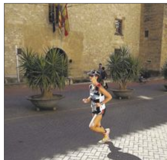
Una corredora pasa por delante del Palacio del Marqués de Dos Aguas de Onil