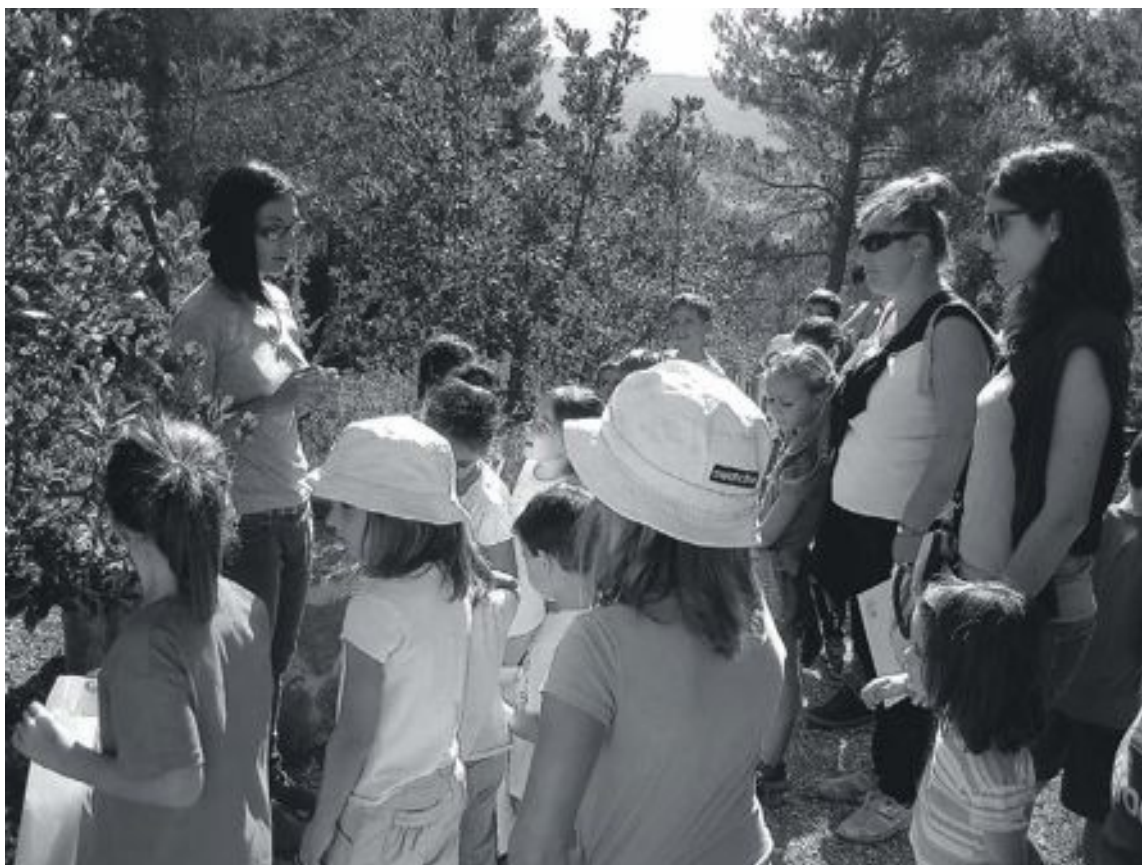
Los más pequeños realizaron también actividades creativas con las hojas que fueron recogiendo en la visita

La gala cuenta con la colaboración del Ayuntamiento de Ibi y el donativo para asistir es de tres euros.