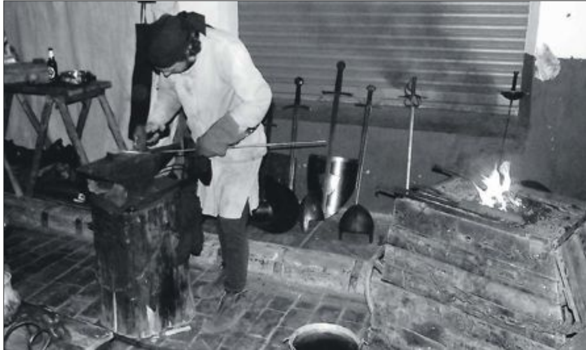
La nueva feria se celebrará del 19 al 21 de diciembre y también contará con una zona medieval

El concejal ya se ha reunido con el colectivo de comerciantes y hosteleros para informarles de