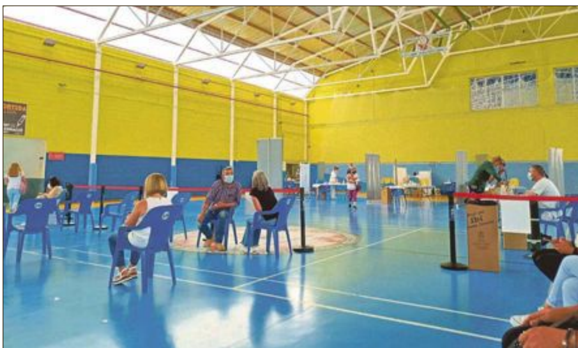
Punto de vacunación masiva en el Polideportivo de Ibi