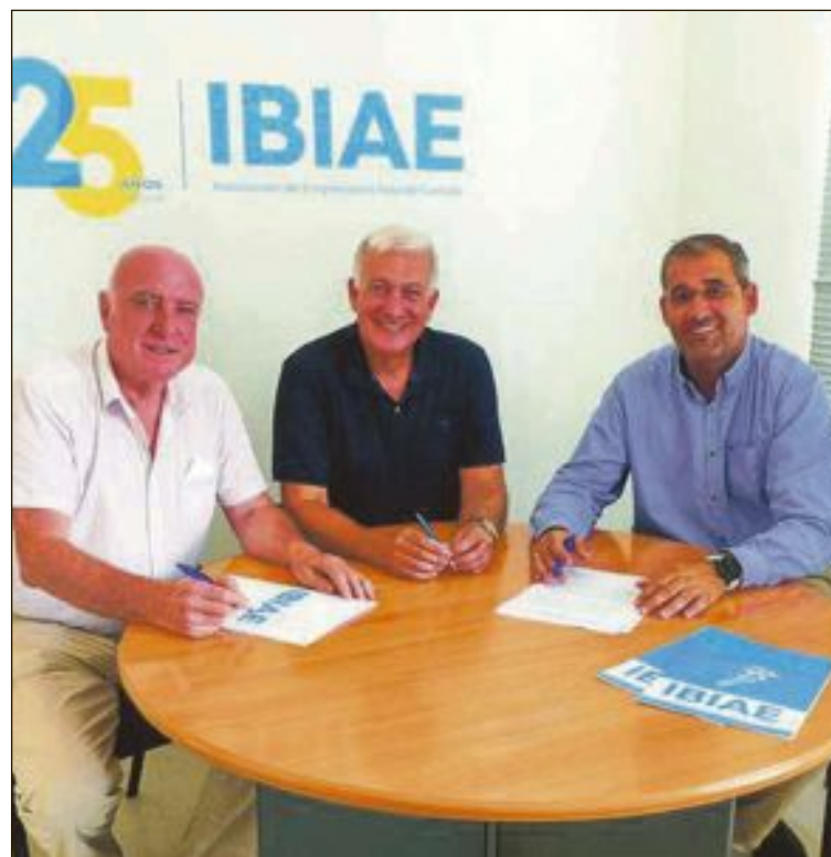
Firma del acuerdo entre IBIAE y el Circular Economy Institute

Indica, además, que muchas industrias están trabajando en el campo de la economía circular y lo que antes se aplicaba a nivel de empresa, ahora se aplica al producto. "En el momento de diseñarlo hay que plantearse cómo recuperarlo o hacia dónde va al finalizar su vida útil. El primer paso para las empresas es analizar a qué lugar van los residuos y cómo pueden actuar con ellos, aunque también hay que ver el modelo de empresa".