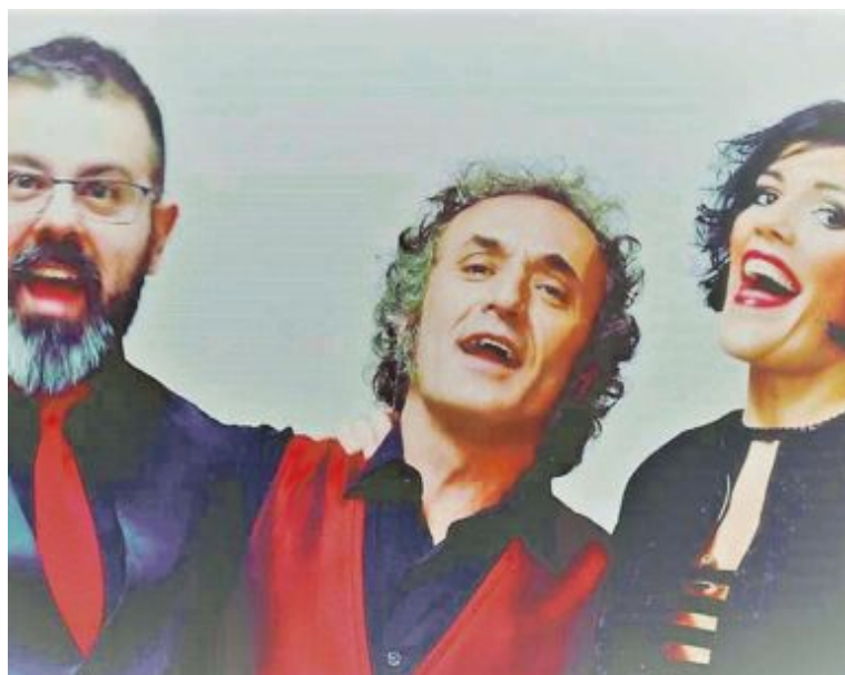
El espectáculo musical Nino & Raphael a solas , será el viernes a las 21 h. y El circo del payaso Tallarín , del grupo Cantajuegos, el sábado 11, a las 18 h.

Los profesionales han valorado el esfuerzo realizado para aumentar significativamente la inversión en el Festival de Artes Escénicas este año y han pedido que comiencen los trabajos para preparar la próxima edición de 2022, comprometida por la vicepresidenta, con el objetivo de recoger nuevas propuestas y consolidar el festival.