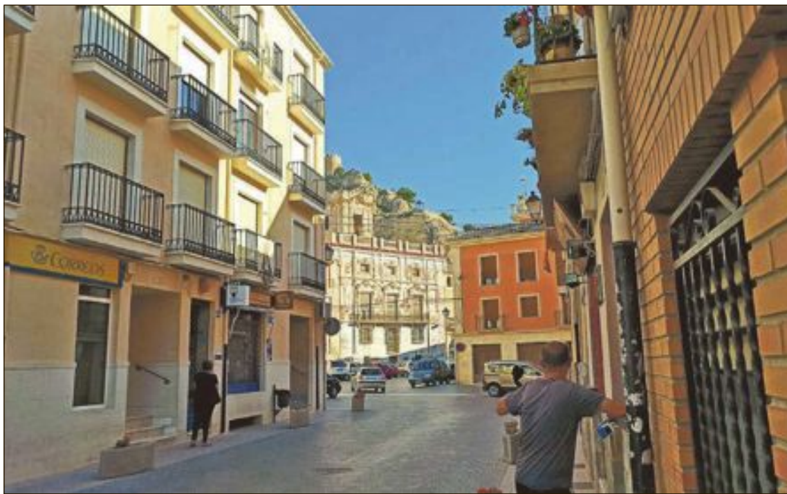
L'Ajuntament injeccarà 32.400 euros en els establiments i comerços de la localitat, a través de les targetes regal

El Consistori també ha destacat l'augment en la participació de les targetes regal. Es tracta d'una iniciativa innovadora de les regidories de Comerç i Turis-