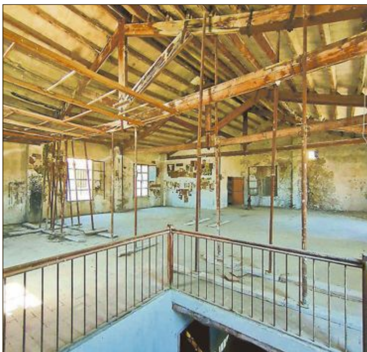
El Pósito fue un depósito de cereal municipal cuya función primordial consistía en realizar préstamos de cereal en condiciones ventajosas a los vecinos necesitados