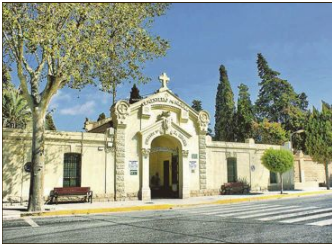
Les actuacions que es duran a terme consistiran en la redacció del projecte durant l'any 2021 i les tasques d'excavació i identificació en el cementiri d'Alacant en el 2022

Segons la informació que ha recavat l'Ajuntament, gràcies al treball previ de l'Associació de familiars represaliats pel franquisme del cementiri d'Alacant i el