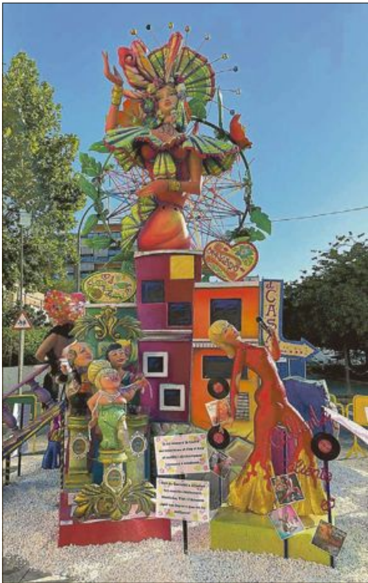
Falla Primado Reig