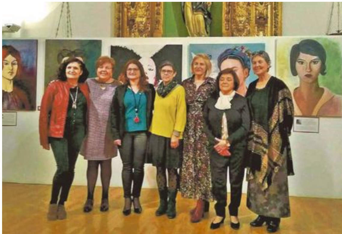
La ermita de San Vicente volverá a abrirse al público para la exposición Animales, del grupo de artes plásticas Cromosoma XX, que realizó en 2018 su primera muestra colectiva coincidiendo con el Día Internacional de la Mujer

El viernes 3 de septiembre se inaugura en la ermita de San Vicente una exposición de fotografías sobre las Fiestas del año 2019 y una exposición de dibujos del concurso infantil de diseño 'Castillo de Moros y Cristianos'. En el mismo acto, que comienza a las 20 horas, se entregarán los premios a los ganadores del XLII concurso de fotografías. Las exposiciones podrán verse hasta el 12 de septiembre.