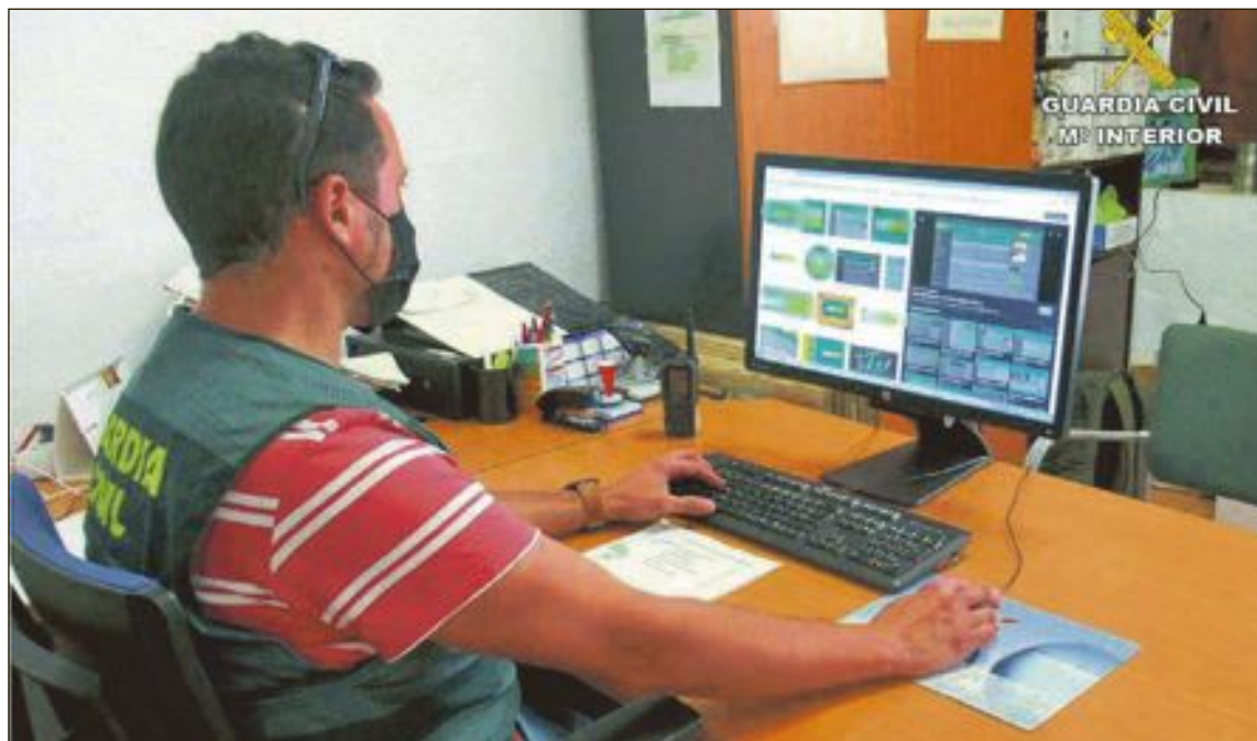
La investigación llevada a cabo por la Guardia Civil ha durado cerca de ocho meses

Pero de repente, el hombre dejó de contestar a las llamadas y, además, se trasladó de domicilio, localizándolo el poco tiempo en Onil. Los agentes solicitaron que les mostrara los dispositivos electrónicos desde los que solía realizar las apuestas deportivas, pero él adujo que los había formateado; tampoco se acordaba de las claves de acceso a las