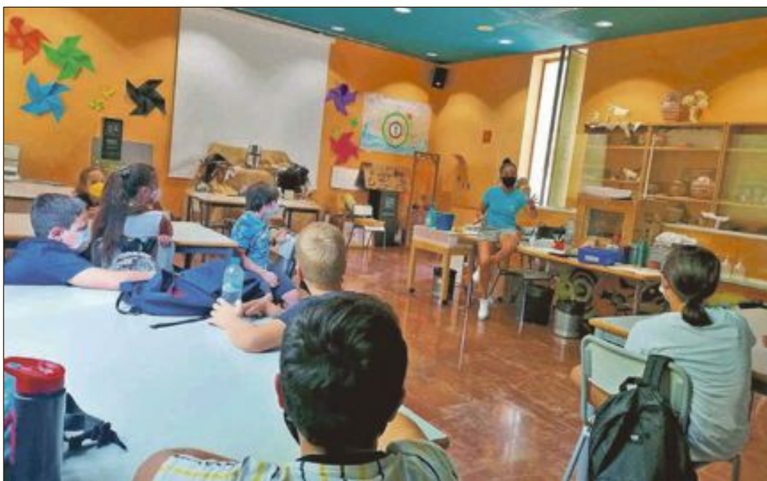
Las actividades han incluido talleres, juegos y animación