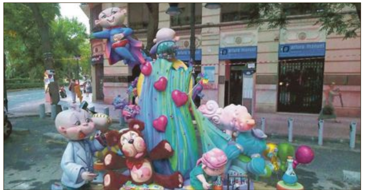
La falla infantil recibió un cuarto premio

La colla Artdefoc planta sus cuatro fallas en Valencia en condiciones extremas