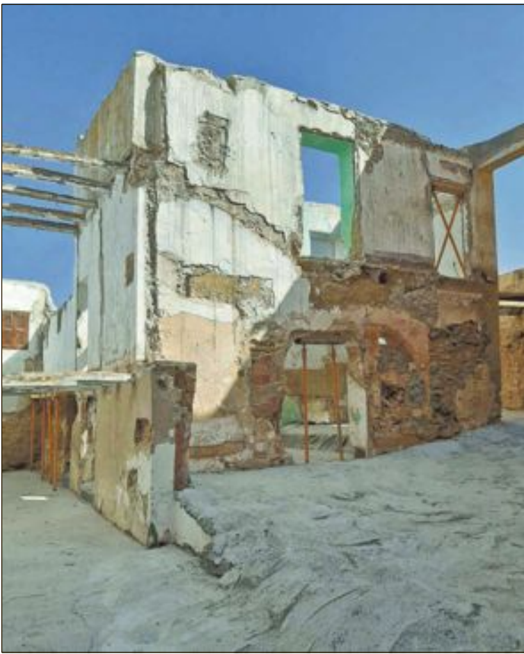
L'estudi del conjunt d'edificacions adossades a la cara interna permet recuperar el llenç original i les construccions annexes