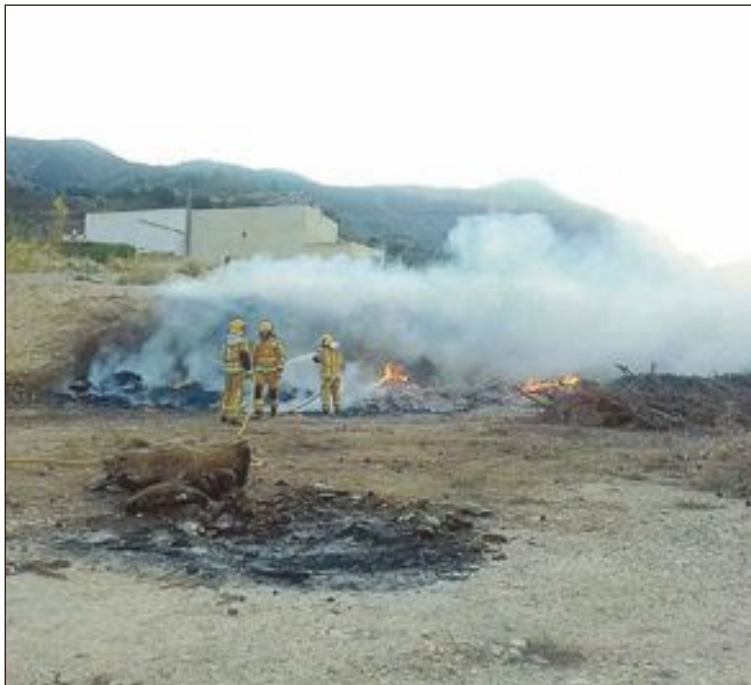
Els agricultors podran indicar l'hora d'inici i de fi de la crema per a activar la monitorització per part dels efectius del Consorci Provincial

L'aplicació es pot descarregar gratuïtament en qualsevol smartphone i ofereix diferents prestacions en funció del tipus