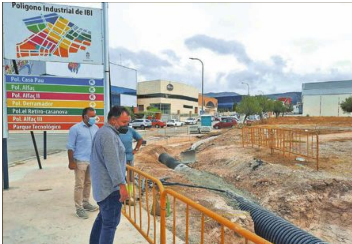
Se ejecutarán once proyectos en total en los polígonos Casa Pau, Derramador, Alfac I, Alfac II, Alfac III oeste, Alfac III este, Retiro Casa Nova, Moltó-Injusa, Pery-Climent, Ramblas-Cementerio y Parque Ciudad del Juguete

El proyecto se ejecuta en el marco de un desarrollo sostenible y de fomento de la conservación, protección y mejora del medio ambiente.