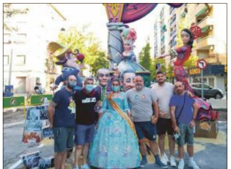
Miembros de Artdefoc junto a la falla El Generas

Por otra parte, la colla ha recibido un cuarto premio por la falla infantil, una de las cuatro obras falleras que han plantado en Valencia.