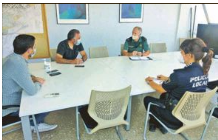
Reunión de la Junta de Seguridad Ciudadana local

más, cabe destacar la gravedad que supone el formalizar una denuncia, a sabiendas de su falsedad, simulando con ello un delito que, en realidad, no ha tenido lugar.