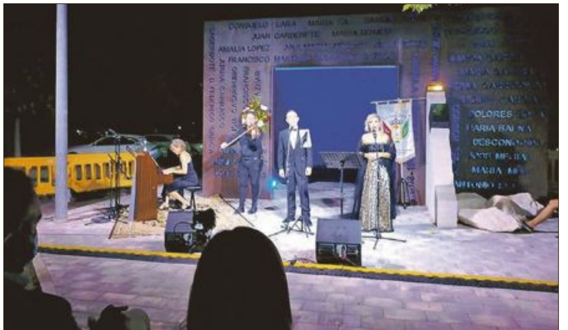
El concierto tuvo lugar la noche del 28 de agosto junto al monumento en recuerdo de las víctimas

Los artistas interpretaron un amplio repertorio de temas muy conocidos como Nocturno de Chopin, Aleluyah de Leonard Cohen, Ave María , La vida es bella o Leyendas de pasión , entre otras muchas que hicieron las delicias del público.