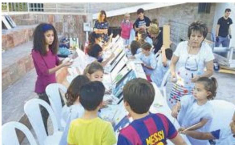
Taller infantil de pintura a càrrec de Castell'Art