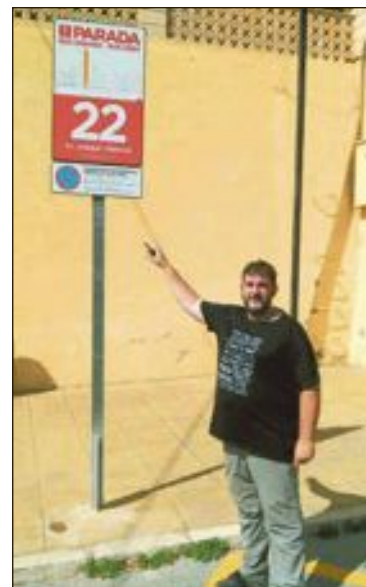
Hay postes con más de dos metros de altura, según indica Moreno

Por todo ello, el grupo municipal pide que se calcule la hora aproximada de paso por cada una de las paradas y que se ponga dicha información los carteles. Que ponga el mapa y los horarios actuales en la web del Ayuntamiento y que se dé mayor difusión a través de las redes sociales.