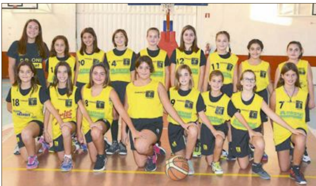
CD Onil Alevín Femenino Nivel 2