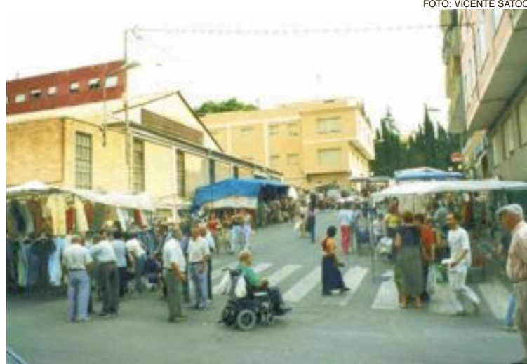
Imagen del Mercado de finales de los años 90