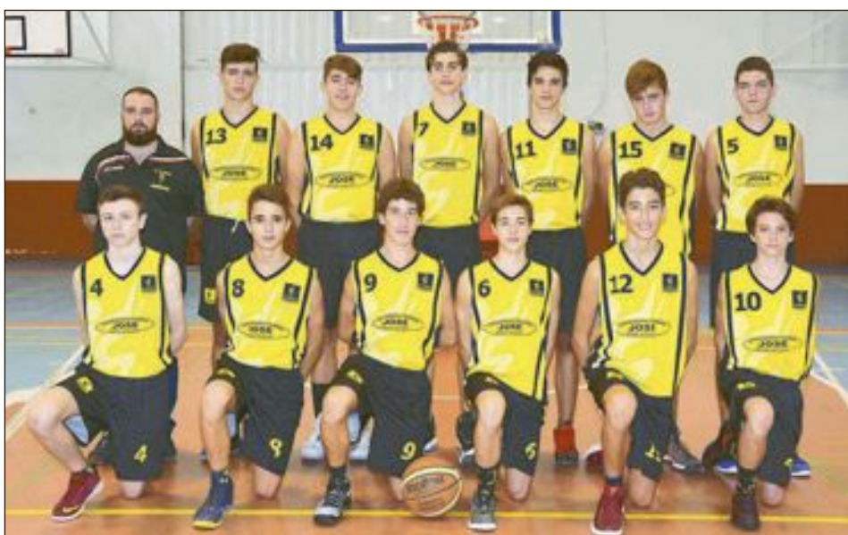
CD Onil Cadete Masculino Nivel 2