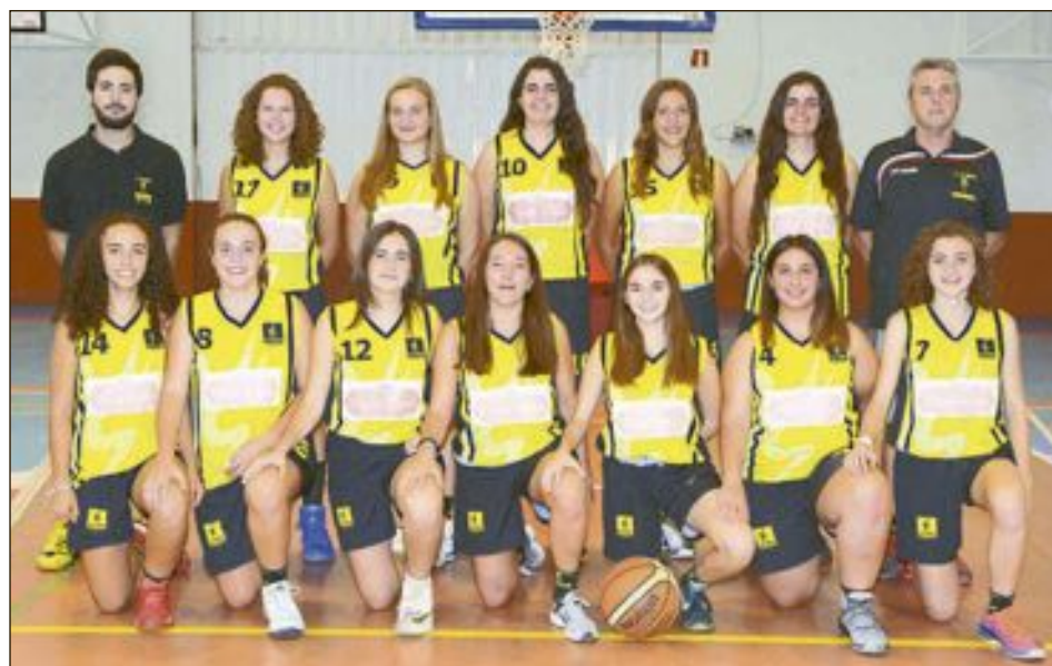
CD Onil Júnior Femenino Nivel 2