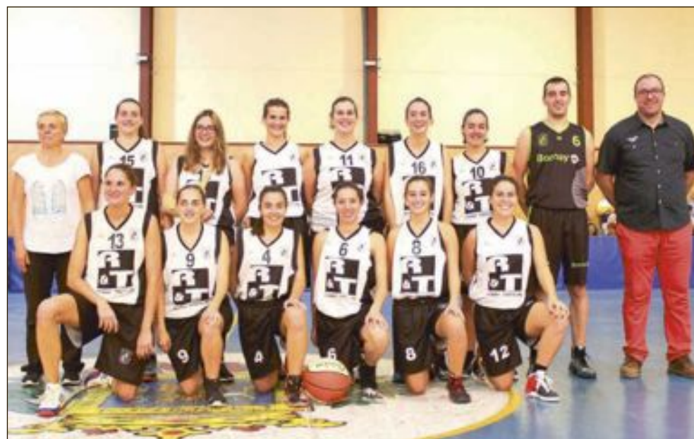
CB Castalla Sénior Femenino