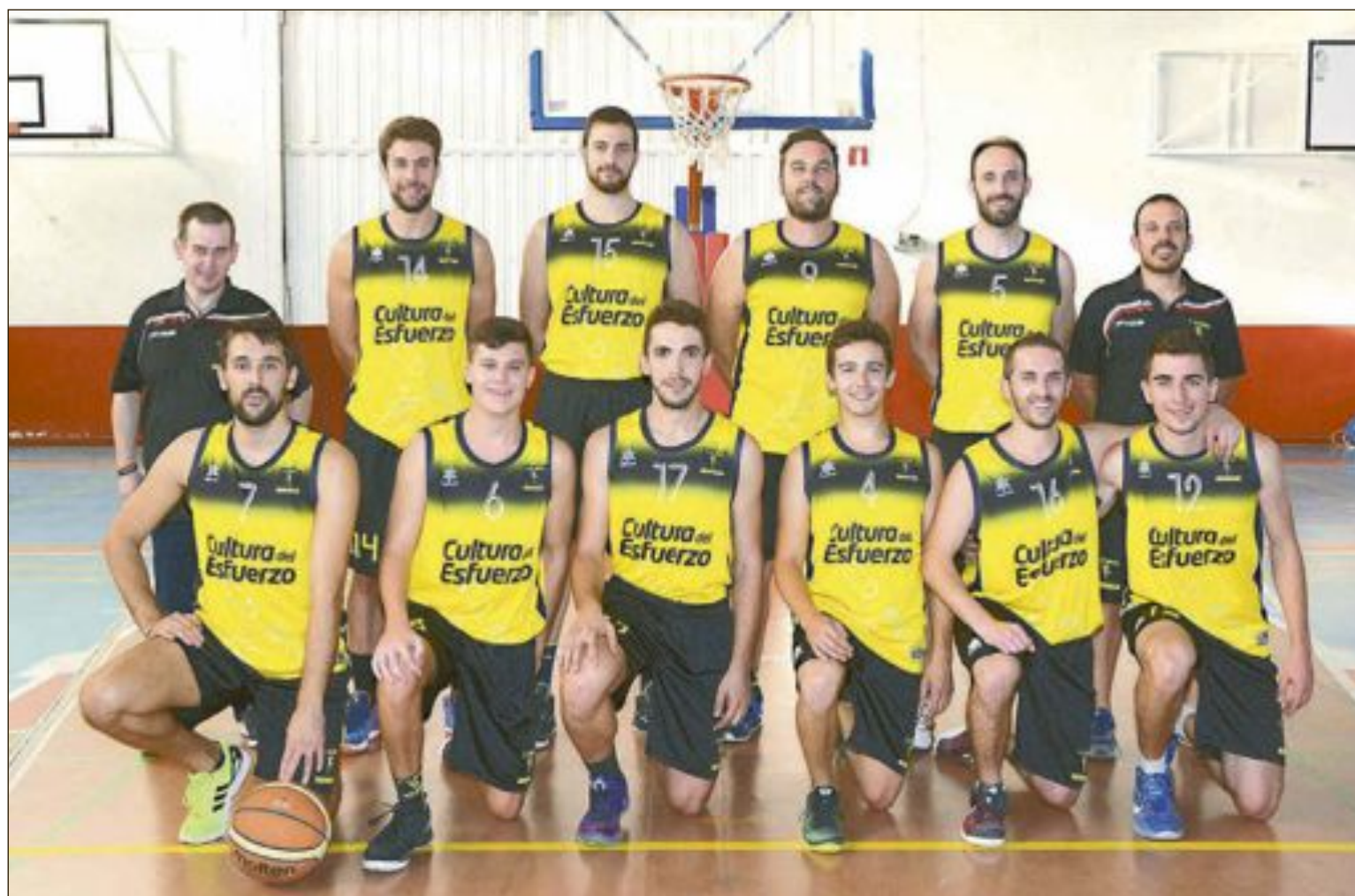
CD Onil Sénior Masculino Autonómico

Y recordad: Esto es ONIL, ¡¡¡Somos BALONCESTO!!!