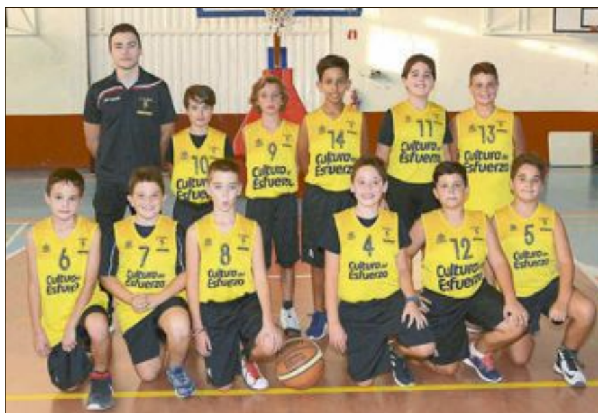
CD Onil Alevín Masculino Nivel 2