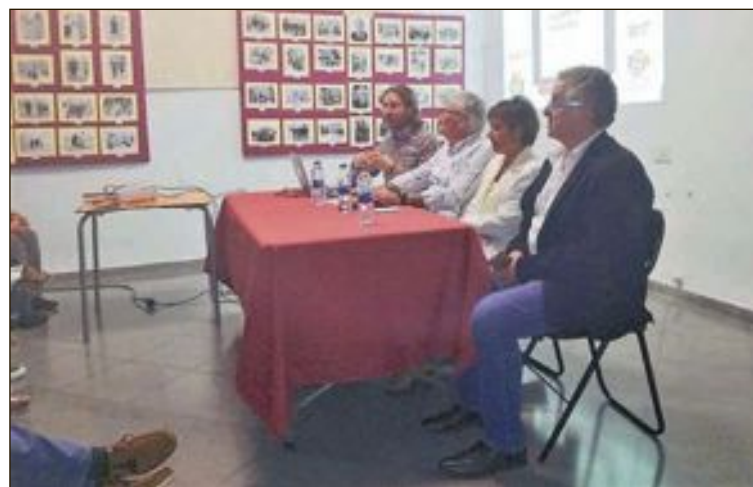
Mesa de ponentes en la presentación del libro sobre la Ermita de la Sang