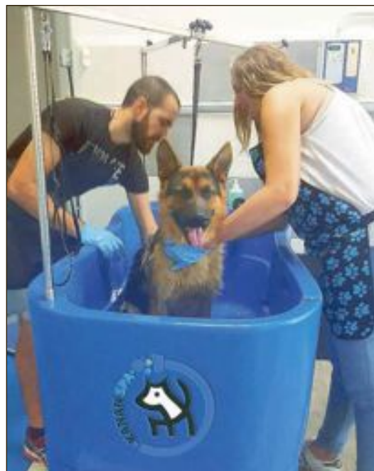
Kanan Spa Canino cuenta actualmente con dos equipos completos de baño y secado, con opción a añadir uno más dependiendo de la demanda

Horario: de martes a viernes de 10 a 13 y de 17 a 21 horas; sábados y domingos de 10 a 14 horas. Teléfono: 644.436.089.