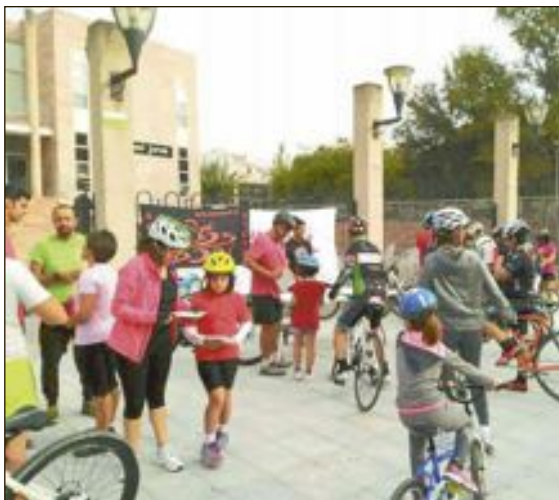
Numerosos vecinos de todas las edades participaron en esta quinta edición del Día de la Bici de Castalla

Numerosos vecinos de todas las edades se concentraron a las diez de la mañana en el Parque Municipal para participar en esta prueba, no competitiva pero altamente divertida.