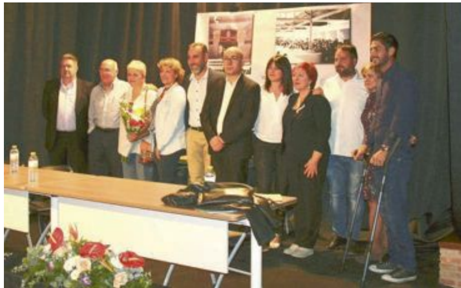
Responsables políticos de varias legislaturas y miembros de la directiva de la asociación del mercado