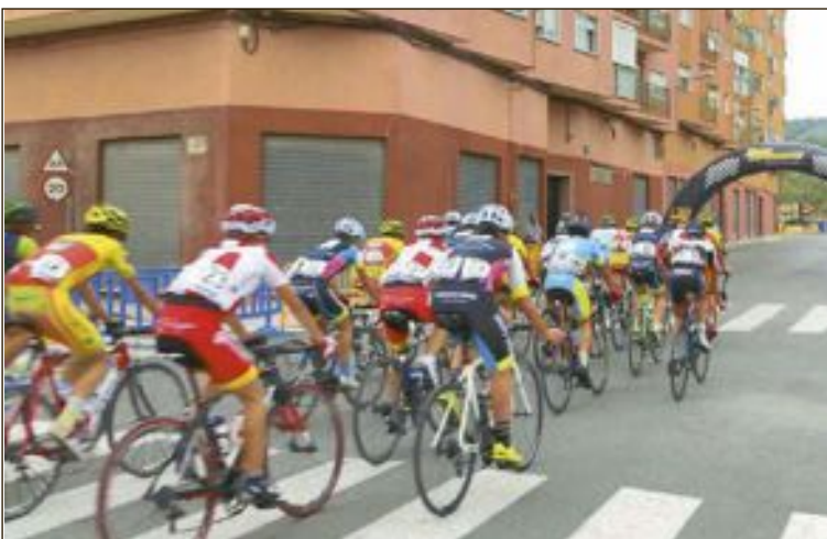
Cerca de 50 corredores participaron en el XXIII Trofeo Ciclista Cadete Fiestas del Barrio Fernoveta-San Miguel