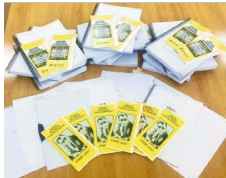
Obres presentades als certàmens de novel·la i poesia de Onil

Por último, la Asociación de Hosteleros participa en la II Feria de Comercio y Costumbres, donde en la plaza del Carmen ofrecerá numerosas degustaciones los días 7 y 8 de octubre de 11 a 13:30 y de 17:30 a 18:30 horas. También habrá paela el sábado y gaspaxos el domingo (a las 13:00 horas).