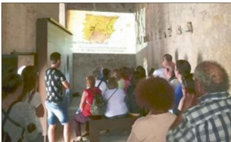
Los días 30 de septiembre y 1 de octubre hubo puertas abiertas en el Conjunto Patrimonial del Castell de Castalla

Este programa piloto durará hasta el fin del contrato del joven, en julio de 2018, y entonces se valorará su continuidad, según los resultados obtenidos. Asimismo, habrá un seguimiento y control mensual o trimestral del trabajo realizado.