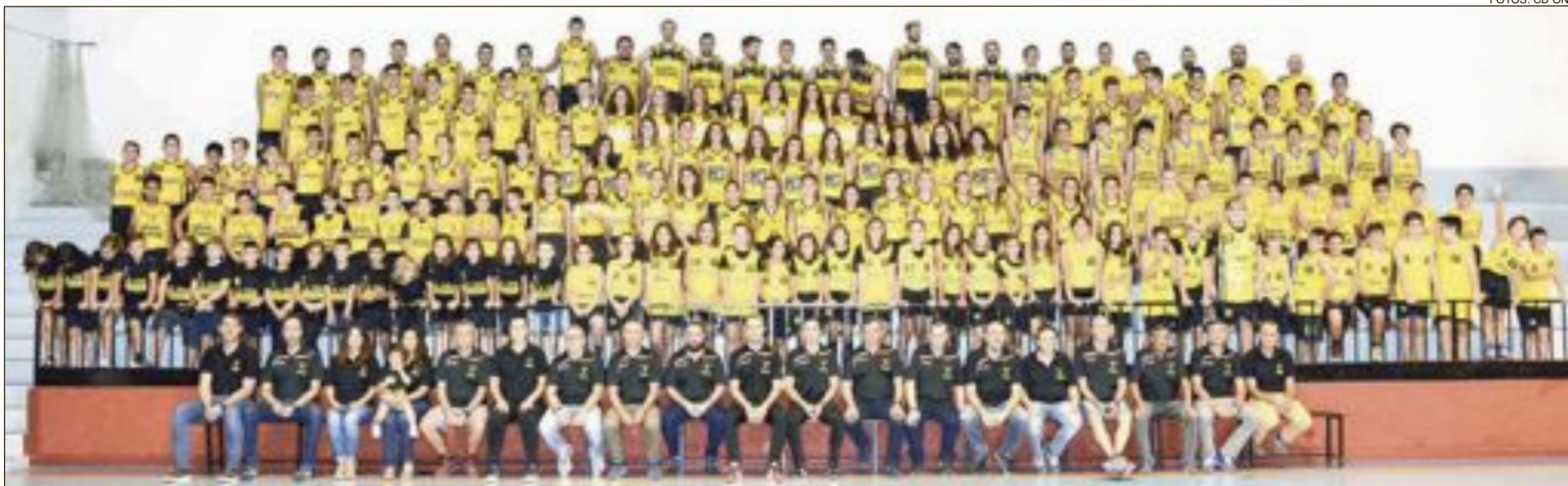
Foto de familia con los directivos, técnicos y jugadores de todos los equipos del CD Onil