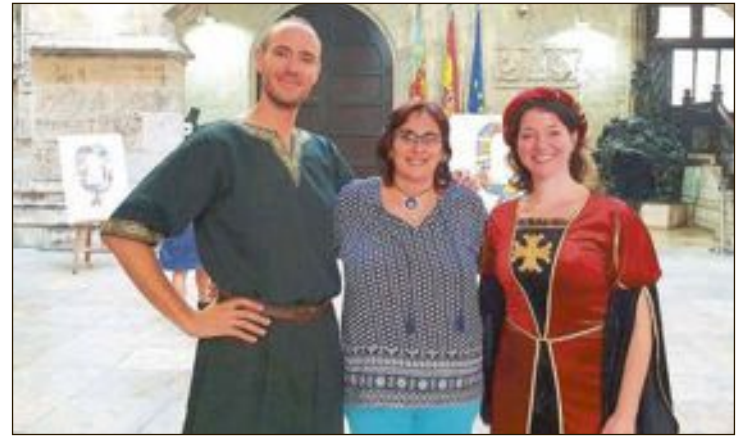
La edil de Educació y profesora del colegio en la visita teatralizada