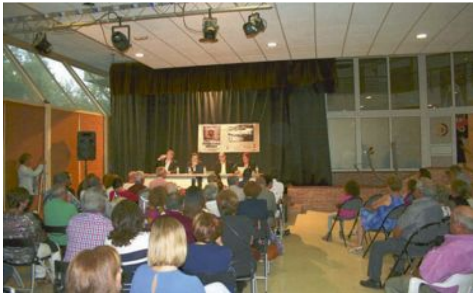
La presentación del libro tuvo lugar el 29 de septiembre en el Centro Cultural