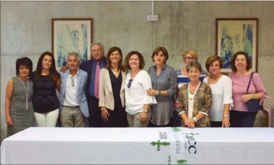
El diumenge 1 d'octubre va tindre lloc la presentació de la nova associació local de lluita contra el càncer a Tibi