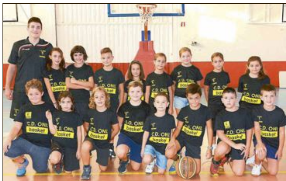
CD Onil Benjamín Mixto