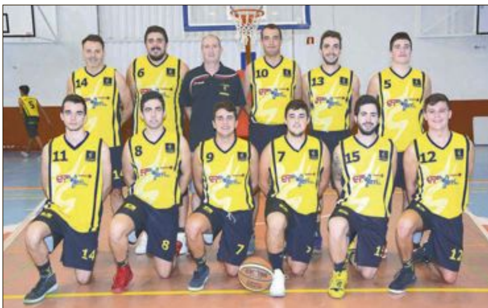
CD Onil Sénior Masculino Zonal 1