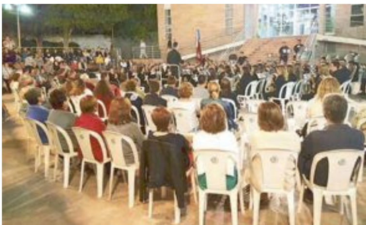
Concert de l'Agrupació Musical Santa Cecília