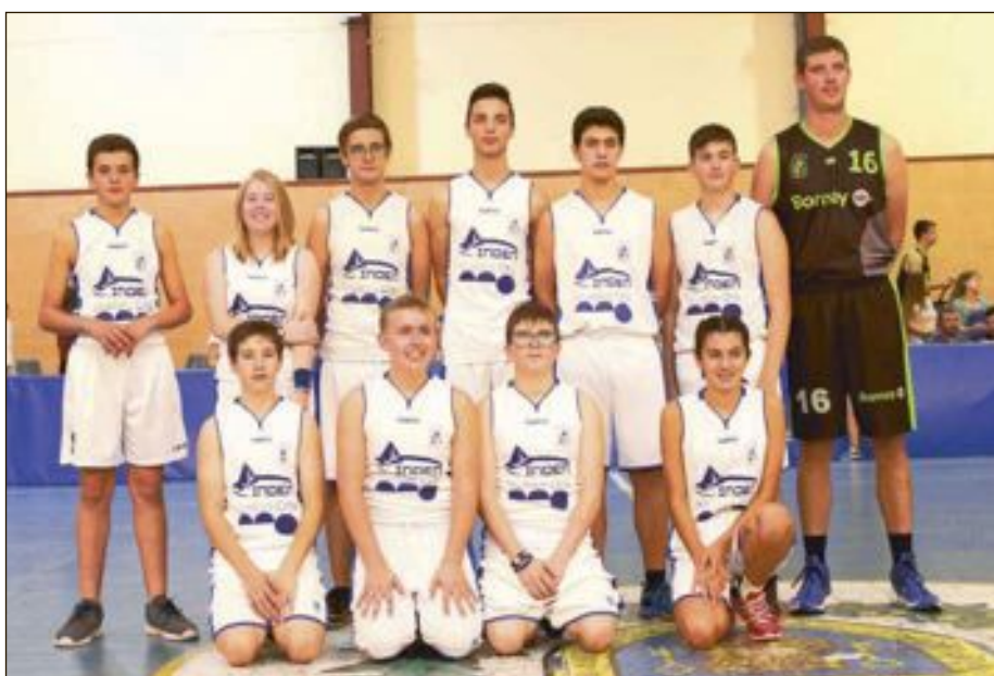
CB Castalla Cadete Mixto