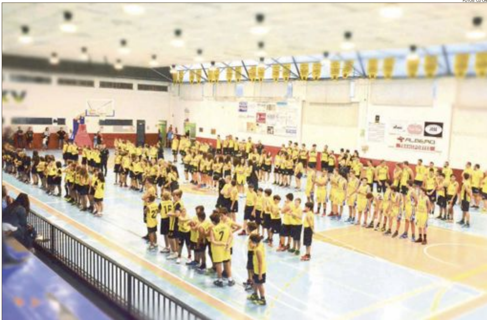
La presentación oficial de la nueva temporada del Club Deportivo Onil tuvo lugar el viernes 29 de septiembre en el pabellón del Polideportivo Municipal