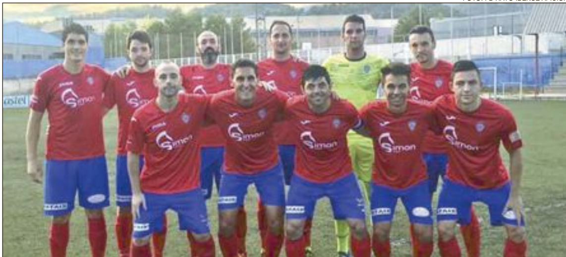
Imagen de archivo de un once inicial del Rayo Ibense de Tercera

Fue un encuentro muy igualado donde el equipo visitante