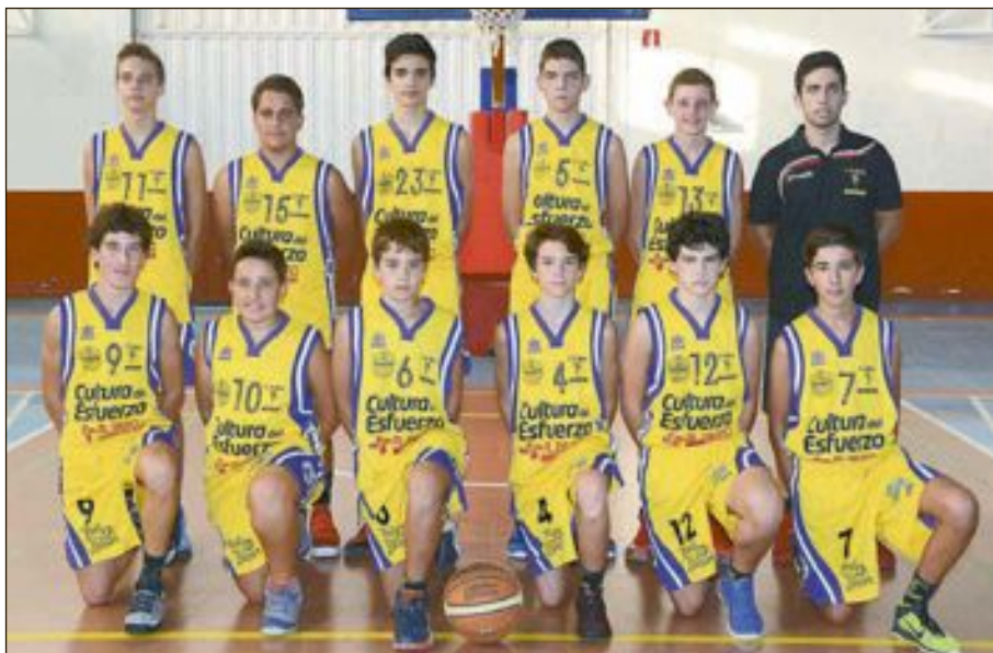
CD Onil Cadete Masculino Nivel 3