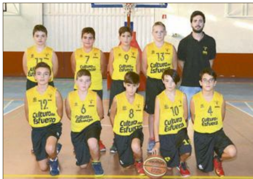
CD Onil Infantil Masculino Nivel 3