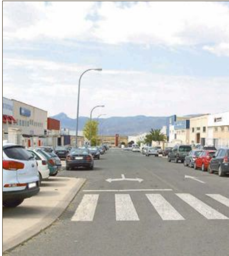
De los 208 nuevos contratos realizados en septiembre, 126 se han hecho en el sector industrial

Para el sindicato UGT, la contratación indefinida sigue siendo muy baja y a tiempo parcial involuntario, "por eso es urgente controlar el abuso y el fraude en las contrataciones, aspecto importante que a lo único que nos está conduciendo a la economía y la sociedad es hacia un modelo de desarrollo desequilibrado".