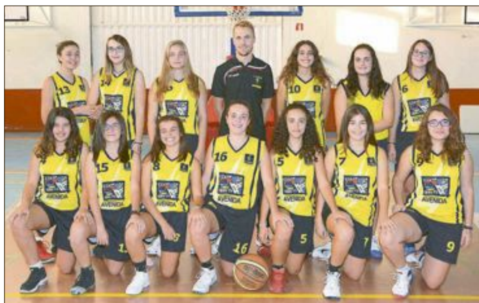
CD Onil Cadete Femenino Nivel 3