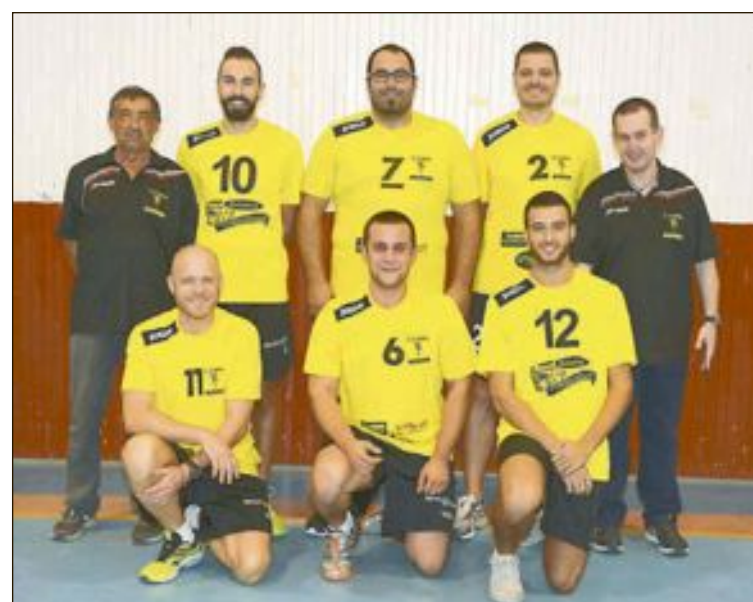
CD Onil Voleibol Sénior Masculino