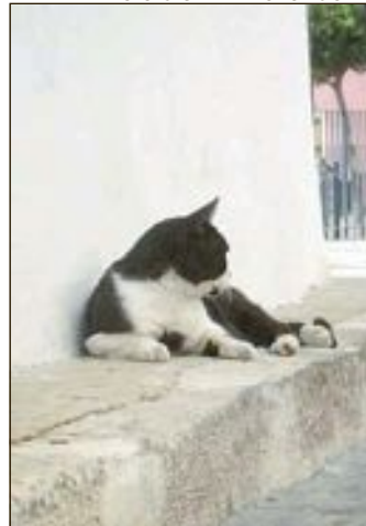
Un gat de carrer en el casc antic