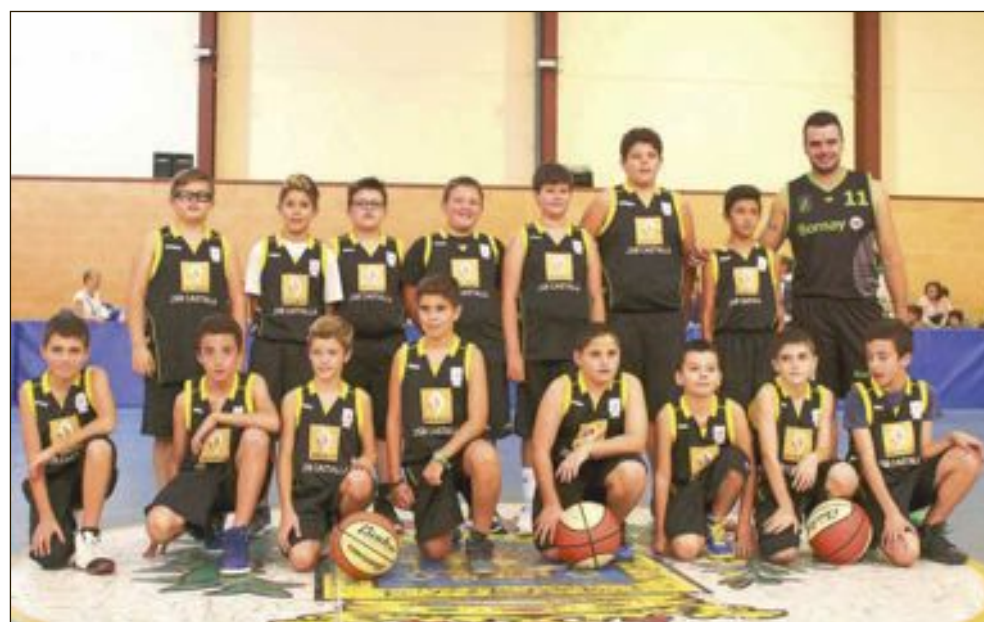
CB Castalla Alevín Masculino