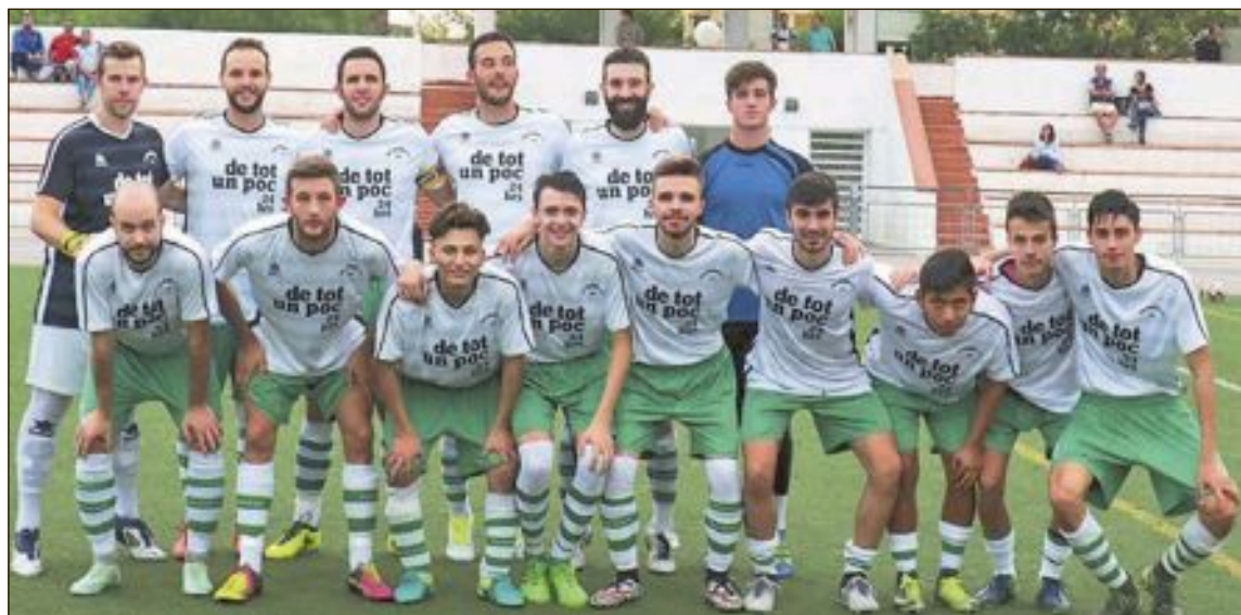
Jugadores de la Peña Madridista de Ibi que se desplazaron a Alicante el sábado 30 de septiembre

Estas esperanzas para el segundo tiempo se esfumaron a los dos minutos, cuando se le