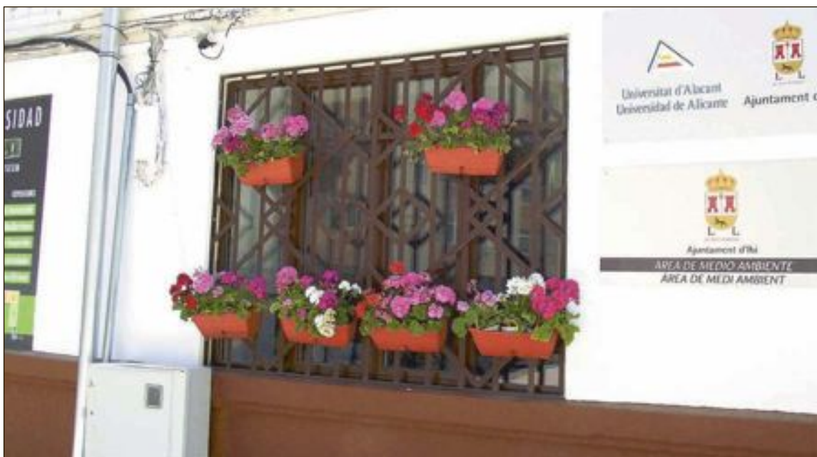
El Ayuntamiento repartió en mayo flores a los vecinos del casco antiguo, como parte del programa Urbact

Comienza la segunda fase del programa europeo en el que participa Ibi