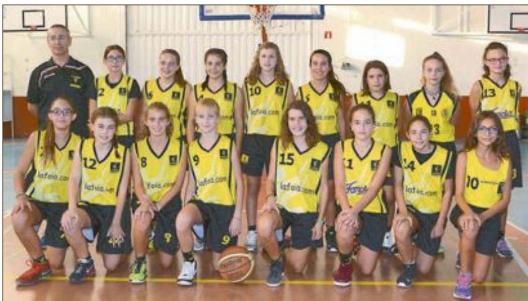
CD Onil Infantil Femenino Nivel 3