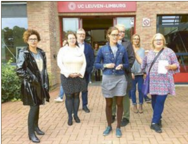
Asistieron a la reunión, la coordinadora de Educación y una profesora del centro de formación de personas adultas Joan Lluís Vives

El programa se basa en la colaboración y el trabajo conjunto de siete entidades europeas expertas en la materia. El Ayuntamiento de Ibi, con una larga y reconocida trayectoria en el ámbito del acoso escolar, coopera con la Universidad de Lovaina (Bélgica), la Universidad de Coimbra (Portugal), el gobierno regional de Arad (Rumanía), la asociación de entidades educativa Polo Europeo del conocimiento (Italia), la empresa especialista en ciberbullying Action Synergie (Grecia) y el centro educativo Wesley János Óvoda (Hungría),