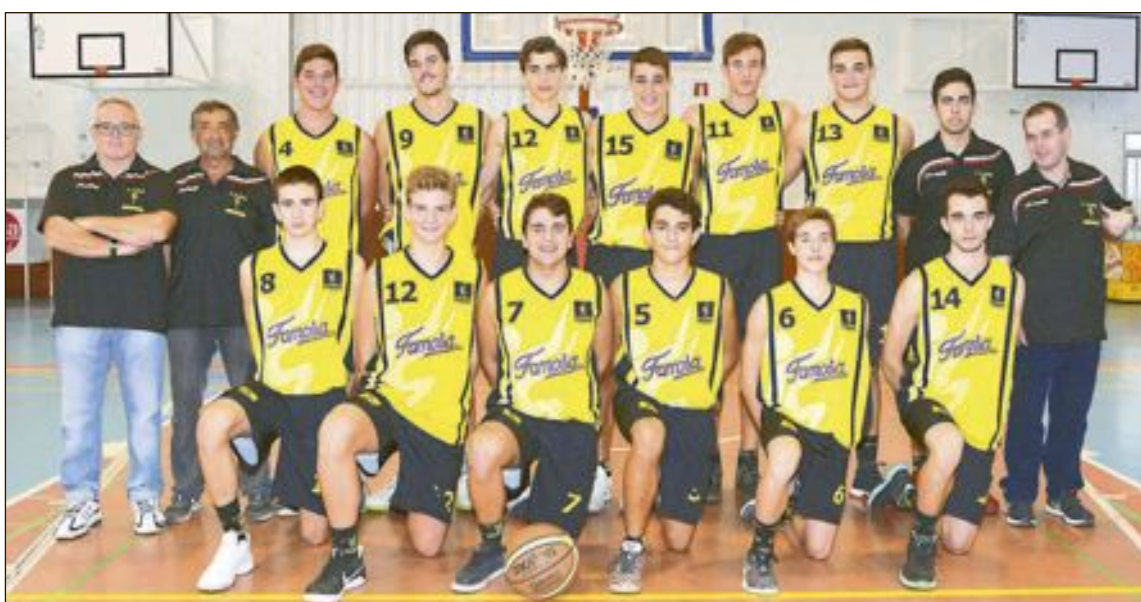
CD Onil Júnior Masculino Autonómico