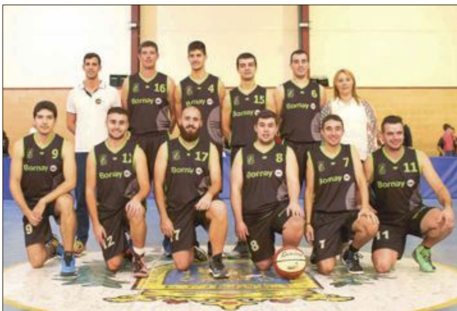
CB Castalla Sénior Masculino