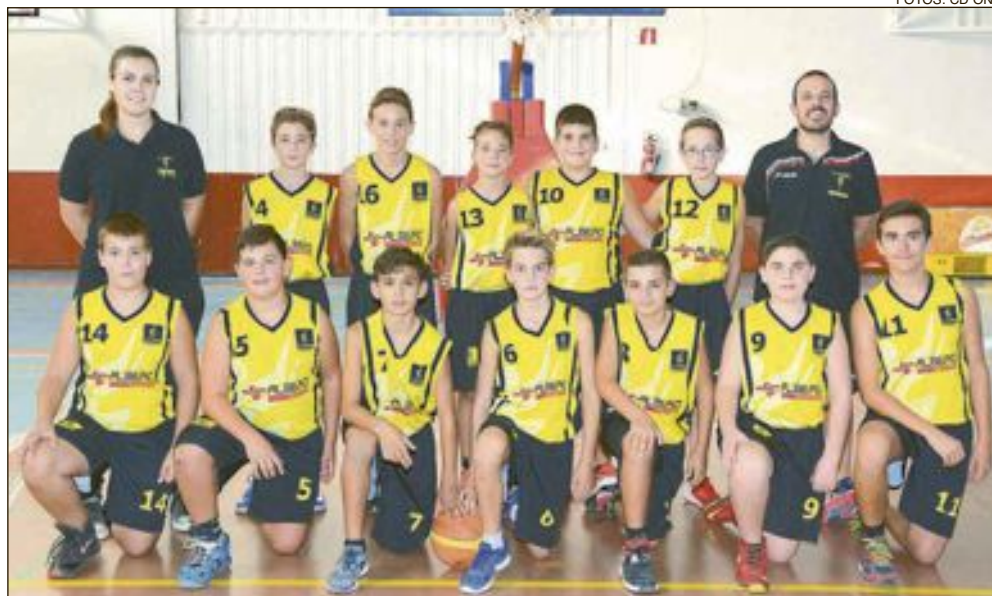
CD Onil Infantil Masculino Nivel 2