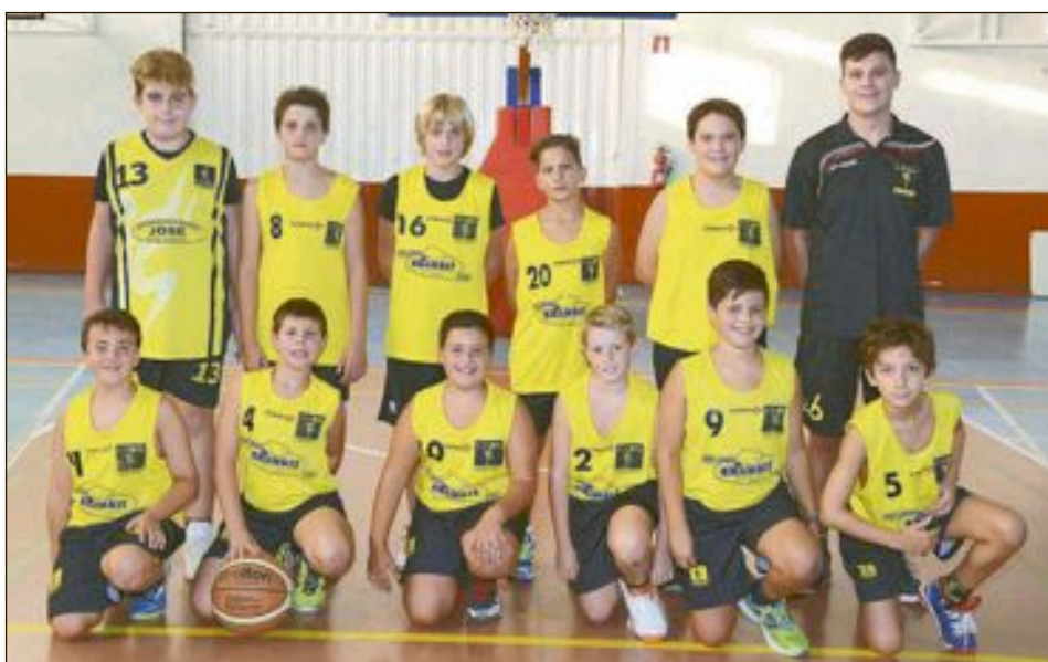
CD Onil Alevín Masculino Nivel 3