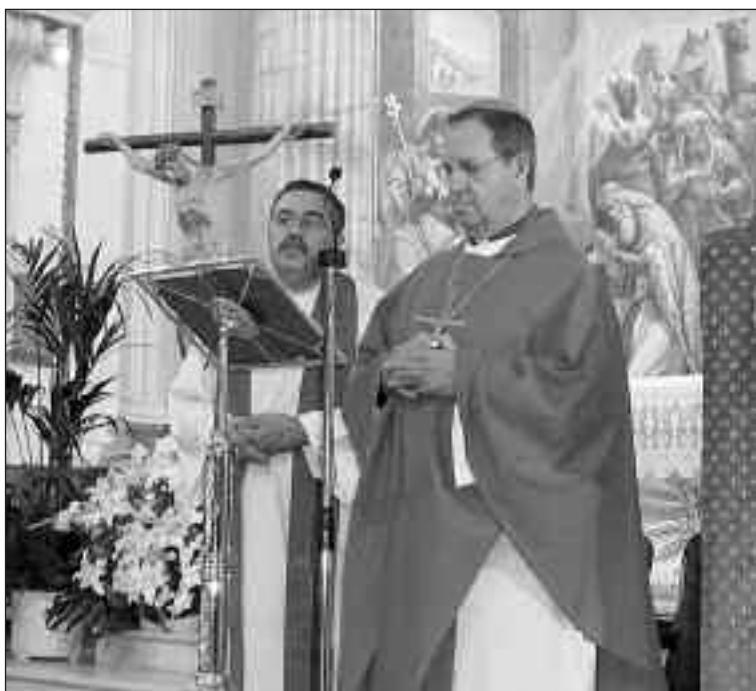
El Obispo de Orihuela-Alicante ofició la misa de la inauguración