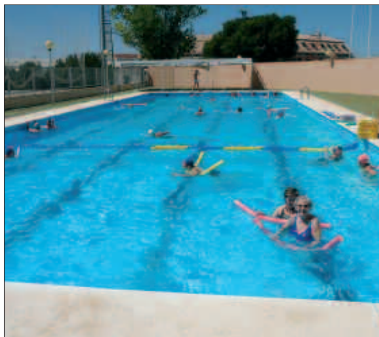
En la piscina del Climent se realizan cursos para personas mayores

La concejal de Deportes ha indicado que se ha optado por disminuir el tiempo de apertura de la piscina del Climent con respecto a otros años porque es una instalación deficitaria. Sarabia ha recordado que durante el mes de julio está abierta la piscina climatizada.