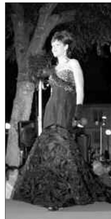
Como se puede comprobar en estas imágenes, la velada fue brillante y estuvo arropada por numerosos espectadores

Asimismo, el PSOE considera que ésta "es una buena ocasión para recordar al Ayuntamiento que esta Muestra no debe ser un evento aislado", sino que "debe mimar y cuidar al comercio de Castalla