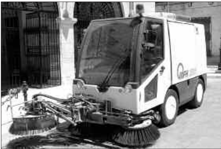
La nueva máquina de limpieza, a las puertas del Ayuntamiento