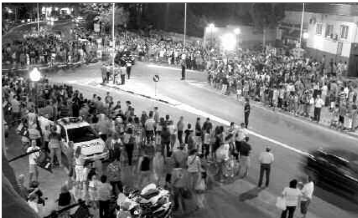
Más de 3.000 personas, según fuentes policiales, se echaron a la calle en Ibi para celebrar la victoria española