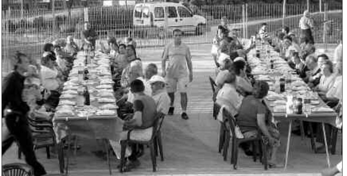
Este año, por primera vez, los participantes han adquirido un tiquet de 2,5 euros para poder entrar al recinto