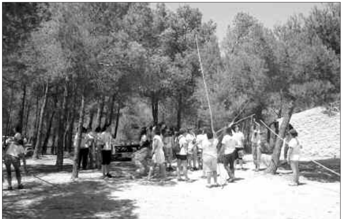
Las participantes durante la actividad medioambiental