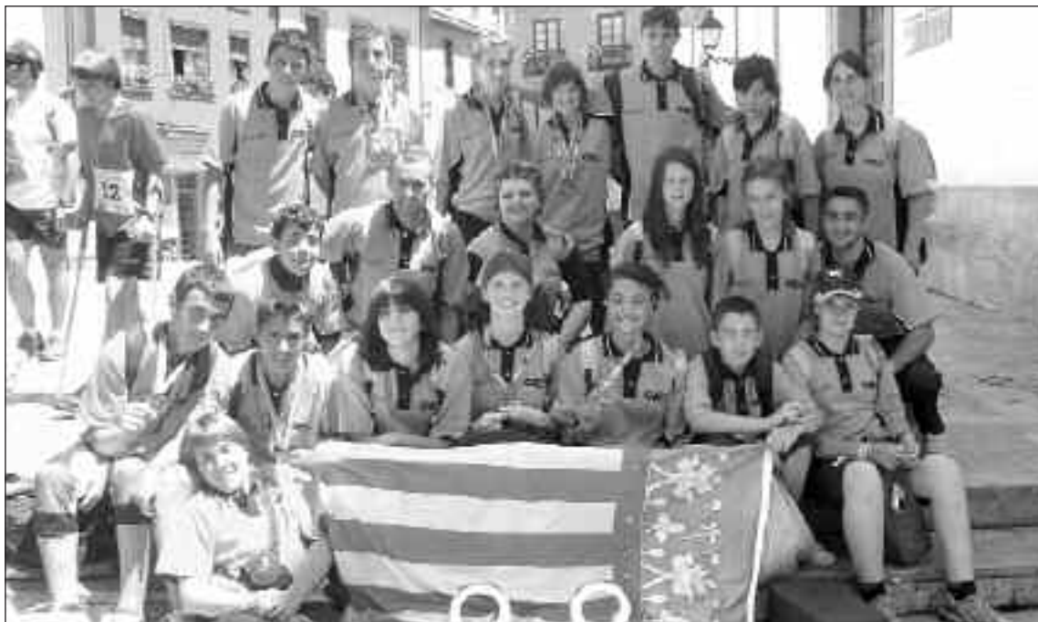
La expedición valenciana estaba formada por una veintena de personas

Fuentes del Centre Esportiu Colivenc indican que los resultados fueron buenos, "pero podrían haber sido mejores" si el terreno y los trazados hubieran sido más técnicos y con menos factor suerte.