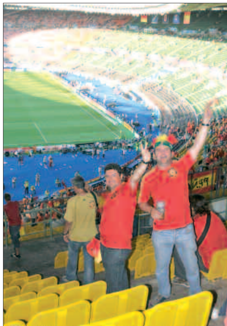
La expedición ibense paseó el nombre de la villa juguetera por toda Viena, incluido, por supuesto, el estadio donde se jugó la final