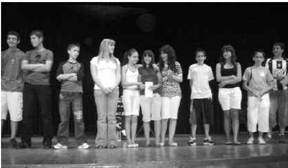
La ganadora, en el centro, junto a otros concursantes