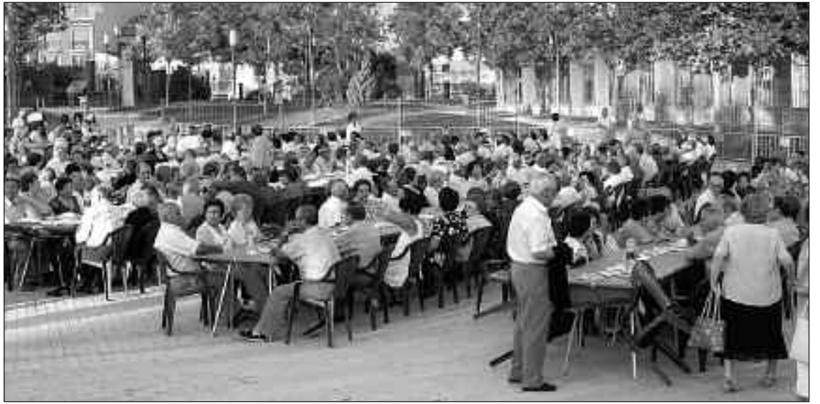
Alrededor de 700 personas asistieron a la cena del parque Les Hortes