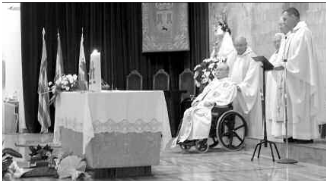
El sacerdote participó en la celebración de la Eucaristía

Actualmente, el sacerdote reside en la Casa Sacerdotal de Alicante.