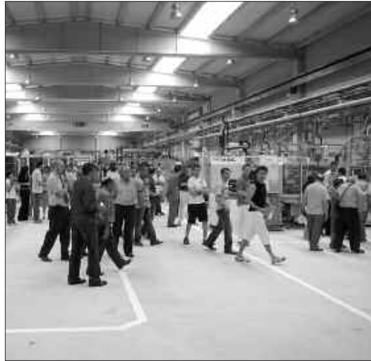
Interior de las nuevas instalaciones de Avenida Plastic