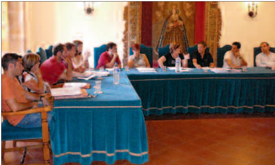
La alcaldesa y los ediles del equipo de gobierno del PP, en el pleno de presupuestos del martes 1 de julio