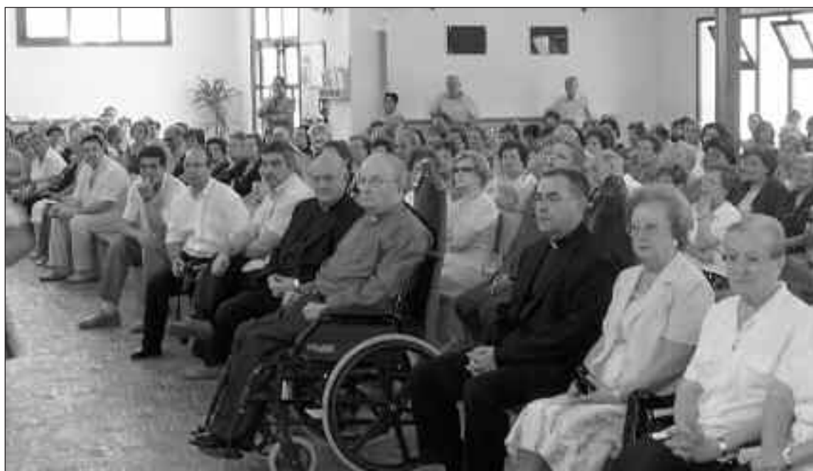
Numerosas personas asistieron el domingo 29 de junio al acto que se celebró en la iglesia de Santiago Apóstol