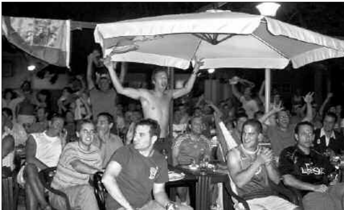
Numerosos aficionados de Onil siguen la final en el bar del parque municipal

Por supuesto, tanto en Biar como en Tibi hubo cientos de personas en las calles, al igual que en el resto de poblaciones de la geografía española, que celebraron por todo lo alto el triunfo de nuestra selección.