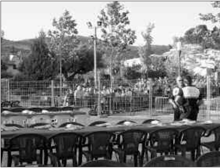
Agentes de la Policía y Protección Civil controlaron el acceso al recinto