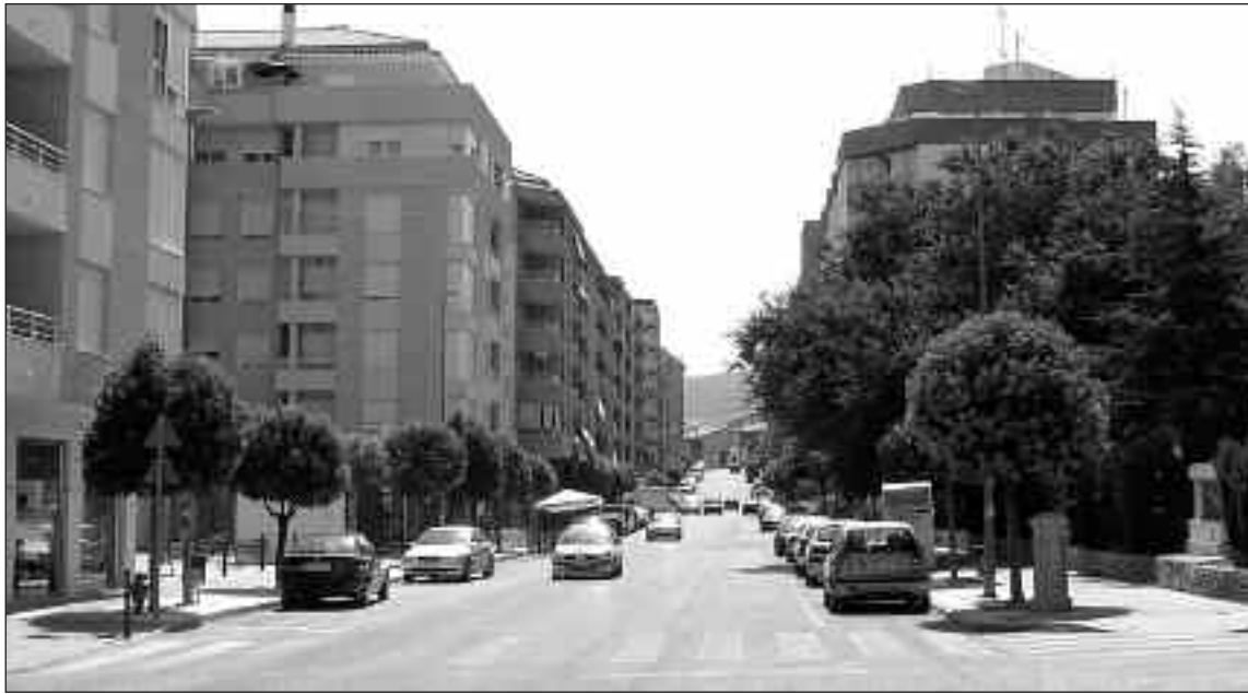
La avenida de la Paz acogerá por primera vez la I Feria de San Cristóbal

En la I Feria de San Cristóbal se expondrán vehículos nuevos y de ocasión; clásicos, complementos de automoción: artesanía, artículos de regalo y otros productos. Además de la paella gigante del sábado, se ha organizado la I Carrera de radiocontrol, el domingo a las 10'30h, en la avenida La Paz. El viernes, habrá un espectáculo de sevillanas a cargo del grupo local y luego discomóvil, a partir de las 21h. El sábado, a la misma hora, se ha programado otra actuación a cargo