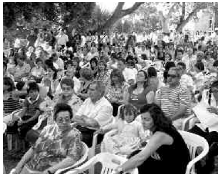
Numeroso público asistió a la XII edición de Castell Vermell

El grupo Castell Vermell fue el encargado de cerrar la duodécima audición de fin de curso, tras la entrega de diplomas, con dos piezas 'Toc de cucanyes' y 'Zorongo Gitano'. El público salió muy contento del repertorio.