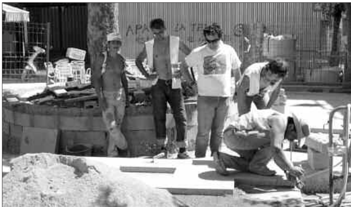
El jueves por la tarde, comenzó la pavimentación en la plaza que durará alrededor de tres semanas

Los comerciantes, además de solicitar que se agilicen las obras, piden al Ayuntamiento de Ibi que realice campañas informativas en los medios de comunicación locales animando a los ciudadanos a que acudan a los establecimientos y heladerías de la zona.