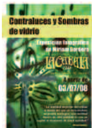
Cartel de la exposición