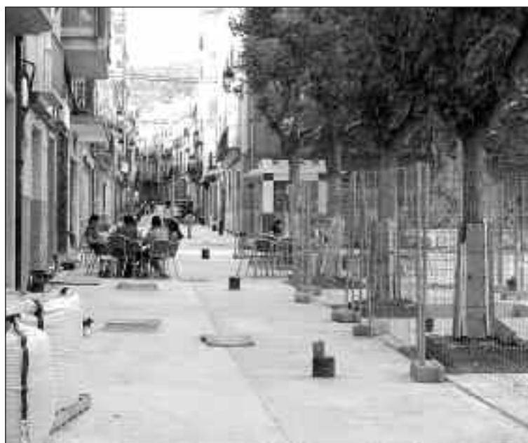
Escasa presencia de clientes en las terrazas de la plaza La Palla