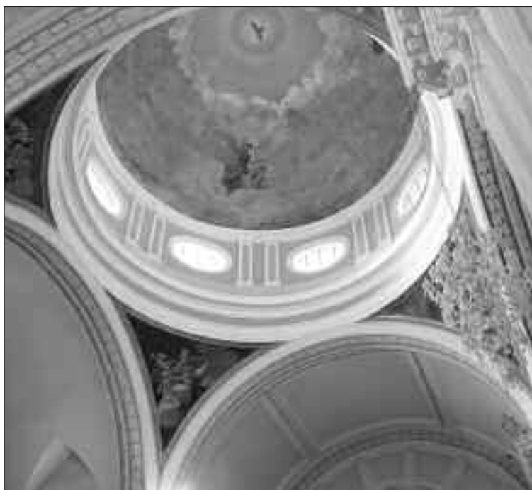
Se han restaurado las grietas de la cúpula y las pinturas

El acto de presentación estuvo presidido por el Obispo de Orihuela-Alicante y la corporación municipal