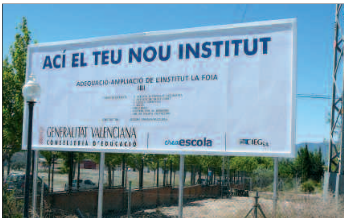
Colocado el cartel en el patio para anunciar las obras de adecuación del centro

El concurso está dirigido a estudiantes de diseño y recién titulados. El tema escogido este año por el Instituto Tecnológico del Juguete ha sido el de 'jugar con movimiento'.