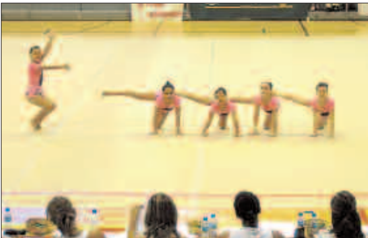
Un momento de la actuación de las ibenses