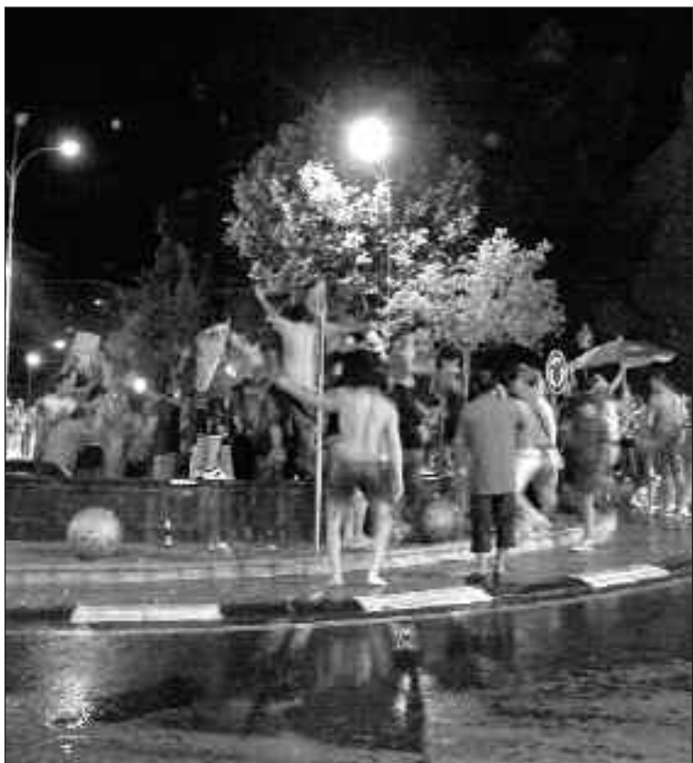
Los más osados se bañaron en la fuente de la rotonda de Ibi