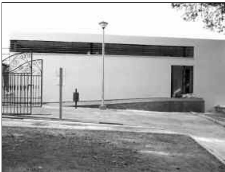
El Aula de la Naturaleza se encuentra en el Parque de La Carrasca

En el Aula de la Naturaleza, ubicada en el parque de La Carrasca, se abordaron temas