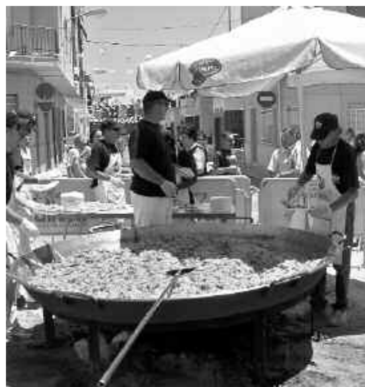
Una empresa de Alicante realizó la paella el domingo

El próximo concierto de este grupo de pop-alternativo será en la sede universitaria de Alicante, el miércoles 9 de julio, a las 23h.