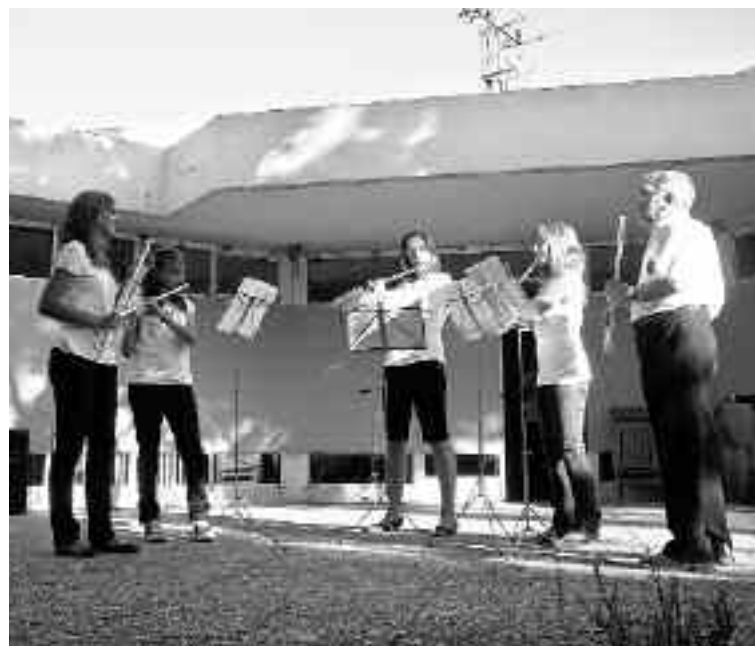
Uno de los grupos de flautas, durante la actuación de fin de curso