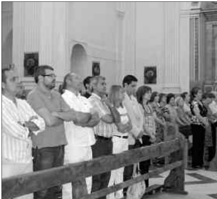
La alcaldesa y miembros de la Corporación asistieron al acto