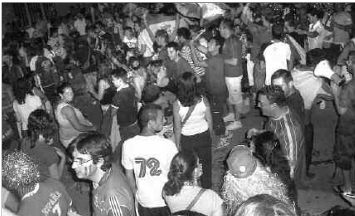
El parque municipal de Castalla acogió a cientos de aficionados