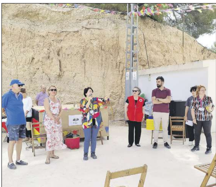
L'alcalde i la regidora d'Urbanitzacions (dreta) en l'acte de obertura