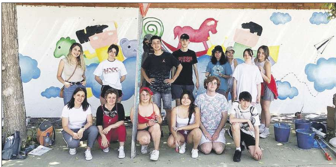
Alumnos de 1º de Bachillerato de Arte del IES La Foia ha pintado un mural con motivo de este Día

El primer premio está dotado con 600 euros, que otorga el Ayuntamiento, y habrá premios de 400 y 200 para el segundo y tercer clasificado. También se concederán accésits de 100 euros.