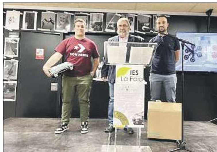
Uno de los alumnos premiados por el IES La Foia

futuras en grandes campeonatos como el mundial del próximo año, para el de este año solo quedan tres semanas y ya estamos apuntados».