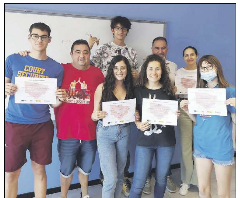
Han asistido once alumnos, todos ellos jóvenes de entre 18 y 29 años

ITC Packaging FALKEN NEUMÁTICOS Automóvil Club de Alicante subidaibi.es