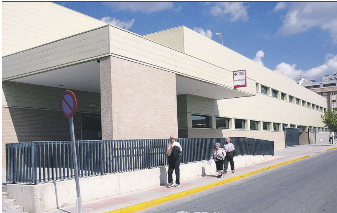
El nuevo contrato se licitará por 951.345 euros anuales (iva incluido), lo que supone un aumento de algo más de 280.000 euros respecto al anterior

La nueva contrata fue aprobada en el pleno del miércoles 1 de junio únicamente con los votos a favor de PP y Ciudadanos. El portavoz de la formación naranja calificó en esta ocasión la nueva contrata de «más realista», después de haber sido muy crítico con la oferta de Varese, que ofreció gratis 5.760 horas de trabajo anuales. Por eso, Nicolás Martínez pidió al equipo de gobierno que, en esta ocasión, tuviera cuidado con las bajas económicas que ofertan las