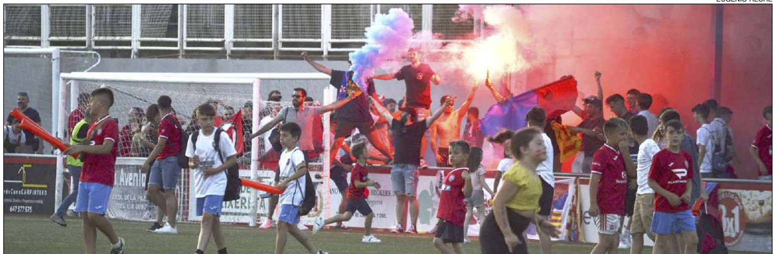
Los Rayo Boys, incansables, no dejaron de animar durante todo el encuentro

más a esa mochila de motivación, ganas e ilusión que este equipo lleno de experiencia y juventud tiene por el ascenso.