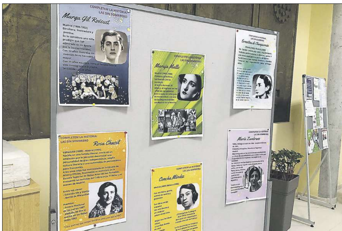
Exposición en el Centro Cultural Eusebio Sempere en una de las actividades del Día de la Mujer

En el área de cultura, educación y tiempo libre se buscará aumentar la creación cultural y artística de las mujeres, su participación en la cultura e impulsarla en los centros escolares con la