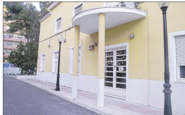
El Casal Jove se cerró al inicio de la pandemia

do «a puntos de vista diferentes con el técnico municipal» e indicó que la decisión política es poner en marcha el Casal Jove, para que sea, de nuevo, un lugar de encuentro sociocultural para los jóvenes, donde se ofrece una alternativa de ocio y tiempo libre.