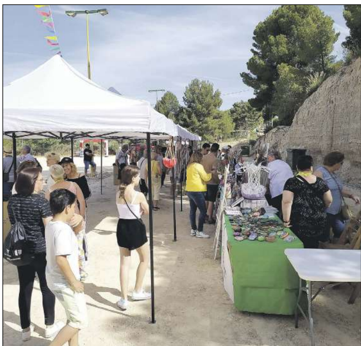
Mercat ambulant de llocs artesans, realitzats pels propis veïns