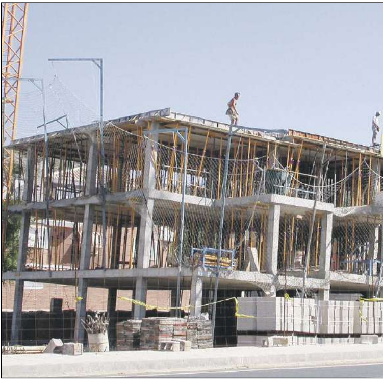
Industria, agricultura y construcción han tirado del paro en mayo generando 54, 10 y 13 empleos, respectivamente

La Concejalía de Medio Ambiente de Onil asume la gestión del voluntariado para este verano