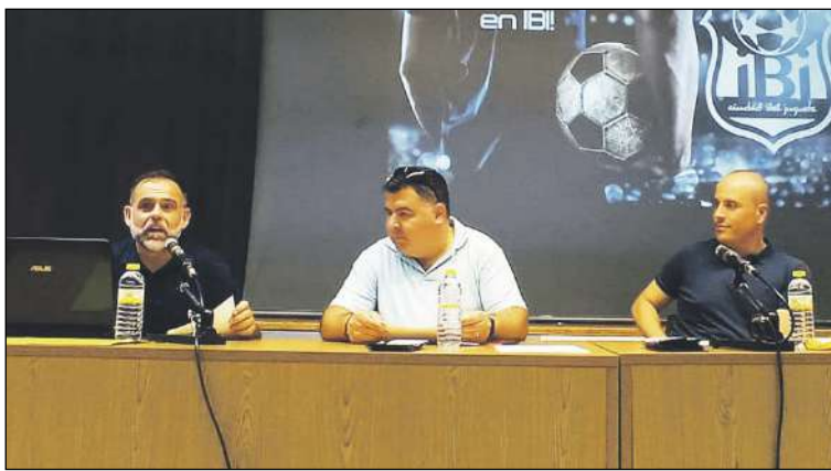
Acto de presentación del nuevo club a cargo de sus fundadores

El club arranca paso a paso, pero lo que está claro, y es oficial, es que el club solo contará, por el momento, con categorías inferiores, desde querubines hasta juveniles. Según hemos sabido, los recursos se quieren destinar en su totalidad a la formación de los más jóvenes, a nivel deportivo y a nivel social, enseñar los valores que promueve el deporte. La metodología de la base está bien definida para todos los equipos. se contará con entrenadores y formadores titulados, junto con un prepa-