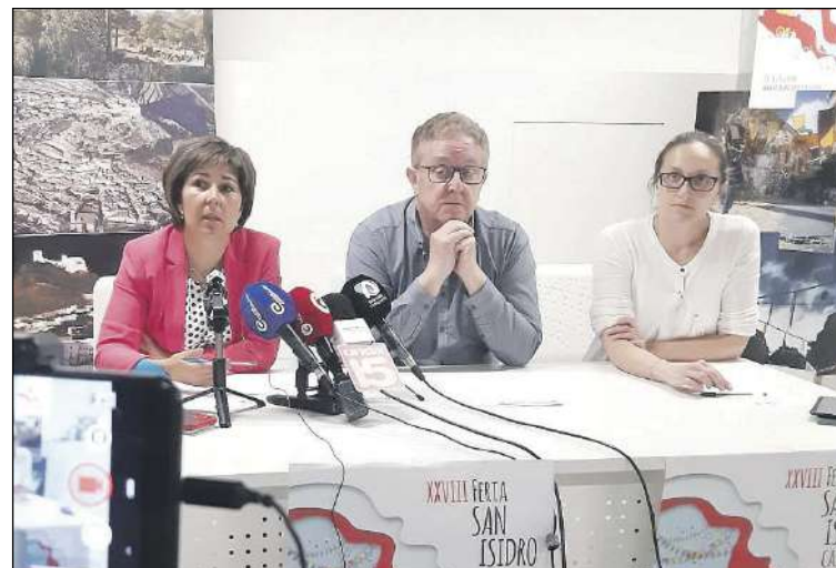
Roda de premsa de valoració de la Fira

Pel que fa a l'assistència, l'organització de la fira no pot facilitar dades concretes de l'assistència total de persones –en no haver col·locat comptadors que sí està previst instal·lar la pròxima edició-. Tampoc es pot entregar