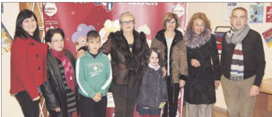
Todos los premiados en la sede de ACI junto a la edil de Comercio y el presidente de la Agrupación