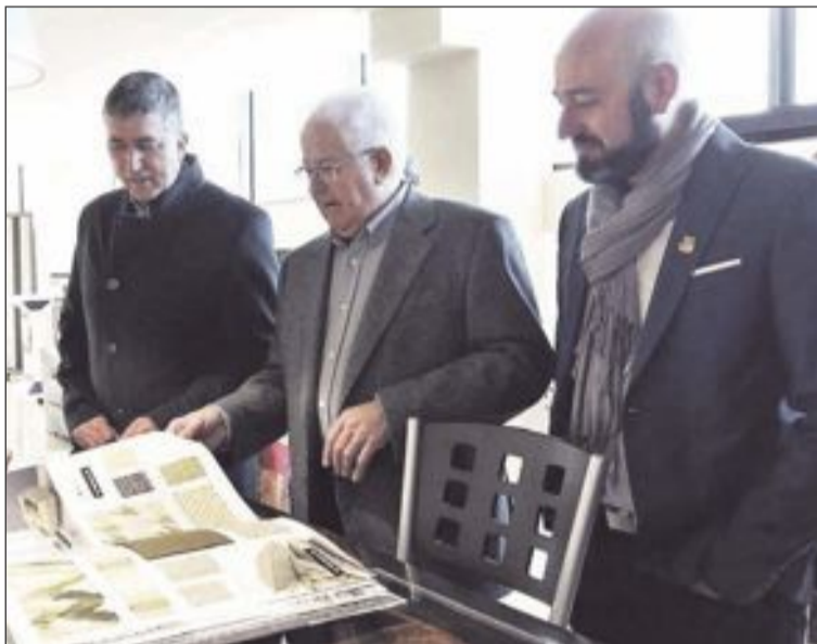
El conseller durante su visita a las empresas de Biar

El titular de Economía resaltó el esfuerzo que vienen realizando estas empresas para invertir de forma constante en investiga-