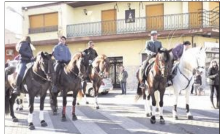
En el desfile de San Antón participó una treintena de caballos y jinetes