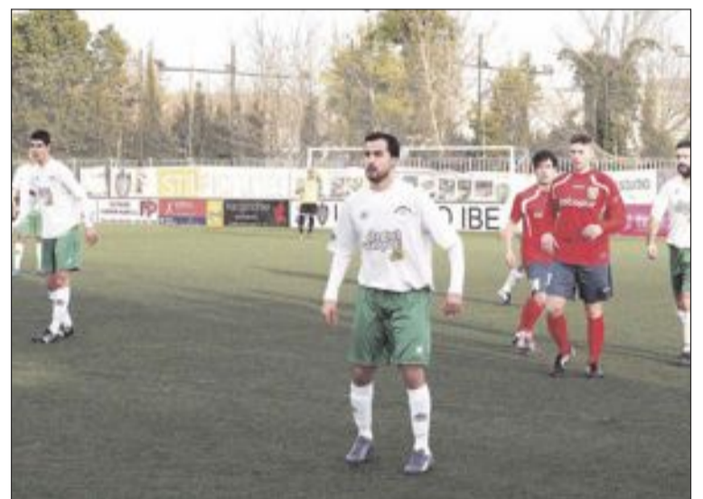
La Peña Madridista de Ibi consiguió un importante triunfo en el Vilaplana