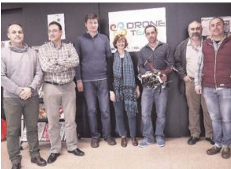
Equipo europeo durante su visita al instituto de Ibi

El lunes los alumnos y profesores del IES La Foia implicados en la Feria Aérea (otro proyecto de drones coordinado por la Univer-