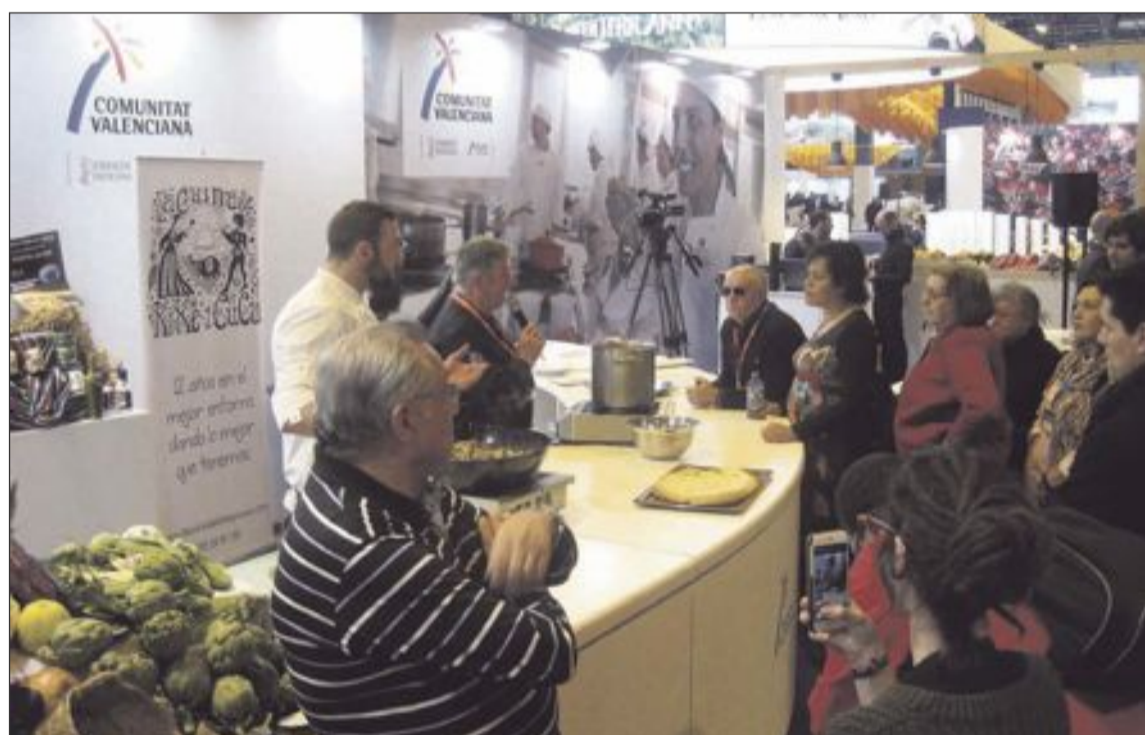
La Cuina de Kike y Cuca ofreció una degustación de gaspatxos de Castalla el día de la apertura de la feria