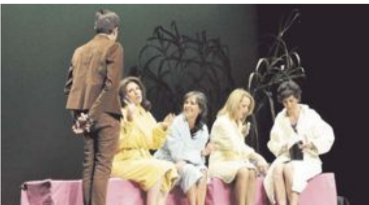
La obra se representa el 23 de enero en el Centro Cultural de Ibi

La estancia de los socios europeos concluyó con una visita cultural al Museo de la Fiesta.