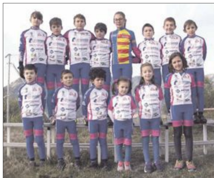
Escuelas de BTT

El Club Ciclista de Tibi agradece la colaboración de sus patrocinadores: