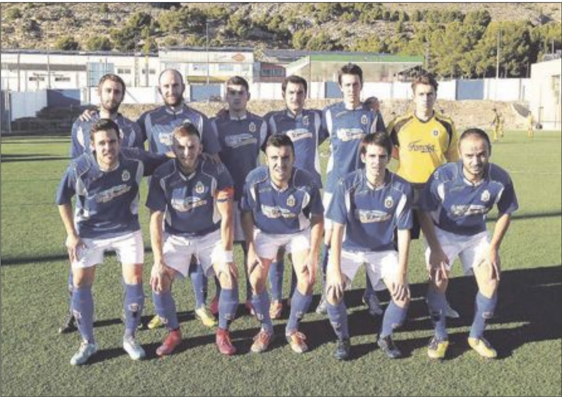
Once inicial de un partido de la UD Onil (archivo)

Escasas ocasiones Una primera parte para olvidar de ambos conjuntos, ya que solamente hubo un par de disparos a portería para cada equipo y con muchas interrupciones en el juego. El segundo tiempo, el Bocairent se adelantó en el marcador a los cinco minutos, en un error en la salida de balón de los de