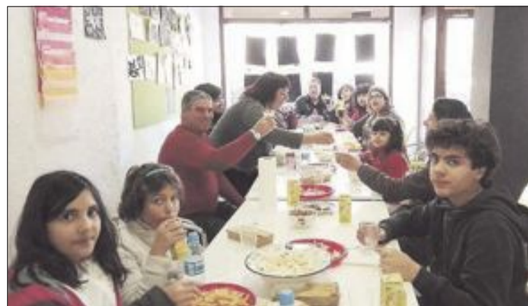
La sede de IntegrAcción se encuentra en la plaza San Vicente, nº 2, de Onil