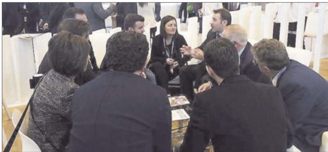
Momento de una reunión entre políticos de la comarca y representantes de la Diputación de Alicante

como el de los Reyes Magos, los parques temáticos y la variada y rica oferta gastronómica.