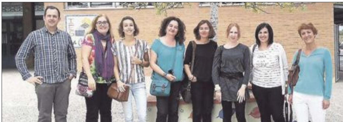
Un grupo de profesores franceses visitó recientemente el Instituto de Educación Secundaria La Creueta de Onil

También asistieron a una jornada de experiencias sobre la educación en Europa en el Centro de Formación, Innovación y Recursos Educativos de Elda (CEFI-RE). Por su parte, dos profesores del IES La Creueta viajaron hasta Clermont-Ferrand para observar los distintos dispositivos de que disponen en el instituto L'Oradou (SEGPA, Ulises, Relais, etc). Las citadas fuentes señalan que se