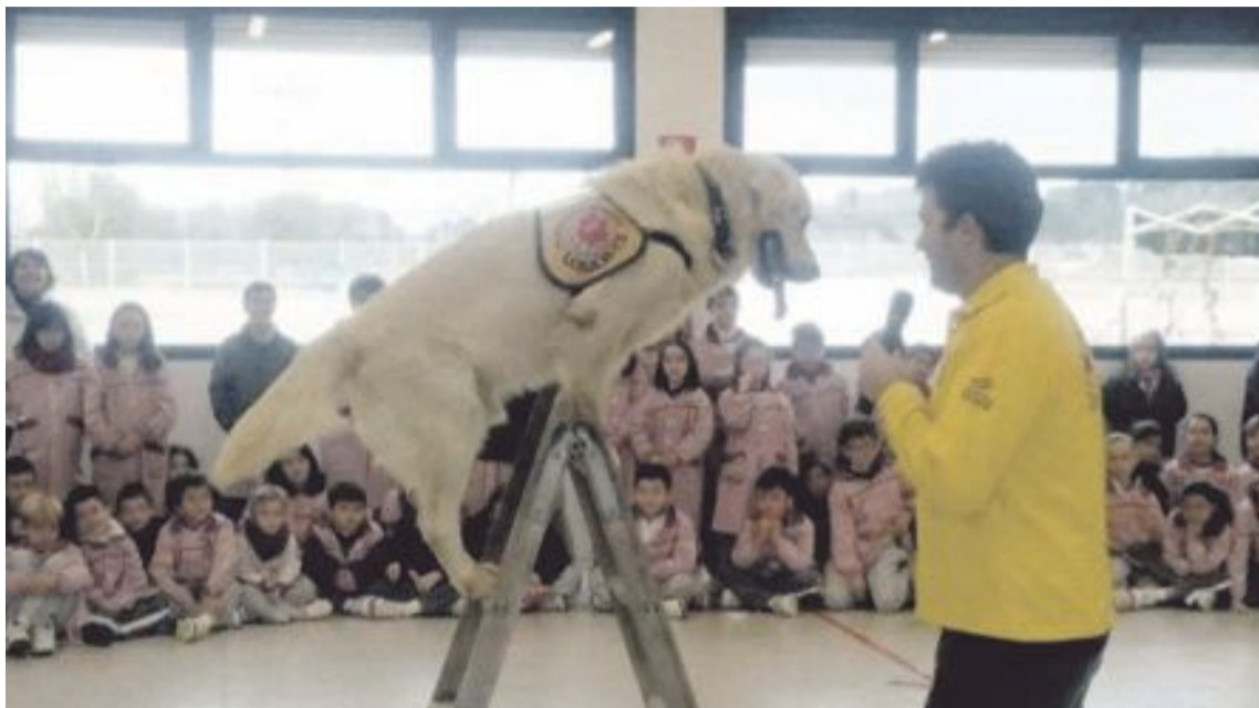
Miembros de la ONG realizando una demostración de habilidades durante una visita al colegio Muntori de Castalla

Los perros son el eje central de la labor de esta ONG, compuesta en su mayoría por bomberos, policías, médicos y enfermeros. Los animales intervienen tanto en las labores de búsqueda y rescate como en los diferentes programas y proyectos sociales, como el de compañía para mayores.