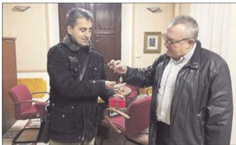
Los donativos recaudados se entregarán a asociaciones solidarias

horas, carretones. Desde las 18 a las 20 horas, también habrá vaca. El domingo se celebra, a las 12:30 horas, la Misa en honor a la patrona Santa María Magdalena, con la asistencia de la Reina y Damas de Honor de 2015 y, al finalizar, la ofrenda de flores en la Ermita.