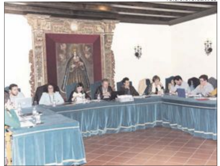
Imagen de archivo de un pleno celebrado en el Palacio del Marqués de Dos Aguas de Onil

«Respecte a l'ús del valencià en l'Administració local, des de l'equip de govern recolzem la normalització. Defensem i llui-