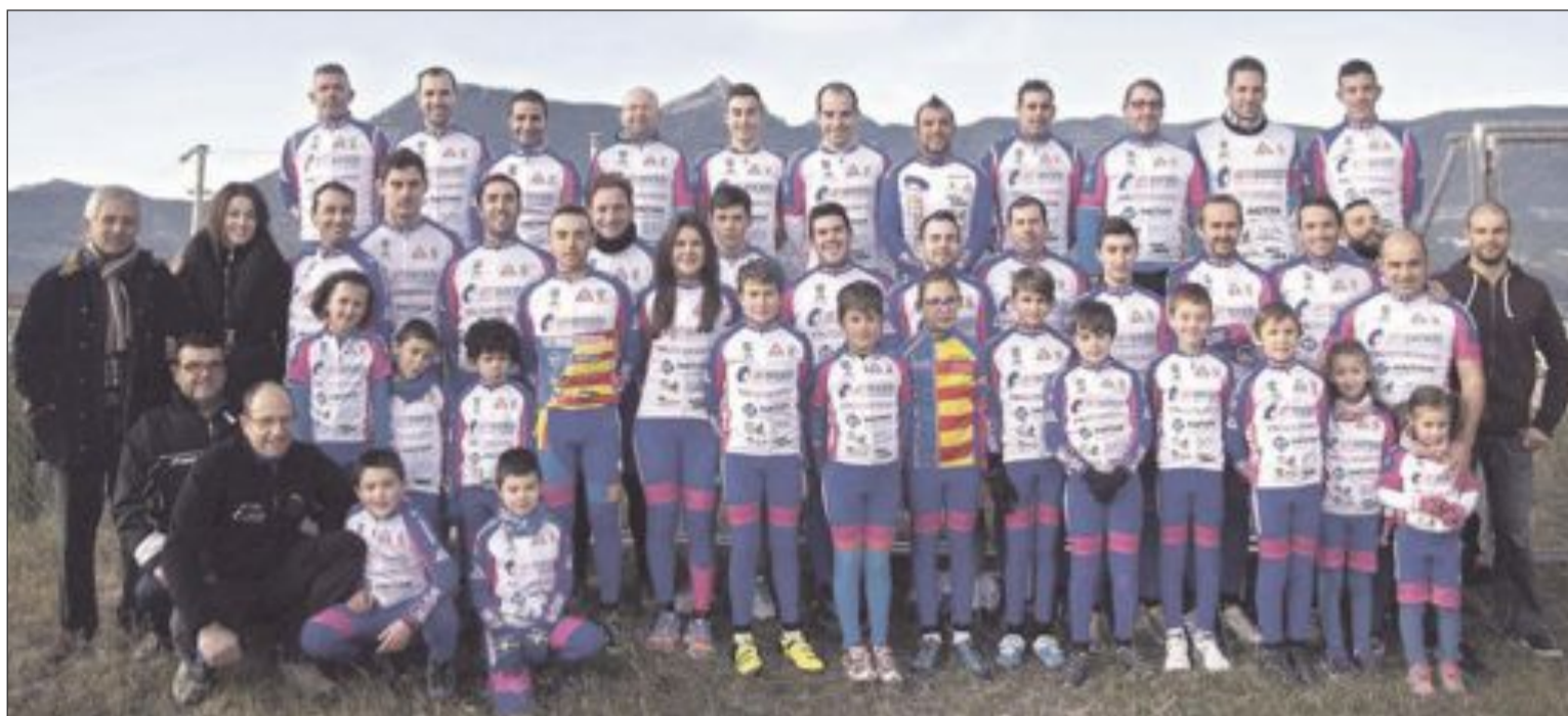
Club Ciclista Tibi AM Sonido

Para 2016, se continúa con la labor que se lleva desarrollando durante los últimos años apoyando a la cantera e inculcando