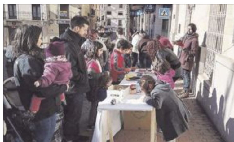
La fiesta infantil se celebró el sábado 16 de enero en la plaza Mayor