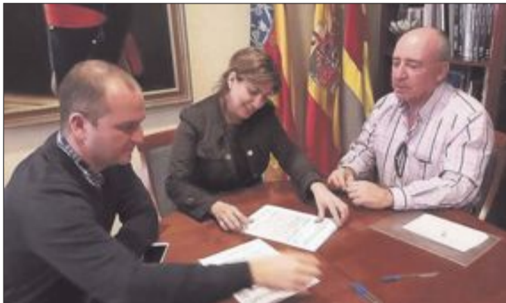
La edil de Urbanismo y un representante de la Diputación y de la empresa Involucra SL-Desmontes durante la firma del acta de replanteo

Concluido este trámite, se ha acordado que las obras comiencen el lunes 25 de enero.