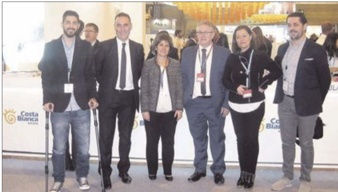
Alcaldes y concejales de Turismo de Ibi, Castalla y Onil en la inauguración de la feria el día 20 de enero

En el apartado festivo, se promociona, además de las Fiestas de Moros y Cristianos, les Festes d'Hivern y Els Enfarinats , los monumentos más emblemáticos,