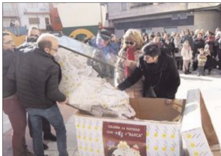
El sorteo tuvo lugar el sábado 16 de enero en la plaza Sanchis Banús