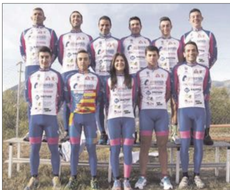
Equipo de competición

Desde el club queremos agradecer su apoyo a AM Sonido, Tecniacabados, Ayuntamiento de Tibi, Haitian Ibérica, Grupo Mirón, Muñecas Arias, Idfa, Restaurante El Picaor, Riber Inyectados, Citroen y Ciclos Pater.