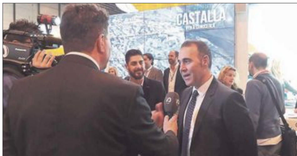
El alcalde de Ibi, Rafael Serralta, durante una entrevista con la televisión comarcal TVA