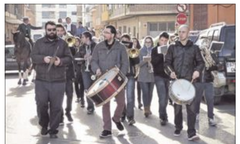
La Agrupación Musical Santa Cecilia amenizó la mañana