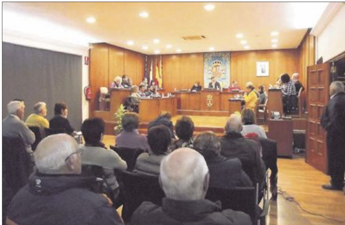
Una veintena de vecinos asistió el pleno del lunes 18 de enero donde se aprobó el compromiso municipal

Pero para culminar todo el proyecto, en el pleno del lunes se acordó, a propuesta del alcalde Rafael Serralta, destinar a esta obra el remanente de tesorería obtenido en 2015 y, además, recurrir a una modificación