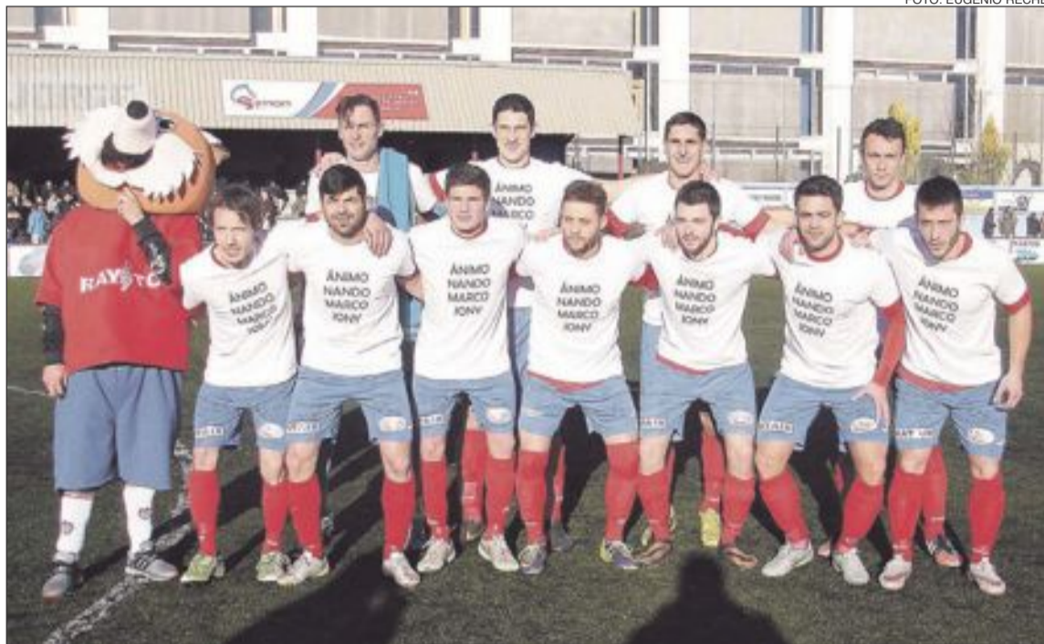
Los jugadores del Rayo lucieron una camiseta de apoyo a los lesionados del equipo

La primera acción del choque fue clave. Se pasó del posible 1-