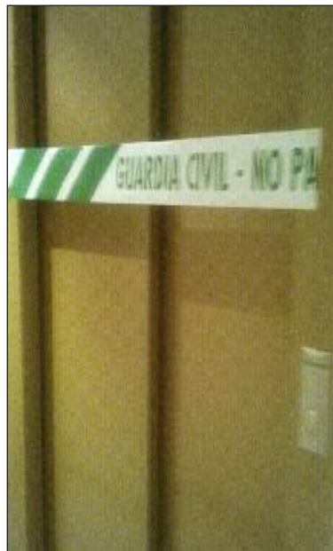
Ascensor donde ocurrieron los hechos y la puerta donde hallaron huellas