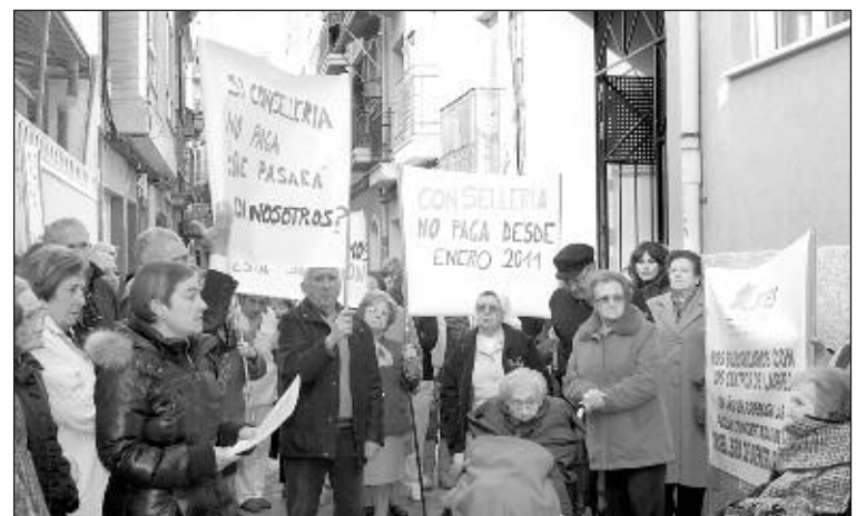
Protestas en el Asilo por los impagos de Conselleria

De los 190.971 euros que le fueron aprobados en concepto de ayudas por las 17 plazas concertadas para personas mayores dependientes, queda por abonar a fecha la cantidad de 76.388 euros y según la