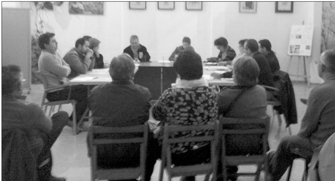
El plan de ajuste fue aprobado en Pleno por unanimidad de todos los grupos el 30 de marzo

Los políticos se quedan sin dietas, kilometraje e indemnizaciones por asistencia a plenos y comisiones.