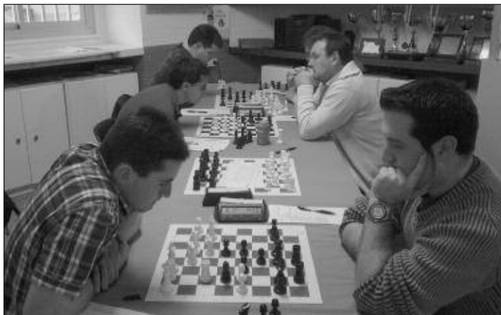
Momento de las últimas partidas disputadas en la sede del club de Oliva