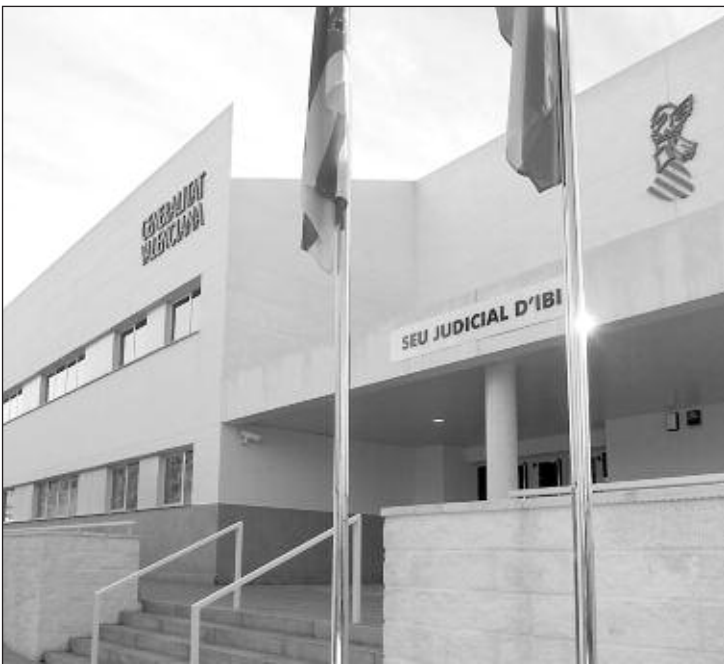
El Palacio de Justicia fue inaugurado en 2009