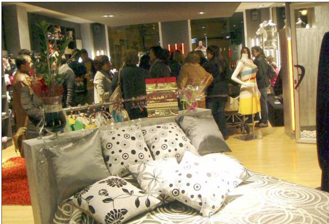
La nueva tienda de Cotó está ubicada en la Avenida de la Paz, 7 de Onil

Cotó , ahora en un espacio mejor y más grande, para satisfacción de Onil y comarca.