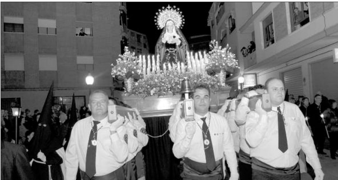
La imagen de la Virgen de los Dolores participa en las procesiones del Jueves y Viernes Santo