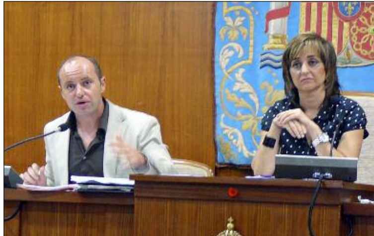
Pleno con la alcaldesa y el concejal de Hacienda

El PP explica en un comunicado que pudo sacar adelante