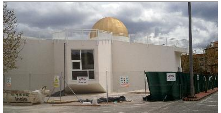
La Casa de los Reyes Magos se está construyendo en el parque Les Hortes