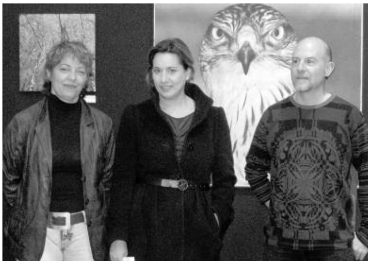
El autor junto a la portavoz del PSOE y la concejal de Medio Ambiente

El trabajo de campo se realizó entre el 2005 y el 2006. El autor visitó los bosques más importantes de la península, alrededor de 140, y el libro recopilará los 100 más importantes, además de una descripción técnica de cada parque natural y un bosque ideal