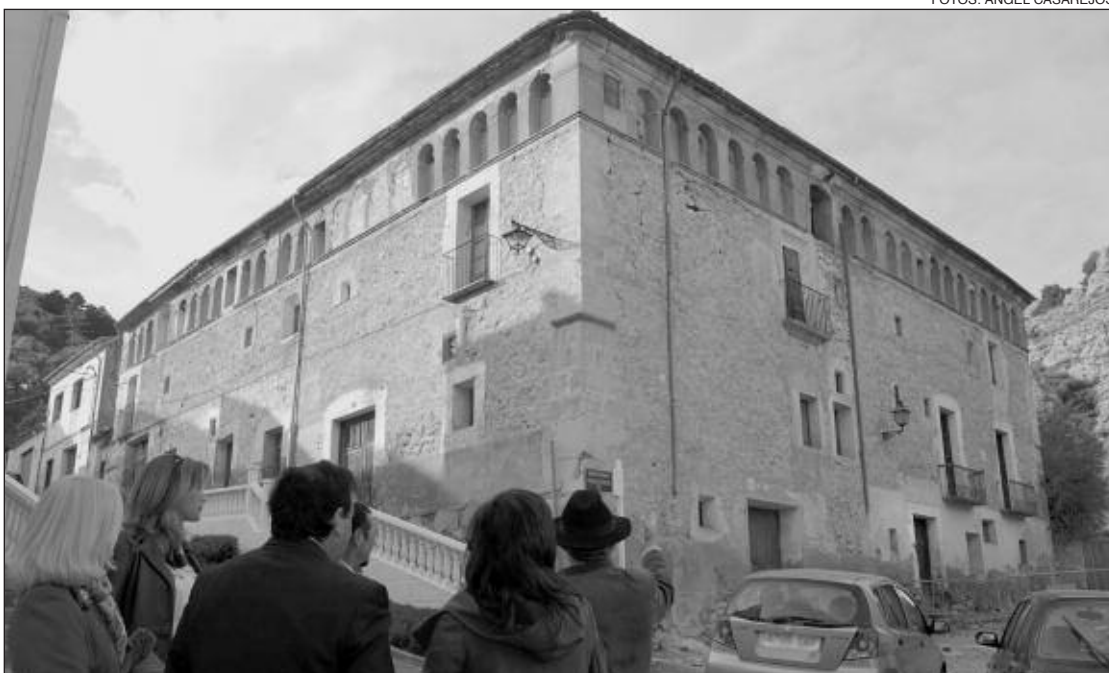
Aparte de comprobar el estado del Monasterio de Montserrat, la directora general de Patrimonio Cultural Valenciano visitó el Palacio del Marqués de Dos Aguas, la Exposición de Trajes Festeros, el Museo de la Muñeca, la Exposición Permanente de Arte de la Bienal Eusebio Sempere y el edificio Multiusos, que será inaugurado en breve