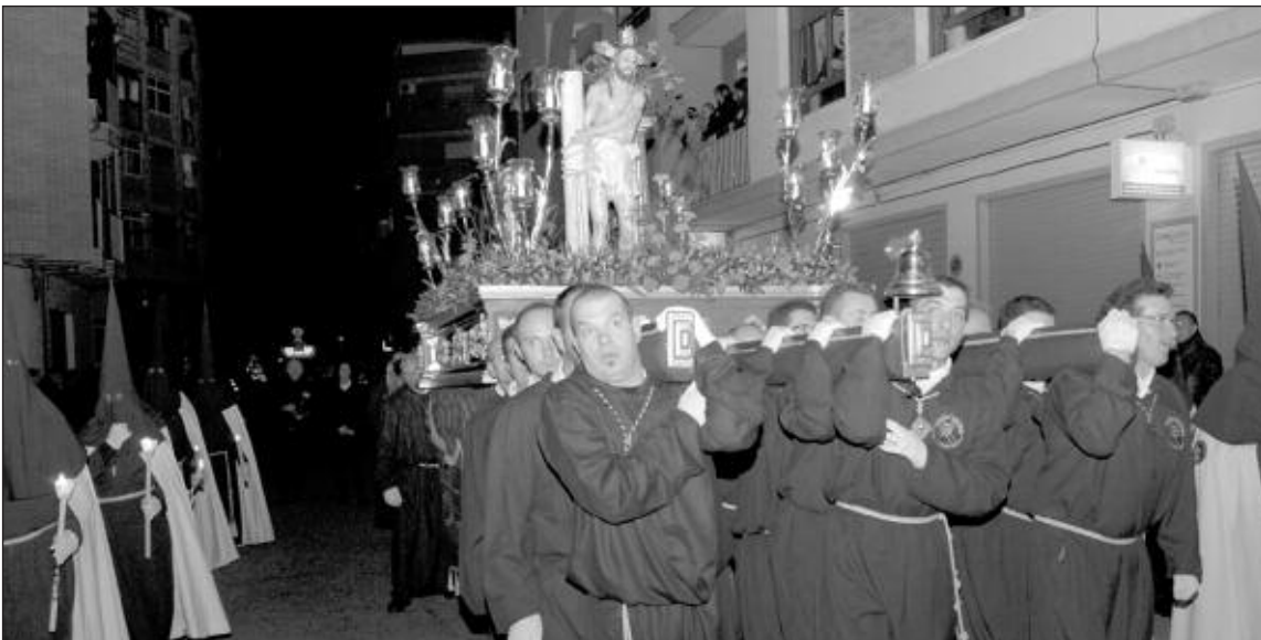
Imagen del Cristo de la Columna en la procesión del Jueves Santo