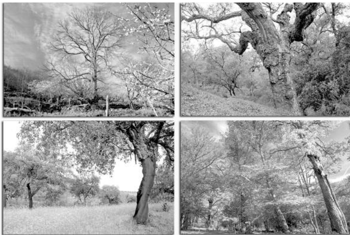
Valle del Jerte, Sierra de Aracena, Bosque de Hornachuelos y Hayedo de Huerta de Arriba, vistos por Kaiko