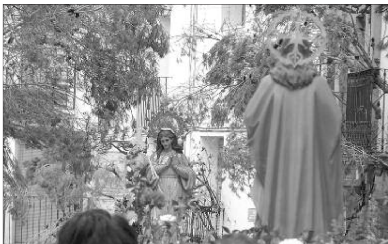
La procesión del Encuentro del domingo de Resurrección

Hace hincapié, asimismo, en que la medida, desde el punto de vista económico, no guarda relación con una gestión de medios eficiente, "ya que el Cuerpo de la Policía Local, es el departamento mas productivo del Ayuntamiento, puesto que durante el ejercicio 2011, se tramitaron expedientes de tráfico por valor aproximado a 9.500 euros y en infracciones urbanísticas se han tramitado casi la totalidad de los expedientes por obras sin licencia".