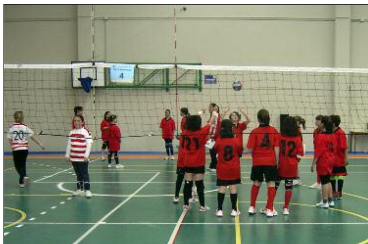
Los partidos de minivoley se disputaron en el Polideportivo de Biar