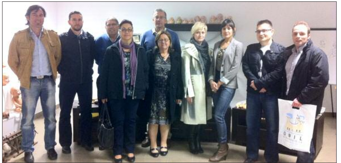
A la reunión asistieron los concejales de Turismio de Biar, Ibi, Onil, Tibi y el técnico de la Tourist Info de Castalla

Para finalizar, el lunes 16 de abril, festividad de San Vicente Ferrer, se celebra la procesión dels Combregars y el anuncio de Fiestas con los disparos de arcabucería, a cargo de las comparsas.