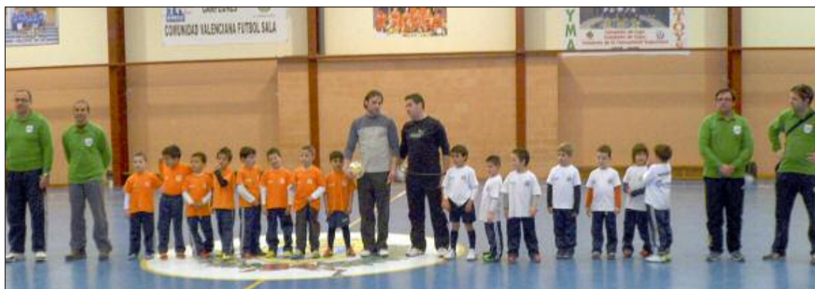
En la final de la categoría Querubín se enfrentaron los Leopards (camiseta blanca) contra los Cocodrilos