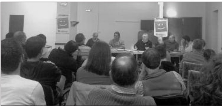
La charla se celebró en el Hogar del Pensionista