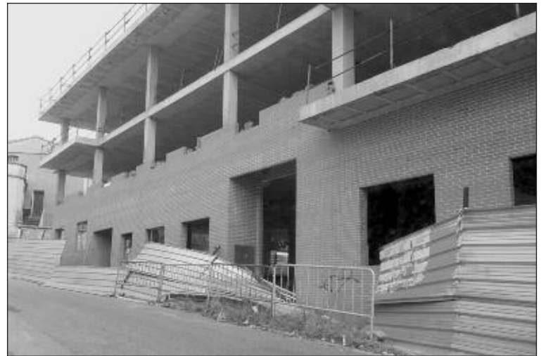
El edificio se encuentra situado en los aledaños del Parque (archivo)

Así pues, éste “es un problema que en ningún momento se ha abandonado e incluso actualmente se siguen realizando trámites legales por parte del departamento de Obras para buscar una solución definitiva”, explican desde el equipo de Gobierno municipal, que añade que, prueba de ello son los diferentes informes de la Policía Local y las actuaciones realizadas desde el año 2008, una documentación que puede consultarse en el Ayuntamiento.