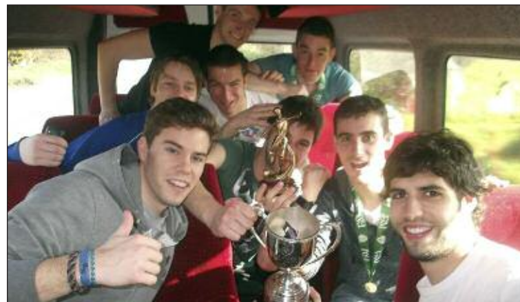
Equipo UCC ( University College of Cork ), celebrando el triunfo

Tras ganar tres partidos, pasaron primeros de grupo con