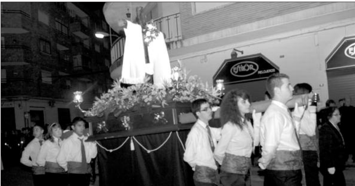
El paso de la Santa Cruz es llevado por costaleros muy jóvenes