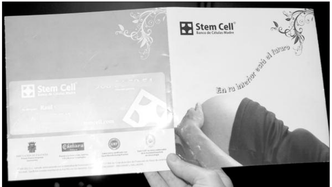
Tríptico al que ha tenido acceso Escaparate y que estaba en las clínicas hasta el mismo día de la detención

Tal y como informó este periódico en su número anterior, fuentes de la investigación confirman que las propiedades de los tres implicados en la presunta trama de células madre están siendo investigadas por la Policía Judicial.