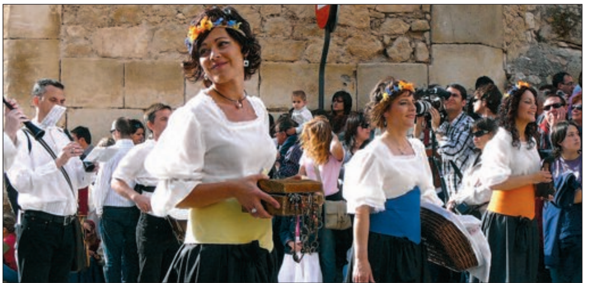
Componentes de una de las escuadras de Maseros