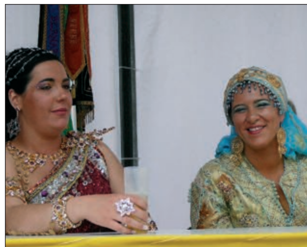
Abanderadas Mudéjar y Pirata