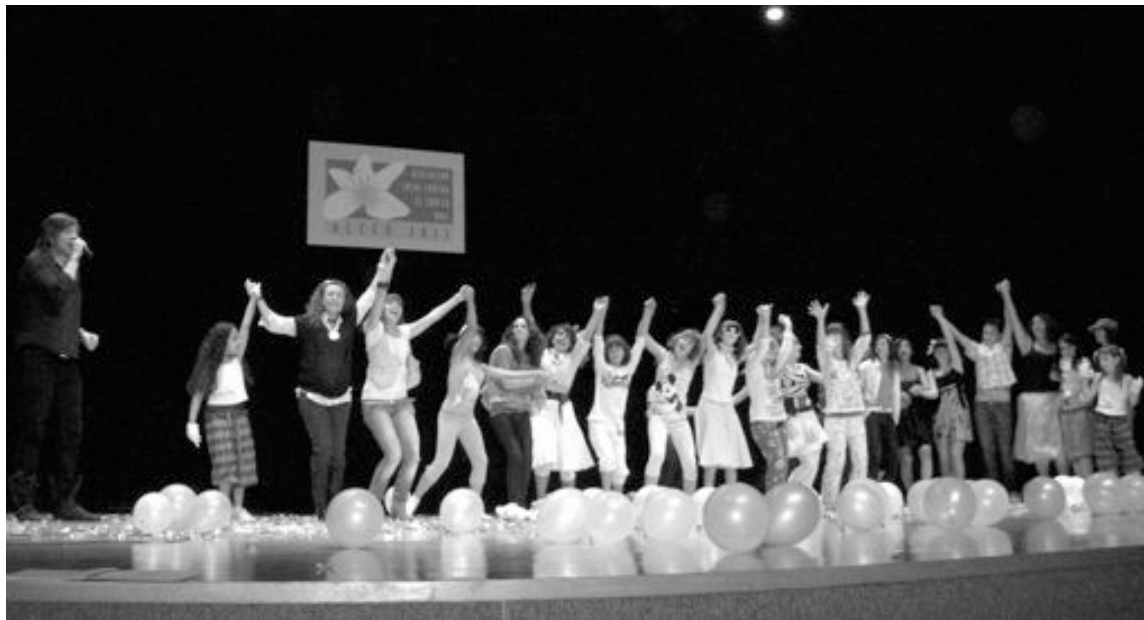
Un momento de la actuación, en el Centro Cultural de Onil

mundo cine mundo VIDEO CLUB C/. Tibi, 8 - Tel. 96 633 82 09 - IBI www.mundocineibi.com