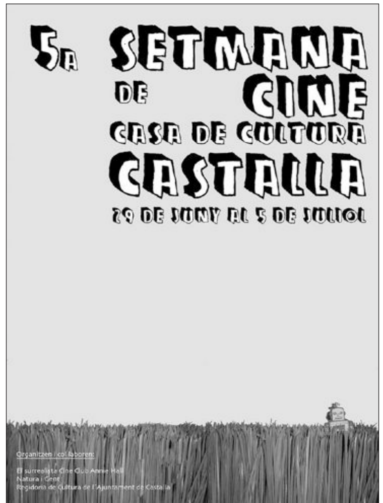
Cartel anunciador de la V Semana de Cine de Castalla

La particularidad es que estos trabajos no podrán durar más de un minuto. El premio al mejor nanometraje será de 100 euros, mientras que habrá un premio otorgado por el público que estará dotado con 50 euros.