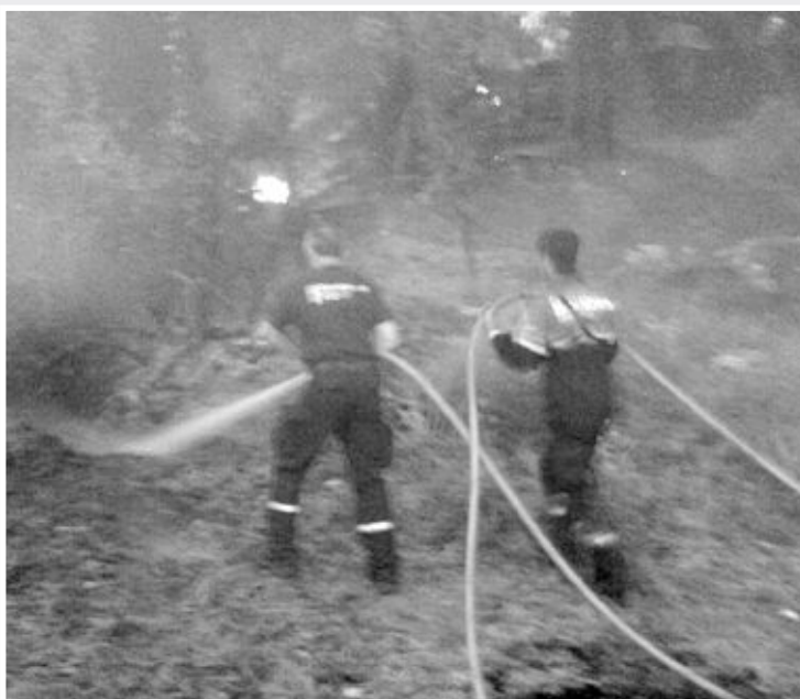
Los bomberos contaron con la colaboración de dos unidades aéreas

El incendio comenzó en una parcela del polígono 3, por causas que se desconocen, y rápida intervención de los todos los equipos de emergencia impidieron que las llamas ocasionaran más daños. Una hora y media después el fuego estaba totalmente controlado.