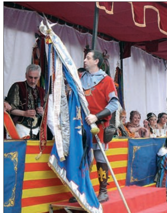
Primer premio para una escuadra Almogávar