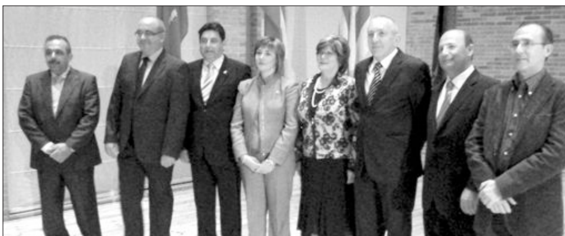
Arriba, los jefes de la Policía Local de las ocho localidades implicadas en el Plan. Abajo, alcaldes y concejales.

La actividad 'Cerdo Asado para Caridad' registró una numerosa entrada el sábado 9 en el parque municipal