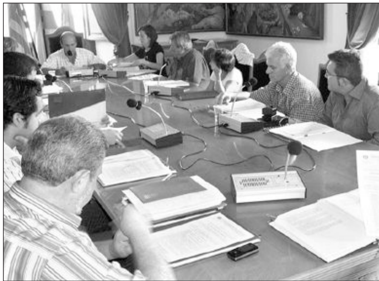
Imagen de archivo de un Pleno municipal

2. Pago de los libros de texto y material escolar para los cursos 2009-2010 y 2010-2011. El Ayuntamiento pagará un cheque por valor de 120