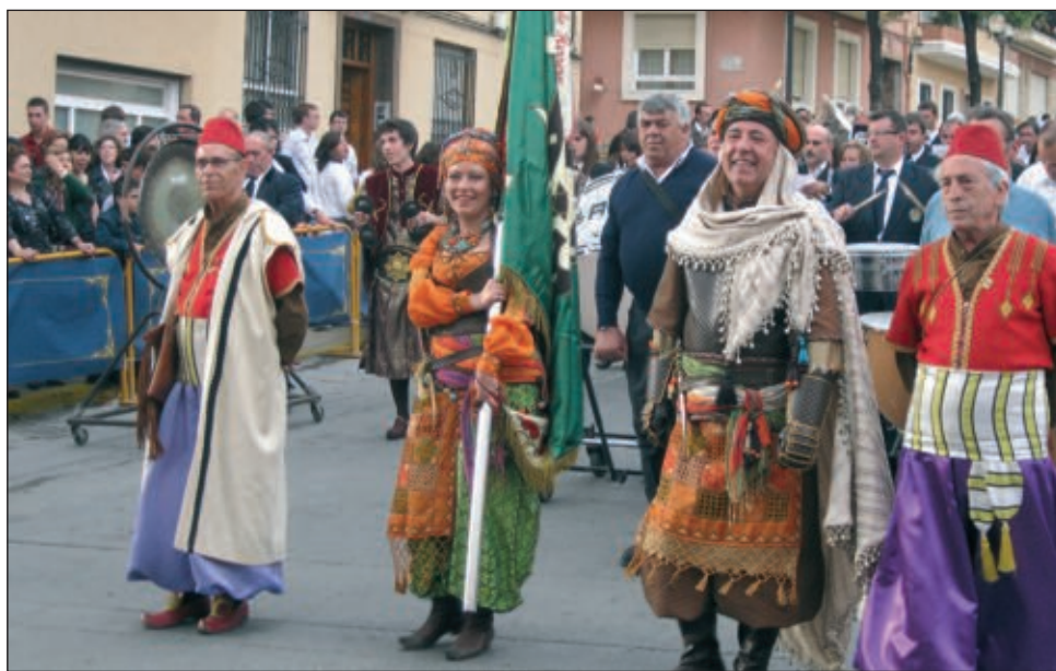
Capitán y abanderada de la comparsa Argelianos