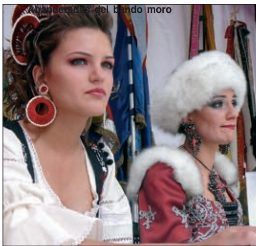
Abanderadas del bando cristiano