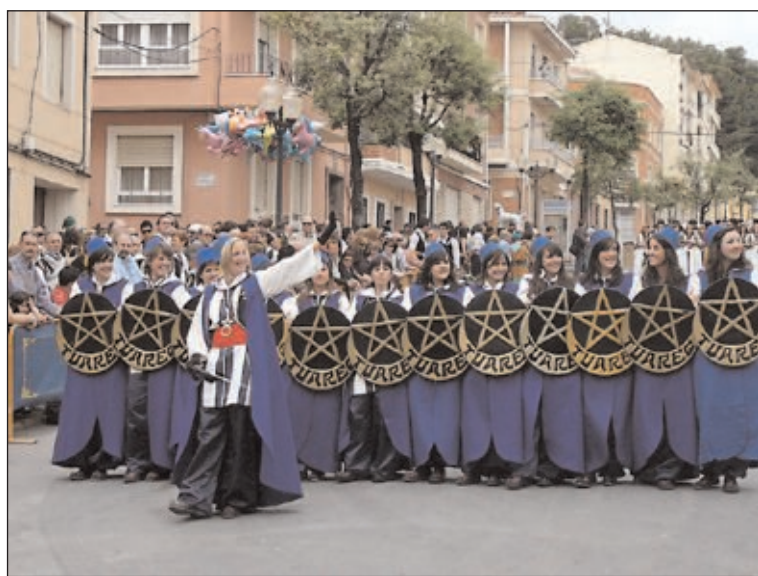
Escuadra de los Tuareg, durante su participación en el concurso