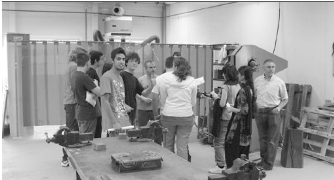
Visita de alumnos y profesores de IES Nou Derramador

Una de las ofertas más innovadoras es el Programa de Cua-