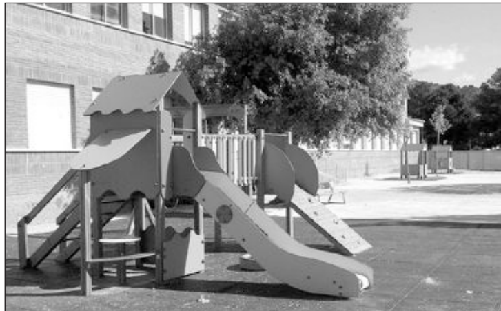
Parque infantil en el colegio Virgen de la Salud