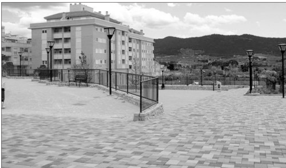
El parque ocupa una superficie total de 17.191 metros cuadrados

Con estos cambios, explica el concejal Enrique Palacios, Ibi pasará a ser una localidad de museos con buenas infraestructuras y adaptados a las nuevas tecnologías, "donde la cultura sea un punto de interés a tener en cuenta para los ciudadanos y visitantes, ya que se ofrece una muestra de gran valor sentimental e histórico, como es el juguete y el medioambiente, que se completará con las fiestas, la etnología y el helado.