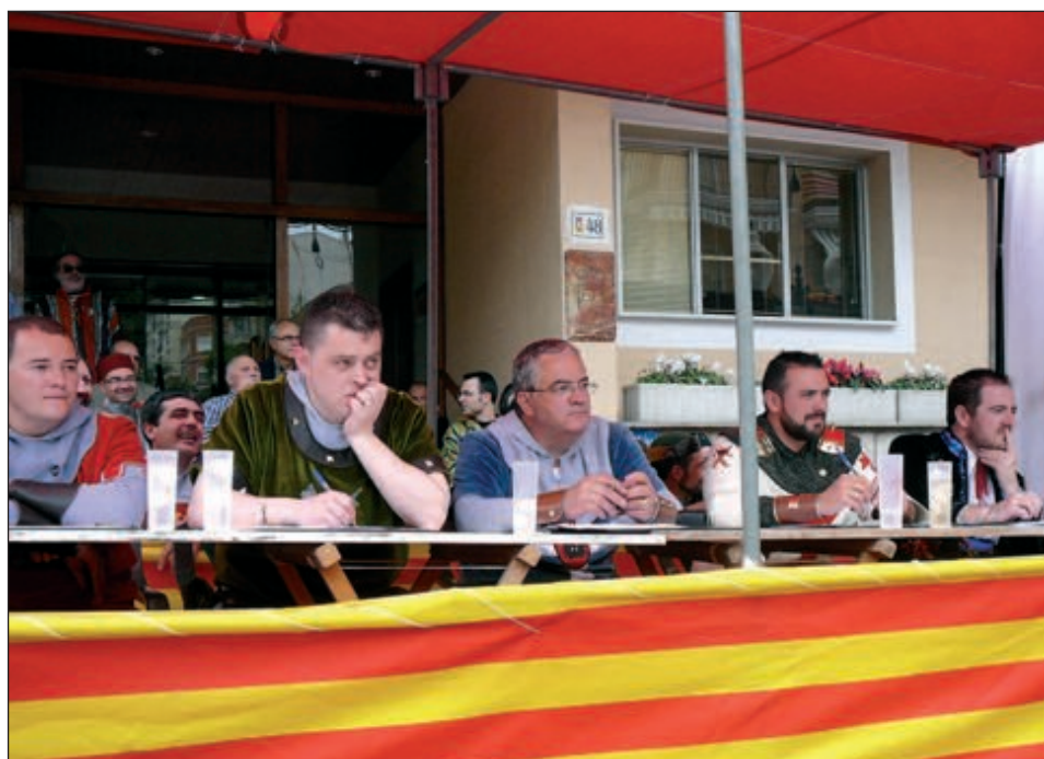
Miembros del jurado del concurso de cabos de escuadra