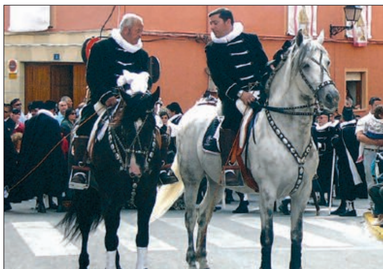
Miembros de la comparsa Estudiantes, a caballo