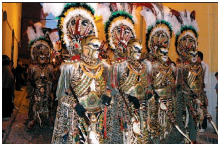
Escuadra especial Moros Nous