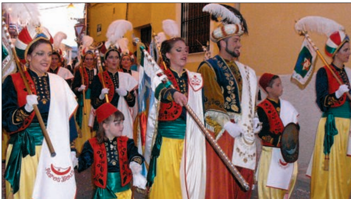
Desfile de la comparsa Moros Nous que celebra este año su 150 aniversario