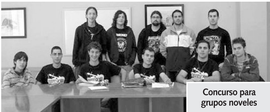
La asociación está foirmada por miembros de varios grupos de rock