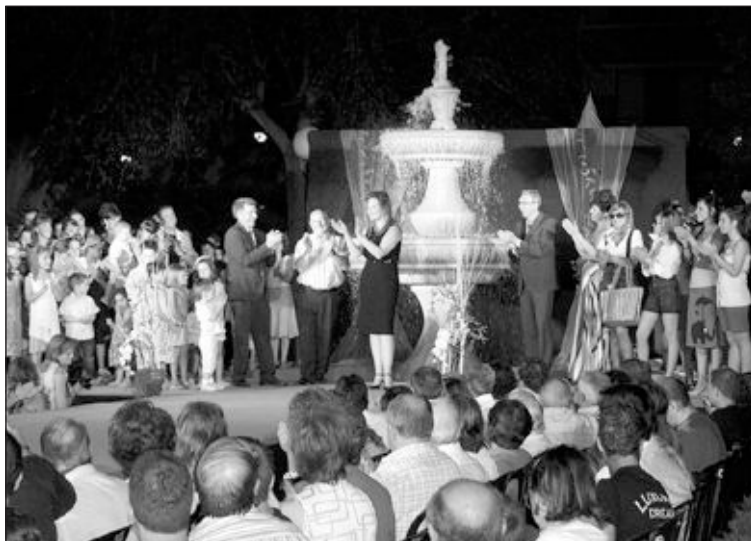
La gala del comercio se celebró el año pasado en el parque municipal