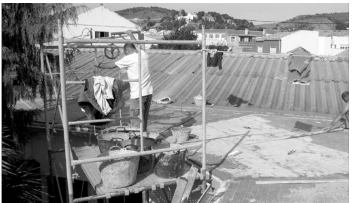
La guardería pública de El Salvador también se ha beneficiado de una mejora en sus instalaciones