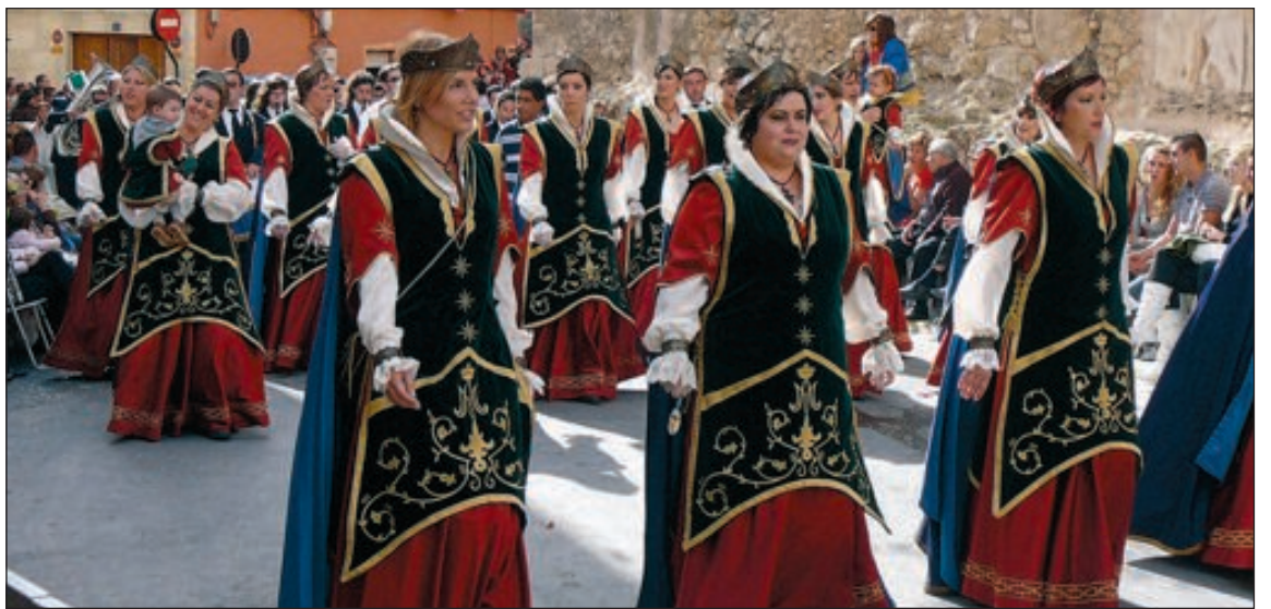
Escuadra femenina de la comparsa Blavets