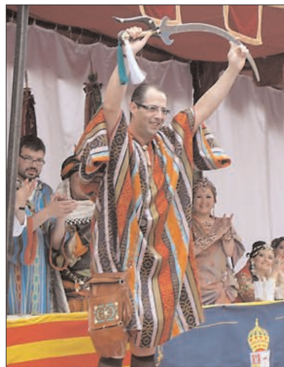
Premio para una escuadra de los Chumberos