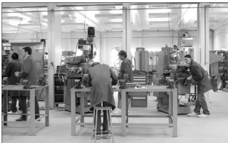
Alumnos de La Foia impartiendo clases en los talleres que tiene el centro

Desde el instituto se destaca la aceptación de este programa por parte del alumnado ya que actualmente se imparte a 17 estudiantes y se presenta como una importante salida educativa.