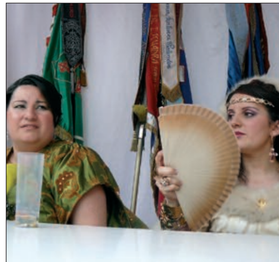
Abanderadas Cides y Templaria