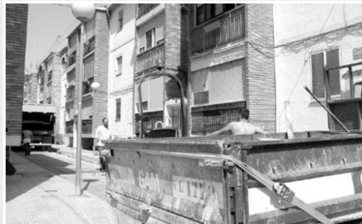
La calle Sant Josep es una de las que está en obras actualmente

Tal y como adelantó este periódico, las obras en las calles de la zona conocida como Saúco quedaron paralizadas con motivo de las Fiestas Patronales. Ahora se han retomado los trabajos de sustitución de aceras y alcantarillado en las calles San José, San Pancracio y Santa Lucía.