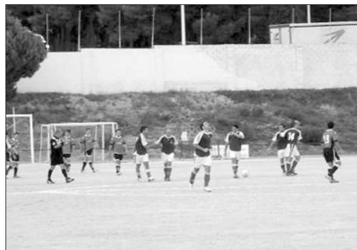
Imagen de archivo de un partido de la UD Onil