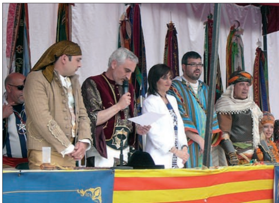
El presidente del comisión, junto a la alcaldesa, fue el encargado de otorgar los premios