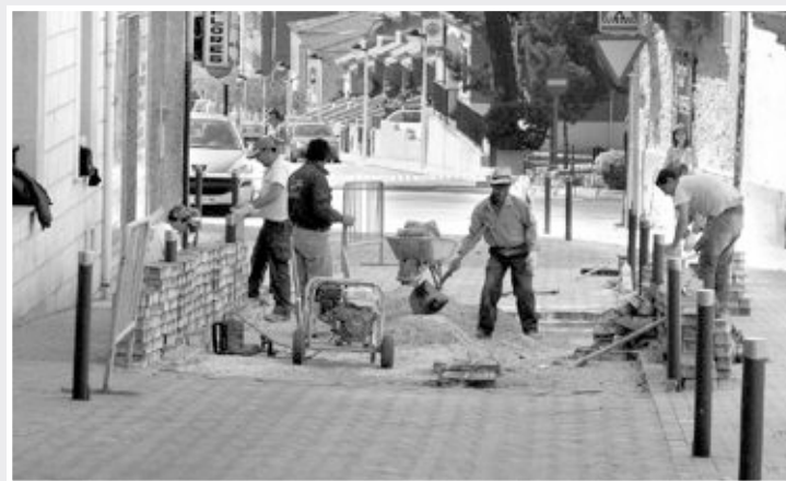
Los trabajos se centralizan delante de la farmacia de la C/Portal

Dopema está ejecutando trabajos de reparación del adoquinado del tramo final de la calle Portal, justo delante de la farmacia. Al tratarse de un tramo donde los vehículos han de frenar para dar preferencia a los que vienen por la rotonda, los adoquines estaban muy deteriorados.