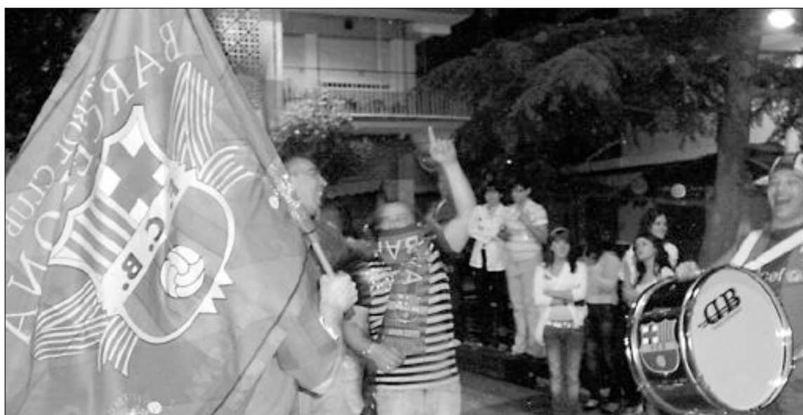
Los seguidores del Barça festejaron la victoria de su equipo en las fuentes de la rotonda y de los Reyes Magos