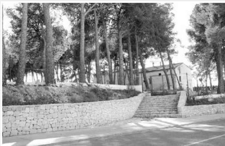
El geriátrico está previsto que se construya en la Finca el Retiro