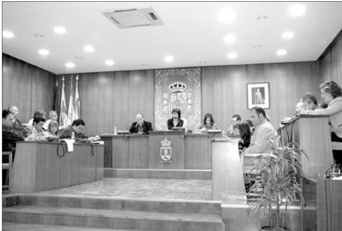
Imagen de un Pleno Ordinario en el consistorio ibense

Consideran que las acusaciones “infundadas” suponen un ataque al honor de las personas, “algo que el Grupo Municipal Socialista no va a consentir” y critican esta forma frecuente de actuar del PP, poniendo como ejemplo las últimas declaraciones de la