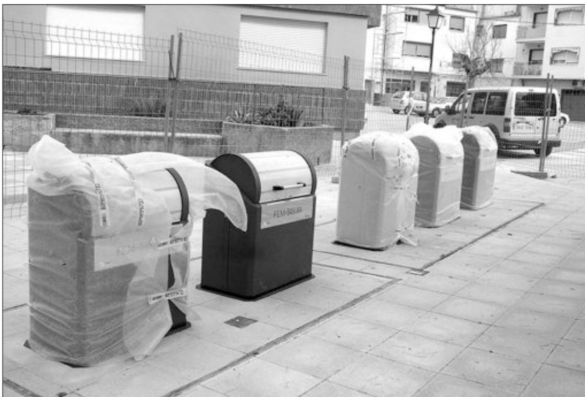
Los contenedores se han instalado en varias ubicaciones para mayor comodidad de los vecinos

El de más cuantía económica es la reforma y ampliación del escenario del parque de la Era del Teular que tiene un presupuesto de casi 154.000 euros. Las obras de este proyecto ya se están ejecutando, junto a la reforma de toda el área del parque, inversión ésta última que corre a cargo de la Diputación de Alicante y del Ayuntamiento.