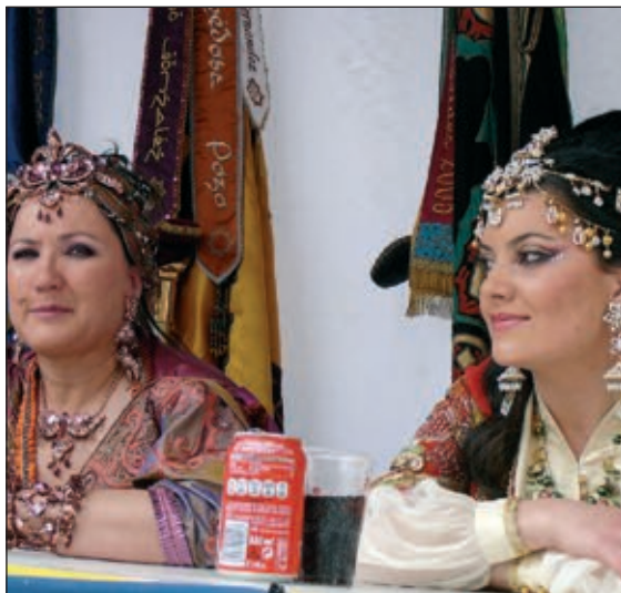
Abanderadas del bando moro

Otra novedad es el concurso 'Mi mascota fester' que servirá para ilustrar unidades didácticas durante el curso.