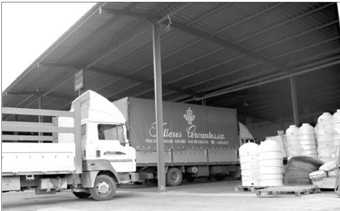
Inyectados Cervantes se cerró en septiembre de 2007 dejando sin trabajo a cerca de 50 personas