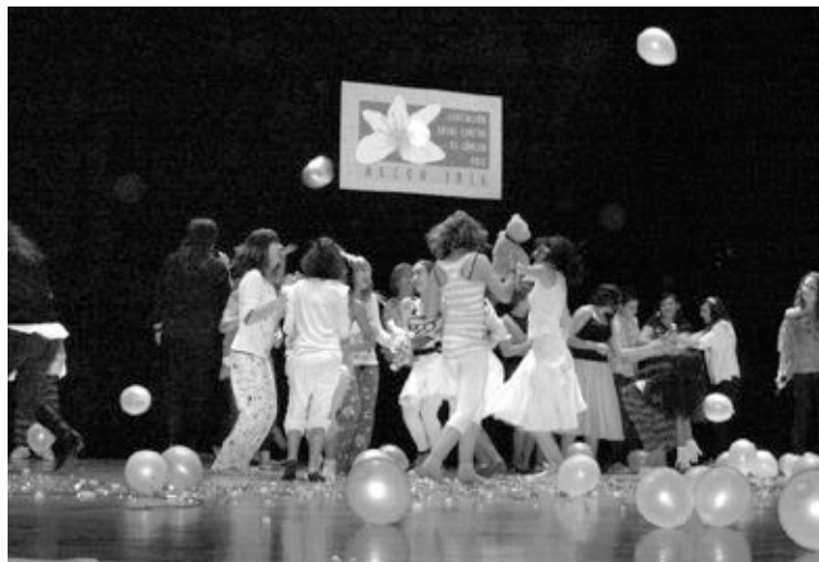
Las actuaciones corrieron a cargo del gimnasio Cronos

La gala benéfica organizada con el objetivo de recaudar fondos para la Asociación Local contra el Cáncer (Alcco-Iris) reunió a unas 250 personas en el Centro Cultural de Onil, con cuyos donativos se alcanzó la cifra de 441 euros. Los asistentes disfrutaron del espectáculo musical 'Broadway', representado de forma gratuita por miembros del gimnasio Cronos. Fuentes de Alcco-Iris informan de que la SGAE tenía la intención de cobrarles el 10% de lo recaudado, aunque finalmente no ha sido así.