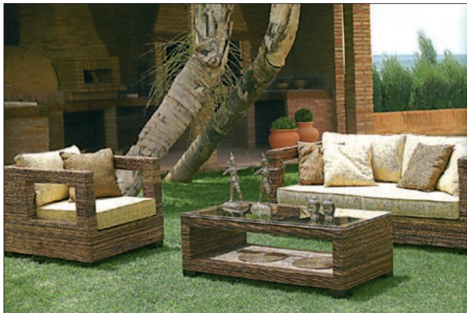
Nueva línea de jardinería en Sola Decoración