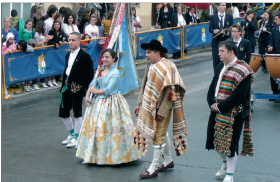
Capitán y abanderada de la comparsa Maseros