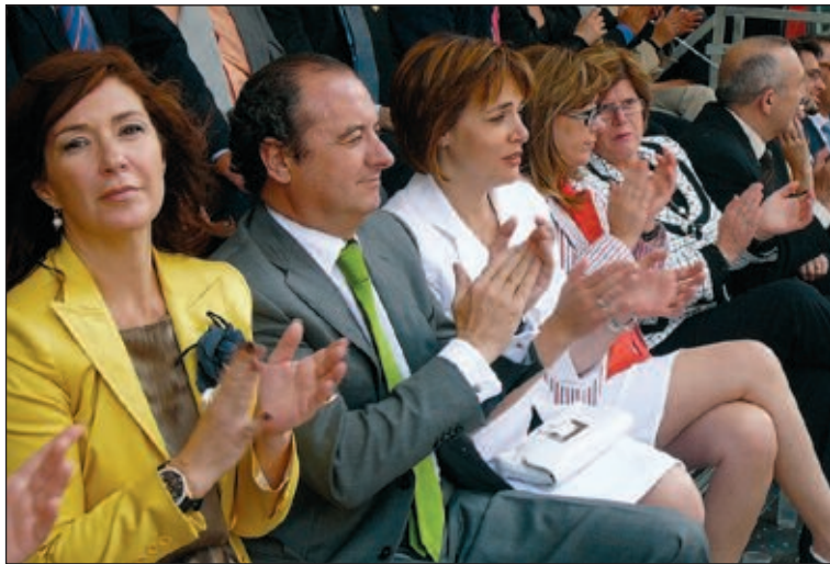
El presidente de la Diputación, junto a otras autoridades, asistió a la Entrada