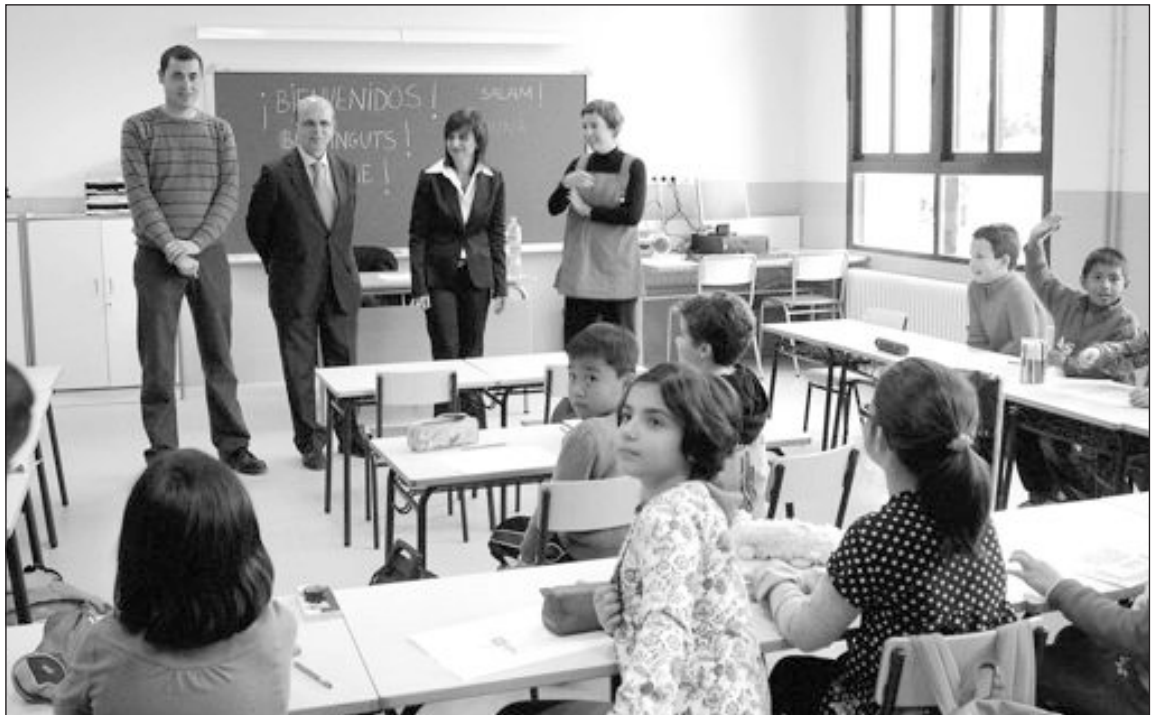
El director del colegio del Cervantes acompañó al inspector de Educación y a la alcaldesa a visitar el centro

El objetivo, por tanto, es dirigir “nuestro esfuerzo siempre hacia una educación de calidad y vamos a continuar trabajando con este mismo impulso para atender e intentar seguir dando respuesta a todas las nuevas realidades que se plantean en la sociedad ibense.”