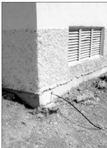
Las escaleras de acceso a las pistas están rotas y en muchos puntos del Polideportivo hay cables sueltos