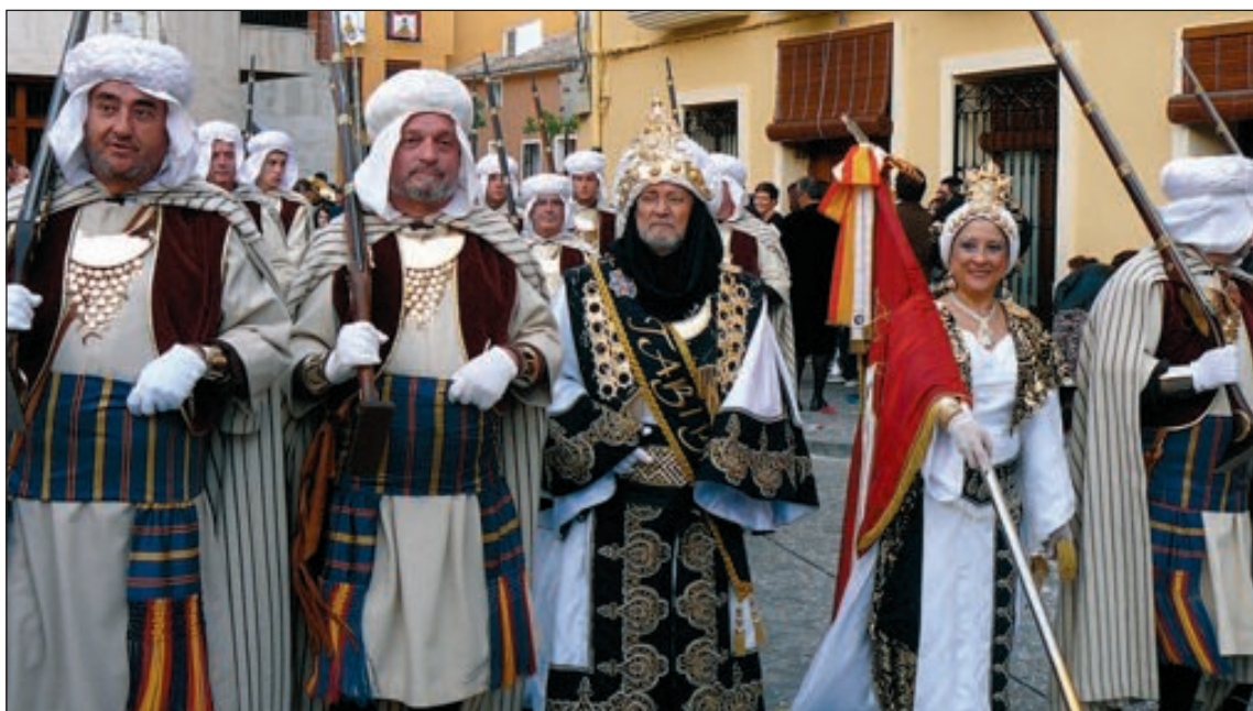
Capitanía de la comparsa Moros Tariks

En caso contrario, asegura, “no ocurriría nada ya que la propia comparsa asume ese cargo que queda bien representado”.