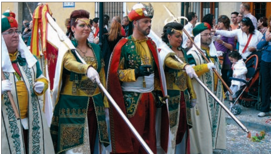
Capitanía de la comparsa Moros Vells