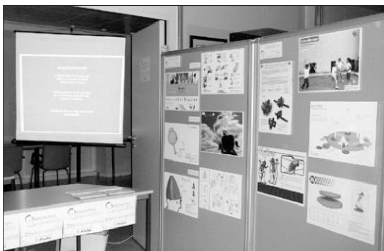
Exposición de los proyectos ganadores del concurso de diseño de juguetes

Paralelamente a las jornadas se exponen en el Instituto los proyectos ganadores y finalistas de la cuarta edición del Concurso de Diseño que organiza AIJU, así como también, algunos de los proyectos en los que está trabajando el propio Instituto Tecnológico del Jugete.