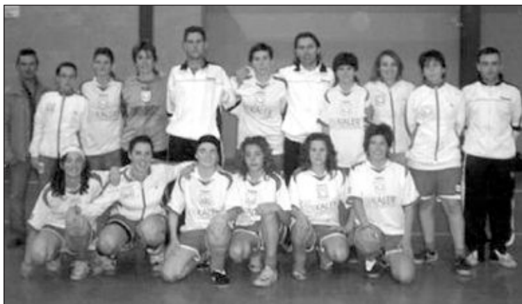
Plantilla y cuerpo técnico del CFS Castalla Femenino

El domingo día 10 se enfrentaban a la UD San Vicente, que ha quedado tercer clasificado de su grupo y que en los encuentros ligeros se había impuesto a las castallenses por 6-3 en San Vicente y por 3-8 en Castalla, con lo que partían como claras favoritas.