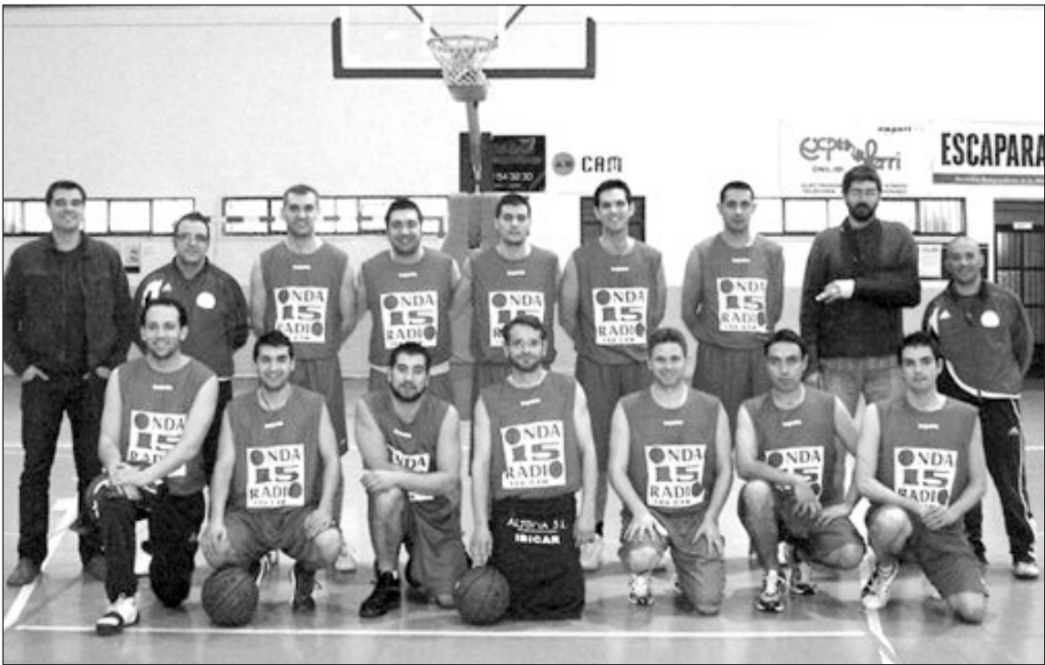
Plantilla del Onix CB en el pabellón del Polideportivo de Onil

ascenso comenzarán a las 17:00 horas con una ofrenda de flores a la Patrona de Onil, la Virgen de la Salud, mientras que la fiesta en sí empezará a gestarse a partir de las seis de la tarde en el pub Tizzio.