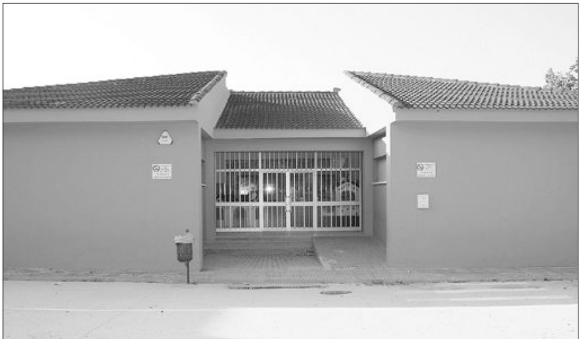
Aseos del colegio Felicidad Bernabeu