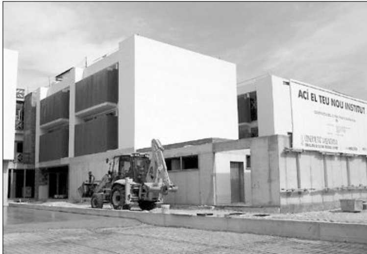
Estado actual de las obras del nuevo instituto Barrachina

En cuanto al Derramador, se han reformado los aseos, se ha colocado una cubierta en el patio principal y se ha adecua-