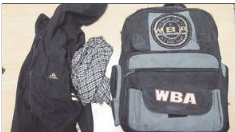
Todos los objetos confiscados pueden verse en la web de la Policía Local

El martes 15 de marzo, la Policía Local realizó una actuación en la que se intervinieron diversos objetos susceptibles de haber sido robados. Por tal motivo, se ruega la colaboración ciudadana para localizar al propietario/s de estos objetos, que se encuentran custodiados en las oficinas policiales (96.556.10.76).