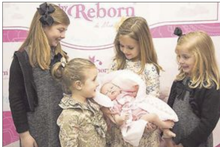
Un grupo de niñas aprecia la perfección de un muñeco Baby Reborn

Según Gutiérrez, "probablemente esta colección revolucione el mercado muñequero de nues-