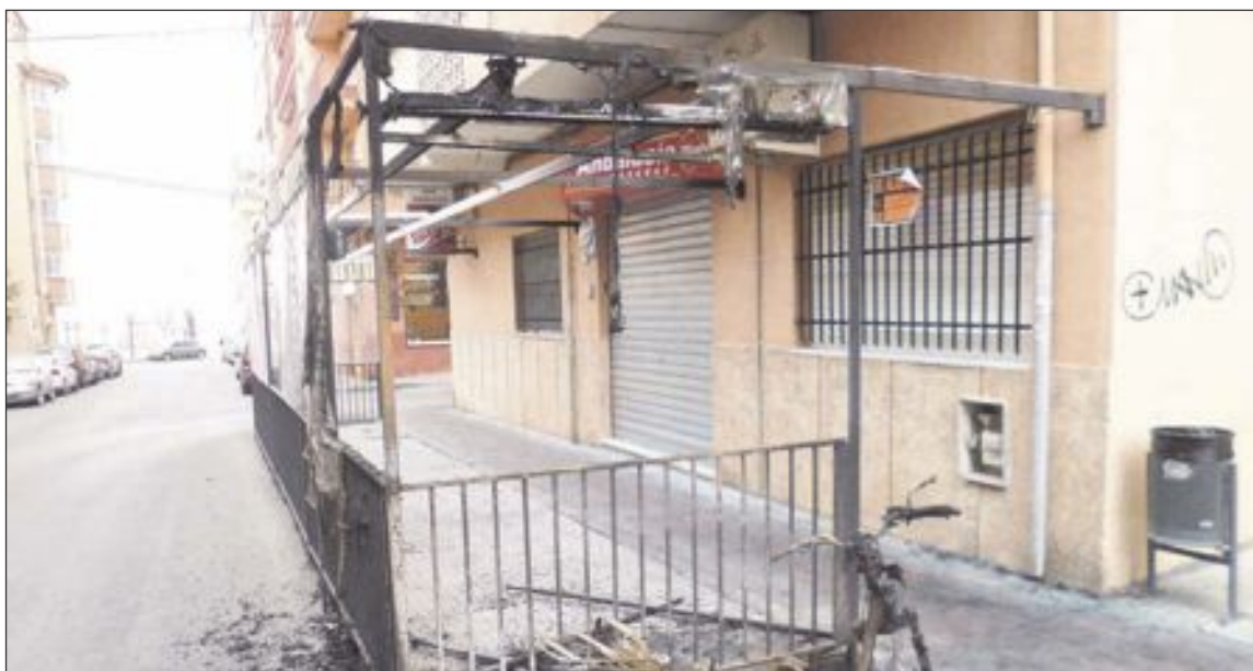
Los hechos ocurrieron la madrugada del 19 de marzo en la calle Don Pelayo