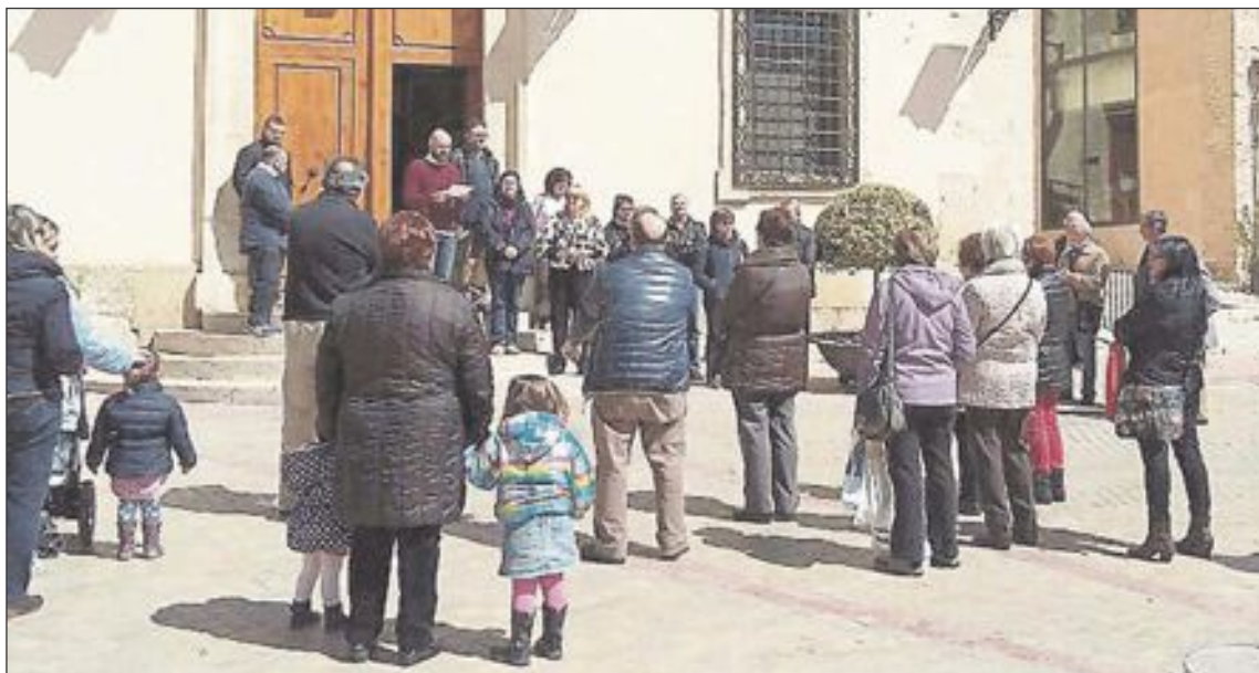
Concentración en las puertas del Ayuntamiento de Biar