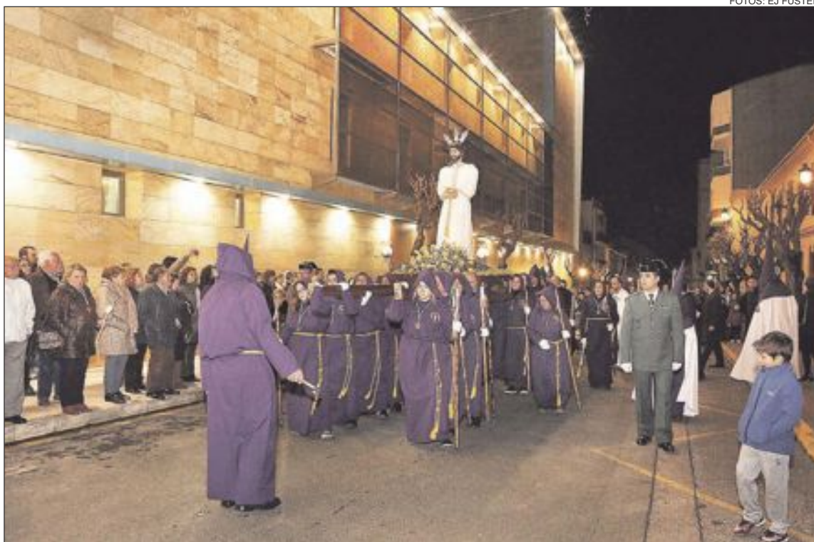
La procesión de Jesús Cautivo se celebró la noche del martes 22 de marzo, con gran asistencia de fieles