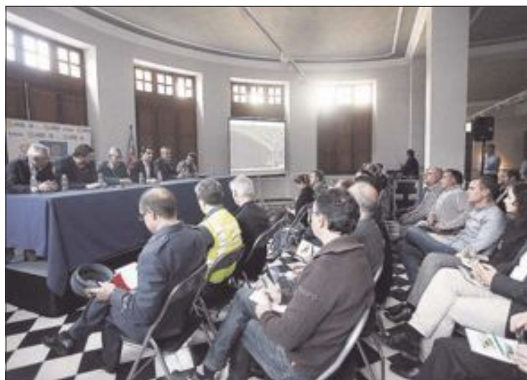
La reunión tuvo lugar recientemente en instalaciones de la Diputación

Ahora, los chicos se toman unas merecidas vacaciones, regresando a la competición con la vuelta al cole tras Semana Santa, el sábado 9 de abril.