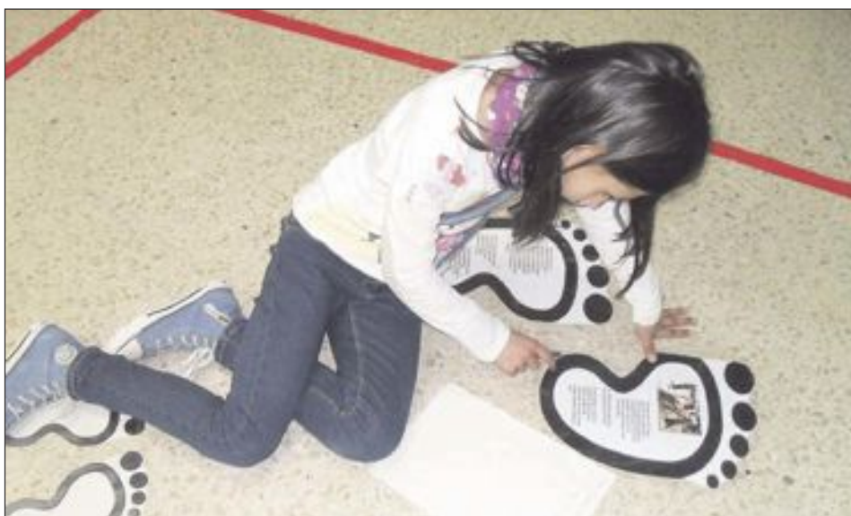
Una alumna del centre llig una de les petjades que s'han apegat pels corredors del col·legi