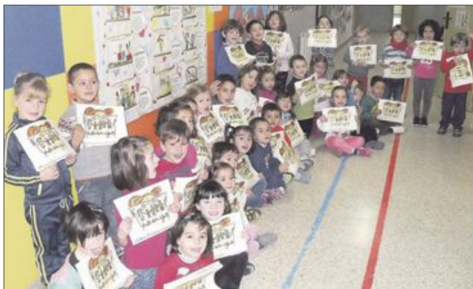
Alumnes de l'escola mostren els seus dibuixos sobre els drets humans infantils i els refugiats