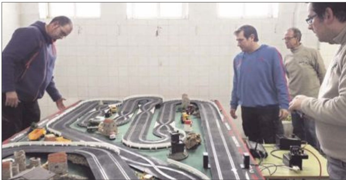
El Campeonato Local de Rallyes se disputa en la sede de la Asociación de Slot APP Ibense

Ibense felicita, como siempre, a la ganadora de este rally, así como a todos los pilotos parti-