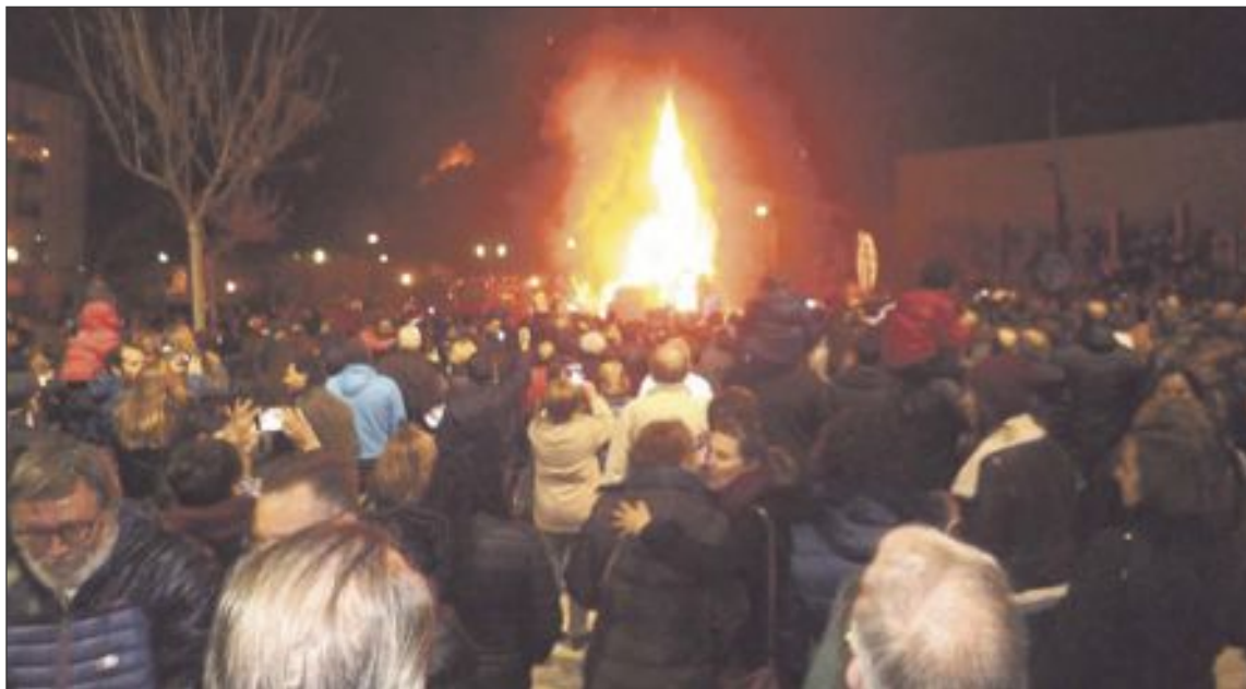
La cremà de la falla del Centro Ocupacional San Pascual tuvo lugar la noche del viernes 18 de marzo

Por último, el 1 de octubre tendrá lugar la jornada Insectos en el plato , donde los participantes podrán comer delicias culinarias elaboradas con insectos como grillos, hormigas o gusanos. La doctora Estefanía Micó, de la Universidad de Alicante, explicará las costumbres de nuestros antepasados y seguidamente habrá degustación en el Restaurante RQR.