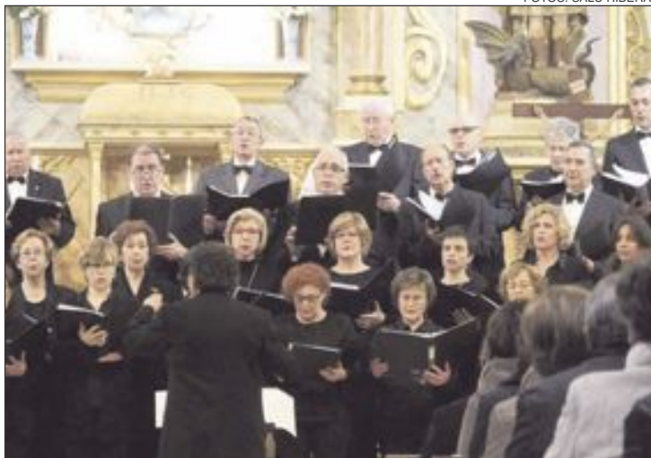
Un momento de la actuación de la Orquesta y Coral Polifónica Cristóbal Pastor de Onil