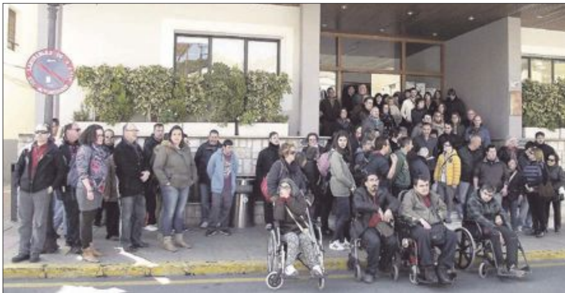
Concentraciones en los ayuntamientos de Ibi (arriba) y Castalla (abajo)

El doble atentado, reivindicado por el Estado Islámico (ISIS), ha dejado al menos 30 muertos y más de 230 heridos, tras un ataque suicida en el aeropuerto de Zaventem y una explosión en una céntrica estación de metro, muy cerca de las instituciones europeas.