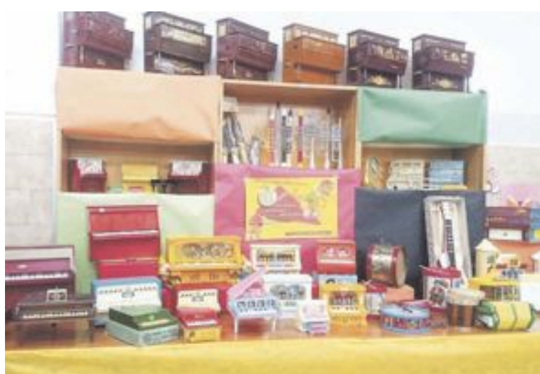
Se organizó por categorías: musicales, menaje, héroes y coches