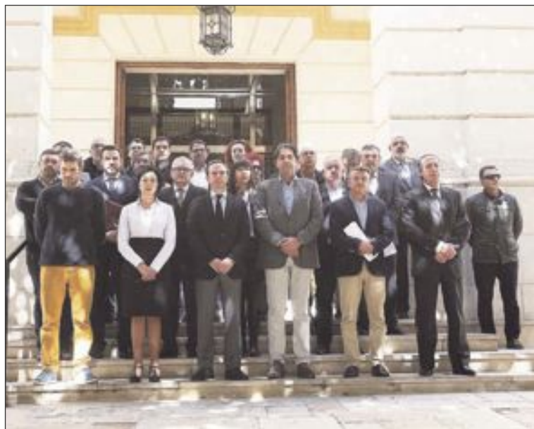
Minuto de silencio en la Diputación de Alicante