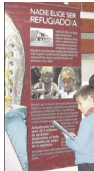
Acnur va cedir murals per a confeccionar una exposició en febrer

zà el dia 20 de maig (divendres) al recinte de l'escola i on es posaran a la venda, a 0'50 cèntims i 1 euro, manualitats confeccionades pels alumnes i educadors del menjador, joguets i llibres donats pels alumnes, gelats aportats per la gelateria Chàmbit, berenar preparat per l'AMPA i una rifa d'articles cedits per esportistes del poble, músics, artistes, etc.