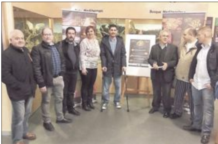
La presentación de las nuevas jornadas tuvo lugar el miércoles 23 de marzo en el Museo de la Biodiversidad