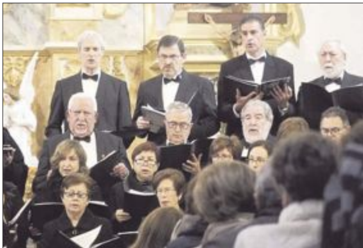
Actuación de la Coral Ibense en el Convento de las Monjas Justinianas