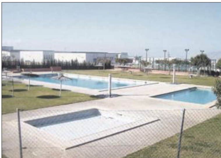
La pista de pádel se ubicará entre la piscina y la pista de tenis

Por otro lado, los trabajos incluyen la pavimentación de la zona oeste de la pista polide-