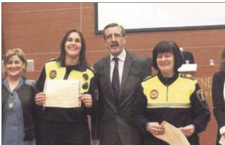
La entrega del diploma policial tuvo lugar el martes 15 de marzo

De igual forma, este curso sirve de guía para actuar conforme al modelo policial preventivo y asistencial, con el fin de garantizar la seguridad y protección de las víctimas e identificar indi-