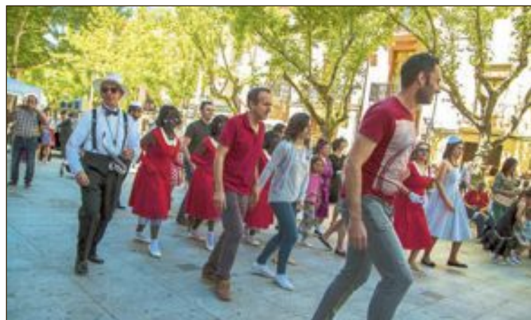
El sábado por la mañana se realizó un taller de lindy hop, y Font Viva realizó un espectáculo callejero ambientado en los años 20 y 30