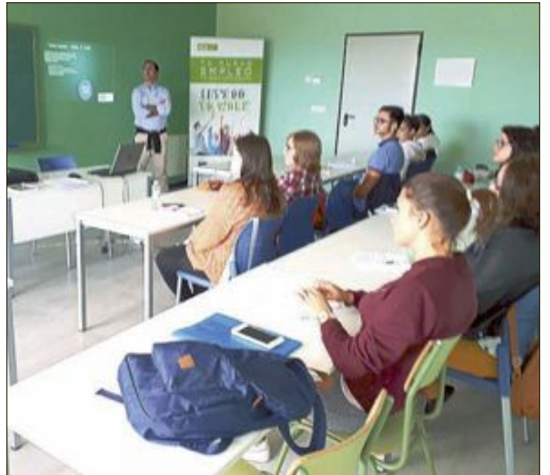
Los cursos van dirigidos a menores de 30 años

Esta programación está orientada a formarse en materias que