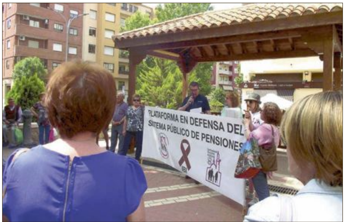
La protesta tuvo lugar el lunes 3 de junio en la plaza de la Tartana, con la asistencia de unas treinta personas

La coordinadora afirma que "sobran los motivos" para que cada lunes los pensionistas ocupen las calles y plazas exigiendo unas pensiones justas. La próxima concentración está convocada para el lunes 17 de junio.