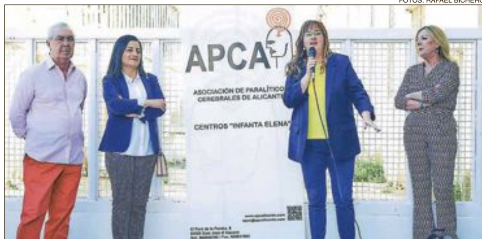
De izquierda a derecha: el presidente APCA, la alcaldesa Onil, la directora del Centro de Atención Temprana 'Infanta Elena' y la gerente de APCA