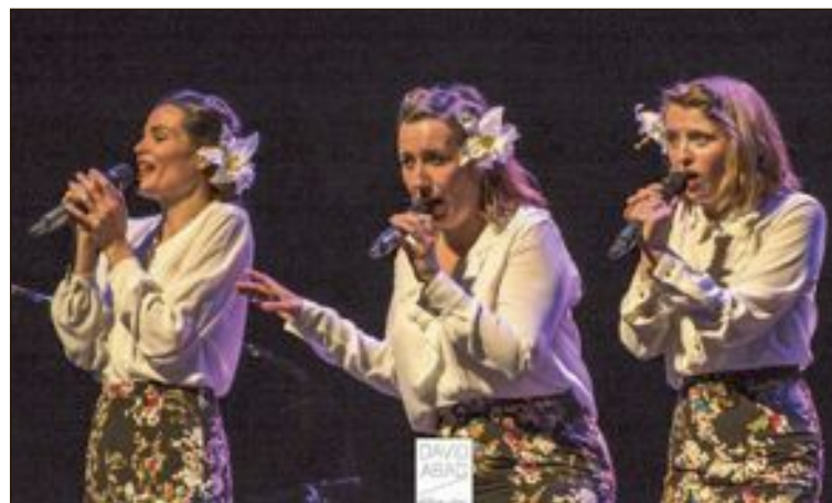
El festival se clausuró con el concierto de las Dómisol Sister, con una gran asistencia de público en el Teatro Río