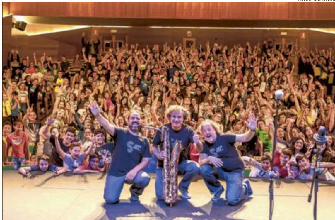
Más de 500 niños participaron en la actividad 'Historia del Jazz' que abrió los actos del festival

Queremos que los espacios y calles de Ibi vuelvan a inundarse de música y que nuestros vecinos vuelvan a experimentar la creatividad en estado puro a través de la improvisación de grandes artistas nacionales e internacionales. Por ello ya estamos trabajando en la próxima edición del festival. Así que no nos perdais la pista y seguidnos en redes sociales!