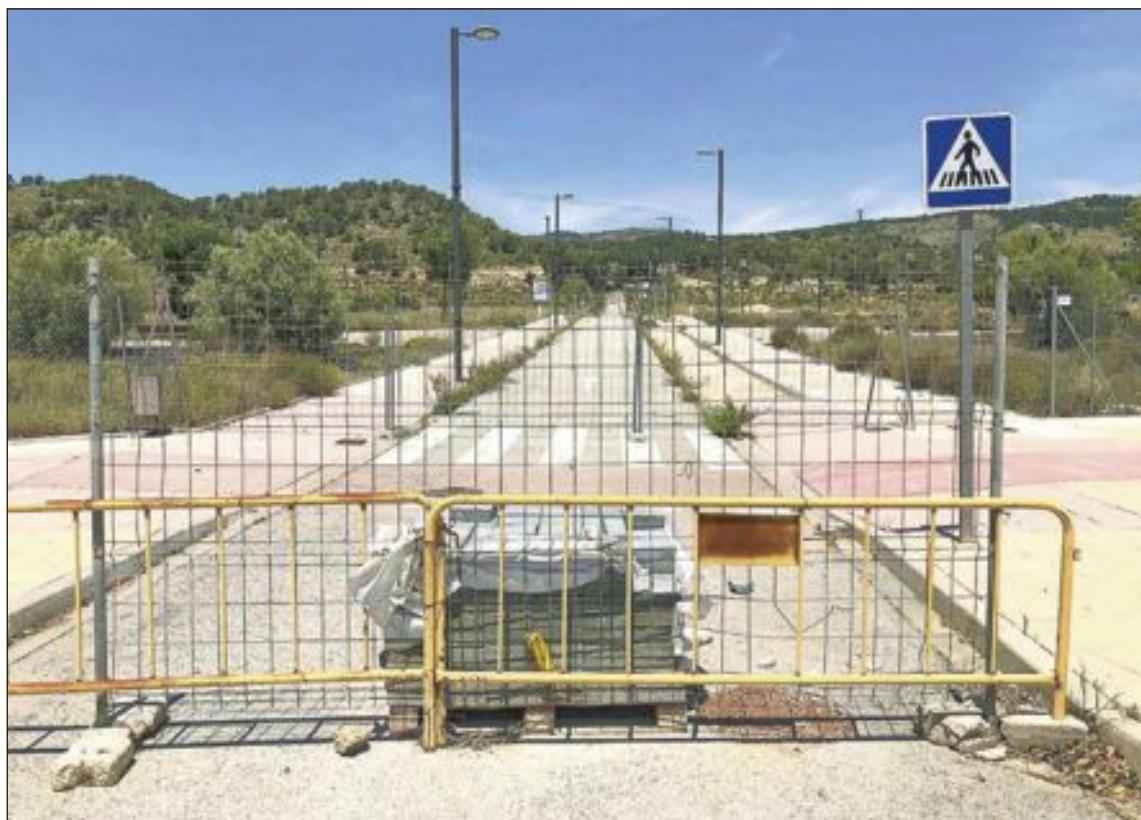
La promotora tendrá que finalizar ahora la urbanización del Alamí, que lleva un retraso de diez años