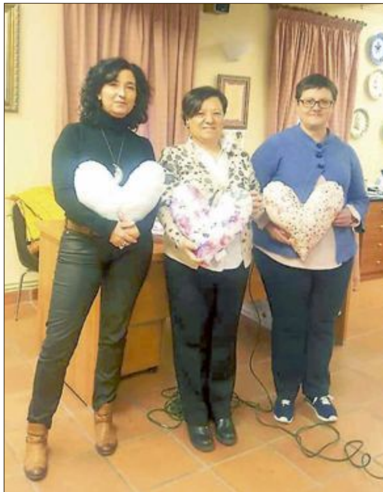
La primera quedada va tindre lloc el 27 de gener on es van confeccionar 515 coixins del cor que s'han distribuït per diversos hospitals

Una vegada es va recuperar va decidir introduir-les en l'hospital en què treballava.