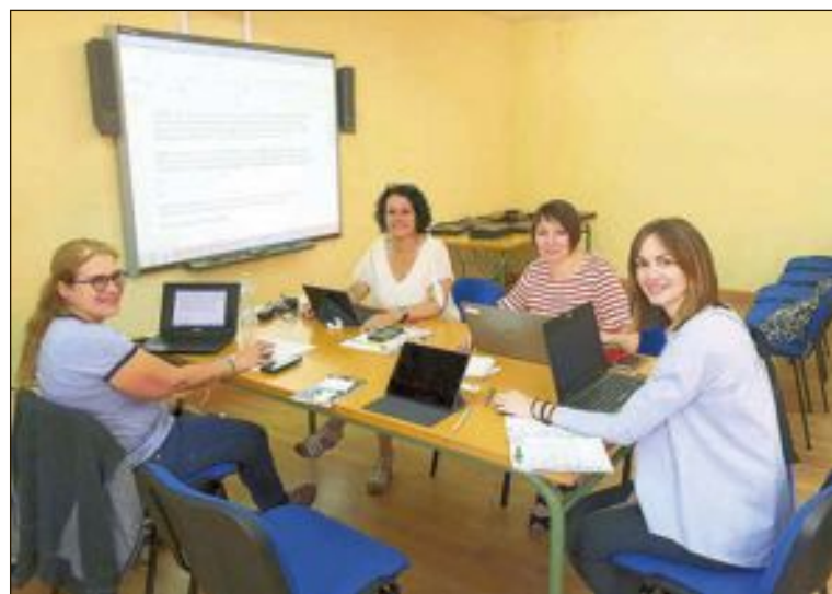
Professors procedents d'Alemanya i Finlàndia han pogut realitzar una avaluació final del projecte

En breu, una nova etapa començarà per a ambdós.