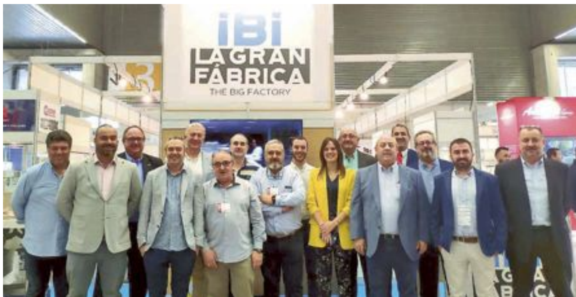
Las empresas de IBIAE que han asistido a la feria de Bilbao son Abad Integración de procesos industriales, Angis, Carlos Valero, Deinpro, Erycop, IFR, Jayso Solutions, Joviar, Ferrotall, Grupo Solitium y Torneados Sola

Abad Integración de procesos industriales, Angis, Carlos Valero,