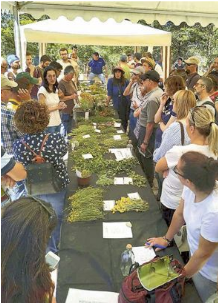
Uno de los talleres fue el de elaboración de herbero para adultos

El sábado, hubo un sinfín de actividades; visitas guiadas por el Jardín Botánico, mercado de productor artesanales, bailes populares, taller de extracción de semillas, talleres de elaboración de herbero para adultos, cuentacuentos, talleres infantiles, intercambio de semillas de variedades locales, taller sobre la aplicación moderna de licores tradicionales, concurso de herberos, mesa de experiencias de producción y consumo de variedades locales y destilación artesanal de aguar-diente.