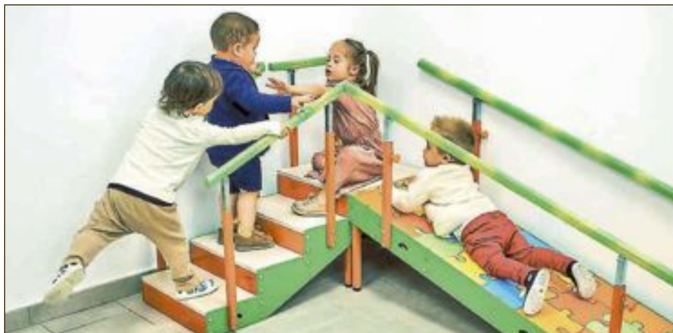
El Centro de Atención Temprana de Onil cuenta con cinco dependencias: un gimnasio para fisioterapia y cuatro salas para logopedia, psicología y estimulación