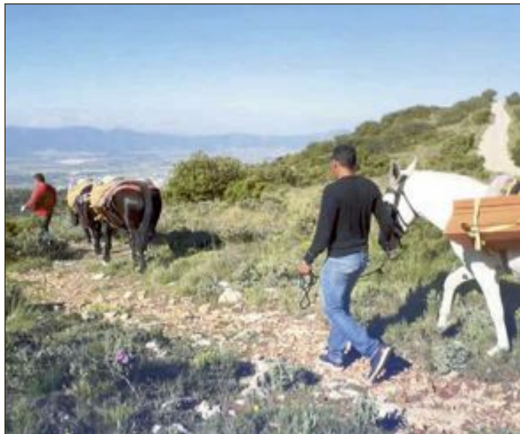
Els cavalls empleats per a traslladar el material

Aquest projecte, sota la supervisió de la direcció del Parc Natural, ha comptat amb la col·laboració de la regidoria de Medi Ambient de l'Ajuntament d'Ibi mitjançant l'aportació del material escaient per a l'execució de l'obra. Aquest material va ser traslladat al lloc de l'obra amb cavalleries llogades per a tal efecte. Aquesta restauració vol fer-se de manera que el resultat final siga el més fidel possible al seu estat original.