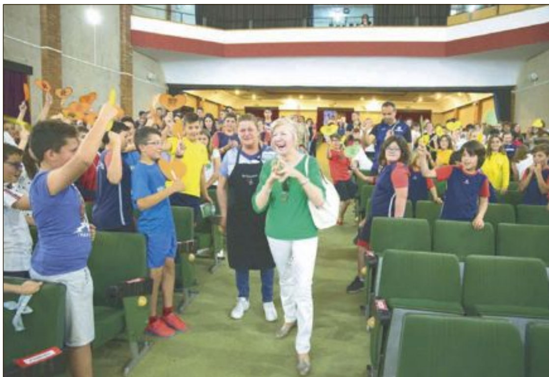
El acte va tindre lloc el dijous 30 de maig al teatre del col·legi a on van assistir, alumnes, mestres i familiars