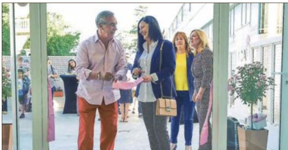
El presidente de APCA y la alcaldesa de Onil cortaron la cinta inaugural el viernes 31 de mayo