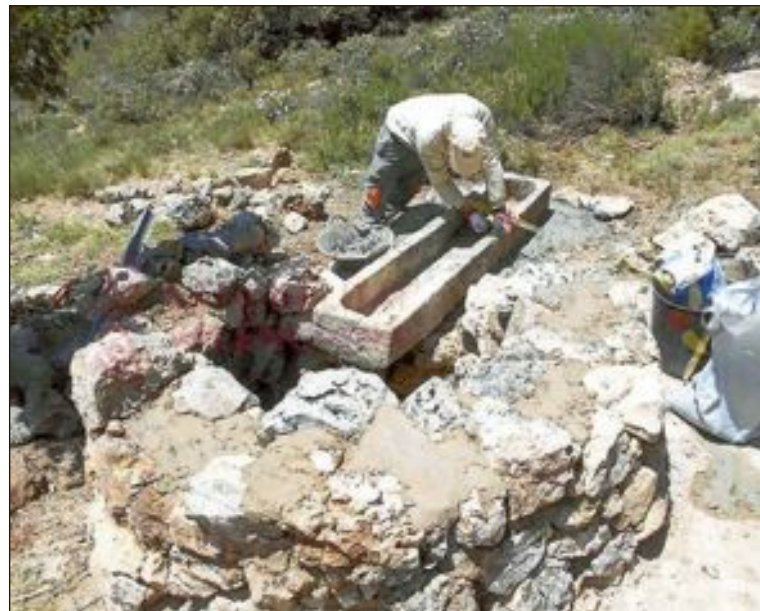
Aquesta restauració vol fer-se de manera que el resultat final siga el més fidel possible al seu estat original