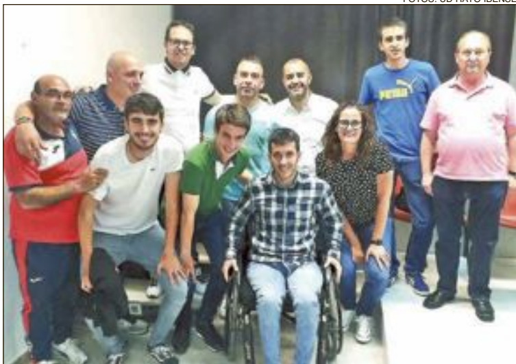
Miembros de la nueva junta directiva de la UD Rayo Ibense