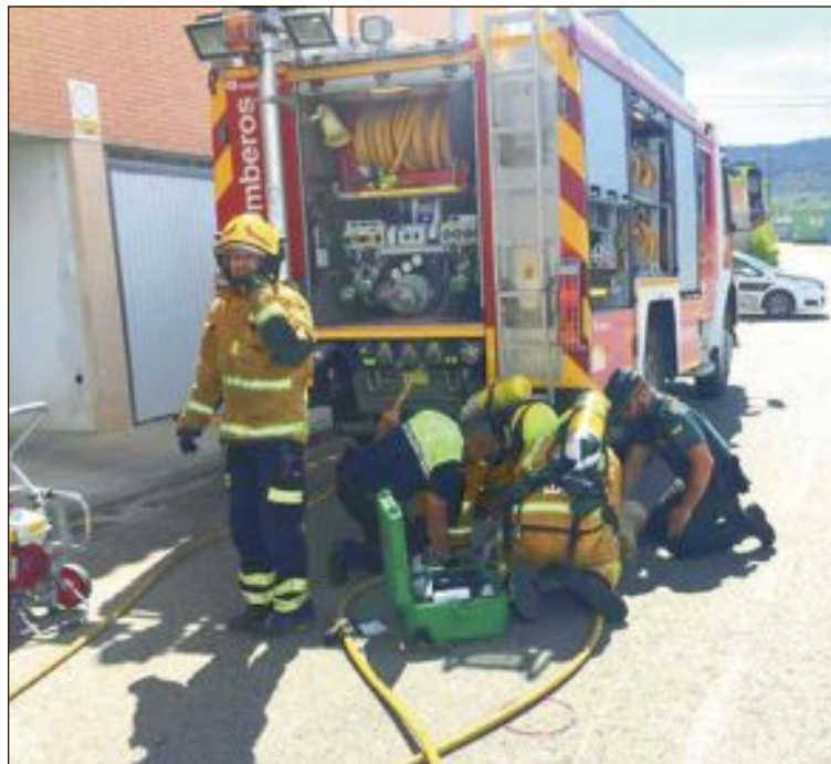
El incendio se produjo a las once de la mañana en una vivienda de la calle Virgen de la Salud y el fuego se originó en la cocina

A raíz de las investigaciones iniciales practicadas por los cuerpos de seguridad en el lugar, se determinó que el fuego se originó en la cocina de la vivienda.