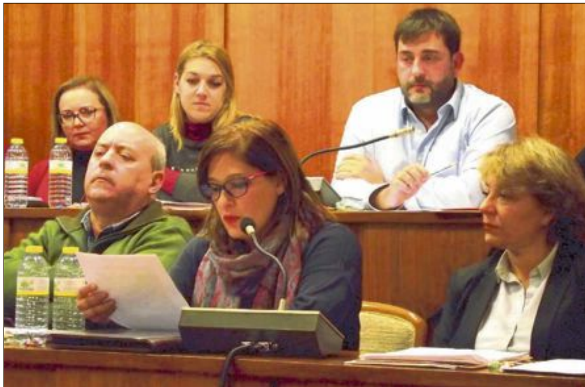
La concejal leyó una emotiva carta de despedida en el pleno del lunes 4 de diciembre