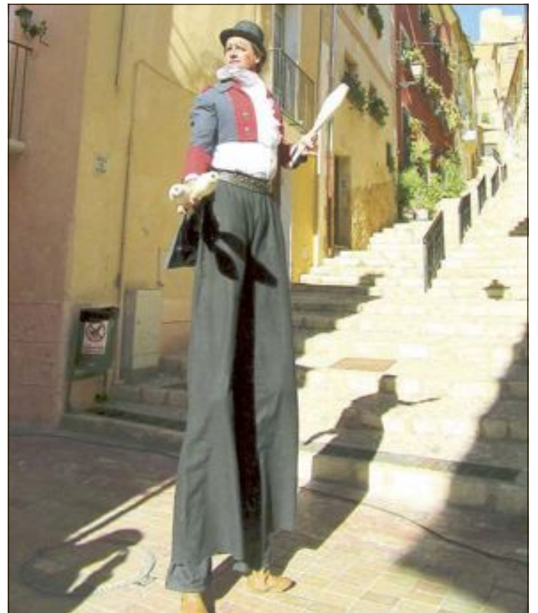
El mercat de Nadal va comptar també amb animació de carrer