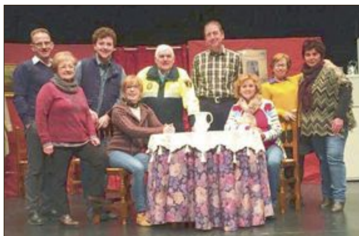
Elenco actoral de la obra 'ací no paga ni Déu', junto a directores y técnicos

Un año más, desde la concejalía de Turismo, y gracias al Centro de Turismo de Alicante (CdT), este segundo semestre se han realizado en Onil dos cursos para profesionales del sector de la hostelería. Por un lado, los días 20 y 21 de noviembre se impartió un curso de coctelería creativa, donde participaron miembros de la Asociación de Hostelería de Onil y también de fuera de esta villa. El otro curso, de escandallos, se ha celebrado en dos partes, dada su extensión.