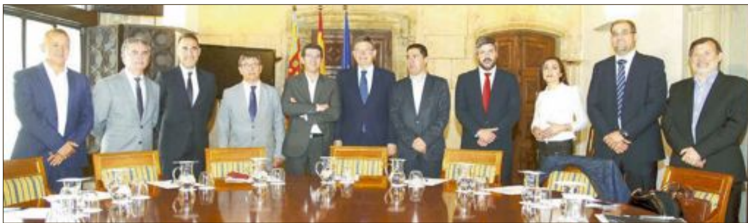
La Plataforma por la Reindustrialización Territorial presentó en 2016 al presidente de la Generalitat y al conseller de Economía el proyecto AIC (Área Industrial de Calidad)

La Plataforma por la Reindustrialización Territorial hace balance de 2017