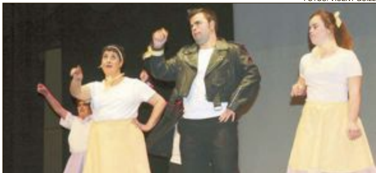
Els xics i xiques ballaren y es divertiren al ritme de la pel.lícula 'Grease'