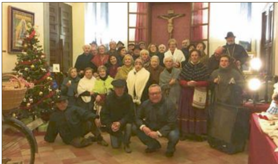
El grup coral Veus Noves va ambientar amb nades i cançons populars