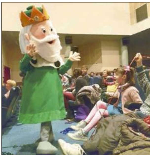
El niño del Rey Melchor bajó a jugar con los niños del público