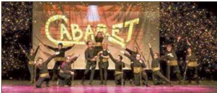
Un fragment del musical 'Cabaret' es va viure el dissabte dia 2 en Castalla