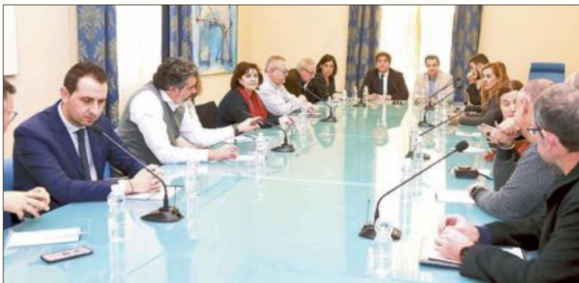
El alcalde y la edil de Turismo asistieron el viernes 1 de diciembre a una reunión de trabajo