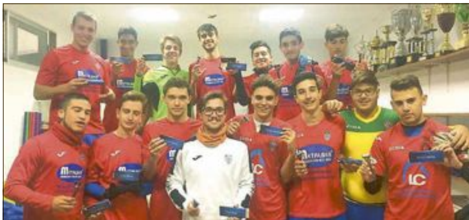
Los jugadores del Rayo Ibense Juvenil se han presentado al concurso Jóvenes Promesas Gillette