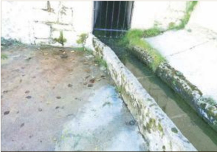
La fuente tiene fugas y ahora el agua se huela por el frío