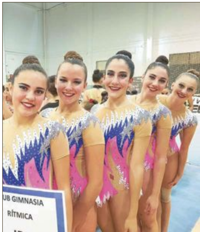
Conjunto Sénior avanzado del Club Rítmica Ibi