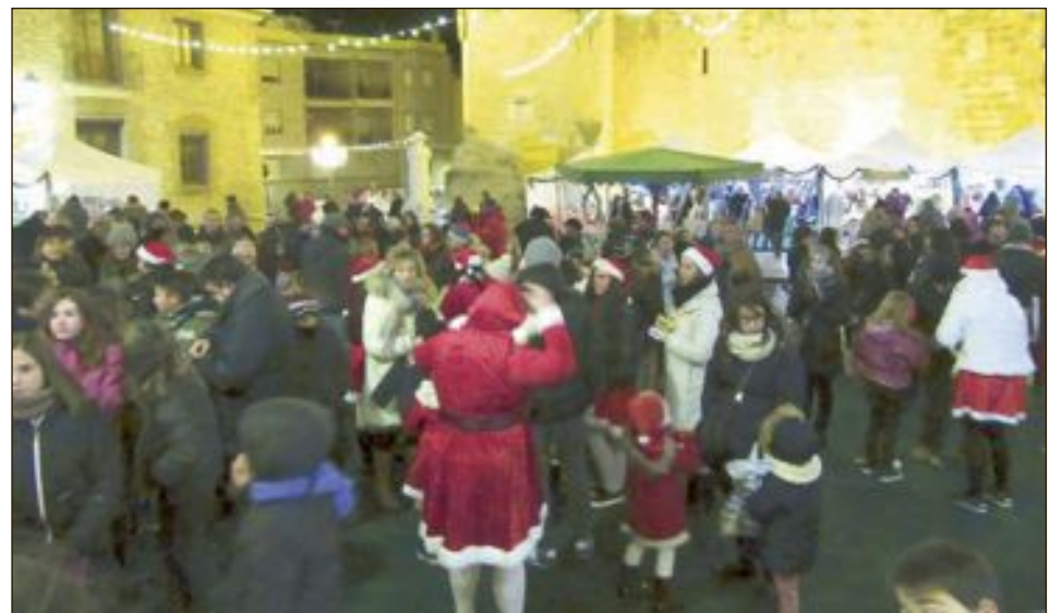
El dissabte a la vesprada i el diumenge al matí va ser quan més públic va acudir