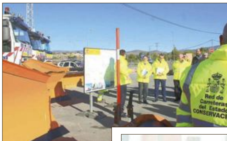
El delegado del Gobierno, Juan Carlos Moragues, presentó el 1 de diciembre en Castalla el Plan de Vialidad Invernal

En cuanto al contingente humano, 200 son los efectivos de los centros de Conservación de Carreteras del Estado y más de 850 los agentes de la Guardia Civil de Tráfico que se movilizarán en caso de activarse el Plan Invernal para hacer frente a