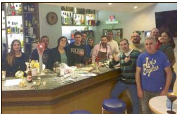
El curso de coctelería creativa tuvo lugar en noviembre en la cafetería Tizzio

En su próximo ejemplar, Escaparate publicará el Especial Navidad, donde vendrán detallados todos los actos programados por la asociación Reis Mags d'Onil.