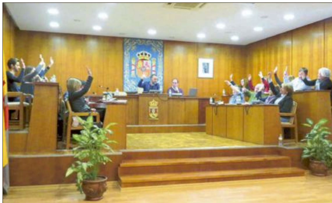
La moción para reclamar una financiación justa se aprobó en el pleno del 4 de diciembre

Porque los datos son demoleedores: Este año, cada valenciano recibirá 237 euros menos que la media de ciudadanos del Estado, o 839 menos que la autonomía mejor financiada, lo que equivale a un 10% y 29% menos de