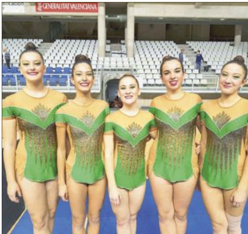
Conjunto Juvenil básico del Club Rítmica Ibi