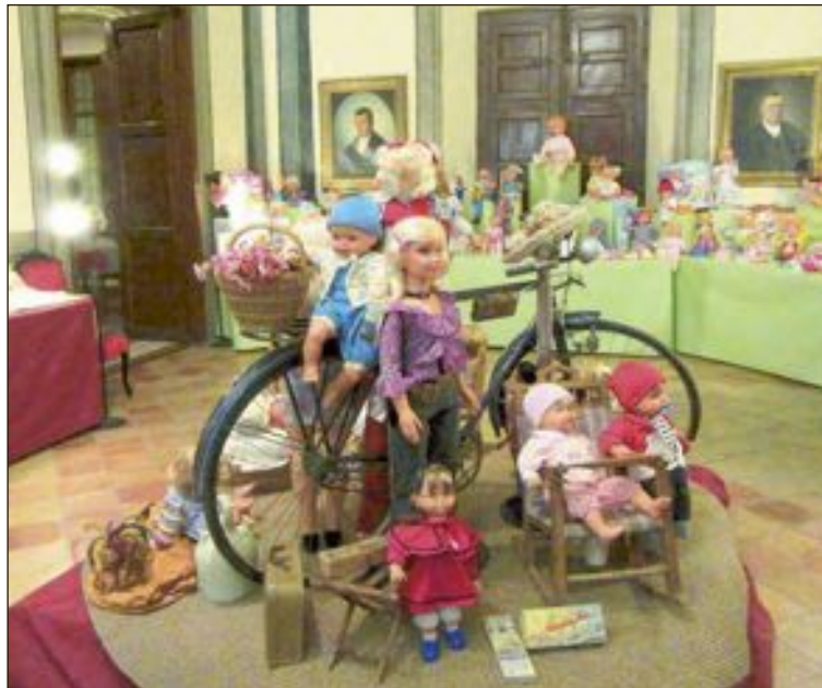
L'exposició de nines ha sigut un dels grans atractius del mercat de Nadal

Així mateix, l'Ajuntament va organitzar per al diumenge una ruta cultural gratuïta i el Castell i el Museu van obrir eixos dies amb un horari més ampli per a tots els visitants.