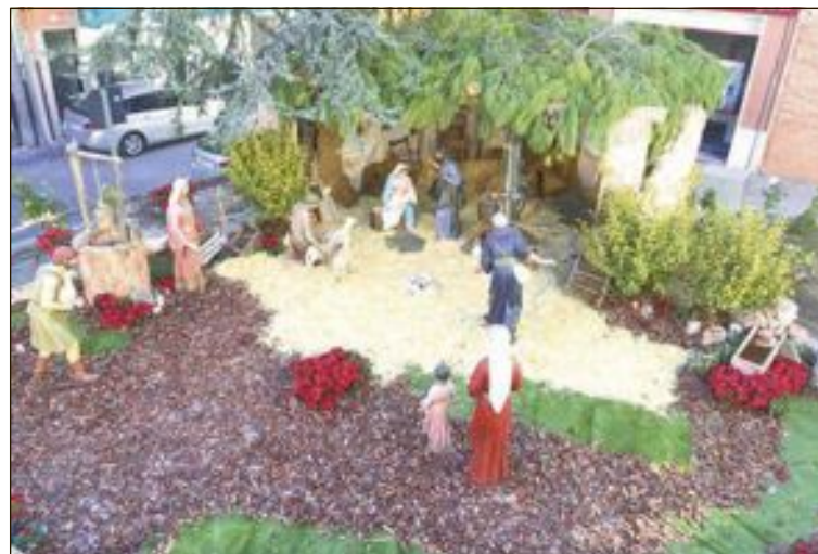
Vista aérea del Nacimiento instalado en la plaza de la Font Vella

También está ya instalado el tradicional Nacimiento en la plaza de la Font Vella, con figu-