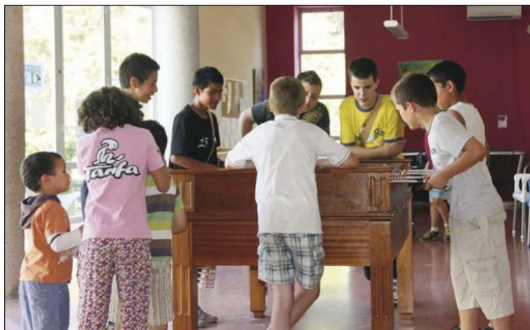
Los chavales disfrutaron de los juegos y actividades en el Casal Jove