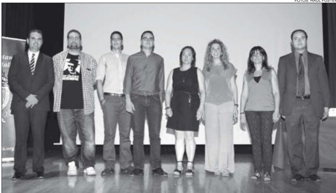
Los participantes de las jornadas, sobre el escenario de la Casa de Cultura de Castalla

C/ Reyes Católicos, 12 Tel. 96 555 43 54 - Fax 96 655 24 30 Email: asesoria@salfe.com IBI