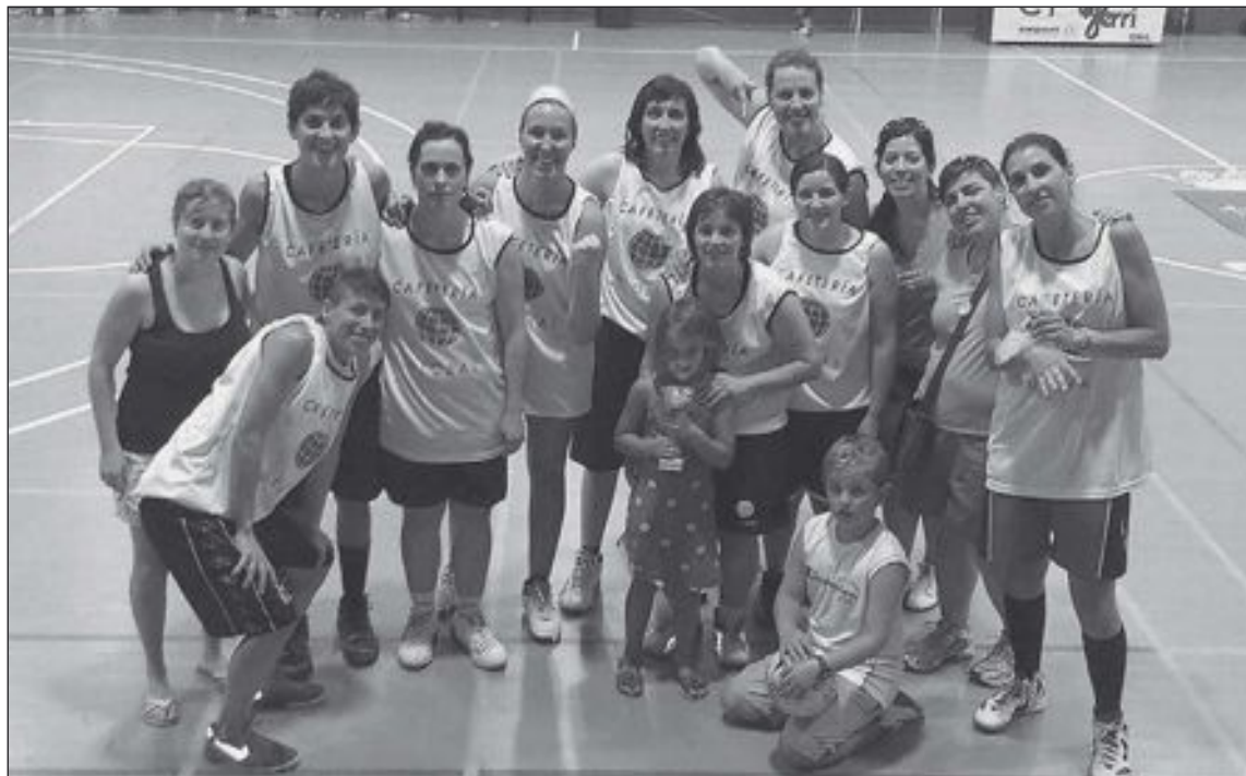
El equipo Pérez Francés Hermanos ganó las 12 Horas Absolutas Femeninas de Baloncesto de Onil 2013

Los premios serán sendos jamones para la pareja ganadora, garrafas de aceite para los segundos y bolsas con productos variados para los terceros y cuartos clasificados. En la categoría de Consolación, las cuatro primeras parejas clasificadas recibirán sendas bolsas con productos variados.