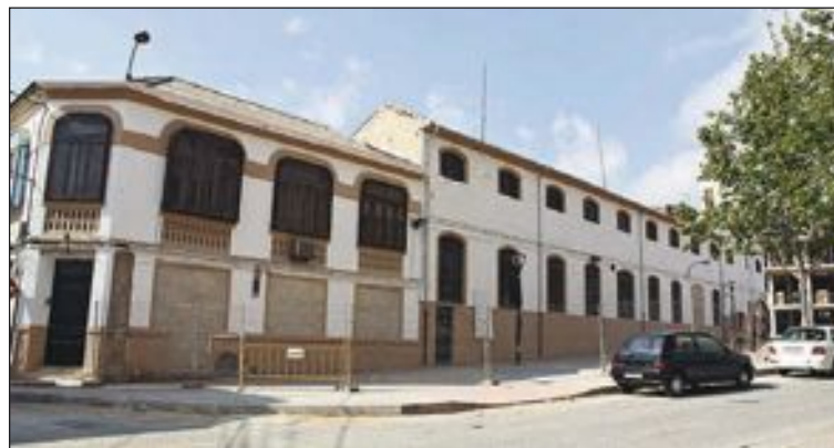
El Museo del Juguete se instalará en la fábrica Payá

El Ayuntamiento ha dispuesto para estos trabajos y para el res-