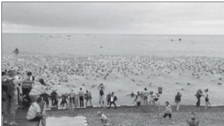
La prueba de natación juntó a cerca de 3.000 personas en el mar