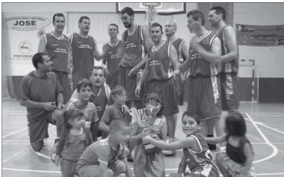
El equipo Bar Ca Huertas ganó las 24 Horas Absolutas Masculinas de Onil 2013