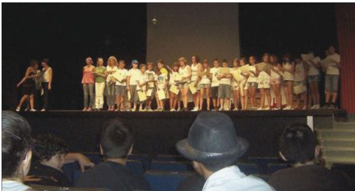
El jueves 18 de julio tuvo lugar el fin de curso en el Centro Cultural

Por la mañana, los voluntarios trabajan en el paraje natural y, por las tarde, se organizan diferentes actividades de ocio para que los jóvenes conozcan los lugares emblemáticos y las tradiciones de la localidad.