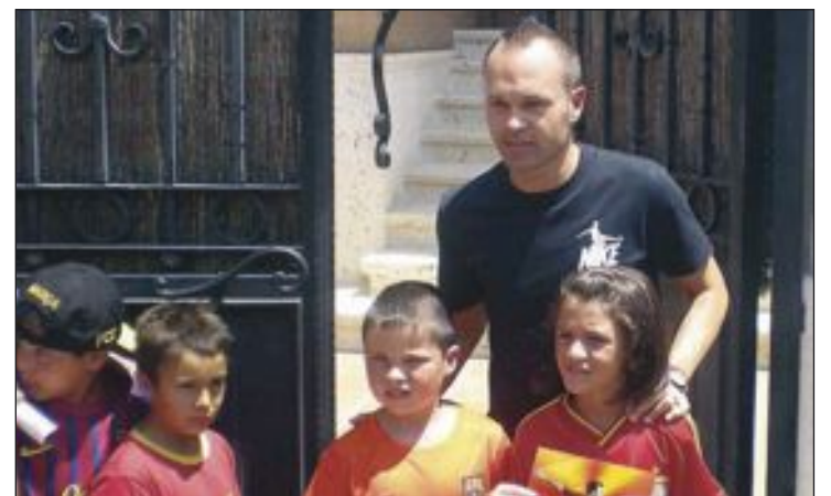
El jugador hizo las delicias de pequeños y mayores dejándose fotografiar