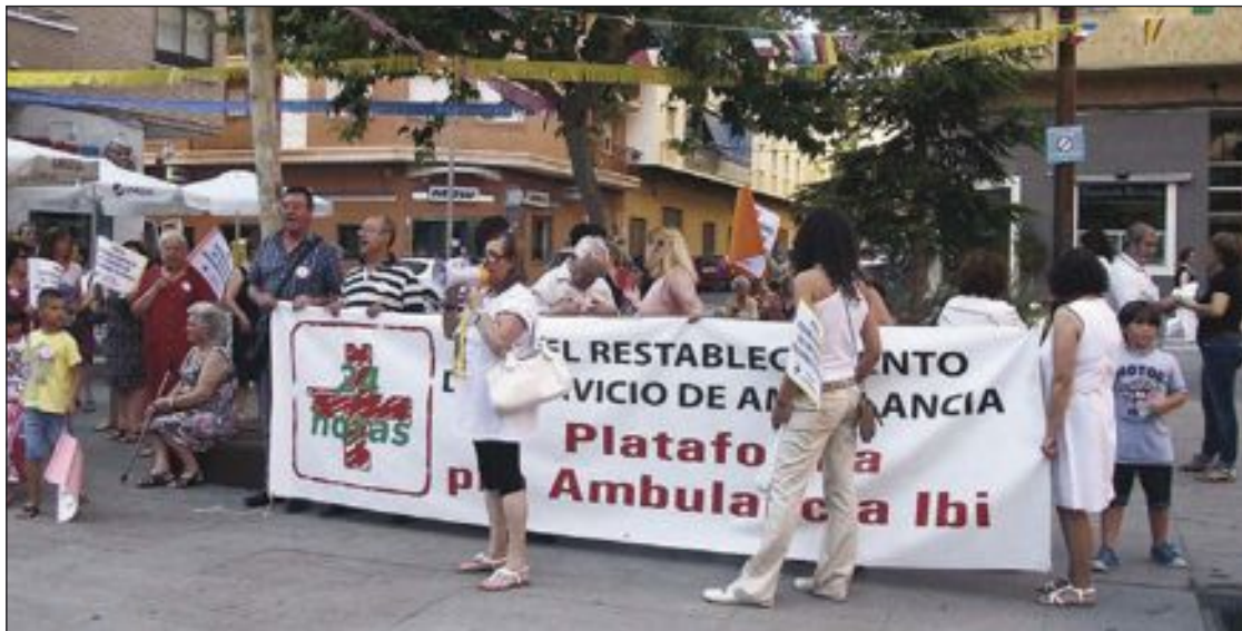
En la concentración se pidió el restablecimiento del servicio de 24 horas

lancia con cobertura las 24 horas del día. Sin embargo, la primera edil y diputada autonómica se ausentó de la Comisión de Sanidad y Consumo de las Cortes Valencianas, justo antes de la votación en la que se pedía el restablecimiento de todos los servicios de urgencias