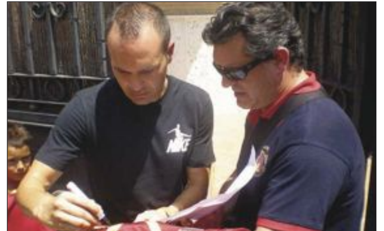
Iniesta firmó una camiseta que será sorteada en Ibi y los beneficios destinados al Centro Ocupacional San Pascual