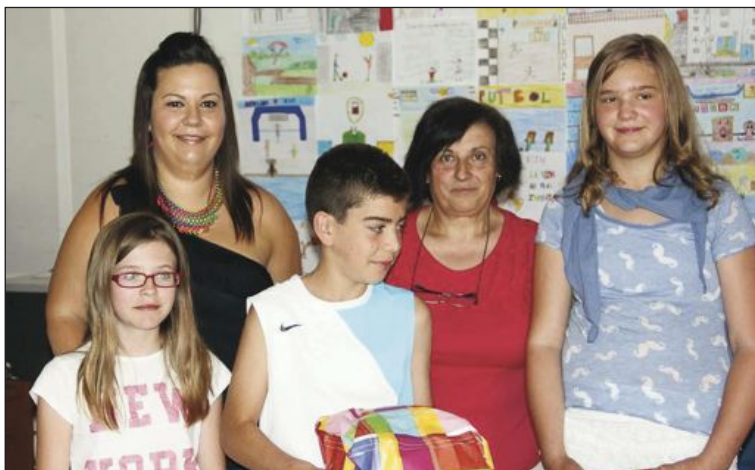
Representantes de Preavir, junto a los ganadores en el concurso de dibujo