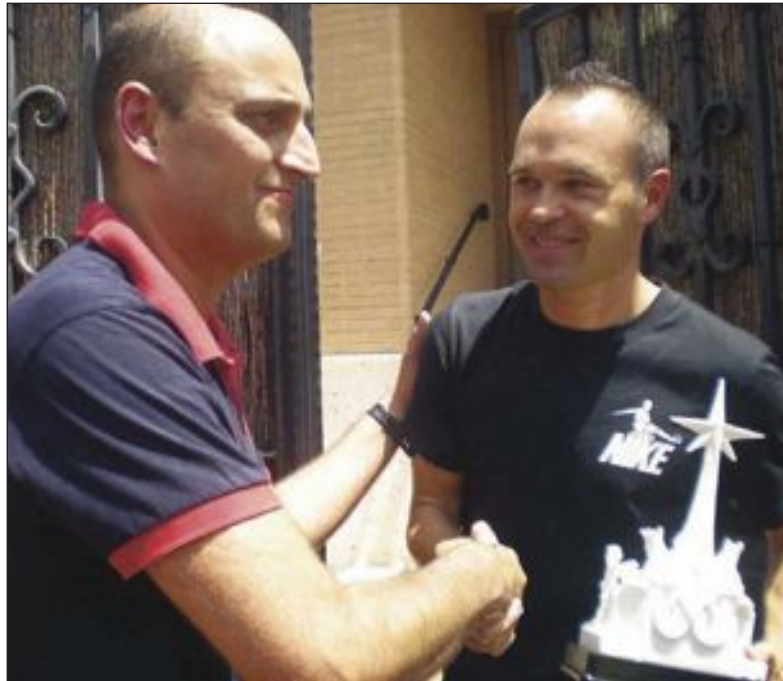
La Peña Barcelonista de Ibi le entregó una réplica de los Reyes Magos

Fuentes de la organización señalaron que Andrés Iniesta estuvo muy simpático en todo momento y quedó encantado con los regalos de la Foia.