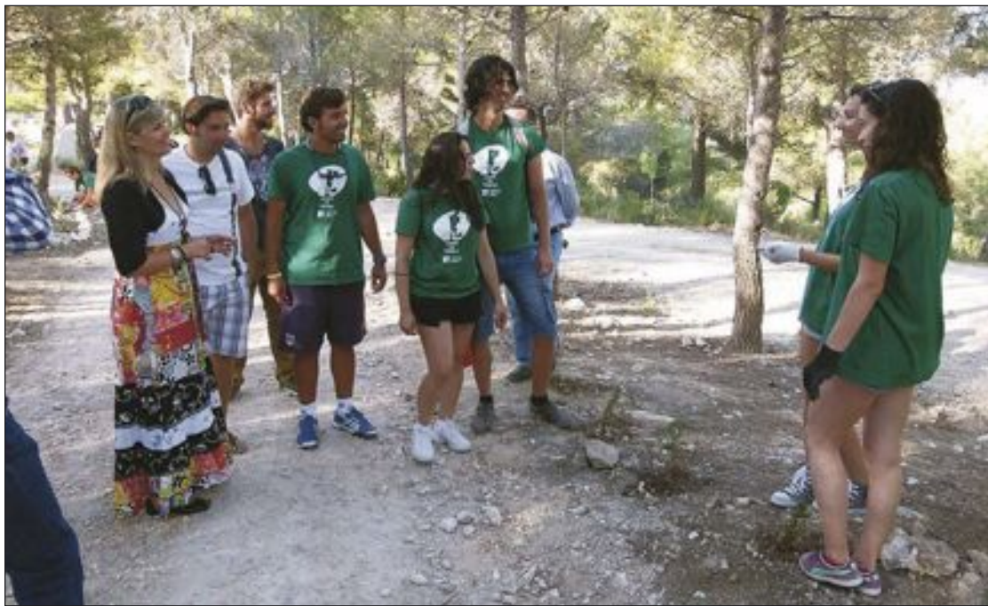
La consellera durante su visita, el 24 de julio, al Campo de Trabajo Internacional

Durante tres semanas, los participantes han creado películas, teatros, coreografías, un mural en la plaza de la Libertad, camisetitas y dinámicas. Todo ello relacionado con las ideas y valores del cuento 'Así es la vida'.