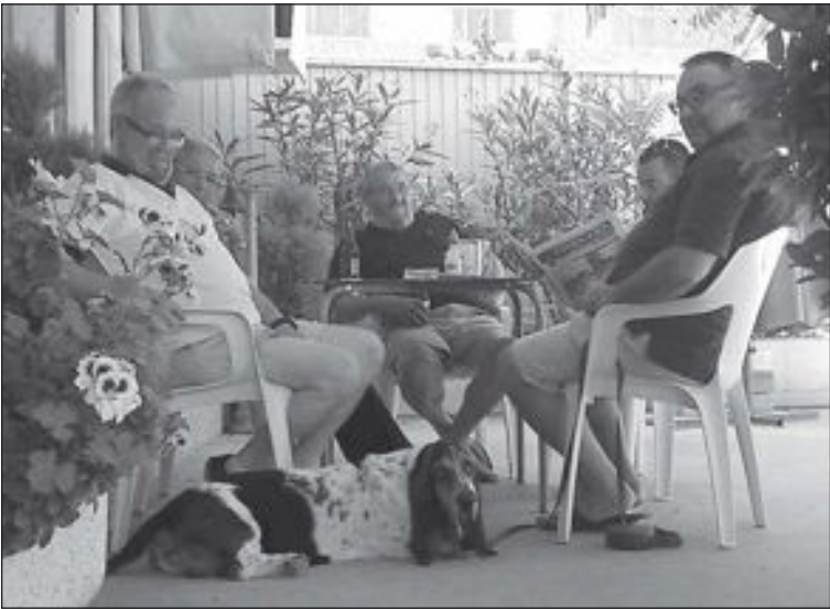
‘Los Meninos’ almuerzan en Los Tuaregs de Ibi