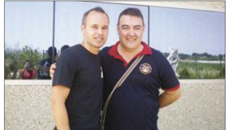
Iniesta, en sus bodegas de Fuentealbilla, junto a un aficionado ibense