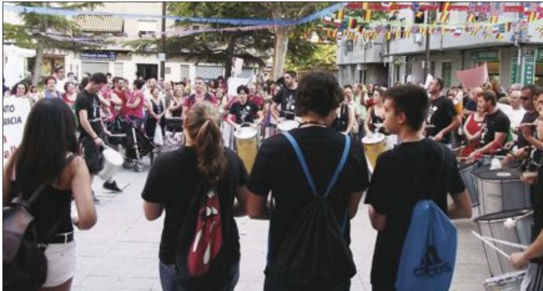
El grupo de batukada Trencatoms se unió a la concentración de protesta del 23 de julio en la plaza Reyes