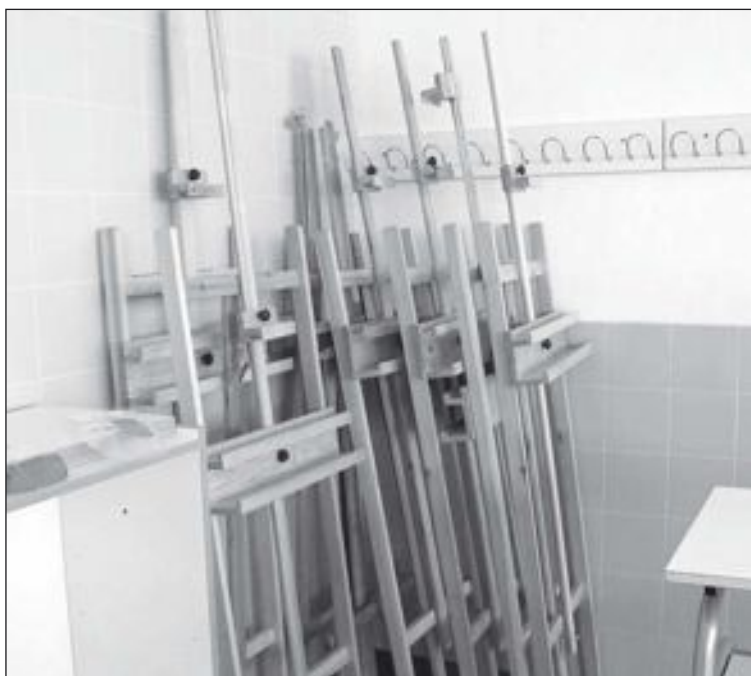
También dispone del material didáctico necesario y del docente