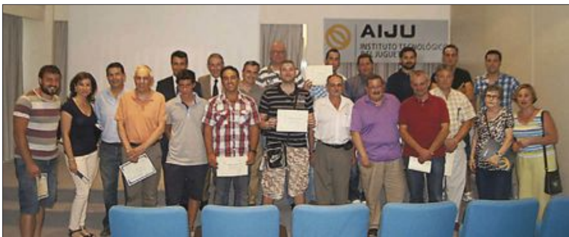
Entrega de los diplomas de formación a varios alumnos en AIJU