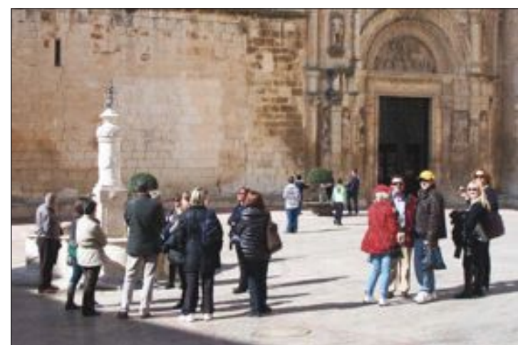
Las visitas tienen cada año más adeptos