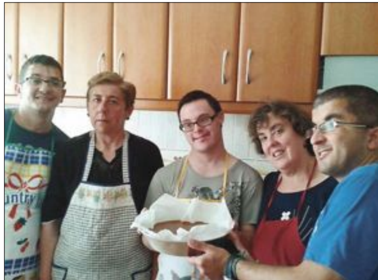
A los residentes se les enseñan habilidades personales y sociales

A los diez participantes se les enseña habilidades personales y sociales como son el aseo, la limpieza de la vivienda, manejo