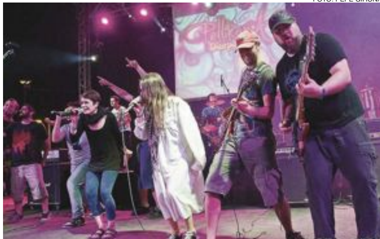
Arriba a la derecha, Pellikana en la concha de la Explanada de Alicante; a la izquierda, en la comparsa Pirates de Castalla; abajo, en el Feslloch (Benlloch)