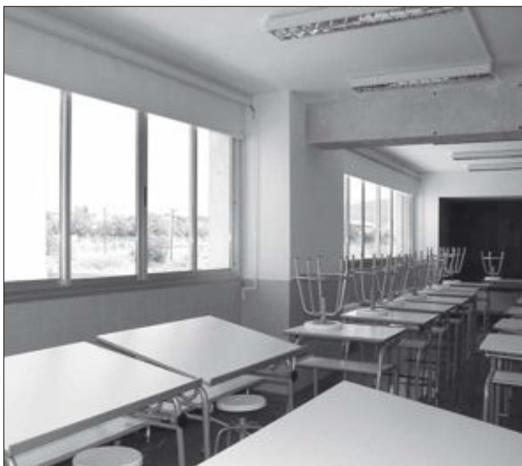
El instituto dispone de aulas adecuadas para esta modalidad de bachillerato