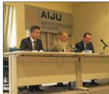
Asamblea de socios de AIJU

AIJU tiene en la actualidad 486 empresas asociadas y 1.150 clientes activos, entre los que destacan las firmas relacionadas con juguetes y puericultura (236), transformación de plásticos (91), matricería (27) o alimentación infantil (9), entre otros.