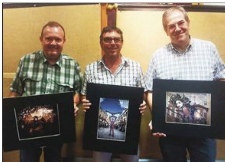
Los miembros del jurado muestran las fotografías premiadas

La guía incluye información sobre las siete Capitanías, la Corte de Honor y el pregonero de este año.