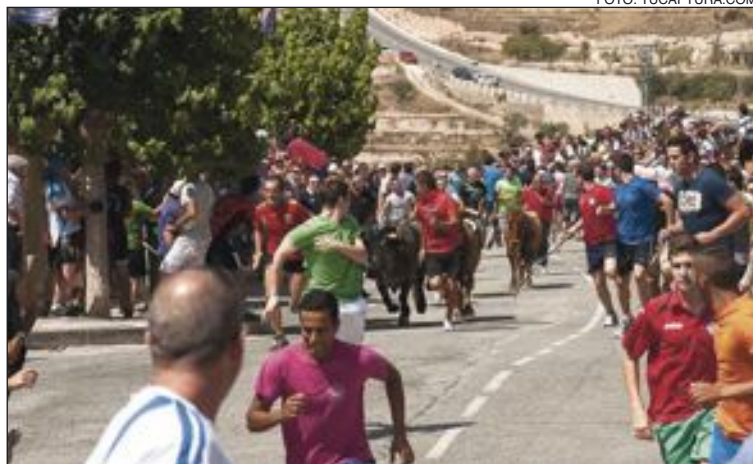
Entrà de vaques, acto declarado de Interés Turístico Local de la Comunidad