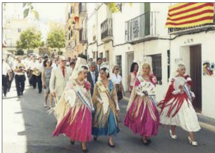
Pasacalles de la Reina, damas y autoridades tras la Misa Mayor