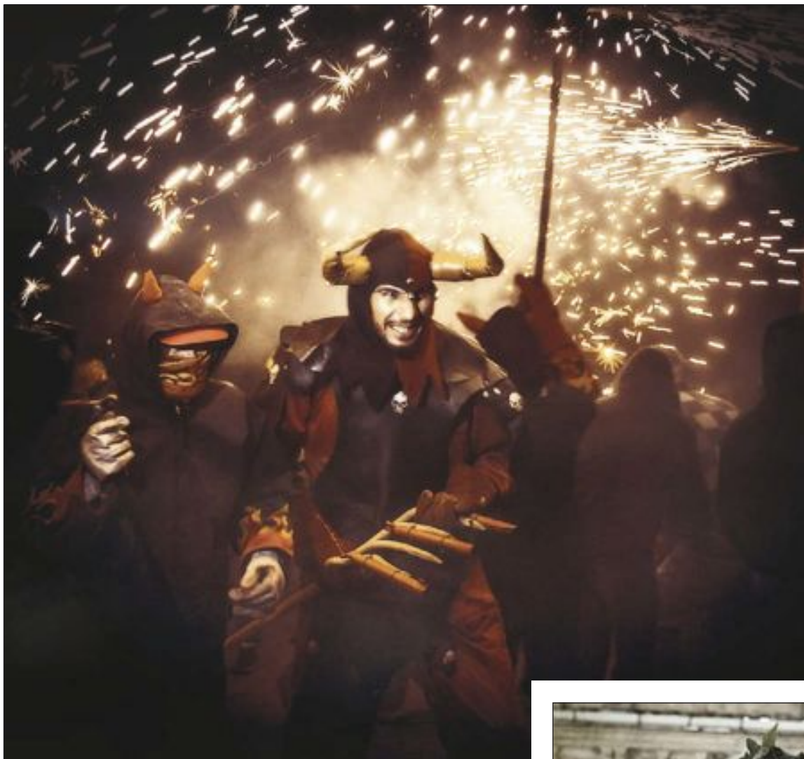
Primer premio: 'Lulú', de Antonia Pentinat Ayelo

Según la Agrupación Fotográfica de Castalla