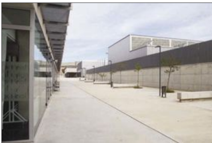
La demanda pretende cubrir las necesidades de traslado a los institutos