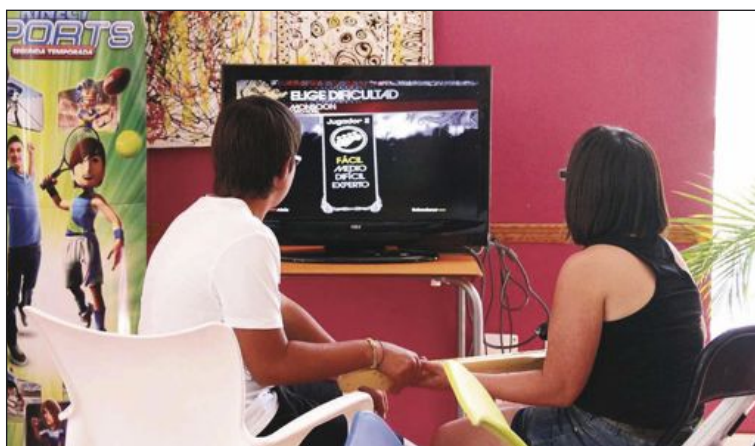
Entre las propuestas juveniles hubo videojuegos de última generación