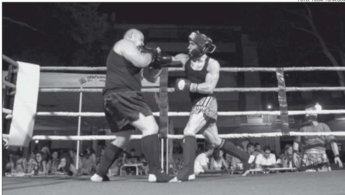
Los combates se desarrollaron en un ring colocado en El Kiosket de Ibi (glorieta de España)

temporada, los chicos del club ibense están participando en numerosos eventos deportivos, demostrando un gran nivel y dejando el nombre de Ibi bien alto, lo cual deja patente que