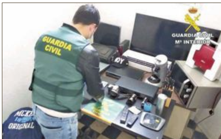
La investigación sigue abierta para poder determinar la propiedad de los objetos que le han sido intervenidos, robados en las casas de campo

Para intentar escapar del cerco policial, el individuo se trasladó hasta las partidas rurales de Ibi y Onil, ya estando decretado el estado de alarma. Consciente de que la gran mayoría de las viviendas estarían desocupadas, debido a la obligación de los ciudadanos de permanecer en