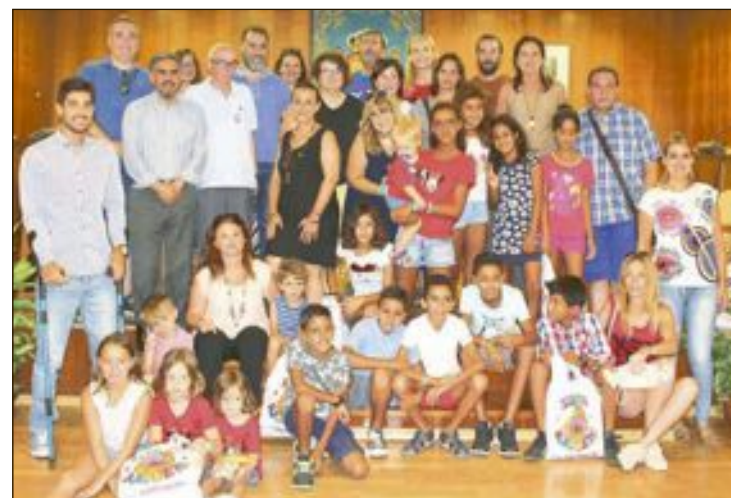
Recibimiento del Ayuntamiento a los niños saharuis venidos en verano

rial sanitario, pero creemos que empieza a ser el momento de enfocar esa solidaridad hacia las personas con escasez de recursos básicos, por lo que animamos a todas las asociaciones, colectivos y entidades ibenses que consideren estar en disposición de ayudar, a que lo hagan sin esperar más".