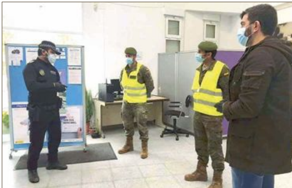
Un equip operatiu del MOE de l'Exèrcit de Terra, va estar a Tibi el dilluns 13 d'abril