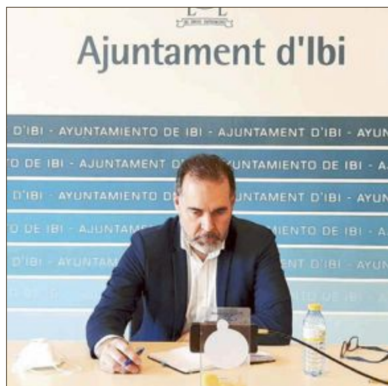
El alcalde, durante la reunión online con otros alcaldes populares

El alcalde sigue en constante comunicación con los dirigentes del Partido Popular y en sintonía con lo manifestado, añade que “lo urgente son los pactos para garantizar mascarillas, test y prestaciones a todos los ciudadanos que necesiten ayuda”.