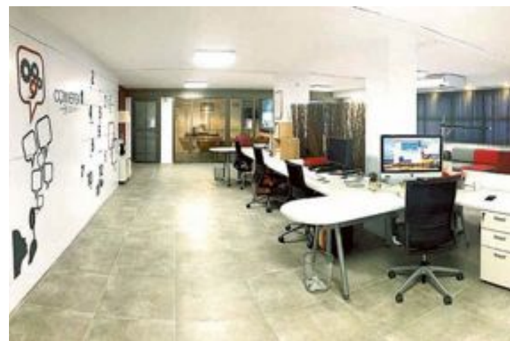
Instalaciones de coworking de Conversa en Ibi

Si en treinta días de confinamiento ya has comprobado que puedes trabajar desde casa, aunque las condiciones no sean las más favorables, ahora te toca aumentar tu productividad hacién-