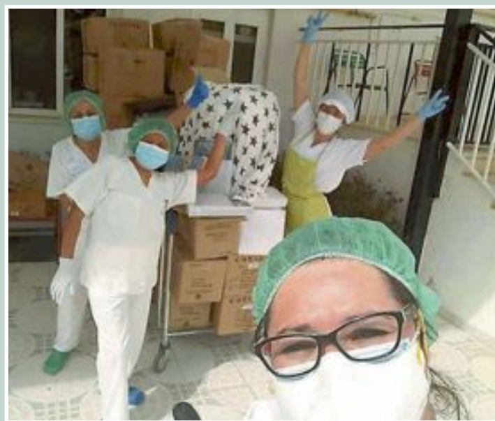
El Asilo cuenta con 35 usuarios y 30 trabajadores

La conselleria de Sanidad actualizaba el jueves también la situación de las residencias de la Comunidad Valenciana, donde hay detectados casos