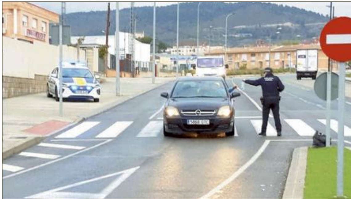
La Policía Local y la Guardia Civil dispusieron el martes 14 de abril un amplio dispositivo para el reparto de mascarillas en las entradas y salidas de los polígonos industriales

Tal y como anunció la pasada semana, tendrá dispuestas 30.000 mascarillas reutilizables, realizadas por voluntarios y voluntarias de Ibi, que se repartirán en todos los domicilios de la localidad. Concretamente, se repartirán tres mascarillas en cada casa.