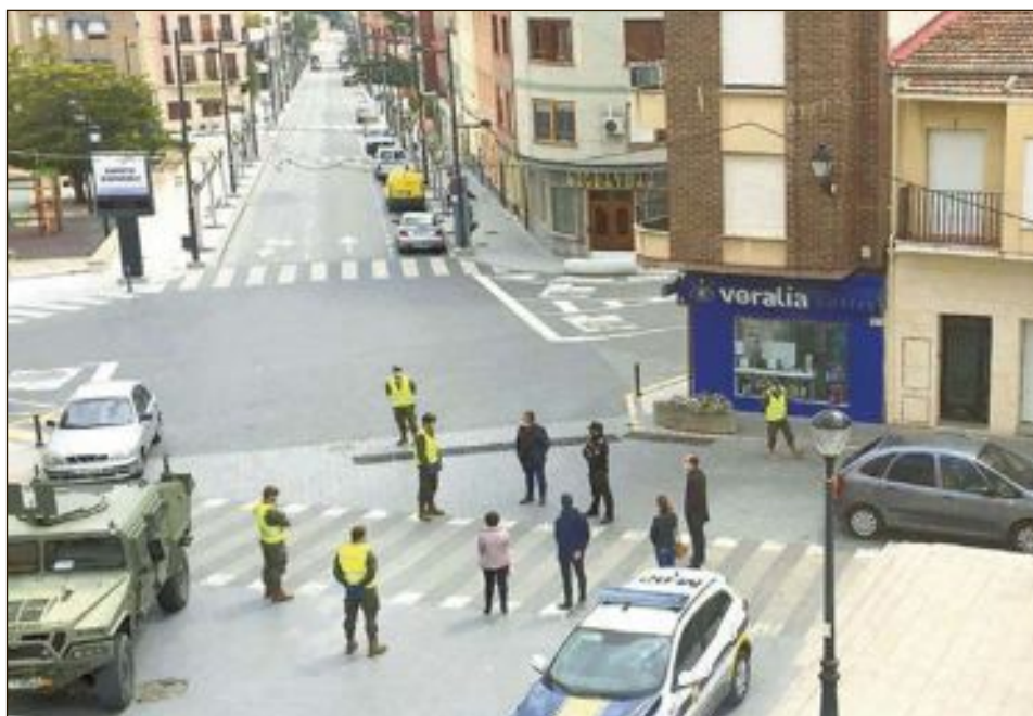
Diverses unitats militaritzades del Comandament d'Operacions Especials (MOE) d'Alacant es va desplaçar el dilluns 13 d'abril al municipi de Castalla