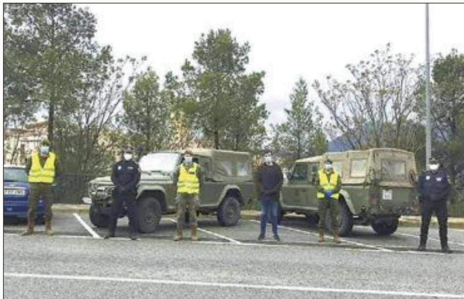
La unitat va actuar amb col.laboració d'autoritats locals, Guàrdia Civil i Policia Local