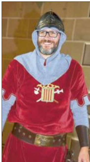
Las fiestas de Moros y Cristianos se aplazan a septiembre de 2021, manteniendo los cargos actuales de capitanes y abanderadas

Desde la Comisión, también expresan “nuestro más profundo dolor ante cada una de las personas fallecidas que deja esta pandemia y transmitir nuestro más sincero pésame a las familias, que están sufriendo un proceso de duelo, deseando la pronta recuperación de todos los afectados lo antes posible”.