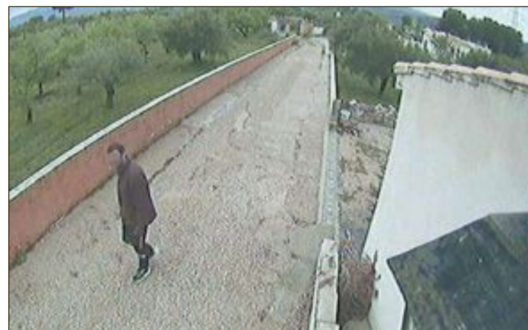
La cámara de seguridad de una casa en una partida rural de Onil captó cómo el sospechoso merodea por las viviendas

objetos que le han sido intervenidos a esta persona, objetos que, por el momento, aún no han sido reconocidos. Esto podría deberse a que, debido a las medidas restrictivas del estado de alarma, los propietarios de estas segundas residencias ocupadas ilegalmente, aún no se han cerciorado de ello, por estar cumpliendo las medidas en sus residencias habituales o bien por tratarse de segundas residencias vacacionales, de propietarios residentes en otros países.