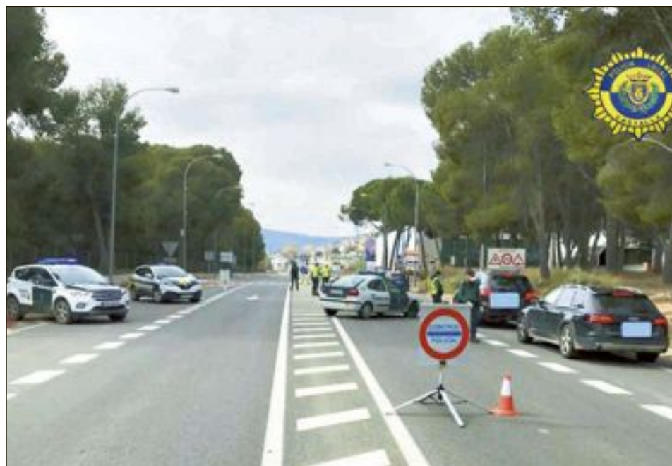
Els membres de la Policia Local Castalla van tindre el divendres 10 d'abril un dia intens controlant el xicotet augment de circulació de vehicles