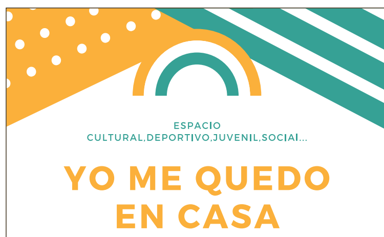
Cartel anunciador de 'Yo me quedo en casa' para participar en la emisora local

Debido al momento actual de confinamiento, se trata de aliviar en la medida de lo posible el tedio que supone permanecer en casa tanto tiempo creando una simpática idea que genere la creatividad y el ingenio. Según explica el edil de Cultura, Raúl Ferrer, esta iniciativa ha tenido una gran acogida con la participación de muchas niñas y mayores "con textos muy interesantes y muy entrañables que hacen los más pequeños. Es muy agradable