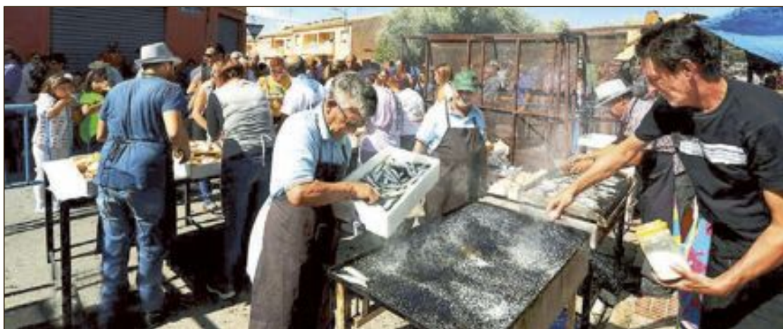
En las fiestas de San Miguel, junto al esmoraset amb coca es también típica la sardinada a mediodía

Por último, solicitan que exista “diligencia exhaustiva” en todos los aspectos relacionados con servicios de ayuda a domicilio, servicios sociales y persona vulnerables, entre otras.