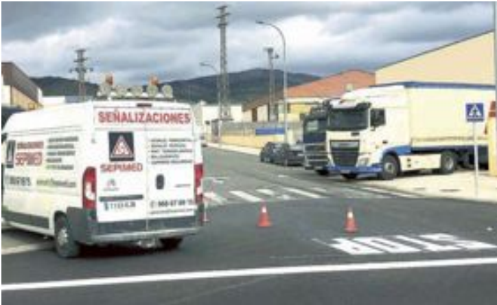
En los tres últimos años, Ibi ha recibido en materia de subvenciones para sus polígonos industriales alrededor de 4 millones de euros