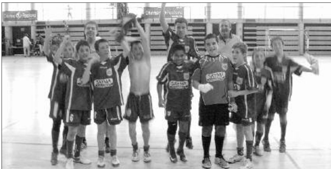
La alegría se apoderó de los jugadores del Sayma cuando fueron proclamados campeones autonómicos

Los horarios de los partidos pueden consultarse en la página 25 de este número de Escaparaté.