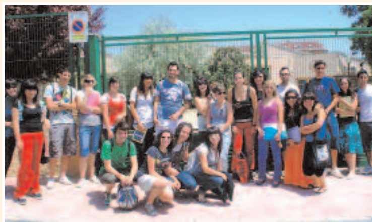
Los jóvenes esperan en la calle a que la biblioteca abra a las 15 horas

Un viandante sorprendido por esta cantidad de jóvenes quiso captar la imagen, a la que se prestaron encantados todos los estudiantes.