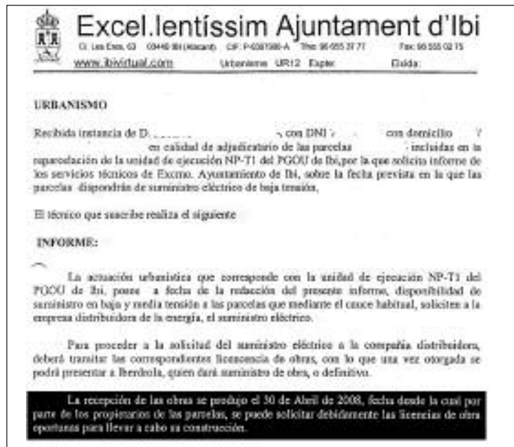
Informe de Urbanismo donde se dice que las obras están recepcionadas