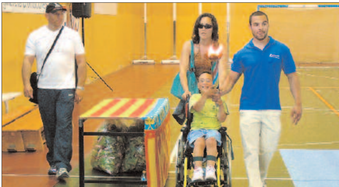
El tramo final de la antorcha fue cubierto por un niño en silla de ruedas