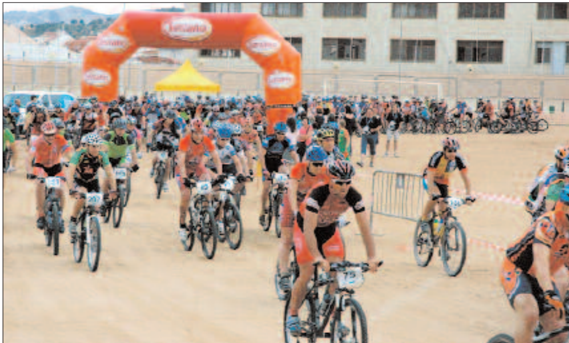
La salida tuvo lugar a las 9:30 horas desde el Estadio Climent

Desde la organización se quiere agradecer la presencia de los participantes y el apoyo de los voluntarios que hicieron posible este acontecimiento deportivo de primer orden: