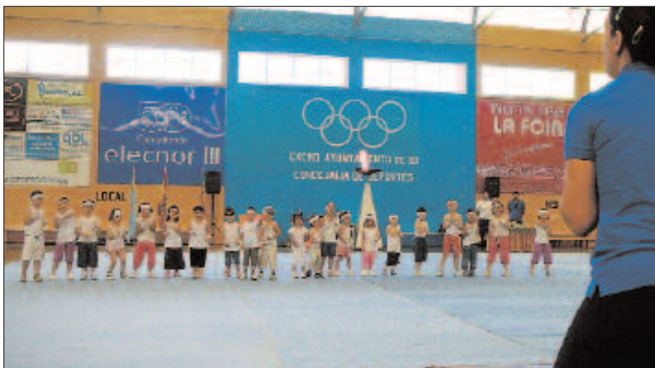
Los monitores de las Escuelas Deportivas acompañaron a los niños en todo momento