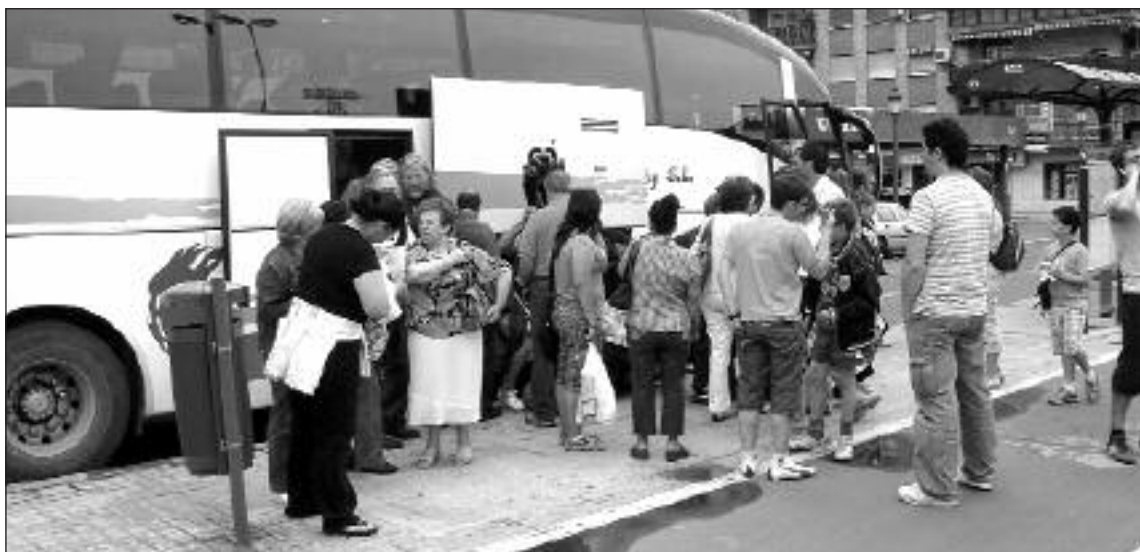
La concejalía de Deportes fletó tres autobuses de aficionados para acompañar al equipo hasta Valencia