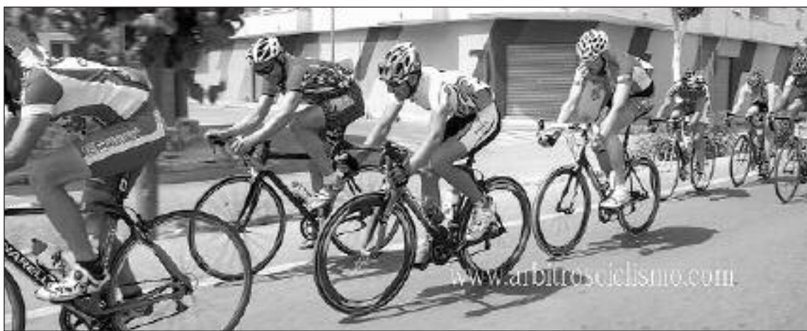
Instante de la carrera disputada en Benijófar el 24 de mayo