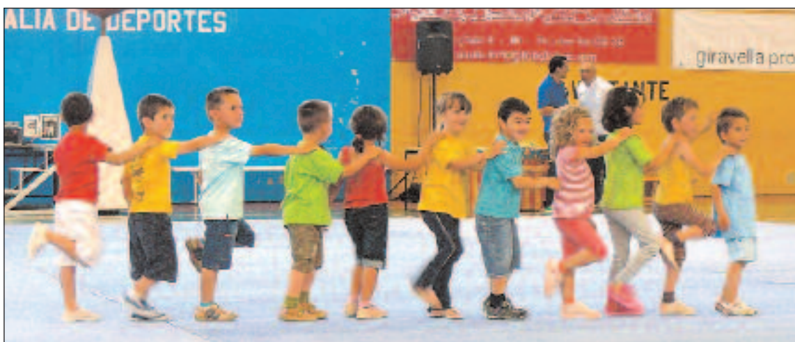
Las exhibiciones de pequedeporte dieron inicio a las V Miniolimpiadas de Ibi