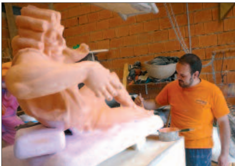
El artista colivenc aplica gotelé a una de las figuras del Olimpo

El grupo de teatro Vico de Biar actuará este sábado, 6 de junio, en el Auditorio del Centro Cultural. La compañía biarense pondrá en escena la obra 'La Casa de Bernarda Alba', de Federico García Lorca. La función comenzará a las ocho de la tarde.