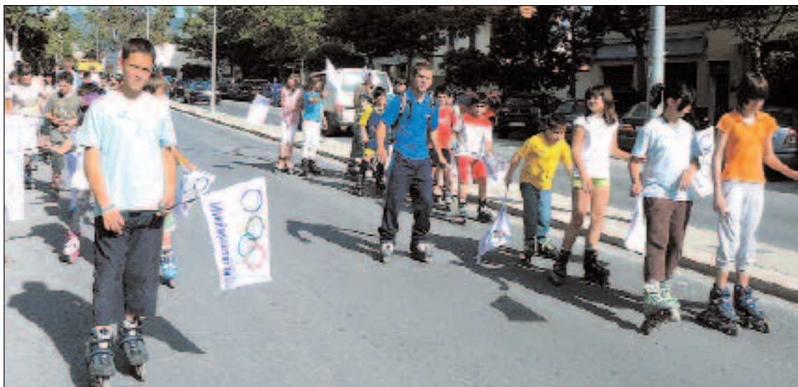
Alumnos de la Escuela de Patinaje fueron los encargados de escoltar la antorcha hasta el Polideportivo

Arturo Picó, concejal de Deportes del Ayuntamiento de Ibi ha querido agradecer el excelente comportamiento y deportividad de todos los asistentes y la participación de los jóvenes deportistas ibenses que hacen posible la celebración de este singular encuentro con el apasionante mundo del deporte.