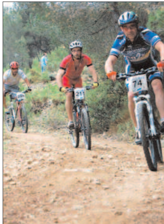
El recorrido de esta III Marcha de BTT 'Villa de Ibi' contó con unos 30 kilómetros