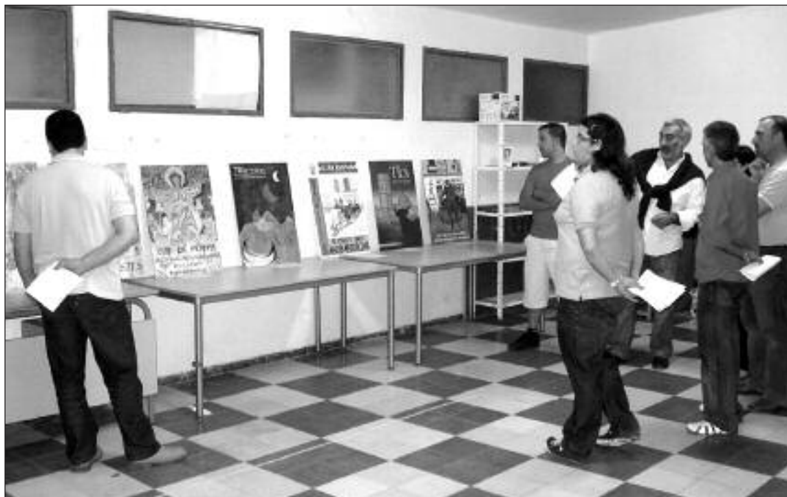
Miembros del jurado durante el fallo del premio que tuvo lugar en el Casal de la Joventut

La obra ganadora llevaba por título 'Que ve la vaca' y será la portada del libro de las