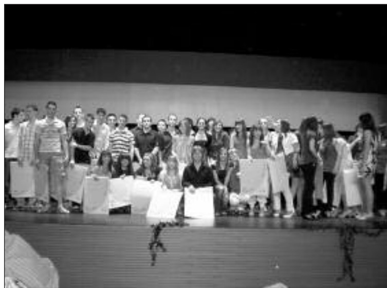
Promoción 2008-2009 de 2º de Bachillerato del Instituto, en el Auditorio

La Virgen de la Soledad vuelve a la Ermita. El domingo 31 de mayo tuvo lugar la tradicional Pujada de la Mare de Déu desde la Iglesia hasta la Ermita de la Sang, donde la Virgen de la Soledad permanecerá hasta las próximas Fiestas de Moros y Cristianos. La imagen de la Patrona de Castalla fue bajada desde la Ermita hasta la Iglesia el Domingo de Pascua, y ahora vuelve a ocupar su lugar a los pies del Castillo hasta septiembre.