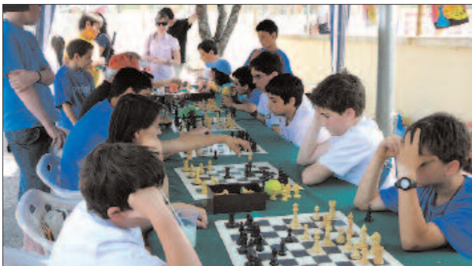
El Club de Ajedrez de Ibi tuvo su apartado para poder disputar varias partidas