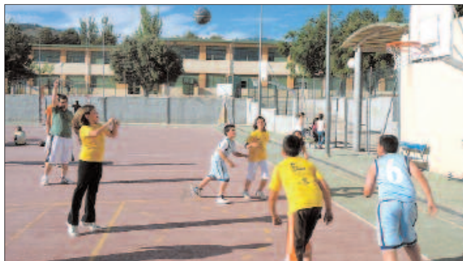
En las pistas exteriores se disputaron partidos de baloncesto y otros deportes