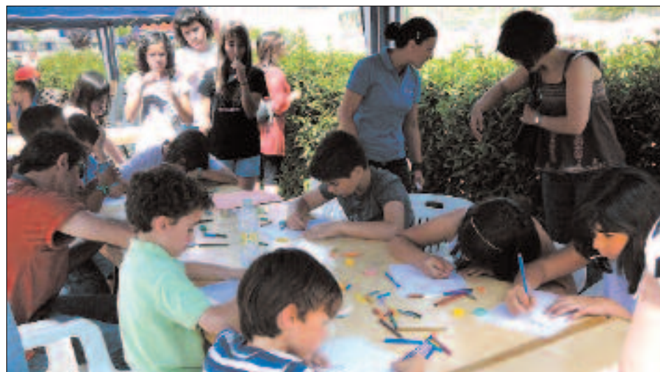
Los chavales pudieron participar en un concurso de dibujo