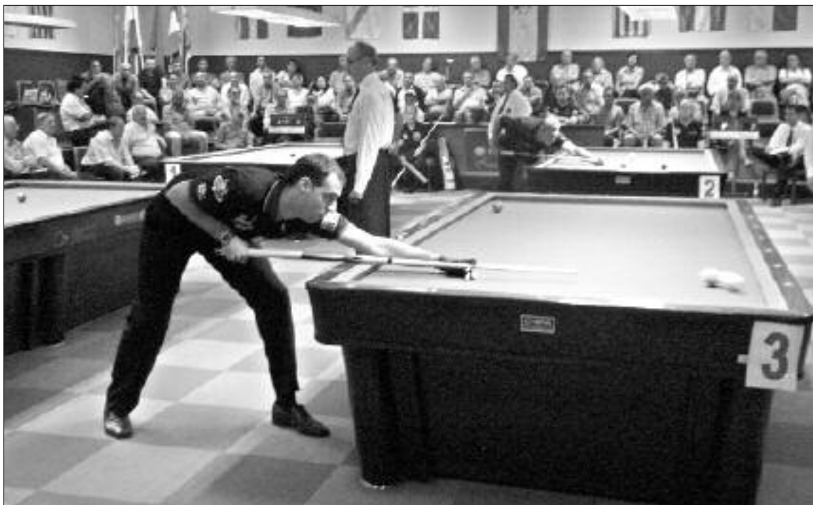
El Campeonato de España se disputó en la Real Federación Española de Billar (Madrid)

El domingo 31 de mayo fue la jornada más dura, con las semifinales y finales