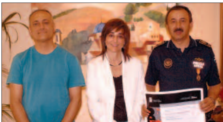
El concejal de Policía, la alcaldesa y el jefe de la Policía Local