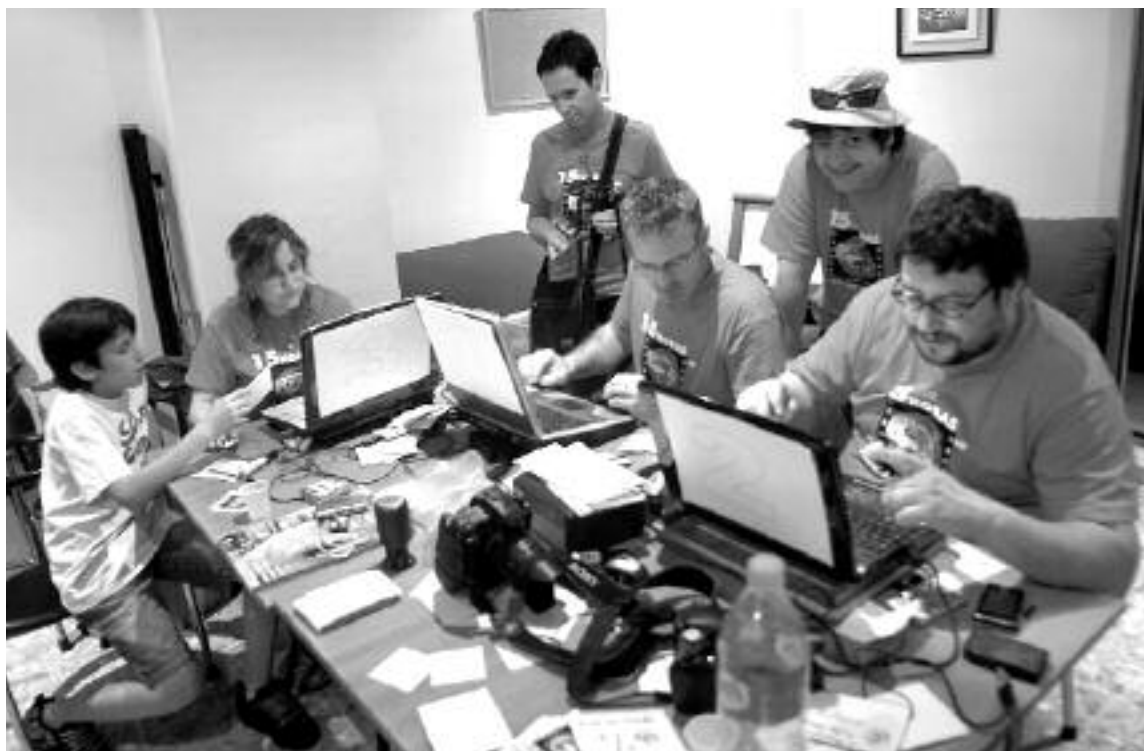
Las inscripciones se realizaron en el Casino Primitivo y a todos los participantes se les obsequió con una camiseta

C/. Tibi, 8 - Tel. 96 633 82 09 - IBI www.mundocineibi.com