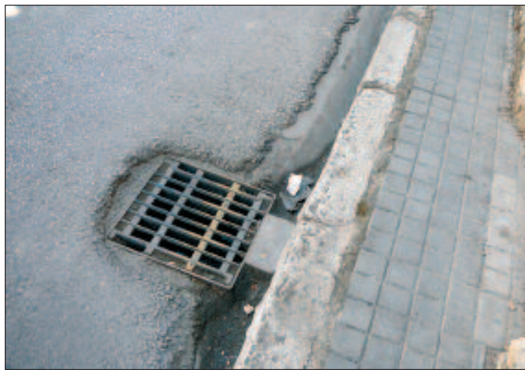
Se está actuando sobre el alcantarillado y otras zonas públicas