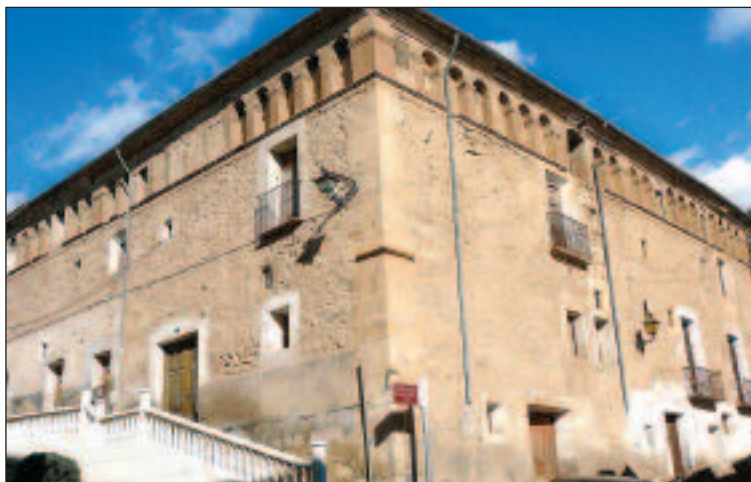
Monasterio de Nuestra Señora de Montserrat

Este edificio emblemático, que requiere de una intervención específica e integrada, se encuentra protegido por el vigente Plan General de Ordenación Urbana y catalogado por la conselleria de Cultura como Bien de Relevancia Local.