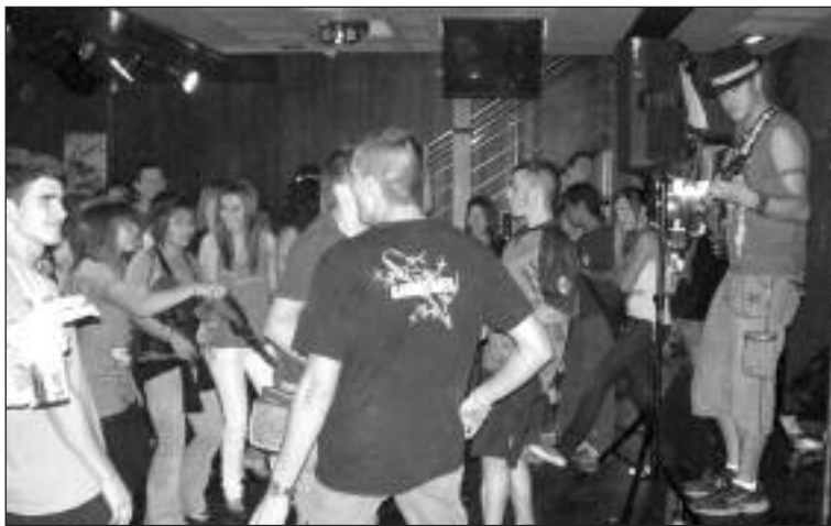
El grupo local Pellikana actuó en el pub L'Escarabat d'Or

Para cualquier consulta o aclaración pueden dirigirse a la Secretaría del centro.