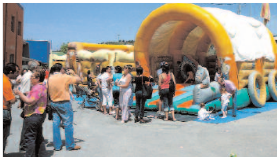
Las actividades se completaron con hinchables para los más pequeños