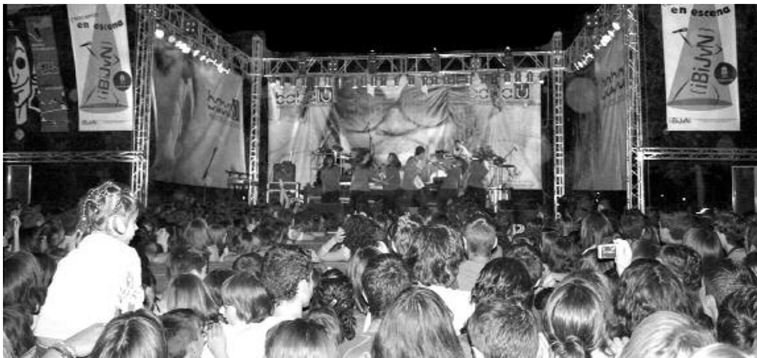
El parque Les Hortes albergó un gran escenario con pasarela y un espectacular despliegue de luz y sonido