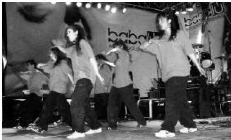
Danza Fusión (primer premio)