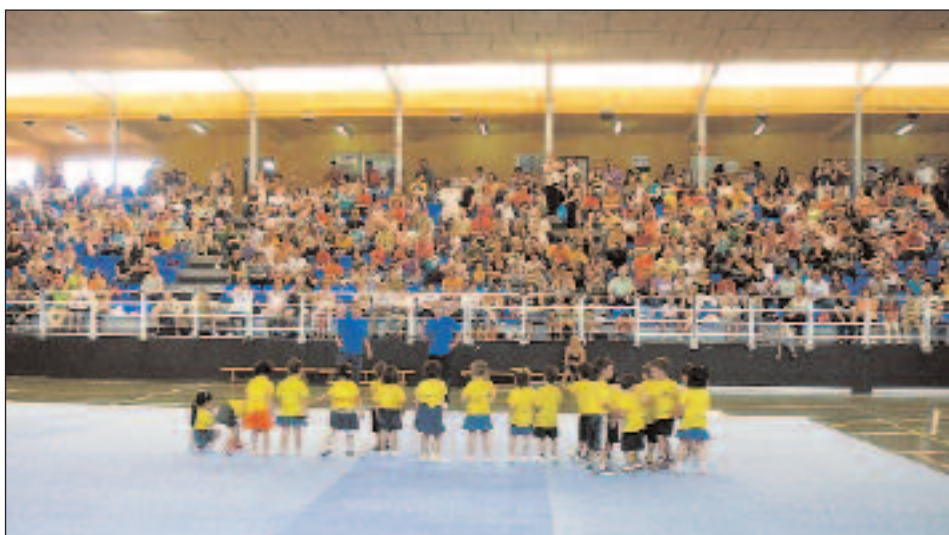
El pabellón registró un lleno absoluto para la mayoría de exhibiciones