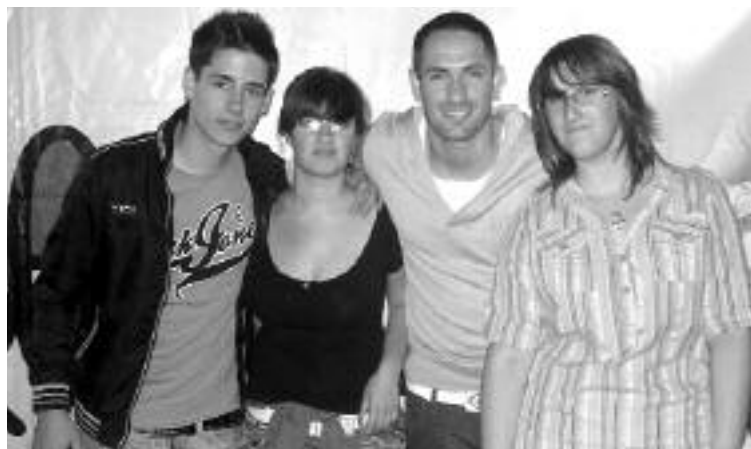
Púa (de Operación Triunfo ) y Ginés (de Fama ), artistas invitados, estuvieron cerca de 45 minutos fotografiándose con sus fans

Santoyo, se mostró tremendamente satisfecho con el resultado global del evento, a pesar de que hubo algunos problemas a la hora de ecualizar a los grupos participantes, y quiso trasladar a todos los asistentes el agradecimiento de Ginés y Púa por el cariño con que se les trató en todo momento.