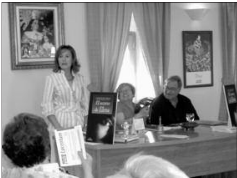
El acto estuvo organizado por la Asociación de Amas de Casa

Con todos los carteles presentados a concurso se realizará una exposición que se abrirá al público en julio, coincidiendo con la celebración de las fiestas patronales.