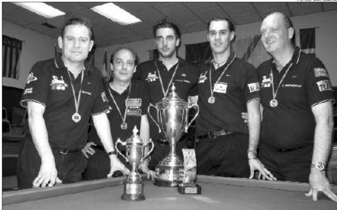
Los componentes del Club de Billar Caseta Nova muestran orgullosos los trofeos de campeones

El Caseta Nova, como primero de grupo y con un promedio general de 1'405 en el