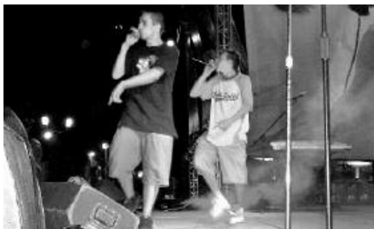
Santa Morte (segundo premio)