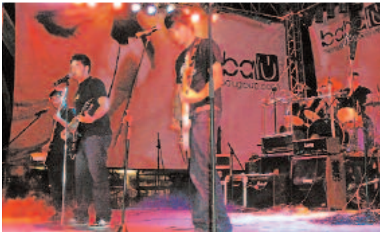
El Gato Tarumba (tercer premio)