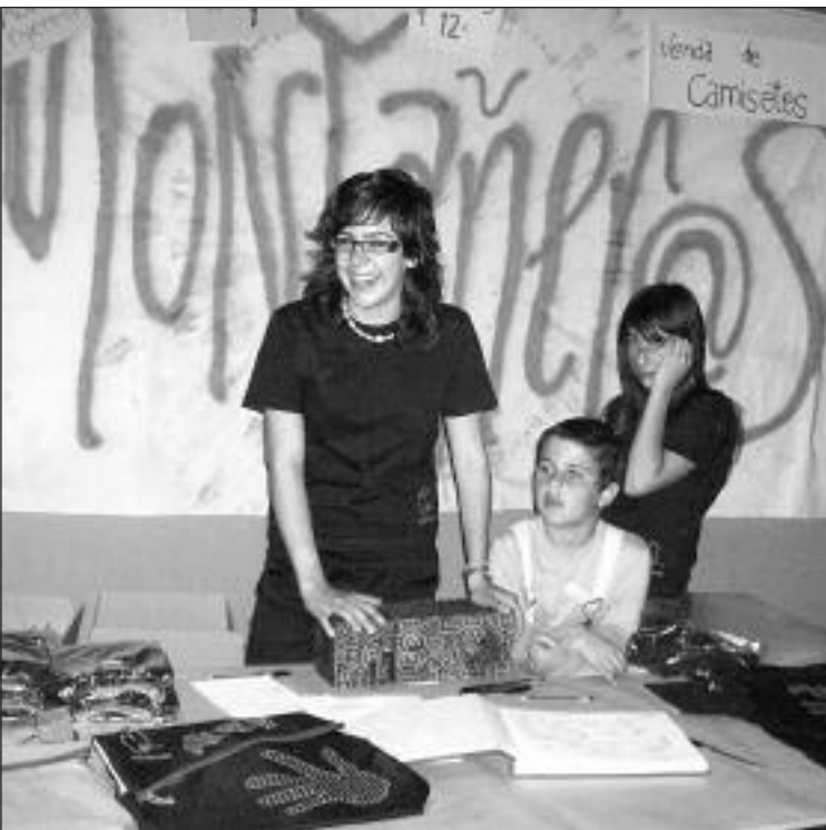
El año pasado se celebró la primera edición de 'Tira una mà'

El primer proyecto con el que colaboró 'Tira una mà' fue el de Viriogo (Rwanda).