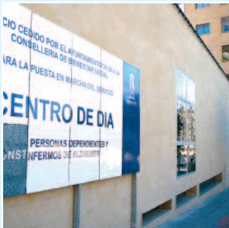
El edificio del Centro de Día se encuentra en la Avenida Juan Carlos I