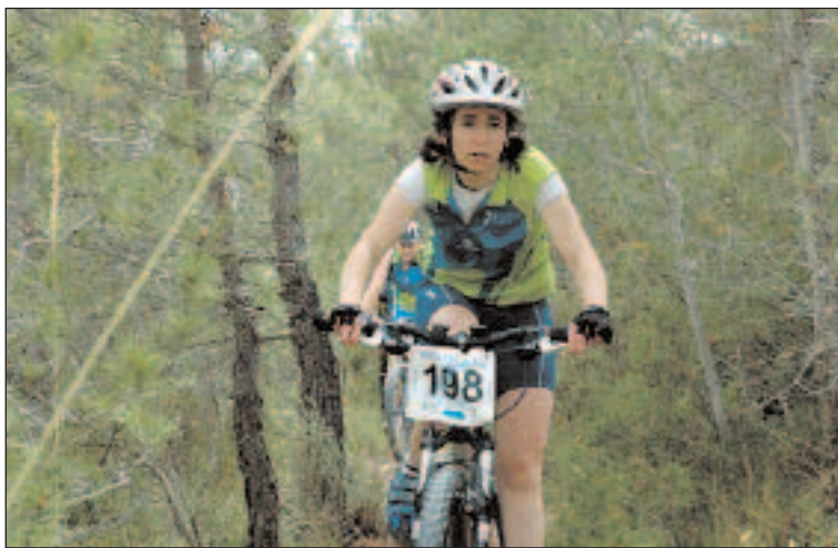
Las féminas demostraron su valía participando en esta prueba

llo de rigor, se procedió a un sorteo de regalos y se emplazó a todos los participantes a la próxima edición de la Marcha de BTT 'Villa de Ibi', que se celebrará en 2010.