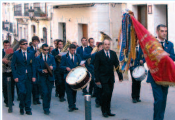
Antes del concierto hubo un pasacalle por Onil