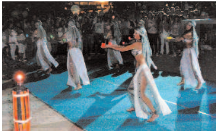
Pirates i Tresors