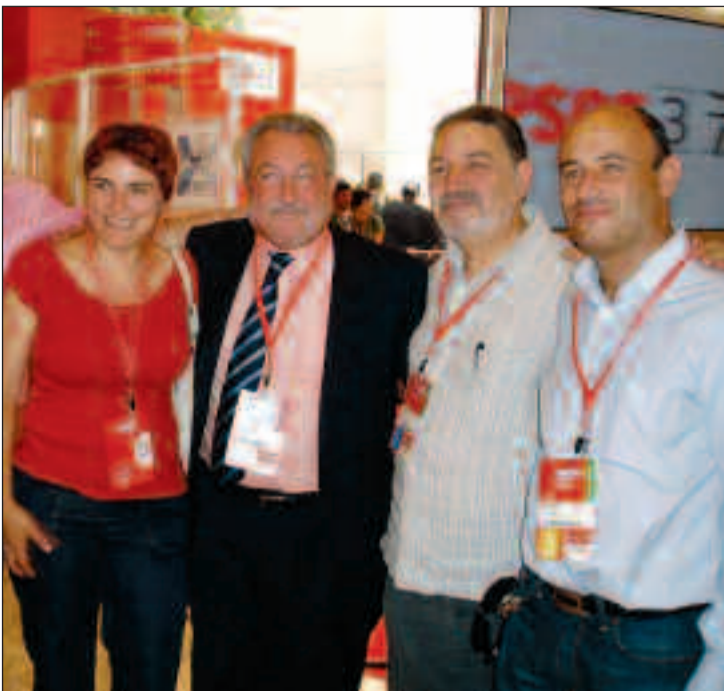
Delegados de la comarca junto al ministro de Sanidad Bernat Soria