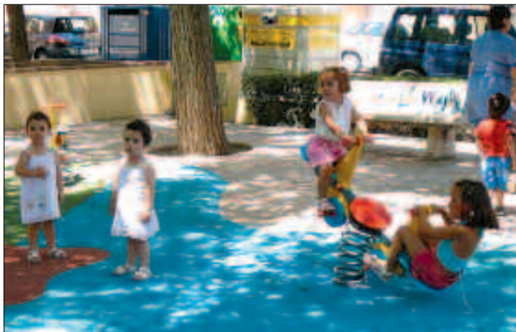
Los niños juegan en los nuevos columpios del parque Horta La Vila