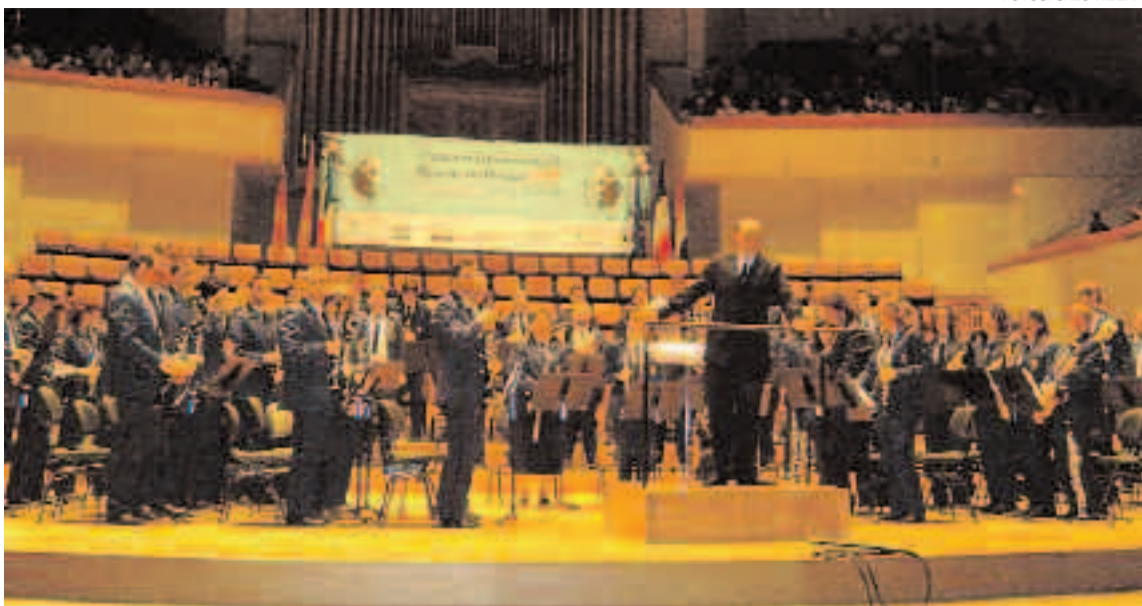
El CIMO interpretó la obra obligada y una de libre elección y un pasodoble que no entraba a concurso