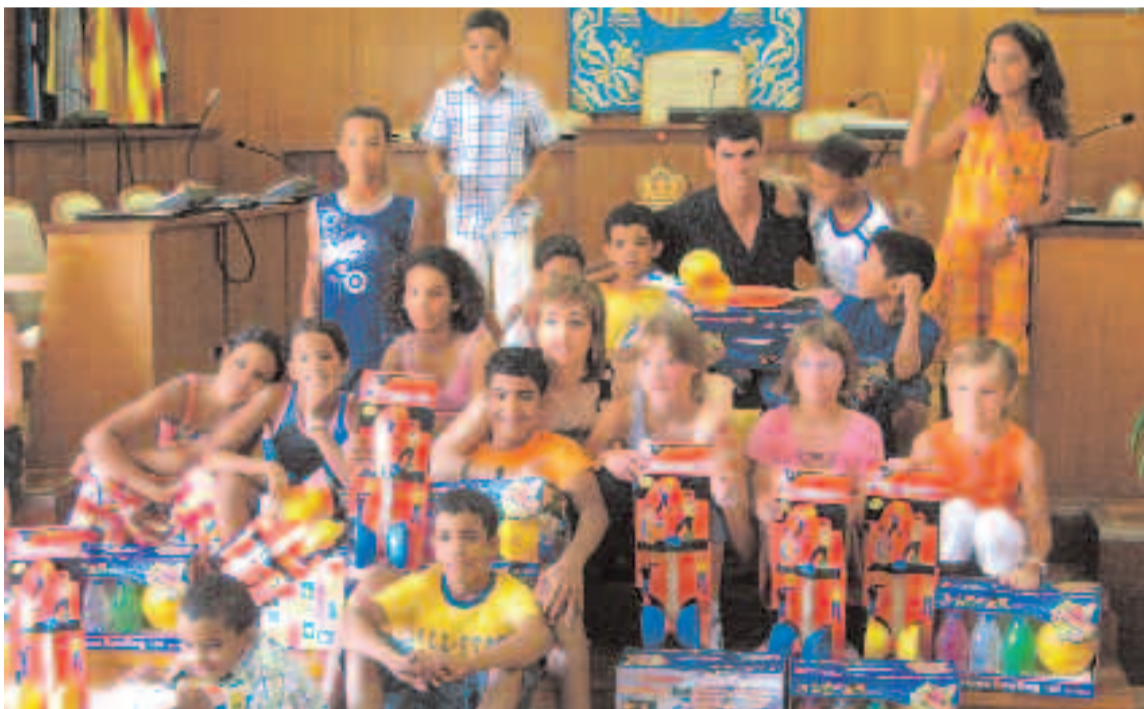
Con este acto, se pretende que las familias de acogida aumenten cada año

Durante el acto, se expusieron lienzos de Mohamed Moulud, artista saharaui que vive en de los campos de Auserd.