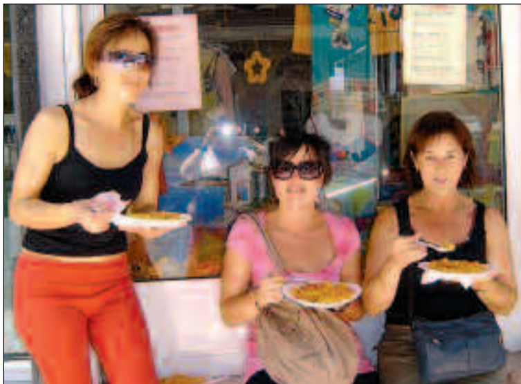
Cualquier sitio fue bueno para probar la paella