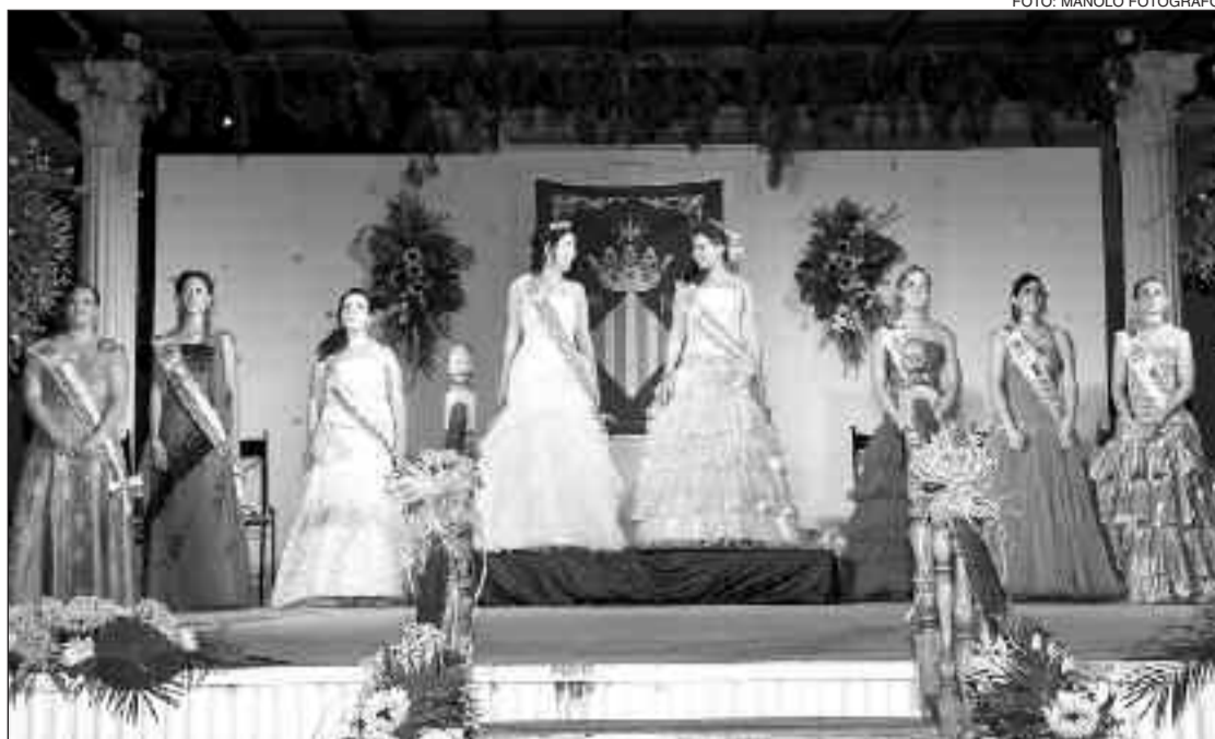
La Reina y damas de honor durante el acto de su proclamación en la Era del Teular

El corral dispone ahora de puertas correderas, barandillas de hierro, paredes más resistentes, un aseo y un almacén. Sólo falta colocar un mural de cerámica en la entrada.