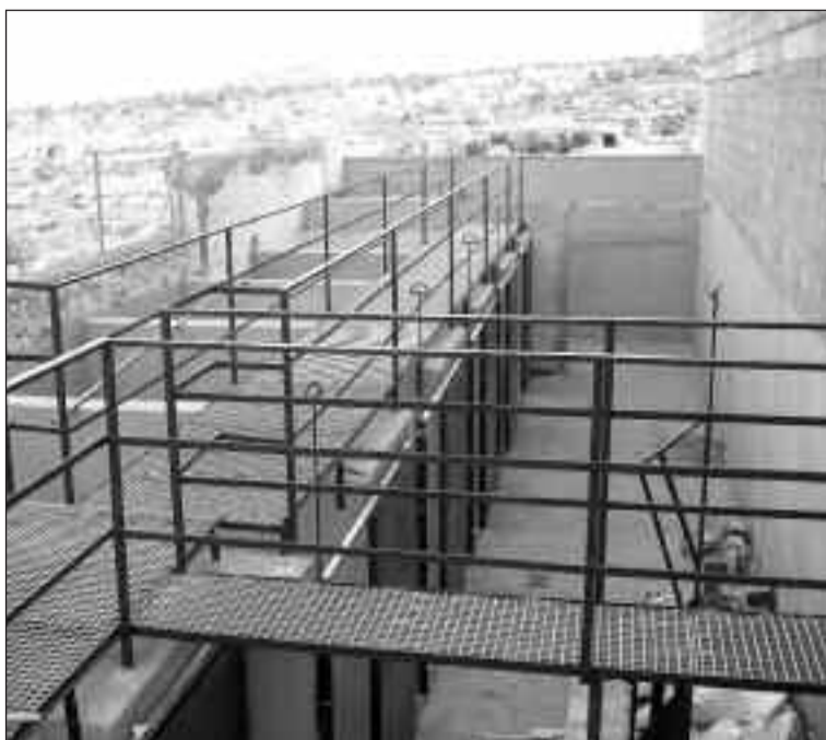
La reforma se inició hace unas semanas y está prácticamente terminada