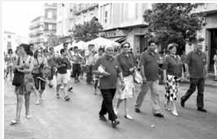
Después de la bendición, la comitiva regresó al barrio de San Cristóbal

xons fue, un año más, el protagonista de este acto. A continuación, se trasladó la imagen de San Cristóbal al barrio, acompañada de las autoridades, el CIMO y vecinos, donde se sirvió un refrigerio.