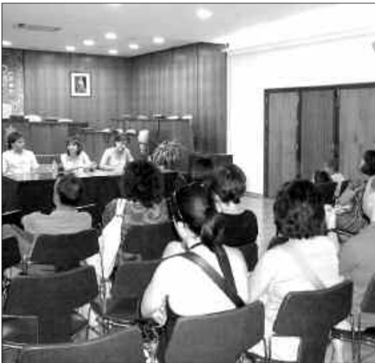
El constructor, la alcaldesa y la concejal de Educación, en la reunión con los padres del pasado miércoles