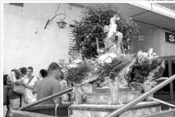
La imagen de San Cristóbal fue transportada en un vehículo