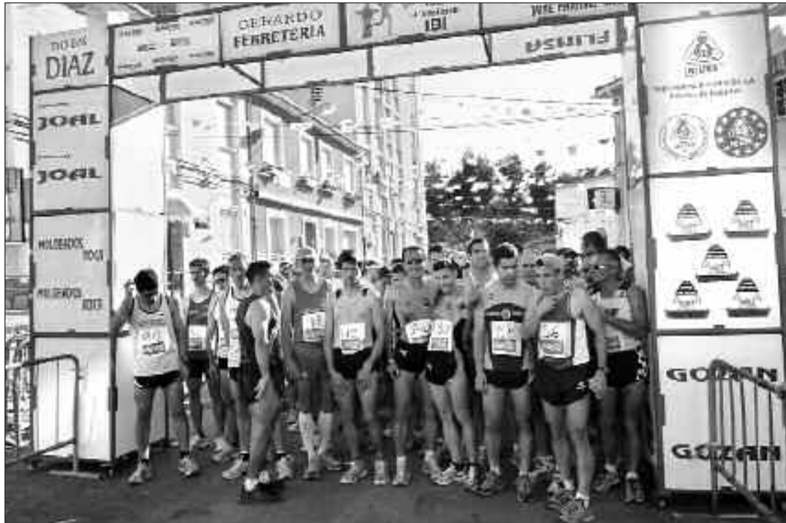
Los participantes se disponen a tomar la salida en la plaza de las Cortes de Cádiz (barrio de La Dulzura)

Con motivo de las fiestas del barrio de La Dulzura