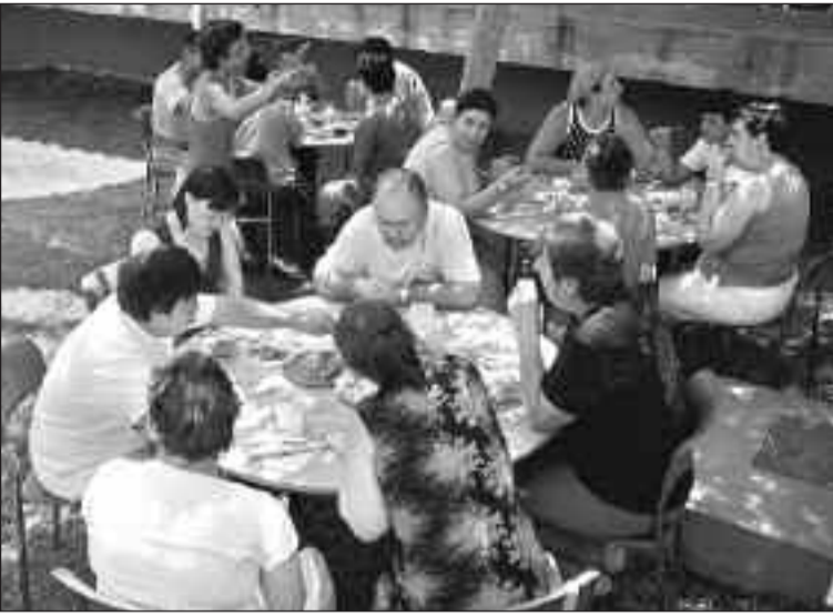
Los usuarios del centro ocupacional comieron en el jardín