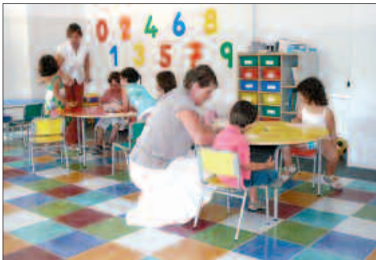
Los niños participan en talleres de diversa índole en inglés y español

Diecisiete niños se han matriculado en los cursos de verano del colegio bilingüe Muntori, que cuentan con diversos talleres, clases de repaso y natación en la piscina del centro, que está completamente instalada y operativa. Las actividades, en inglés y español, se desarrollan en horario de mañana y tarde y los alumnos comen en las instalaciones del colegio. Asimismo, ya está abierto el plazo de matrícula para el próximo curso.