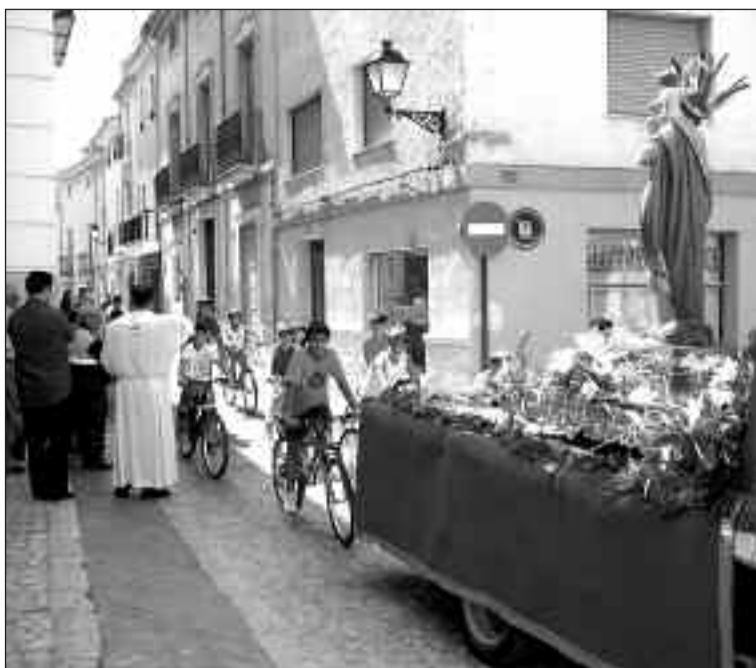
Llegada de la imagen del Patrón seguida por numerosos conductores