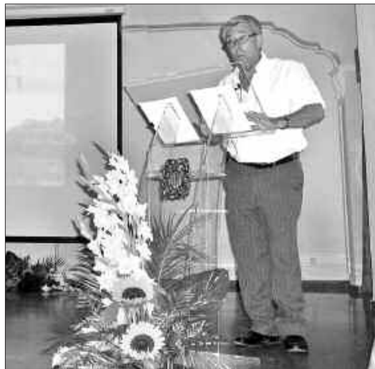
El autor durante la presentación del libro

El libro, que se vende a un precio de 12 euros, incluye también un CD con nueve tocatas interpretadas a xaramita y tambor.