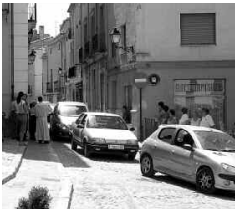
Los biarenses participan masivamente en este tradicional acto

Numerosa participación de vecinos en los actos celebrados el jueves con motivo de la fiesta de San Cristóbal