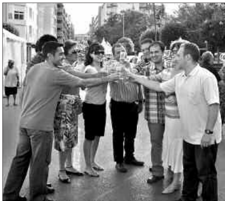
Alcaldesa y concejales brindan por el éxito de la primera edición