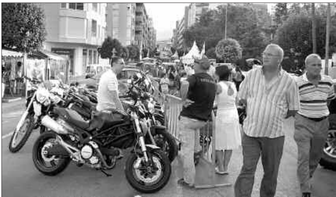
Cientos de personas visitaron la feria durante todo el fin de semana