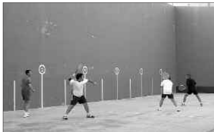
Una partida de frontenis durante las 24 Horas de Castalla