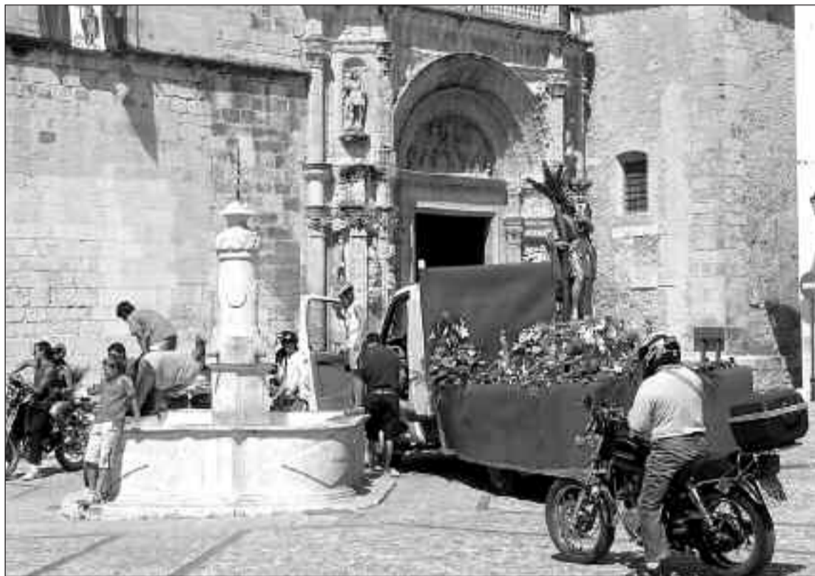
La imagen de San Cristóbal se deja en la plaza de la Constitución para presidir la bendición

A media mañana se inicia el regreso hacia la población también en forma de caravana que va presidida por la imagen de San Cristóbal. A esa hora son muchos los vecinos que se agregan a la fiesta, cogiendo