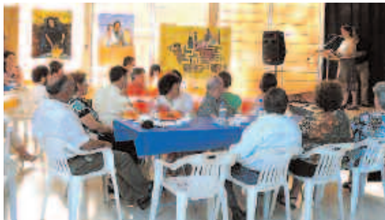
Un centenar de personas acudieron a este acto en el centro cultural de Ibi

Cerca de un centenar de personas acudieron a este encuentro, a pesar del calor que hizo durante la jornada del sábado, para escuchar poemas y cuentos escritos por autores saharauis, recopilados en un librito que algunos se llevaron a casa por