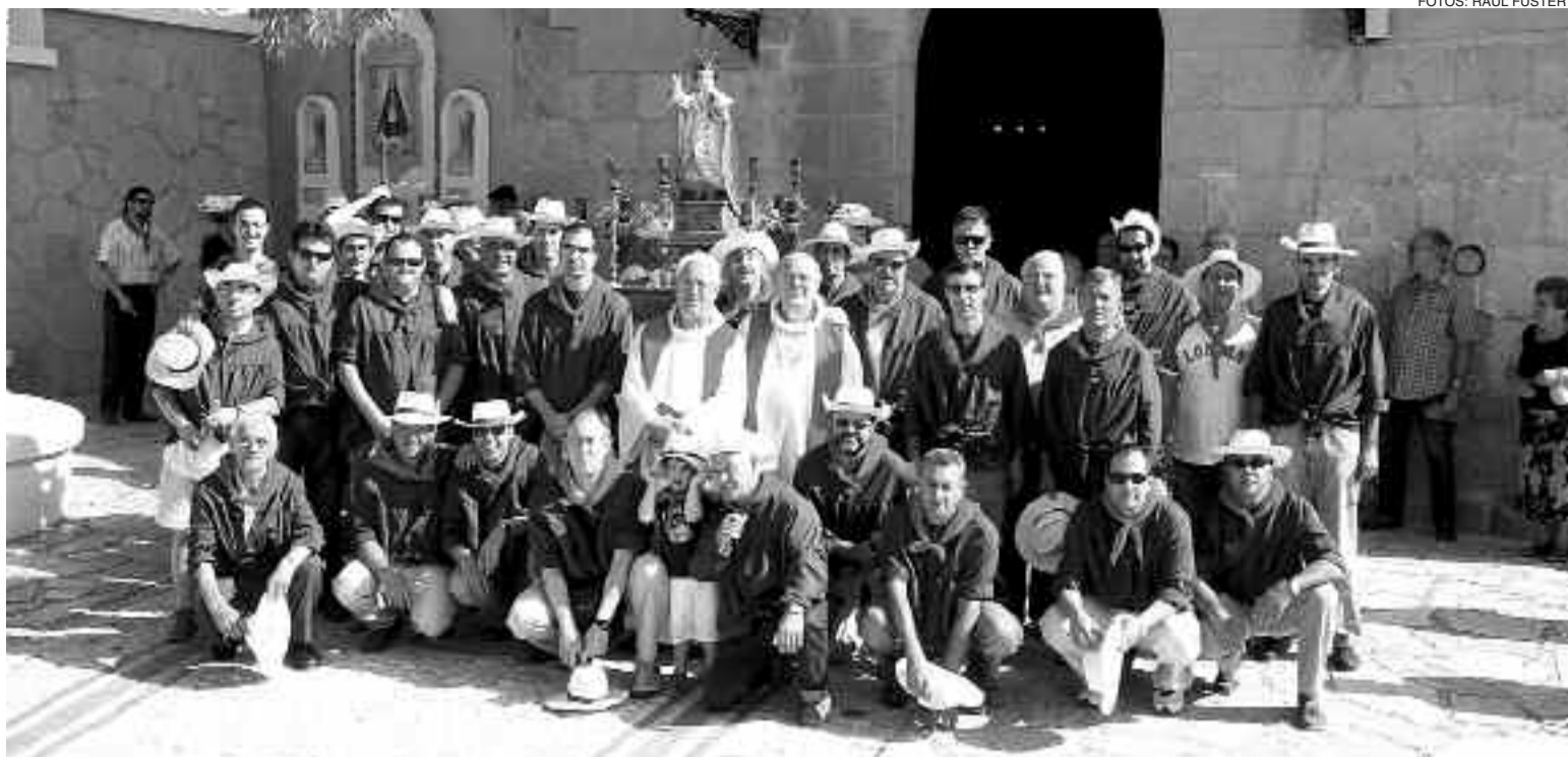
Miembros de la Cofradía de la Preciosísima Sangre de Jesús y los sacerdotes participantes, junto al Jesuset , a las puertas de la Ermita