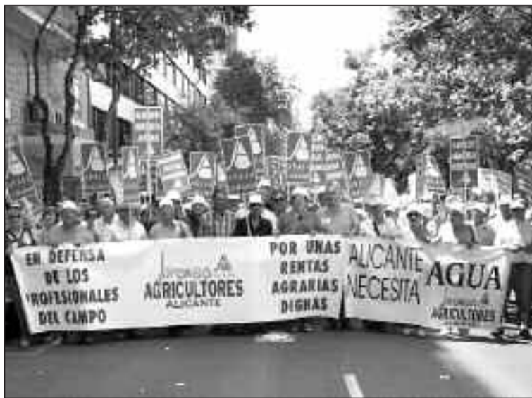
Los agricultores de la Foia se unieron a los de la provincia de Alicante