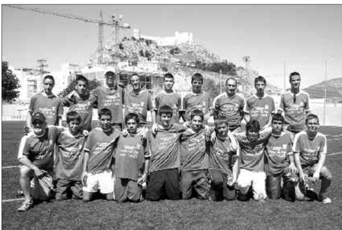
El equipo Infantil 'A' recibió un homenaje por haberse proclamado campeón de la liga 2007-08