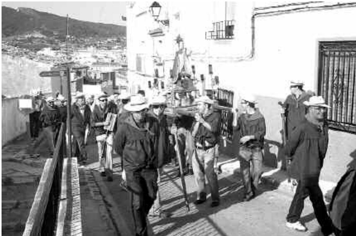
La imagen del Niño Jesús fue trasladada desde la Plaza Mayor hasta la Ermita de la Sang