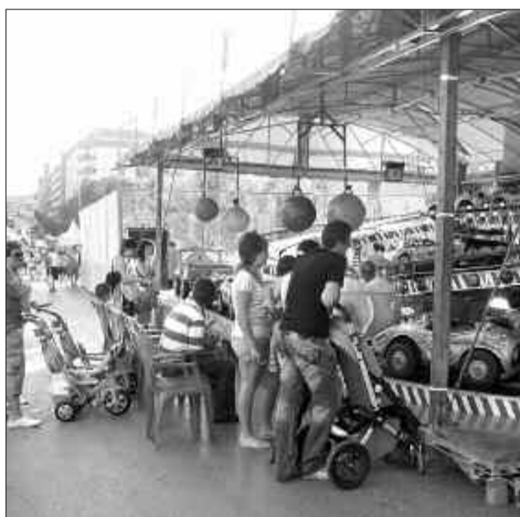
Se montaron algunas atracciones para los más pequeños

El viernes por la tarde, la alcaldesa inauguró la feria acompañada de numerosos concejales del PP y la portavoz socialista. Tras el corte de cinta, se dispararon dos tracas y los organizadores brindaron por el éxito de esta primera edición.