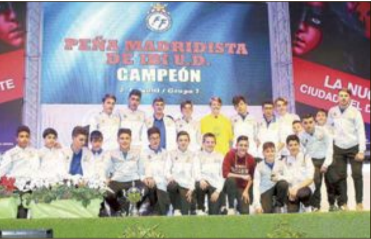
A la izquierda, el equipo Infantil y, a la izquierda, el cadete de la Peña Madridista de Ibi, con sus merecidos reconocimientos recogidos en La Nucía