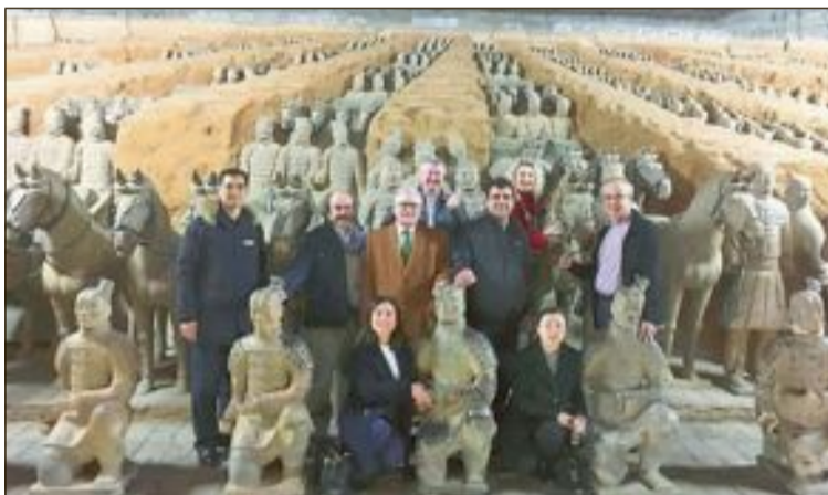
Una comitiva encapçalada pel diputat provincial de Cultura va visitar recentment el monumental mausoleu del primer emperador xinés, que alberga el conjunt dels Guerrers de Xian, format per més de 8.000 soldats de terracota

Les gestions per a que part d'esta excepcional col·lecció conforme la pròxima exposició internacional del Marq, l'any que ve, estan arribant a la seua fi. Després de la productiva visita a Xina d'una delegació alacantina encapçalada pel diputat de Cultura, el procés està únicament a