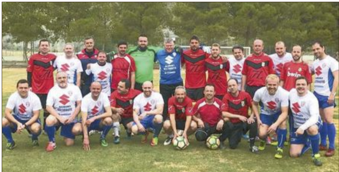
Los jugadores de los equipos veteranos de Partaloa e Ibi que disfrutaron de una gran jornada el sábado 3 de marzo