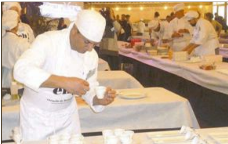
Imagen de archivo de la fase final del certamen GastroCastalla, en enero

Durante la gala se comunicará el nombre de los proyectos ganadores del programa Castalla Emprende, una iniciativa que ha contado en esta primera edición con 52 inscritos, de los que ocho llegaron a la final y presentaron sus proyectos ante un jurado formado por expertos. El programa Castalla Emprende se enmarca en Emprende UMH, la red de aceleradoras públicas de la provincia de Alicante.