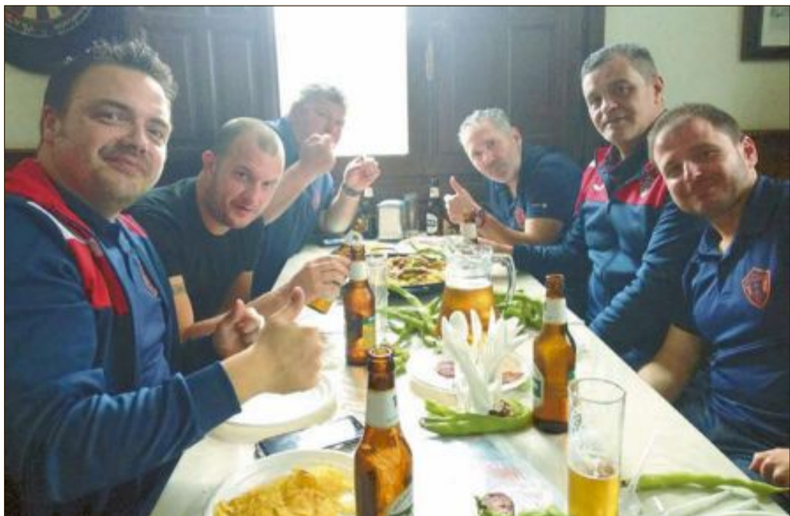
Después del partido, los jugadores de ambos equipos participaron en una succulenta comida de hermandad