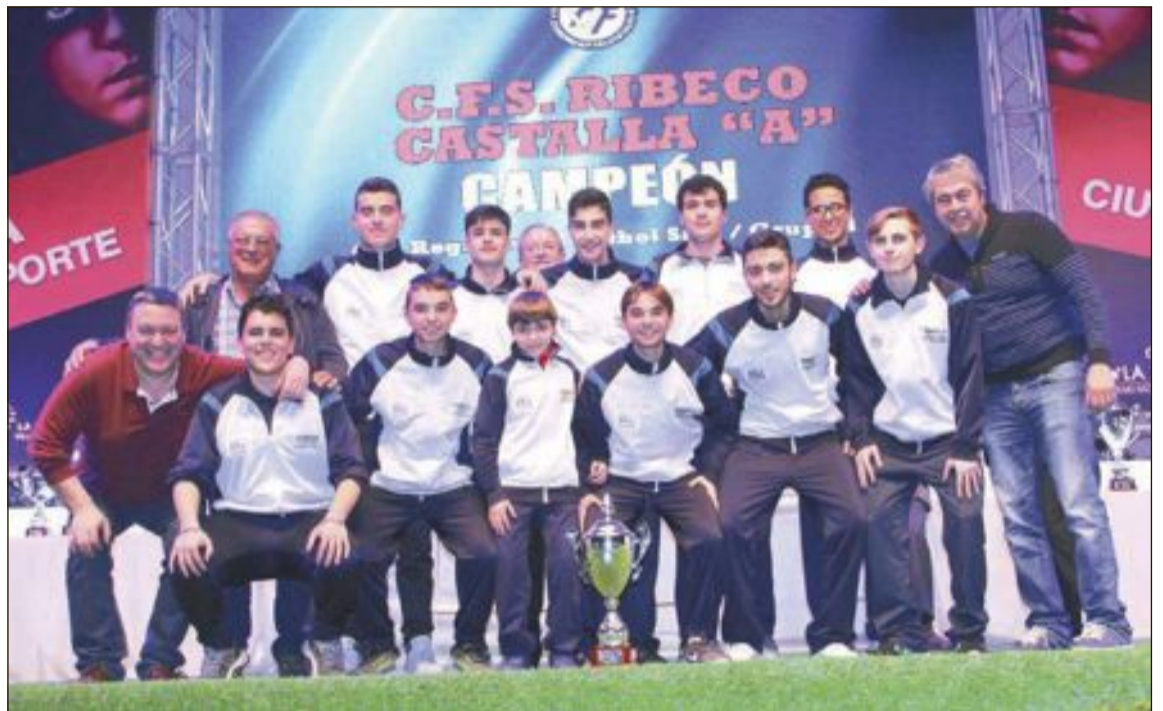
Jugadores, técnicos y directivos del CFS Ribeco Castalla se desplazaron el viernes 9 de marzo a La Nucía para recoger el trofeo de campeones de la liga 2016/2017