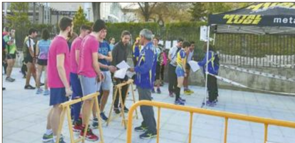
Los jóvenes orientadores reciben instrucciones de sus monitores en el Parque Municipal