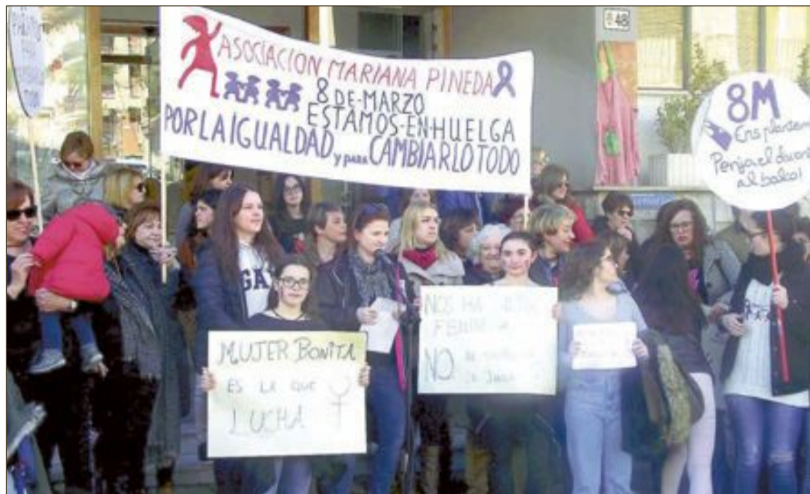
Concentración de mujeres el pasado 8 de marzo en la puerta del Ayuntamiento de Ibi

Todas las mujeres interesadas en participar tienen que realizar la inscripción en el mostrador de la piscina cubierta. Las inscripciones se abrirán el martes 20 de marzo, a partir de las 16 horas. Las plazas son limitadas y se adjudicarán por riguroso orden de inscripción. Una vez completadas todas las vacantes se abrirá una lista de espera. Las plazas de autobús estarán reservadas únicamente para las participantes de la carrera inscritas