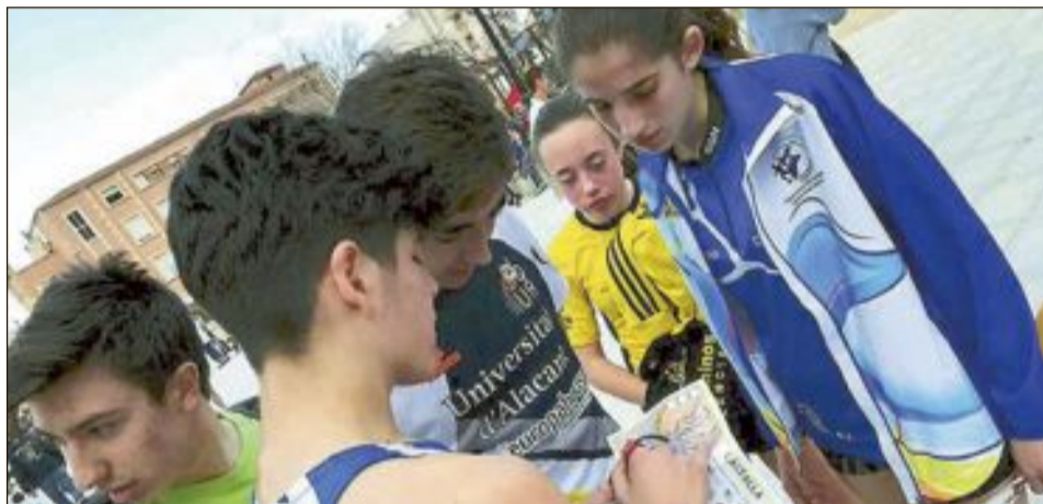
En ambas pruebas participaron deportistas de distintos puntos de la Comunidad Valenciana