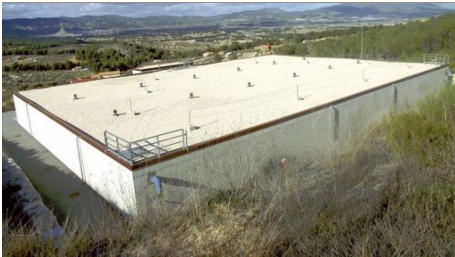
El depósito de la Espartosa, con 5.000 metros cúbicos de capacidad, comenzó a construirse el 23 de junio de 2014, mes y medio después de ser adjudicado

sentencia obligaría a eliminar la subida del 8% en el recibo del agua que soportan actualmente los vecinos del municipio, si bien el Ayuntamiento tendría que hacerse cargo del pago a la concesionaria del importe restante de las obras del depósito, puesto que las instalaciones están actualmente en funcionamiento y se podría acusar al Consistorio de enriquecimiento ilícito.