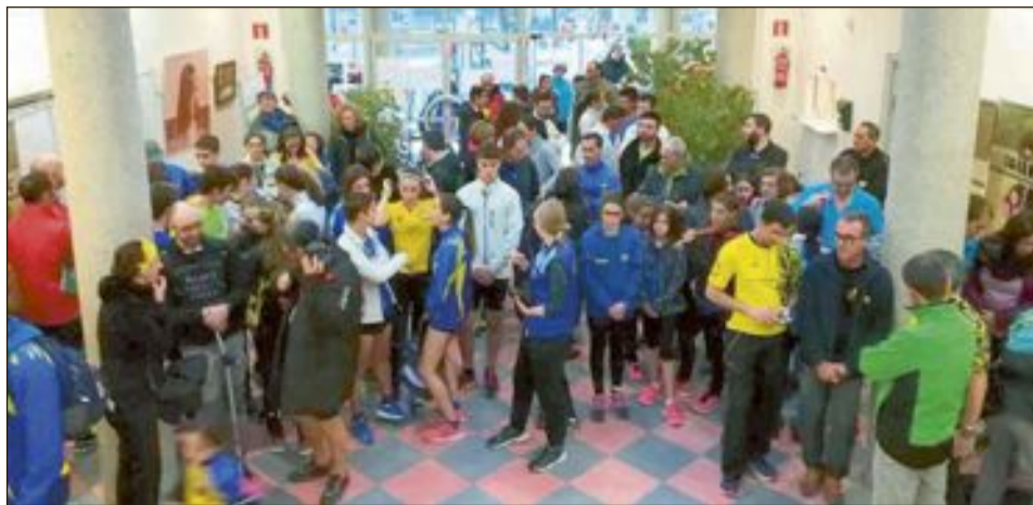
Los participantes se congregaron en la Casa de Cultura para la entrega de premios