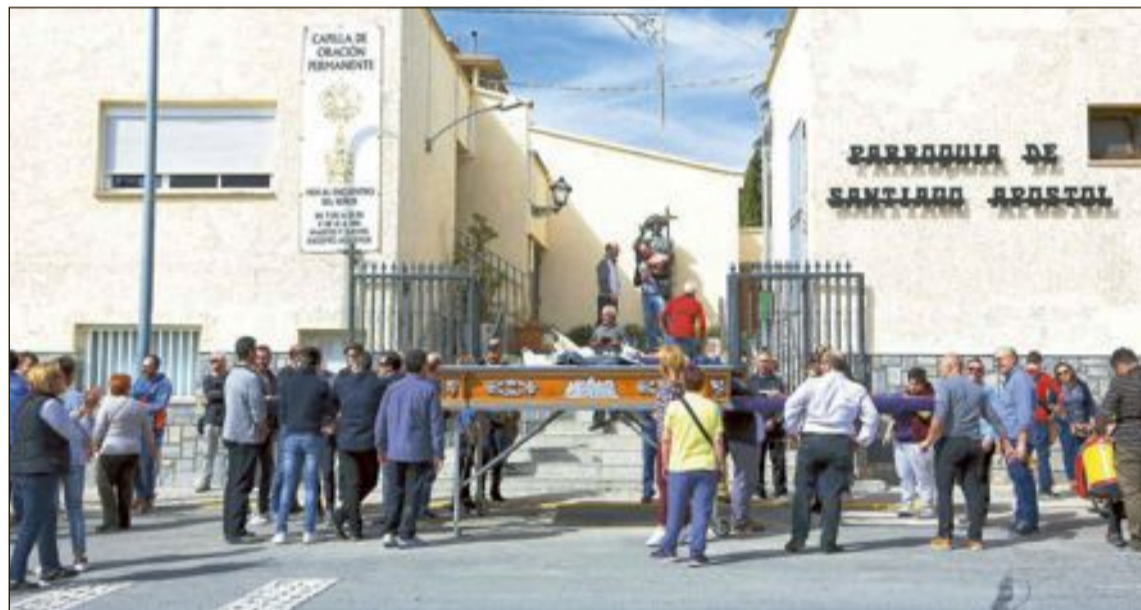
El ensayo de las cofradías comenzará a las 10:30 horas y durante el recorrido recogerán alimentos para Cáritas

El domingo 18 de marzo, la junta local de Cofradías de Semana Santa ha organizado el tercer ensayo solidario, a beneficio de Cáritas. Las cofradías sacarán las andas y recorrerán las calles Salvador, Castalla, el Riu, Manuel de Falla, Pablo Sorozábal, Camino Viejo de Onil, Comunidad Valenciana, Maestro Chapí, Granados, Óscar Esplá, Balaguer, Manuel de Falla Avd, Paz, Espronceda y Quevedo, recogiendo los alimentos que la gente vaya donando.