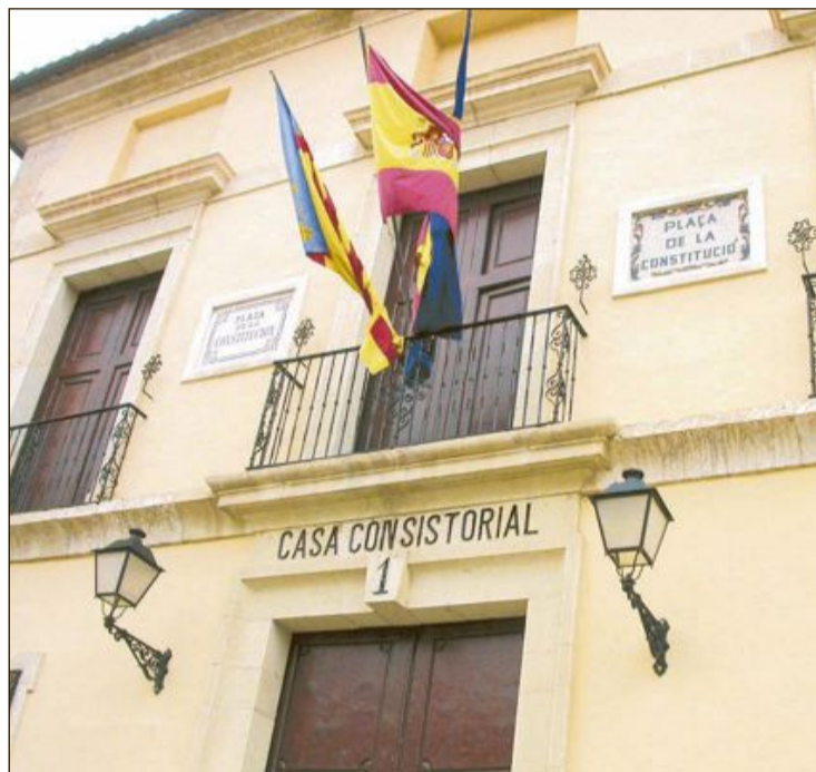
La declaració es va aprovar per unanimitat en el plenari del 28 de febrer