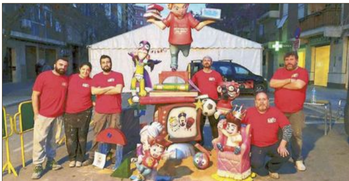
Los artistas de Art de Foc, con uno de sus monumentos falleros, tras el primer día de plantà