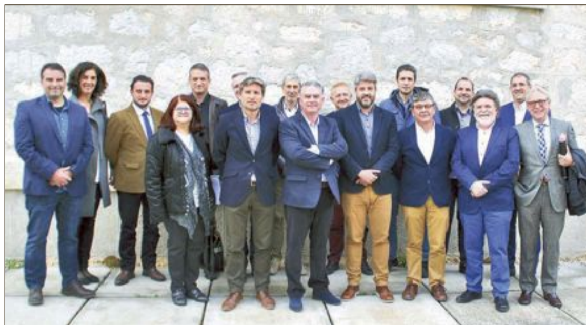
Los miembros de la Plataforma celebraron el 13 de marzo su asamblea anual en Alcoy

Una de las cuestiones que más se subrayó, por su indudable importancia, fue el impacto que ha tenido el proyecto AIC (Áreas Industriales de Calidad), que ha permitido impulsar las ayudas a las mejoras de los polígonos de las zonas de influencia