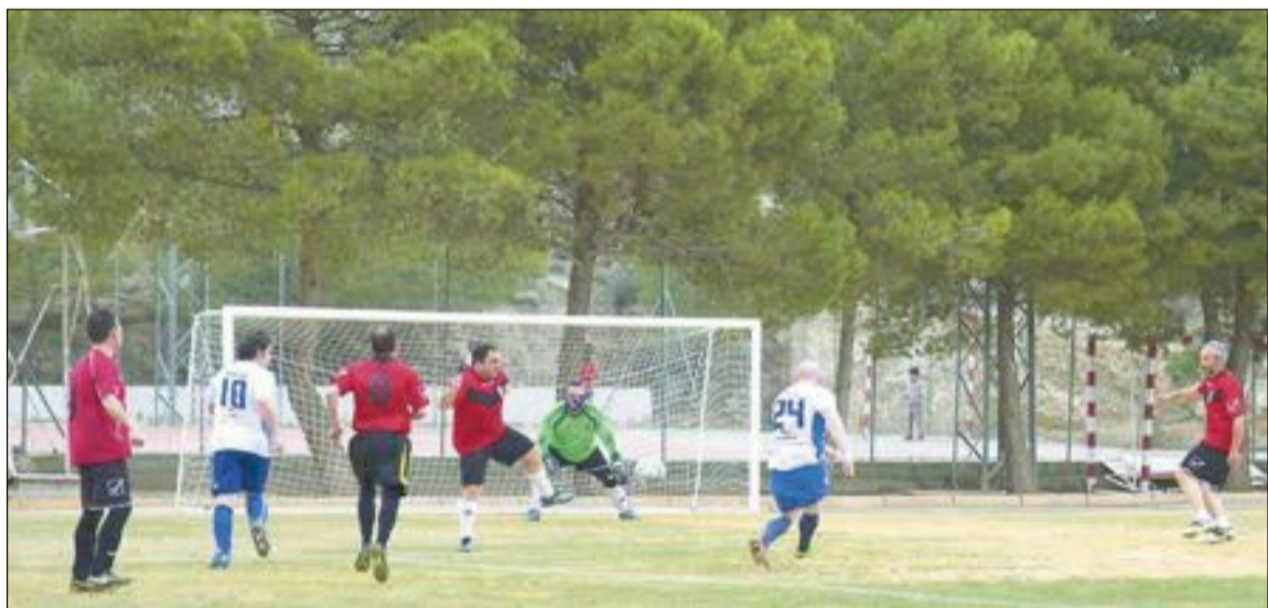
El partido entre los equipos veteranos de Partaloa e Ibi se disputó en el estadio de esta localidad almeriense