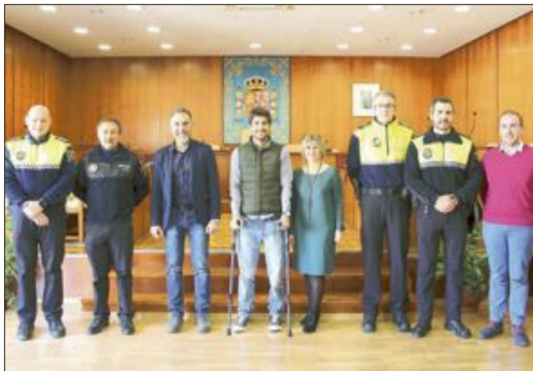
La toma de posesión tuvo lugar el 9 de marzo con la asistencia de alcalde y concejales de las áreas