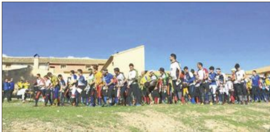
La jornada del domingo 11 de marzo se disputó en el entorno natural del Pla de les Caves