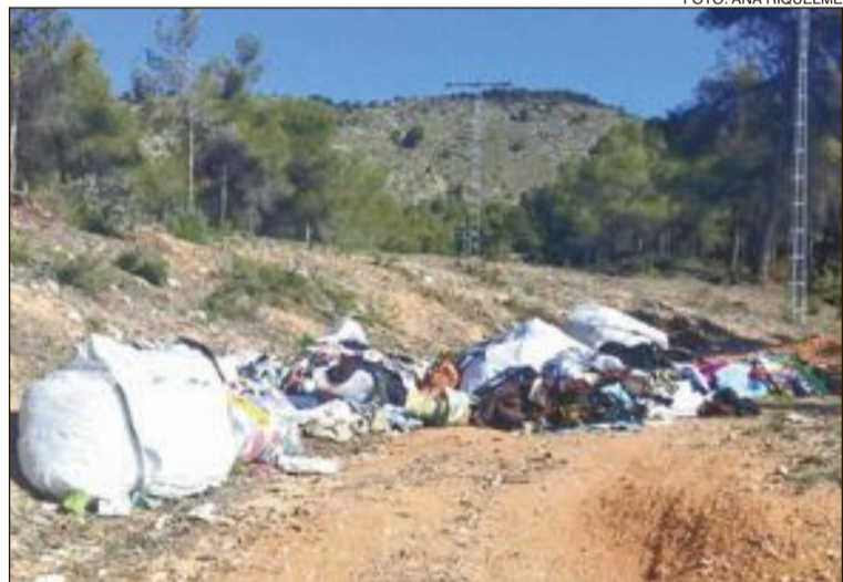
Los fardos de ropa que aparecieron el sábado 10 de marzo en las inmediaciones de la finca Serafines