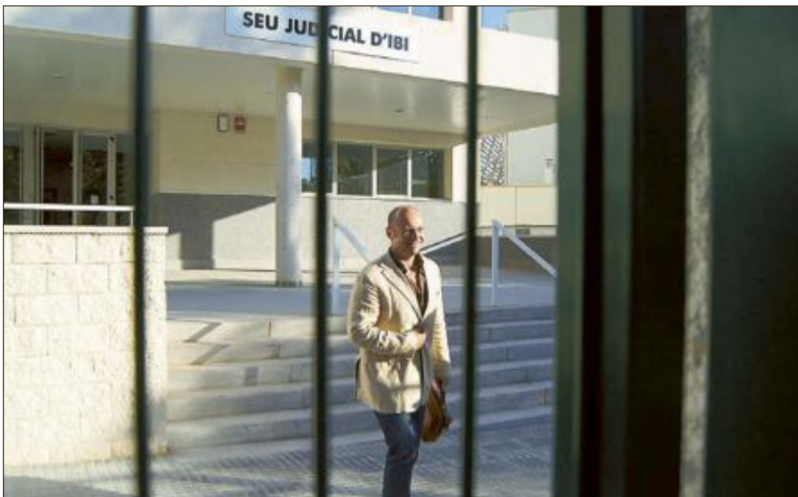
En 2015 cuando se creó la UACC, en los juzgados de Ibi se instruían veinte casos sobre corrupción política

En el informe que emitió entonces la Jueza Decana al TSJCV, se hacía constar la necesidad de crear una Fiscalía para Ibi y dotar de personal también al registro civil.