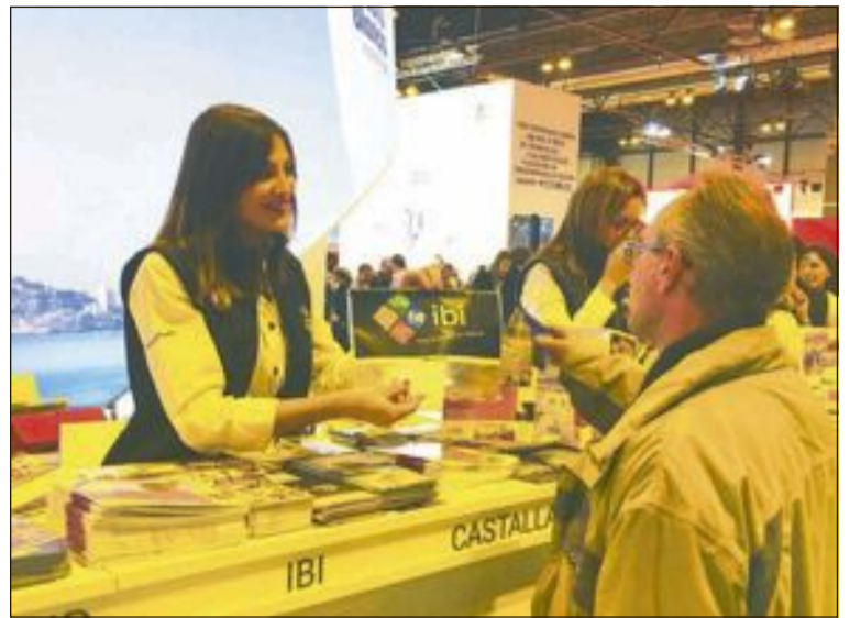
La técnica de Turismo en la pasada edición de la feria de Fitur

Briet aprovechó su estancia en Ibi para visitar las obras del centro Sanchis Banús, las cuales se espera que estén finalizadas para el mes de junio.