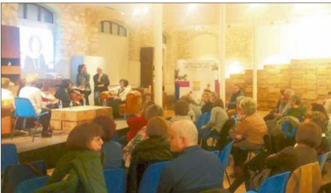
La exposición, que se inaugura próximamente, se presentó en el café-tertulia, celebrado el viernes 9 de marzo en el Museo del Juguete, donde asistieron muchas mujeres integrantes de los colectivos a los que se rinde homenaje

en calidad de miembros del foro ciudadano Urbact, creado a comienzos de 2017.