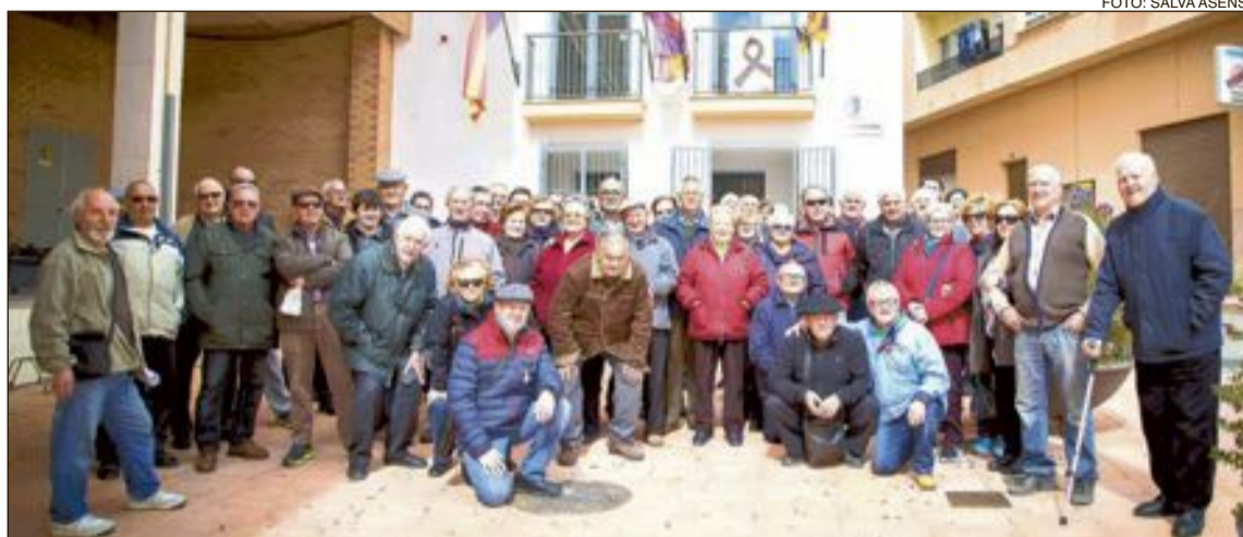
Alrededor de setenta personas participaron en la concentración celebrada en Onil el lunes 12 de marzo; el Ayuntamiento se sumó a la protesta colgando el lazo de la plataforma en uno de los balcones

La plataforma Pensionistas de España por su Dignidad volvió a celebrar, el lunes 12 de marzo, una concentración pacífica ante las puertas del Ayuntamiento, que fue respaldada por unas setenta personas, en señal de protesta por la ínfima subida de sus pensiones por parte del Gobierno central, que provoca la paulatina pérdida de poder adquisitivo en un colectivo tan vulnerable como es la tercera edad. Los organizadores han convocado una nueva concentración para el sábado 17, Día de La Volta, por lo que esperan el apoyo de festeros, vecinos y visitantes.