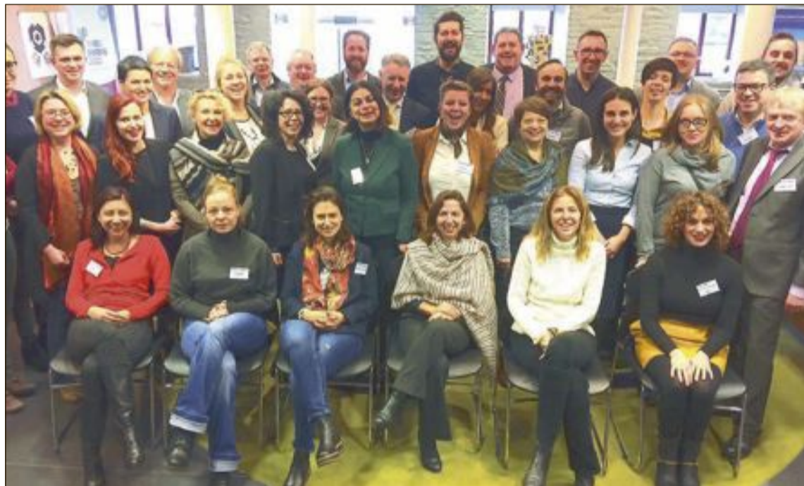
Los socios de Ibi en la red Creative Spirits son de: Budapest (Hungría), Sofía (Bulgaria), Ravenna (Italia), Loulé (Portugal), Waterford (Irlanda), Lublin (Polonia), Kaunas (Lituania) y Maribor (Eslovenia)

nado por el área de Urbanismo, cuenta con el apoyo y la colaboración de diferentes departamen-