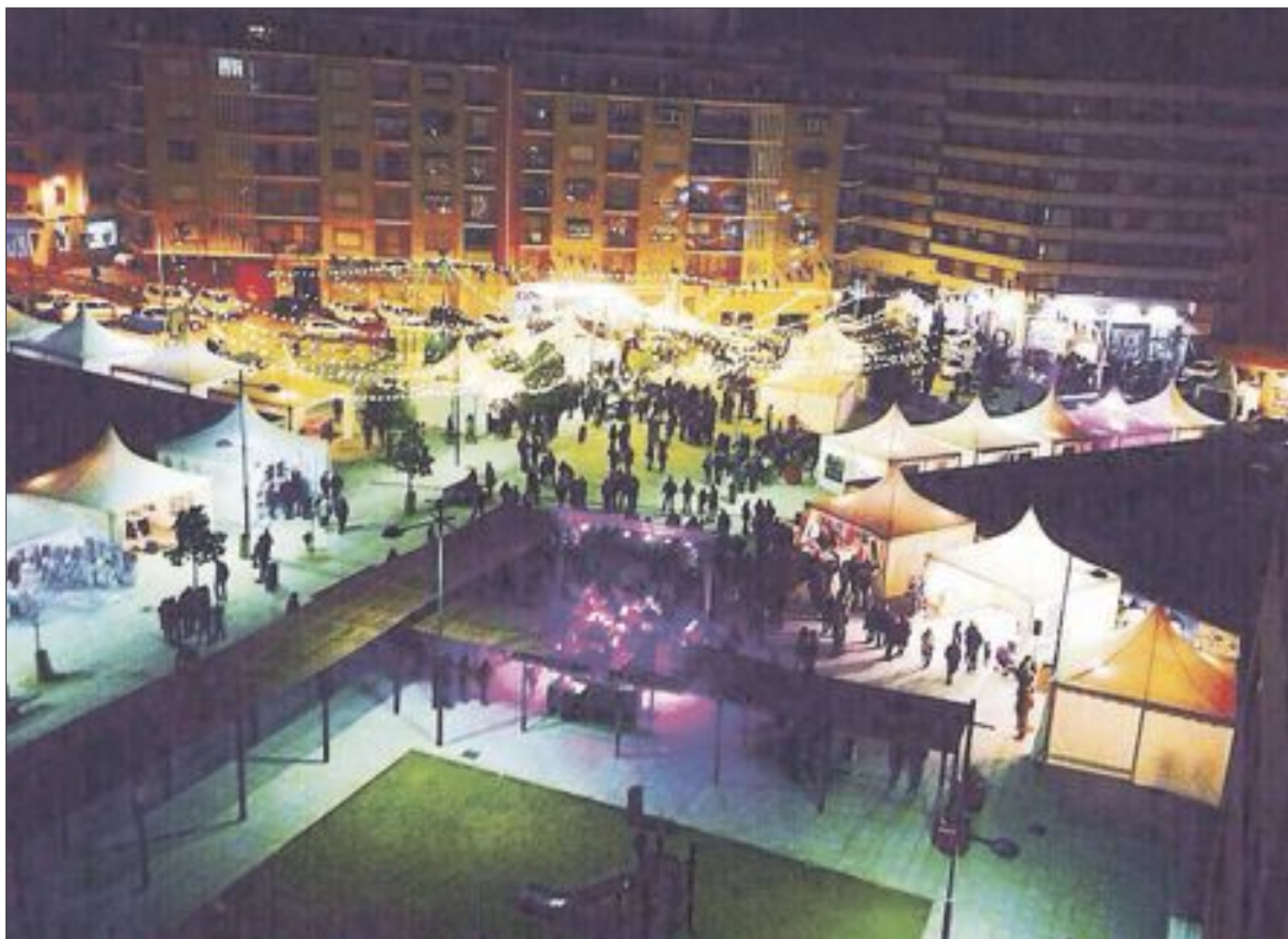
Espectacular vista nocturna de las carpas montadas en la plaza de la Libertad