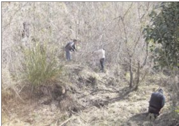
Con el programa Ezonai se recibió una subvención de 29.600 euros