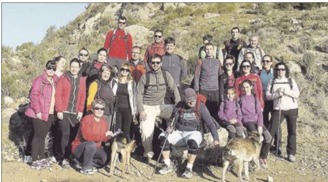
La primera marcha del Club d'esports de muntanya i escalada Tibi se organizó el domingo 15 de marzo