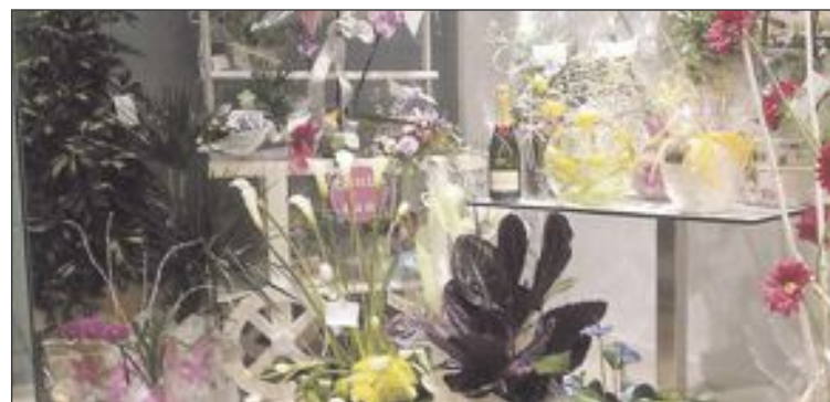
Regalos (en su mayoría, flores) que clientes y amigos de L'Aplec regalaron a su gerente, Paco Siles, el día de la reapertura

Con esta nueva imagen y su amplia oferta en comidas y bebidas, el éxito de L'Aplec está asegurado por muchos años más.