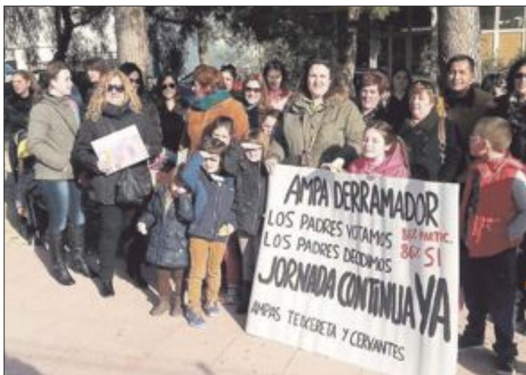
En el colegio Derramador mostraron los resultados de la votación