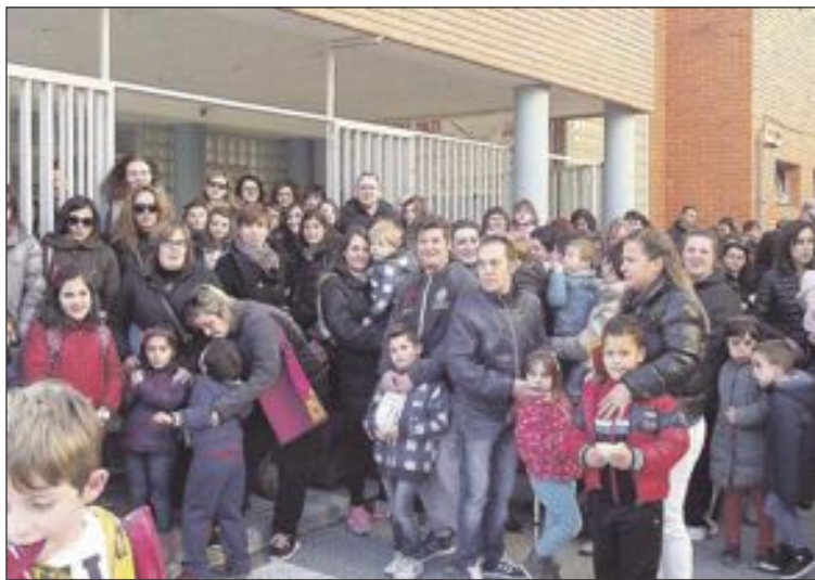
Concentración de padres de alumnos en el colegio Teixereta

Ahora mismo, las negociaciones están estancadas y todo hace prever que no dará tiempo a su aprobación para el próximo curso. La opción a la que podría volver a acogerse la Administración es ampliar una vez más el número de centros pilotos.