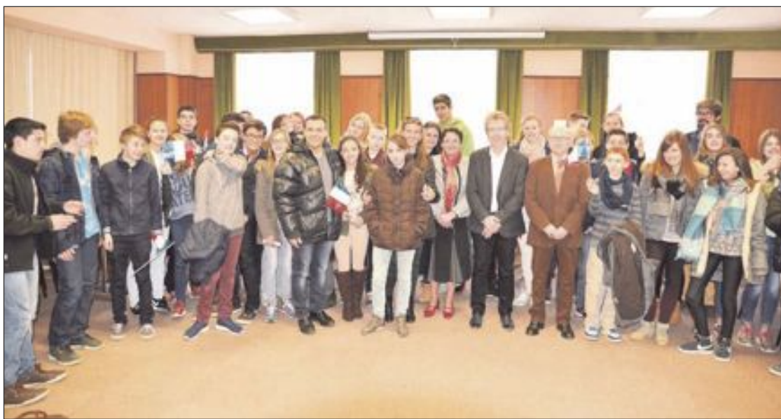
El viaje tuvo una duración de siete días y realizaron diversas visitas culturales