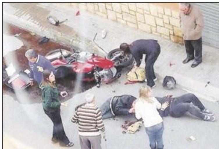
Los ocupantes de la motocicleta sufrieron daños de diversa consideración