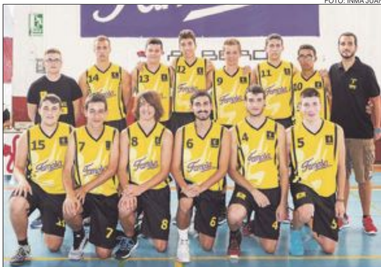
El CD Onil Júnior Masculino está realizando una irregular campaña

marcador de principio a fin y, aunque en ataque jugaron bien, no tuvieron el día cara aro, ya que fallaron canastas fáciles que no suelen fallar. Ese aspecto