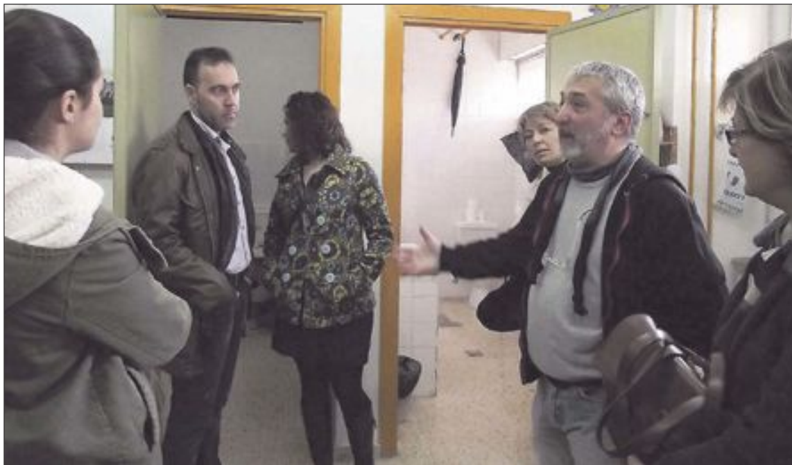
El centro lleva años reivindicando su adecuación ya que asisten 60 alumnos cuando tiene capacidad para veinte

El nuevo edificio tendrá tres aulas para alumnos de ciclo A (de 3 a 8 años), otras tres, para alumnos de ciclo B (de 9 a 16 años) y dos, para alumnos de ciclo C (de 17 a 21 años). También contará con una sala de usos múltiples, salas de rehabilitación e hidroterapia, un comedor y la vivienda del conserje. Estas dos últimas estancias serán demolidas para crear otras nuevas.