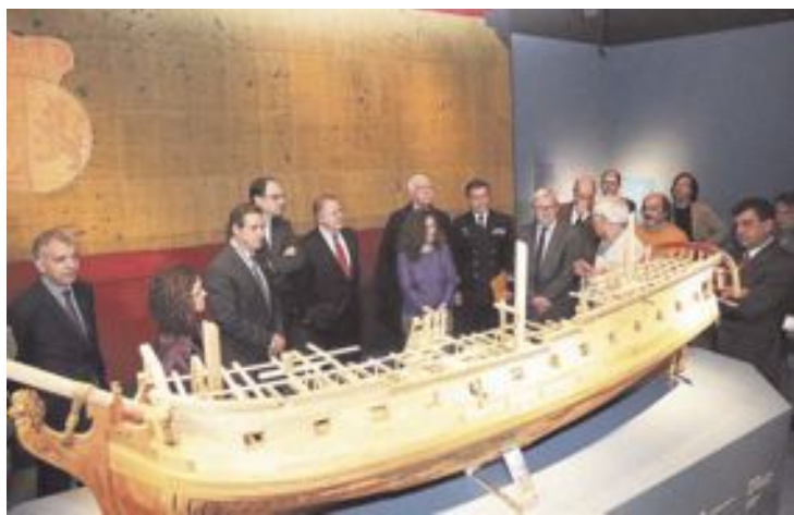
La exposición cuenta con una miniatura de la fragata Mercedes