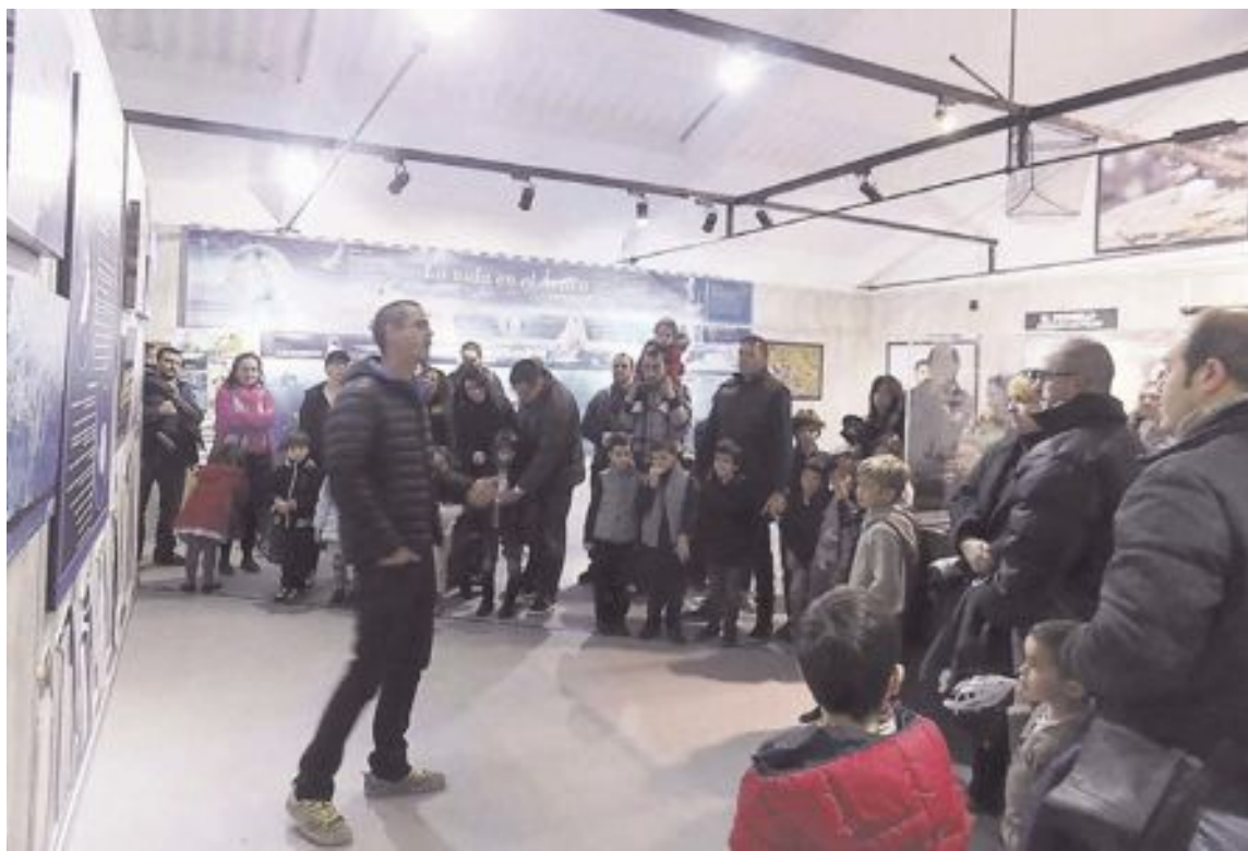
Una de las actividades programadas durante la exposición temporal 'Un viaje a los polos. Un mundo en peligro'