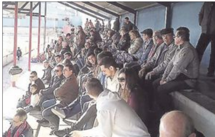
Las gradas del Vilaplana Mariel mostraron este aspecto la pasada jornada