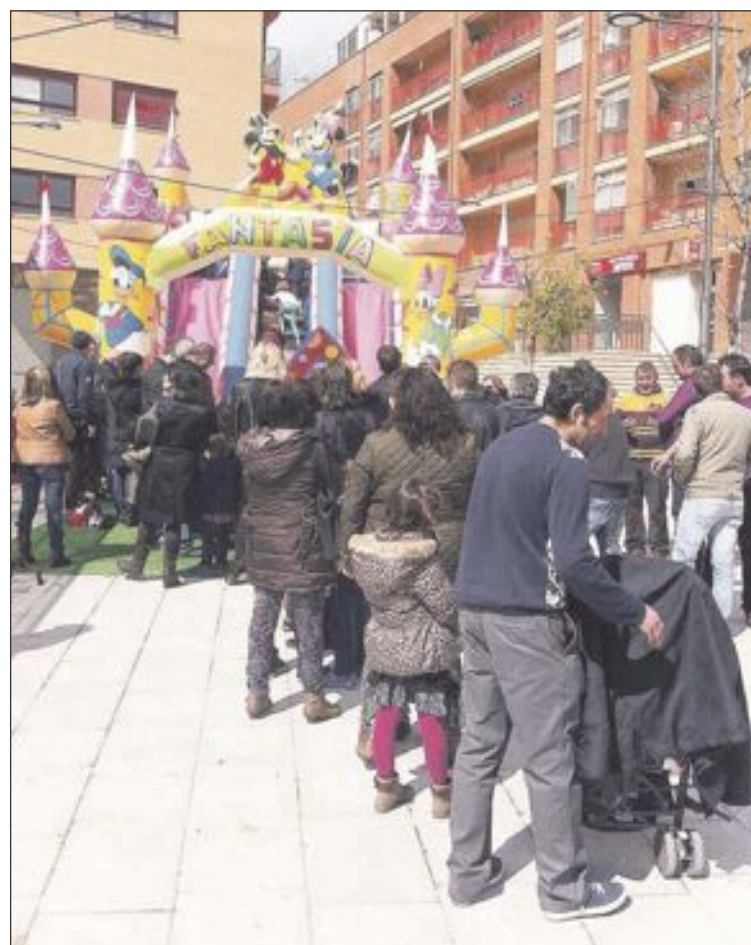
Atracciones para los más pequeños durante la jornada matinal