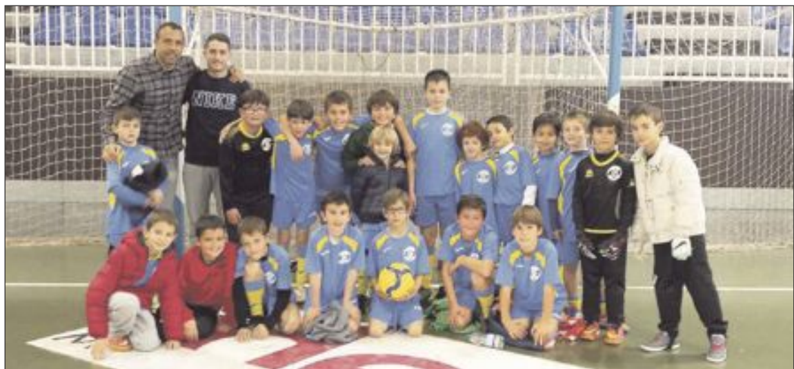
Jugadores y entrenadores de un equipo del Club Salesianos Ibi, en el pabellón 1 del Polideportivo Derramador

del portero del Petrer, con dos paradas antológicas, privaron al equipo Prebenjamín de cosechar una nueva victoria y, pese al resultado, 0 a 0, el partido tuvo muchas ocasiones y fue muy