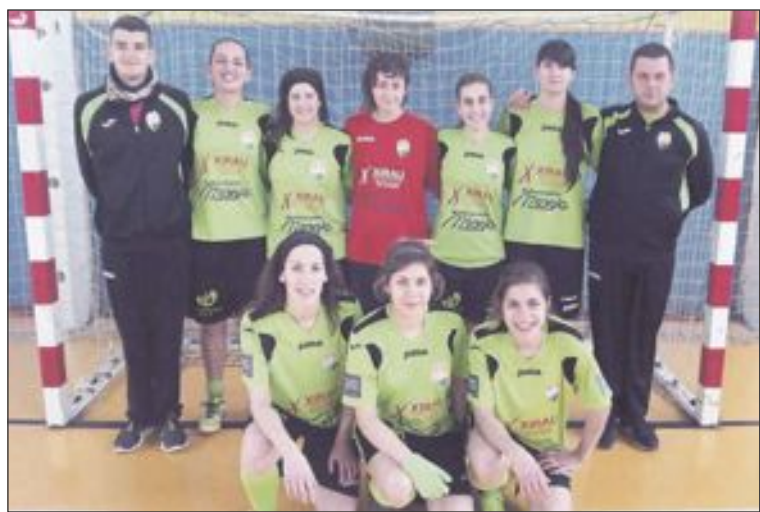
Equipo Futsal Ibi Sénior Femenino

Así finalizaría el partido, con un contundente 3-9 pero con un positivo ritmo de juego, que ilusiona sobremedida a las jóvenes ibenses para afrontar los siguientes partidos.