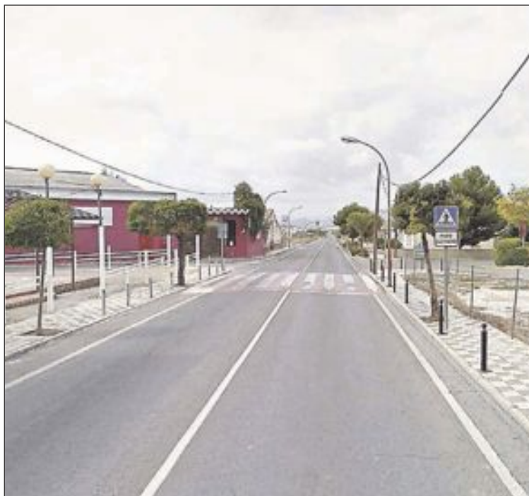
Paso de peatones donde se produjo el accidente

La Policía Local practicó el atestado, que se ha remitido al juzgado de Villena. Los familiares de la víctima han presentado ya una denuncia contra el conductor y el seguro y estudian interponer otra contra la Policía por no haber sido informados de las diligencias llevadas a cabo.