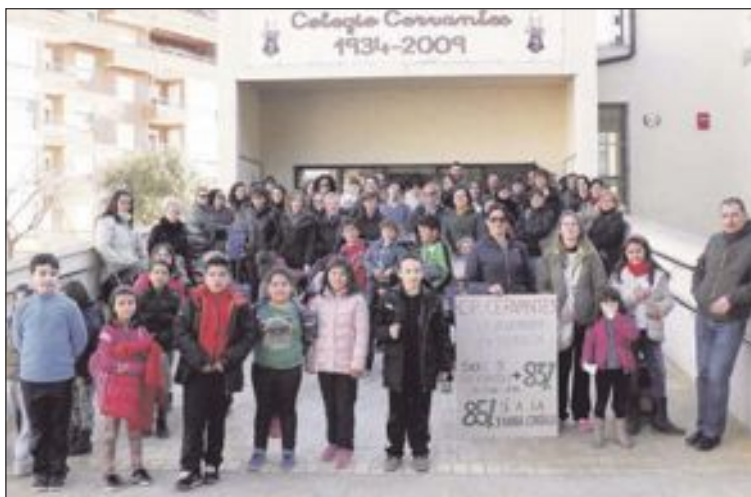
Concentración en el colegio Cervantes

La Conselleria anuncia que no autorizará en más centros la jornada continua para el curso que viene