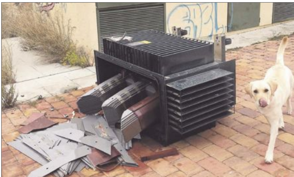
Iberdrola calcula que el valor de los cables robados asciende a unos cien euros