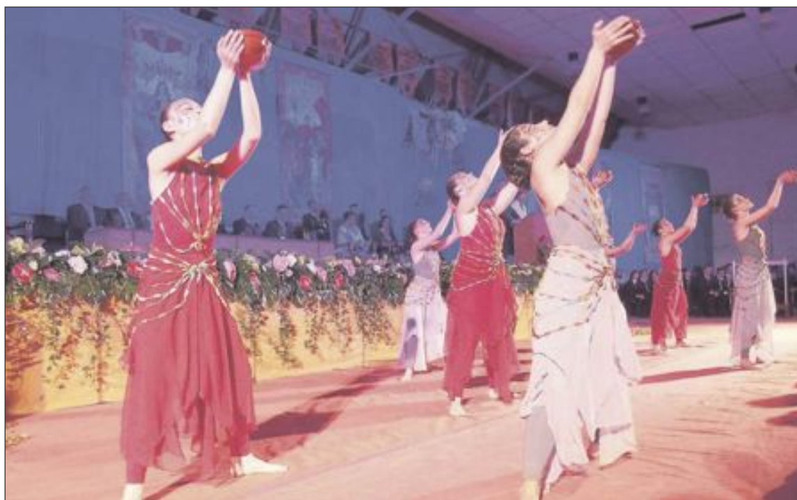
El acto contó con varias intervenciones artísticas