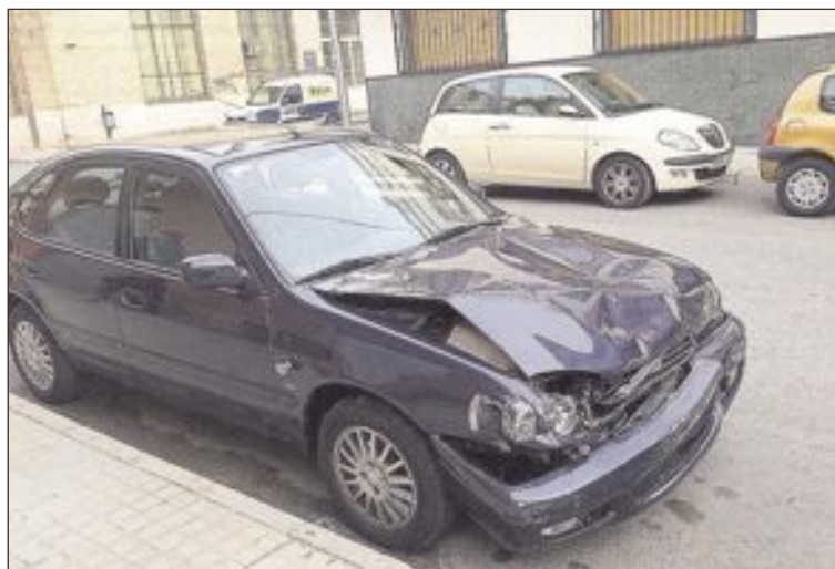
Estado en el que quedó el coche tras el accidente

La colisión se produjo a las 16,50 horas, al saltarse la señal de stop el vehículo que circulaba por Manuel de Falla. Como consecuencia del impacto, el conductor de la moto sufre rotura del tobillo y deberá ser, presumiblemente, intervenido. Su hija, la acompañante, resultó con diversas contusiones.