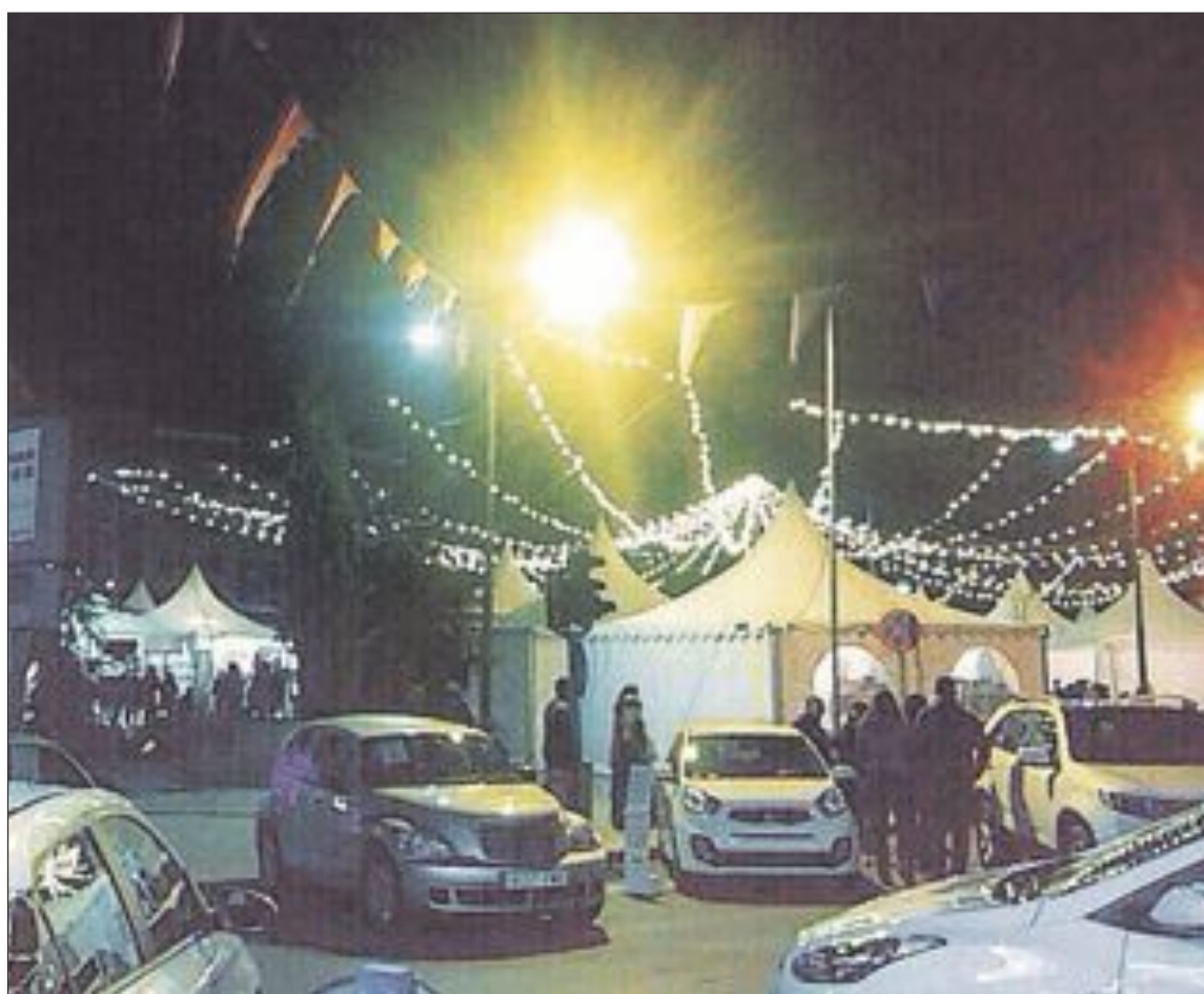
Cuatro concesionarios de Ibi ofrecieron vehículos nuevos y de ocasión