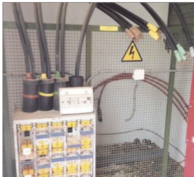
Los autores del robo también rompieron las cajas del alumbrado público

El suceso se produjo la madrugada del miércoles 18 de marzo