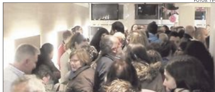
A la derecha, nueva entrada de Cerveceria L'Aplec; a la izquierda, una gran multitud de vecinos de Onil no quiso perderse la reapertura del local