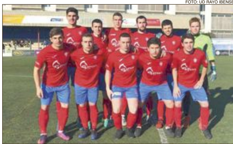
Varios jugadores del Rayo Ibense 'B'

Por otro lado, el equipo filial se impuso al Villena 'B', el martes 27 de marzo a domicilio, por