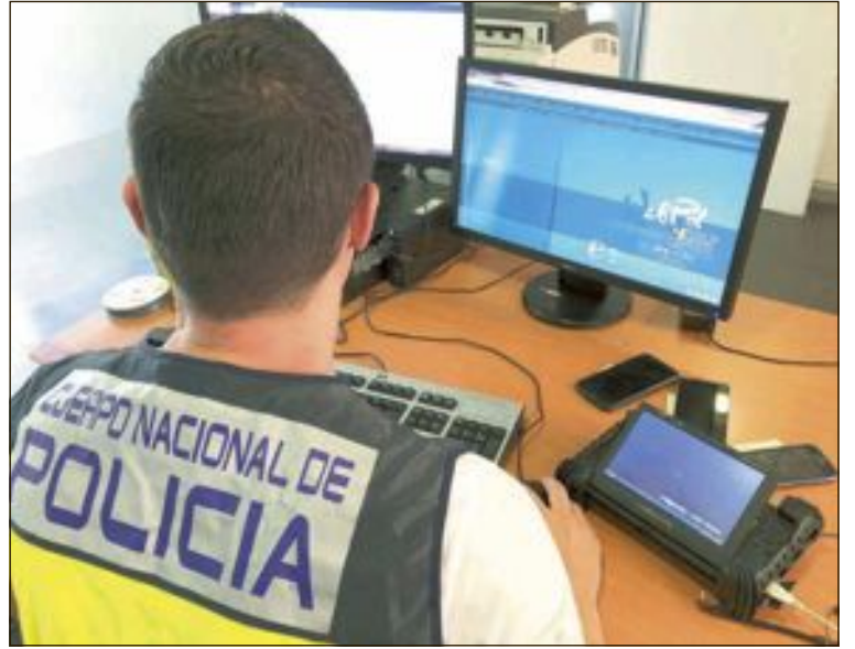
El caso ha sido resuelto por el grupo de Delitos Tecnológicos, especializado en la investigación de delitos cometidos a través de internet

Ante la gravedad del asunto, los agentes valoraron el riesgo de la víctima, quien solicitó una orden de protección y alejamiento del detenido por tratarse de una víctima de violencia de género. El grupo de protección de la UFAM, Unidad de Atención a la Familia y la Mujer, se ha encargado de llevar a cabo los trámites para asegurar la protección integral de la mujer.