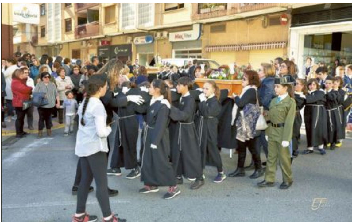
La procesión infantil tuvo lugar el miércoles 28 de marzo y salió desde la parroquia de Santiago Apóstol