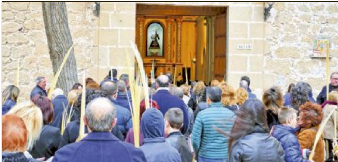
La bendición de ramos tuvo lugar en el Convento; posteriormente se ofició una misa en la Iglesia parroquial