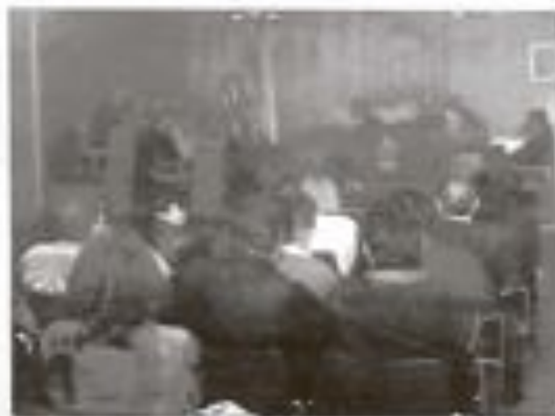
El Ayuntamiento de Ibi debate los Presupuestos del '95

Alrededor de 1.000 millones de pesetas es el monto de los Presupuestos Generales del Ayuntamiento de Ibi para 1995, año de elecciones municipales.