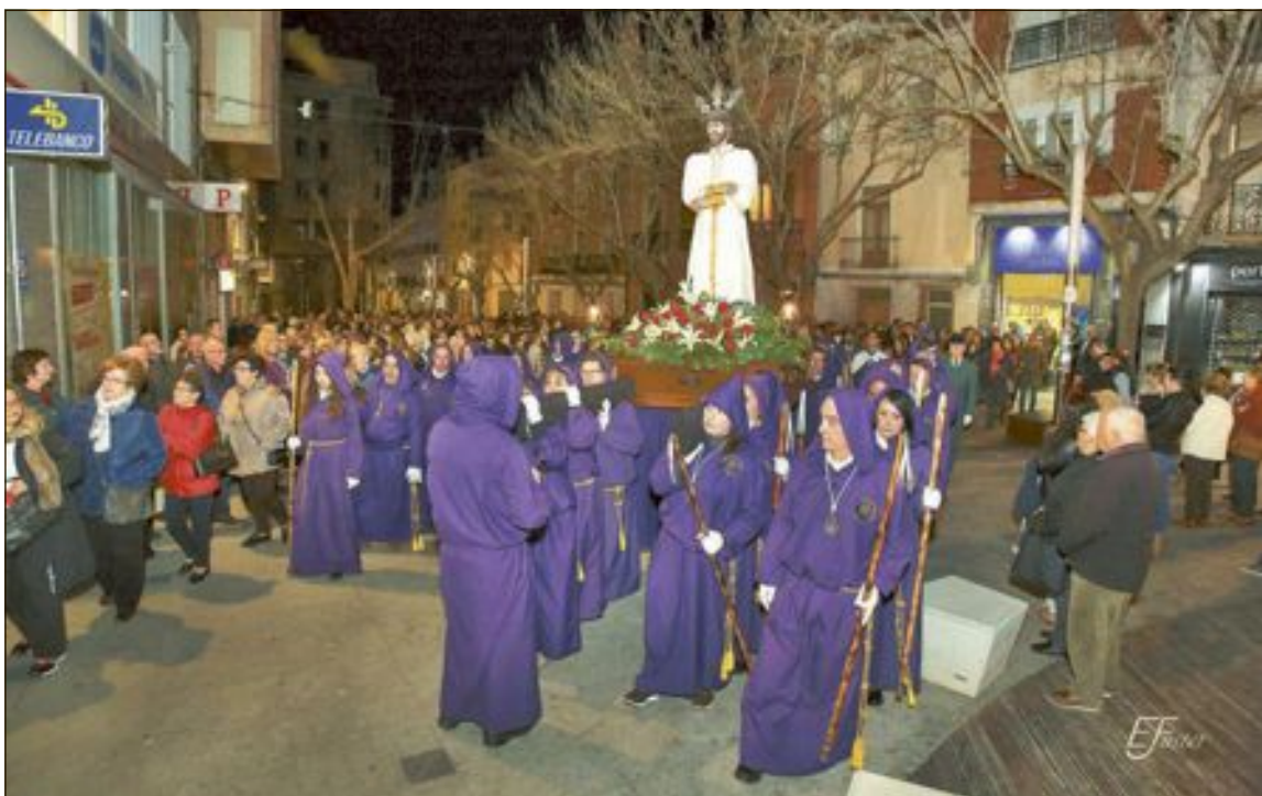
La procesión del Cautivo tuvo lugar la noche del martes 27 de marzo

Desde la Junta Local de Cofradías de Semana Santa expresaban su satisfacción por la destacada asistencia de menores y también de público, al tratarse del primer año, y explicaban que este acto continuará se incorporará a partir de ahora al programa de procesiones.