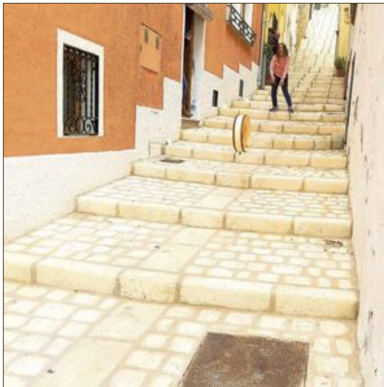
El llançament és realitza al carrer Romero