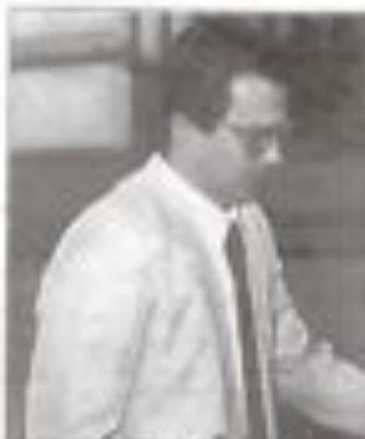
El juez Garzón, instructor de caso 1995

El juez Baltasar Garzón, instructor del Juzgado Central de Instrucción número cinco de la Audiencia Nacional, ha dirigido la operación que ha culminado con la detención en la provincia de Alicante, de cinco sospechosos de pertenecer a una red de falsificación de monedas de los reales de plata de 100 pesetas y de los reales de plata de 50 pesetas de 1975 y 1985.