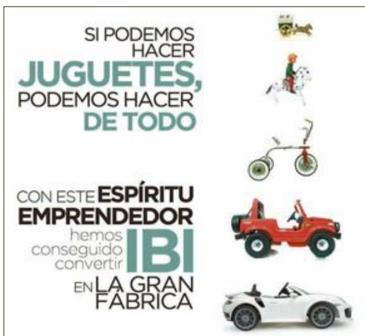
Anuncio de la campaña promocional sobre la industrial de Ibi

El mensaje principal de la campaña es: 'alguna vez en tu vida has consumido un producto fabricado en Ibi' y ha comenzado su promoción con la instalación de un stand en la feria de París, la proyección de un vídeo corporativo traducido en inglés y francés y la presentación de los cuadernos de venta 'Ibi, la gran fábrica', disponibles en castellano e inglés. Algunos de los 10.000 cuadernos impresos se han repartido ya en la feria y su distribución internacional se realizará, entre otros, a través de las oficinas de la red exterior del