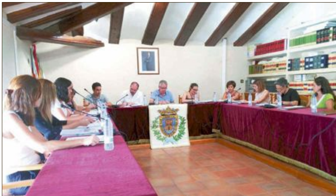
El pleno donde se aprobaron los presupuestos de 2019 tuvo lugar el miércoles 31 de julio en el Ayuntamiento

Destacar que, precisamente gracias a esta regularización del catastro de Castalla, el próximo año será posible incluir una