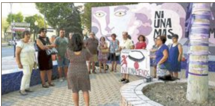
Concentración en Ibi por las últimas víctimas de violencia de género, el 31 de julio

Desgraciadamente, la violencia machista no se toma ningún respiro. Nuestra asociación seguirá manifestando el dolor que sentimos cada vez que una mujer sea asesinada y mostrar nuestra repulsa hacia los maltratadores. Con este último crimen se elevan las