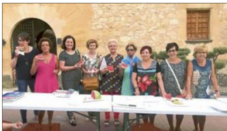
L'alcaldeessa, dos regidores i varies membres de l'Associació d'Ames de Casa d'Onil es van encarregar de repartir llepolies i meló d'alger en la plaça Major