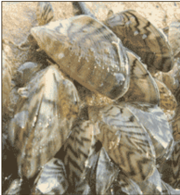
Impactos del mejillón cebra

dos y colonias densas capaces de recubrir grandes áreas.