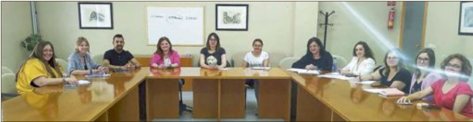
El Centro Ocupacional San Pascual y las asociaciones Upapsa, Adibi, Cocemfe, Afem, Babilón, Somriu y Somriures están trabajando de la mano del Ayuntamiento (áreas de Servicios Sociales y Empleo) para dar forma al proyecto Ibi Integra, que busca dar visibilidad a la gran cantidad de oportunidades que la contratación de personas con diversidad funcional puede ofrecer a las empresas

La multinacional italiana Giochi Preziosi compra la empresa Famosa, nacida en Onil en 1957