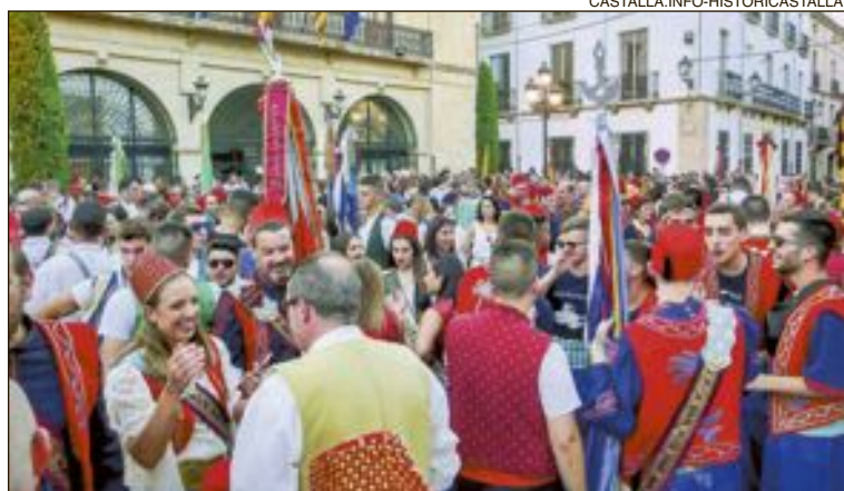
La plaça Major es va omplir de gom a gom de festers i músics