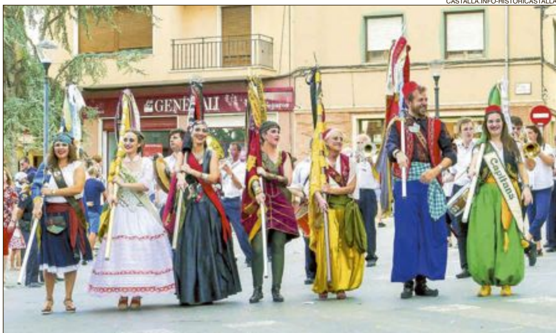
Un representant de cada capitania porta al muscle l'estendard de la seua respectiva comparsa