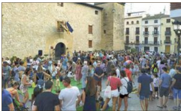
La plaça Major es va omplir de gent amb motiu de Mon anem a Agost