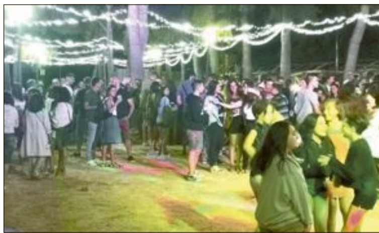
Els dies 26 i 27 de juliol va haver revetles en el paratge de Santa Ana