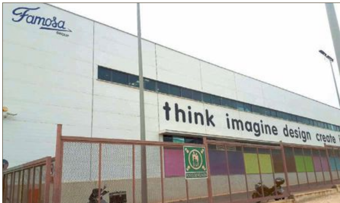
Las instalaciones de Famosa se trasladaron de Onil al polígono Las Atalayas de Alicante en diciembre de 2012