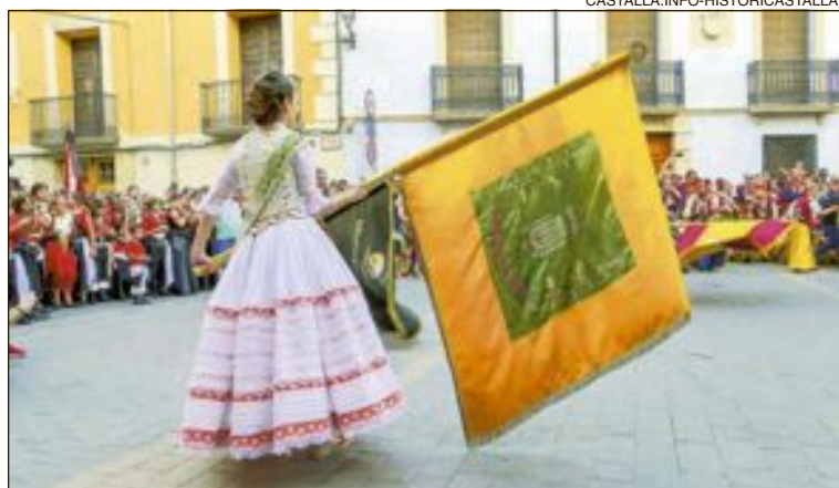
Un moment de la ballada de banderes per part del capitans d'enguany