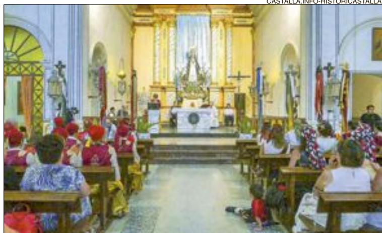
El Convent va acollir la missa de comparses pel matí i la benedicció d'estendards per la vesprada, abans de començar la desfilada fins la plaça Major

«Un Sant Jaume magnífic, amb una miqueta menys de calor que altres anys però també amb moltíssima festa i ganes de pasar-ho genial. Gràcies, festers, per fer-nos la faena fàcil, per acceptar els canvis en els recorreguts deguts a les obres que ens van impedir pujar a l'Ermita i per fer-nos gaudir d'este dia. Enhorabona, capitans, va a estar a l'altura del dia i estem desitjant vore les magnífiques sorpreses que, de segur, ens teniu preparades!» (Agrupació de Comparses de Moros i Cristians de Castalla).