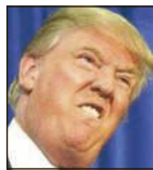
Donald Trump, hostelero jubilado