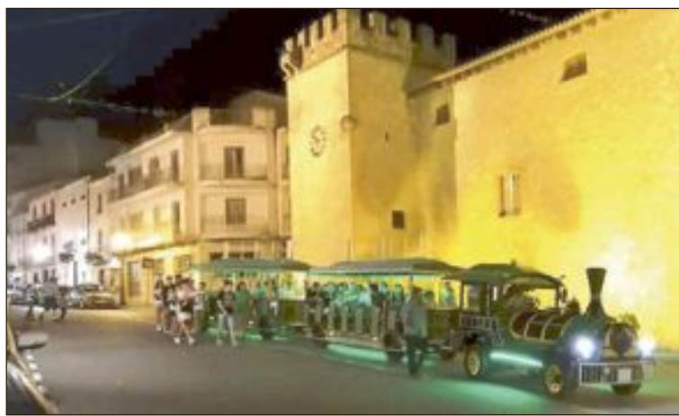
Un trenet va connectar el casc urbà d'Onil amb la revetlla de Santa Ana

I per tancar juliol i rebre el huité mes de l'any, la vila colivenca va acollir el dimecres 31 una celebració pròpia i única: Mon anem a Agost, on grans i menuts van complir amb la tradició de fer un divertit 'viatge' a Agost sense eixir d'Onil.