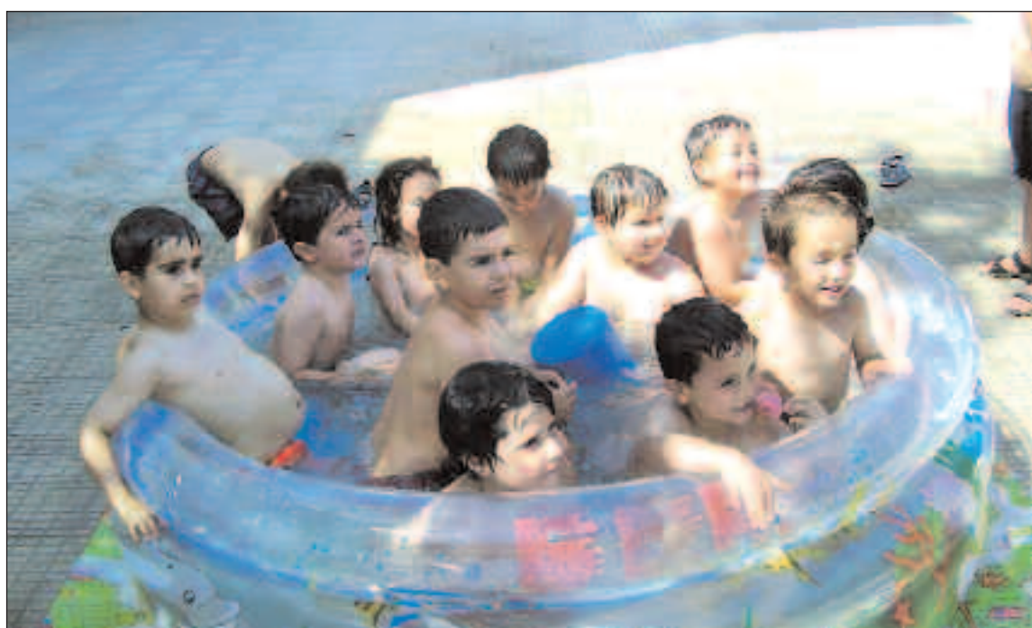
Los alumnos del Rico Sapena de Castalla se refrescaron y "pescaron" en las piscinas de plástico