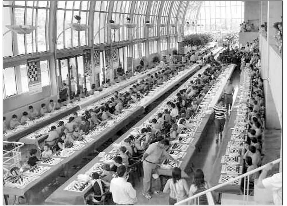
Vista panorámica de la macrosimultánea celebrada en el Palau de la Música de Valencia