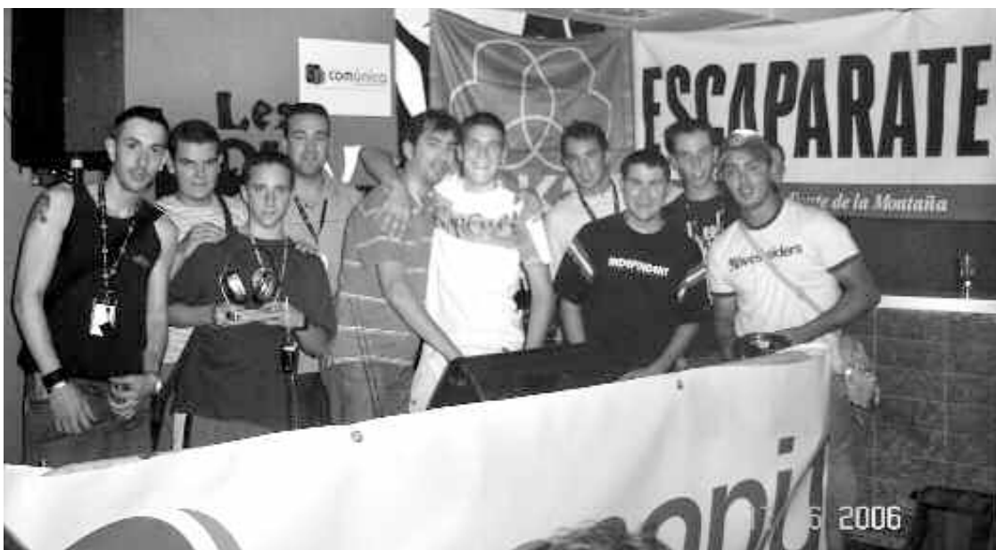
Miembros del jurado y Dj's participantes en la tercera fase clasificatoria que tuvo lugar el sábado en Tibi