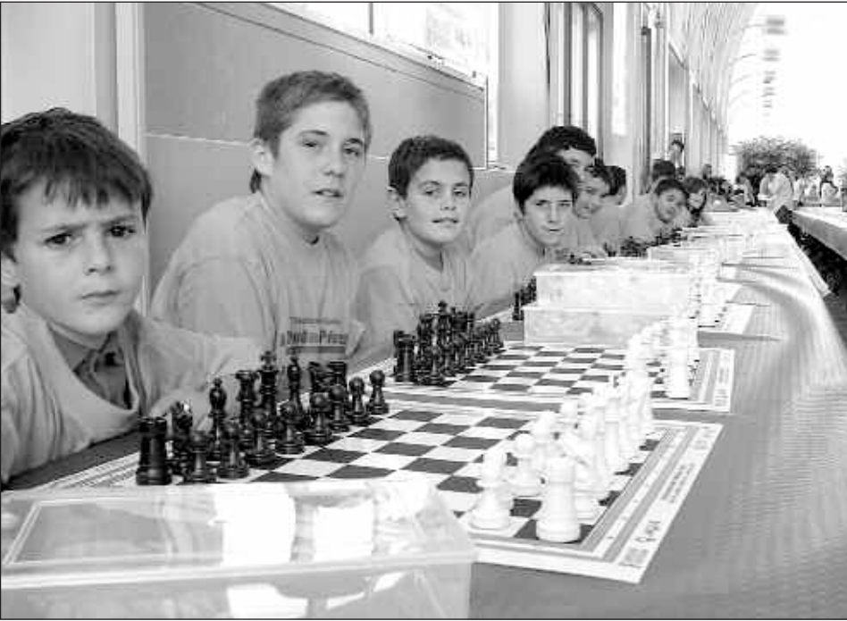
Algunos de los chavales de la comarca que participaron. En primer término, los de Castalla