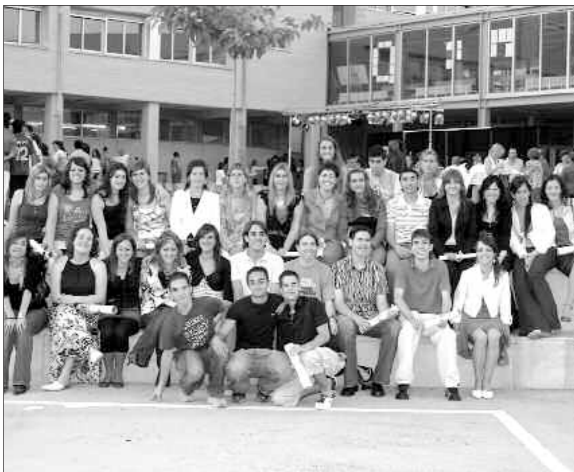
Foto de familia de los estudiantes de Bachiller de Biar, tras la entrega de orlas