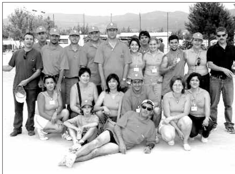
Los padres y voluntarios velaron por una correcta organización