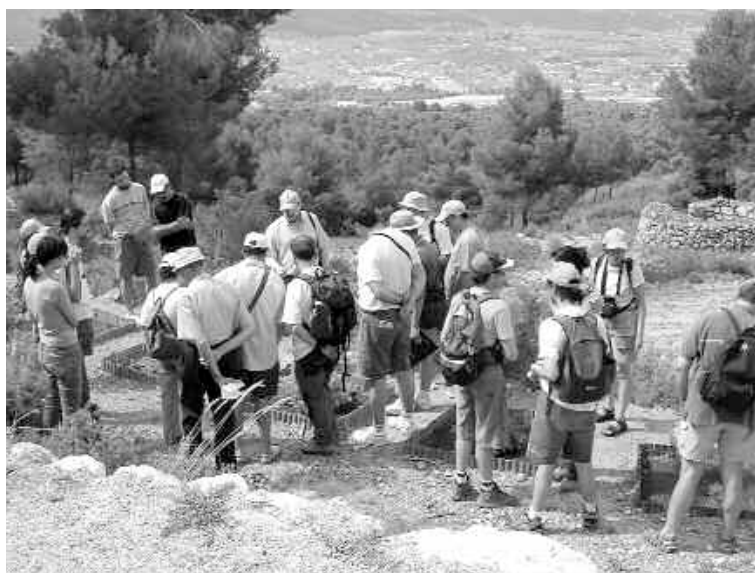
Visita a la Finca Torretes