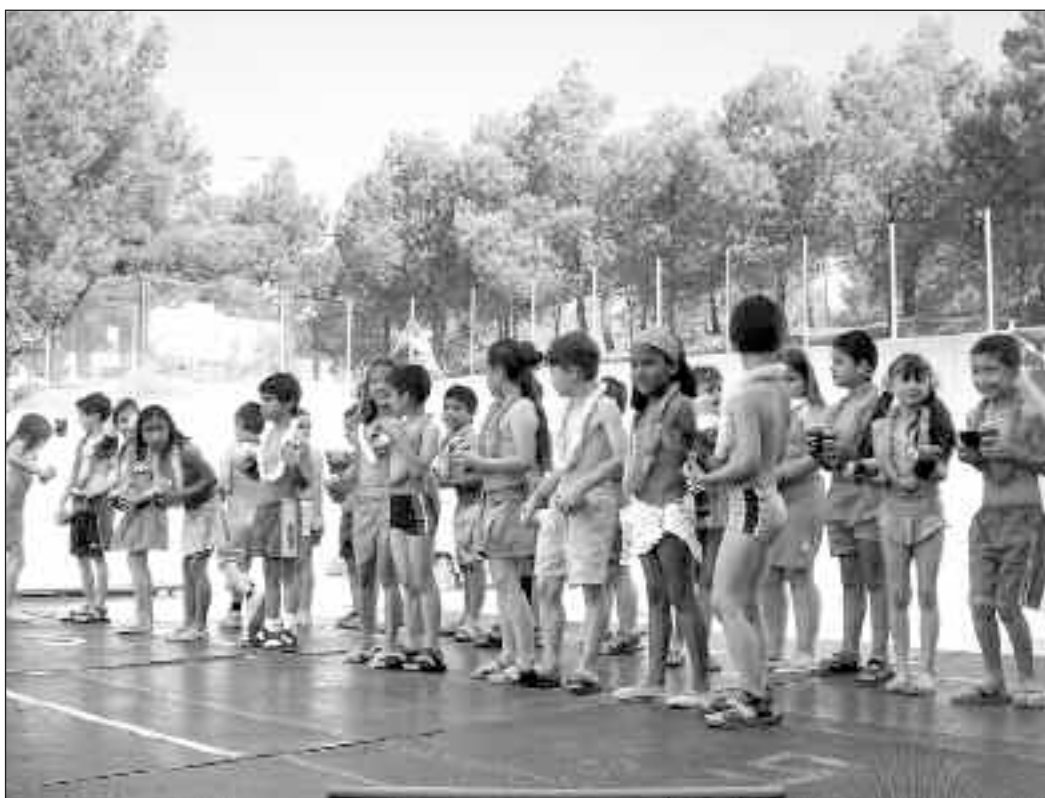
Alumnos del Pla y Beltrán durante una de las actuaciones