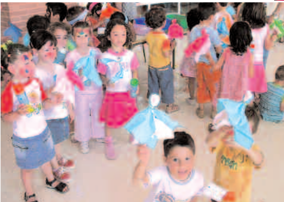
Los niños del colegio San Jaime de Onil participaron en los talleres de manualidades