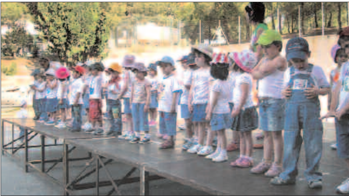
En el Pla y Beltrán de Ibi los niños bailaron y actuaron para sus compañeros y padres