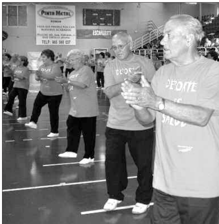
Una exhibición a cargo del Hogar del Pensionista abrió las 24 Horas

El viernes por la noche hubo fiesta Barceló Caribe Show y chocolatada, mientras que el sábado todos estuvieron invitados a agua-limón y los más pequeños disfrutaron con los hinchables.