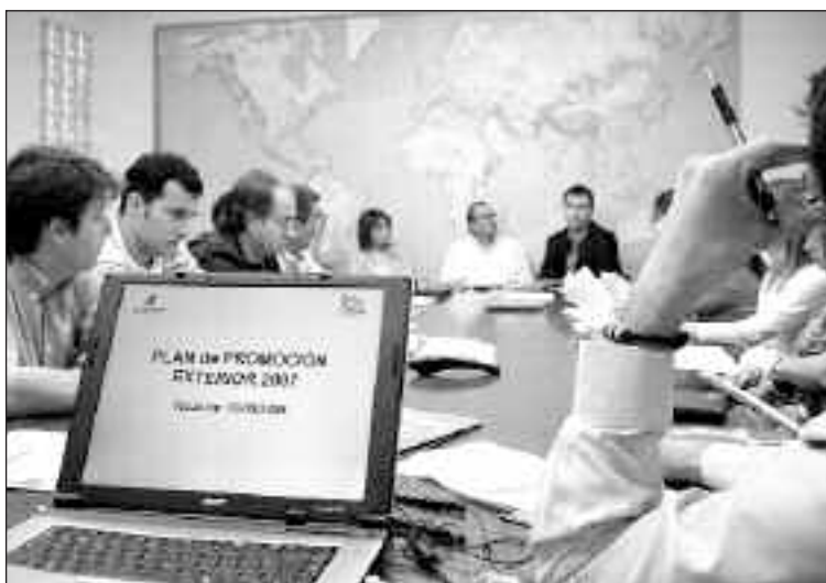
Reunión del sector juguetero el pasado 15 de junio

Asimismo, los jugueteros apuestan por otros mercados de gran interés como India, Canadá, Chile y Turquía y acordaron la creación de varios grupos de trabajo para realizar acciones concretas en Hong Kong y Nuremberg.