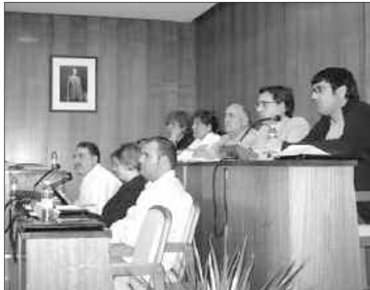
PSOE, EU y el Grupo Mixto, en un pleno ordinario

sis, el portavoz del Grupo Mixto, se expresaba tajante: “no se si es una crisis, ni me importa tampoco, lo único que me preocupa es que los proyectos vayan adelante”.