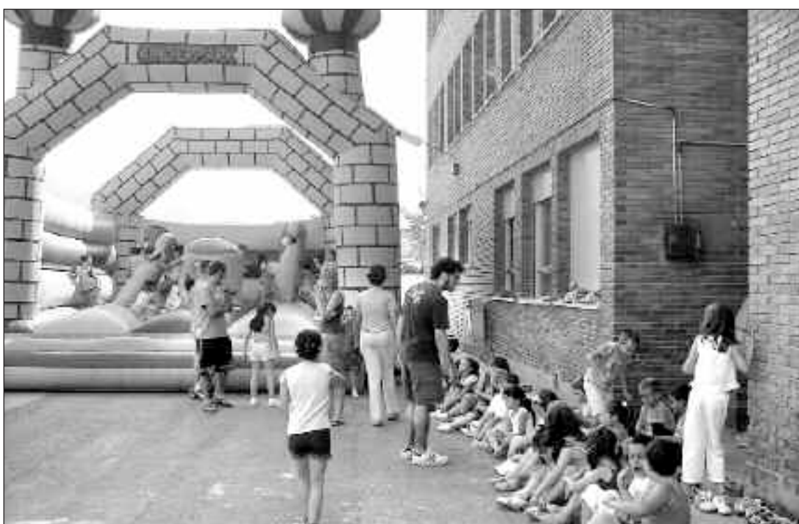
Los niños del Felicidad Bernabeu disfrutaron con los castillos hinchables instalados en el patio