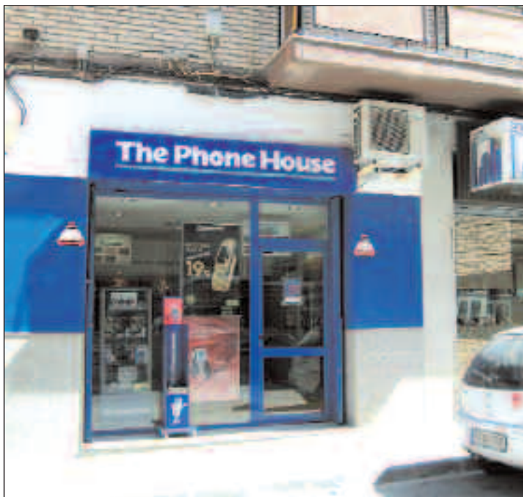
Establecimiento donde se produjo el robo el pasado viernes

Tras las denuncias, la Guardia Civil ha abierto una investigación para detener a los autores.