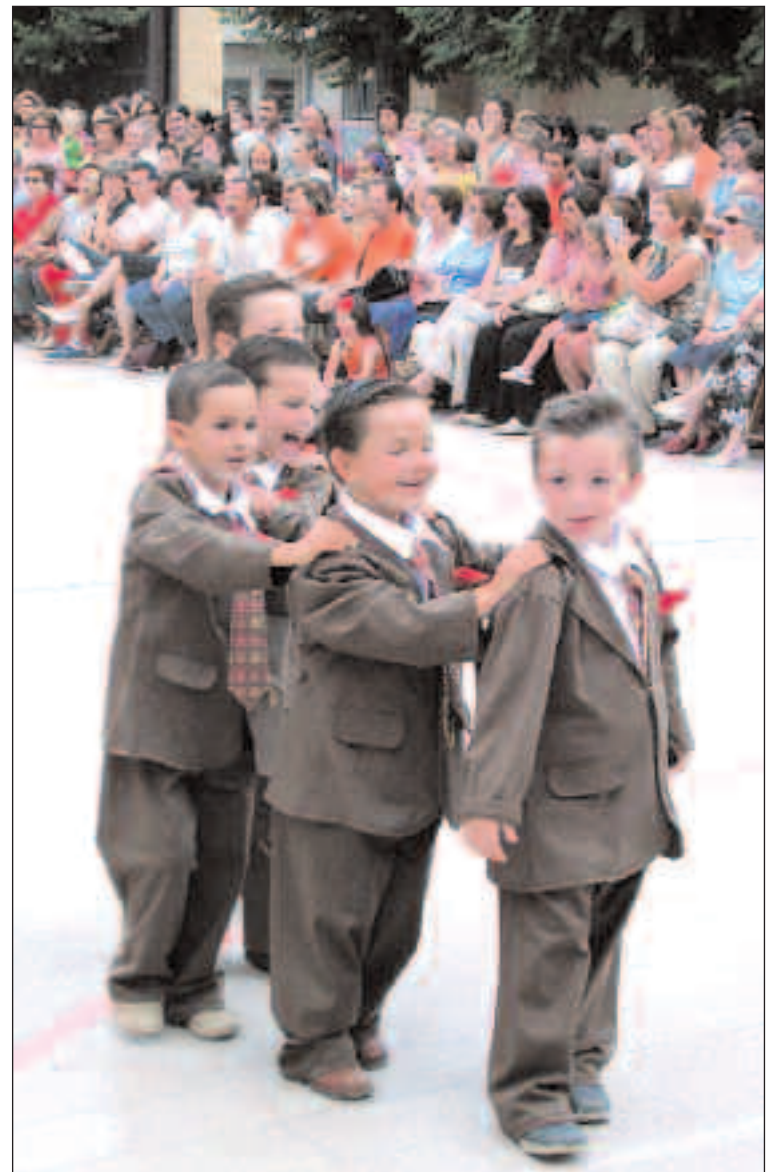
Disfraces de época para el festival del colegio M a Asunta de Castalla