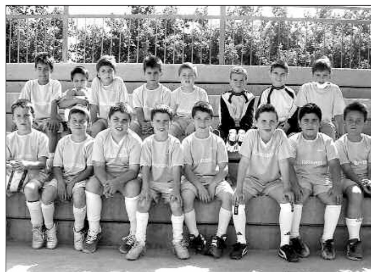
Equipo Prebenjamín Fútbol 7 del CF Castalla

En cuanto al equipo ganador, desde la UD Onil afirman que el River Ibi está formado por muy buenos jugadores, que además supieron cuidarse durante las 24 Horas y llegaron en buena forma a la final.