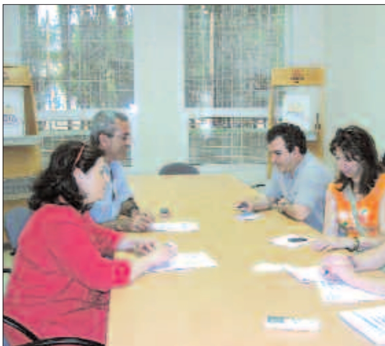
Reunión de la Junta Directiva de ATIF en la sede de IBIAE

La presidenta recuerda que ATIF ha asistido dos años consecutivos a la Feria de Turismo de Valencia y ha creado folletos publicitarios en los que figuran los 56 socios actuales. Pero, “sólo es el comienzo”, afirma.