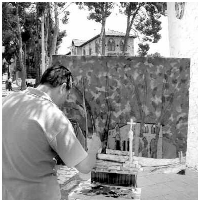
Entre los lugares elegidos por los concursantes, el Patronato