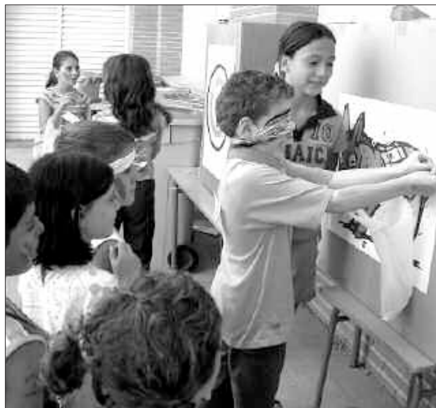
Uno de los tantos talleres organizados en el C.P. San Jaime de Onil