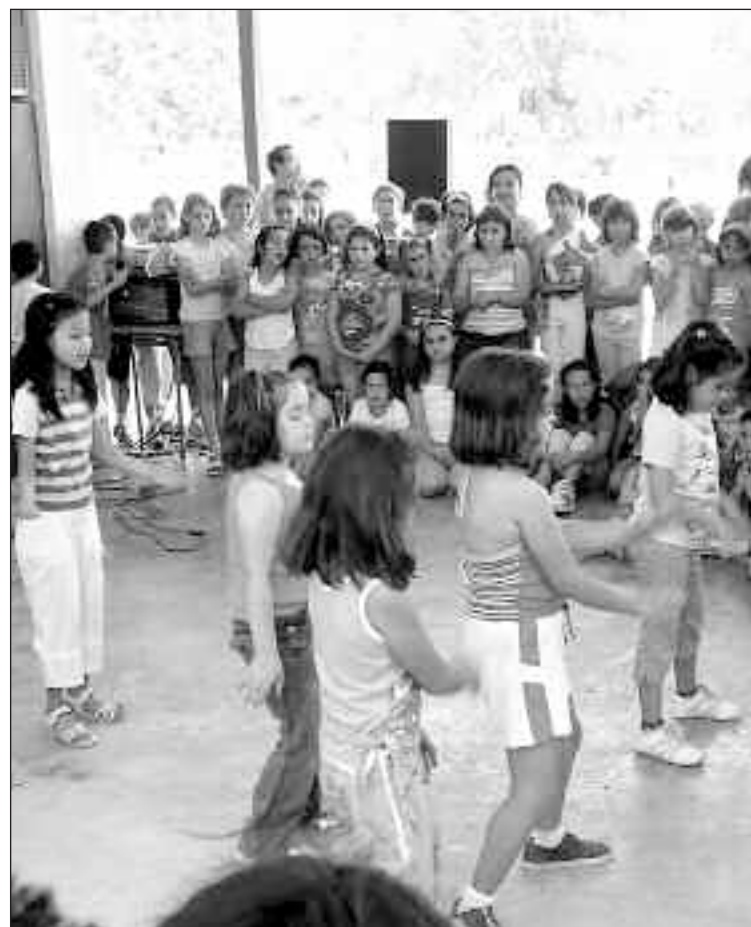
Actuación musical de los alumnos en el colegio Rico Sapena de Castalla