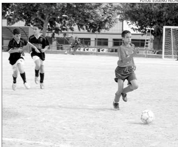
Un jugador del Rayo Alevín 'A' lucha por la pelota en uno de los partidos

Cabe destacar el gran éxito de asistencia, ya que participaron más de 300 deportistas de 16 equipos de la provincia, y la excelente organización. Se echó de menos más público local, debido a las 24 Horas.