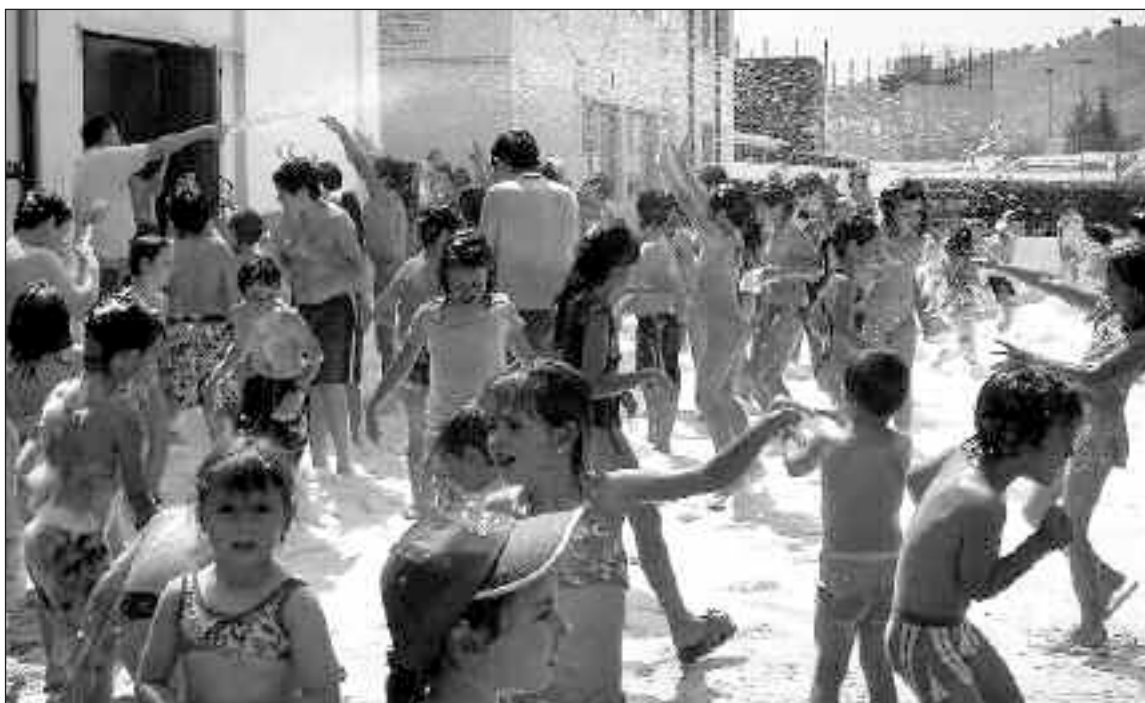
Fiesta de la Espuma en el colegio Derramador