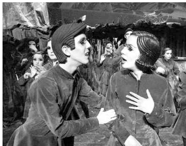
Un momento de la representación de la obra

Estas jornadas han estado organizadas por el Vicerrectorado de Extensión Universitaria de la Universidad de Alicante y el CIBIO, con motivo del X Aniversario de la Sede Universitaria de Cocentaina.