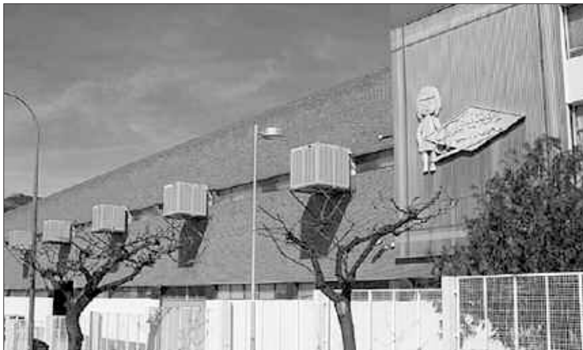
El complejo industrial Famosa 1 tiene una superficie de 31.000 metros cuadrados

La propuesta de convenio con Famosa, presentada por el PP, también solicita a la firma muñequera "el depósito de un aval a favor del Ayuntamiento, por valor de las plusvalías obtenidas de la revalorización de