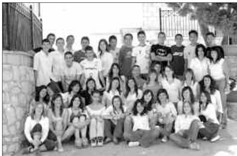
Alumnos de 4º de ESO del colegio San Juan y San Pablo de Ibi