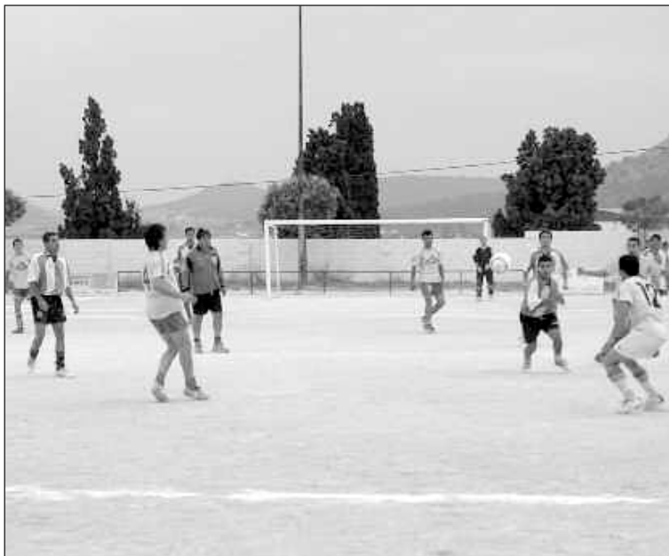
Momento de uno de los partidos que se celebraron el sábado por la tarde

Fuentes de la organización mostraron su satisfacción por el desarrollo del torneo, donde se pudo ver "un alto nivel de juego", sobre todo en los