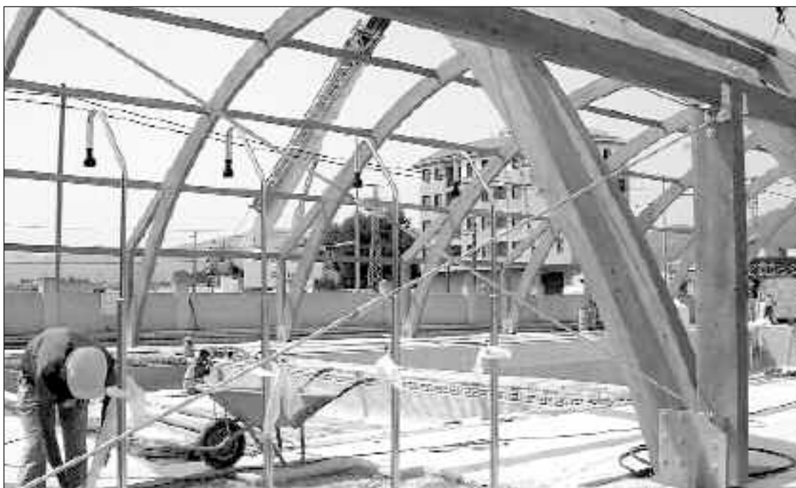
La estructura que será cubierta por una membrana ya está totalmente montada

El día de la apertura está prevista una jornada de puertas abiertas