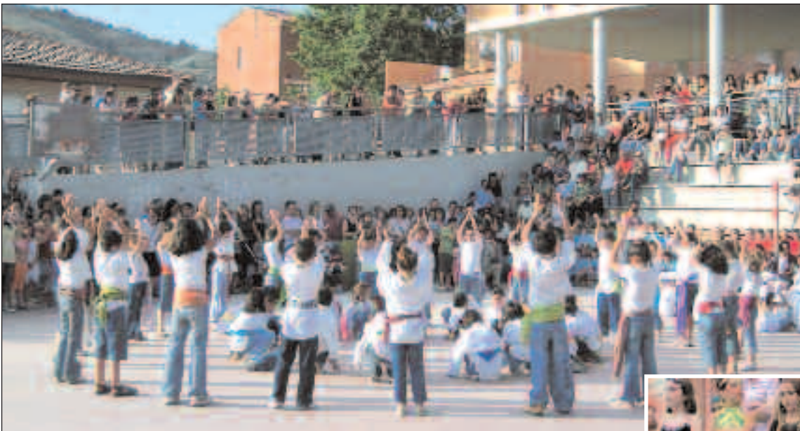
Actuación de los alumnos del colegio Teixereta de Ibi