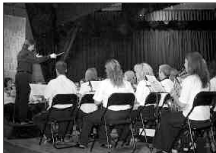
Concierto de la Agrupación Santa Cecilia del sábado 17 de junio