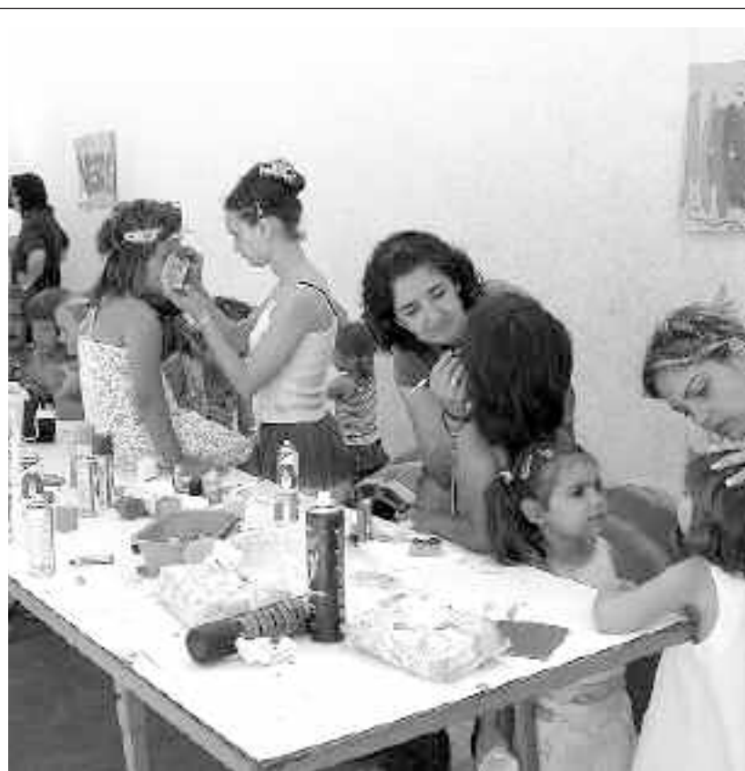
El C.P. Virgen de la Salud de Onil, preparó distintas actividades buscando la participación de los jóvenes estudiantes