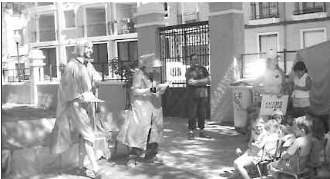
Escuela de verano que se desarrolló el año pasado en el colegio Cervantes

Para dar cabida a la gran demanda, la Asociación Babilón ha ofertado hasta 200 plazas, un centenar en cada centro. Los padres podrán elegir el colegio según sus preferencias. El horario es el mismo que el de los veranos anteriores, de nueva a una de la mañana, aunque los jóvenes podrán permanecer media hora más en el colegio a la espera de ser recogidos por sus tutores.