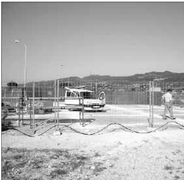
La carpa podría estar abierta al público la semana próxima