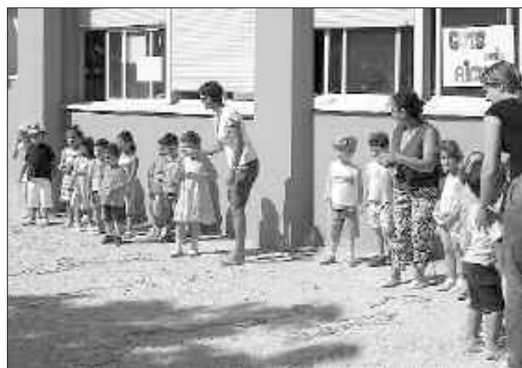
Los más pequeños del Felicidad participaron en diferentes juegos