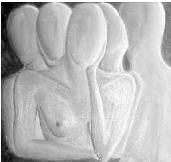
Una de las obras que se exponen en el Ayuntamiento