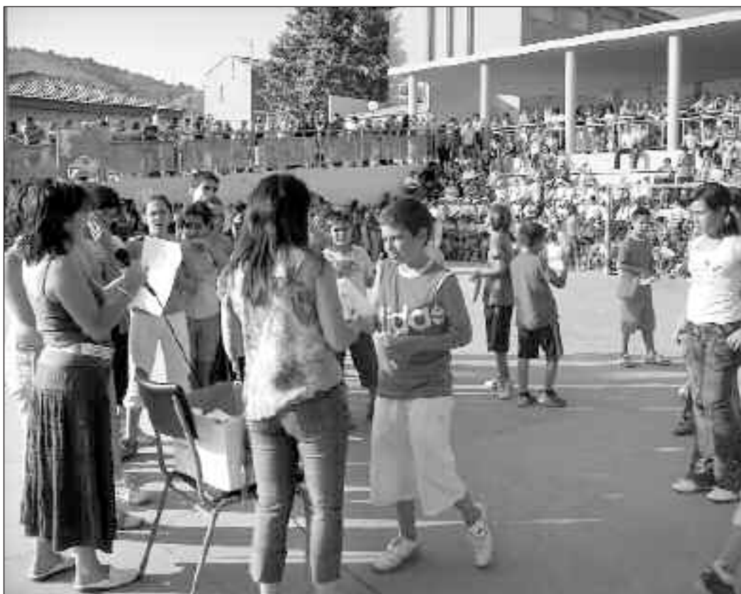
Despedida a los alumnos de sexto en el C.P. Teixirreta de Ibi