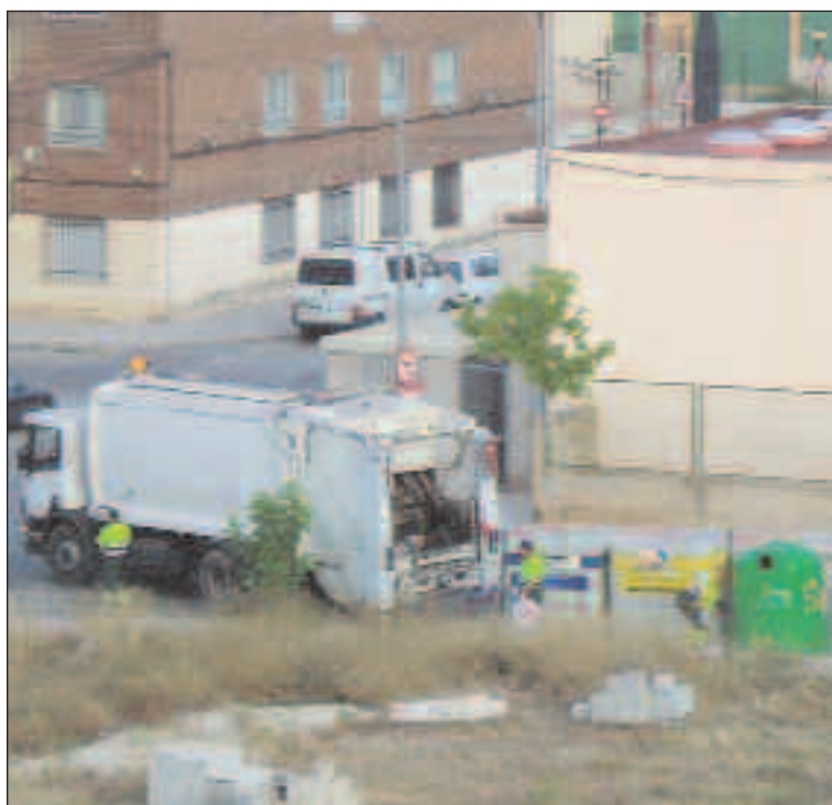
Una vecina de la Sagrada Familia realizó fotos tras observar este hecho