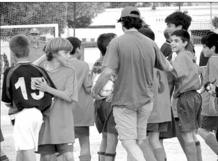
La alegría fue patente en el equipo tras superar los cuartos de final

Habrán trofeos para los cuatro primeros equipos clasificados, al máximo goleador, al portero menos goleado y a la deportividad.