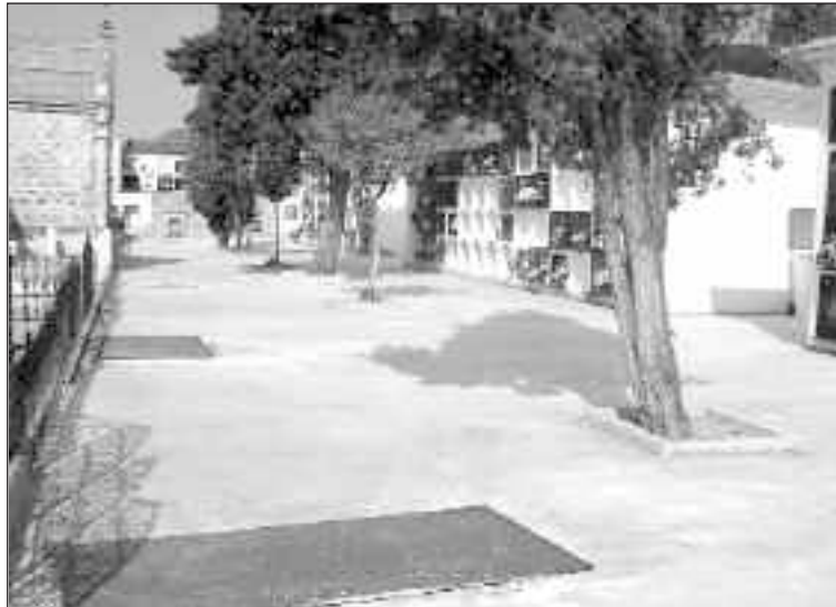
Según la Mutua, el cementerio incumple normas de prevención de riesgos laborales

Este sindicato también ha presentado otra denuncia por