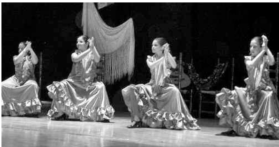
Alumnas de la escuela Municipal de Danza, durante la representación del sábado