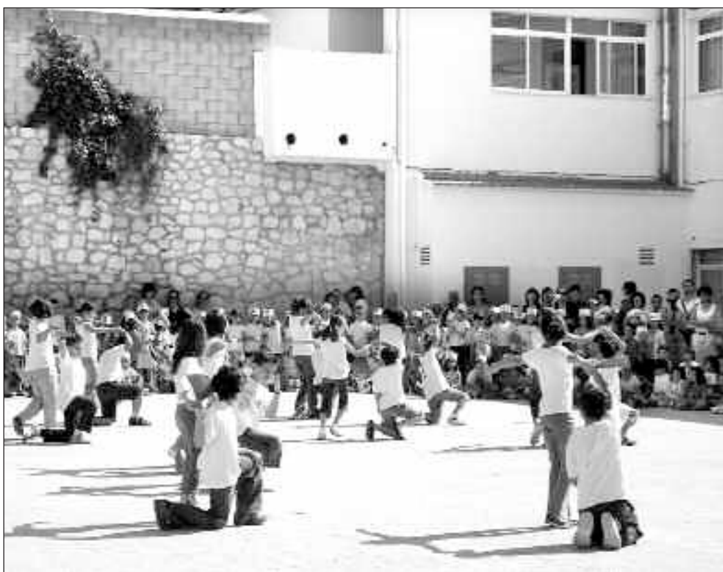
Bailes en el Festival del Colegio San Juan y San Pablo de Ibi