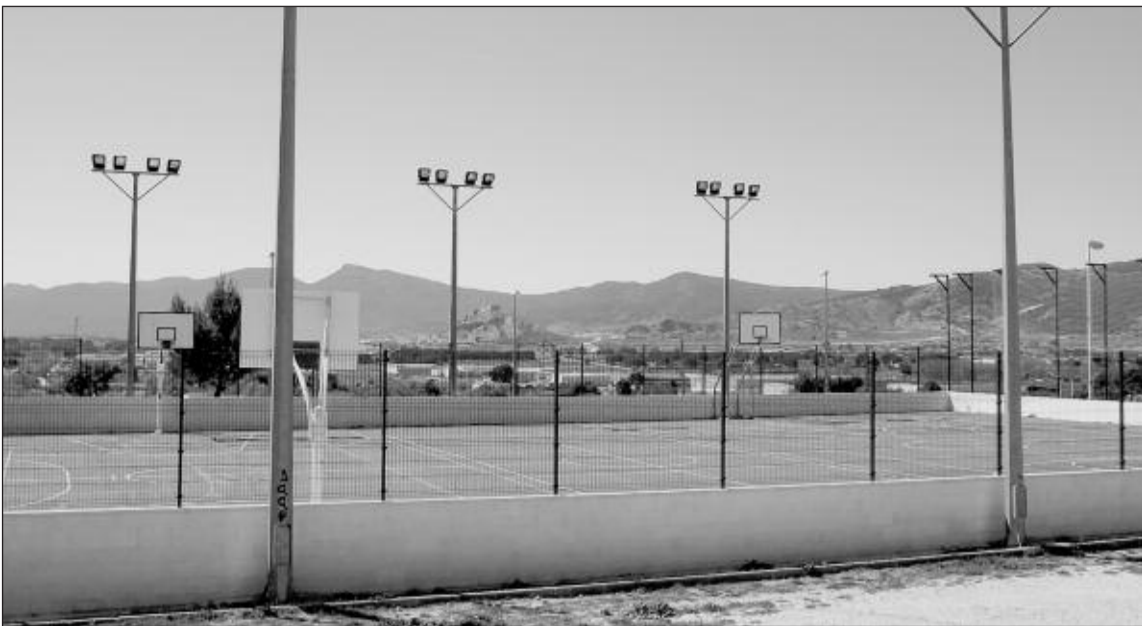
La pista multiusos de la zona deportiva podrá ser utilizada gratuitamente por niños y jóvenes de entre 10 y 25 años