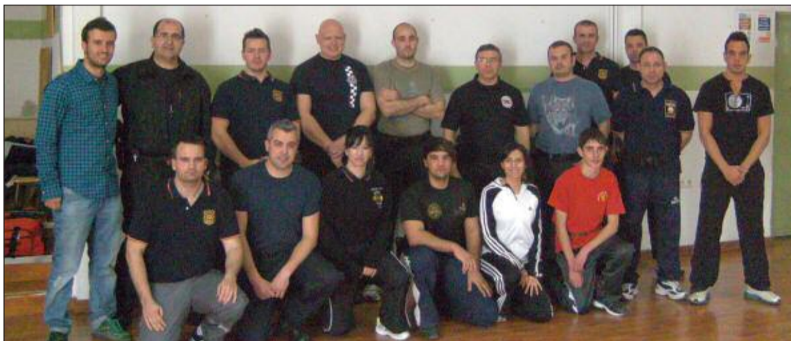
Participantes del curso celebrado en Ibi a finales de marzo