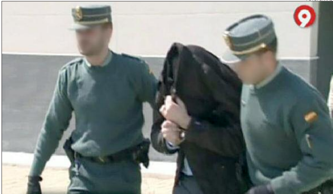
R.C. fue detenido el pasado 27 de marzo. Las otras dos mujeres arrestadas están en libertad provisional

En febrero de este año se decretaron las escuchas telefónicas a R.C. En ellas, y según transcurre del sumario, el principal sospechoso ofrecía comisiones a ginecólogos para que estos ofreciesen el servicio en las clínicas en las que trabajaban. Según fuentes judiciales "estos profesionales, entre 3 y 4, debían asegurarse de que todo era legal, pero sin embargo no lo hicieron", por lo que pueden tener consecuencias jurídicas. Algunos afectados han declarado que sus ginecólogos "les obligaban" a contratar dichos servicios con R.C. ya que en el caso de no hacerlo con el principal sospechoso, el ginecólogo no extraería las muestras tras el parto, mientras que otros aseguran que solo fueron aconsejados.