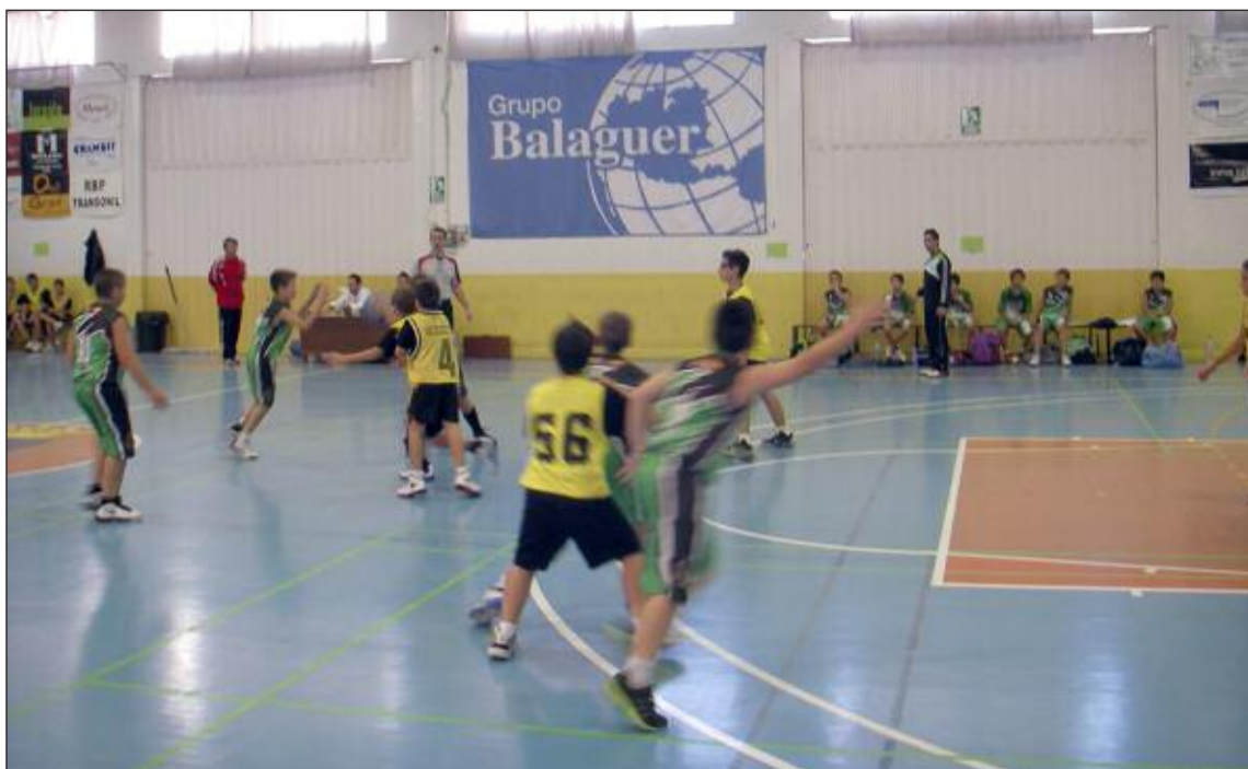
El equipo Alevín Masculino se impuso al Carolinas de Alicante por un resultado de 72-36

Desde el minuto uno salió el Cartagena en tromba con un 15-2 que ponía de mani-