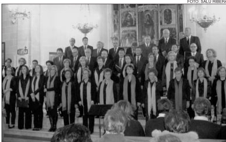
Actuación de la Coral Polifónica de Onil en la Iglesia de Beneixama

El Centro Instructivo Musical de Onil (CIMO) y la Societat Musical La Pau de Beneixama ofrecieron sendas actuaciones, el sábado 14 de abril en el Centro Cultural, dentro del VIII Festival de Bandas 'Villa de Onil'. Previamente hubo un pasacalle.