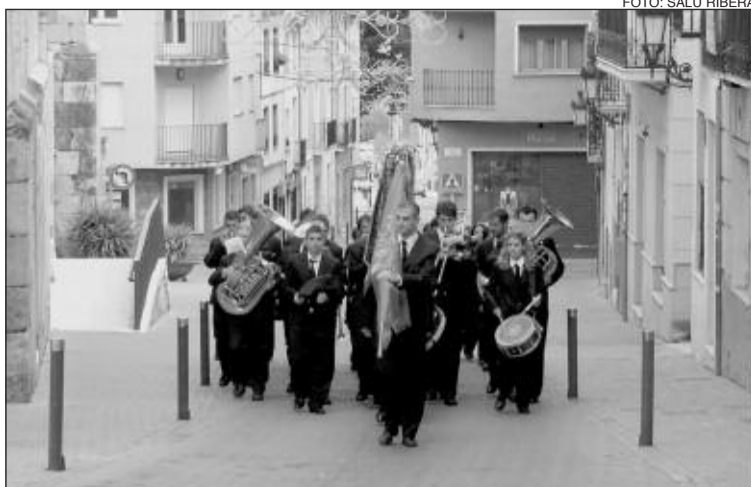
El CIMO y la banda invitada protagonizaron un pasacalle antes del concierto