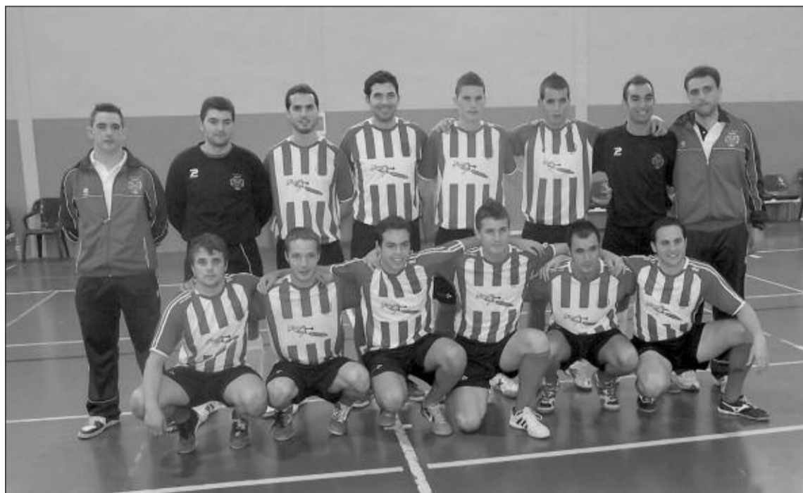
Plantilla del equipo Sénior de la Unión Deportiva Ibense para la temporada 2011-2012