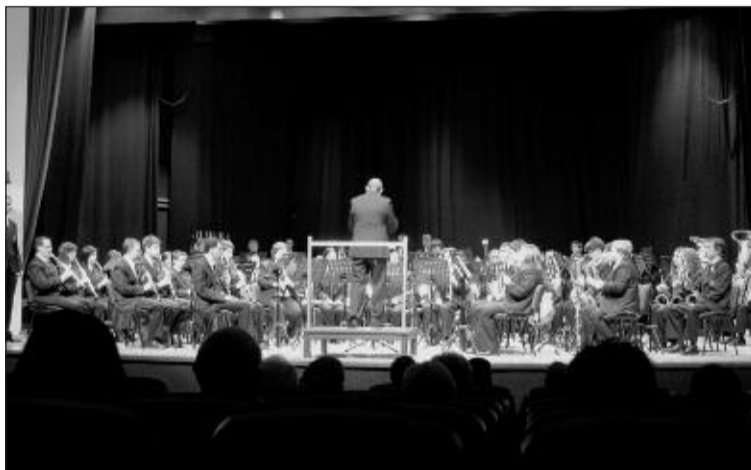
Un momento del concierto del CIMO en el Centro Cultural