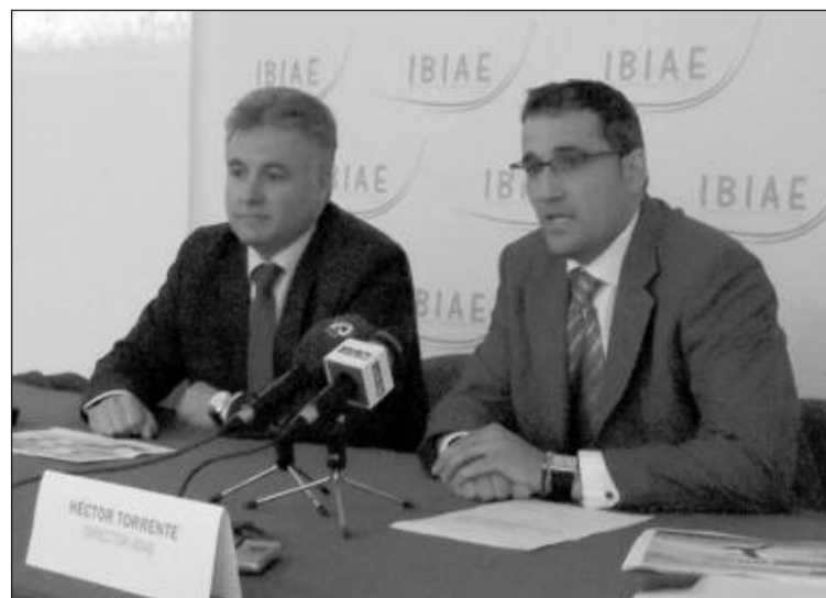
El director del CEEI y el gerente de IBIAE en la presentación del estudio

Estudio sobre la vocación emprendedora en la Foia