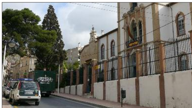
Cuartel de la Guardia Civil de Onil

Fuentes policiales indican que la menor podría haber sufrido un abuso sexual, además de un presunto delito de retención involuntaria por parte del acompañante. La Guardia Civil de Onil se ha hecho cargo del caso y está investigando los hechos.