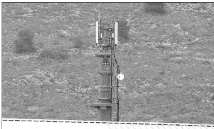
La antena está instalada en el patio de la empresa Vilaplana

Por el contrario, Benillup es el municipio con la tasa más baja ya que sólo cobran tres de los 17 parados registrados, el 17'65 por ciento.