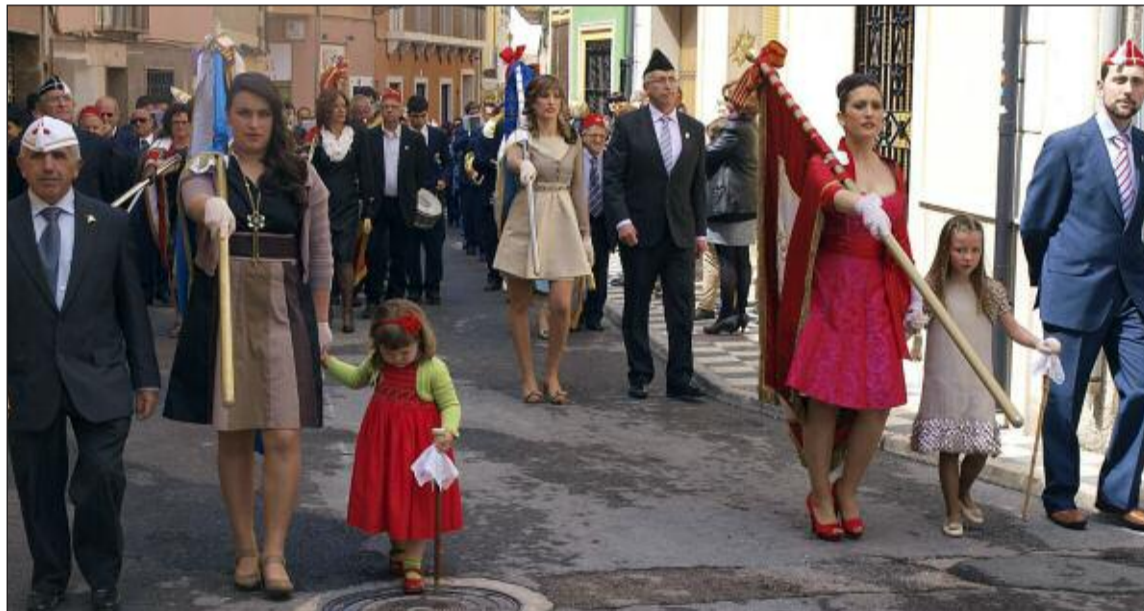
Desfile de abanderadas, junto a los sargentos y presidentes de comparsas

El lunes 16 de abril, festividad de San Vicente, la localidad celebró el anuncio de Fiestas con el disparo del primer tiro a cargo del capitán de la comparsa Blanquets , al que siguieron el resto de comparsas. Después se celebró el desfile de abanderadas, acompañadas por la Sociedad Unión Musical. El intenso frío de esa jornada no impidió que los vecinos se volcarán masivamente en la celebración.