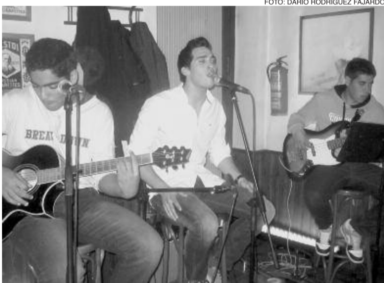
El grupo biarense Aixaten Rock ofreció un concierto el viernes 13 de abril