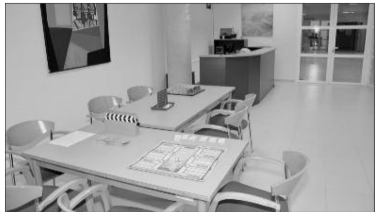
Los usuarios del Casal Jove disponen de una amplia oferta lúdica