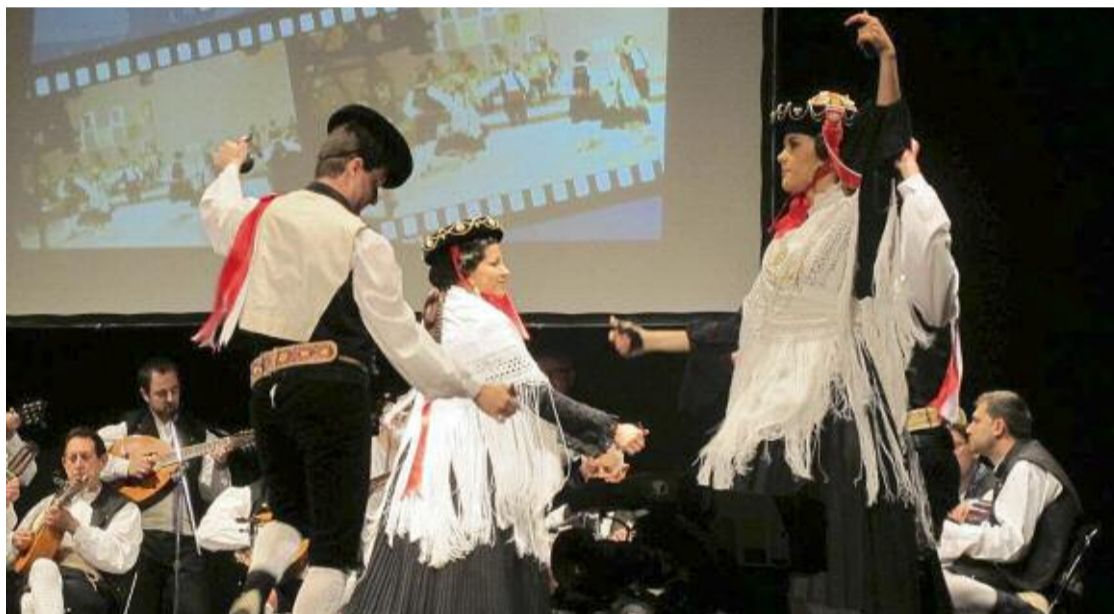
Durante el festival, el grupo interpretó varios bailes acompañados por la música de la rondalla