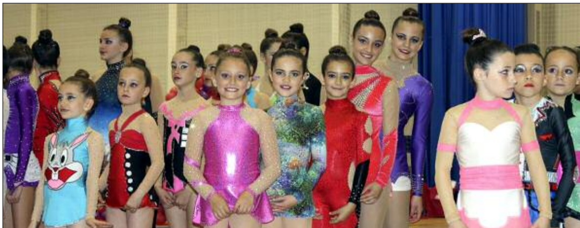
Las gimnastas ibenses no consiguieron podio en L'Alfàs del Pi, pero sí muy buenas puntuaciones