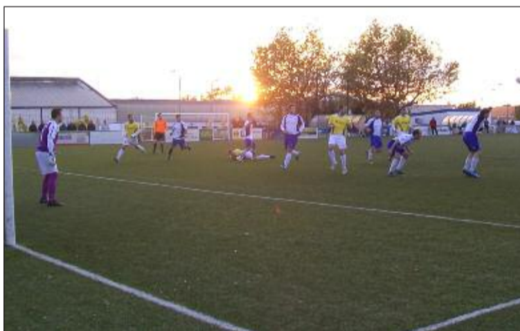
Imagen del partido de ida entre la Peña Madridista y el Albaidense

En la primera parte, el primer acercamiento de la Peña lo convirtió Pincho en gol, con un precioso disparo desde 20 metros que entró pegado al palo, imposible para el portero.