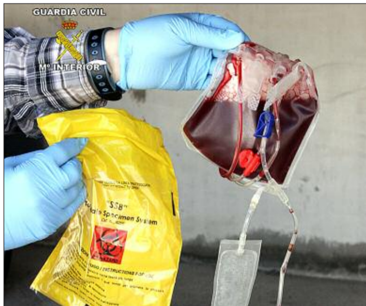
Muestras de cordones umbilicales encontrados en el coche de R.C.

Fuentes cercanas al caso explican que muchas de las familias utilizaron el entonces dinero del ‘cheque-bebé’ para contratar este servicio ya que, según han declarado, consideraban que era “un dinero bien invertido” para asegurarse la salud de sus hijos en un futu-