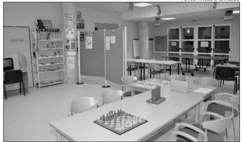
El Casal Jove fue inaugurado el 3 de abril en el lugar que ocupaba el CIJ