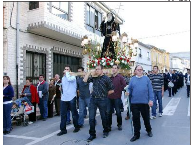
Procesión de Sant Francesc del año pasado

En otro documento, el Consistorio recomienda no quemar madera excesivamente gruesa, evitar que las hogueras puedan dañar edificios o instalaciones,