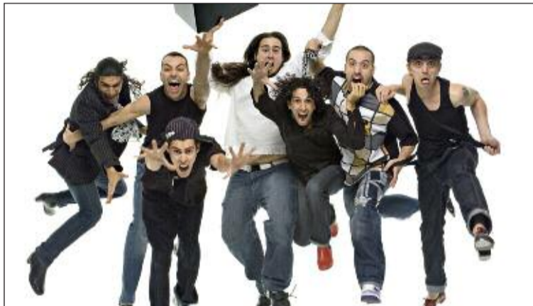
El espectáculo 'Hermanos de Baile' se representará el sábado 30 de junio

-Jueves 3, música: Lagarto Amarillo presenta su disco 'Es-