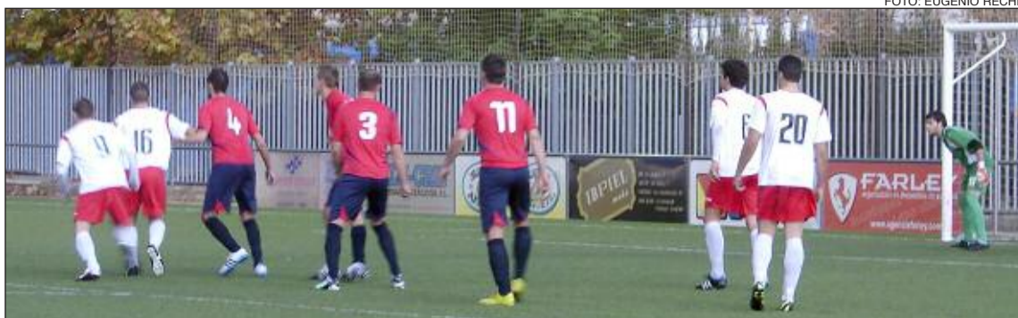
El partido de ida entre el Rayo Ibense y el Algueña se disputó en el Vilaplana Mariel en noviembre de 2011

El Rayo Ibense necesita en estas horas cruciales el apoyo total y absoluto de su afición.