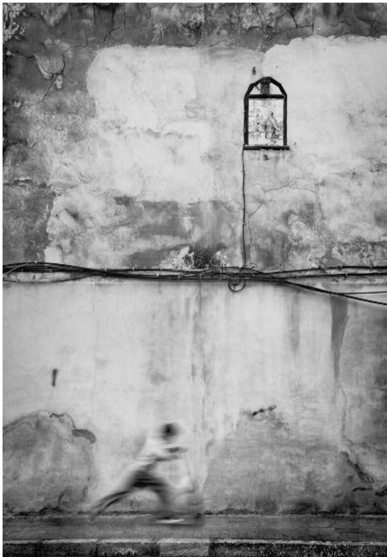
Fotografía titulada 'San Pascual Baylón', de Vicente Guill Fuster

El resto de fotografías premiadas se puede observar en la página web http://petrer-dia.com/imagenes/imagenes-premiadas-del-concurso-foto-petrer-2012.html .