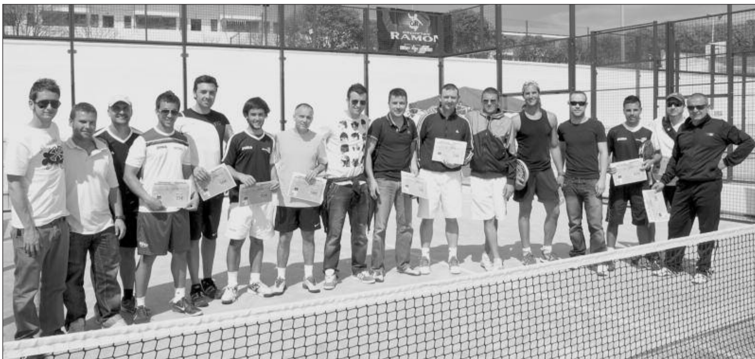
Todos los premiados en este torneo, en las pistas de pádel del Polideportivo de Ibi

Envía la información de tu equipo, club o logros deportivos personales a: deportes@escaparedigital.com