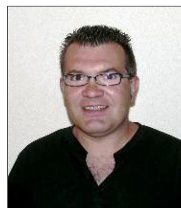
Joan Antoni Cerdà

construir viviendas de tipología tradicional destinadas al alquiler y bajos comerciales de alquiler protegido, construir un albergue juvenil en el casco antiguo y celebrar una reunión con la empresa encargada de elaborar el proyecto de revitalización del casco antiguo para presentarle estas propuestas y debatirlas.