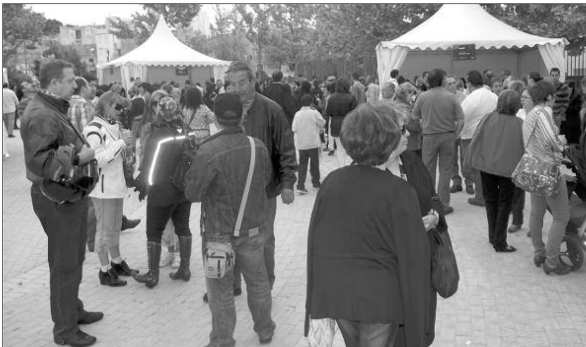
El día de tapas se mantiene por su gran éxito y se celebrará el día 3 de junio en el Parque Les Hortes

En esta edición, cinco nuevos restaurantes de Ibi ofrecerán al público su mejor cocina con menús degustación. Iniciará las jornadas el 27 de abril el restaurante Diferente, al