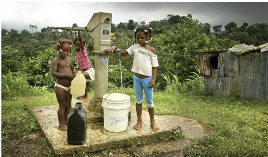
La obra ganadora lleva por título ¡Gracias, pozo!

La fotografía ganadora lleva por título '¡Gracias, pozo!' y su autora ha querido mostrar a través de esta imagen la realidad de los acuíferos subterráneos (30% del agua dulce) de la República Dominicana que están siendo sobreexplotados por la agricultura, industria