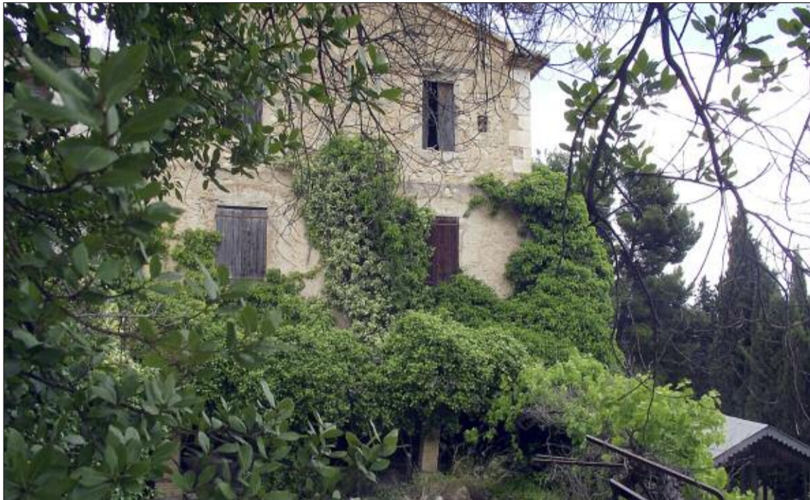
Estado actual del jardín y alrededores del Molino de Papel

En febrero, el colectivo Saginosa presentó una moción para