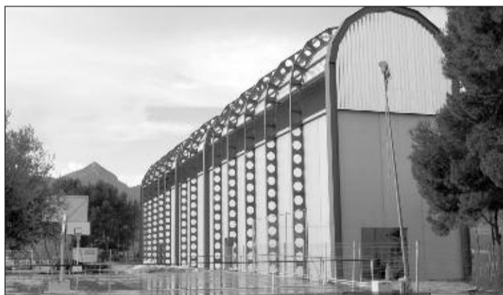
Instalaciones del carrer de pilota

Asimismo, se ha pedido a la empresa que oculte las tuberías del agua ya que están en el interior de las pistas y corren el peligro de