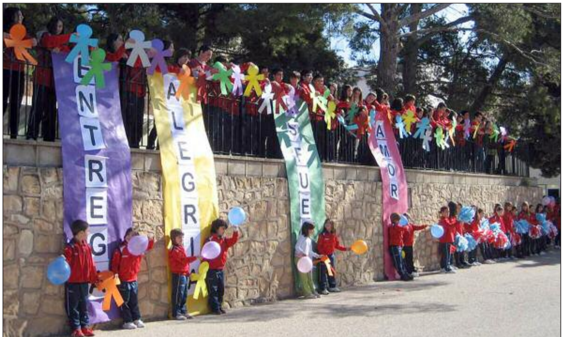
El colegio ha realizado un vídeo del centro donde plasman el buen ambiente que existe

Los asistentes aprenderán conocimientos y realizarán diferentes juegos para aprender la importancia de los cultivos y sus efectos en el cambio climático. Las actividades comenzarán a partir de las 11,30 horas.