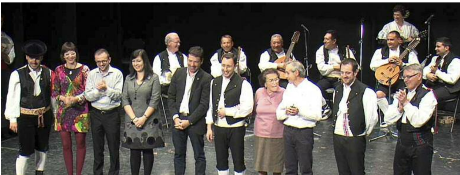
Los diez presidentes en el escenario del Centro Cultural donde se celebró el festival

En el festival 'Un grupo de danzas de película' celebrado el 15 de abril