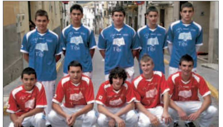
Plantilla del equipo Juvenil

Así, entre los meses de marzo y julio se jugarán partidas de pilota en el Carrer Major de Tibi, todos los domingos por la mañana.