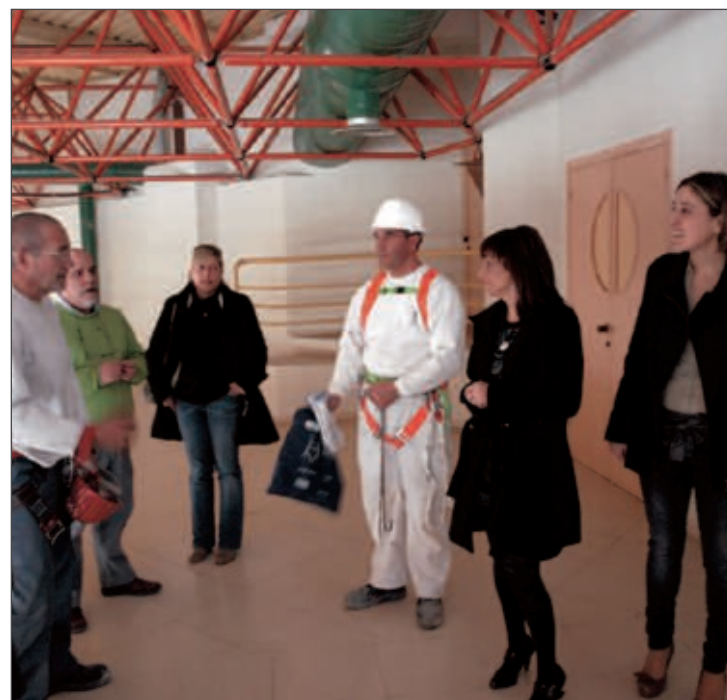
La alcaldesa visitó el martes las obras del Centro Cultural

La vicerrectora de la UMH, en su primera visita a la localidad, aseguraba que se seguirá apostando por la formación “en nuestras sedes amigas, como es la de Ibi, y presentando nuevos proyectos muy interesantes. Seguimos el mismo objetivo que el Ayuntamiento que es el de acercarnos todo lo que podamos al ciudadano y facilitarle la formación”. Además de las Aulas Universitarias de la Experiencia, la UMH también ofrece en la localidad los cursos de verano orientados a profesionales o personas que decidan formarse en materias concretas.