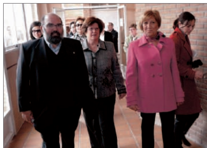
El arquitecto, la alcaldesa y la subdelegada recorren las instalaciones

yectos del segundo Plan Zapatero prevé la construcción de una pista de tenis y dos de pádel en la zona deportiva, puesto que, según Ribera, “el deporte en nuestro pueblo hay que escribirlo con letras mayúsculas, por lo que desde nuestro Ayuntamiento deseamos que todo lo que se está haciendo a favor del deporte en Onil sirva para seguir potenciando la cantera de grandes deportistas con que esta localidad cuenta”.