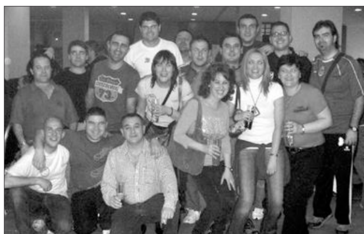
Representación de la Liga 'La Foia-Proneval' en el Campeonato de España