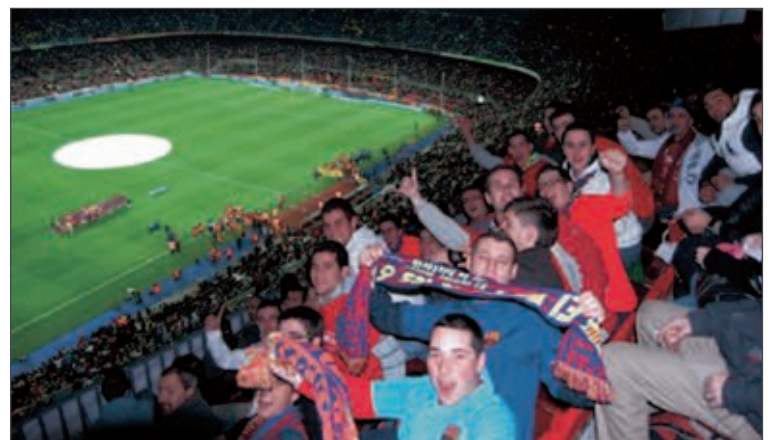
Los castallenses disfrutaron en vivo del espectáculo del fútbol