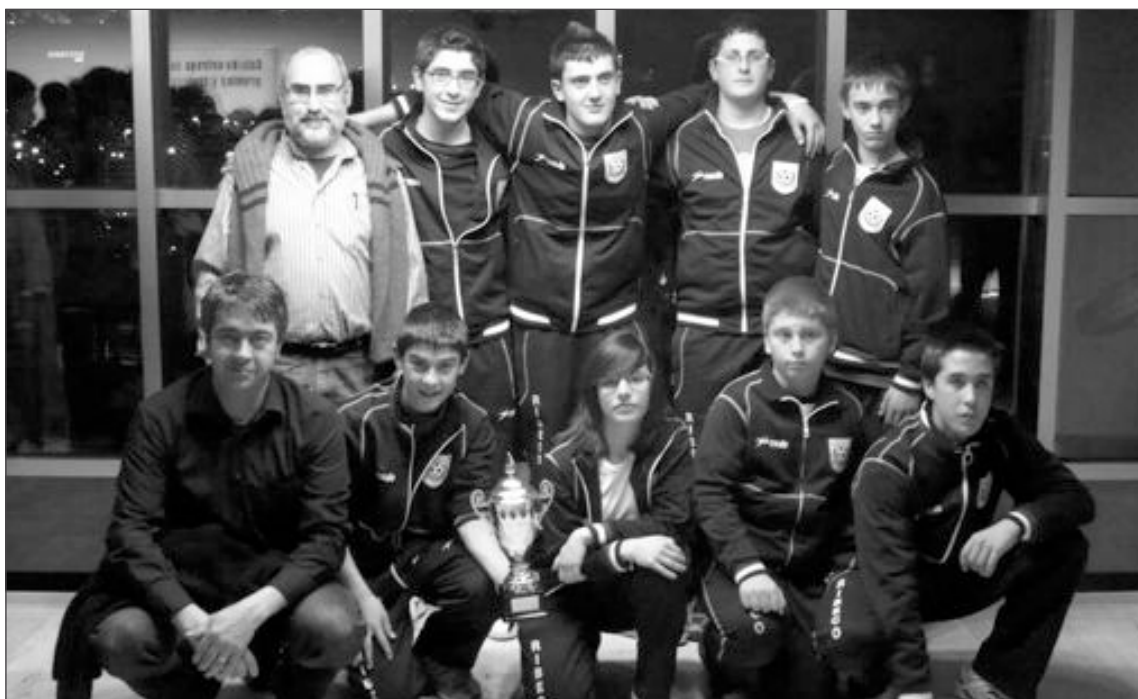
Jugadores del Ribeco Castalla con el trofeo conseguido