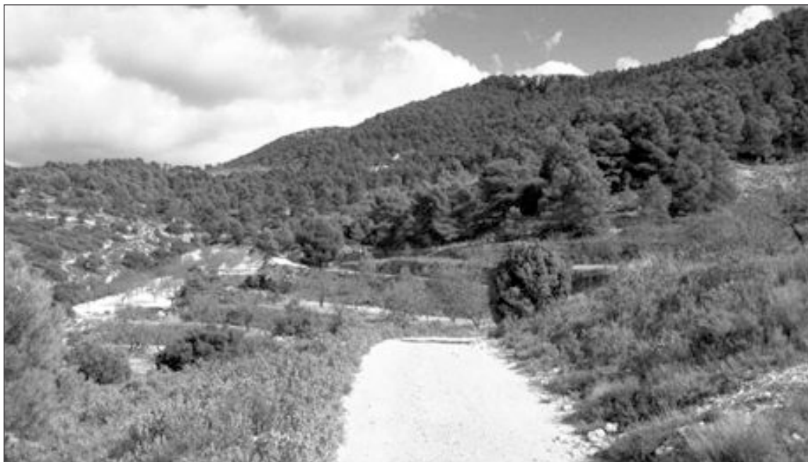
Zona del carrascal, camino hacia el refugio municipal dels Esbarzerets

El anuncio de la permuta en el DOCV lleva las firmas del presidente de la Generalitat, Francisco Camps y del consejero de Urbanismo, Juan Cotino. Los nuevos terrenos de la administración autonómica en Ibi están protegidos.