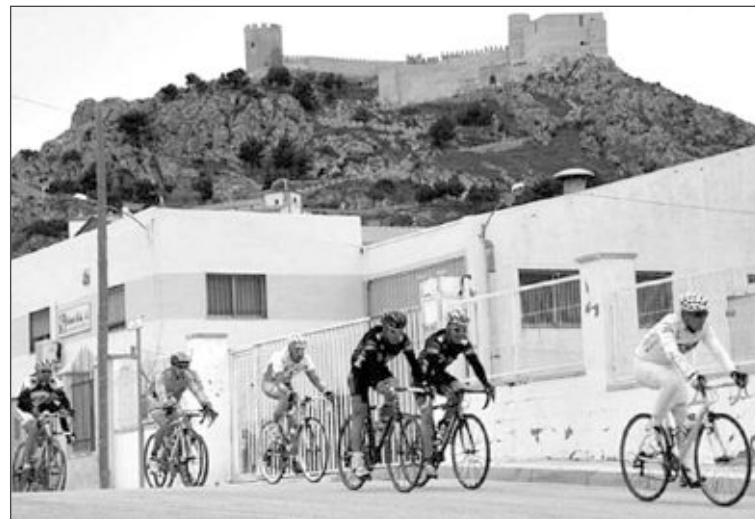
Los participantes a su paso por Castalla, en la etapa del domingo 28

Este fin de semana, el Club Ciclista Ibense intentó escalar puestos en la general por equipos para colocarse dentro del podio, consiguiendo solamente recuperar la cuarta posición