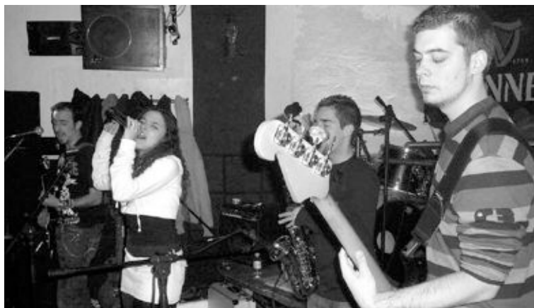
Verghuenza Ajena es uno de los grupos que actuará en Muro de Alcoy