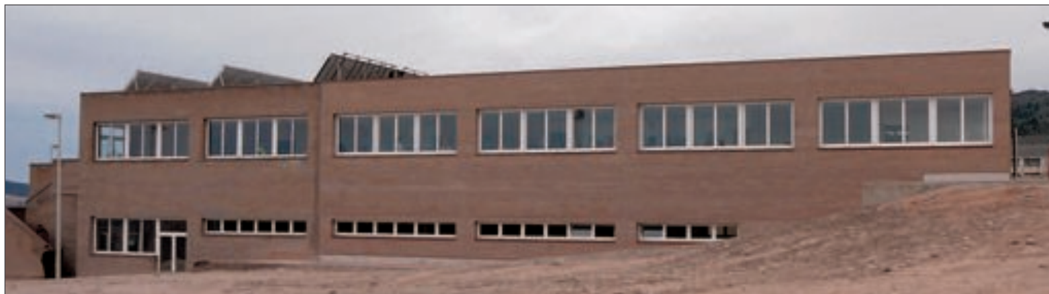
Los nuevos vestuarios están ubicados en la zona deportiva, frente a la pista de atletismo

La alcaldesa recordó los proyectos que han sido ejecutados gracias a los fondos del primer Plan E, que ha destinado a Onil cerca de 1'35 millones de euros, mientras que anunció que en breve serán licitadas las obras de la segunda fase de este programa gubernamental, del que a Onil le corresponden 833.400 euros. Uno de los pro-