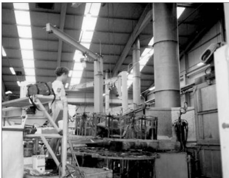
La Industria ha dado incorporado en febrero a 70 personas más