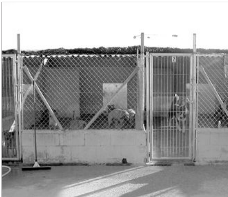
El albergue de Ibi es el quinto de España en número de adopciones

Al albergue ibense llegan de todas partes del país “porque saben que aquí no los sacrificamos, pero se olvidan de que hay que seguir manteniéndolos y esto tiene un coste mínimo