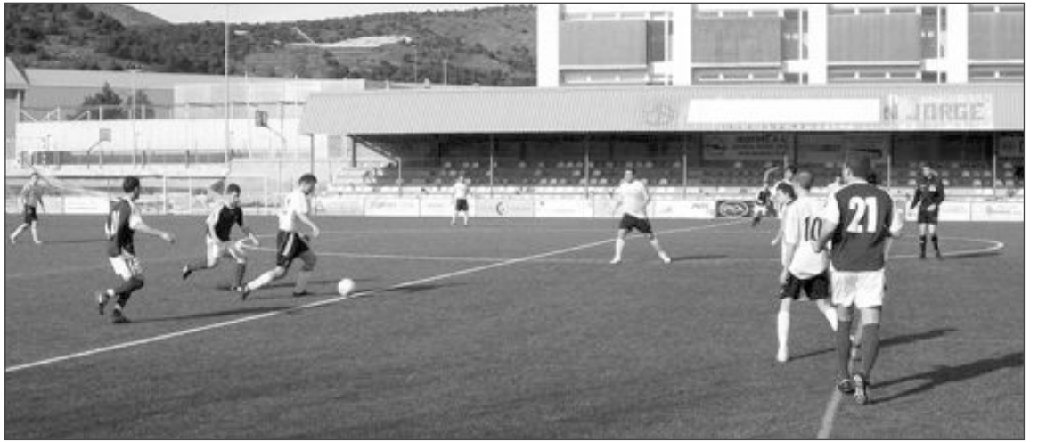
La Peña Madridista de Ibi y la Unión Deportiva Onil se enfrentaron en el Estadio Vilaplana Mariel

Tal y como recoge la noticia de la página 16, el sábado 6 de marzo al mediodía se celebrará la inauguración del cé-