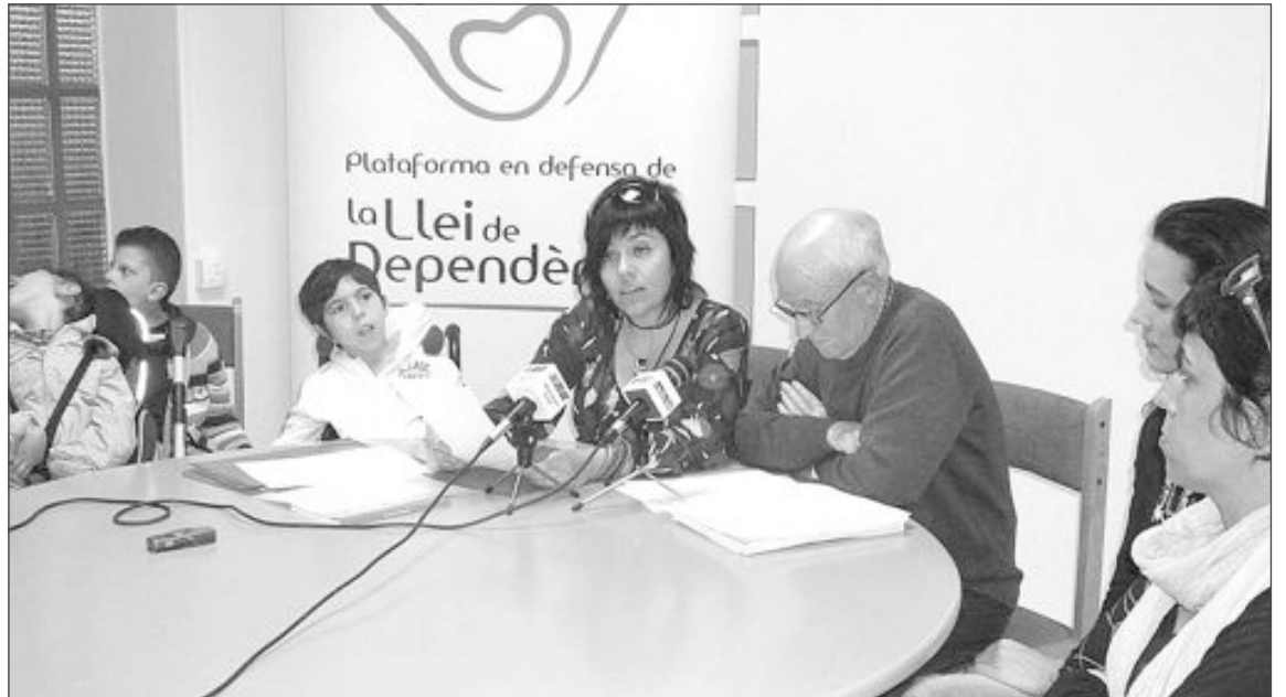
Miembros de la Plataforma en defensa de la Ley de Dependencia en la rueda de prensa del miércoles

bajo de muchas personas que dedican su tiempo y conocimientos a los que los necesitan y criticaban a la alcaldesa por haber calificado el acto 'Dependents a Escena', del pasado 7 de febrero de "indig-