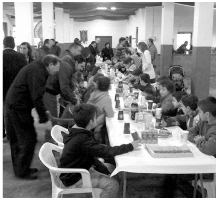
La Comparsa celebrará el sábado 27 de marzo otro almuerzo Chumbero