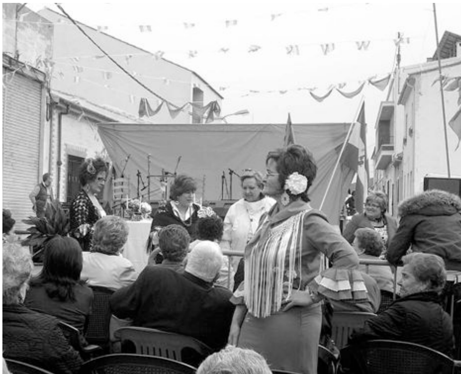
El domingo, frente a la sede, se celebró la misa rociera