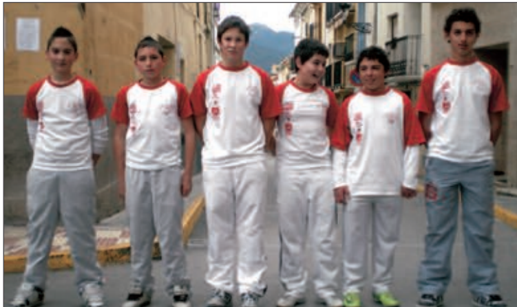
Plantilla del equipo Infantil

Por toda esta trayectoria, el Club recibió el pasado año, de manos de la Federación de Pelota, un premio extraordinario como reconocimiento por la recuperación de este deporte en Tibi y por el trabajo con la cantera, lo que convierte a la entidad tibera, sin duda, en un referente dentro del mundo de la pelota valenciana en