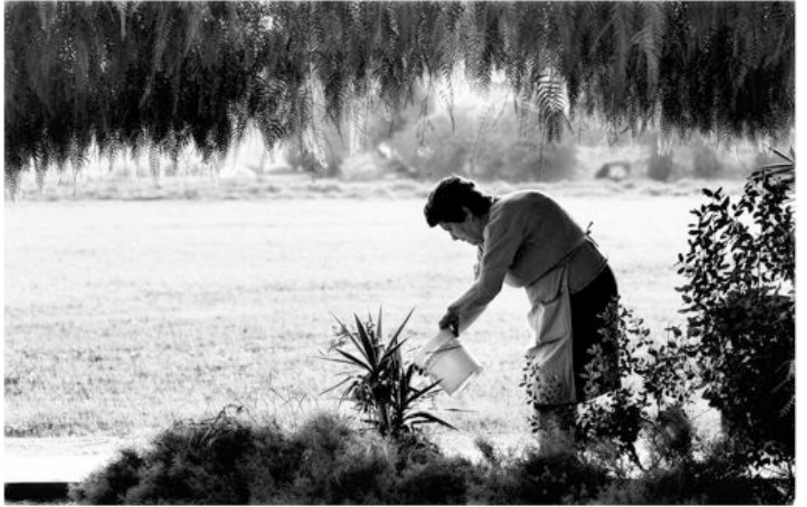
'Sanas costumbres', fotografía de Vicente Guill Fuster

Guill pertenece a la Agrupación Fotográfica de Castalla.