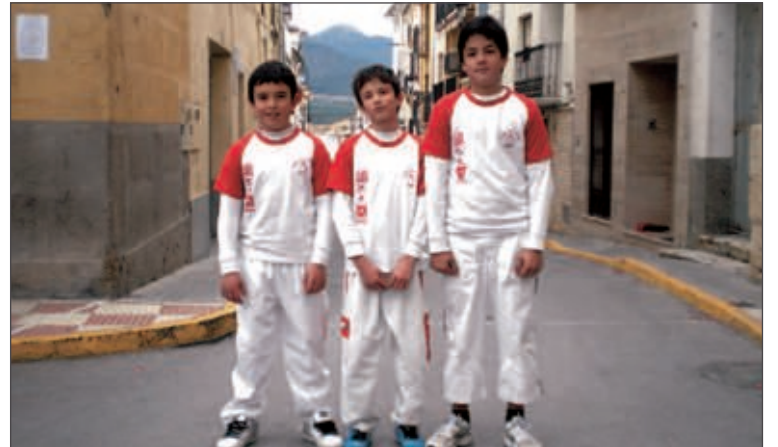
Plantilla del equipo Alevín