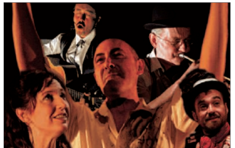
'El palomar de las cartas', obra de Maracaibo Teatro

Por otro lado, para los días 10 y 11 de marzo, miércoles y jueves, se ha programado en el Centro Cultural un taller de