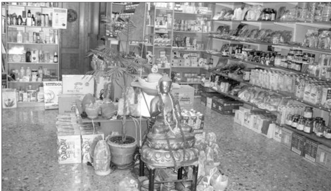
Interior del establecimiento ‘Darsis’, en la calle El Salvador, número 20, de Ibi

‘Darsis’ también ofrece tratamientos con flores de bach, flores de California, así como masajes tibetanos, jin shin jyntsu , masaje con mudras, masaje y vendaje deportivo,