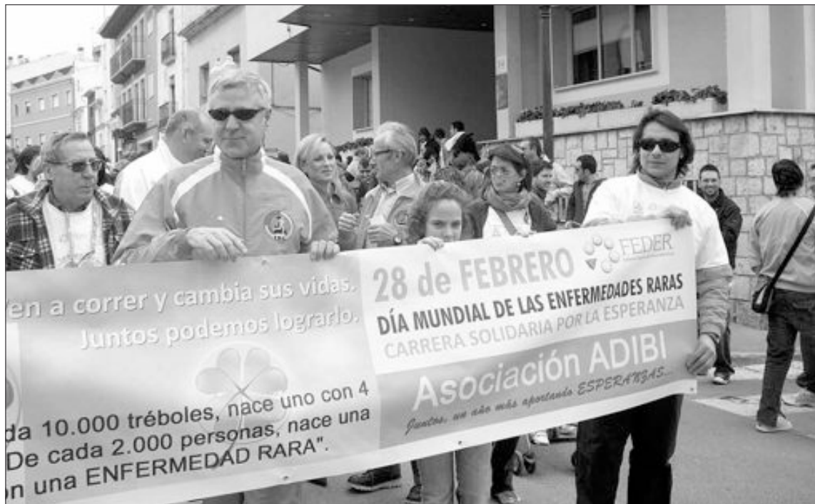
Pancarta que encabezaba la marcha popular que partió a las 12 horas de la puerta del Ayuntamiento

ADIBI ha logrado recaudar 615 euros que destinará a continuar con sus programas y poner en marcha talleres de terapia para los niños afectados por patologías poco comu-