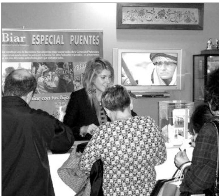
Las visitas guiadas son una de las propuestas estrella de Biar