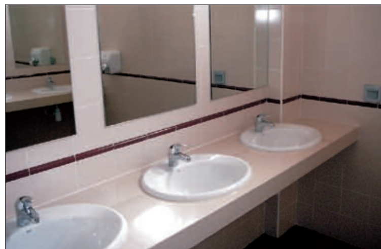
Zona de lavabos en uno de los vestuarios

manos de la alcaldesa un lote de muñecas del ‘Belén de Onil’, destacó “la importancia de los planes E desarrollados por el Gobierno de España”, que han permitido la inversión de 2'18 millones de euros en Onil entre los años 2009 y 2010, un dinero “esencial” para ayudar a la villa muñequera “a superar los efectos de la crisis”. Llinares defendió la necesidad de “seguir trabajando de manera conjunta entre todas las administraciones”, sean del color que sean.