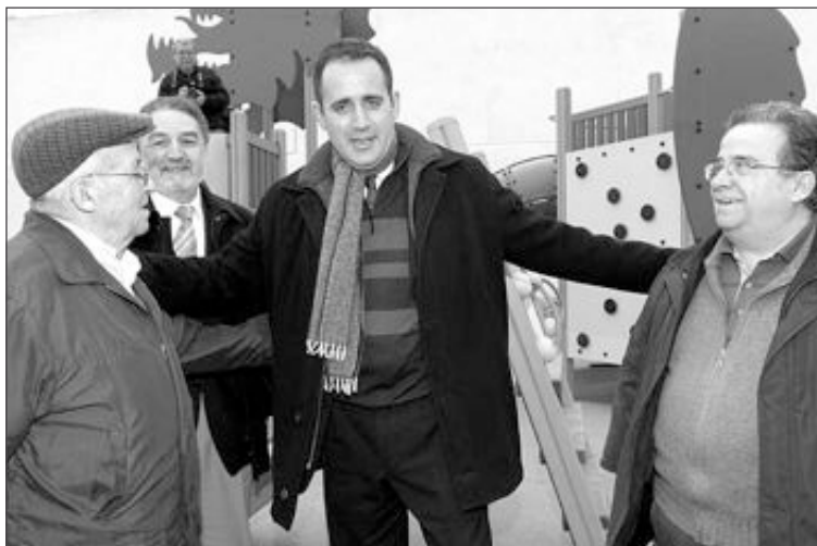
Alarte estuvo acompañado por miembros de asociaciones vecinales

“En los 541 municipios de la Comunidad presentaremos las mejores opciones y en Ibi