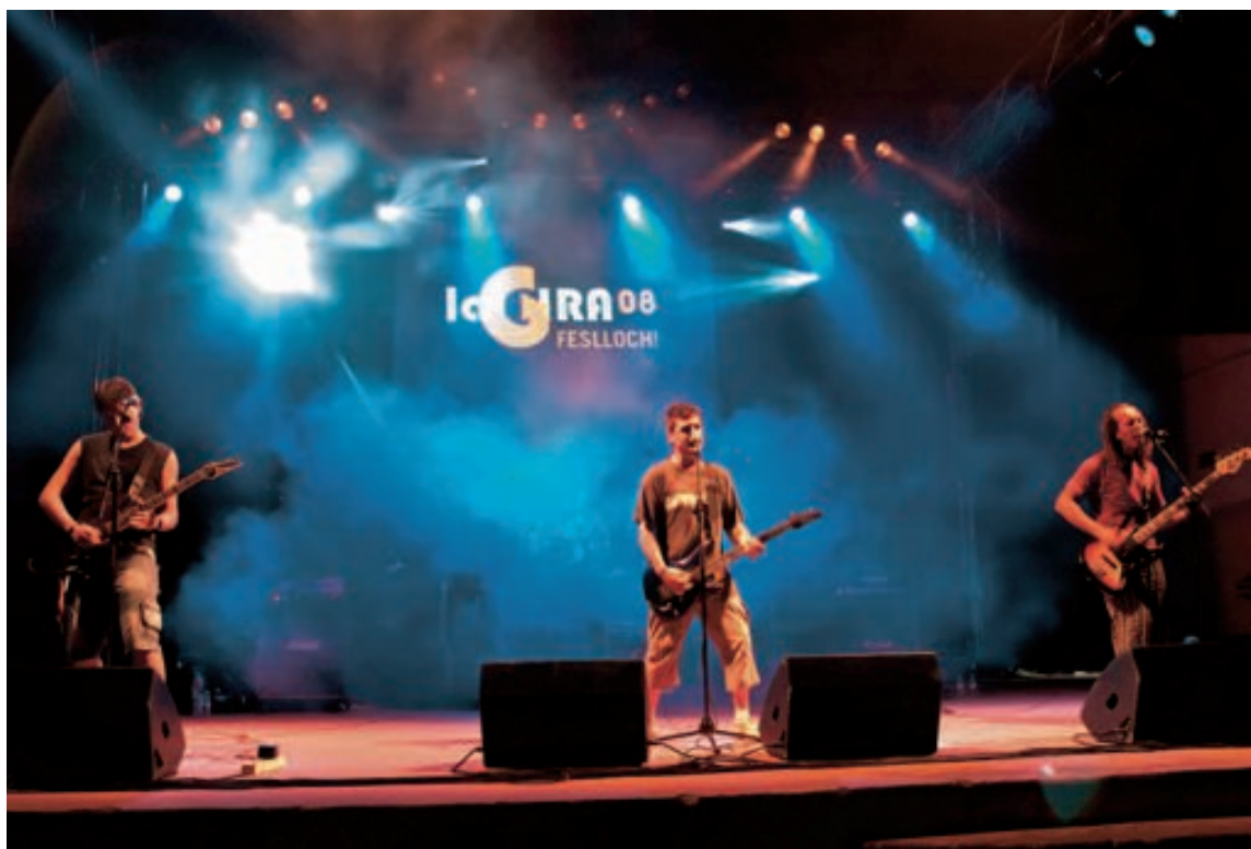
Actuación del grupo Entelèkia en el festival de música Feslloch , celebrado en 2008 en Castellón

La grabación y edición del álbum ya dura cuatro meses