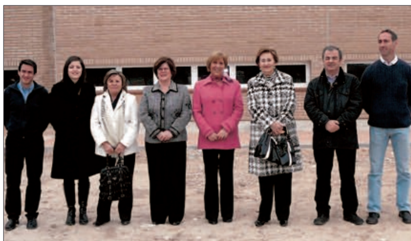
La alcaldesa y la subdelegada del Gobierno, junto a varios concejales, delante del nuevo edificio