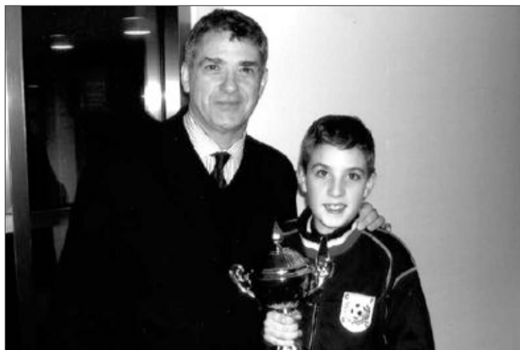
Un jugador del Sayma, junto al presidente de la Federación, Ángel M. Villar

Por un lado, el Ribeco Castalla marcha líder de su grupo, con muchas posibilidades de proclamarse campeón de liga, mientras que el Sayma Erju-toys es tercero. Asimismo, en la categoría Femenina, el Erju-toys Castalla encabeza la clasificación de su grupo.