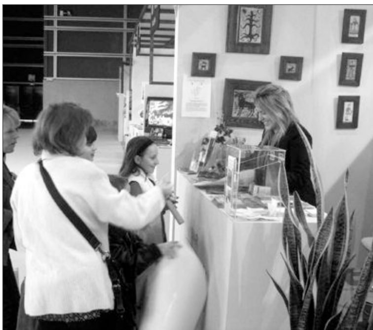
Stand del municipio de Biar en la pasada Feria de Turismo