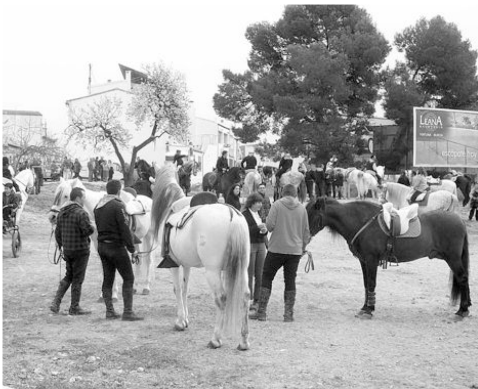
La concentración de caballos es uno de los actos que más público atrae