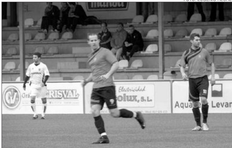
Imagen de archivo de un partido del Rayo Ibense