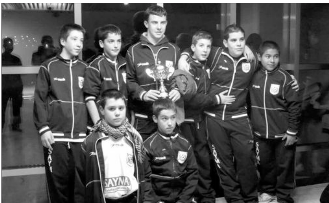
Jugadores del Sayma Castalla con el trofeo conseguido