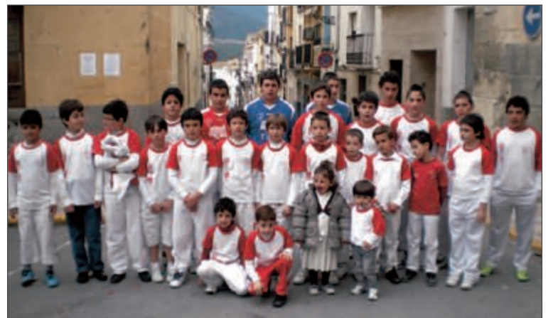
Alumnos de la Escola de Pilota