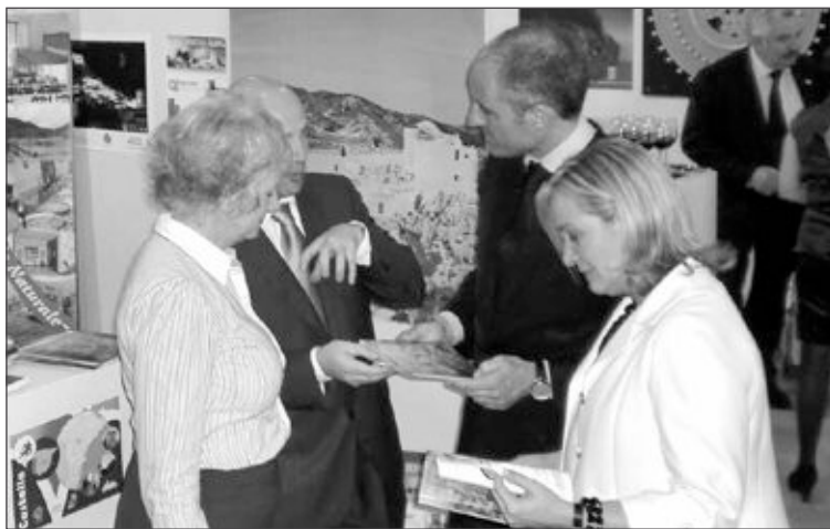
El presidente Camps y la consellera de Turismo en el stand de Castalla

El Ayuntamiento de Castalla asistió por quinto año consecutivo a la Feria Internacional de Turismo de la Comunidad Valenciana (TCV), que se celebró en Feria Valencia del 26 al 28 de febrero. Fuentes de la concejalía de Turismo afirman que los atractivos de Castalla despertaron gran interés entre los asistentes, sobre todo los aspectos relacionados con las audiovideo-guías del Castillo y la guía gastronómica.