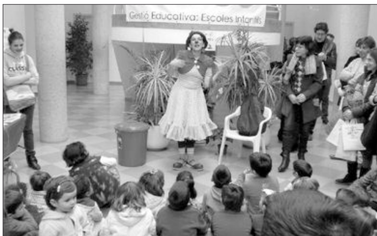
Un nutrido grupo de niños pudo disfrutar con la sesión de cuentacuentos ofrecida por la futura Escuela Infantil Municipal en la Casa de Cultura

La reunión informativa para los padres tendrá lugar el 11 de marzo a las 19 horas, también en la Casa de Cultura.