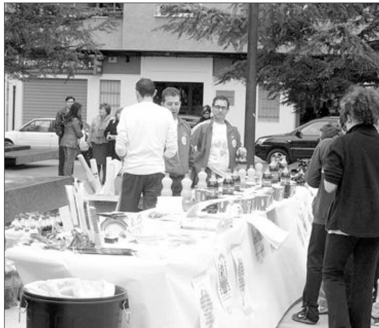
En la plaza Reyes Magos se ofreció un tentempié a todos los participantes