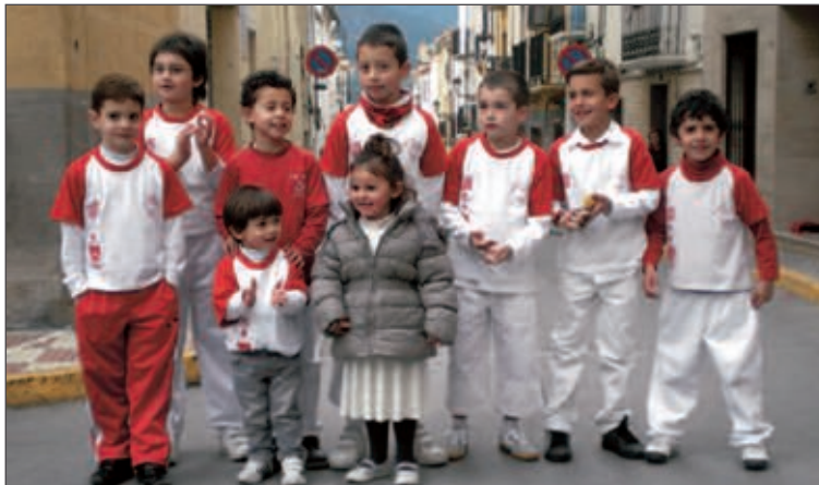
Plantilla del equipo Prebenjamín