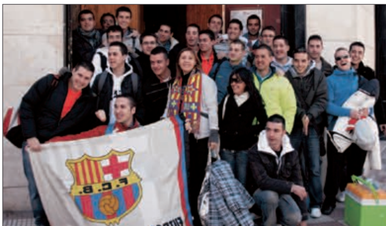
Los aficionados, delante del local castallense que consiguió el viaje

Un grupo compuesto por 35 clientes de un céntrico local de ocio de Castalla viajó el sábado 20 de febrero al Camp Nou de Barcelona para presenciar en directo el encuentro de Liga Barça-Racing, gracias a la 'Experiencia Bus de Coca-Cola'. Los castallenses disfrutaron con el 4-0 del Barça.