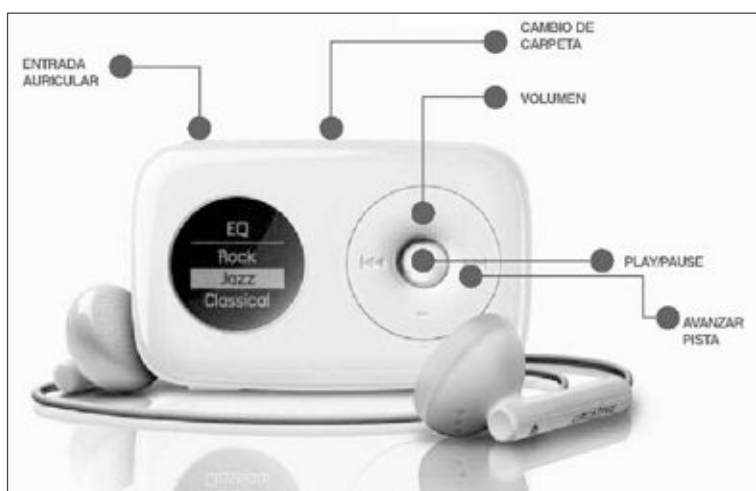
La imagen muestra las partes de una audioguía