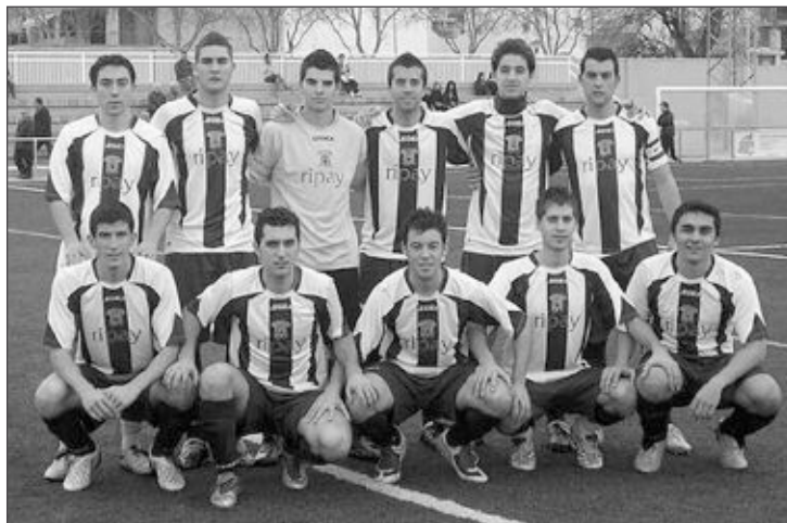
Plantilla del Castalla con la nueva equipación