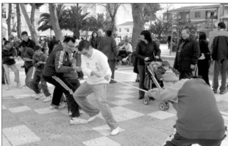
Entre las actividades organizadas por la Cofradía de San Roque para celebrar el II Medio Año hubo diversos juegos en el Parque Municipal

Se realizaron varias actividades, tales como una donación de sangre en la Casa de Cultura, donde había previstos 45 donantes y se presentaron 61, de los cuales 40 eran hombres y 21 mujeres. Cuatro fueron rechazados, se consiguieron ocho donantes nuevos y se