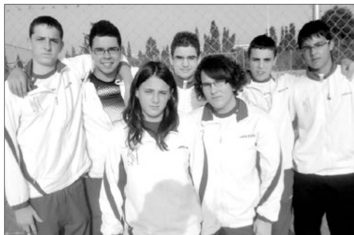
Jugadores del equipo Cadete del Club de Tenis Teixereta de Ibi

El equipo Sénior 'B' quedó Campeón en el II Torneo Comarcal, ganando en la final a domicilio al Club de Tenis Ollería por un contundente 5 a 2. El equipo Sénior Absoluto se encuentra inmerso en plena competición de la Federación Valenciana. El primer enfrentamiento fue en Elda contra el Club de Campo,