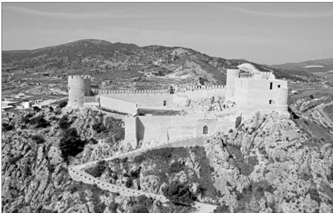
Vista panorámica del Castillo de Castalla

Prats anunció que este año verá la luz otro proyecto, esta vez relacionado con el medio ambiente, otra gran baza turística de Castalla.