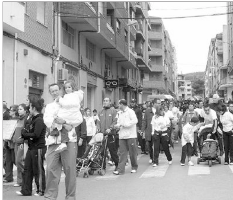
La marcha recorrió dos kilómetros por las calles del casco urbano