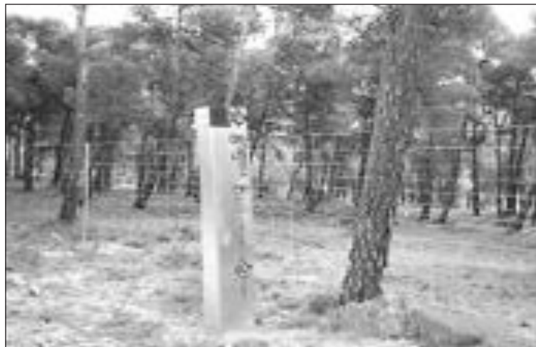
Una de las señales que indican la Font Roja, junto a la valla

La alcaldesa ha asegurado que “si el propietario de la finca no cumple el decreto de restitución y eliminación de estos cerramientos, se aplicará la orden de ejecución de dicho decreto de alcaldía”.