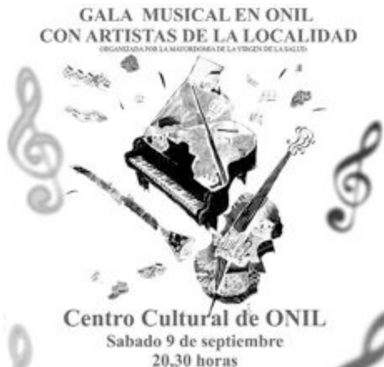
Cartel anunciador de la gala que se celebra el sábado 9 de septiembre