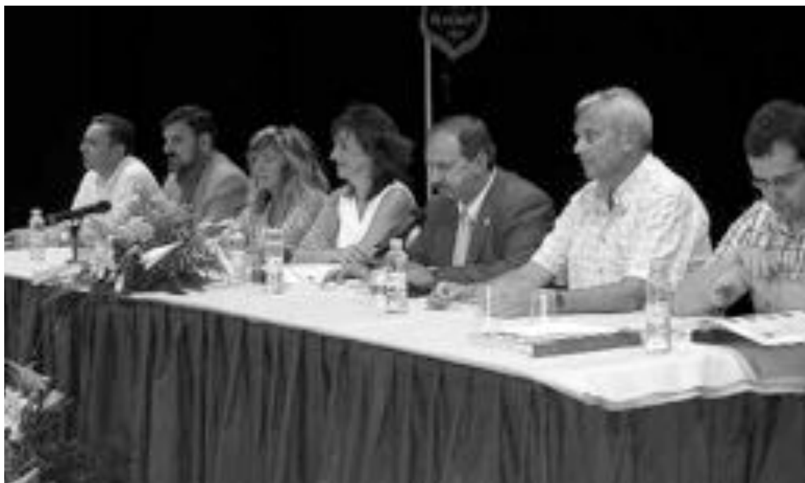
Autoridades festeras y municipales durante el acto de presentación del libro de fiestas de este año

virgo Tus sueños se harán realidad, aunque no todos; bueno, sólo uno: concretamente ése en el que te persigue un perro y tú te caes y el perro intenta cubrirte y chillas y nadie te oye y..., en fin, ése.