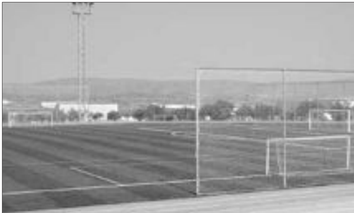
El nuevo campo de fútbol municipal será objeto de mejoras.

El alcalde, Cristóbal Román, ha convocado para el próximo 5 de septiembre un Pleno extraordinario donde se aprobará el proyecto y la solicitud de inclusión en el Plan de Instalaciones Deportivas de la Diputación de Alicante, en su anualidad 2007-2012.