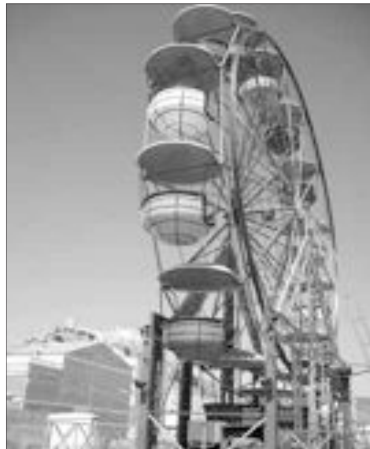
La feria de atracciones mecánicas está instalada junto al Polideportivo

Asimismo, el mercadillo ambulante, que ocupa las principales calles del centro todos los martes y sábados por la mañana, no será instalado el día 2. Tampoco abrirá la Casa de Cultura, que permanecerá cerrada hasta el miércoles.