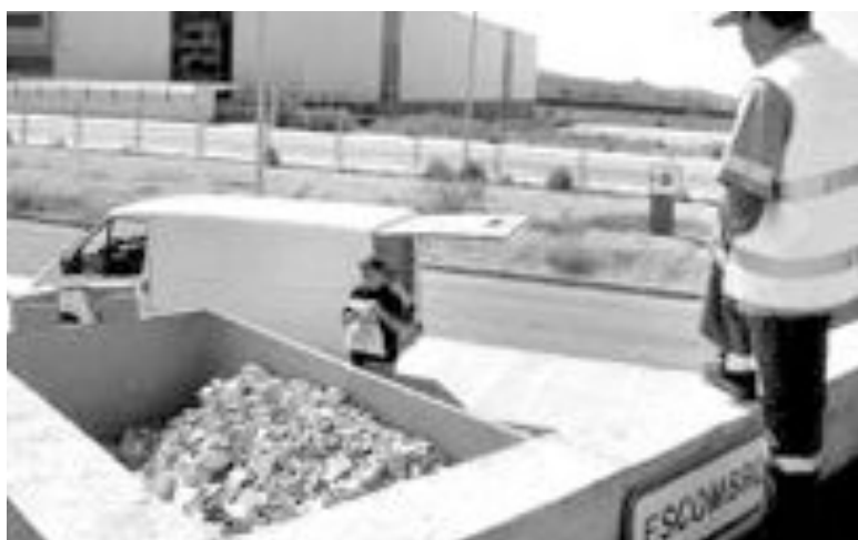
Un usuario del ecoparque tira escombros en el contenedor específico para este residuo