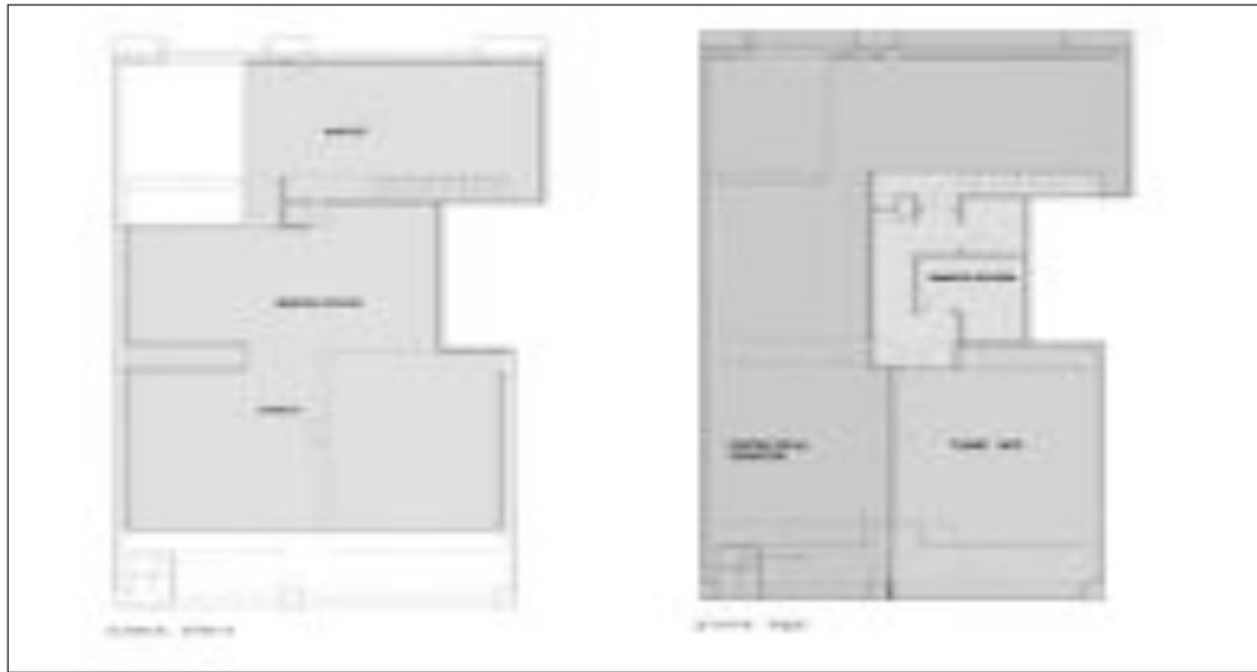
Plano de la Tourist Info y el Centro Juvenil, dispuestos en dos plantas a través de una estructura de madera