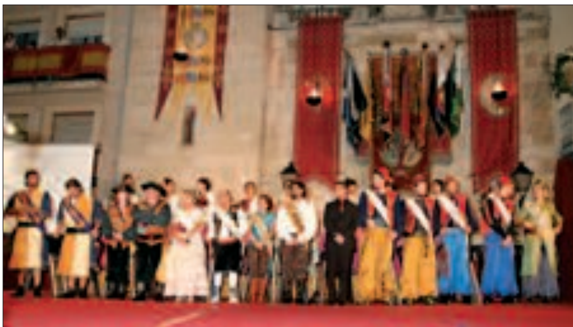
Las Damas, la Reina y los Capitanes, sobre el escenario instalado en la Plaza Mayor