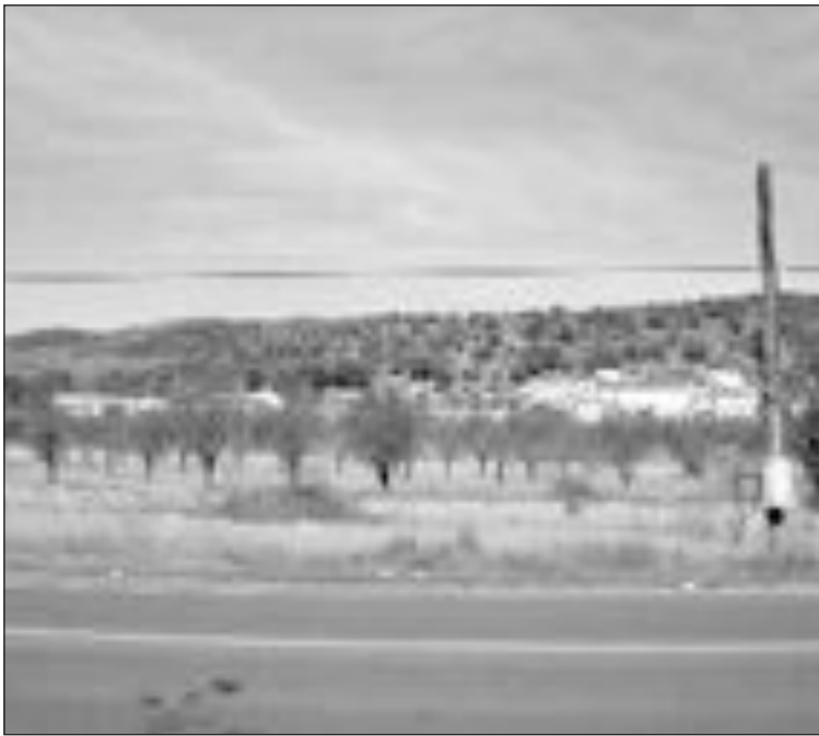
Terrenos donde se ha proyectado la urbanización del Alamí