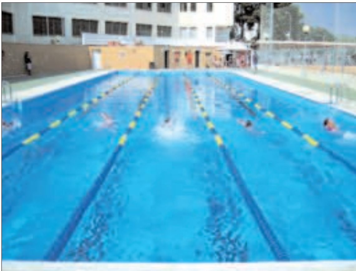
Las pruebas del campeonato se celebraron en la piscina del Estadio Climent