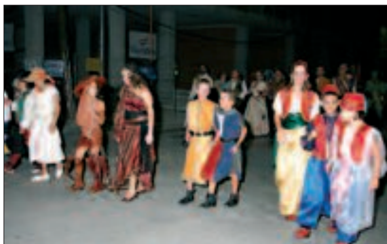
Els Àngels de la Rodella, antes de subir al escenario