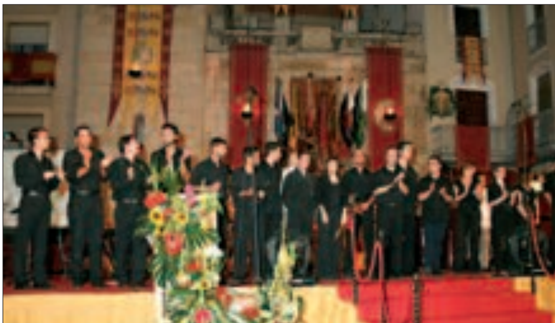
La Escuela de Música de 'El Sogall' protagonizó un brillante concierto