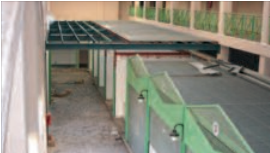
La parte cedida al CIMO, al fondo, está siendo reestructurada para crear la sala de ensayos y oficinas