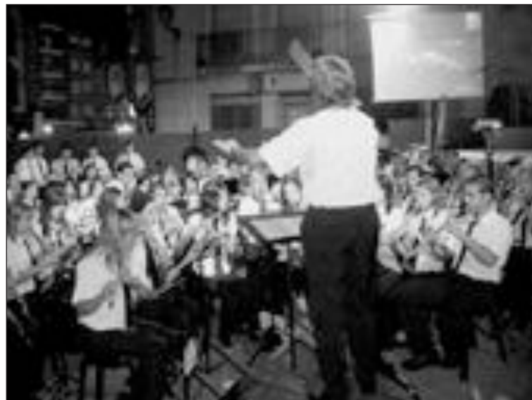
La Agrupación Musical Santa Cecilia actuó en la Exaltación de Fiestas

La Escuela de Música de la Agrupación Musical Santa Cecilia de Castalla abrirá después de Fiestas el periodo de matriculación para el curso 2006/07. Concretamente, la matrícula gratuita puede formalizarse los días 7, 8, 11, 12 y 13 de septiembre de 18 a 22 horas en la sede de la Agrupación. La Escuela de Música imparte, entre muchos otros, cursos de piano, trombón, trompeta, clarinete, flauta, saxo, violín, percusión, lenguaje musical y jardín musical (para niños de 4 a 6 años).