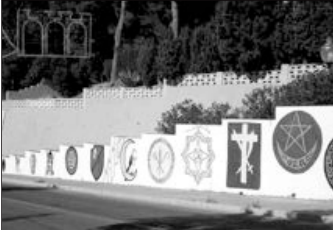
La avenida Joaquín Vilanova cuenta con este graffiti festero

Con este cambio se pretende potenciar este acto ya que, tras la Procesión, son numerosas las personas y festeros que se congregan en la plaza. Hasta ahora, el castillo de fuegos artificiales se lanzaba desde el río.