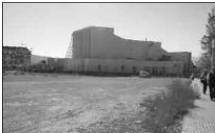
El Palacio de Justicia se ubicará al lado del Centro Cultural