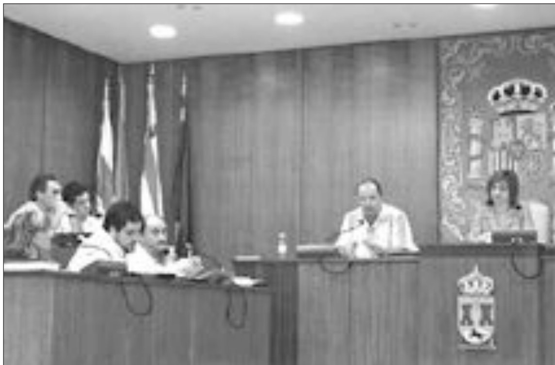
Miembros del equipo de gobierno durante un pleno

ran ambos acuerdos, se argumenta en el citado informe, las consecuencias podrían ser tanto de orden jurídico como penal y conllevar la producción de daños y perjuicios de responsabilidad patrimonial.