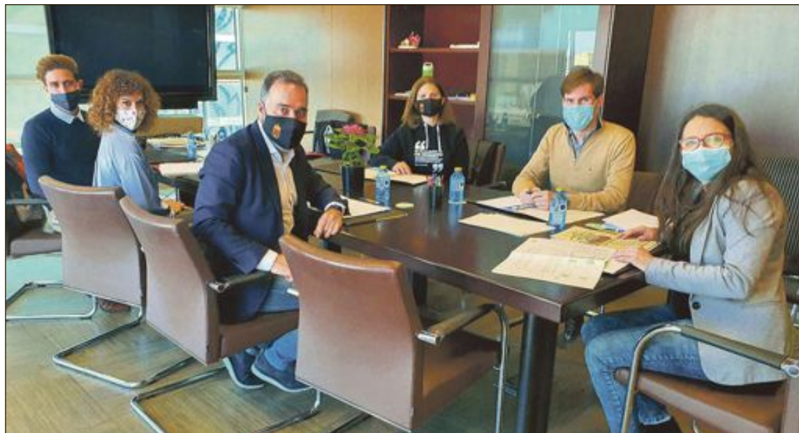
El alcalde, la edil de Servicios Sociales y técnicos municipales se reunieron por última vez con la consellera de Igualdad y Políticas Inclusivas, Mónica Oltra, el 28 de diciembre de 2020

Según explica el alcalde, el servicio será público y ofertará