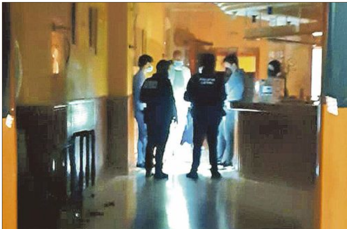
Al local, situado en la calle Manuel de Falla, acudieron agentes de la Policía Local alertados por los vecinos