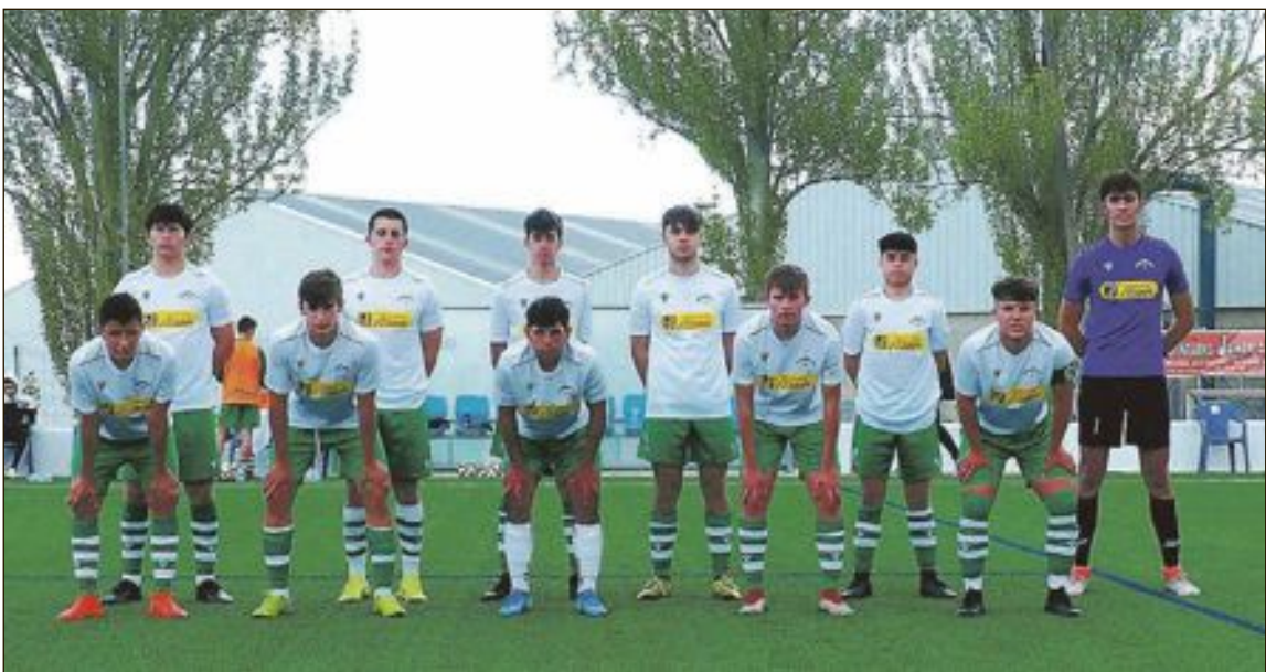
Equipo titular del Juvenil 'A' de la Peña Madridista de Ibi en su encuentro ante el CF Castalla 'A'