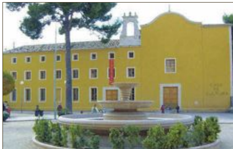
Els actes es celebraran en la Casa de Cultura

Així mateix, en l'acte, es presentaran les bosses per a llibres que s'han dissenyat des de l'Agència de Lectura de Biar i la presentació d'un joc de cartes amb espectacle musical i teatral