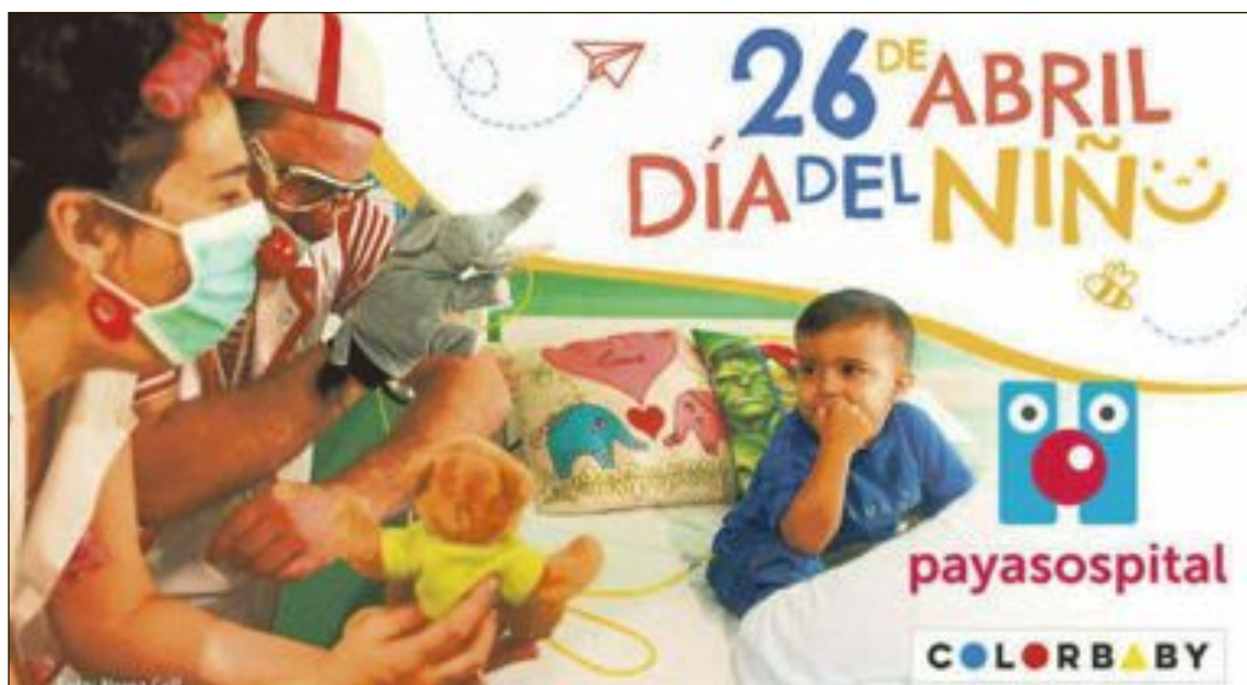
La empresa ibense y Payasospital colaboran juntos para llevar esta iniciativa a los hospitales

La empresa ibense y Payasospital colaboran juntos para llevar esta iniciativa hasta los hospitales de la provincia de Alicante y según explican desde la mercantil, ambas entidades han dado con la fórmula perfecta para seguir haciendo sonreír y alegrar la vida a los niños y niñas hospitalizados.