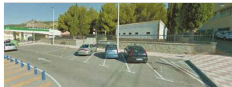
El aparcamiento estará ubicado frente al coto escolar

A las espera de que en las próximas semanas se avance con este proyecto, la primera edil ha revelado que hay dos inversiones que pueden encajar en el Plan Convivint, uno es el centro de día y el segundo es una centro para enfermos de Alzheimer.