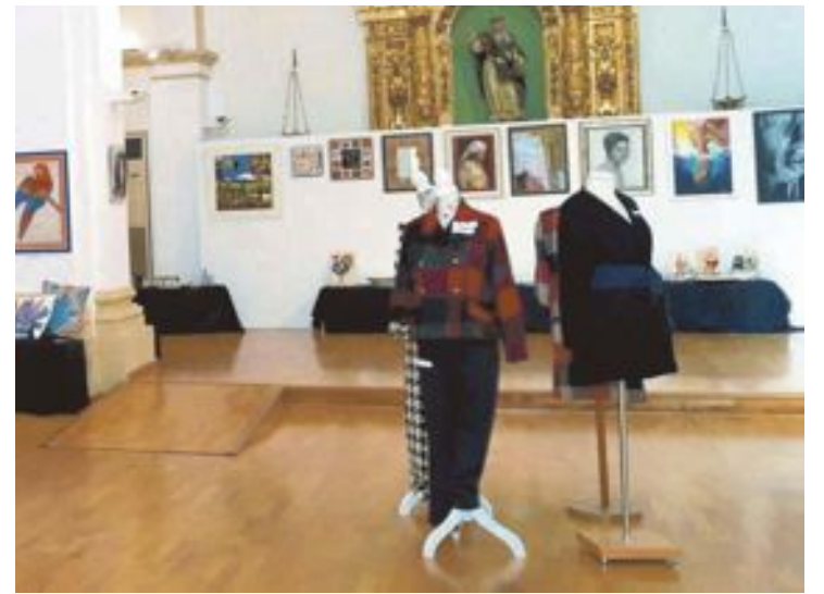
Exposició de Manualitats, Tall i Confecció, Costura i Ceràmica d'altra edició

El precio de las entradas oscila entre los 7 y los 30 euros, teniendo en cuenta los descuentos para mayores de 65 y menores de 30 años.