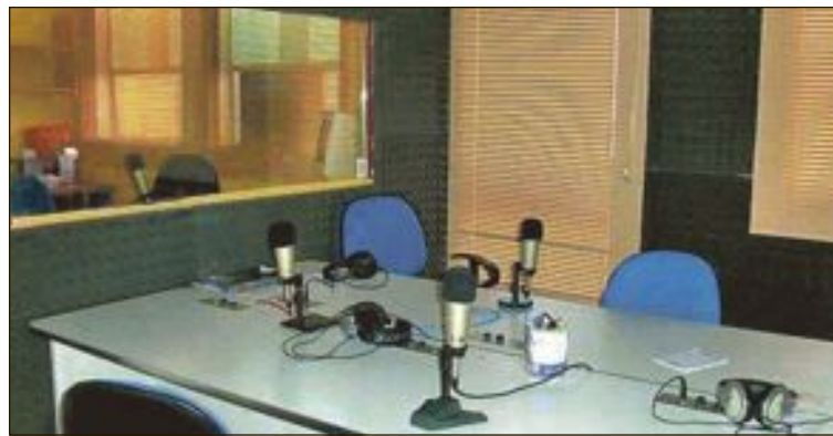
Noves instal·lacions de Don Bosco Ràdio