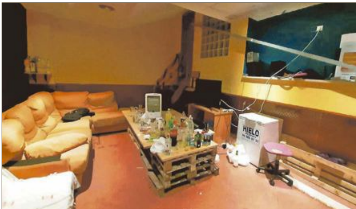
El local fue en su día un establecimiento público con licencia de pub en la calle Manuel de Falla

En total fueron identificadas once personas, de las cuales