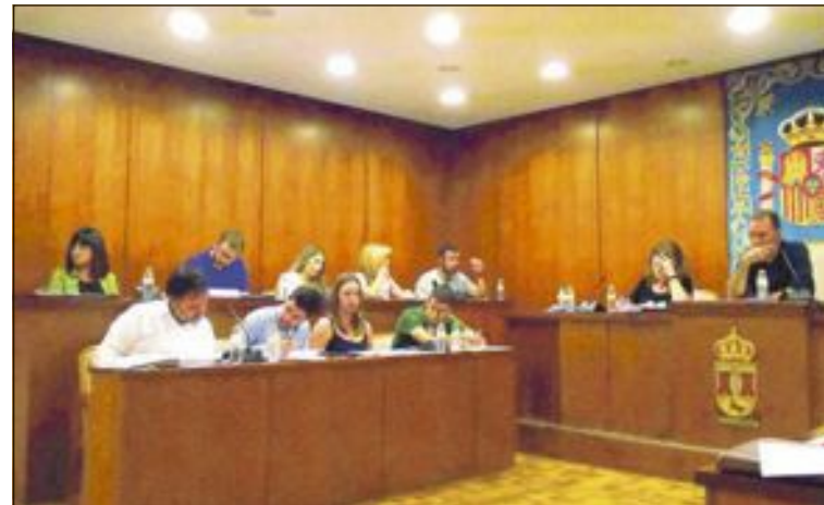
El equipo popular en una sesión plenaria. Imagen de archivo

En cambio, para el PP, el voto en contra de Som Ibi “significa negar al municipio una mayor inversión, estar en contra de una apuesta por ayudar a nuestras empresas y comercios, y rechazar unos presupuestos marcadamente sociales, que suponen la mayor movilización de recursos propios de la historia del Ayuntamiento”. Además, aseguran los populares que “la posición radical de este partido, supuestamente local, no nos sorprende cuando anunciaron que, por discrepancias ideológicas,