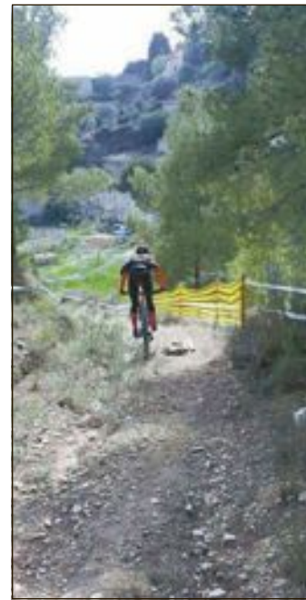
El circuit ja està preparat

El circuit pràcticament ja està preparat i destacar el treball que està realitzant el club organitzador amb el suport de l'Ajuntament de Tibi.