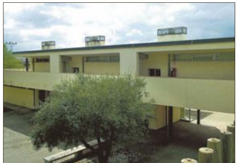
El futur geriàtric tindrà una capacitat al voltant de 50 places

“més de tres anys de reunions amb responsables de Generalitat, un treball continuat des de la legislatura anterior, perquè dos projectes tan importants per a nosaltres veja finalment la llum”.