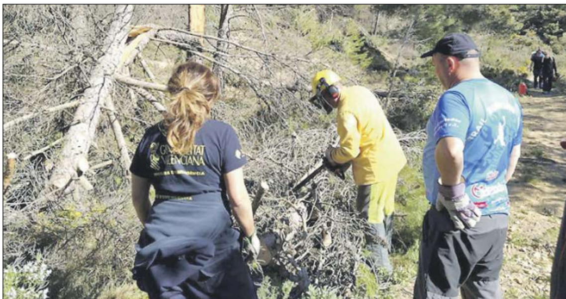
Operarios realizando tareas de desbroce en la sierra de Onil

Se da la circunstancia de que en 2021, los dueños de los terrenos obligados a presentar los planes forestales sufragaron los cos-