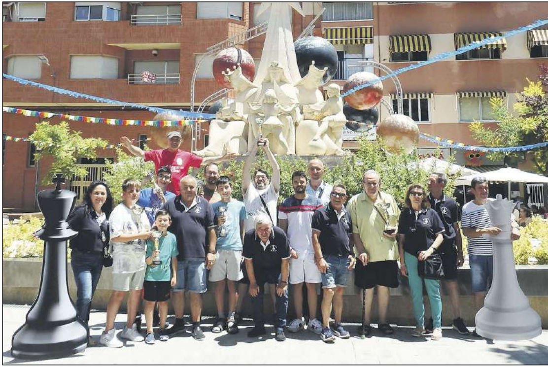
Foto de grupo con los premiados en las distintas categorías del Torneo de Ajedrez La Esperanza-Reyes Magos