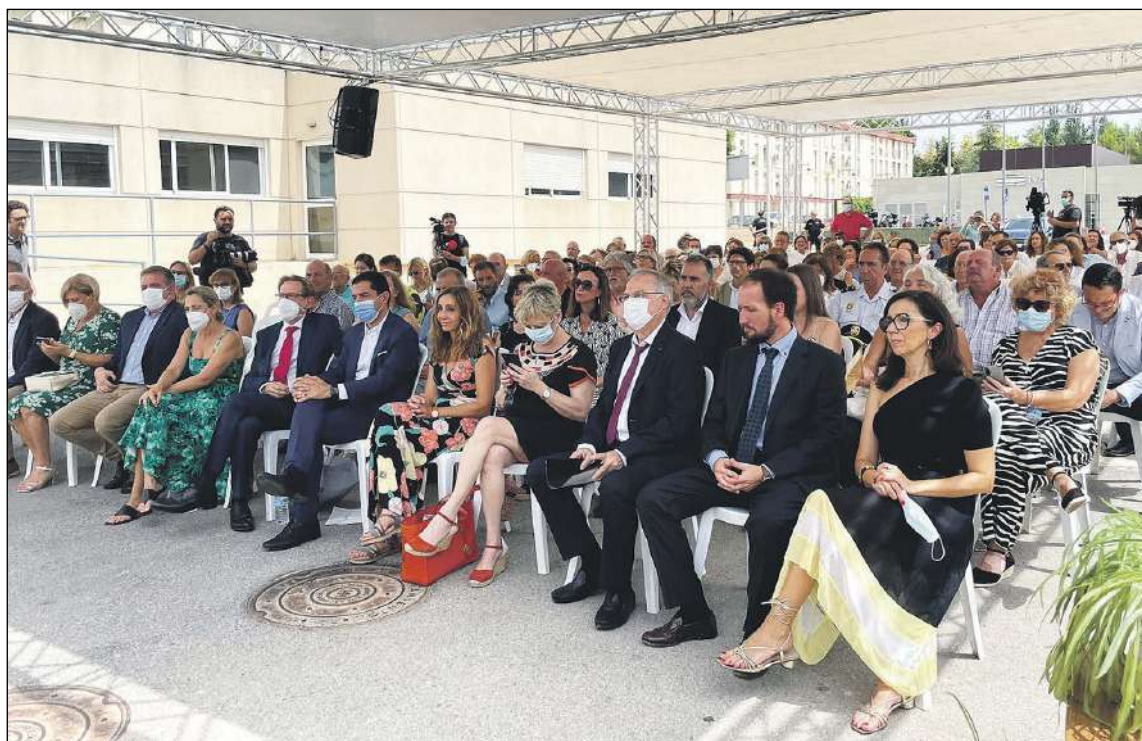
El 5 de julio se celebraron los actos conmemorativos del 50 aniversario del Hospital Virgen de los Lirios de Alcoy

El total de decesos desde el inicio de la pandemia asciende a 9.588 y, de ellos, 3.645 se han producido en Alicante.