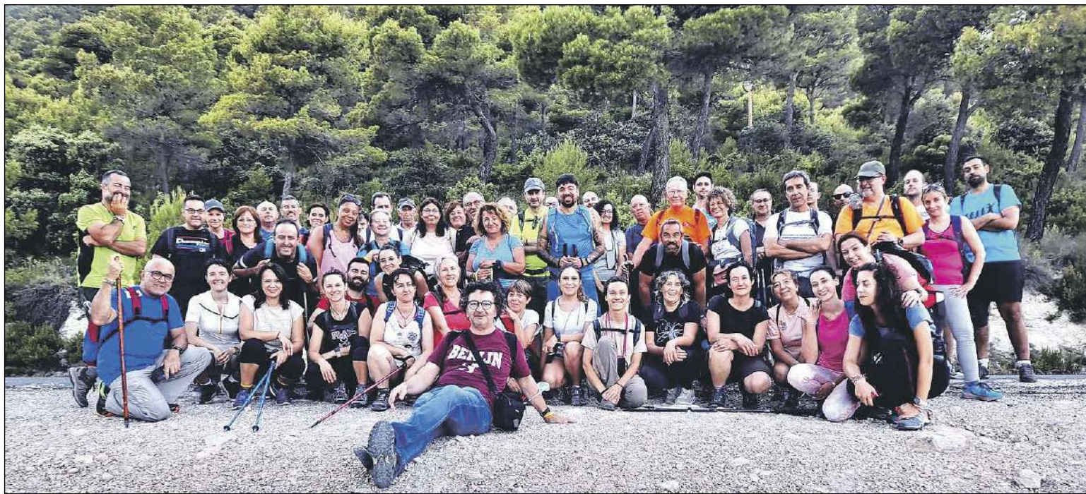
Van participar 54 persones en esta segona ecoruta a l'Alt de Guisop en modalitat nocturna

La pròxima ruta de la regidoria de Medi Ambient tindrà lloc el 20 d'agost.