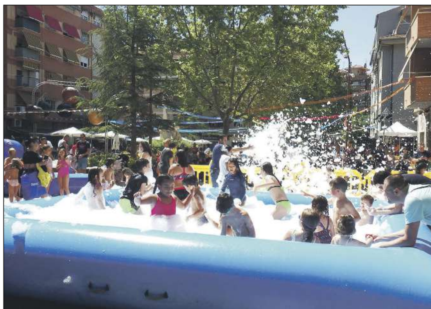
Muchos niños y niñas participaron de la fiesta de la espuma