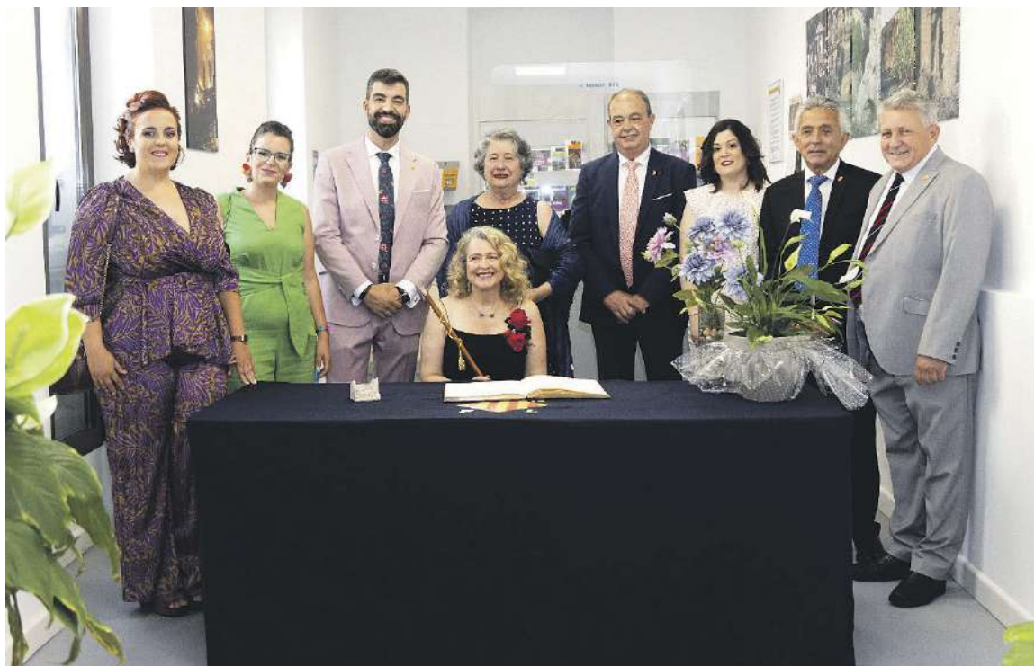
La corporació municipal amb la pregonera abans de la celebració de la proclamació