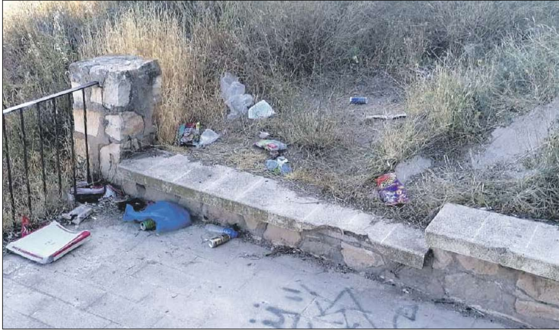
Suciedad y maleza en varias zonas del municipio

De la misma, Som Ibi incide en la limpieza de solares públicos y privados, así como de los parajes y zonas donde aparece gran cantidad de maleza. En la actualidad, «seguimos viendo solares con gran cantidad de