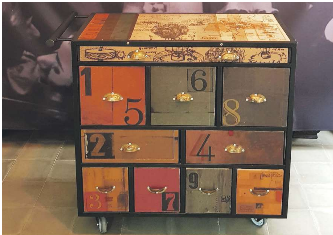
L'artefacte principal és un moble dissenyat segons els típics calaixos que s'utilitzaven en les fàbriques per a emmagatzemar diferents ferramentes de treball, d'ací el seu nom

L'exposició mostra també tots els recursos educatius que acom-