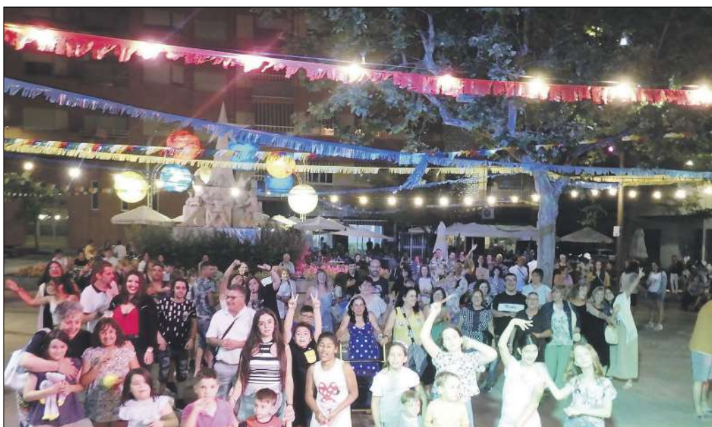
Todas las noches hubo baile con discoteca móvil en la plaza de los Reyes Magos

El punto final lo puso un espectacular castillo de fuegos artificiales.