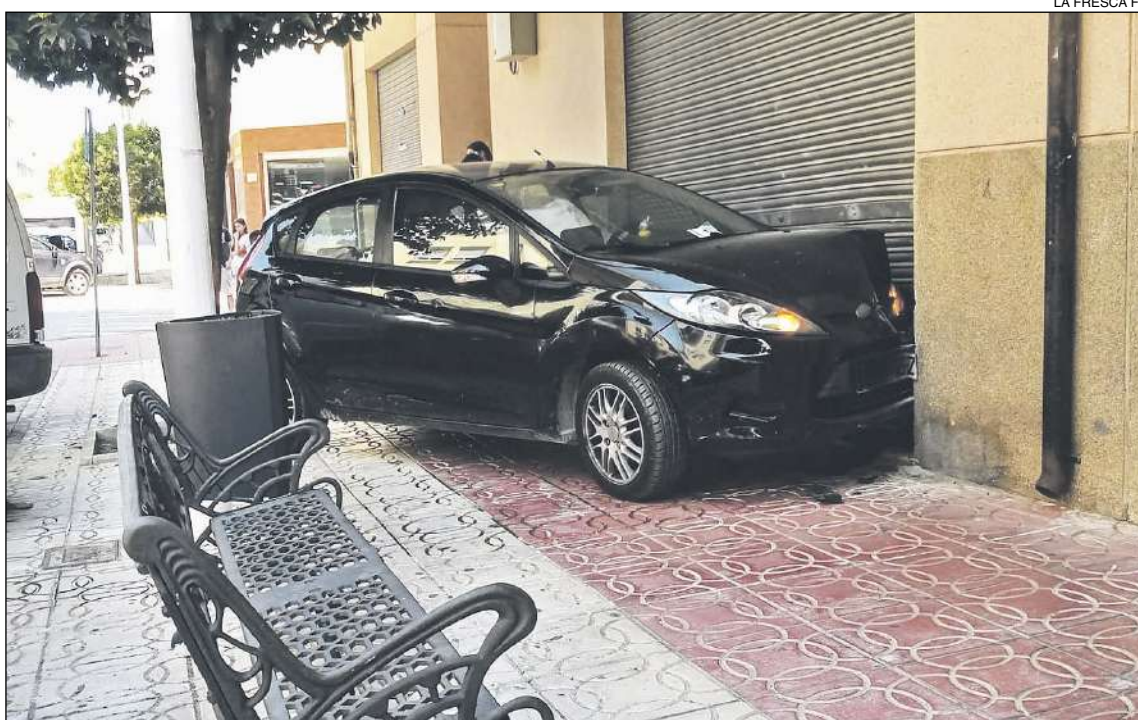
El vehículo quedó empotrado contra un garaje de un edificio comunitario

Se desconoce si se le hizo la prueba de alcohemia y de drogas por parte de los agentes de la Policía que estaban en ese momento de servicio.