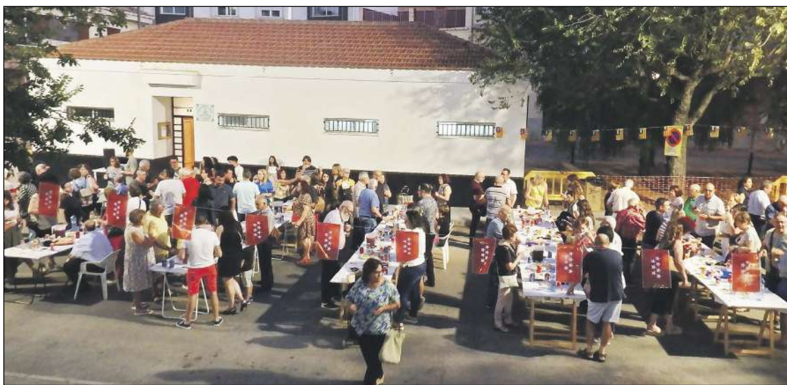
Con el vino de honor para socios se inauguraron el viernes 8 de julio las fiestas del barrio