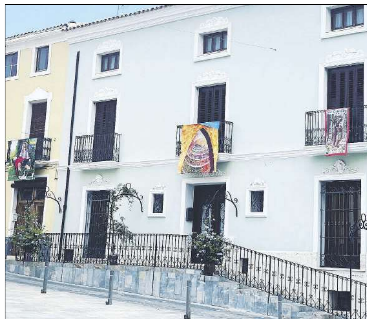
El 23 de julio se inaugurará la exposición de telas pintadas, que cuelgan de los balcones de plazas y calles de Biar

Del 8 al 10 de agosto, a las 22:30 horas, en la plaza de Con-