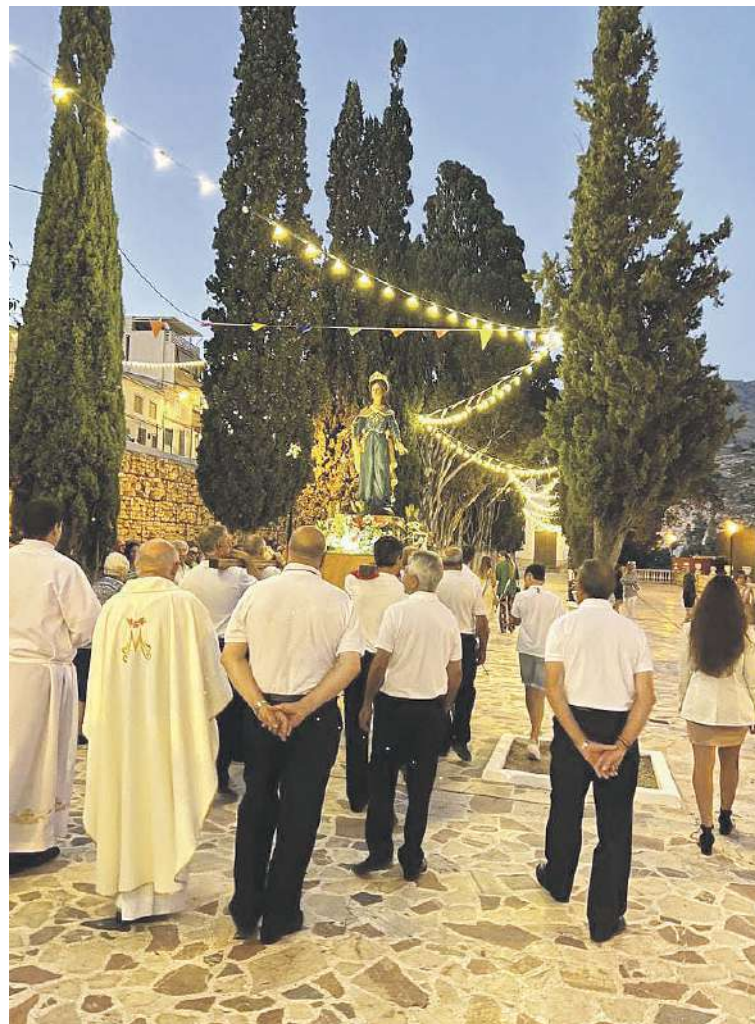
Al finalizar la misa, se realizó una pequeña procesión por el paseo

campana en la parte trasera de la ermita donde está el olivo y donde se coloca la imagen de la Santa. Al finalizar, se realizó una pequeña procesión por el paseo y fue el día 14 cuando tuvo lugar el traslado de la imagen desde la ermita hasta el templo parroquial.