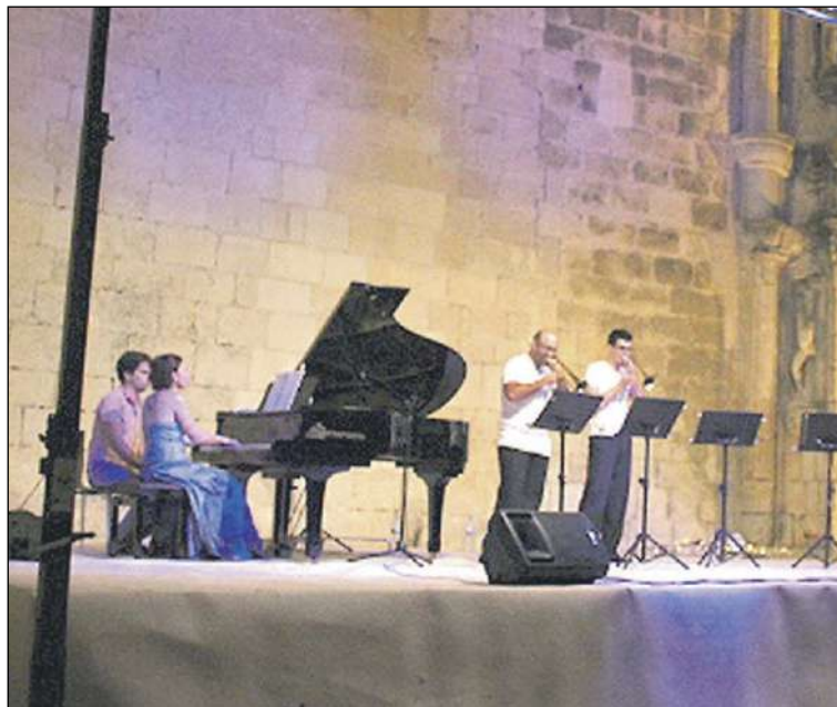
A partir del 21 de julio comienzan las Jornadas Trombonistas