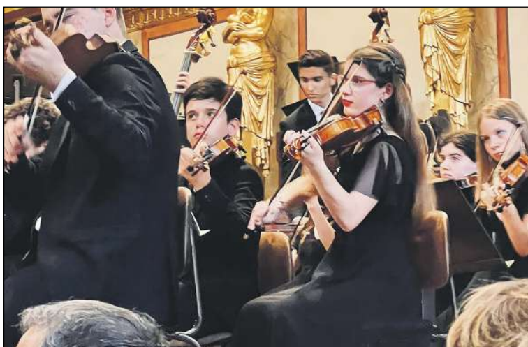
La orquesta Ensemble de la Mediterrània està integrada por músics de 10 a 22 anys