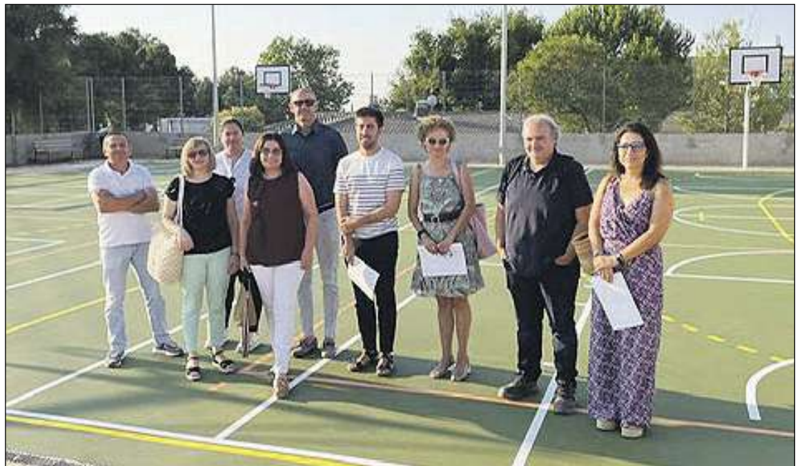
El acto de recepción se realizó en el centro escolar el jueves 14 de julio