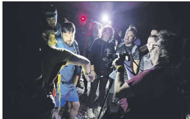
La pròxima ruta serà el 20 d'agost