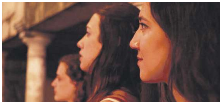
Actrius de la companyia de teatre

En aquest espectacle la companyia proposa tornar a les nostres arrels per entendre millor qui som. Un viatge als nostres fonaments, a la gent que ens ha precedit, a la gent que ens ha donat la vida i la paraula, a les arrels de la terra que ens ha vist nàixer; un espai de recupe-