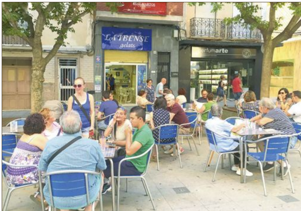
Las heladerías podrían empezar a abrir al público a finales de este mes

Respecto a las tasas, el presidente en funciones advierte que los comercios y establecimientos llevan un mes y medio sin ingresos, a pesar de que siguen haciendo frente al pago de las cuotas de autónomos, seguridad social, IVA y IRPF, y la gran