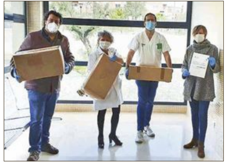
El material sanitario se ha repartido entre el asilo San Joaquín, el Centro de Salud de Ibi y los hospitales de Alcoy y Elda

Esta colaboración se suma a una serie de donaciones desde Smurfit Kappa Ibi de material sanitario a una serie de entidades públicas por un valor de 3.000 euros.