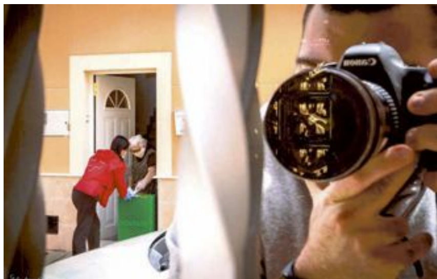
Voluntarios de la Cruz Roja, durante el reparto a los domicilios

Un proyecto que le reconforta y que le hace crecer en cada momento devolviéndolo a ese espíritu solidario y voluntario que siempre ha mantenido con la Cruz Roja. Todo un ejemplo de compromiso personal y vital.