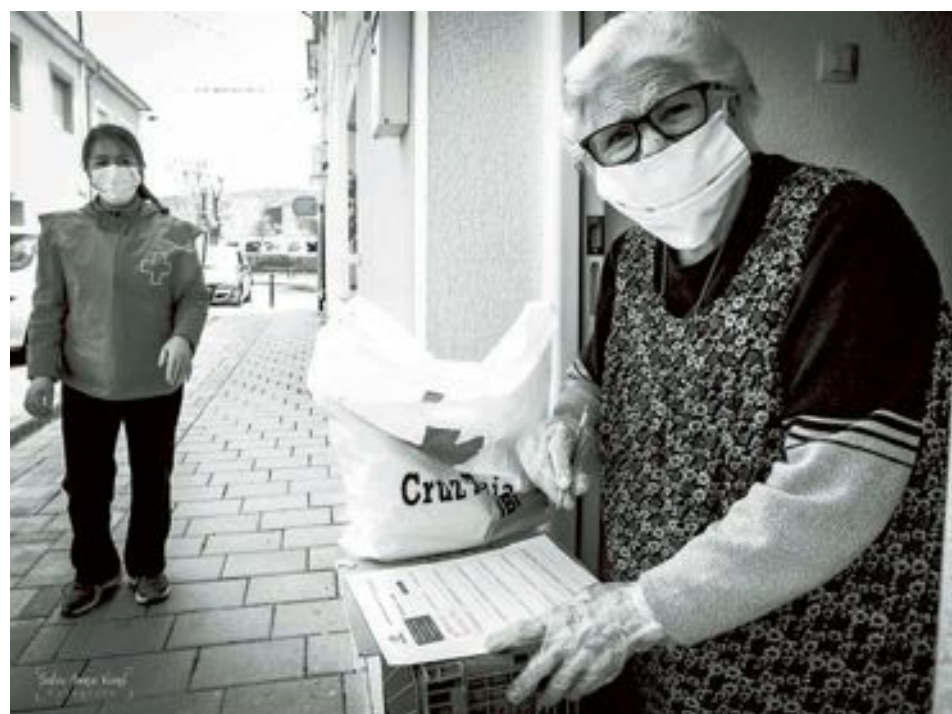
Una vecina de Ibi desde su domicilio recibe a la Cruz Roja