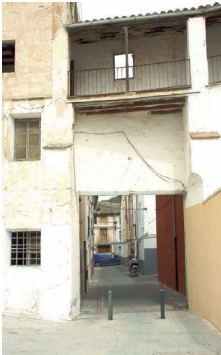
L'únic portal que es conserva en Ibi es troba en la Plaça de Bous

En 1647 i 1648, amb el res-sorgir de la pesta negra i la seua