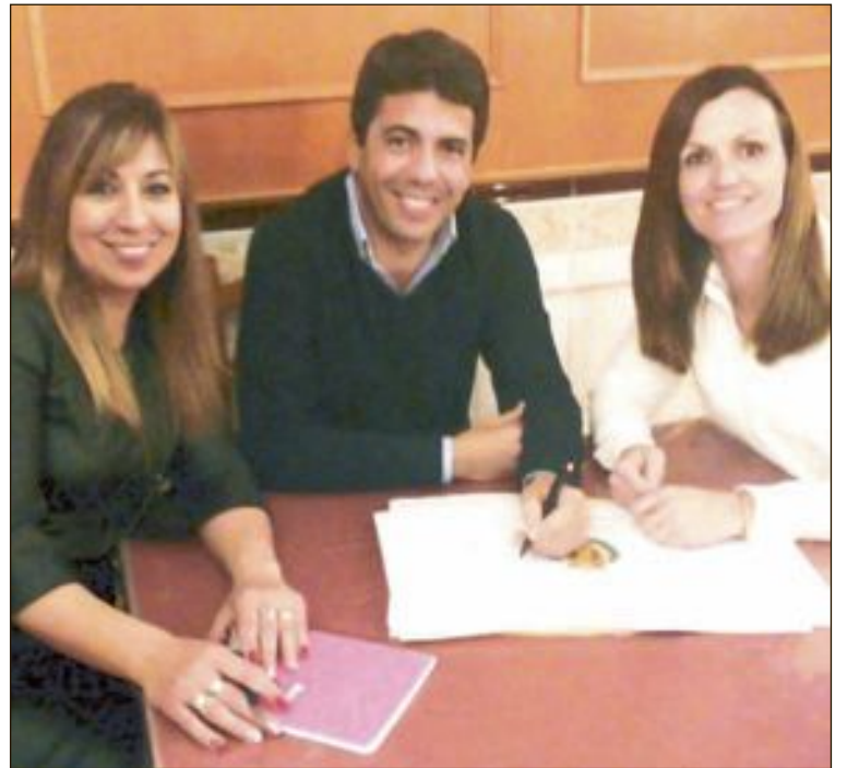
Les dos regidores del PP amb el president de la Diputació, Carlos Mazón, durant una visita d’este a Castalla

Encara que el Partit Popular és conscient que esta situació no té precedents, considera que “és moment de ser valents, tindre determinació i prendre mesures perquè Castalla torne a la normalitat com més prompte millor. Si treballen en esta direcció, sempre trobaran el nostre suport”.