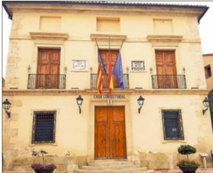
Biar se suma al luto oficial en memoria a los fallecidos por el coronavirus y las banderas ondean a media asta

per concessió directa per a l'any 2020 i ascendeixen a un import global d'11.553.770 euros a nivell de País Valencià, amb càrrec a la línia de subvenció habilitada a aquest efecte dins del programa pressupostari de Serveis socials.