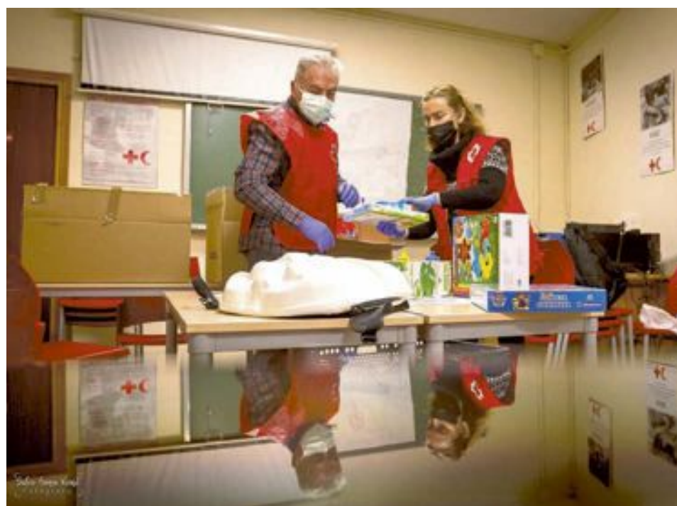
Voluntarios organizan los paquetes de juguetes antes de su distribución