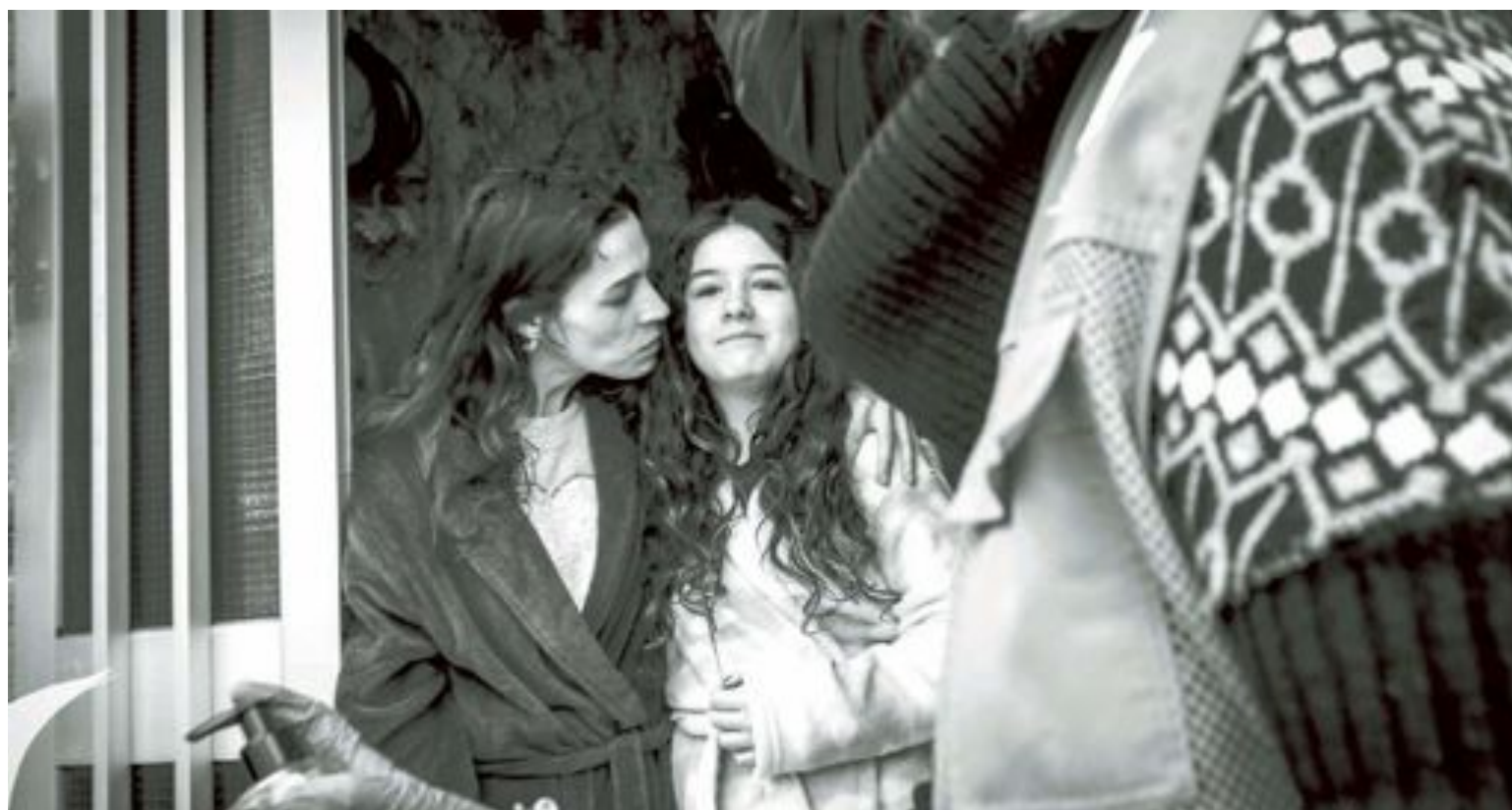
Una familia de Castalla recibe el lote de juguetes de manos de un voluntario