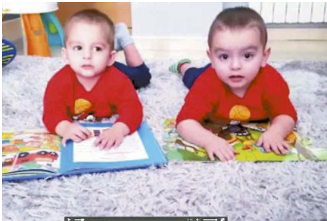
El vídeo dura 4 minutos y 42 segundos, formado por imágenes de 68 niños, de 40 familias distintas