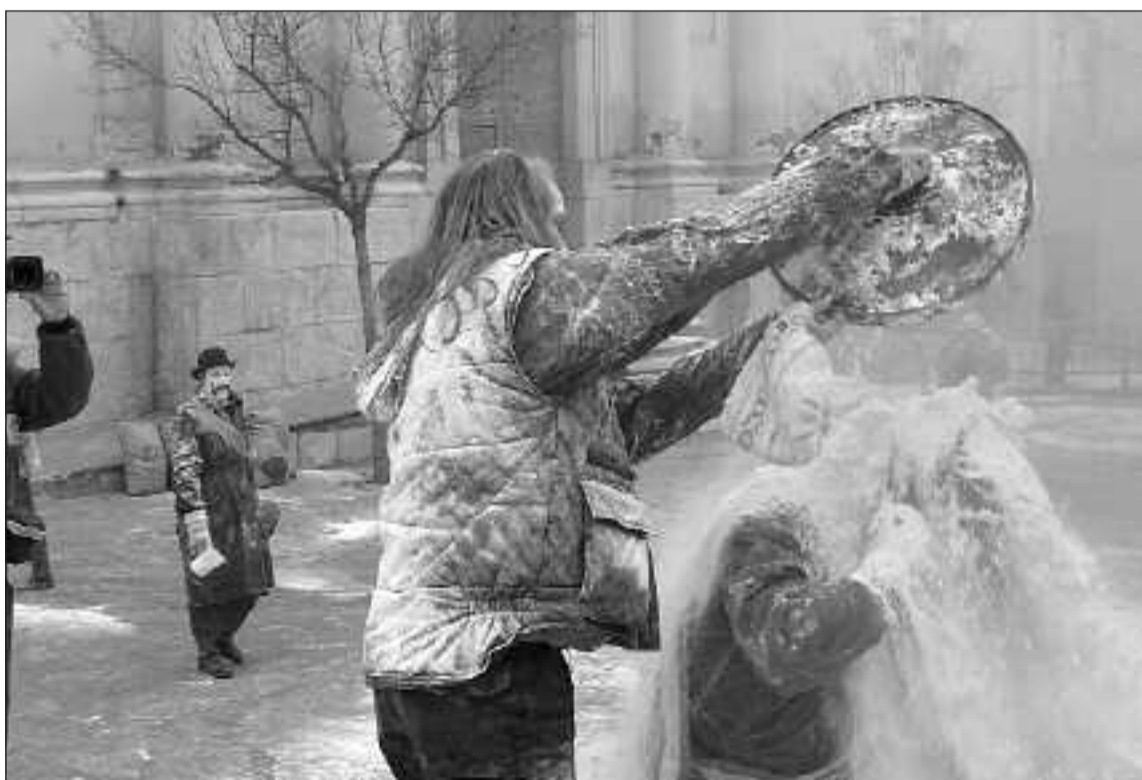
La harina es una de las 'municiones' utilizadas en la batalla entre gobierno y oposición

La fiesta mantiene intacto su interés mediático y las cadenas de televisión y muchos fotógrafos cubrieron esta jornada festiva.