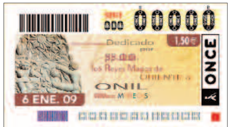
Arriba, entrega de la plancha original. Abajo, el cupón del día 6 de enero