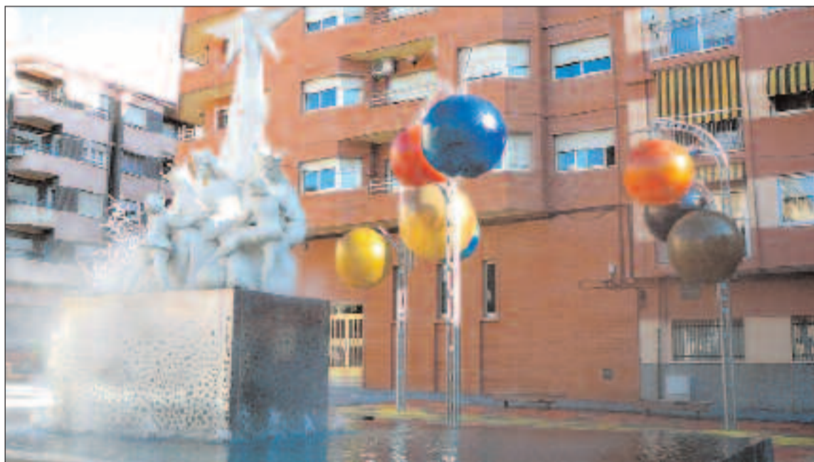
Los hierros que sujetan el monumento se han tapado y se ha colocado detrás un planetario de colores