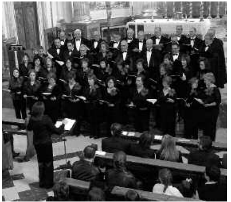
Concierto de la Coral Ibense en la iglesia de la Transfiguración del Señor