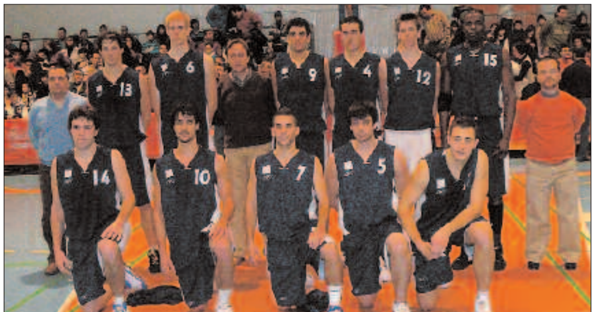
Plantilla del Lucentum B Sub-20