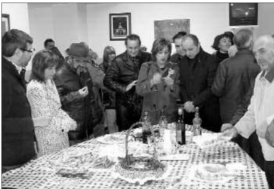
Antes de inaugurar de la Mitja Volta, la comitiva degustó pastas en la Asociación de Reyes Magos