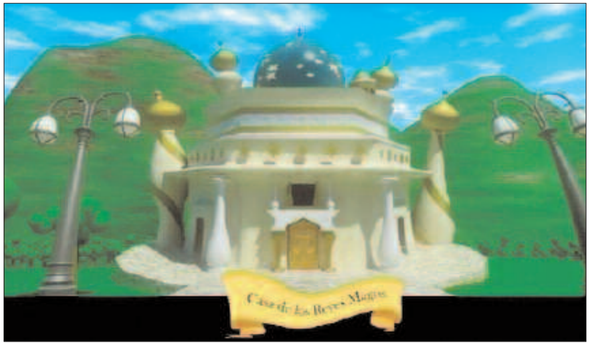
Imagen captada del DVD promocional de la futura Casa de los Reyes Magos