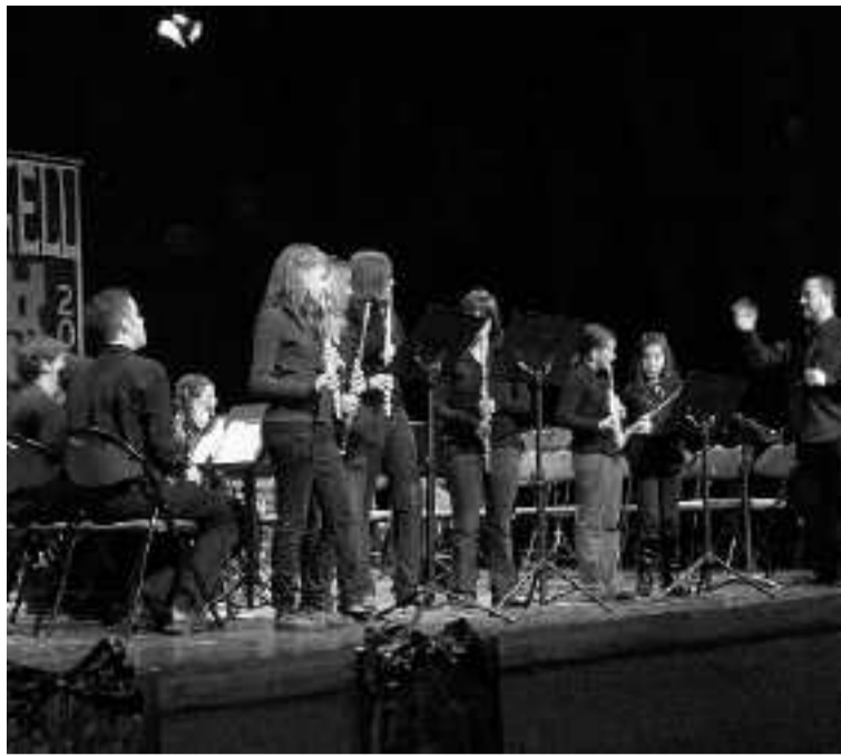
Actuación de los alumnos del taller de música Castell Vermell