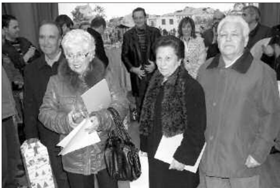
El CEAM ganó el premio al mejor Belén con motivos locales

La tarde del 24 de diciembre, coincidiendo con la inauguración de los belenes de la plaza de la Mitja Volta y la ermita de San Vicente