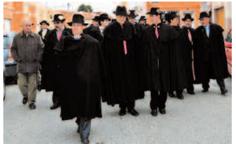
El grupo de danzas de casados durante su visita al barrio Mirasol