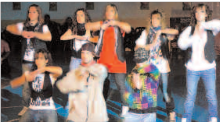
En la ceremonia de apertura participaron dos grupos de baile