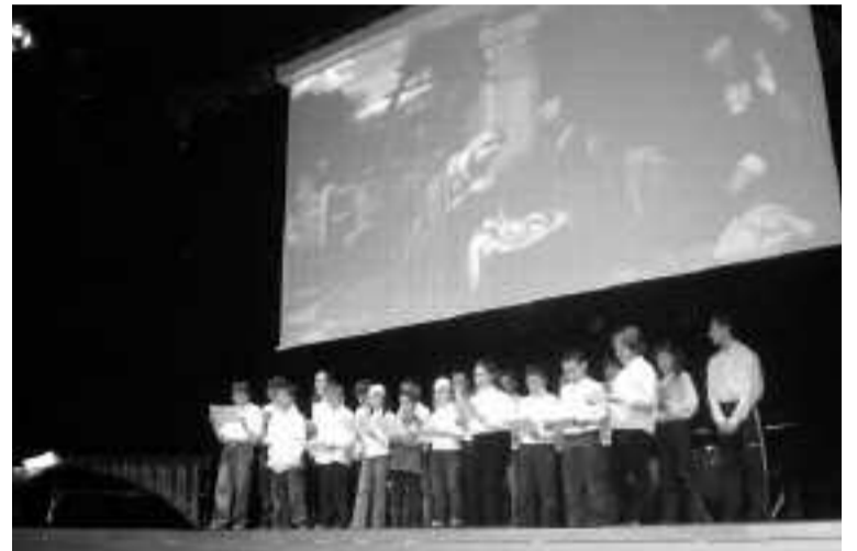
Arriba, alumnos de dulzaina y percusión. Abajo, el Grup El Sogall