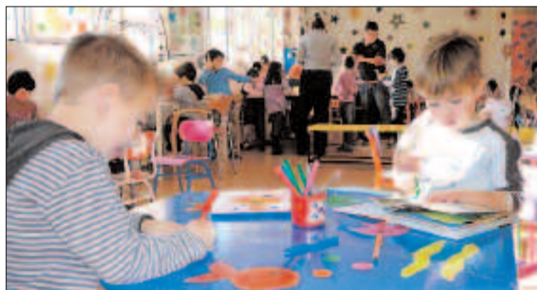
La Ludoteca está instalada en la sala de estudios de la Biblioteca