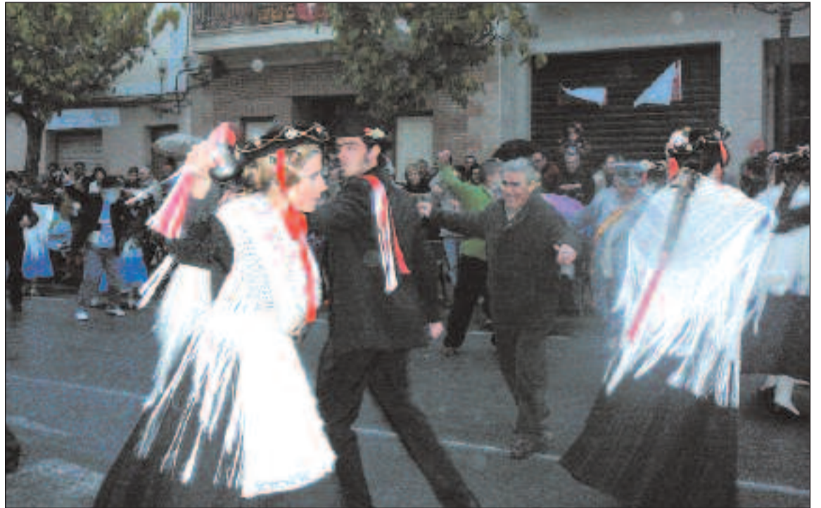
Los grupos de casats i fadrins invitan a bailar al público las danzas

La segunda jornada de danza se celebra el día 30 y los protagonistas son el grupo de solteros. A las cinco de la tarde comienzan las danzas en la calle y por la noche el Ball del Virrei , que cierra las Fiestas de Invierno de 2008.