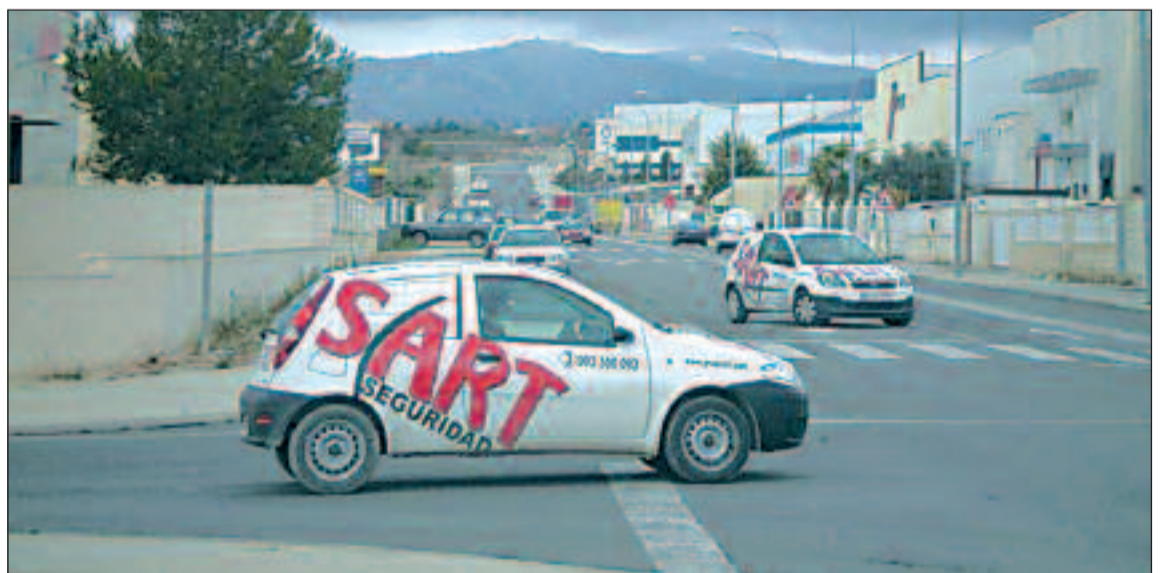
Vehículos de Sart patrullan el polígono industrial de Ibi

Siendo el plan de seguridad propuesto un documento vivo, se mantendrán periódicamente reu-