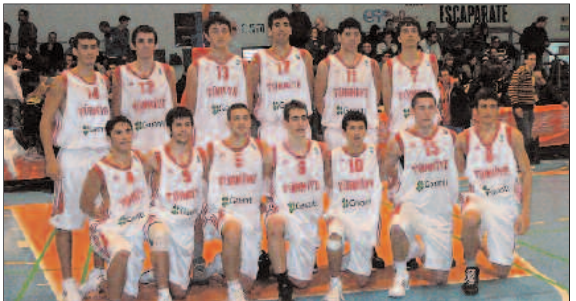
Plantilla de la selección turca