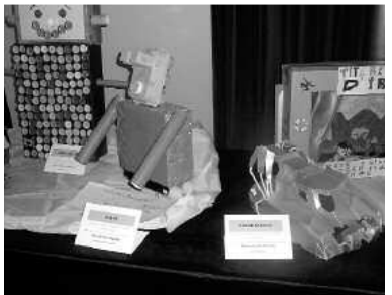
Algunos de los juguetes premiados expuestos en el Museo de Ibi