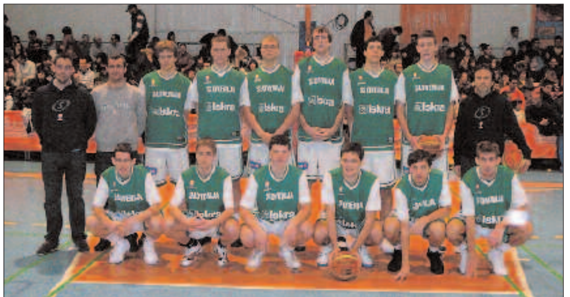
Plantilla de la selección eslovena