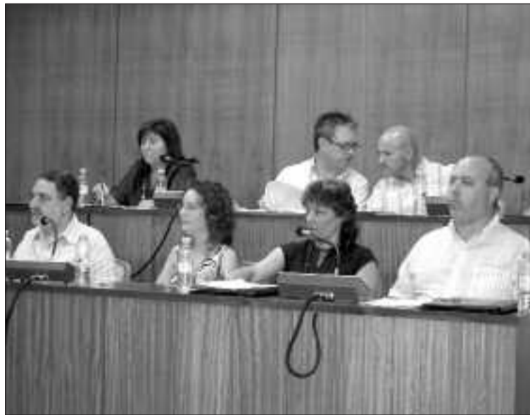
Concejales de la oposición durante una sesión plenaria

Los socialistas también apuestan por la rehabilitación de la fábrica Payá y por la mejora de las instalaciones del Polideportivo.