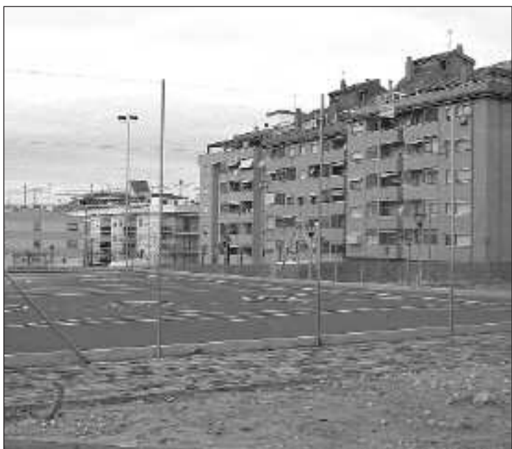
Pista polideportiva que se ha construido en el nuevo parque Giravela