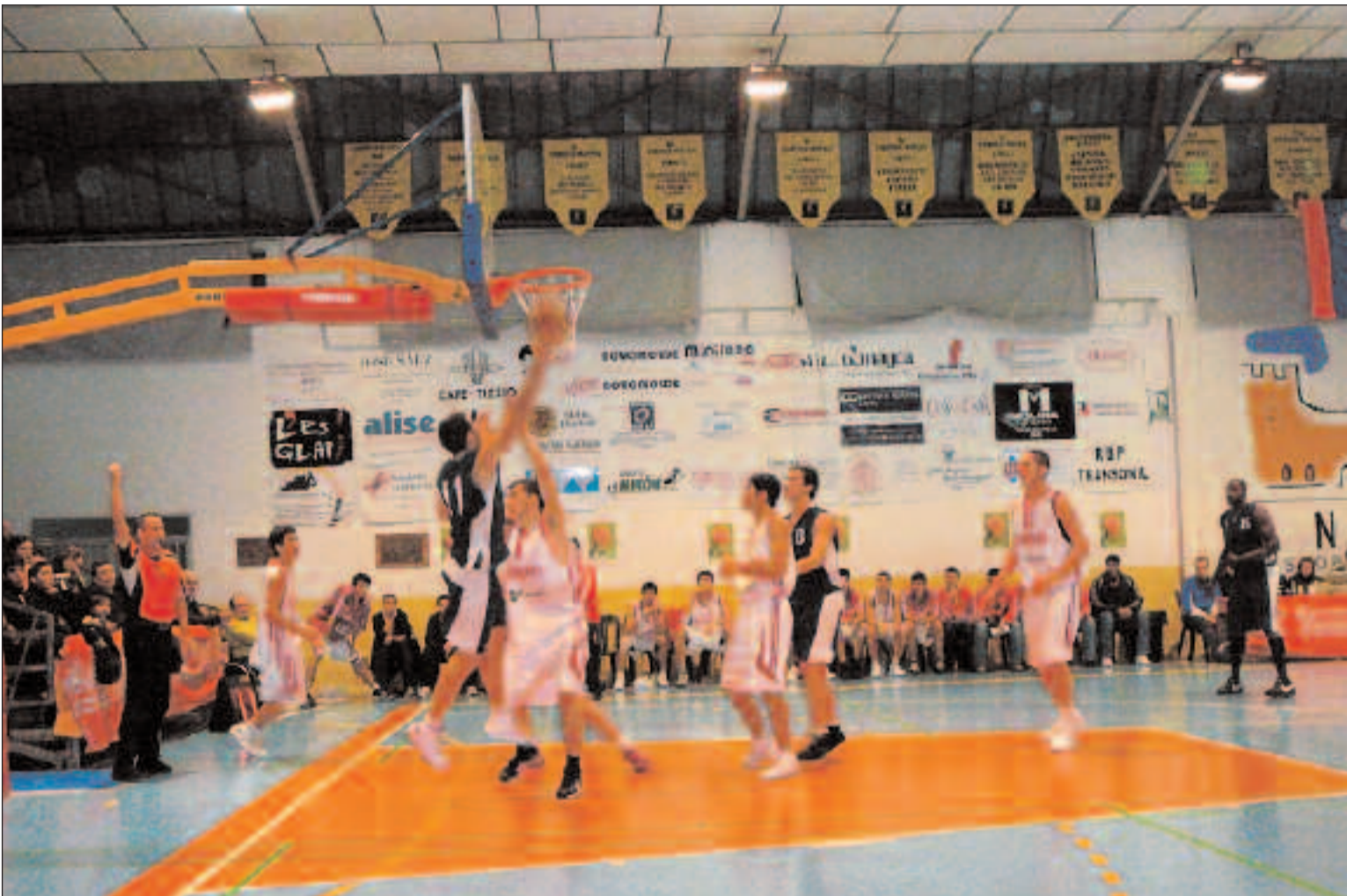
Un tenso momento del partido entre la selección turca y el Lucentum B, que acabó con un resultado de 79-83 favorable a Turquía

Participan las selecciones Júnior de España, Turquía, Eslovenia y el Lucentum B Sub-20