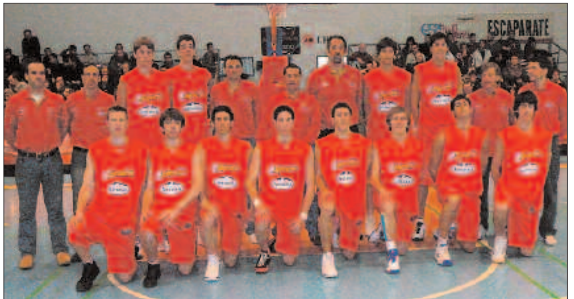
Plantilla de la selección española

"Desde la Federación Española de Baloncesto, en estas fechas necesitamos trabajar lo máximo posible con los chavales en situación real, así que torneos como éste ayudan mucho. Que en una ciudad como ésta se venga desarrollando año tras año una cita tan importante es un motivo de orgullo para todos los que amamos el baloncesto".