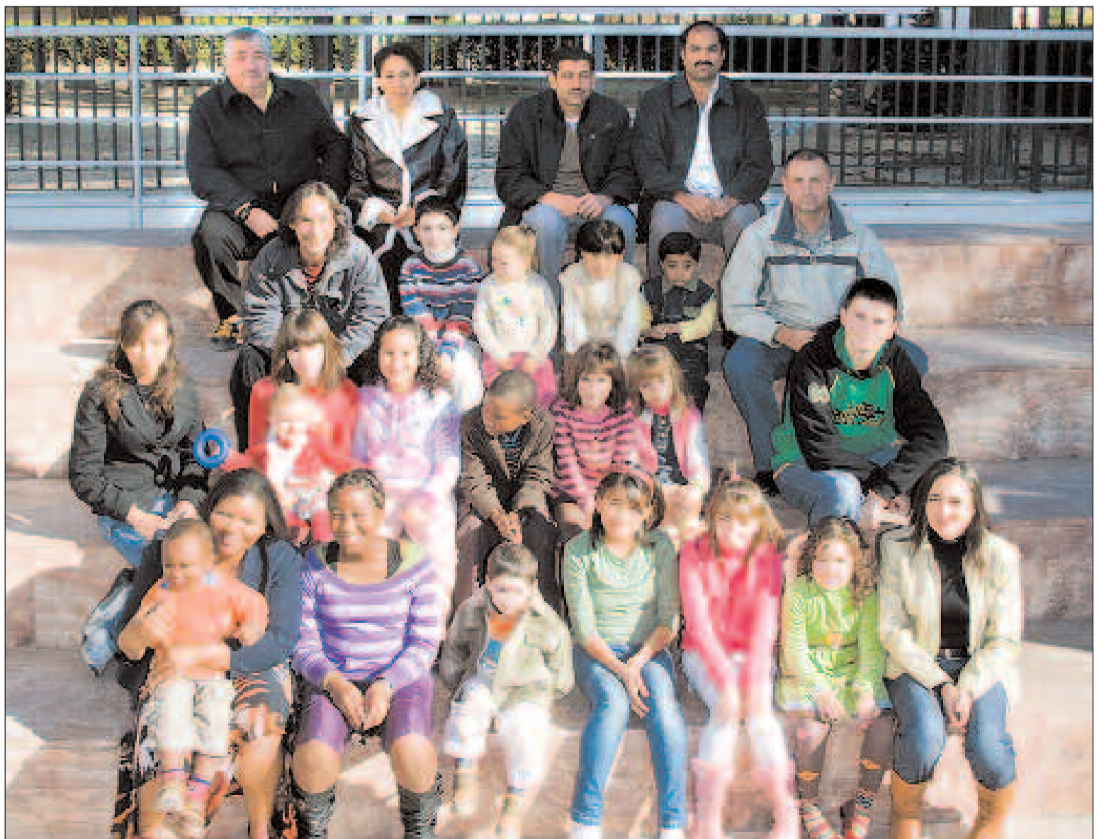
Personas de distintas razas, pero con el mismo color de sangre, en las escalinatas de la Casa de Cultura de Castalla

No obstante, comparando con el año 2006, cuando se registraron 570 donaciones, la tendencia es positiva, siempre que se considere 2007 como un año excepcional.