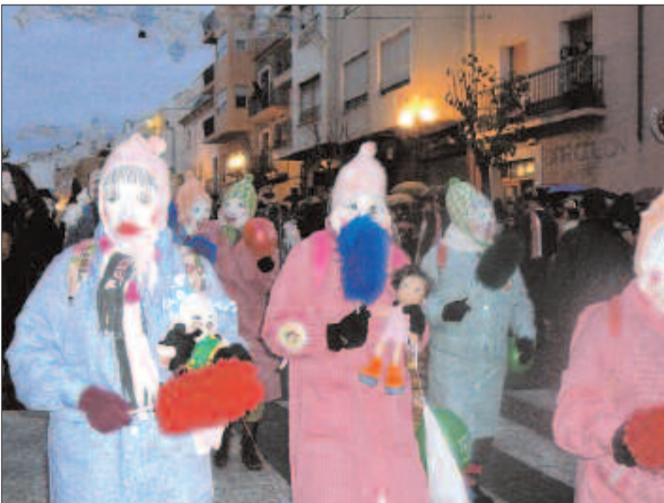
Algunos dels tapats que participaron en el primer día de danza