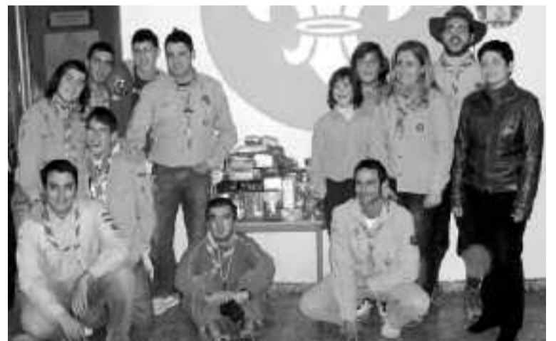
Miembros del Grupo Scout de Ibi muestran los alimentos que enviarán al pueblo saharauí. La donación tuvo lugar el domingo 21 de diciembre