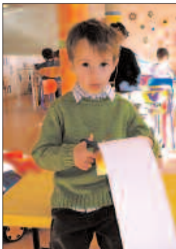
Un niño recorta una corona

vacaciones navideñas no encuentran en qué invertir su tiempo. Los días que restan (el 30 de diciembre y el 2 de enero), la Ludoteca estará abierta de once de la mañana a una de la tarde, con juegos, talleres, juguetes, libros (para leer y colorear) y animaciones de diversa índole, amén de las ya comentadas actuaciones de Déxter y sus juegos de magia y Llorenç Jiménez y sus cuentos. La Ludoteca está instalada en la sala de estudios de la Biblioteca, en el último piso del Centro Cultural.