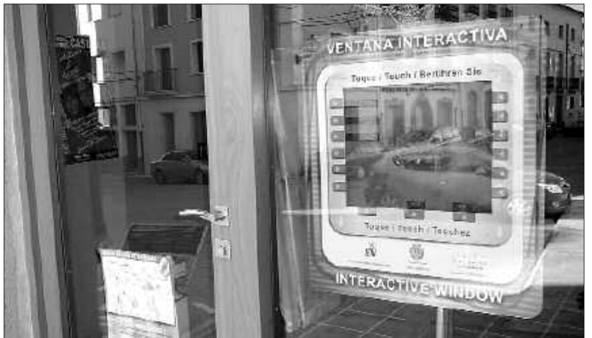
La pantalla táctil está instalada en la misma puerta de la Oficina de Turismo

Por otro lado, la concejalía de Turismo ha iniciado una serie de mejoras físicas en la