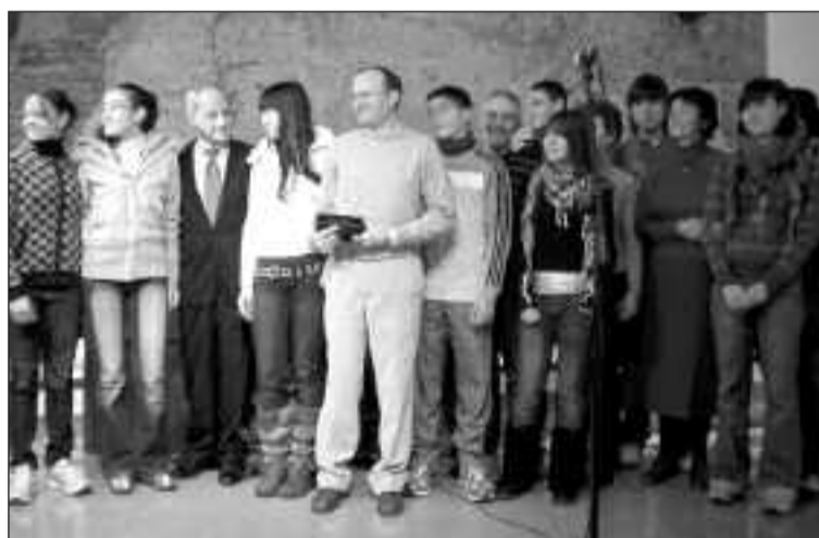
Momento de la recogida del galardón