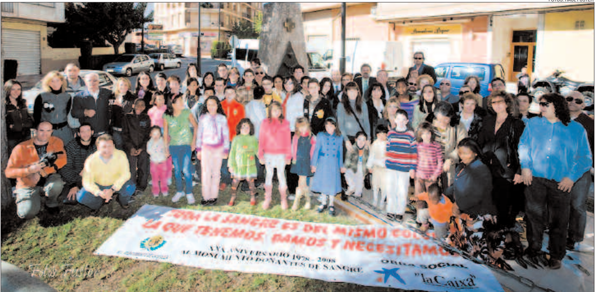
El alcalde de Castalla y varios concejales, junto con miembros de la Asociación de Donantes y numerosos vecinos de la localidad, junto al monumento al donante de sangre

En 2008 se registró un total de 750 donaciones, 116 menos que en el aniversario de la Coronación de la Virgen