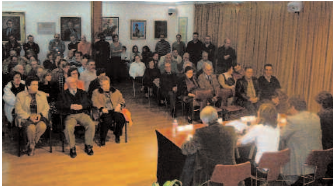
El acto se celebró en el salón de Plenos del Ayuntamiento al que acudió numeroso público

C/ Tibi, 8 - Tel. 96 633 82 09 - IBI www.mundocineibi.com