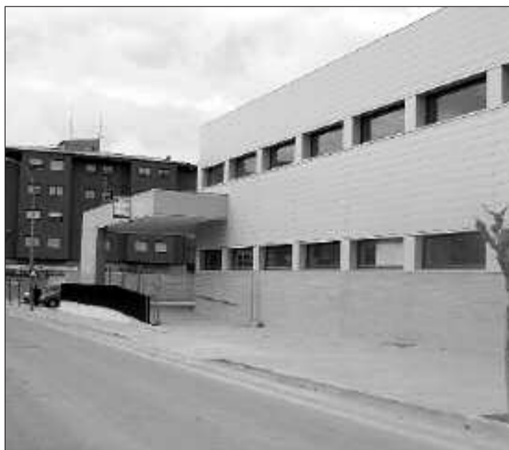
Edificio del segundo Centro de Salud

La nueva plaza ya dispone de una gran parte de alumbrado instalado y está terminada la pista polideportiva con dos canchas de baloncesto y una de fútbol. También es visible un gran tablero de ajedrez en el suelo de la plaza y diferentes elementos de ornamentación que van configurando el aspecto final que tendrá este entorno.