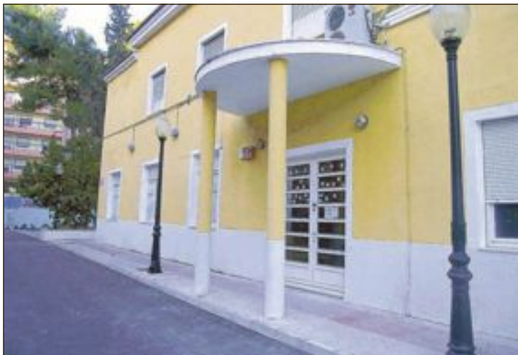
El Casal Jove todavía continúa cerrado