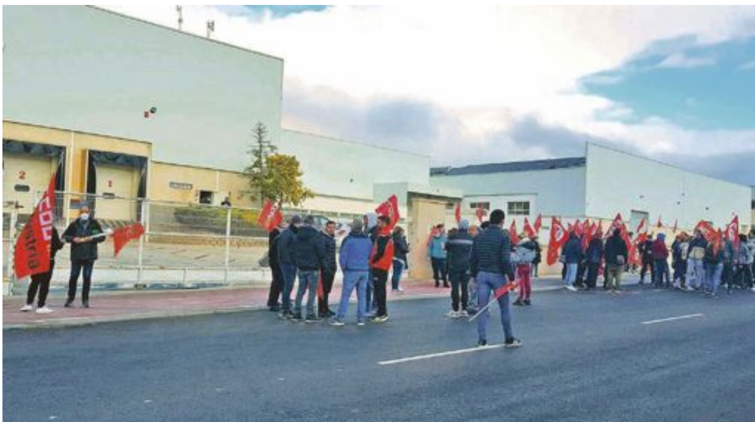
Las negociaciones han llegado a buen término tras dos jornadas de huelga, los días 18 y 23 noviembre, que llegaron a paralizar la producción en las principales empresas del sector en esta comarca

Para el año 2022, el incremento también será del 2% con cláusula técnica de hasta un 0'75% máximo, siempre que el IPC supere 2% y para 2023, otro incremento del 2 por ciento con cláusula técnica de hasta un 0'50% máximo siempre que el IPC supere 2 por ciento.