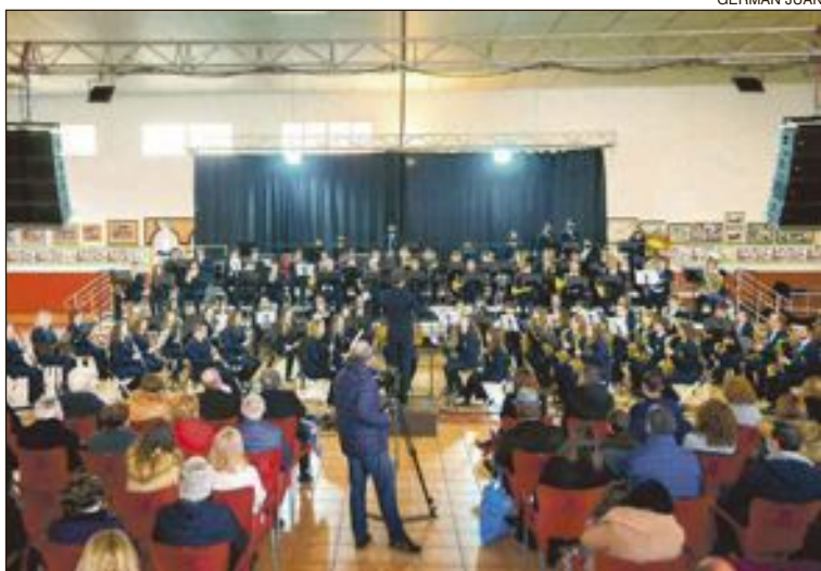
El CIMO organizó la gala en el local social de los Moros Artistas