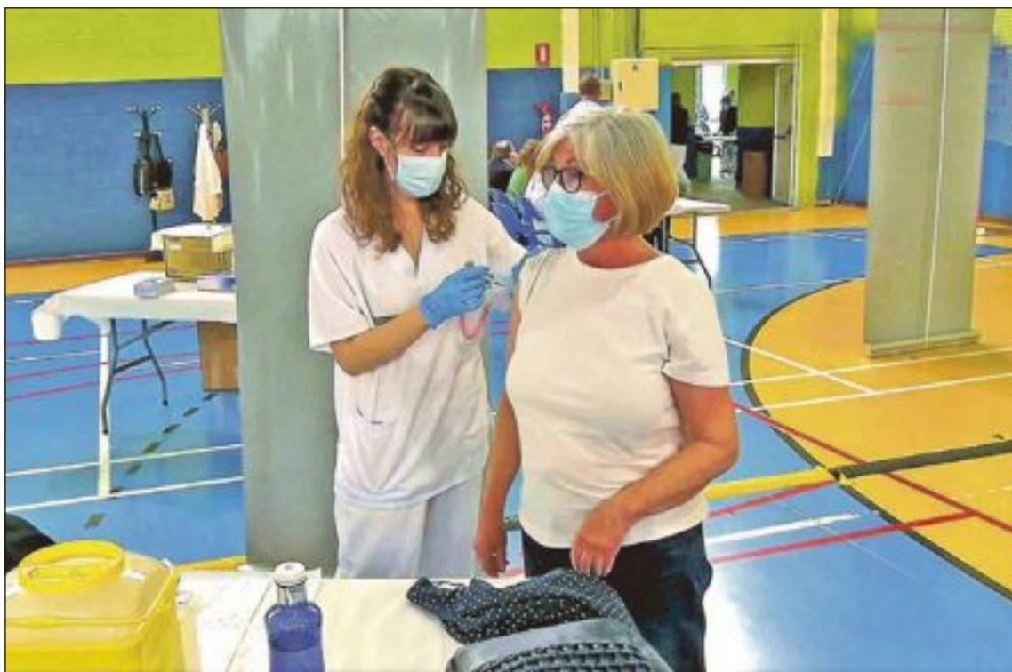
La vacunación se llevará a cabo en los centros de salud de cada localidad

Actualmente, hay seis personas ingresadas en planta en el hospital y una en UCI.