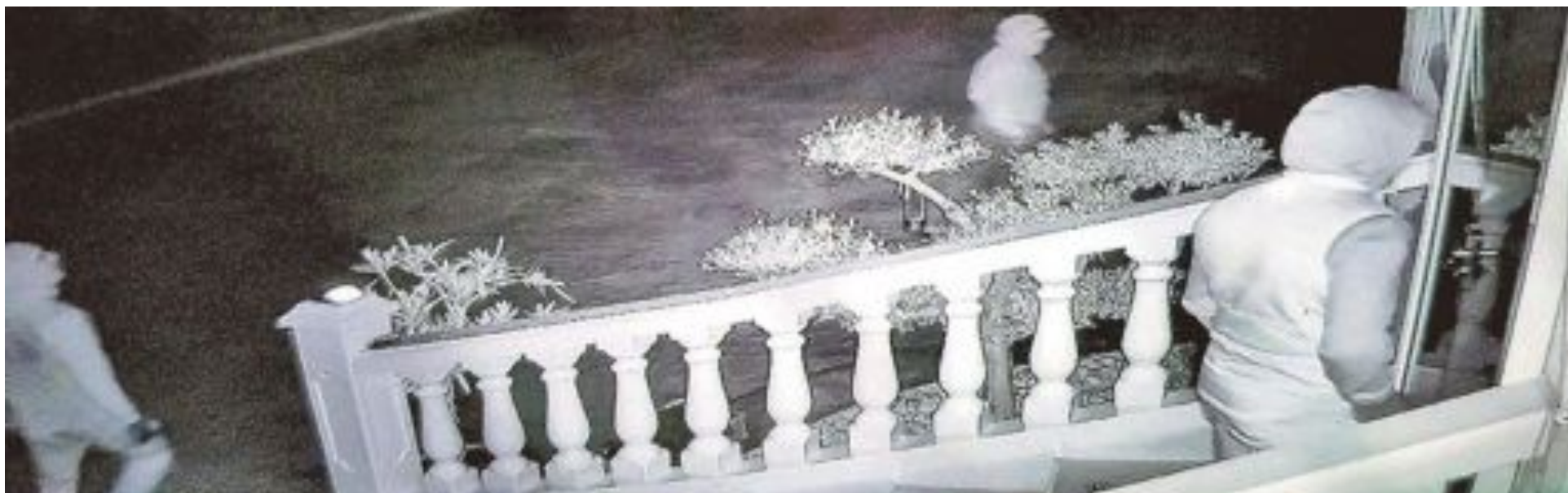
Unas cámaras de seguridad captan a tres encapuchados a punto de introducirse en una vivienda por la noche