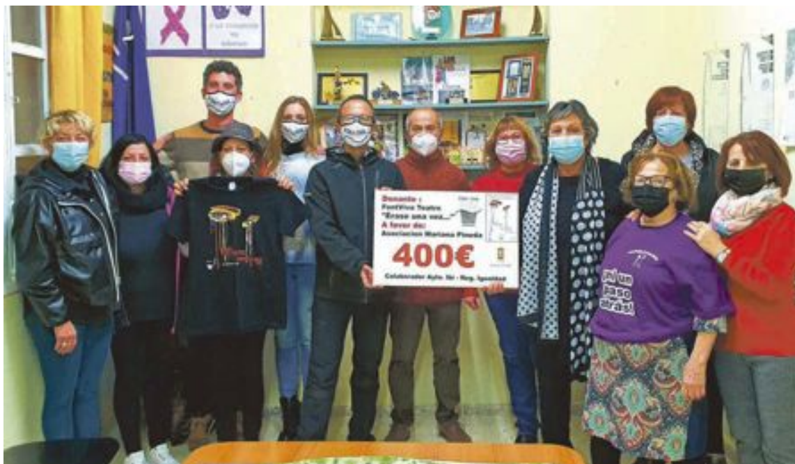
Font Viva ha donado parte de la recaudación de la obra Érase una vez , sobre violencia de género