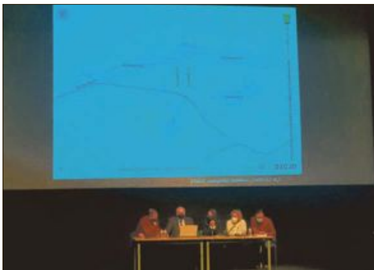
La reunión se celebró el viernes 26 de noviembre en la casa de cultura