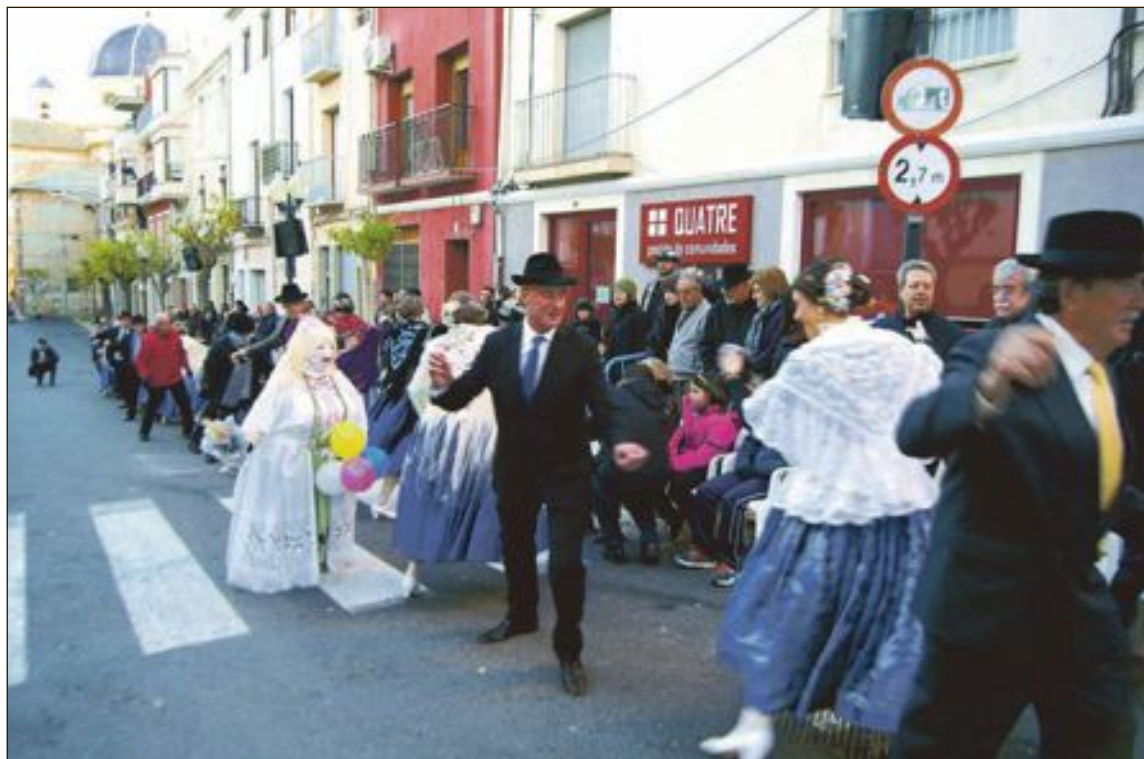
Las danzas en la calle se celebrarán con la presencia de tapats y de todas las personas que quieran unirse a los bailes populares

El sábado día 11 se celebrará el Bateig de Santa Llúcia en la ermita y también se convocarán las danzas en la calle, con la presencia de tapats y de todas las