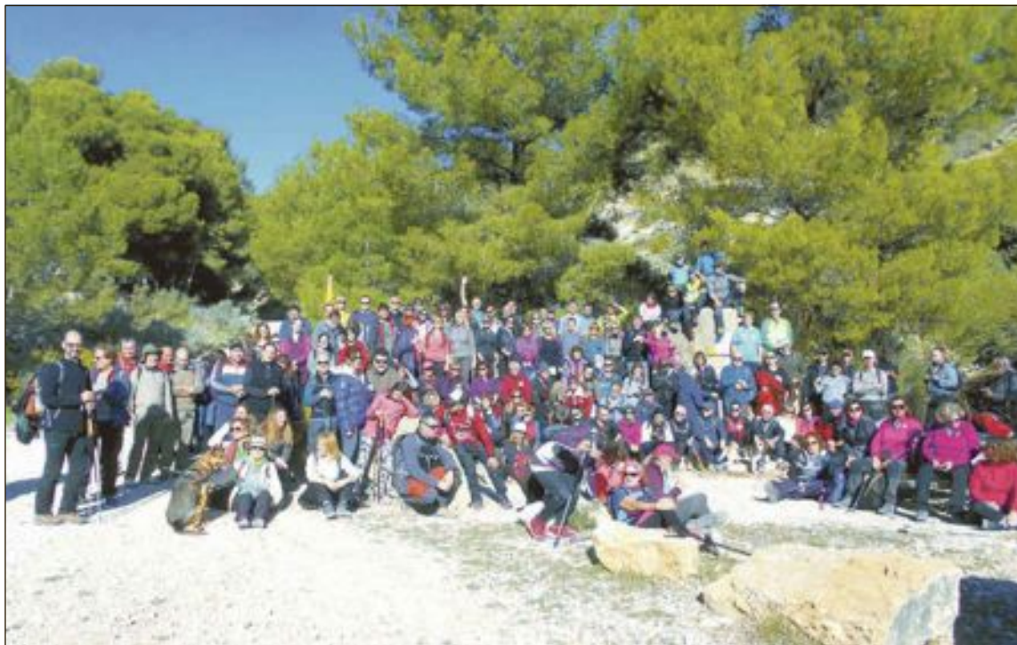
En la tradicional ruta se dan cita senderistas de toda la comarca

Por último, cabe mencionar que el trayecto solo será de ida. Tras acabar el recorrido un autobús devolverá a los participantes a la localidad ibense a las 14:00h.