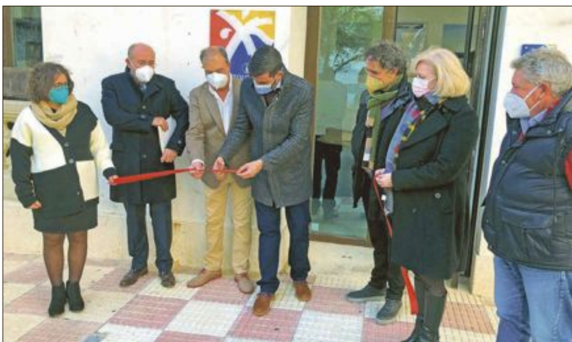
La Tourist Info està situada a la plaça d'Espanya i es va inaugurar el dijous 2 de desembre