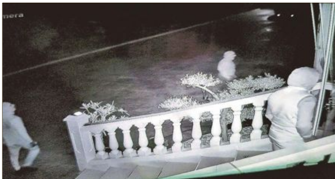
Una cámara de seguridad capta el momento en el que unos ladrones intentan entrar en una vivienda

Especiales Asesorías y Servicios Jurídicos Nuevas Tecnologías