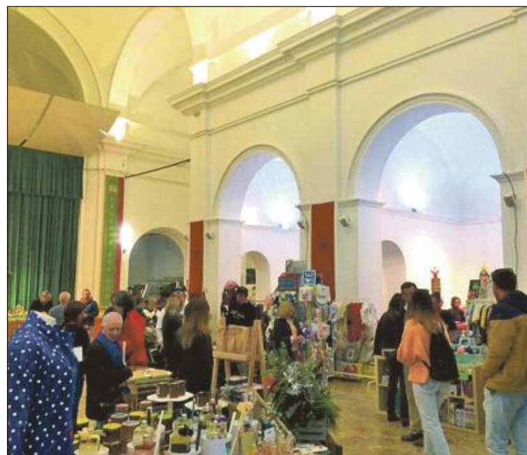
Biar celebra este cap de setmana del 4 i 5 de desembre la Fira de Nadal

Ayala, regidor de Turisme, explicava que Tibi pot oferir moltes coses al visitant, per un costat el seu patrimoni cultural i natural, com tota la zona que rodeja el pantà i també la seua ruta de l'aigua, amb totes les fonts del municipi. A més, afegia, "està la gastronomia local i som un gran referent esportiu, com és el cas de la Pilota". L'oficina obrirà les seues portes de dimecres a diumenge en horari matutí a partir del proper dia 20 de desembre.