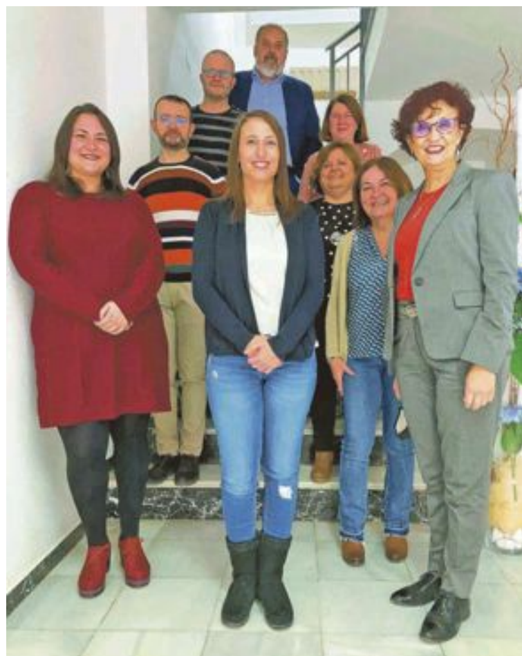
Plantilla de Salfe Asesoría

Este desarrollo de la administración digital o telemática exige que todos los ciudadanos dispongan de un sistema de Identificación, Autenticación y Firma Electrónica