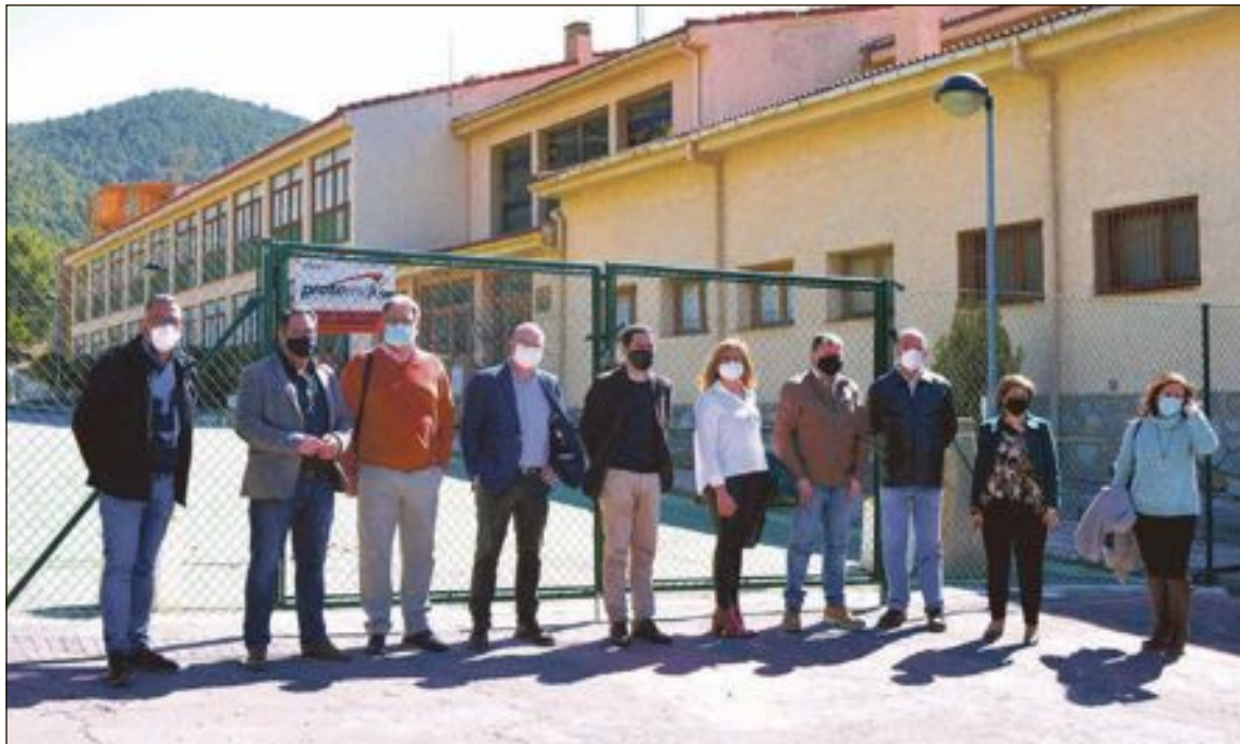
Regidors i diputats socialistes front a les instal·lacions de Xorret de Catí

En la moció, els socialistes han argumentat que estes instal·lacions, competència i propietat de la Diputació d'Alacant, han albergat diferents usos, l'últim d'ells l'hoteler, encara que la dita activitat va cessar fa