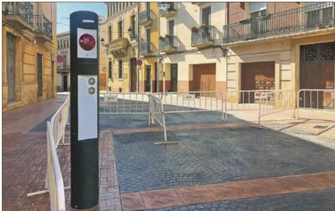
Sistema de control de acceso, con cámaras para el reconocimiento de matrículas, implantado en el casco antiguo

El edil añadió que la previsión es iniciar los trabajos el próximo mes de enero, en una sola fase y con un plazo de ejecución de 18