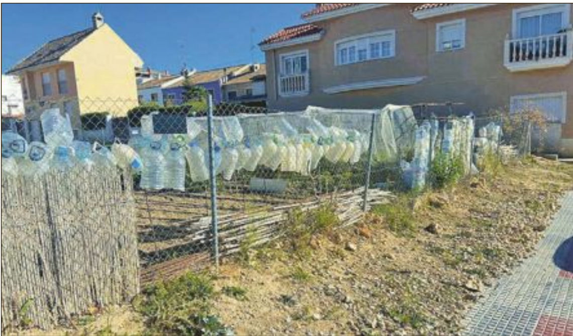
Algunos vecinos se han quejado por el mal estado en el que se encuentran algunos huertos, con acumulación de residuos, materiales y desechos

En demanda de los vecinos por el gran impacto visual