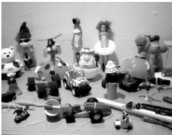
Algunos de los juguetes que se realizaron este pasado domingo

Por su parte, el concejal de Museos, Enrique Palacios, ha manifestado su satisfacción ante el hecho de que, "cada vez son más los adultos que se implican y participan en las actividades, realizando los tra-