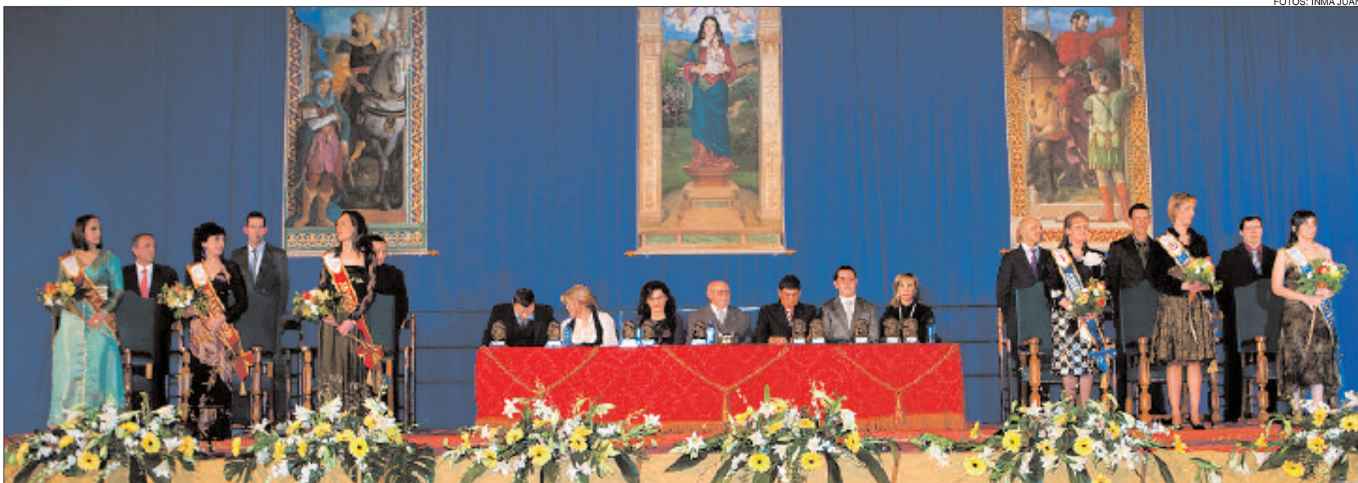
Todos los protagonistas de la Fiesta se dieron cita en el Polideportivo: capitanes, asociación de comparsas, pregonero, etcétera

El pabellón del Polideportivo presentó un lleno absoluto el sábado día 14