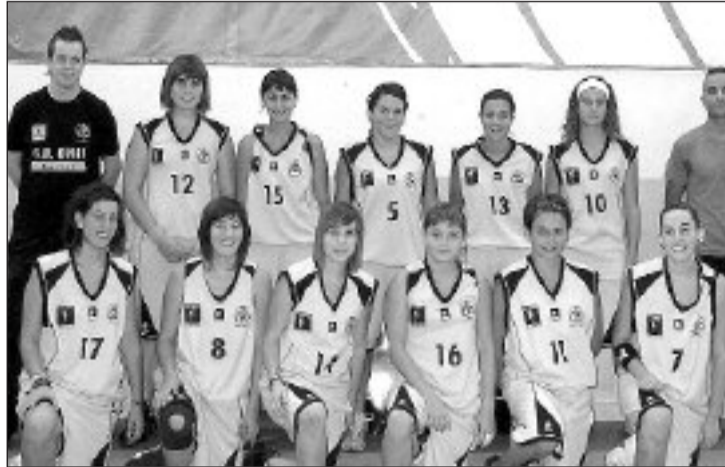
El Júnior Femenino atraviesa por dificultades debido a las bajas

lleria (69-49). La ausencia de tres de sus mejores jugadores, que estaban reforzando al 'A', pesó demasiado en el equipo.