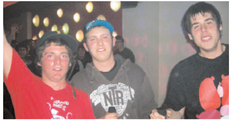
Los tres miembros de La Plaga fueron los primeros en actuar