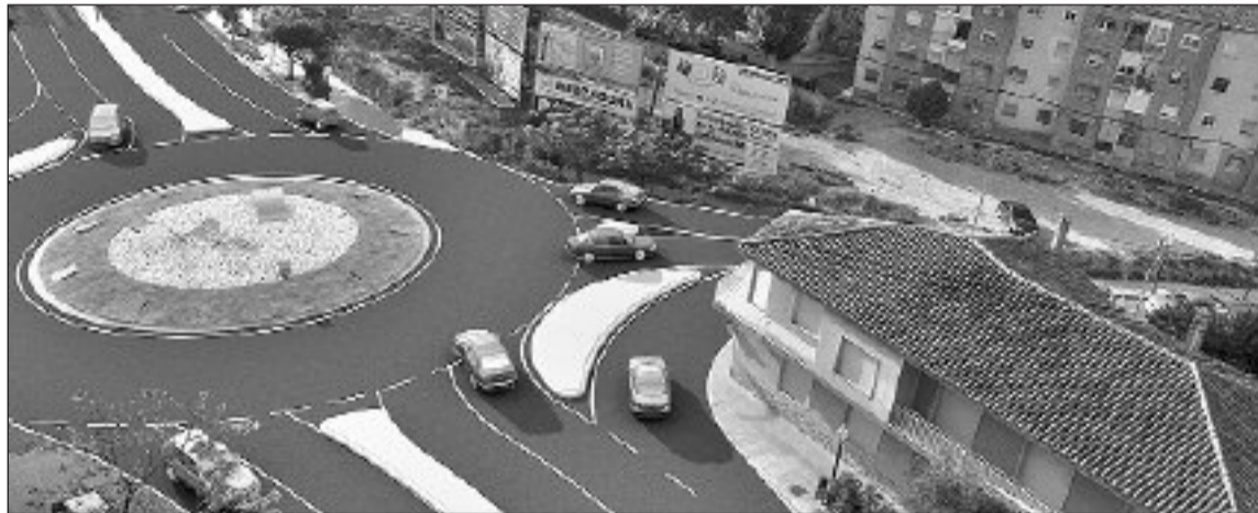
Imagen virtual de la nueva rotonda que se construirá en el cruce de las avenidas Juan Carlos I y La Provincia

Ahora, los técnicos municipales y los de la Cooperativa trabajan para proyectar ese nuevo acceso.