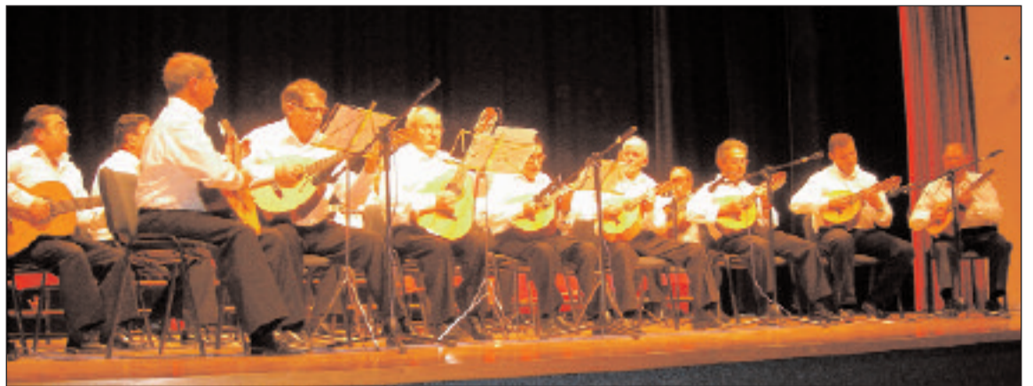
La Rondalla Colivenca fue la primera en actuar

Las palabras de la presentadora llegaron a la fibra sensible de muchos de los espectadores, pero sobre todo a su esposa, que no pudo reprimir alguna que otra lágrima. Además de ella, en el auditorio se encontraban hijos, nueras y nietos del homenajeado, que