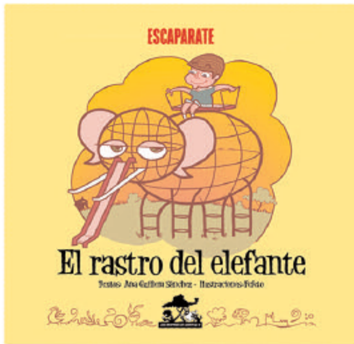
Portada del primer cuento de la colección, 'El rastro del Elefante'

Al igual que en las pasadas ediciones, en 'Una montaña de cuentos III' se han involucrado