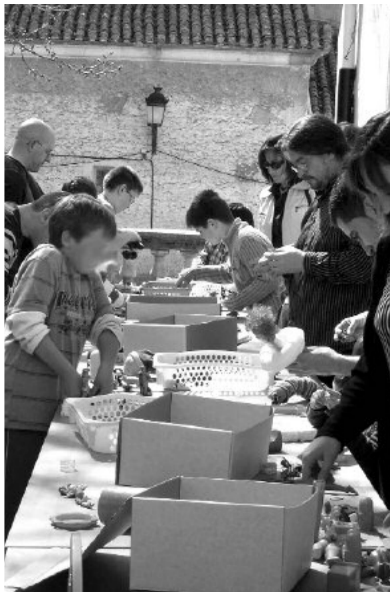
Cada vez son más niños y adultos los que se apuntan a estos talleres

La próxima actividad será el 15 de abril y el tema central será la poesía. Para el mes de mayo y de cara al inicio del verano, está previsto que se desarrolle una actividad de juegos de agua.