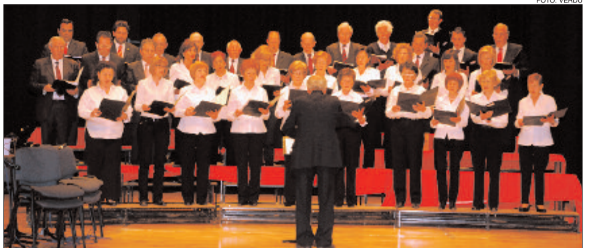
La Coral Polifónica de Onil interpretó varias piezas