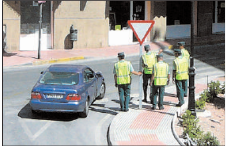
La Guardia Civil cuenta desde agosto con 26 nuevos agentes en prácticas