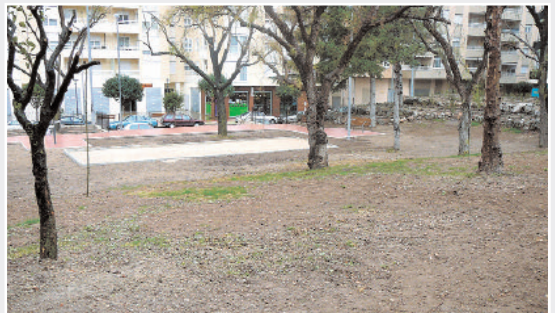
El césped se plantará en el ribazo entre la zona de petanca y la de juegos infantiles

El viernes 20 de marzo comenzará la plantación de césped natural en el ribazo que separa la zona de petanca de la de juegos infantiles en el parque Félix Rodríguez de la Fuente. A pesar de que el parque fue inaugurado recientemente, aún queda por acometer esta plantación y la instalación de un circuito biosaludable. La alcaldesa, Elisa Ribera, anunció que esta zona estará acotada durante al menos dos meses.