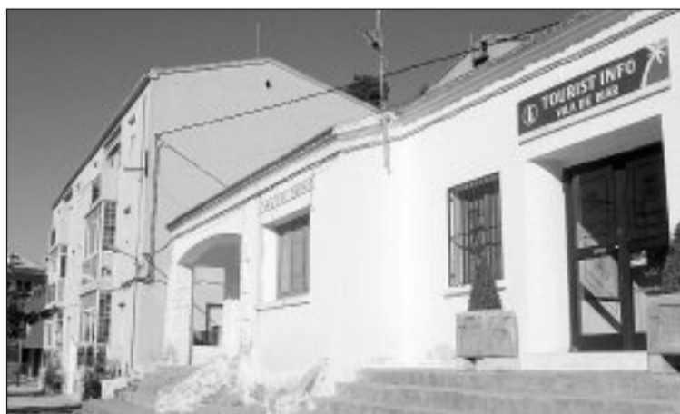
Para la ampliación de la guardería se usará el edificio de la Tourist Info

La reforma permitirá disponer de una instalaciones adecuadas para que la Conselleria catalogue este centro como escuela infantil y se pueda optar a las subvenciones para su mantenimiento.