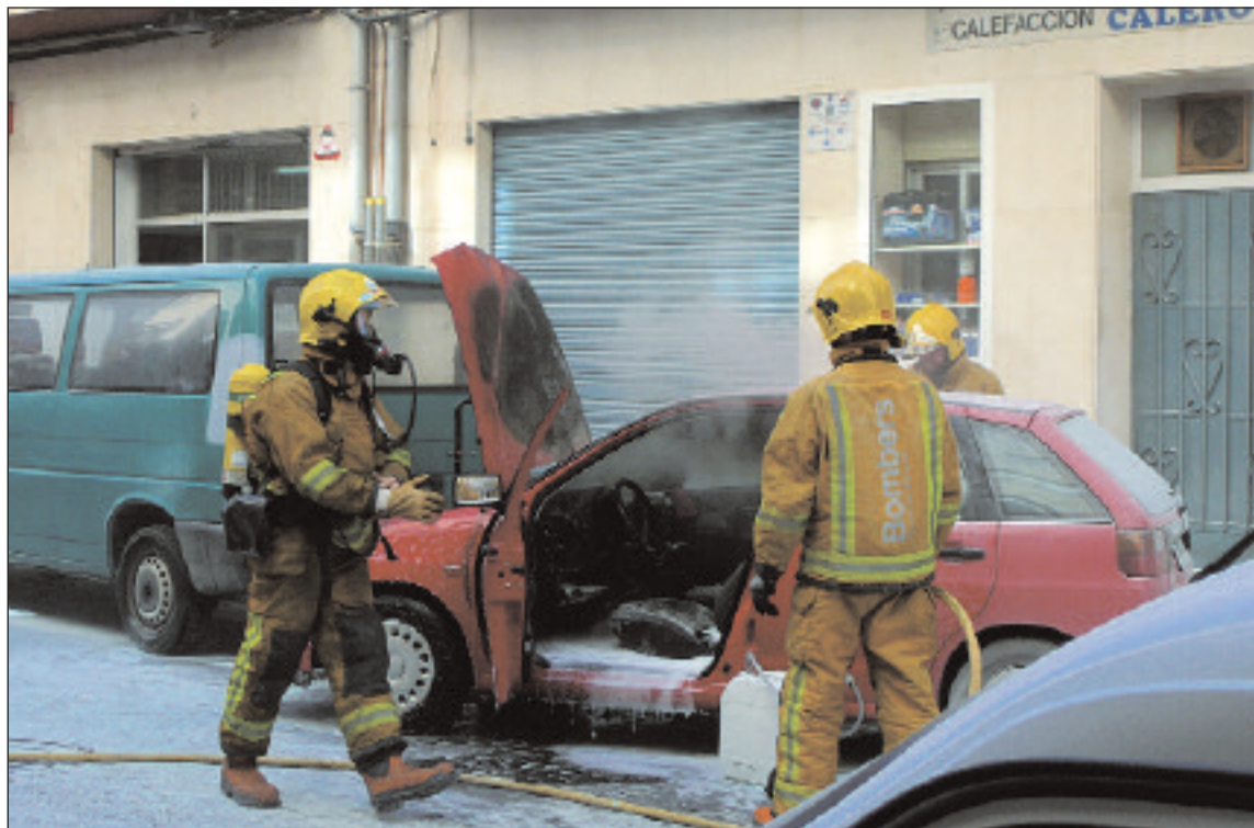
Sólo con la intervención de los bomberos fue posible sofocar definitivamente las llamas del vehículo

Sólo la intervención de los bomberos, que llegaban unos minutos más tarde, pudo acabar completamente con el fuego. Posteriormente se extrajo el combustible del coche, un Seat Ibiza de color rojo, para evitar nuevos peligros. Al parecer, el incendio pudo producirse por un cortocircuito en el sistema eléctrico del vehículo.