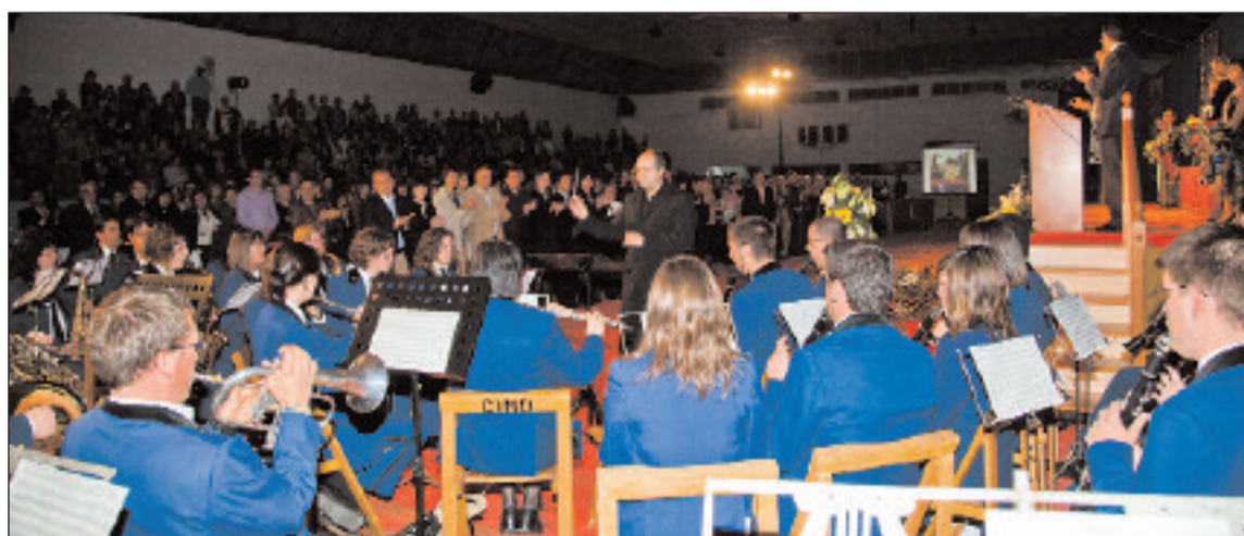
El Centro Instructivo Musical de Onil amenizó la Exaltación festera con diversas marchas

El acto, que se celebró en el pabellón del Polideportivo, contó con la novedad de que, tanto los capitanes como el pregonero, se apoyaron en imágenes sobre una pantalla gigante para hacer más amenas sus respectivas intervenciones.