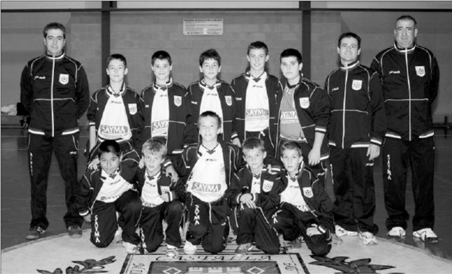
Plantilla del Sayma Erjutoys Castalla

La formación castallense estuvo luchando por el título hasta la última jornada