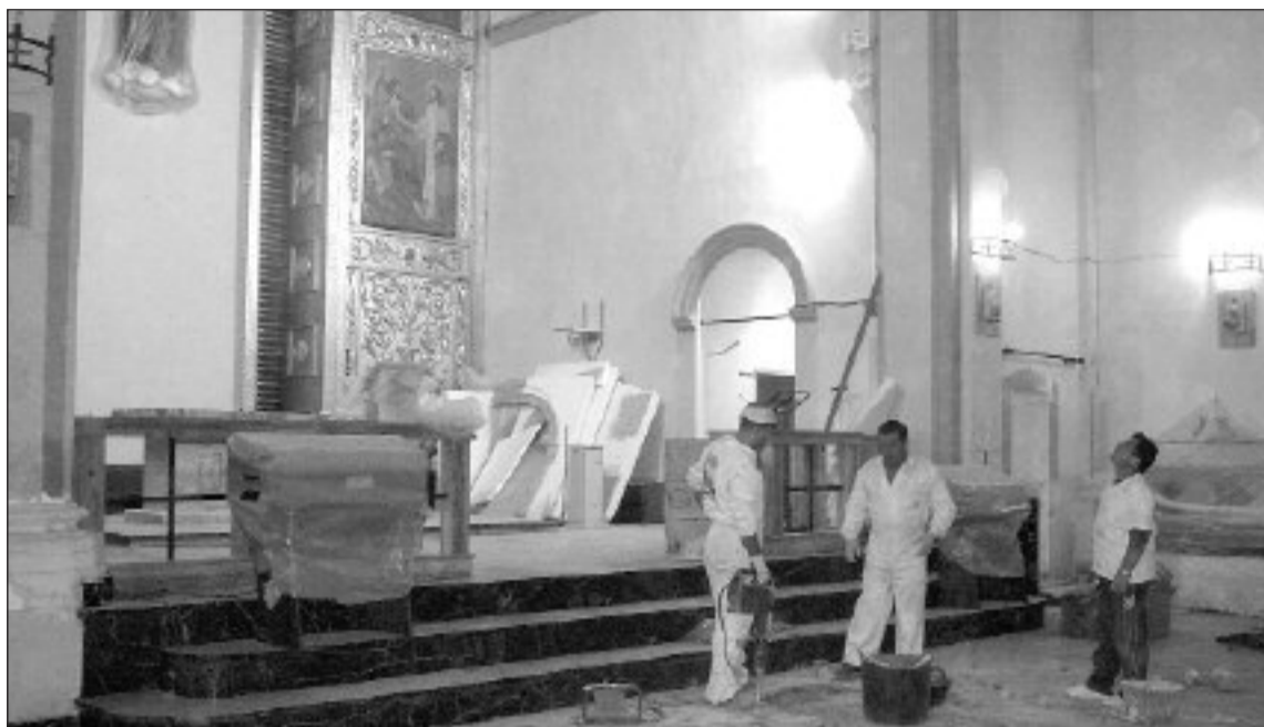
Uno de los proyectos adjudicados es el estudio para el arreglo de las pinturas murales de la iglesia

Finalizado ese tiempo, la localidad dispondrá de contenedores de residuos sólidos urbanos soterrados, de una nueva cubierta en el local de la música, de mejoras en la señalización vial del casco urbano, de un estudio para el arreglo de las pinturas murales en el interior de la iglesia, y también de un nuevo escenario en el parque de la Era del Teular. Este último es el proyecto de mayor cuantía, con un presupuesto de 154.000 euros.