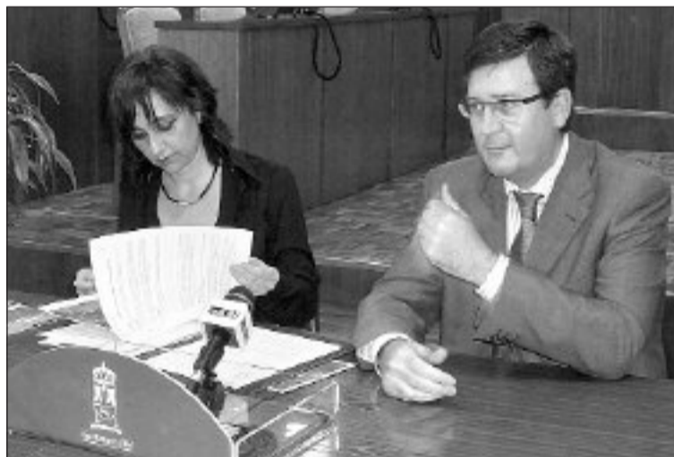
La alcaldesa y el director general de Obras Públicas durante la firma