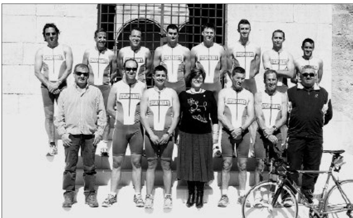
Los componentes del equipo de triatlón del CE Colivenc, con las nuevas equipaciones, junto a la alcaldesa