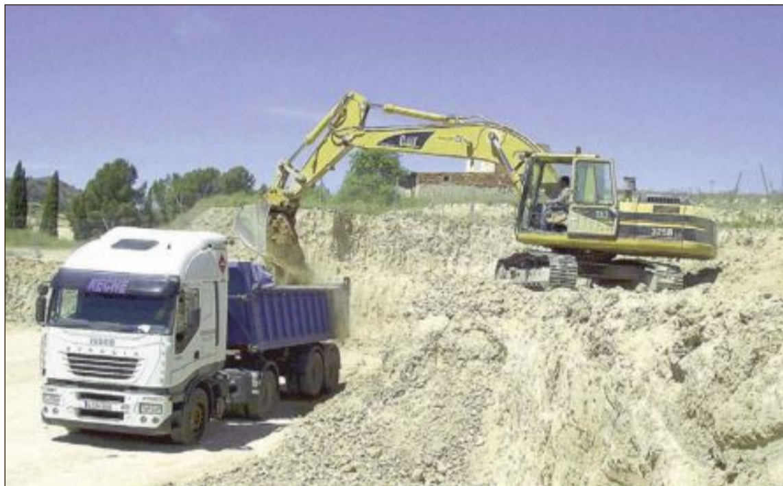
Iberdrola inició el 27 de abril los trabajos y ahora está realizando movimientos de tierra para preparar el terreno

Cabe recordar que, con el objetivo de evitar complicaciones técnicas y medioambientales, así como de reducir los costes económicos, se acordó la construcción de dos subestaciones eléctricas, denominadas ST Castalla, de