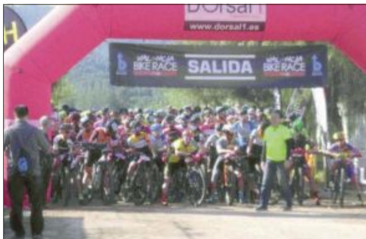
Momento de la salida de la prueba ciclista del sábado 29 de abril en Barxeta, que sería suspendida cuando los corredores llevaban recorridos 32'2 kilómetros

La denuncia está motivada porque los participantes se sienten estafados, debido a que, a pesar de que había alerta 3 por incendios, la organización permitió que se diera la salida, si bien un tiempo después se decidió suspender la prueba, concretamente en el kilómetro 32'2; es