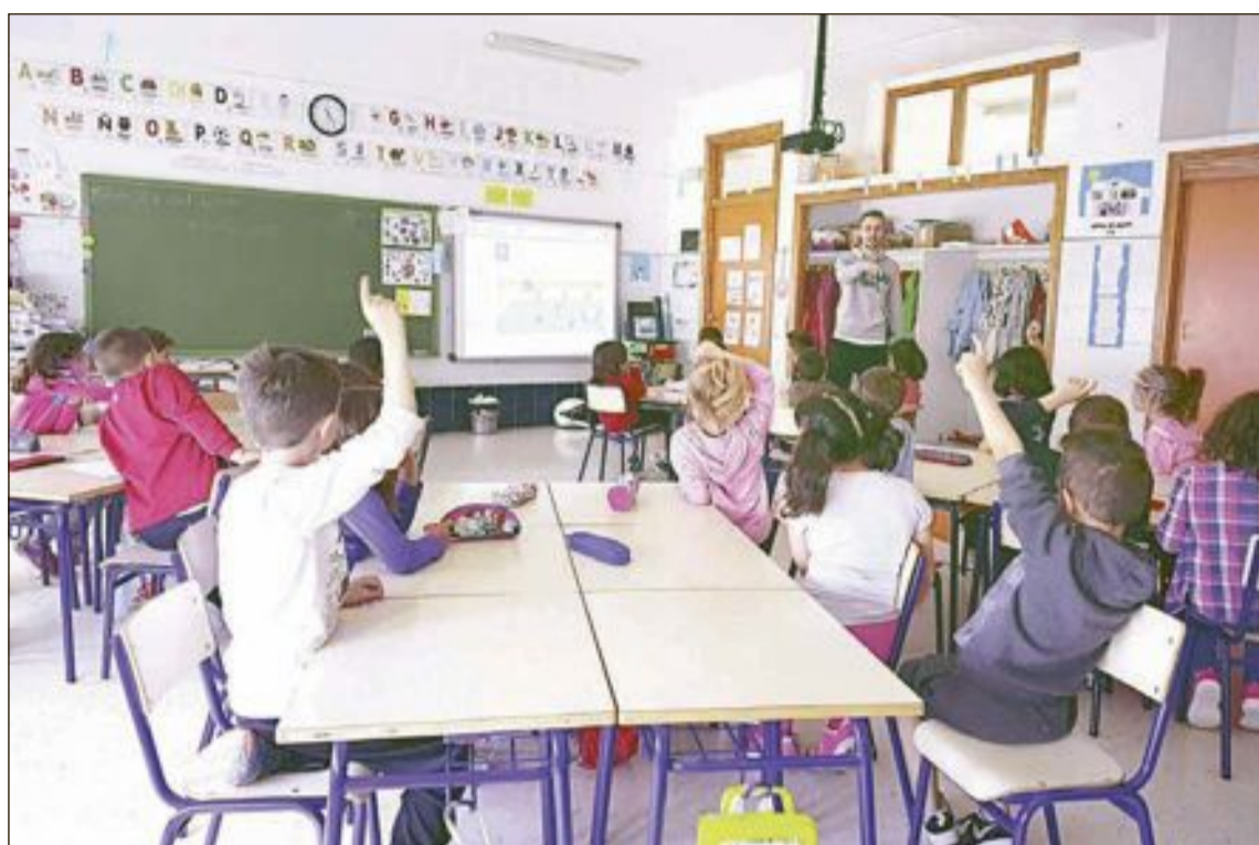
El Plan Local de Cardioprotección de Onil ha comenzado a explicarse a los alumnos más pequeños del CP San Jaime