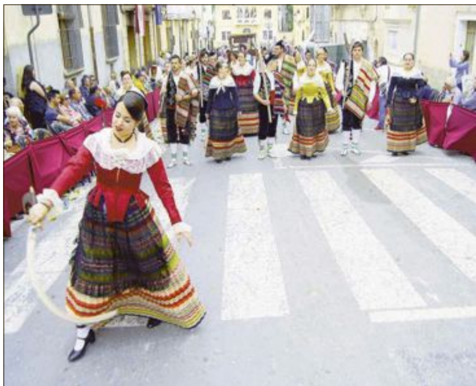
Las céntricas calles de Biar vivieron una Entrada espectacular