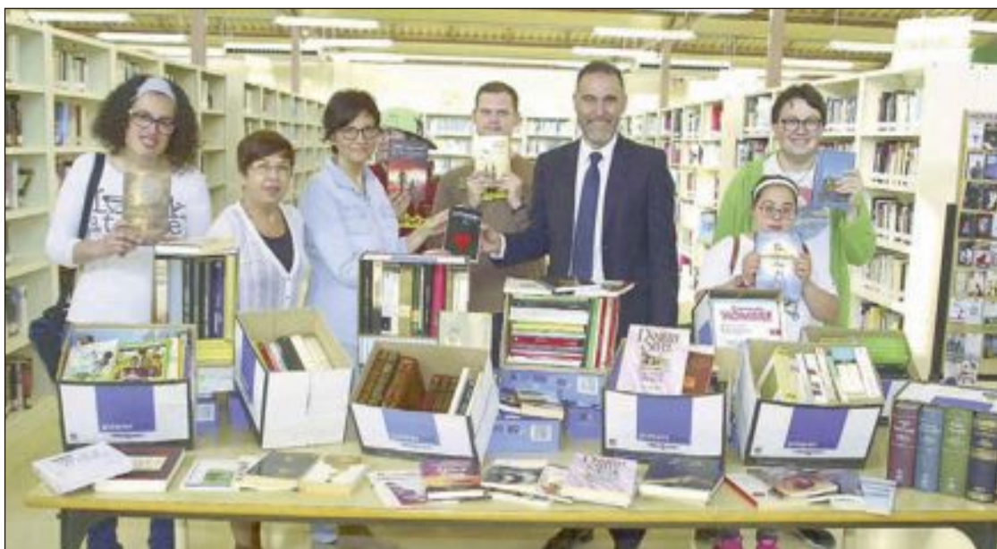
La biblioteca municipal se ha sumando a la campaña del Centro Ocupacional con una voluminosa entrega de libros