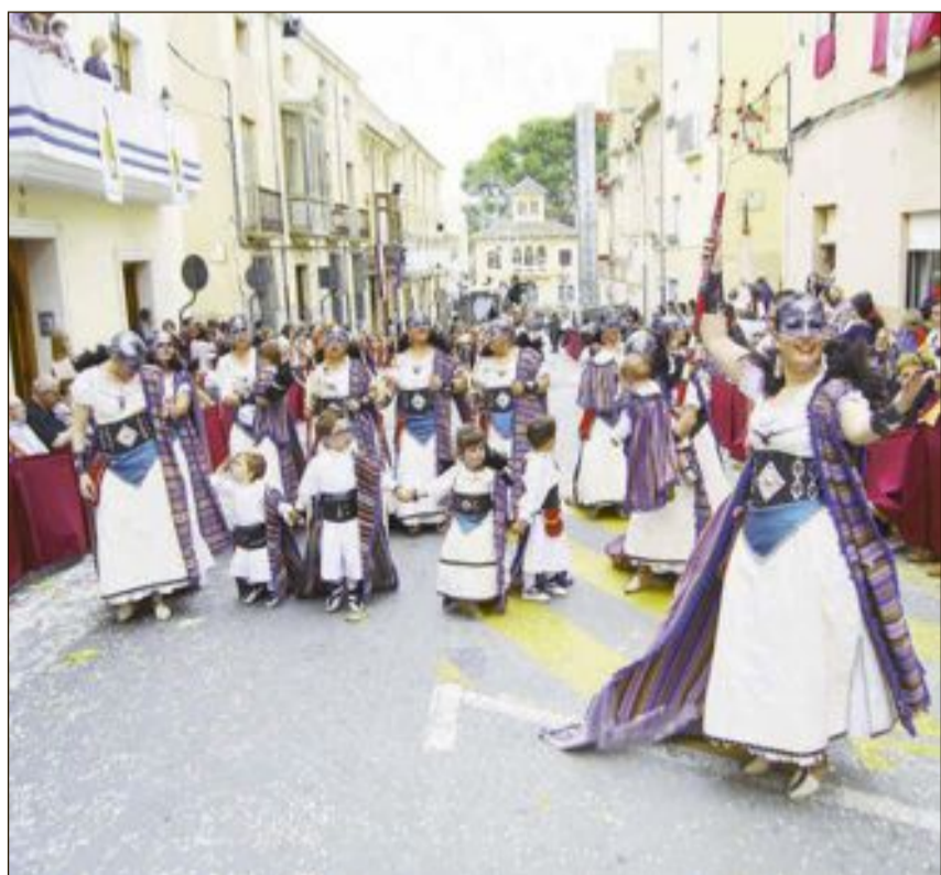
Niños y adultos protagonizaron los desfiles durante la Entrada Mora y Cristiana