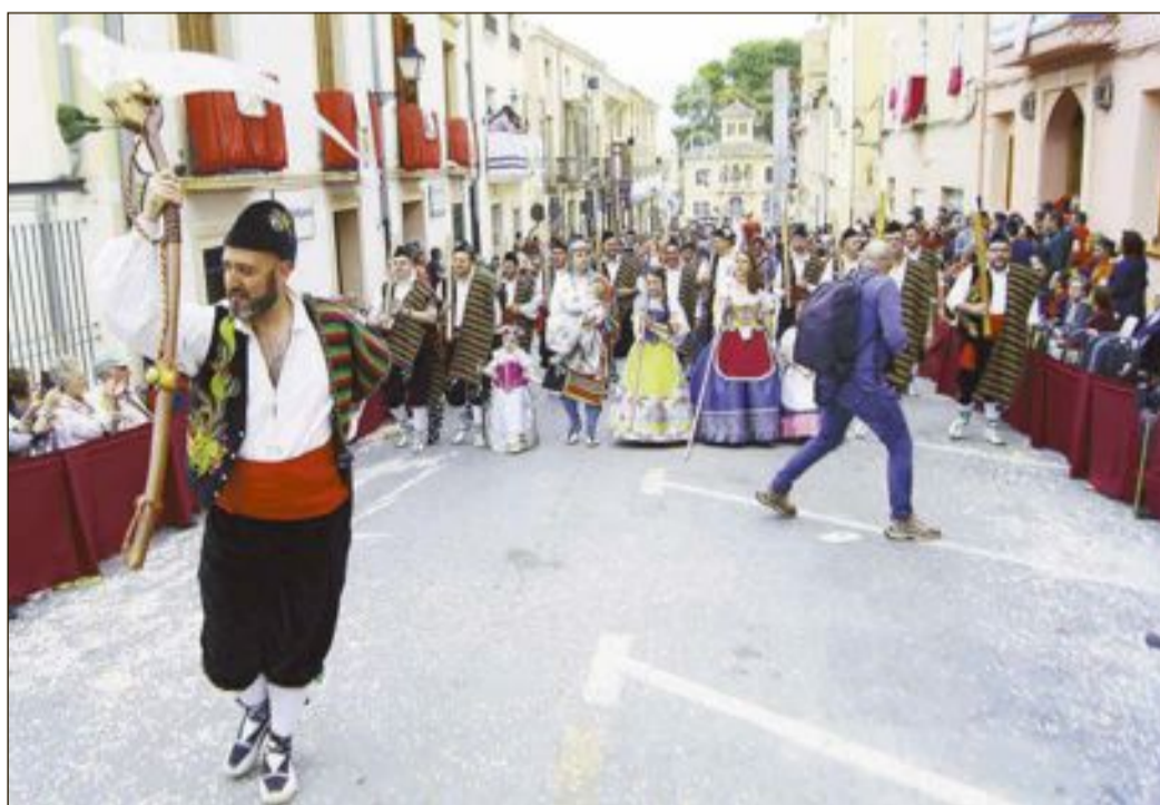
Creatividad y tradición durante los desfiles de las Entradas Mora y Cristiana de Biar