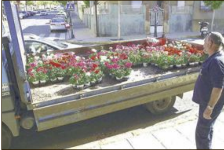
El martes 9 de mayo comenzaron a repartirse los 2.300 geranios

El martes 9 de mayo comenzaron a repartirse los 2.300 geranios para que los vecinos las coloquen en lugares visibles de sus viviendas o establecimientos y, además, están siendo informados sobre un concurso que va a convocarse para premiar los espacios, balcones o establecimientos más atractivos.