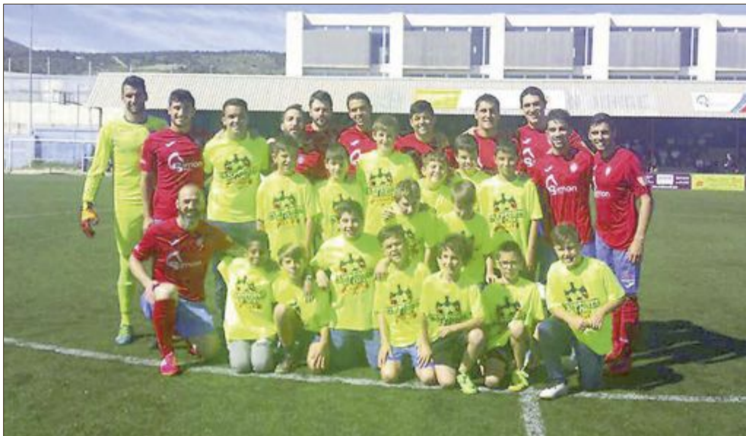
Los jugadores del Rayo Ibense que se enfrentaron al Novelda en el Vilaplana Mariel, junto con los chavales del equipo Alevín 'B', que se ha proclamado campeón de liga