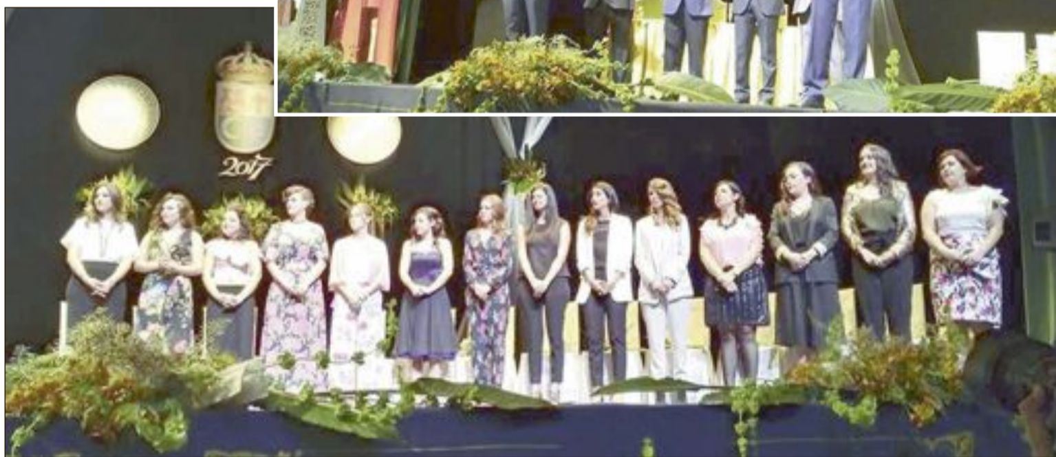
Al finalizar el acto de presentación de cargos, la Unión Musical ofreció un concierto de música festera