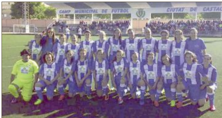
Las gradas del Municipal de Castalla estaban a rebosar el domingo 7 de mayo con motivo del partido amistoso entre los equipos femeninos de Castalla y Onil

IBI: Domingo 21 de mayo.- Intecomarcals IBI (SAN MIGUEL-BISCOI-VENTETA ELS CUERNOS-BARRANC DELS MOLINS...). Salida: Parque de Les Hortes, a las 8 h. Organiza: Amics de les Muntanyes. Imprescindible inscripción.