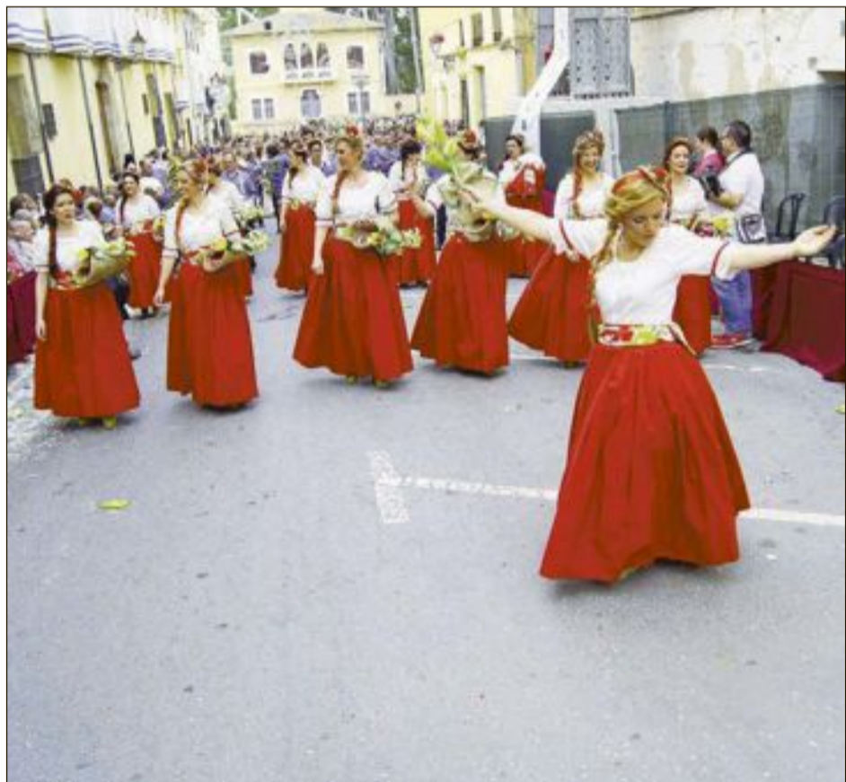
Las escuadras femeninas desplegaron creatividad y colorido en las Entradas