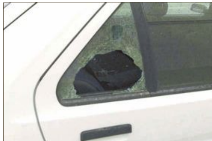
Para robar la pasada semana en el coche estacionado juntos los juzgados los autores usaron una piedra con la que rompieron una luna

y técnicamente factible”, como señalaron en su visita los técnicos de la conselleria de Educación. Sin embargo, el PSOE considera que abrir una guardería supondría “desvestir a un santo para vestir a otro” y propone que los locales se mantengan para actividades de ocio, como conciertos de música, salas de baile y locales de ensayo para grupos musicales locales”.