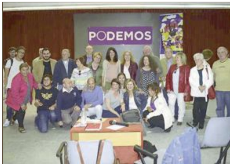
Miembros del Círculo de Ibi con los representantes de las alternativas que se presentan

Desde el Círculo de Ibi explican que el acto se desarrolló en un ambiente asambleario e “ilusionante con las metas puestas en recuperar las instituciones para la gente en 2019”.