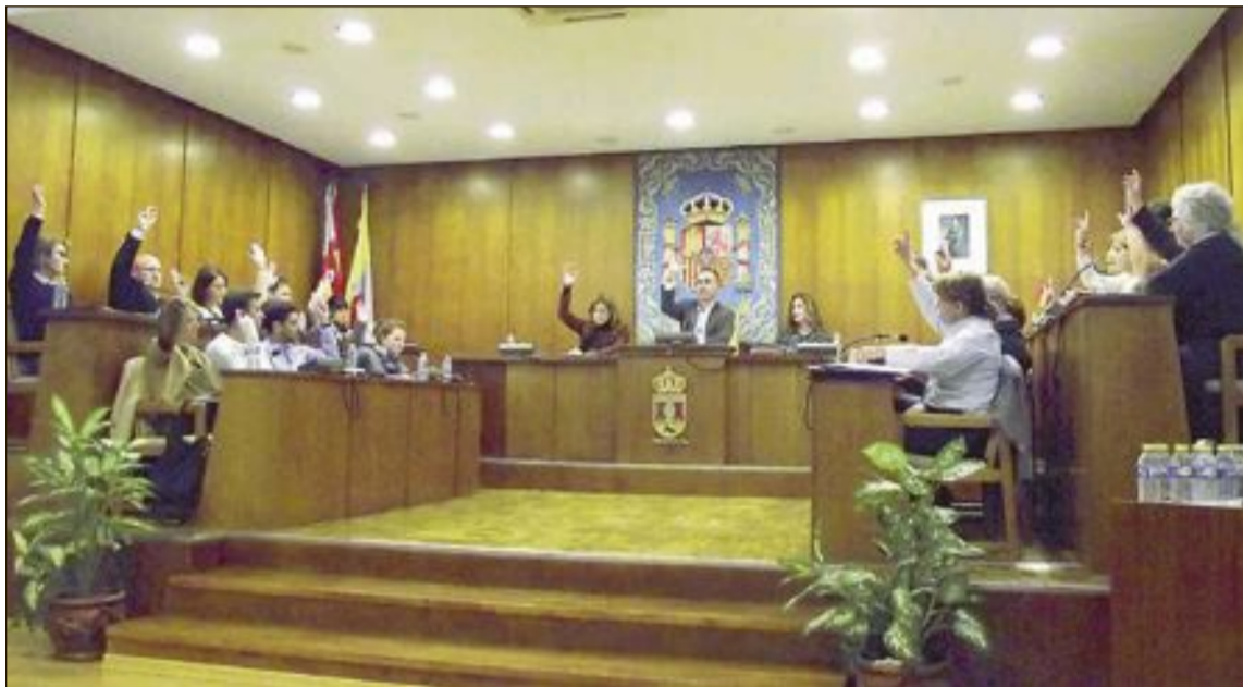
Votación por unanimidad del pleno en un imagen de archivo

nez, fue el más beligerante contra estos presupuestos del Estado y contra quienes “van a votar a favor de ellos”, aunque se mostró especialmente indignado con los diputados valencianos y alicantinos porque “podrían cambiar esta situación y no están haciendo nada”. Señaló que la Comunidad es la peor financiada desde hace 20 años y aseguró que “sale más barato convocar