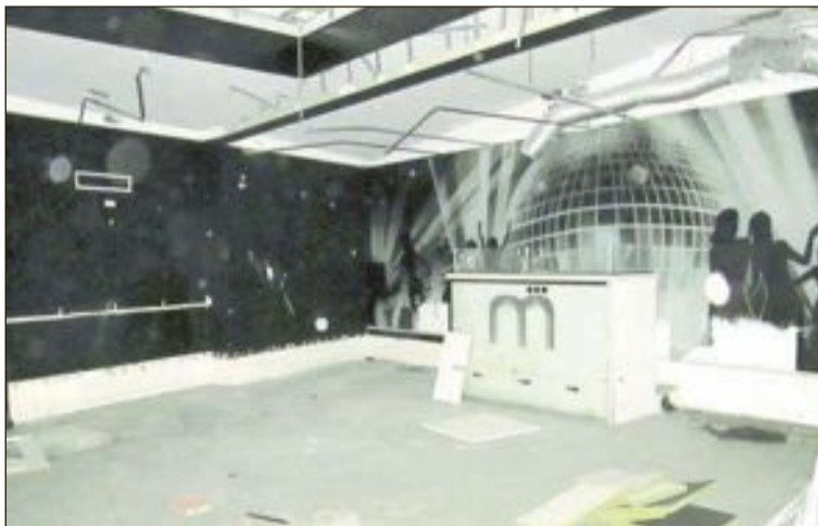
Los locales han sido desmantelados por los antiguos arrendatarios

han sido desmantelados por los antiguos arrendatarios, que se han llevado parte del aislamiento acústico del techo y paredes.