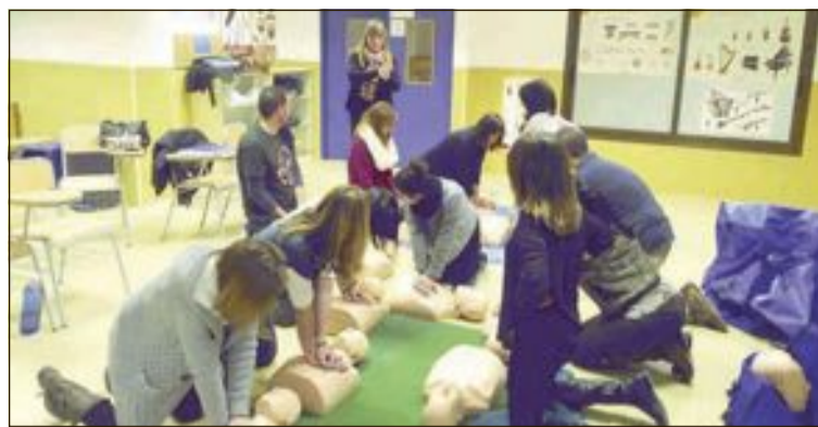
Se impartirá a profesores, alumnos de 6º Primaria y 2º y 4º de Secundaria

A partir de ahora, las donaciones deben efectuarse directamente en el centro.