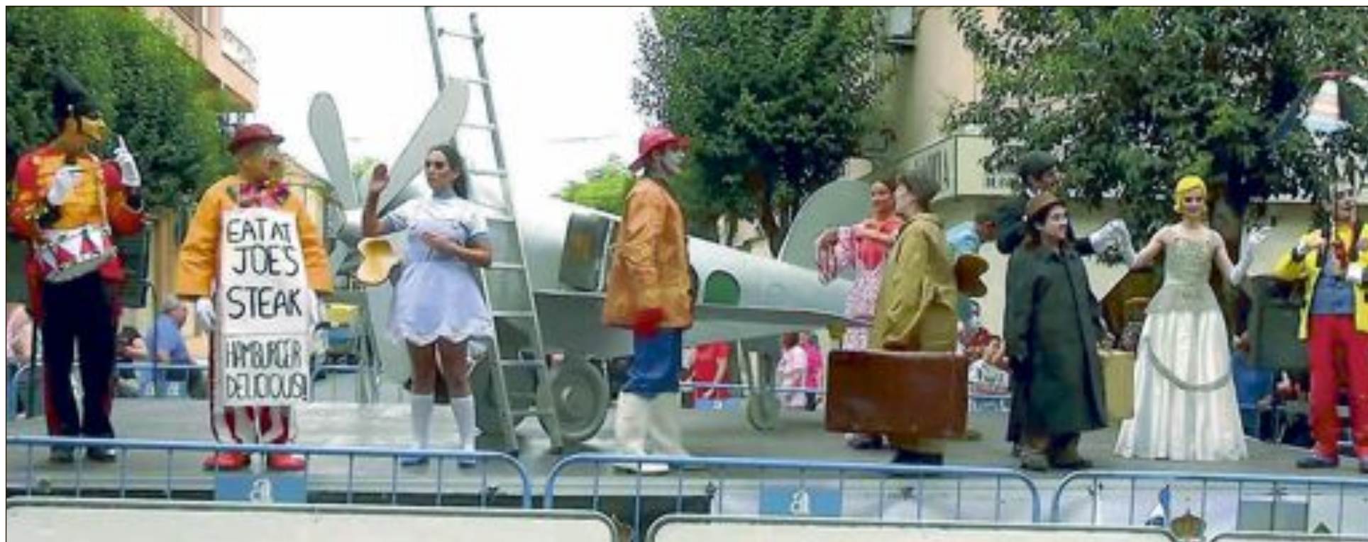
Los juguetes de Payá volvieron a cobrar vida