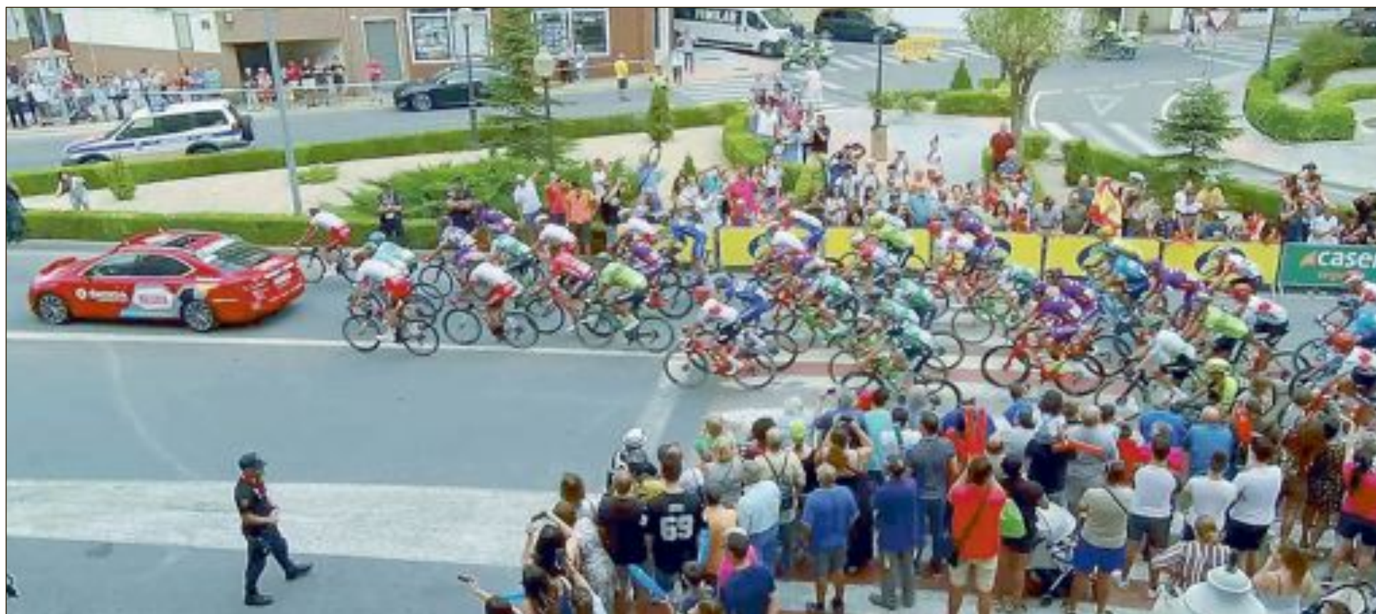
El público se agolpa para ver la salida de la Vuelta