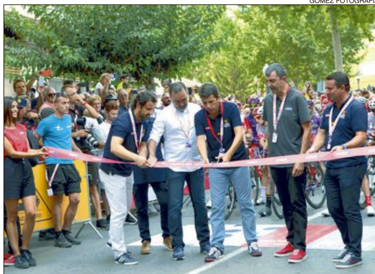
El presidente de la Diputación y el alcalde de Ibi, cortan la cinta que da inicio a la etapa