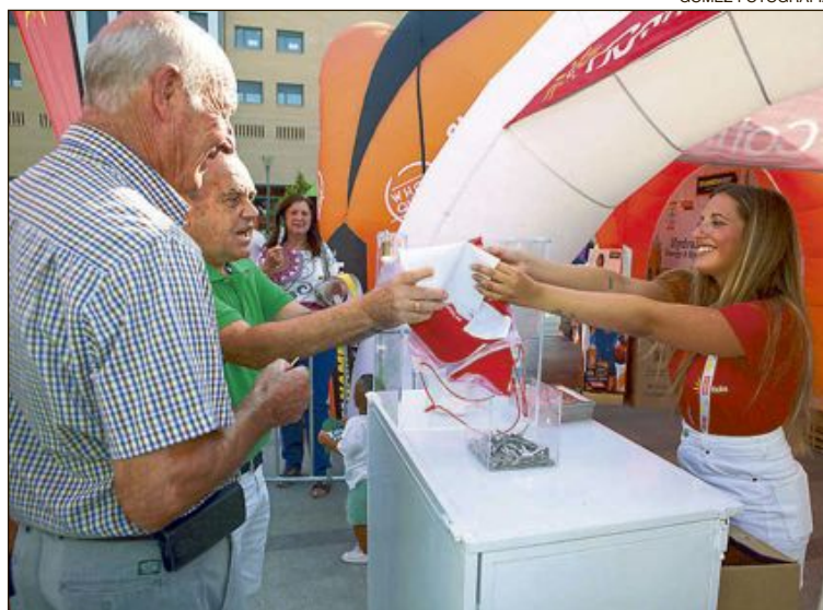
La Vuelta Ciclista a España, reclamo publicitario de primer nivel