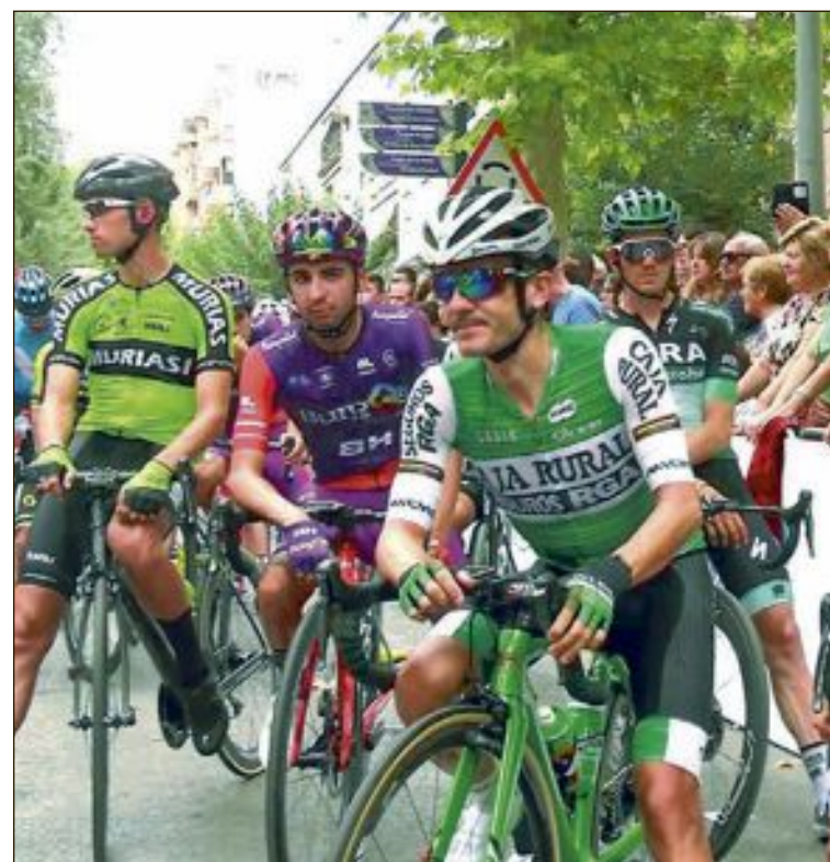
Los corredores, momentos antes de la salida