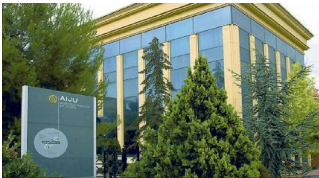
Instituto Tecnológico de Productos Infantiles y Ocio (AIJU), situado en la avenida de la Industria, de Ibi

La jornada es gratuita y durará tres horas. El plazo de inscripción finaliza el 15 de septiembre.