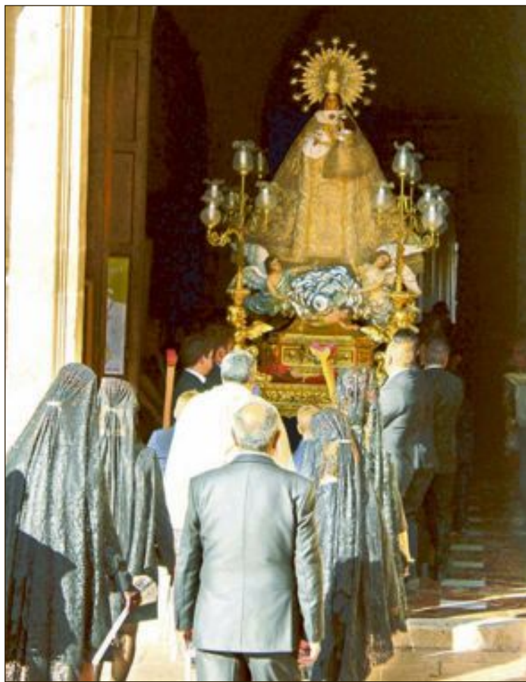
La Patrona entran al Temple Parroquial