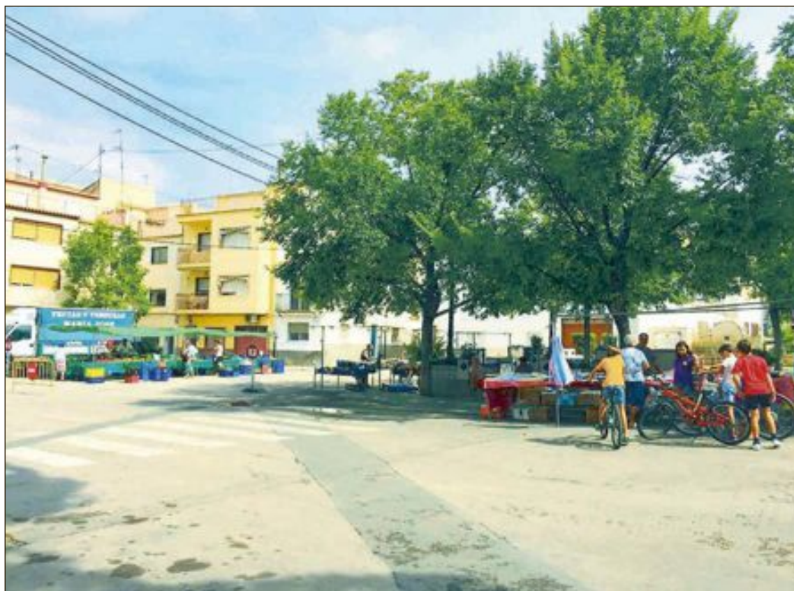
Des del 27 d'agost, el mercat ambulant s'instal·la en la plaça de la Glorieta, la seua ubicació original

ció de cap carrer al tractar-se d'una plaça que no té eixida i, finalment, es recupera una ubica-