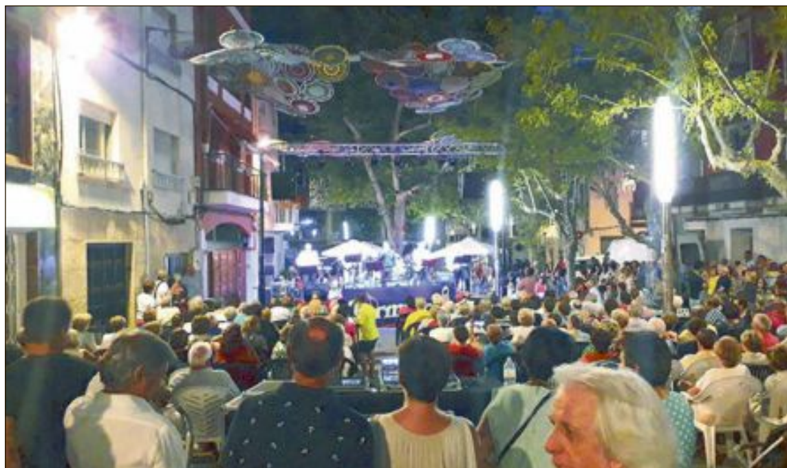
El grupo Fórmula VI actuará el domingo 1 de septiembre en la plaza de la Palla, a las ocho de la tarde

Será también en la Plaza de la Palla, a partir de las 16:30 horas.