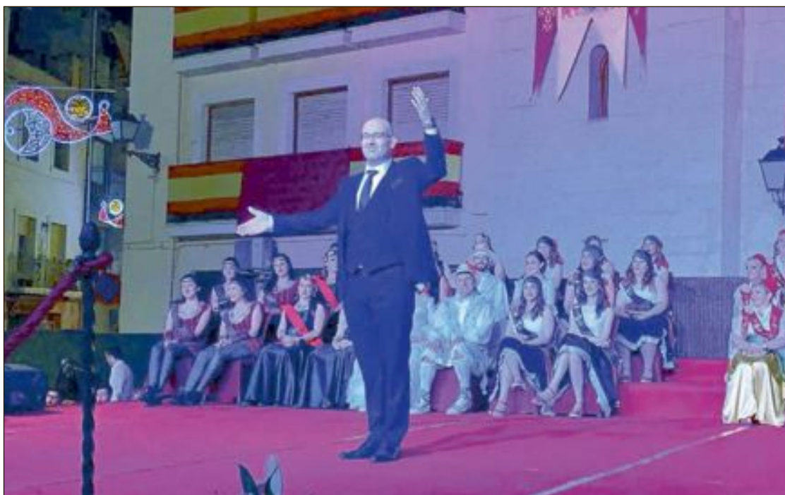
El pregoner la nit del dissabte 24 d'agost en l'acte de l'Exaltació Festera, celebrat en la plaça Major

D'altra banda, es va a dur a terme un monitoreo en distints punts estratègics del Riu Verd per a definir els tractaments i les aplicacions que cal realitzar en cada cas.