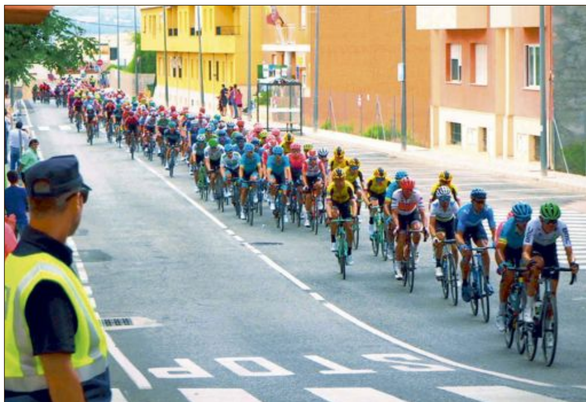
El pelotón cruza Tibi dirección al segundo puerto de la etapa