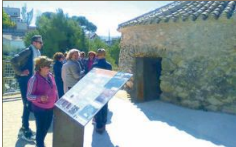
Ruta realitzada al mes d'abril

Esta activitat és de caràcter gratuït, però requerix inscripció prèvia, cridant al número 652 414 426 o bé en info@somme-