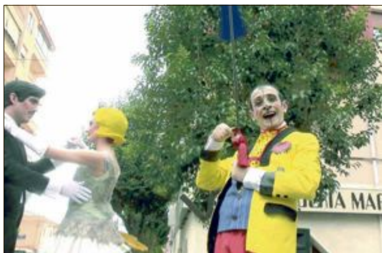
Font Viva dio vida a los juguetes de Payá