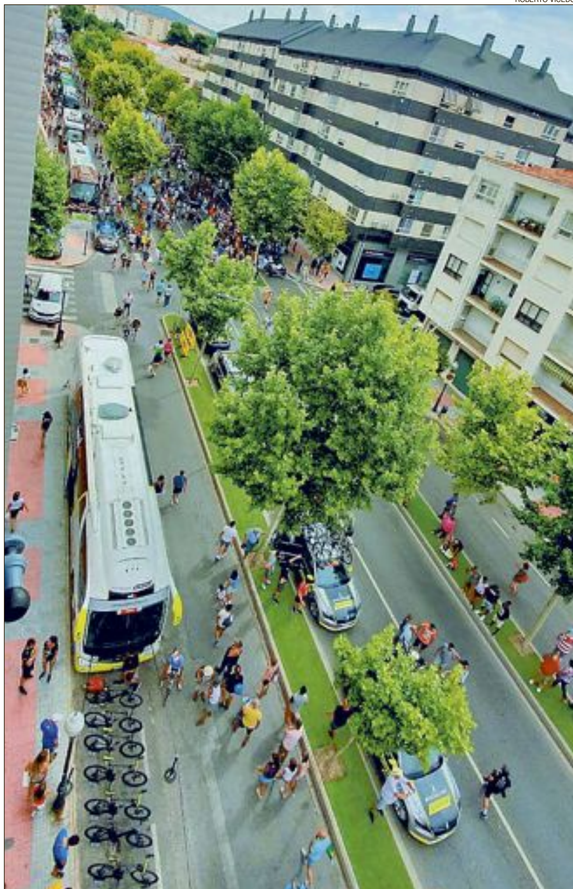
Espectacular aspecto de la Avenida Juan Carlos I, momentos antes de la salida