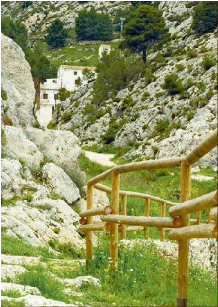
Vía de acceso al Barranc dels Molins