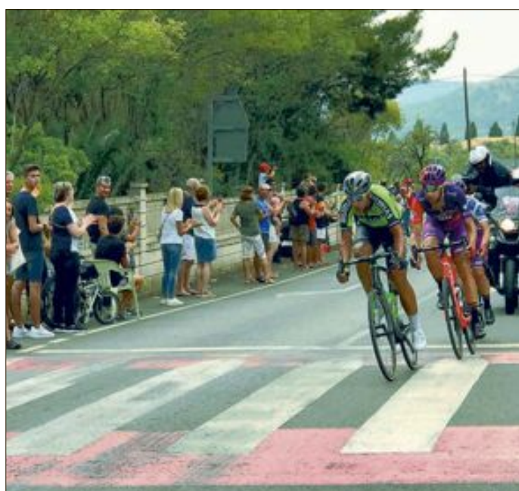
Vecinos de Onil reciben a los corredores a su paso por la localidad