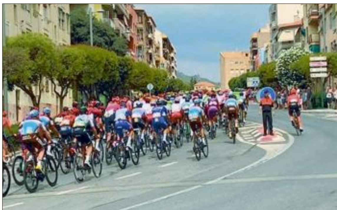
El pelotón cruza la avenida principal de Biar