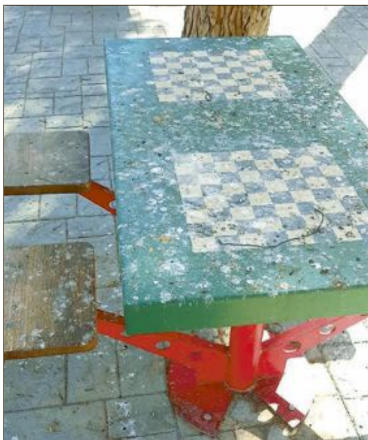
Estado en el que se encuentran las mesas de juegos ubicadas en el parque Pocoyó, situado frente al Centro Social Polivalente

Ante esta situación, el PSOE reitera su petición para que se limpie la zona y se estudie la idoneidad de mantener estos juegos en el citado parque.