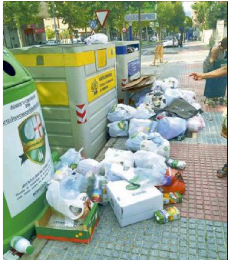
Estado en el que se encontraban algunos contenedores

Sobre la frecuencia del servicio, la edil de Servicios Públicos indica que la recogida del cartón y envases se lleva a cabo en días alternos, siendo los domingos festivos y, por tanto, sin servicio.