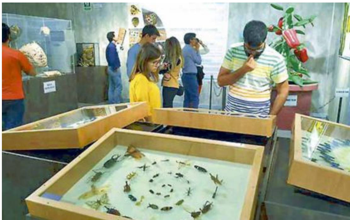
La muestra temporal fue inaugurada a principios del mes de mayo

Los insectos suman más del 70 por ciento de las especies conocidas e intervienen en todo el proceso de los ecosistemas. Siendo el grupo de seres vivos más diverso de la Tierra, con más de un millón de especies descritas es, sin embargo, uno de los grupos más amenazados actualmente.