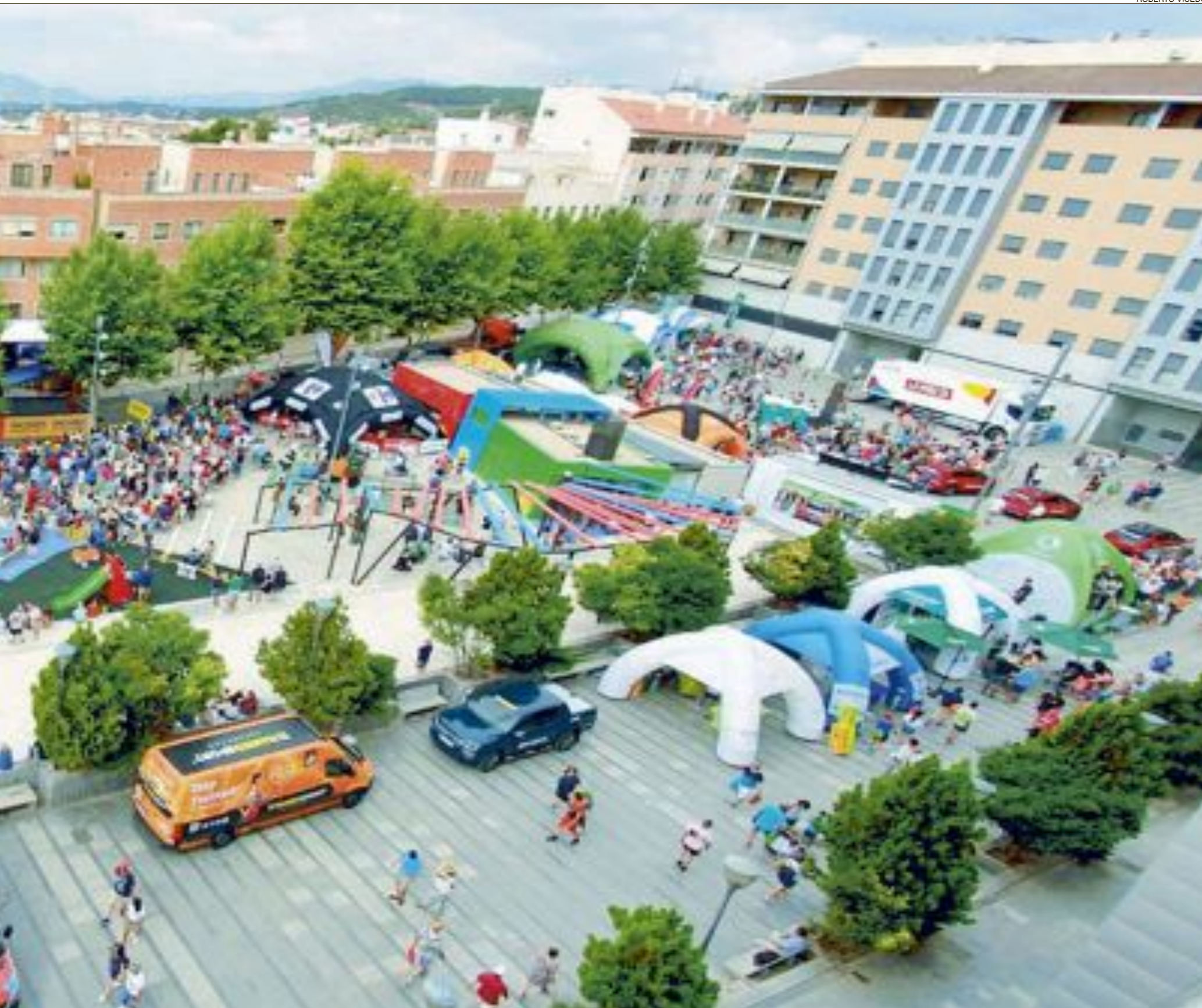
Aspecto de la Plaza del Centenario durante la jornada de la Vuelta Ciclista