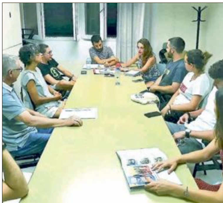
Integrantes del partido político Som Ibi