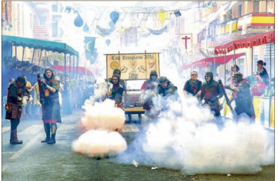
Los actos de arcabucaría son piezas fundamentales para las fiestas de Moros y Cristianos, explica la Undef

En cuanto al cambio de fechas de las fiestas, el presidente de la Comisión indica que no ha habido ningún avance y la propuesta sigue pendiente de la respuesta del Ayuntamiento.