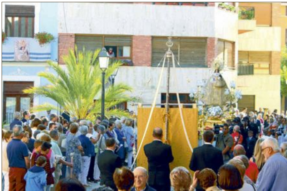
La imatge de la Mare de Déu s'ha passejat per tots els carrers de Biar, on ha sigut rebuda amb molta devoció

En acabar, les parrandes ballaran el 'fandango de Biar', acompanyats per la colla de dolçaina 'La Bassa la Vila'.