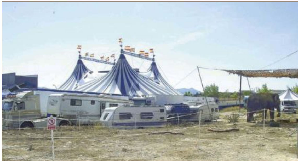
El circo está instalado entre el Auditorio y el colegio Rico Sapena; a la derecha de la imagen, un elefante

Los responsables de este colectivo anuncian que repartirán en