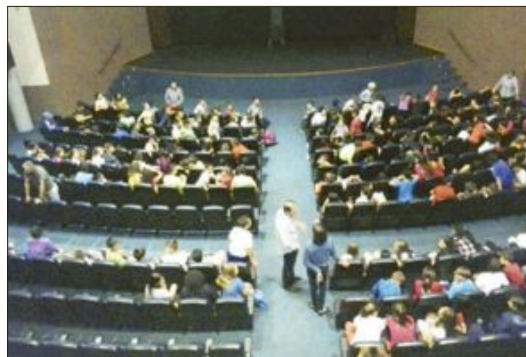
Las proyecciones se desarrollaron en el auditorio del Centro Cultural