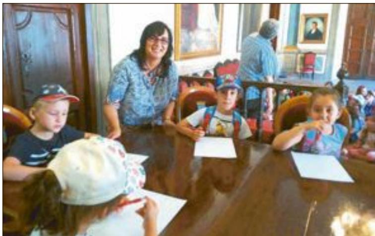
Los niños ejercieron de políticos por un día en el salón de Plenos