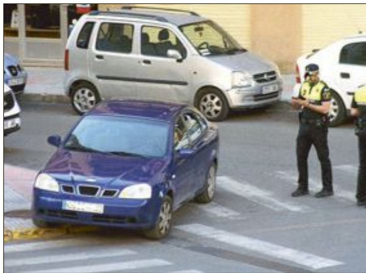
Los hechos sucedieron en el cruce de las calles Médico Anguiz y Tibi

Como informó este periódico, la exalcaldesa fue sancionada por agentes de la Policía Local por estacionar en el cruce de las calles Médico Anguiz y Tibi, subido a la acera, en una rampa de minusválidos y ocupando dos pasos de cebra. El vehículo estuvo más de veinte minutos entorpeciendo el tráfico.