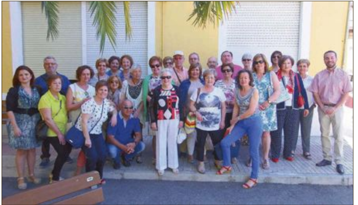
Los alumnos asistieron el viernes 3 de junio al acto de clausura del curso en la universidad Miguel Hernández

Este ciclo ha tenido muy buena acogida, con una media de 14 padres por sesión. Desde la organización señalan que los asistentes han solicitado que se vuelvan a realizar futuras ediciones, si es posible en horario de tarde.