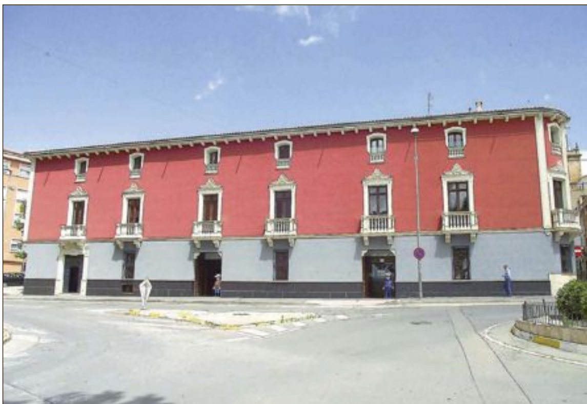
El Museo de la Muñeca de Onil está ubicado en el interior de la Casa de l'Hort