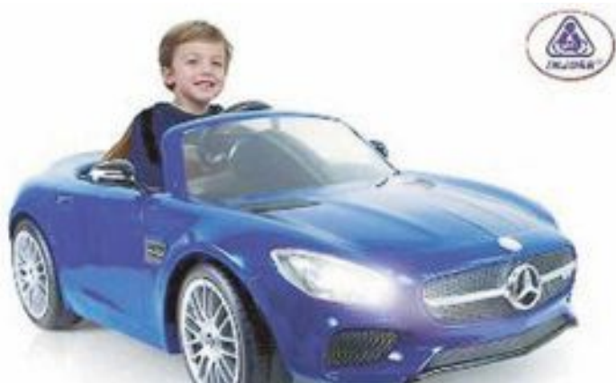
El coche Mercedes AMG GT 6V, de Injusa, es uno de los juguetes premiados

El Mejor Juguete en la categoría de vehículos montables de gran tamaño ha sido para el