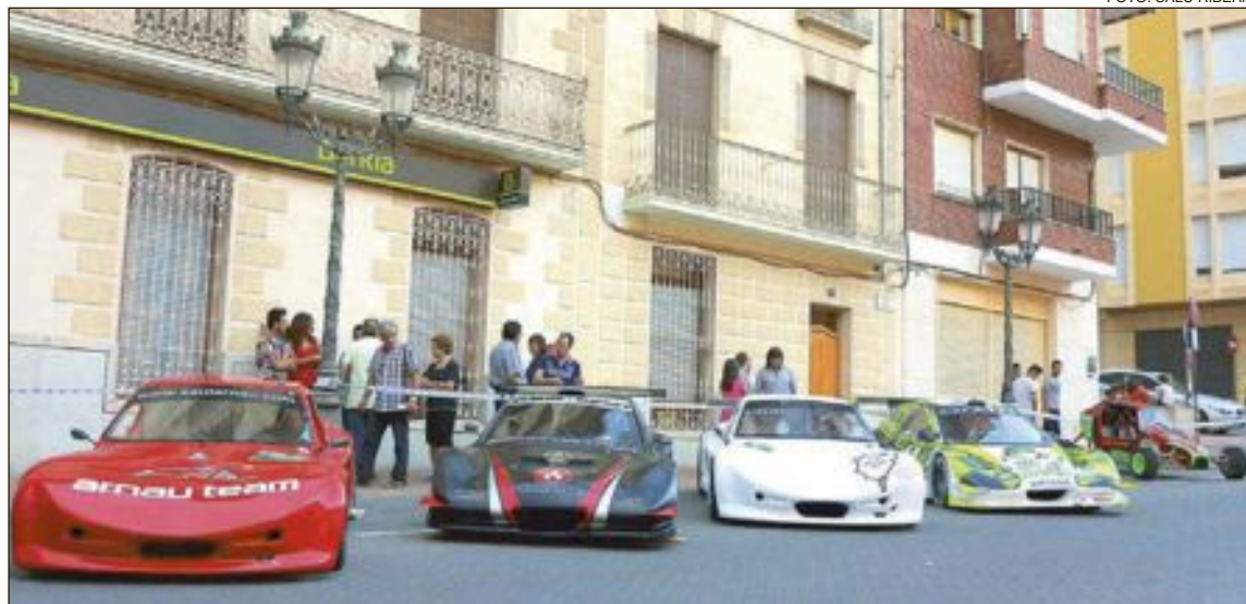
Los vehículos participantes en este rally estarán estacionados el viernes 10 de junio en la avenida de la Constitución y la plaza Mayor de Onil, para que vecinos y visitantes puedan verlos de cerca

Llama la atención la 'diferencia de edad' entre vehículos: algunos son del año pasado y otros fueron matriculados en los años 70. Es decir, diferencias de