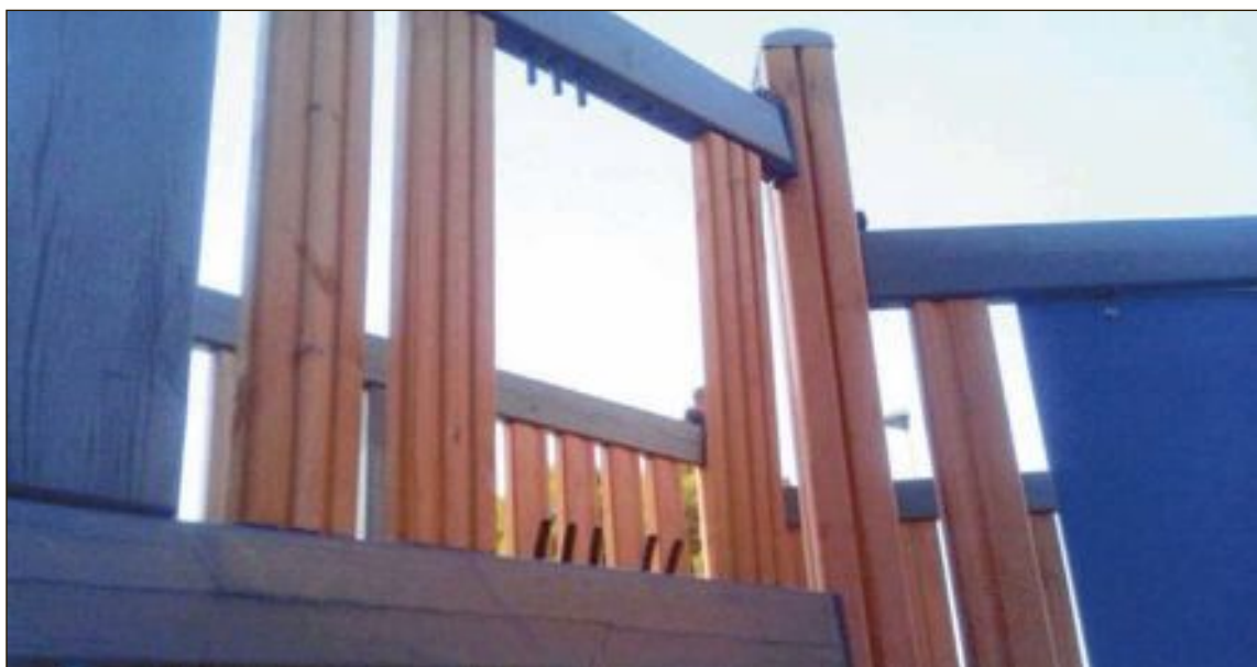
El barco es el elemento de juego que más actos registra y esta ocasión se han roto listones de madera a patadas

sorprea, tras reparar los listones afectados, vuelven a romperlos en pocos tiempo, lo que ya ha supuesto un gasto de más de 1.000 euros para las arcas municipales”.