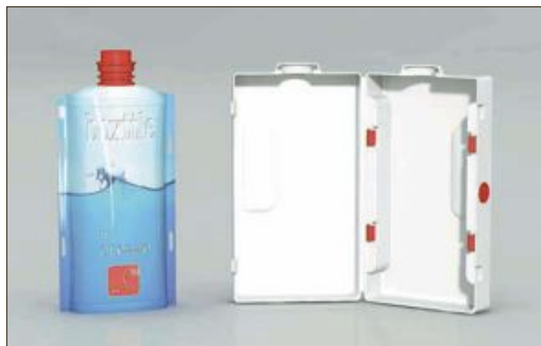
Boxttle consta de un envase flexible y una carcasa rígida para dar funcionalidad

Toda la información sobre esta empresa la puedes encontrar en su web, www.crezze.com .