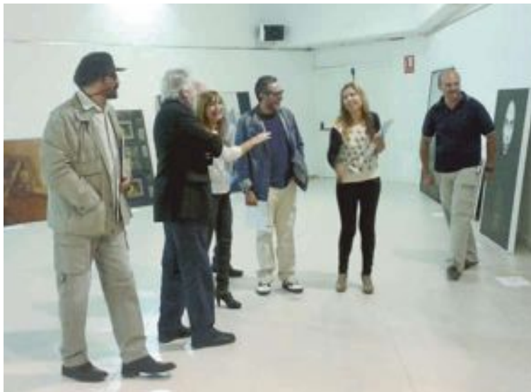
El jurado de la anterior Bienal Eusebio Sempere, reunido en la Pinacoteca

Bases. Pueden participar todos los artistas mayores de edad que