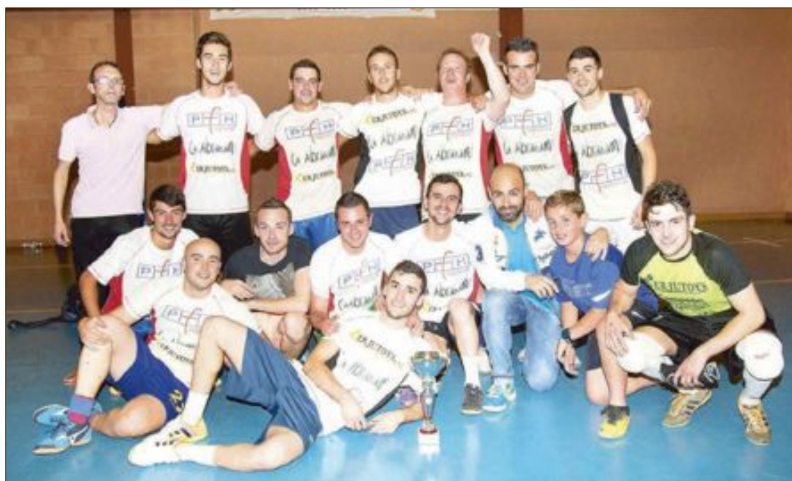
El equipo PFH-Ca Abraham-Erjutoys se ha proclamado campeón de la Liga local de Fútbol Sala (foto: archivo 2015)