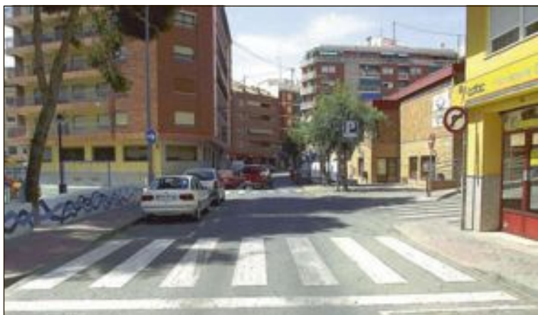
El paso de peatones a la salida del parque infantil podría resultar peligroso debido al intenso tráfico que soporta esta calle

Además, agrega la concejal, “la Policía Local está al corriente de estas acciones y va a reforzar la vigilancia en este parque y en otras zonas para evitar estos actos vandálicos”.