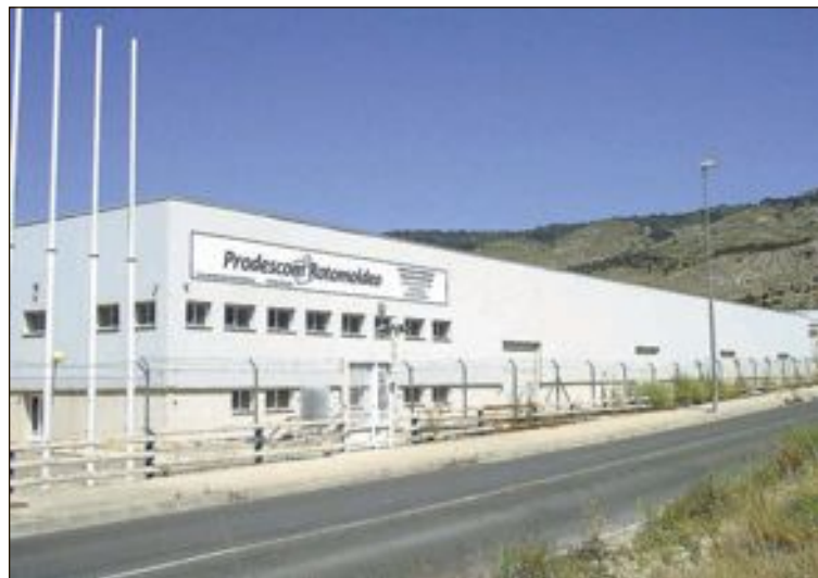
Una de las naves que ocupaba Famosa en Onil ya cuenta con el rótulo de la empresa Prodescom Rotomoldeo

10.- No olvides dejar tu sistema de alarma de seguridad siempre conectado. Y si no tienes uno, llámanos y te ayudaremos a sentirte más tranquilo con nuestras Alarmas de Alta seguridad para el Hogar.