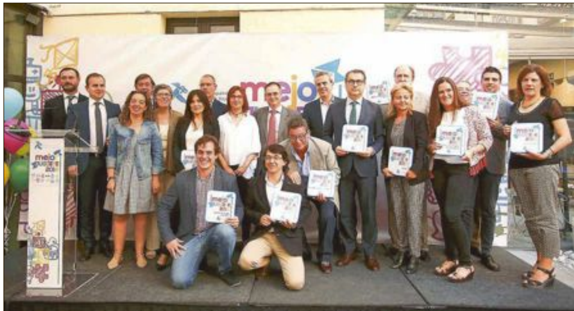
Los galardonados de esta última edición, que convoca anualmente la Asociación de Fabricantes de Juguetes

“Dile a todos lo que quieres hacer y alguien querrá ayudarte a hacerlo” W. Clement Stone