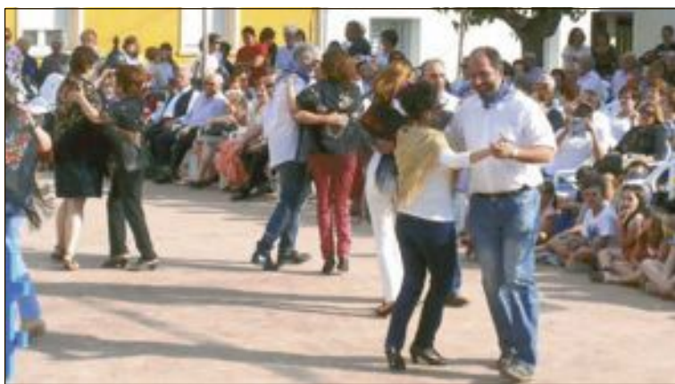
Actuación del grupo de danzas del barrio