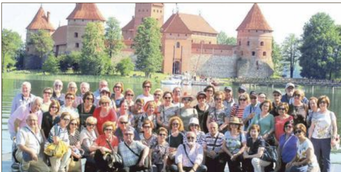
Viaje a los Países Bálticos de la UDP. Un grupo formado por 54 personas, socias de la Unión Democrática de Pensionistas de Ibi, ha realizado recientemente un viaje a los Países Bálticos. La estancia tuvo lugar del 27 mayo al 4 junio y visitaron las localidades de Estonia, Letonia y Lituania. En la imagen, el grupo de pensionistas con el castillo de Trakai (Lituania) al fondo.

que aplasta una y otra vez a las minorías y legisla a base de decretazos como “benditos” dictadores bolivarianos que tanto tienen en sus bocas pecadoras.