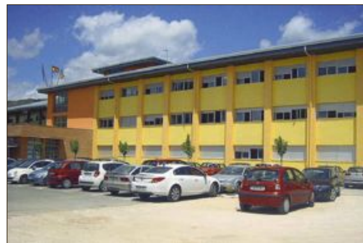
Vista parcial del IES La Creueta

Este nuevo modelo está acabándose de concretar con los servicios jurídicos del Ayuntamiento y, una vez sea una realidad, el Museo de la Muñeca de Onil será reconocido por fin como tal por parte de la Generalitat Valenciana. Es por ello que este proyecto es tan "ilusionante" para el actual equipo de gobierno, concluyó la alcaldesa.