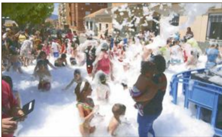
La mañana del sábado se organizó una fiesta de la espuma