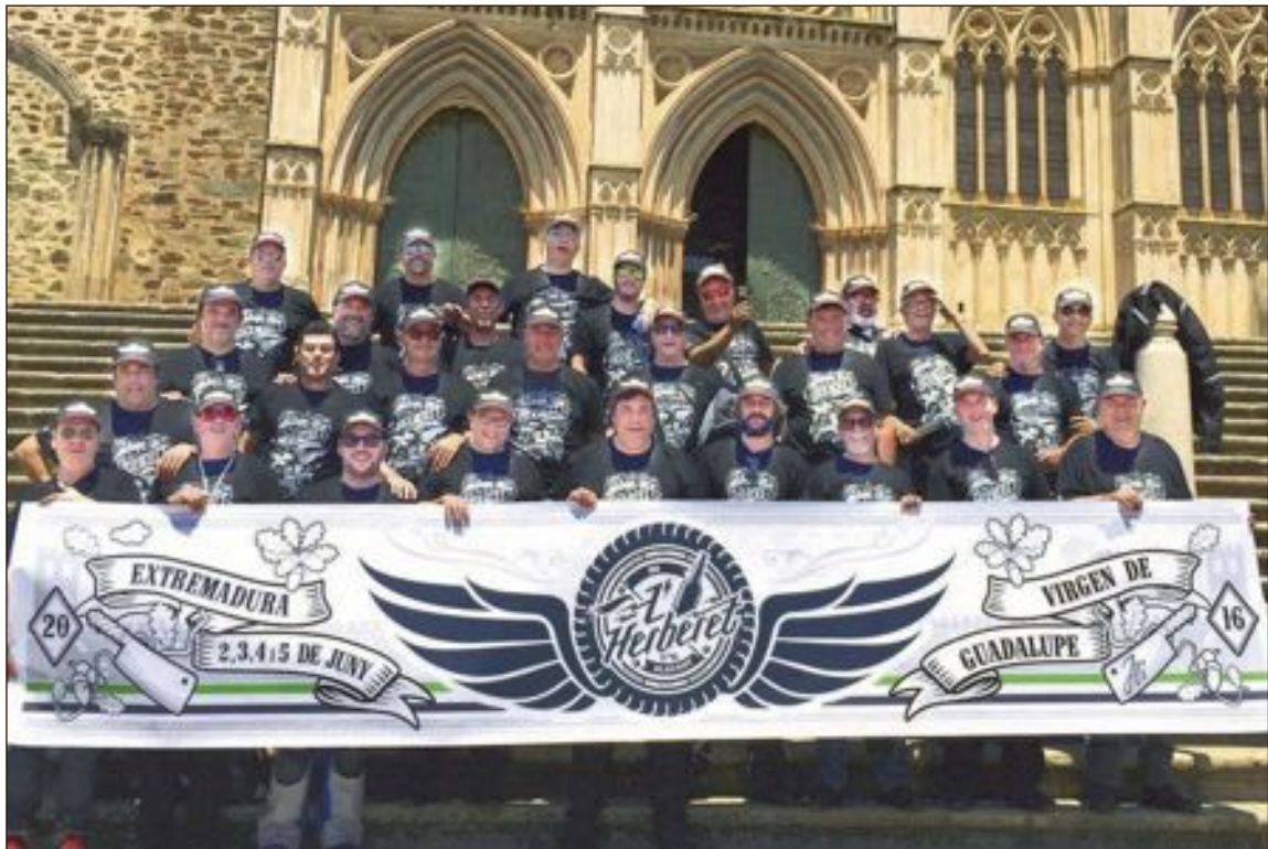
Los componentes de la expedición ibense en la escalinata de entrada al monasterio de Guadalupe (Cáceres)

El pasado 2 de junio, la Peña l'Herberet llevó a cabo su última aventura que duró cuatro días. En esta ocasión un grupo de 27 motoristas de Ibi se embarcó en una ruta de 2.000 kilómetros, recorriendo Extremadura en su totalidad. A pesar de las altas temperaturas que sufrieron durante todo el viaje, no se registró ningún tipo de incidente, por lo que el transcurso de la ruta fue sobre ruedas, alcanzando su punto álgido con la visita a la Virgen de Guadalupe. Desde aquí aprovechamos para dar las gracias a todas las personas que, como siempre, de forma desinteresada han ayudado a organizar y coordinar la expedición. Al mismo tiempo les animamos a empezar a preparar nuestra próxima aventura, en la que esperamos poder contar con buenos amigos que, por diversas circunstancias, no nos han podido acompañar estos últimos años.