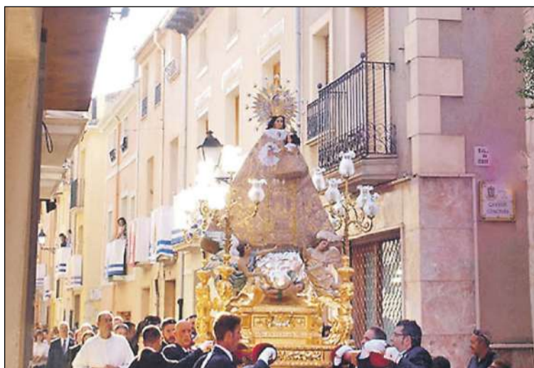
Procesión de la Mare de Déu de Gràcia

La festa tindrà lloc el dissabte dia 3 de setembre.