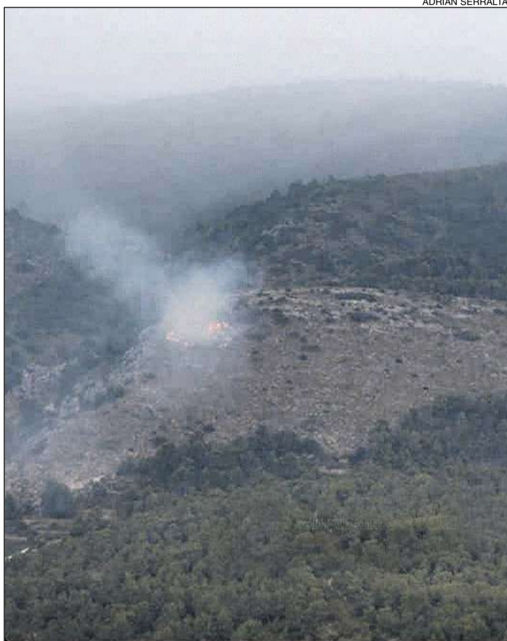
El fuego apareció la tarde del viernes 26 de agosto

Desde el Ayuntamiento se agradece la inmediata colaboración ciudadana, así como la rápida intervención de los servicios de emergencia y una afortunada lluvia.