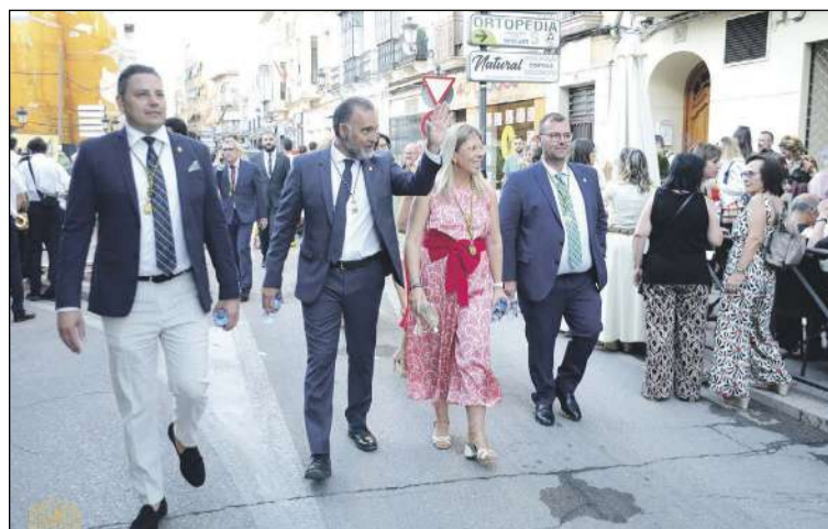
El alcalde, Rafael Serralta, junto a la alcaldesa de Tomelloso, Inmaculada Jiménez, paseando y saludando a los vecinos

file de Moros y Cristianos, donde Ibi mostró el encanto y la singularidad de sus fiestas patronales, despertando gran admiración y asombro entre el numeroso público que se agolpó en las calles del municipio manchego.