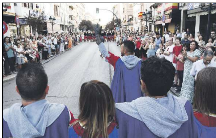
Cientos de vecinos de Tomelloso siguieron el desfile de Moros y Cristianos