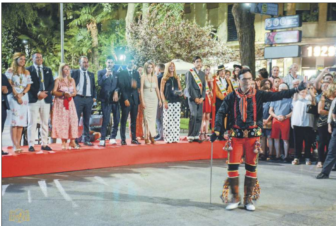
Las autoridades de Ibi y Tomelloso siguiendo el desfile en la Plaza del Carmen