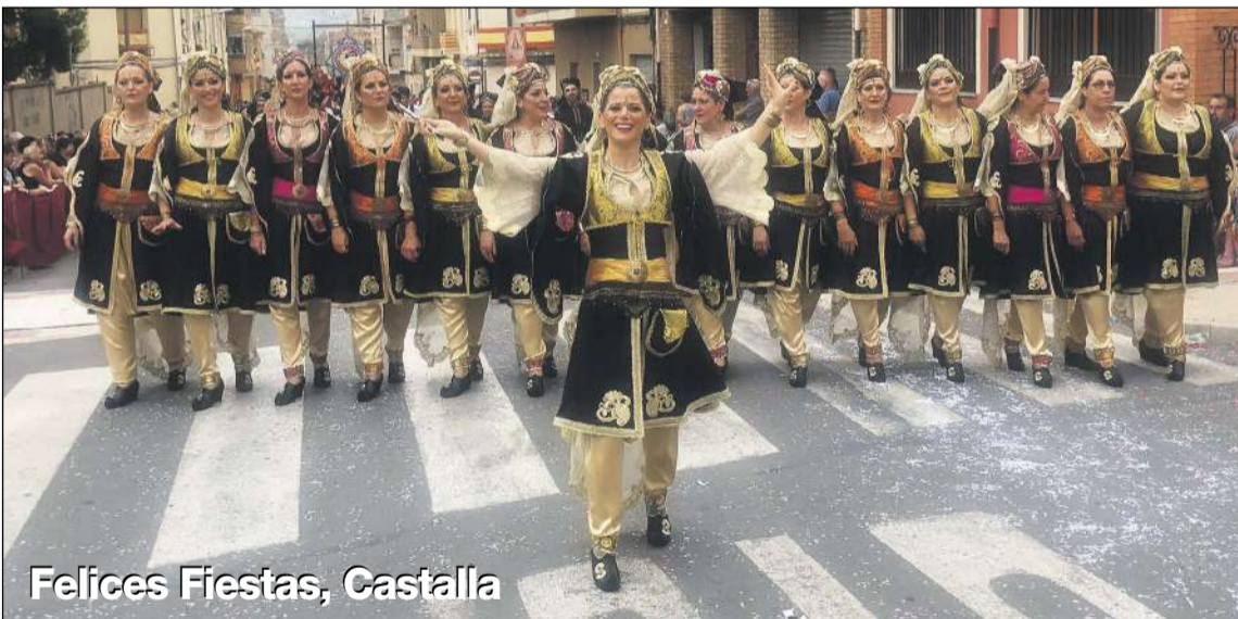
Felices Fiestas, Castilla