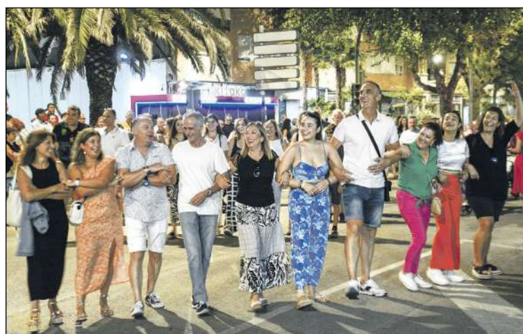
Más de quinientas personas se desplazaron en autobús hasta Tomelloso