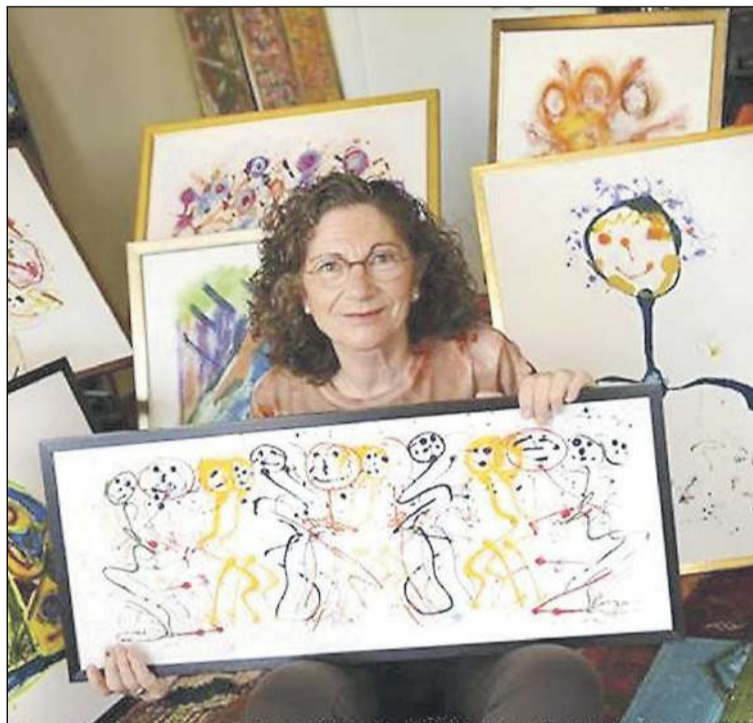
Durante la etapa de jubilación se despierta en ella su vocación pictórica y realizó una exposición titulada 'Mamarratxos'

La propuesta municipal fue aprobada en pleno, después de que se hubiera recabado a través de diversas entidades nacionales, provinciales y locales, de ámbito cultural, social y empresarial, la información necesaria para unirla al expediente de concesión de