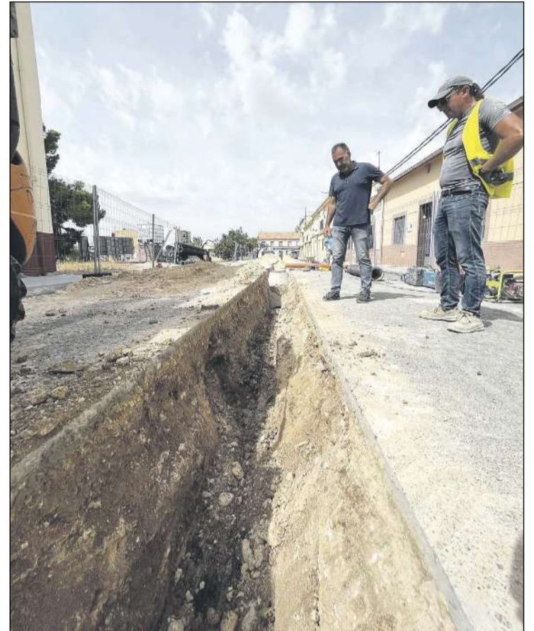
El alcalde supervisa los trabajos que se están ejecutando

Durante la etapa de jubilación se despierta en ella su vocación pictórica. Completamente autodidacta, necesita expresar sus vivencias en colores y formas a través de una colección de cuadros que ella bautizó con el nombre de 'Mamarratxos'.