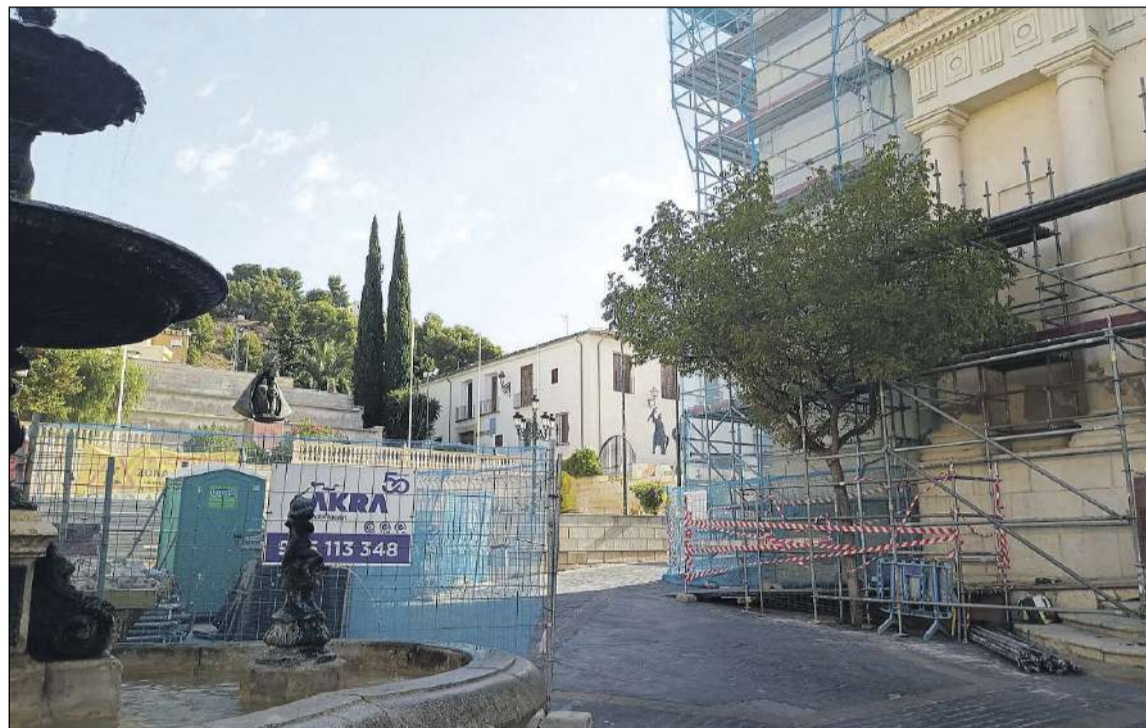
Debido a las obras de restauración de la fachada de la Iglesia, el acceso al monumento de la patrona está cerrado

Así pues, explica Eva Galera, la estructura donde se disponen los ramos de flores se colocará a la altura de la fuente de la plaza de la Iglesia y los festeros continuarán calle abajo. Para que la imagen de la patrona pueda presidir el acto, el Ayuntamiento ha encargado una réplica más pequeña del monumento. «Si no llegara a tiempo, porque los trabajos se están retrasando, coloca-