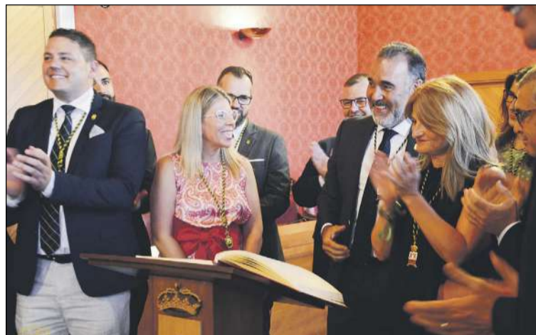
Un instante del acto institucional celebrado en Tomelloso