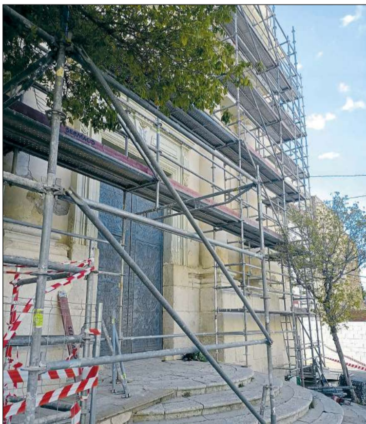
Los andamios de la fachada suponen un peligro en caso de que se produjera aglomeración de personas en la plaza

El concejal señala, además, que todas las modificaciones se han hecho «por seguridad, ya que la fachada está llena de andamios y la aglomeración de gente comporta peligro».