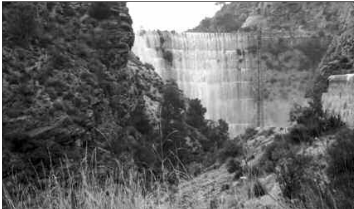
Aspecto actual del Pantano de Tibi

Aunque se trata de una inversión muy importante, el alcalde de Tibi confía en que las gestiones realizadas y el interés que esta iniciativa está despertando en el nuevo Ejecutivo “consiga que el tema siga adelante porque con la