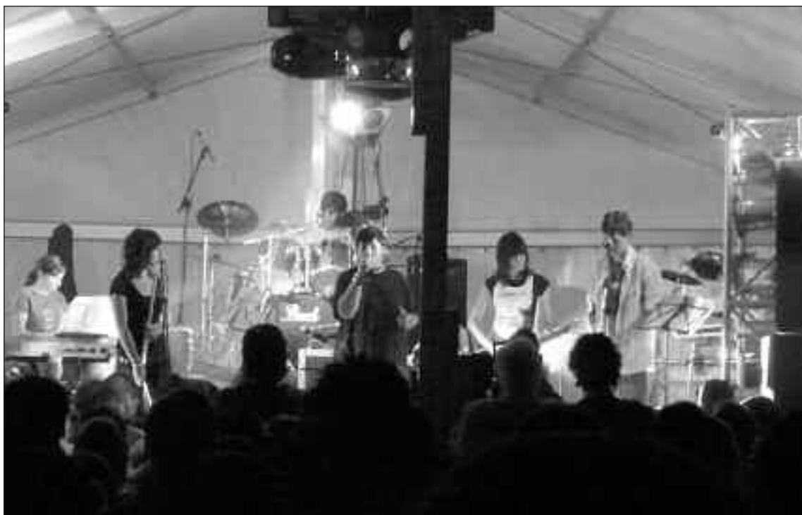
Un instante de la actuación del grupo ibense CN2 (Censurados) que obtuvo el segundo premio en el concurso