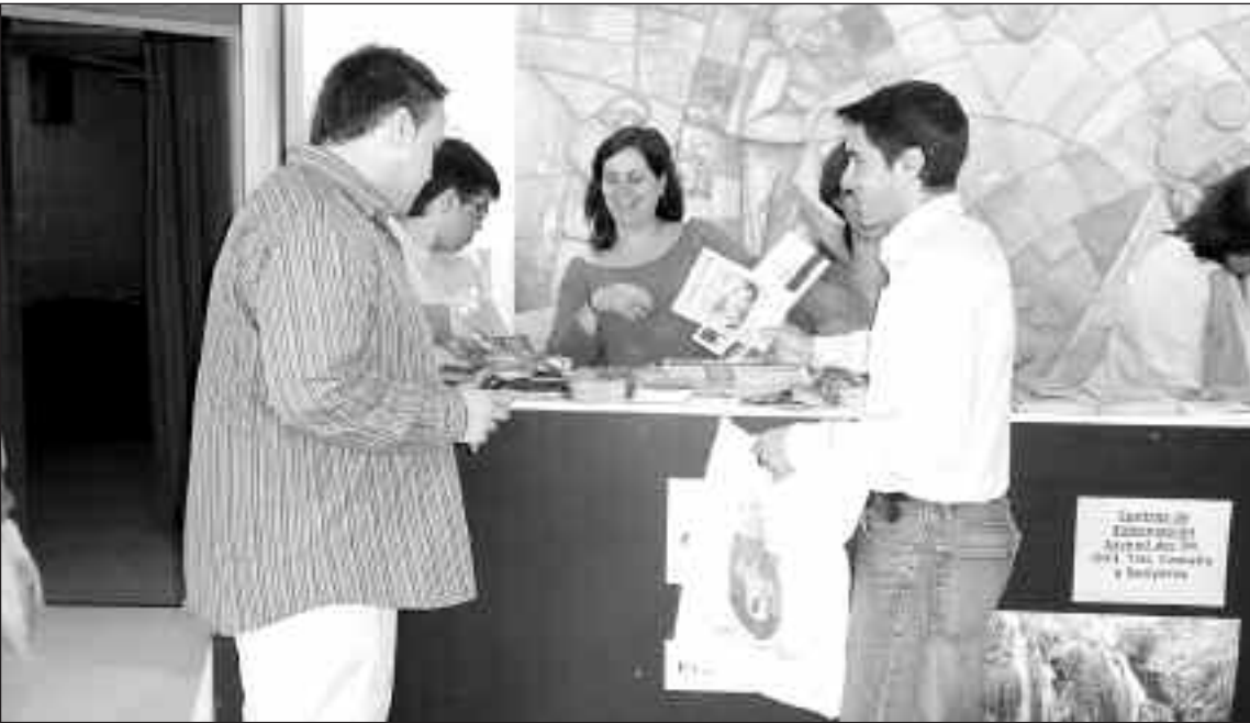
Los concejales de Juventud de Ibi y Onil en la primera jornada de iBiJvN'08