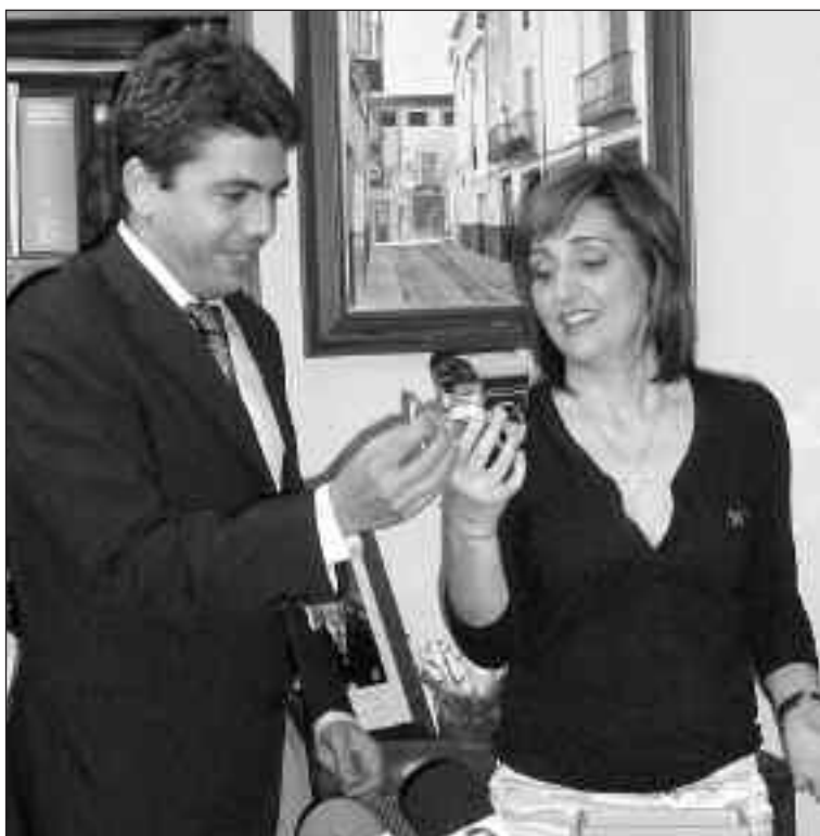
La alcaldesa entrega una tarta de plata al diputado de Infraestructuras