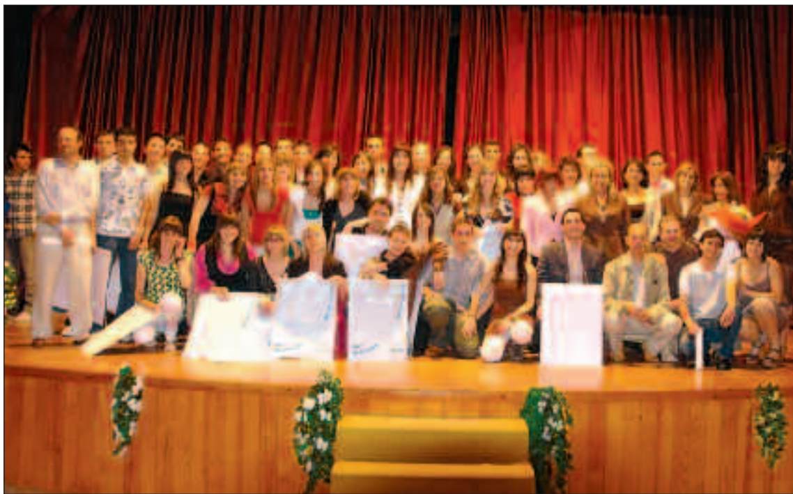
Alumnos y profesores del IES de Castalla en el escenario de la Casa de Cultura