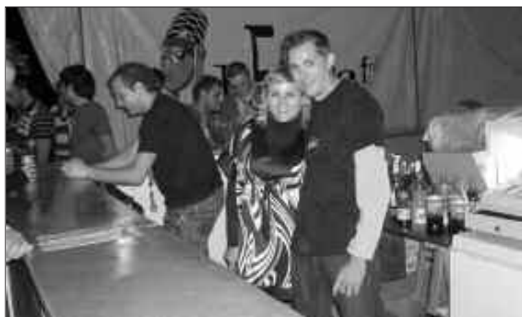
Durante las actuaciones, había también servicio de barra