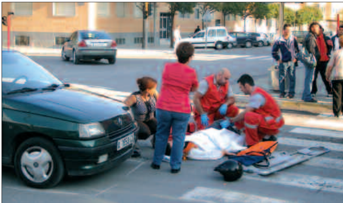
Uno de los heridos tuvo que ser trasladado en ambulancia al Hospital de Alcoy

Al lugar de los hechos, acudieron agentes de la Policía Local y una ambulancia. Uno de los jóvenes tuvo que ser trasladado en la ambulancia al Hospital de Alcoy.