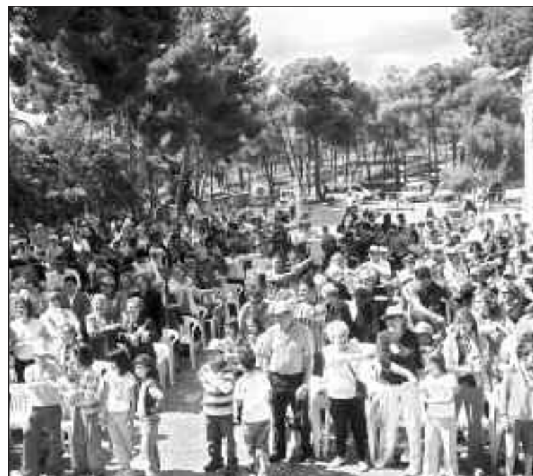
Las familias participaron de numerosos juegos y actividades