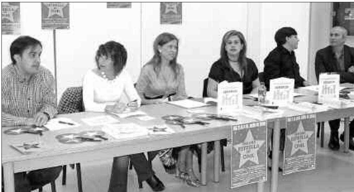
Acto de presentación del Libro de Comercio, el lunes por la tarde, en la pinacoteca del centro cultural de Onil

La charla del miércoles, impartida por el subinspector de la Policía Nacional, informó