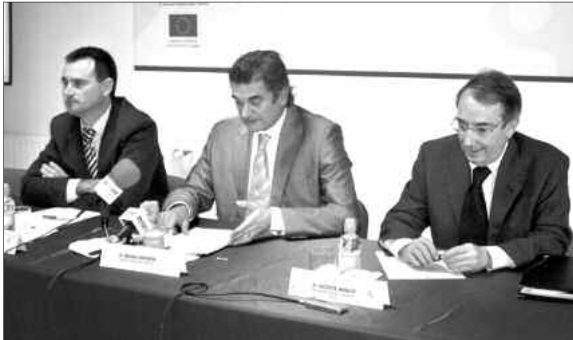
El director de Industria, en el centro, junto al presidente de AEFJ y el presidente de la comisión de Industria de AEFJ

La jornada, titulada ‘La marca, motor de cambio’, fue clausurada por el director de Industria y el presidente de la