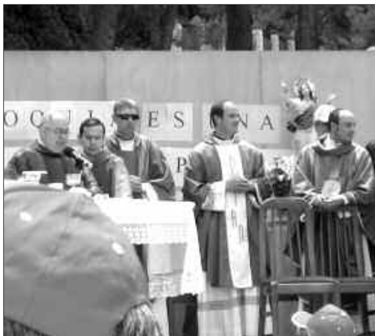
Los curas de Biar y Villena durante la celebración de la eucaristía

La jornada de convivencia consistió en juegos para niños, a mediodía la celebración de la eucaristía y por la tarde el festival con participación de todos. Debido a la gran acogida del acto, los organizadores volverán a convocarlo el año próximo.