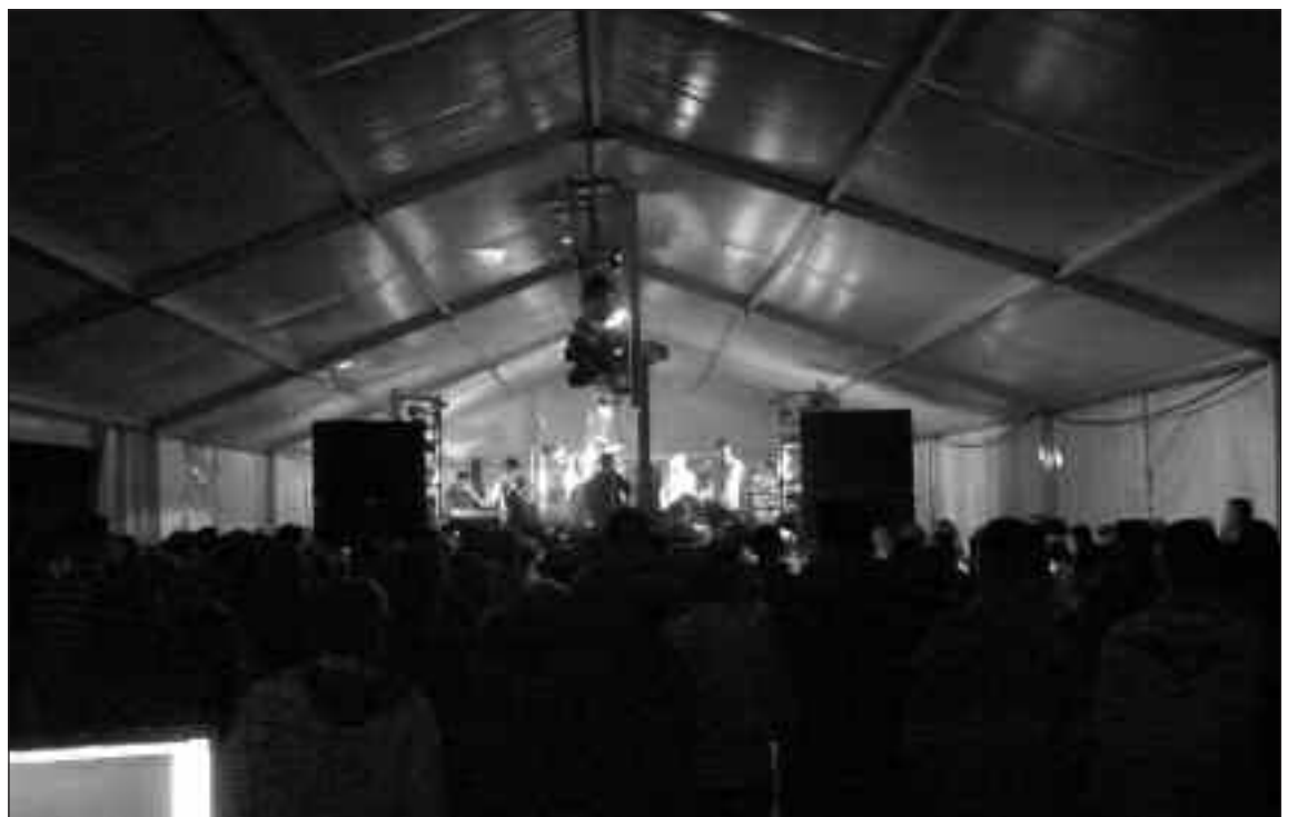
Las actuaciones de los premios se realizaron en la carpa que instaló el Ayuntamiento en el parque Les Hortes