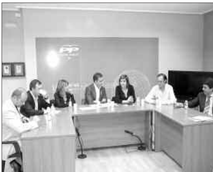
Mesa presidencial con la alcaldesa y el secretario regional en el centro

en el Plan de Obras y Servicios 2009 de Diputación. Mazón también se ha comprometido a reformar ocho calles del barrio de la Dulzura y a finalizar una rotonda en el cruce de la carretera de Tibi con la avenida del Juguete, actuación que será más inmediata.