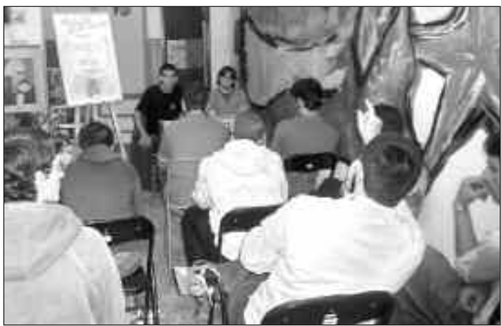
El acto se celebró en la sede del Partido Comunista de Castalla