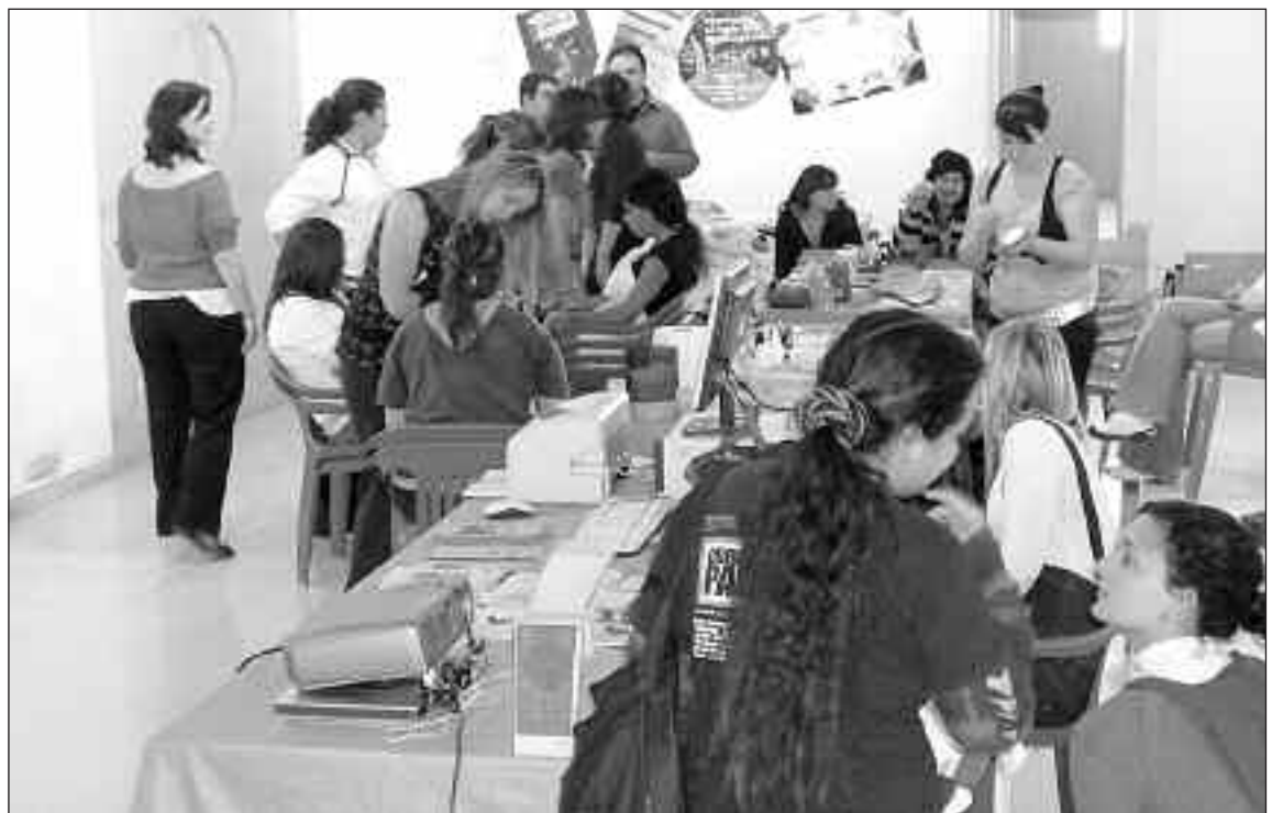
Los jóvenes tuvieron la oportunidad de participar en los talleres que organizaron algunas asociaciones

Ha habido juegos, talleres, exhibiciones, teatro y conferencias sobre el tráfico ilegal de especies y la emancipación juvenil. Nuevamente, la edición ha sido un éxito de asistencia de jóvenes.