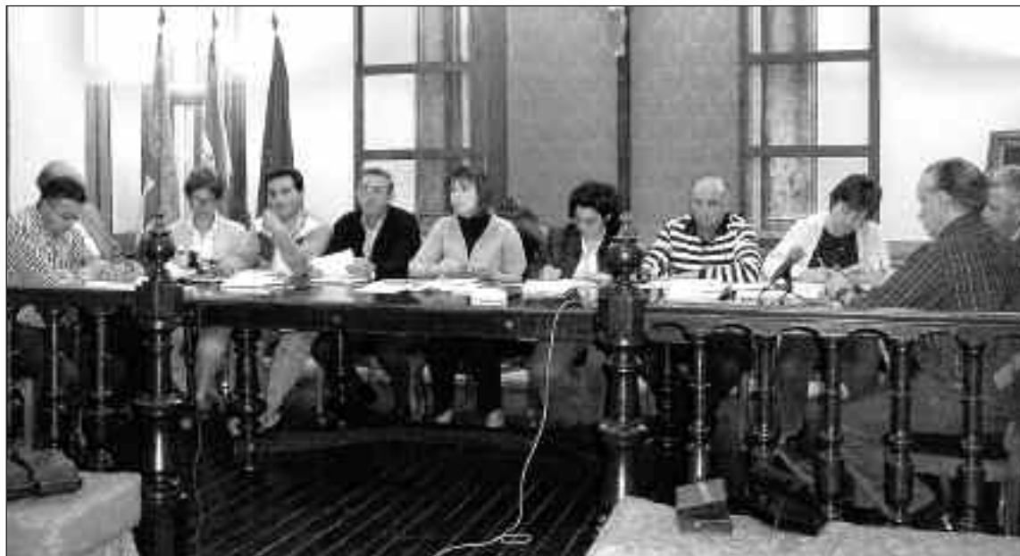
Pleno de presupuestos celebrado el pasado 2 de junio

Los socialistas lamentaron que se no hayan incluido en estas cuentas municipales proyectos como la iluminación del barrio de Santa Lucía y de la zona los Navarros, la instala-