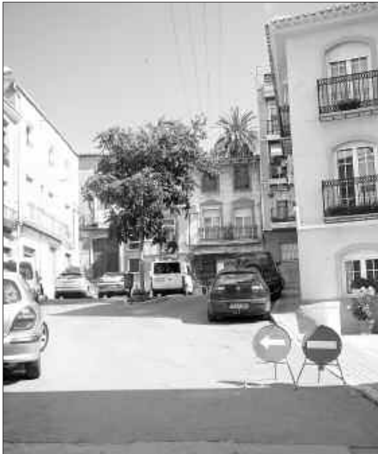
La Plaza de San Vicente, inicio del casco antiguo de Onil

Antes de iniciar este proceso, que tiene un coste cercano a los 300.000 euros, el Ayuntamiento recogerá las quejas y reclamaciones de los ciudadanos para estudiar la posibilidad de incluirlas en esa modi-