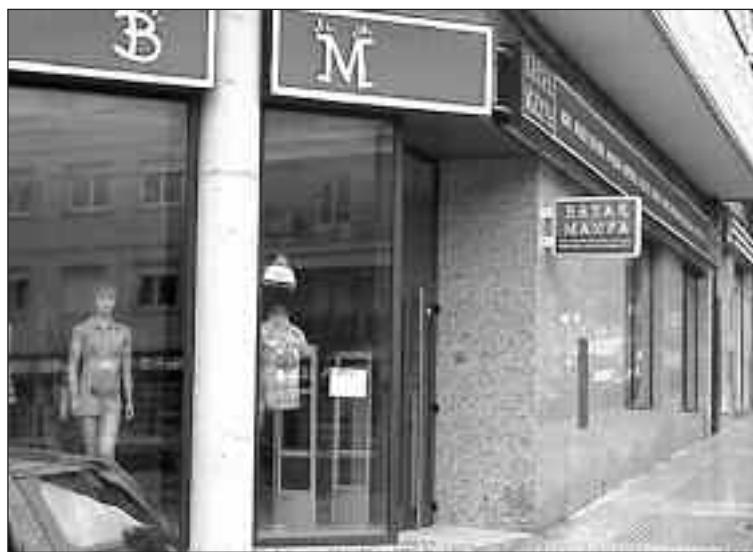
Las fotografías muestran los escalones a la entrada de ambos locales que impiden el acceso con silla de ruedas