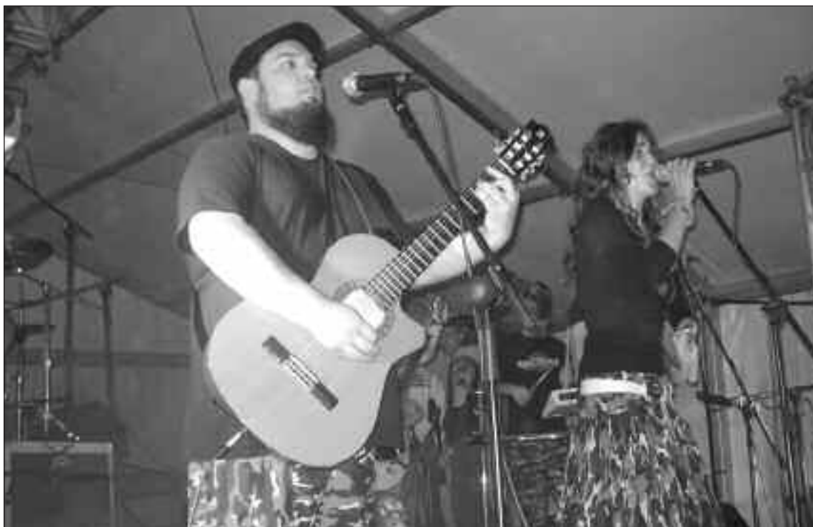
El grupo Sajra Sambja se alzó con el primer premio del concurso de grupos de música