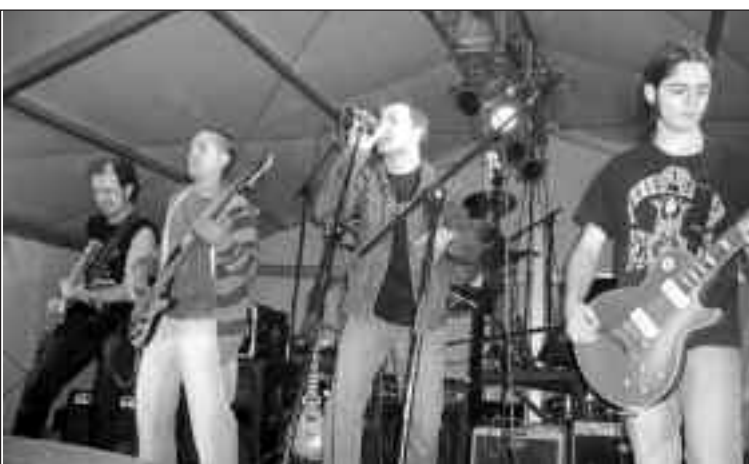
Actuación del grupo ibense Conflicto