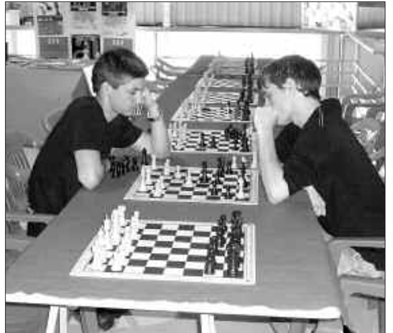
Entre las muchas actividades organizadas, había partidas de ajedrez

iBiJvN'08 se celebró los días 29, 30 y 31 de mayo en el Centro Cultural