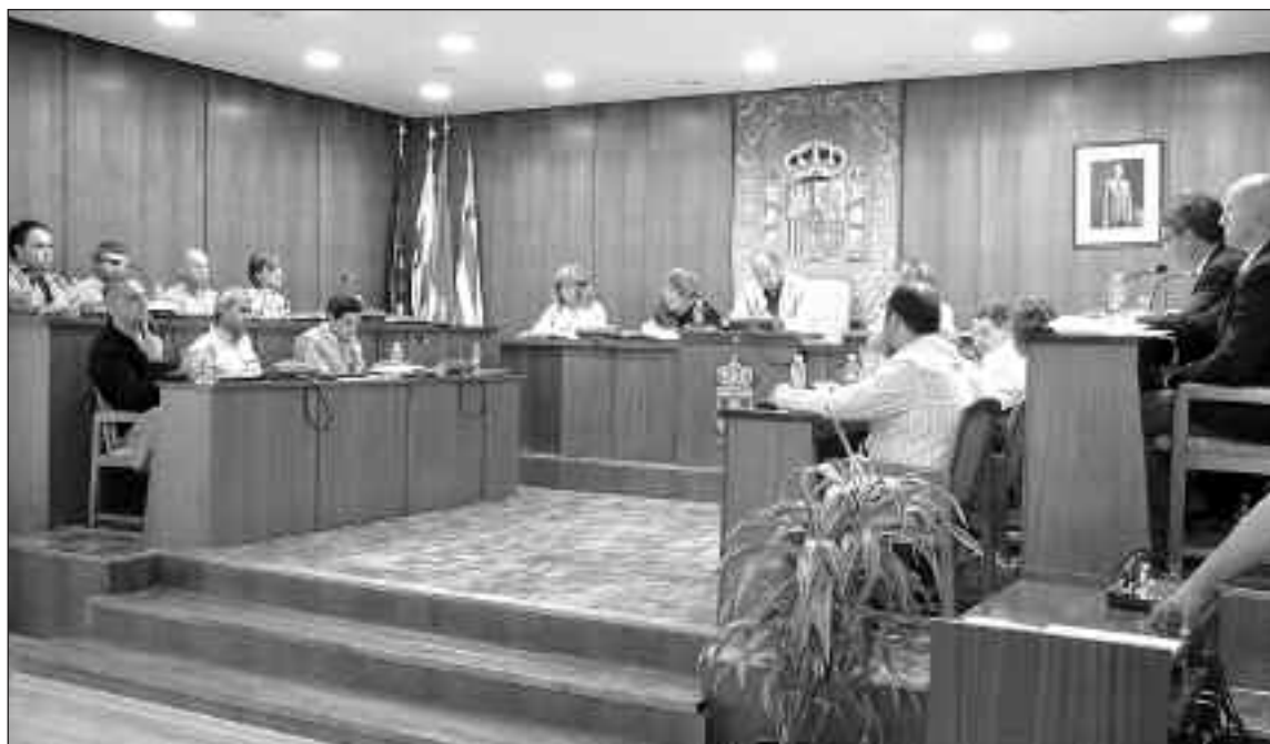
Sesión plenaria del mes de junio, celebrado este lunes en el Ayuntamiento