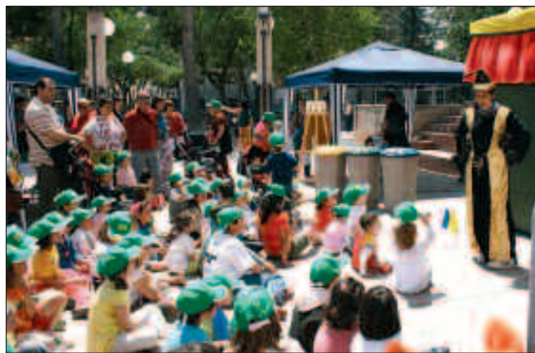
Dos momentos de la actividad celebrada el domingo en el parque municipal