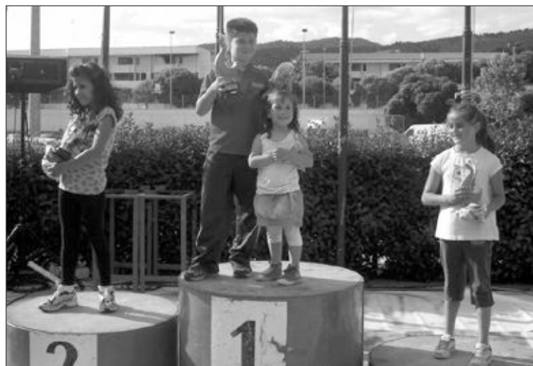
Podio de la categoría C de orientación