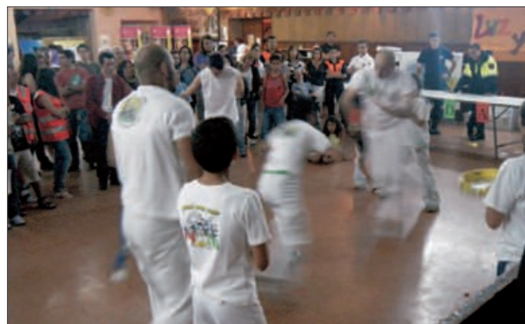
La lluvia obligó a celebrar bajo techo la exhibición de capoeira