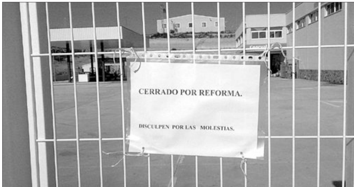
Un cartel a la entrada de la Cooperativa informa sobre el cierre por reforma

Al margen de estas demandas, también se encuentra en litigio otra que afecta a un trabajador que se encuentra en situación de desamparo, ya que no le han comunicado oficialmente su baja laboral o extinción de contrato. De tal forma que dicho trabajador se ha visto obligado a acudir al Juzgado de Lo Social para que se haga efectiva su extinción y, tal y como ha sucedido con los otros operarios, recibir la correspondiente indemnización legal.