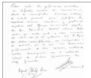
Carta remitida a Escaparaté