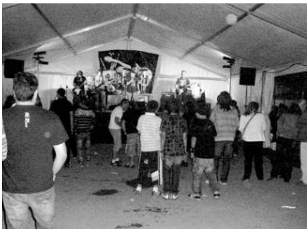
La carpa estuvo ubicada en el parking del IES 'La Foia'