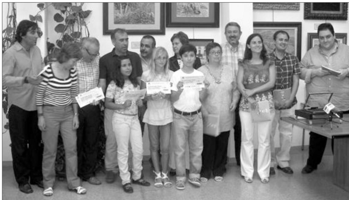
Los premiados posan junto al director del periódico y los representantes de las entidades colaboradoras

El director agradecía la participación de todos los centros escolares y el trabajo desarro-