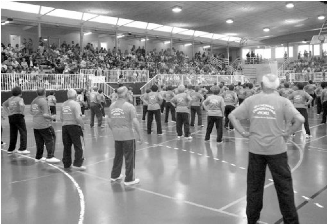
Los alumnos de gimnasia del Hogar del Pensionista abrieron las 24 Horas con una exhibición

El partido que más interés despertó fue la final de fútbol sala, donde Talleres Gárbenase impuso a La Granja por 3 goles a 1.