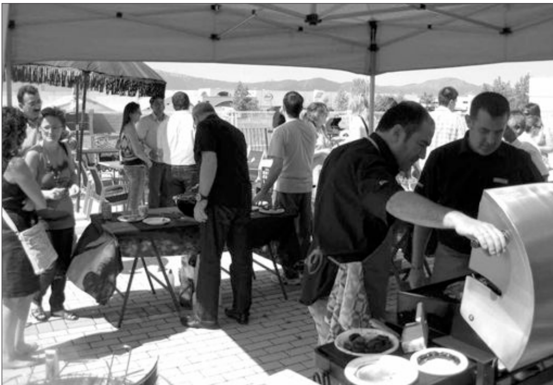
Un buen número de personas disfrutó con la succulenta barbacoa servida en Sola Decoración

La empresa Sola Decoración y las marcas Grandhall y Barbecue ofrecieron a toda la comarca, durante la mañana del sábado 19 de junio, una degustación de carne y embutidos asados en las nuevas barbacoas que ya están a la venta en la calle Salamanca número 3 (polígono industrial L'Alfaç II). Esta Jornada de Barbacoa tuvo una gran aceptación y fueron muchos los visitantes de toda la comarca que se interesaron por las nuevas barbacoas, y sobre todo por los nuevos combustibles. Destacó un carbón vegetal de bambú, pensado para cocinar en el interior de las viviendas, puesto que no emite humo. Sola Decoración desea agradecer la visita de todos sus clientes y amigos, que almorzaron como reyes.