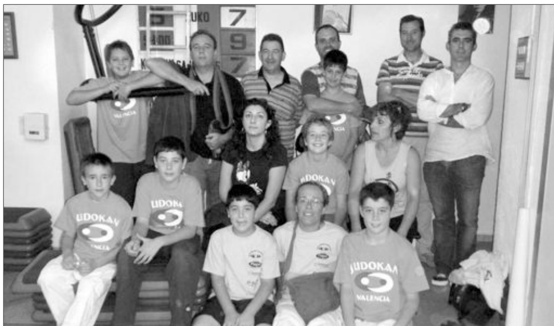
Los alumnos seleccionados por sus buenos resultados en la liga Judokan Valencia acudieron a un entrenamiento en el club organizador

“Con Arcos el Luch-Energiya sumó tres victorias, un empate y una derrota. Ahora el equipo ocupa el noveno puesto de la clasificación”, explicó un portavoz del club de Vladivostok.