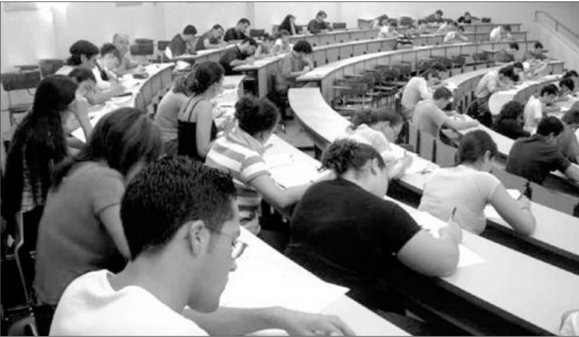
Alumnos durante la prueba de selectividad