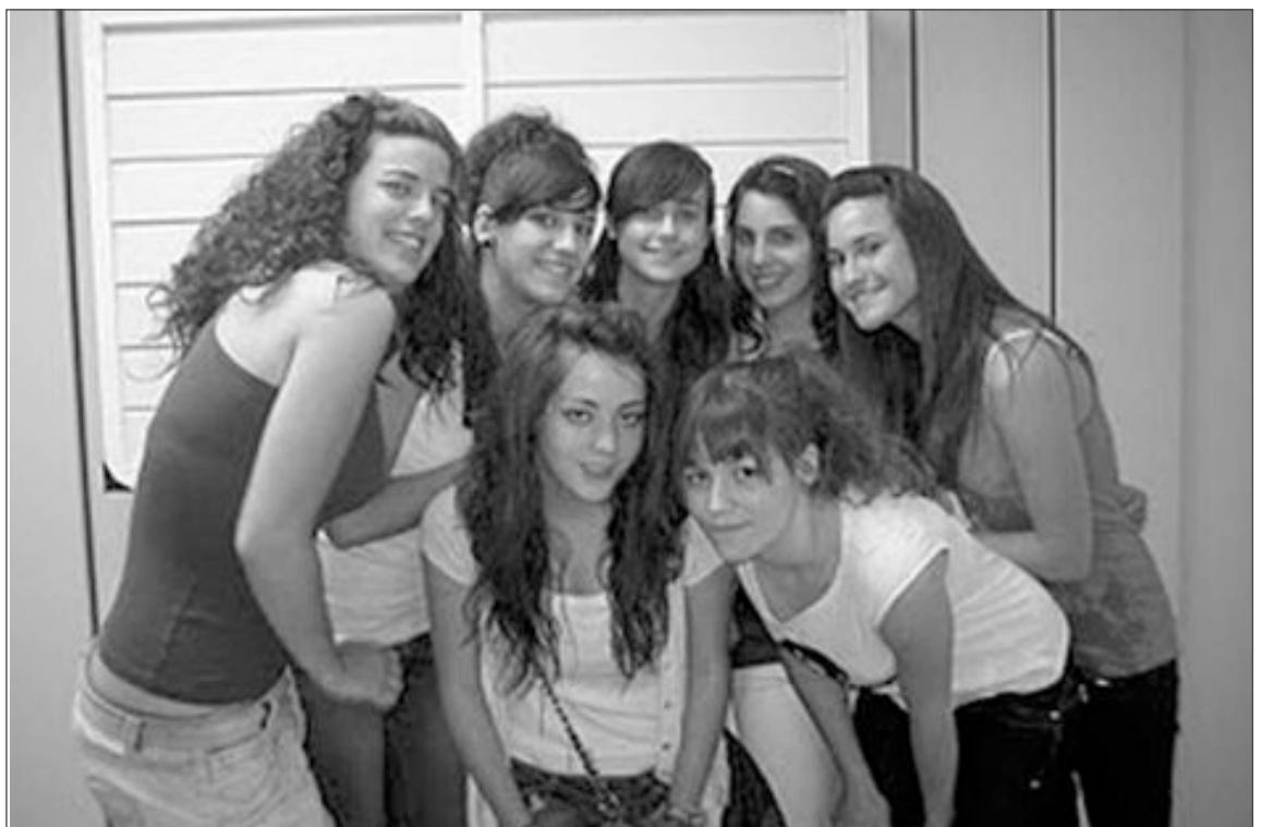
Las siete alumnas acudirán junto a otros alumnos de España y de Europa

Los premiados con dicha beca, lo han sido como consecuencia directa de sus buenas calificaciones.