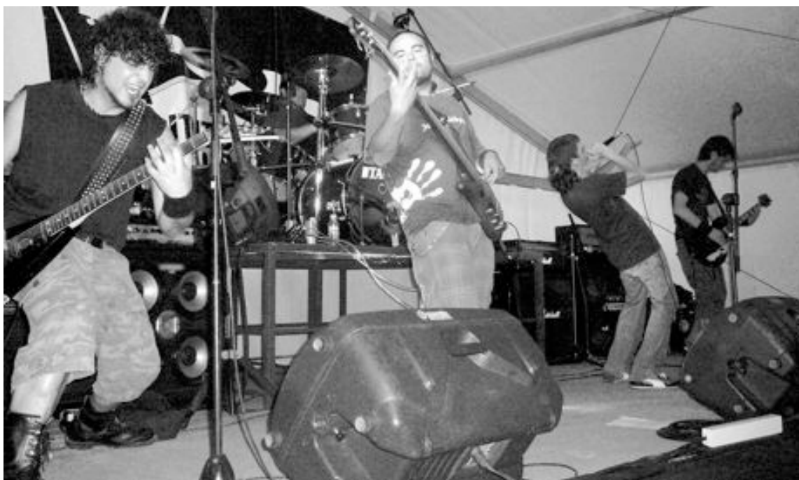
El grupo In Extruyendo fue el segundo en actuar

Además de la barra montada por la Asociación de Hostelería Ibense, en el exterior del recinto se podían comprar bocadillos. Uno de los aspectos más criticados por los asistentes fue el hecho de que la carpa estuviera situada a una cierta distancia del Polideportivo, que había que cubrir a pie y en semipenumbra, mientras que en el Derramador se estaban disputando las 24 Horas Deportivas. Muchos no entendían por qué la pista de atletismo estaba vacía y a oscuras, pudiendo haberse instalado allí la carpa, ya que es en este lugar donde otros años ha habido actuaciones musicales que han dado una nota de color a las 24 Horas.