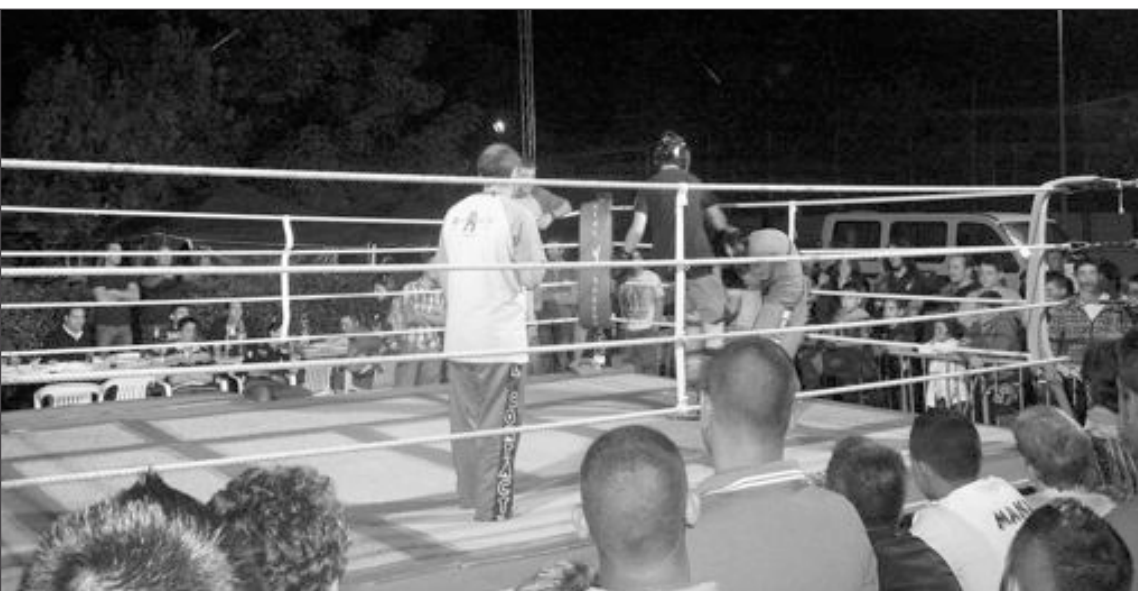
El hall del Polideportivo albergó un ring donde se ofrecieron exhibiciones de kick boxing