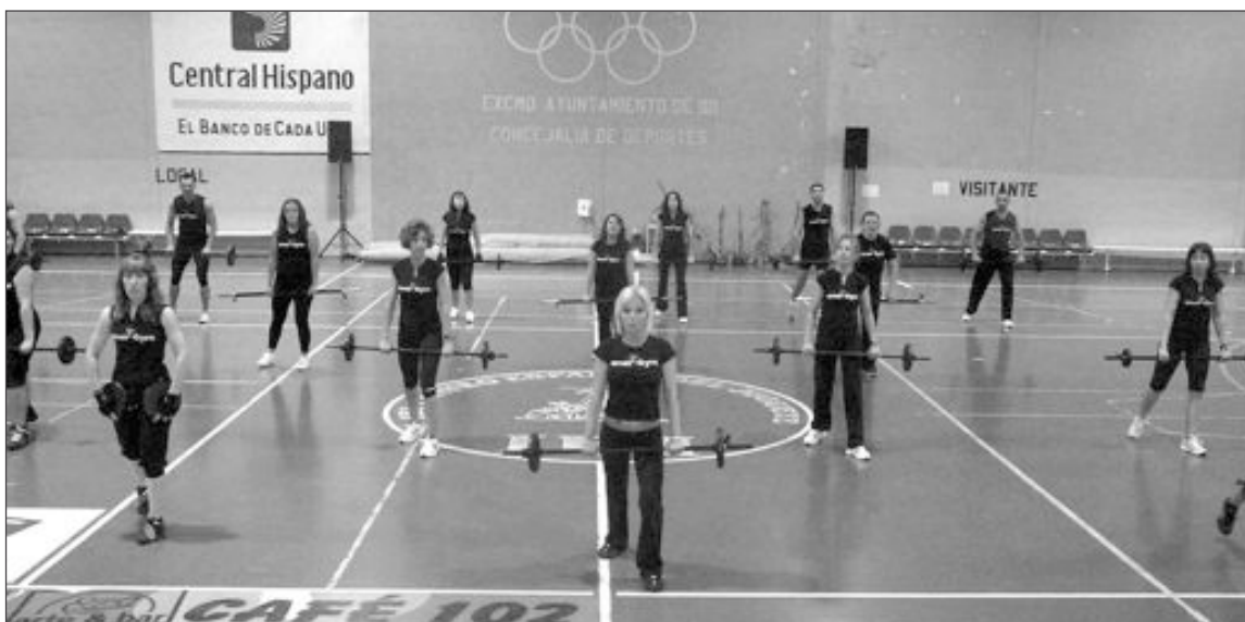
El gimnasio Energyum puso la nota marchosa a la tarde del viernes