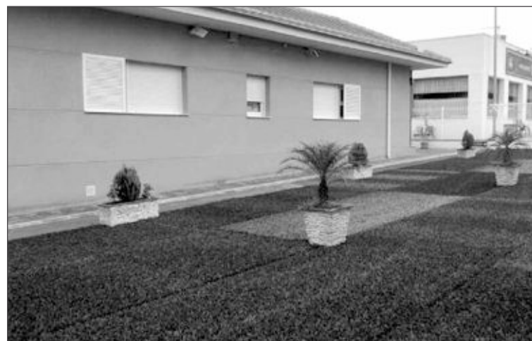
Zona ajardinada de “El Rincón de Amanda”

to, por lo que, después de efectuar mejoras en la infraestructura y medios publicitarios, como la nueva página web, invita a todos aquellos que tengan interés en conocer la nueva alternativa hostelera, a que asistan al evento.