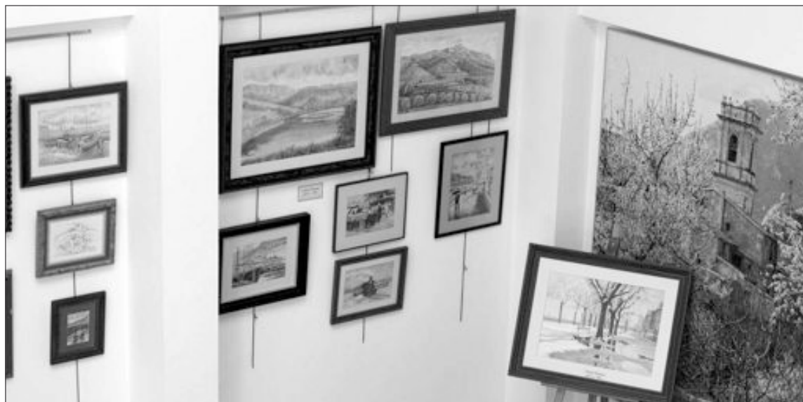
La muestra puede visitarse en la sala de exposiciones del Ayuntamiento

la capital para estudiar en el Circulo de Bellas Artes. Durante su trayectoria se ha codeado codeado con artistas de la talla de Picasso, Chillida y Delibes. Su etapa alicantina comienza al casarse con Mari Lourdes, cuyos padres alicantinos y propietarios de la heladería La Española de San Sebastián, pasaban los inviernos en el municipio tiberio.