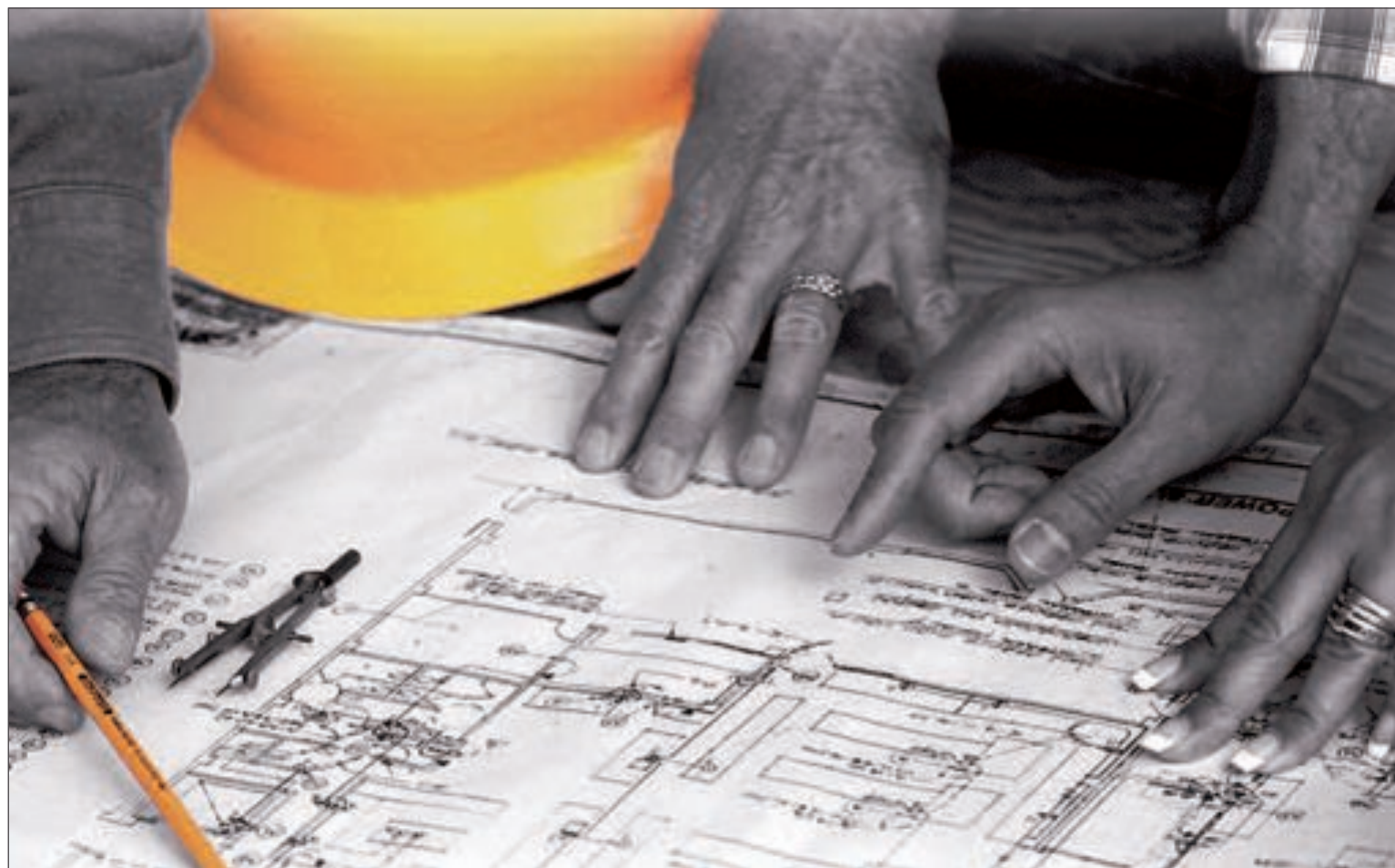
Sola Decoración dispone de un experimentado equipo humano para el total desarrollo y ejecución de cualquier tipo de reformas

El programa también contempla deducciones para mejo-