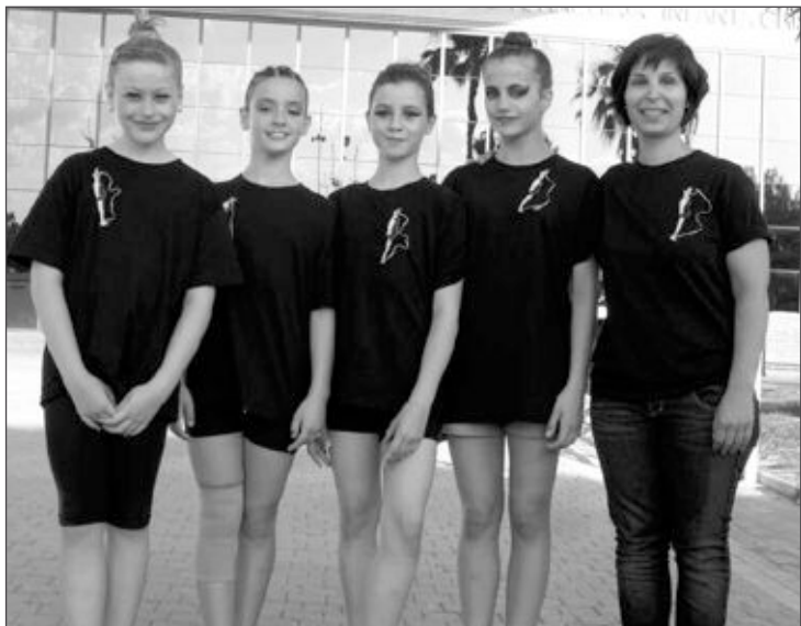
Participantes en el Trofeo Federación en Torrevieja