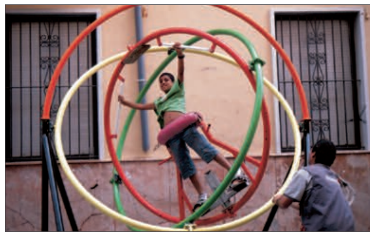
Una de las atracciones más exitosas fue la bola elíptica

Al finalizar los juegos se repartieron algunos premios.