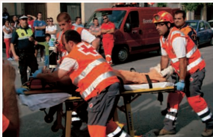
Dos momentos del simulacro de accidente de tráfico con heridos, que levantó una gran expectación el sábado 19 de junio por la tarde