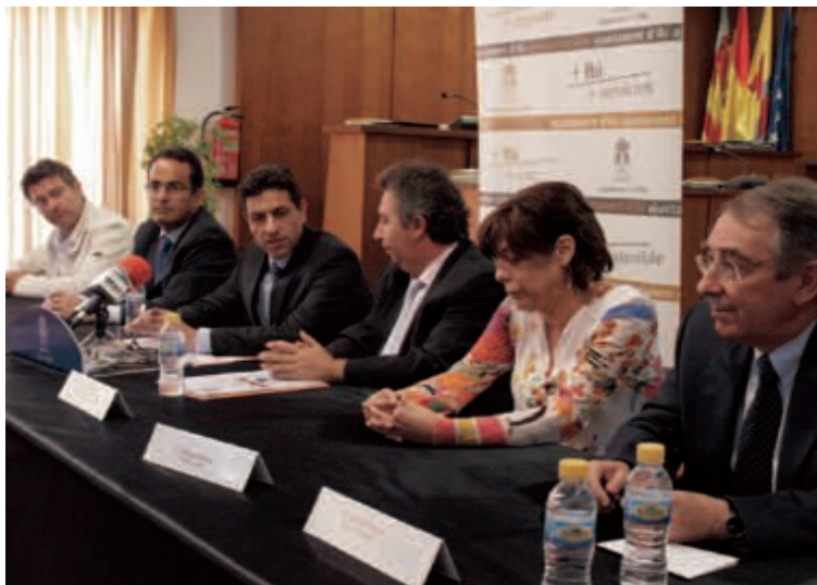
Asistieron el edil y representantes de IBIAE, AEFJ, UHM, AIJU y terciario

Las entidades y asociaciones responsables de la organización del Congreso presentaron el martes 22 de junio las conclusiones del estudio en rueda de prensa.