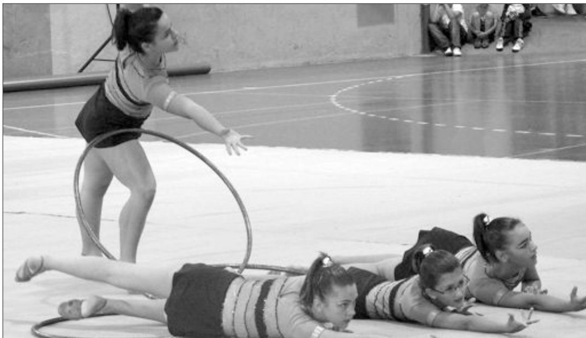
Momento de una exhibición a cargo del Club de Gimnasia Rítmica de Ibi