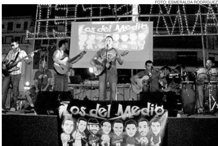
Un momento de la actuación de Los del Medio en La Rambla de Alicante