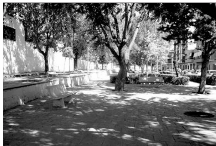
Parque Horta La Vila, uno de los muchos emplazamientos donde trabajarán los miembros del Taller de Empleo

El departamento de Servicios Sociales de Castalla desea agradecer el compromiso de las asociaciones, su asistencia y su implicación en esta actividad formativa.