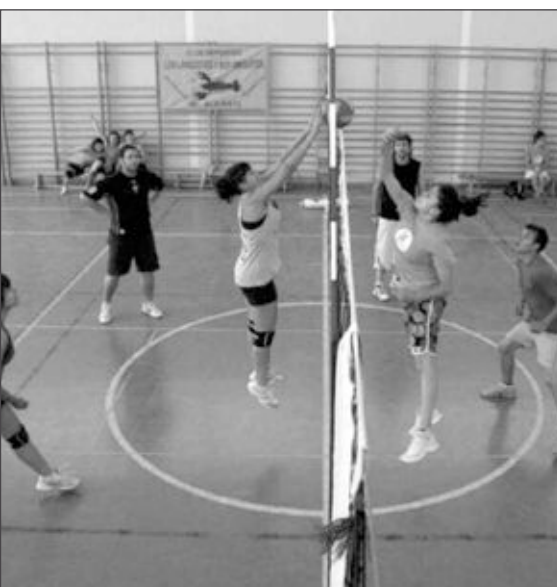
Los partidos de voley se jugaron en el pabellón del IES