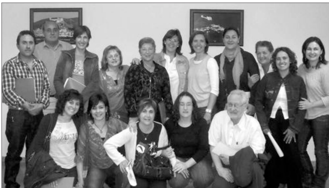
Parte del grupo participante en esta iniciativa del departamento de Servicios Sociales