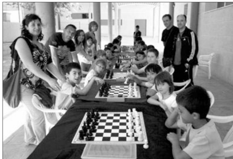
Participantes en las competiciones de ajedrez