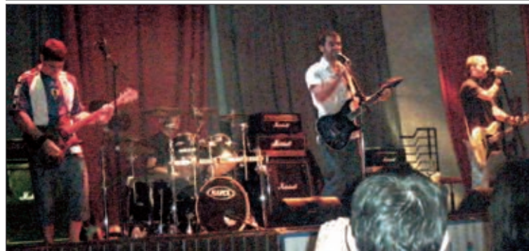
Arriba, Verghuenza Ajena . Enmedio, Kelesden . Abajo, Inevitables Rock