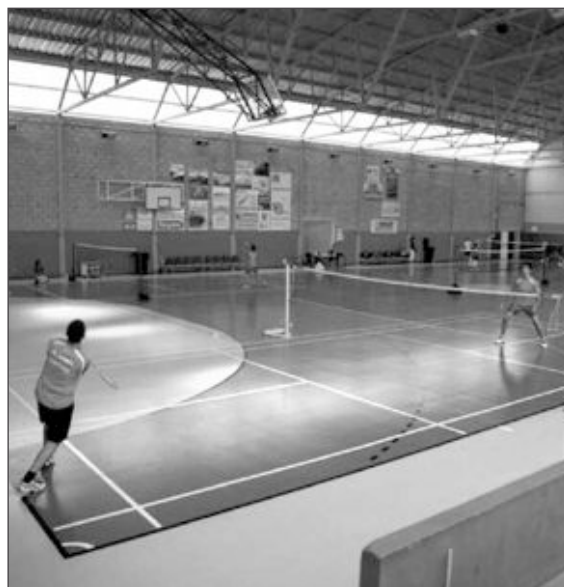
Momento de un partido de bádminton