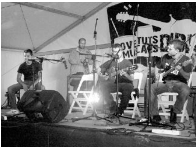
Uno de los grupos ibenses fue Fadrins Storm