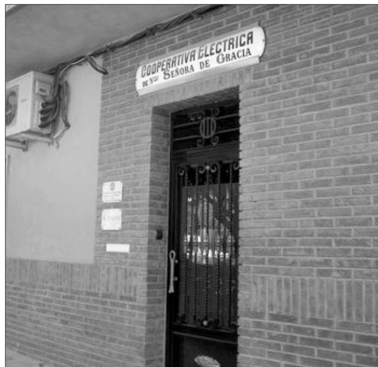
Oficinas de la Cooperativa Eléctrica

La Cooperativa debe convocar de nuevo la asamblea en julio y estudia otra ubicación con mayor aforo.