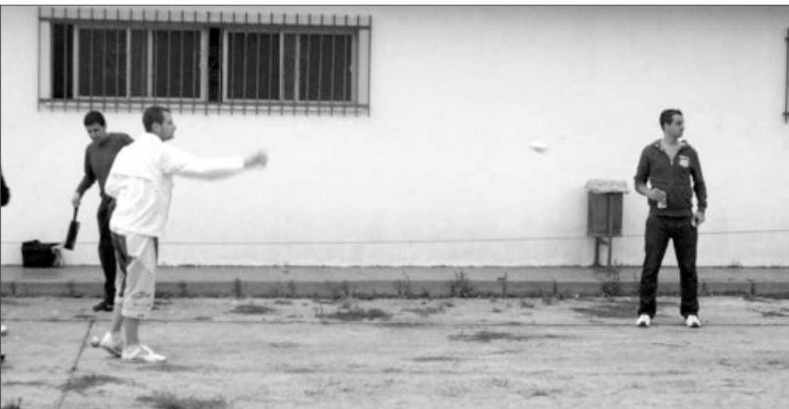
A pesar del terreno ligeramente embarrado, los aficionados a la petanca pudieron jugar con normalidad