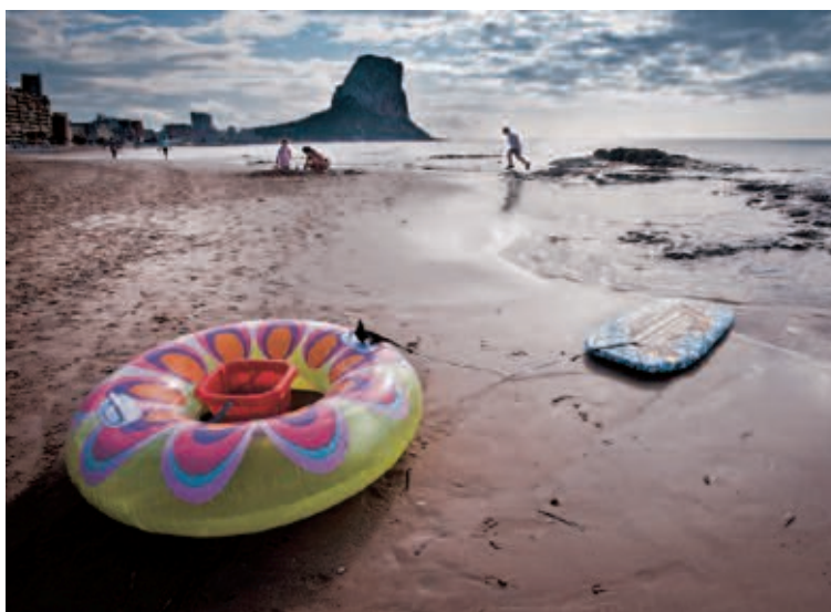
Cuarta imagen de la serie ganadora, titulada 'Naturalmente Calpe'

Las fotografías ganadoras será utilizadas para la promoción turística de Calpe.