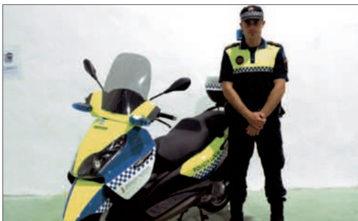
Agente de la Policía Local de Onil que se encargará de la nueva unidad motorizada de Tráfico, Seguridad y Educación Vial