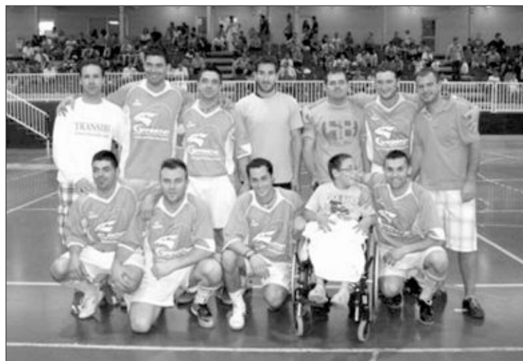
Talleres Gárbena se impuso en fútbol sala