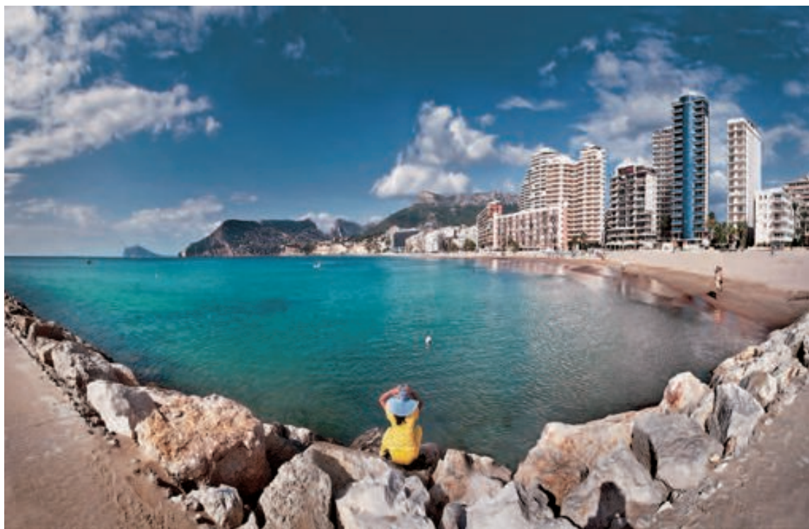
La serie fotográfica consta de cuatro imágenes (ésta es la tercera)