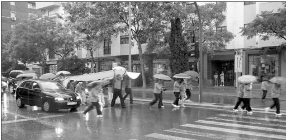
Miembros del Hogar del Pensionista bajaron la antorcha bajo una intensa lluvia