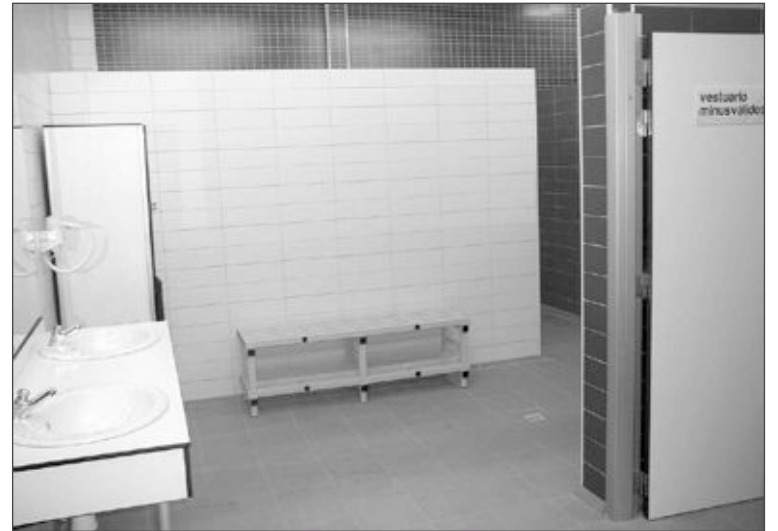
Uno de los nuevos vestuarios del Polideportivo Derramador