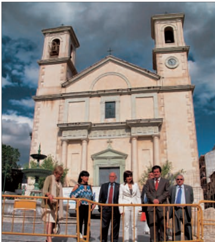
Los diputados durante su visita a las obras de la calle Les Eres