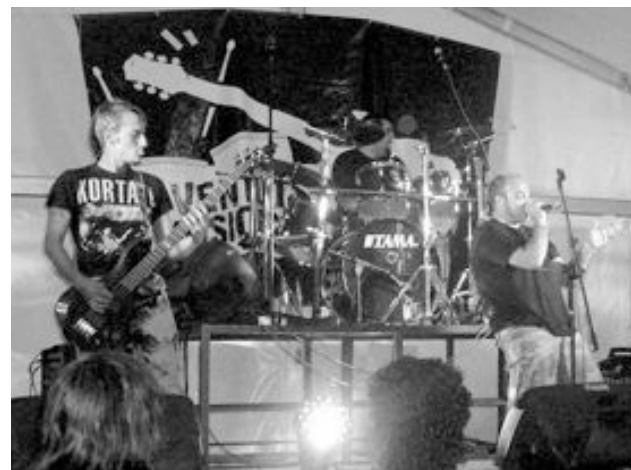
Actuaron grupos de Ibi, Banyeres, Ayora y Almansa