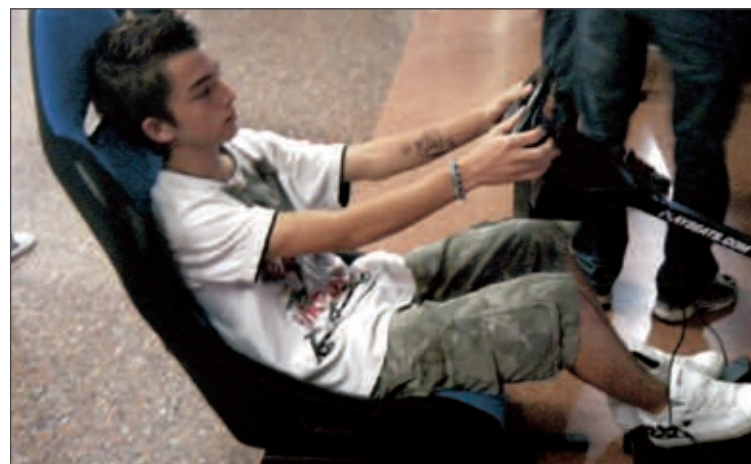
Los chavales disfrutaron con las videoconsolas