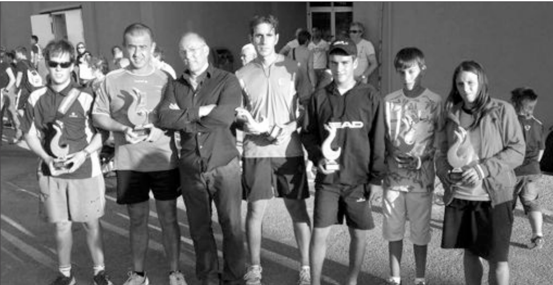
Un total de 28 participantes se dieron cita en las competiciones de tenis