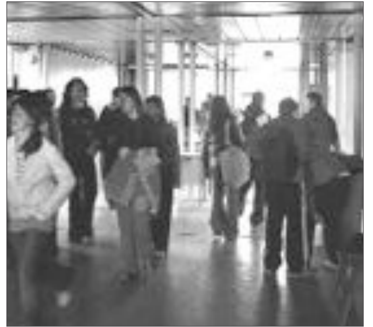
En los institutos La Foia y Nou Derramador la iniciativa se puso en marcha en cursos pasados

Posiblemente este año, los estudiantes tendrán más fácil acceder a las carreras universitarias elegidas, donde, en muchas de ellas, se exige una elevada puntuación para entrar. Medicina, Biología, ingenierías, Psicología y Empresariales siguen siendo todavía de las más demandadas.