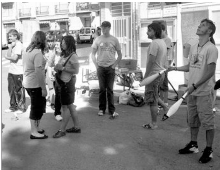
La actividad se desarrolló en el Mercado, entre otras localizaciones

Para hacer llegar a la ciudadanía el mensaje que se quiere transmitir, el Ayuntamiento ha editado 5.000 trípticos infor-