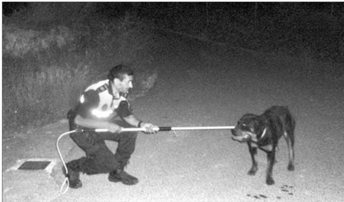
La Policía Local trabaja desde hace ocho años en la elaboración de un censo canino municipal

A partir de ahora, los dueños de perros de estas razas, o bien cruzados con algunas de ellas, tendrá que solicitar la licencia de tenencia de animales potencialmente peligrosos en las dependencias municipa-