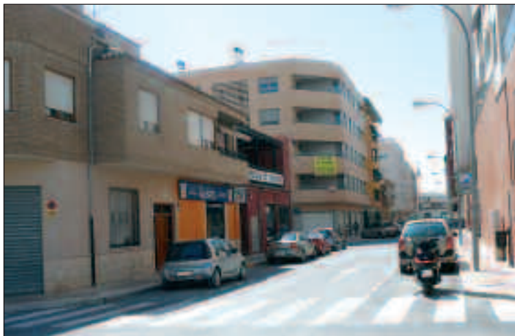
La calle Blasco Ibáñez es un hervidero de jóvenes los fines de semana

Los problemas, sin embargo, no están en el pub en cuestión, que está bien insonorizado y cierra a la hora estipulada en su licencia (las 7:30 de la mañana), sino en la propia calle, donde, según denuncia el PSOE, los jóvenes hacen botellón, consumen drogas y escu-