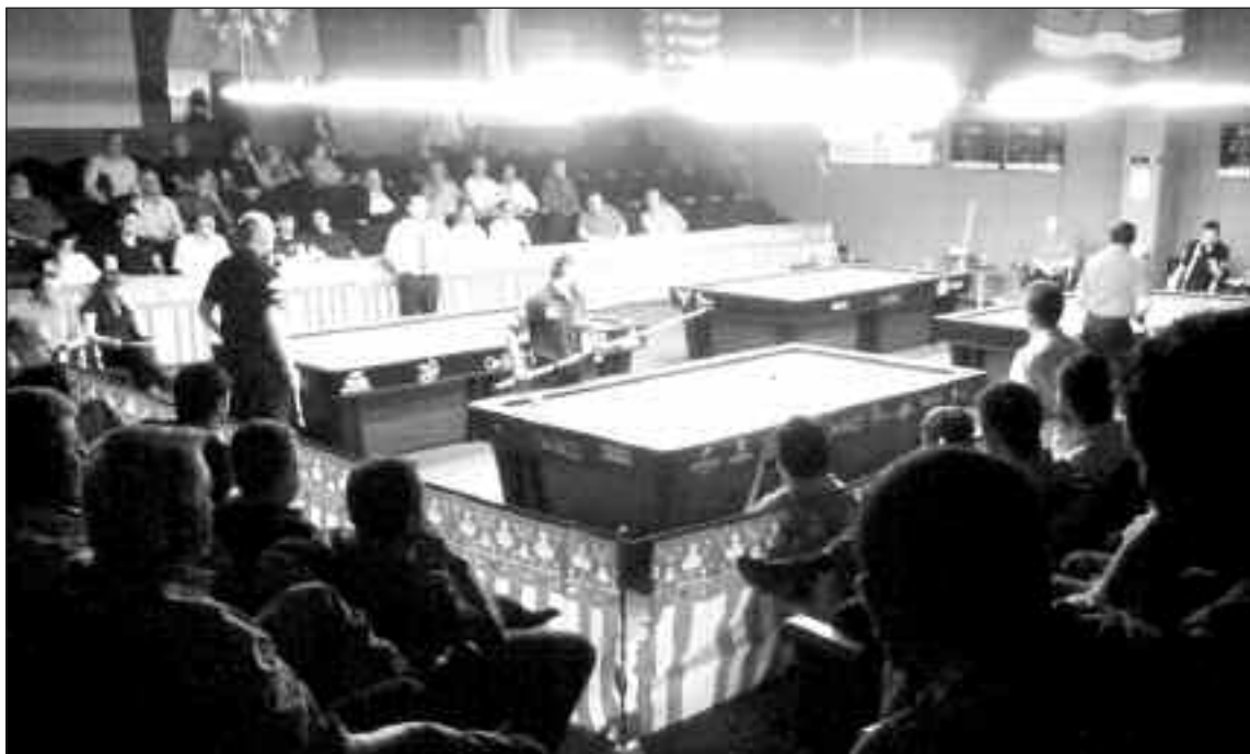
Instalaciones del Club de Billar Caseta Nova, cuyo salón tendrá que ampliarse para albergar entre 6 y 8 mesas