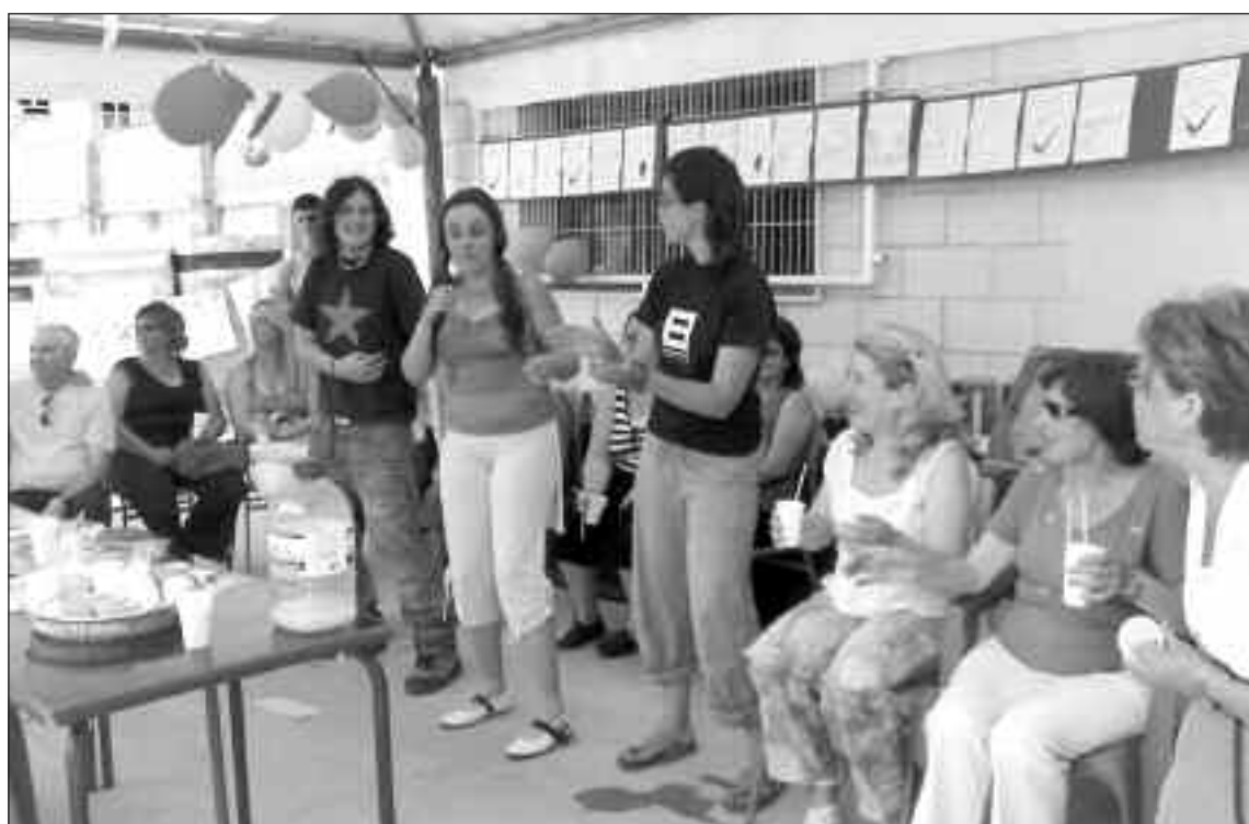
Algunos de los asistentes a la fiesta, en plena celebración

Fuentes de Babilón explicaron a Escaparate que los usuarios se lo pasaron en grande en esta fiesta de fin de curso. Las actividades de la Asociación acabaron este jueves, día 31, y se retomarán después de las fiestas patronales de Ibi.