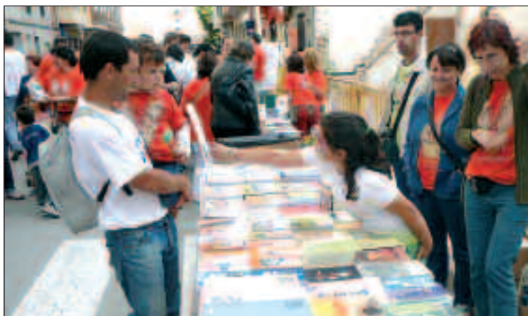
La Trobada reunió en Castalla a miles de personas el sábado 7 de junio