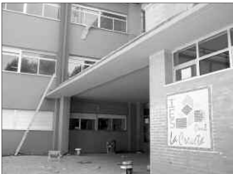
Los colores elegidos para pintar el centro son los del logo del IES