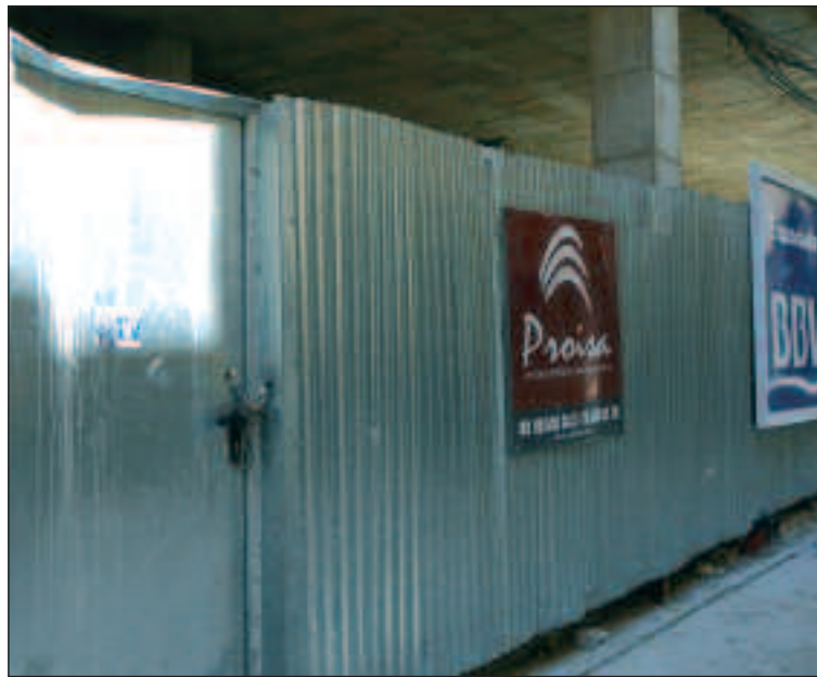
Las obras en el edificio de la calle San Roque se han parado

Reconoció que el sector está atravesando una importante crisis y que se han visto obligados a cerrar la oficina que tenían en Ibi "para reducir costes". A partir de ahora, los