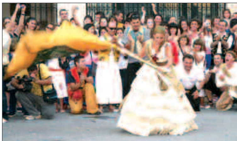
Arriba, una comparsa de Maseres. Abajo, Ballà de Banderes