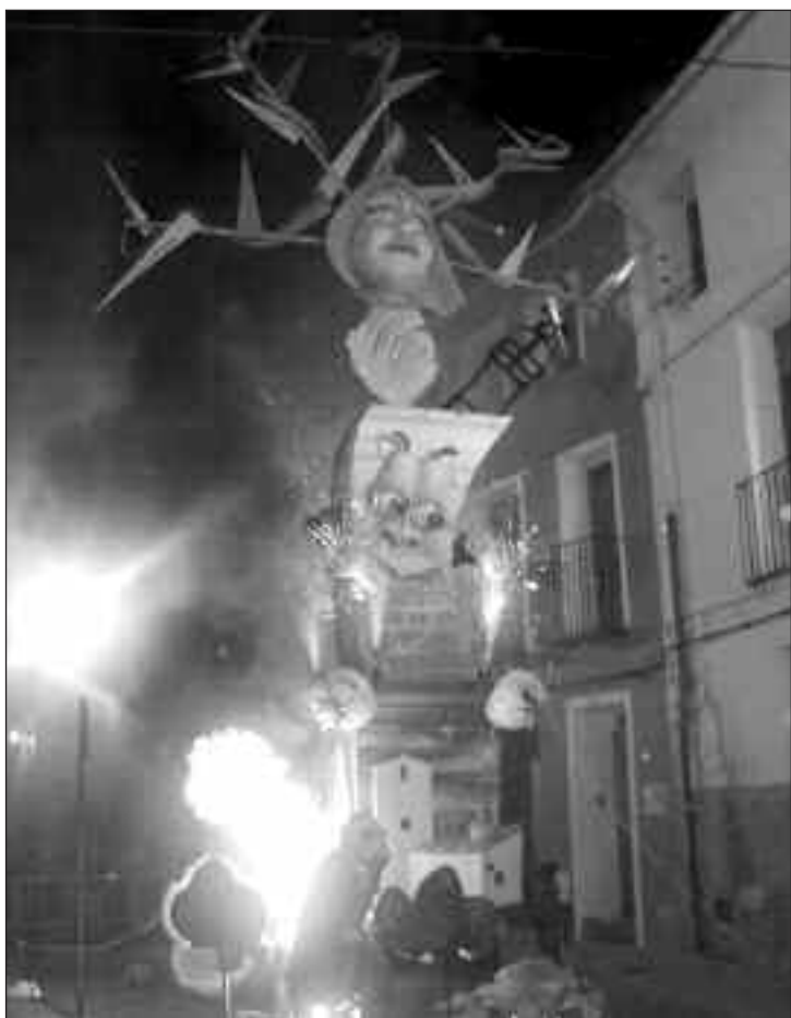
Inicio de la cremà de la falla de San Jaume