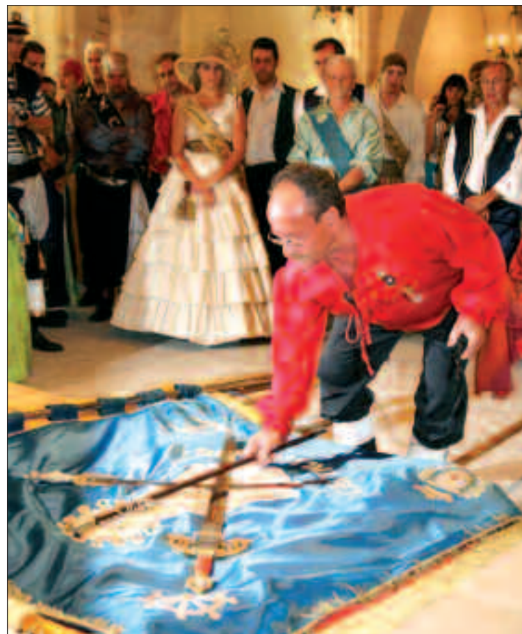
Los festeros ofrecen sus armas y enseñas a la Virgen para que las bendiga