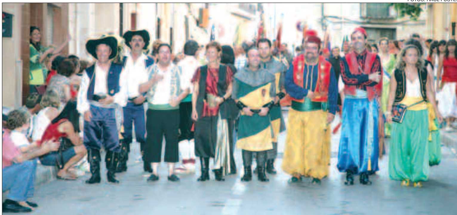
Representantes de las siete comparsas castallenses durante el desfile de Sant Jaume

piscis No salgas de casa esta semana. ¡Que no salgas de casa, hombre! Nada, ni caso. Ya se ha ido, el tío capullo.