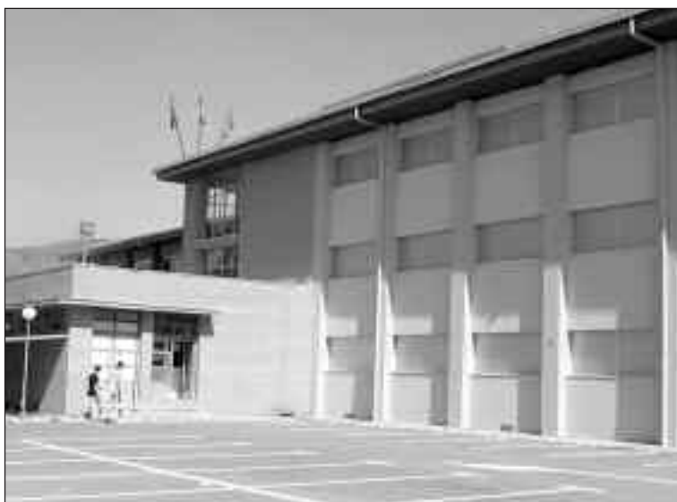
Se han cambiado todas las persianas que fueran arrancadas por el tornado