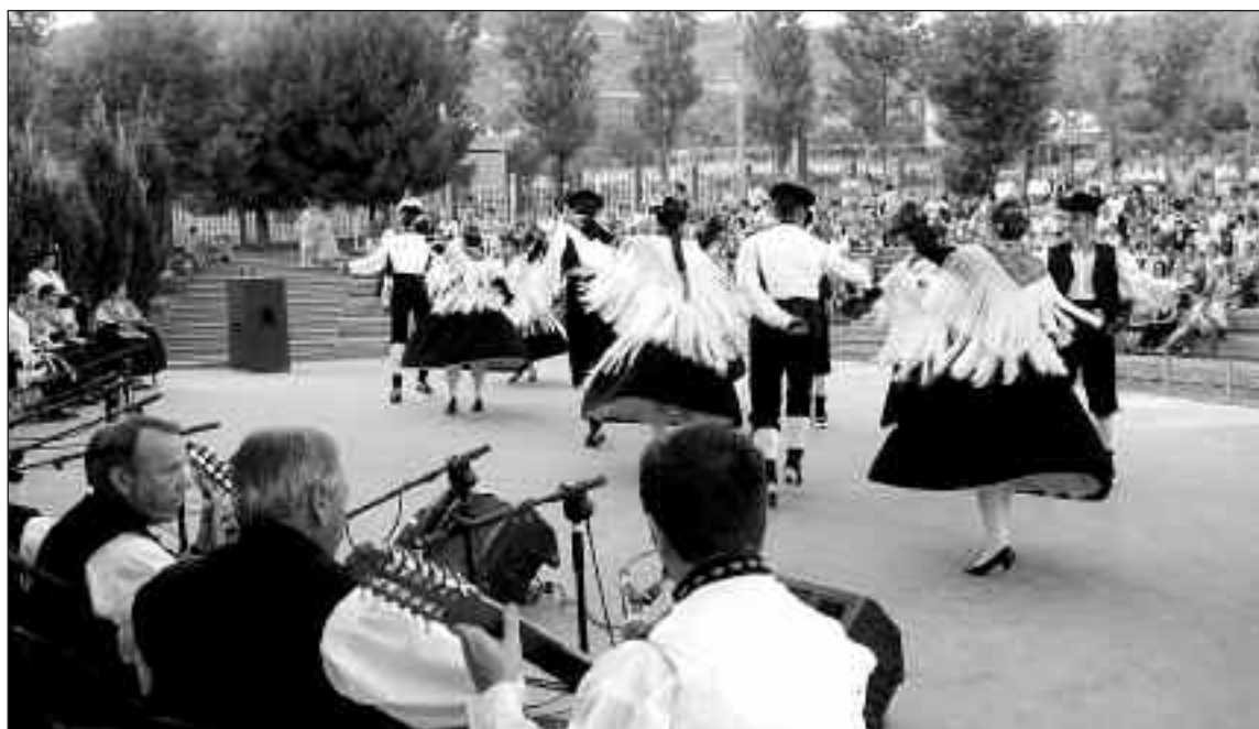
Un momento de la actuación del Grup de Danses d'Ibi