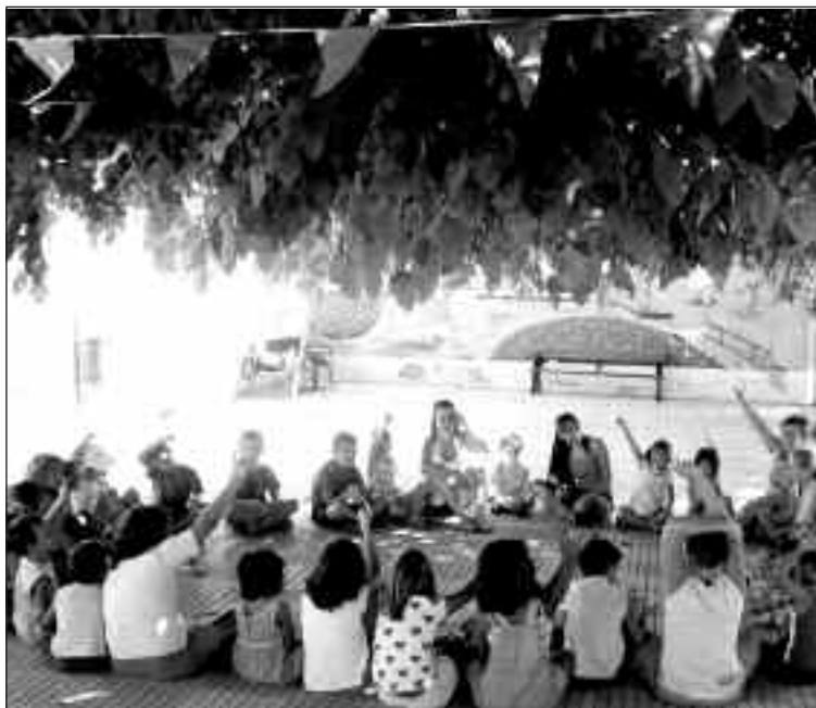
Cerca de treinta niños se han inscrito este año en estas actividades