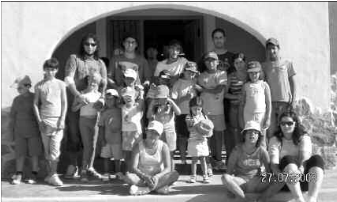
Los niños han disfrutado de un fin de semana de convivencia en la que han realizado multitud de actividades

Este año, como principal novedad, se ha realizado una excursión de fin de semana a la Granja Escuela Altalluna de Onil, donde los niños han pasado unos días de convivencia, realizando también actividades como montar a caballo, escalada, circuito multiaventura, piscina y la visita a los corrales donde hay ovejas, gallinas, patos y conejos.