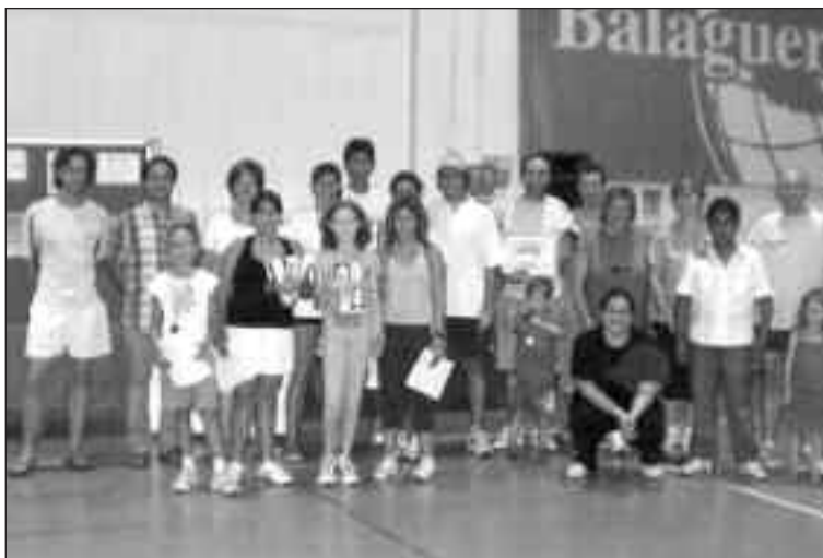
Participantes en la pasada edición de las 12 Horas de Bádminton