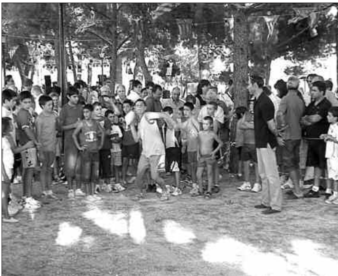
Los niños son los protagonistas en los juegos de saltos de longitud, carreras y lanzamiento de piedras