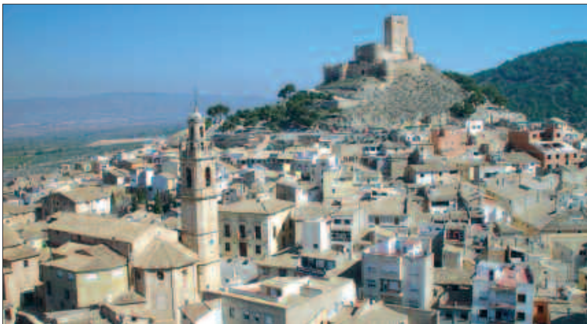
Algunas calles del centro histórico de la localidad

La otra modificación introducida en el Plan Especial de Protección hace referencia al pavi-