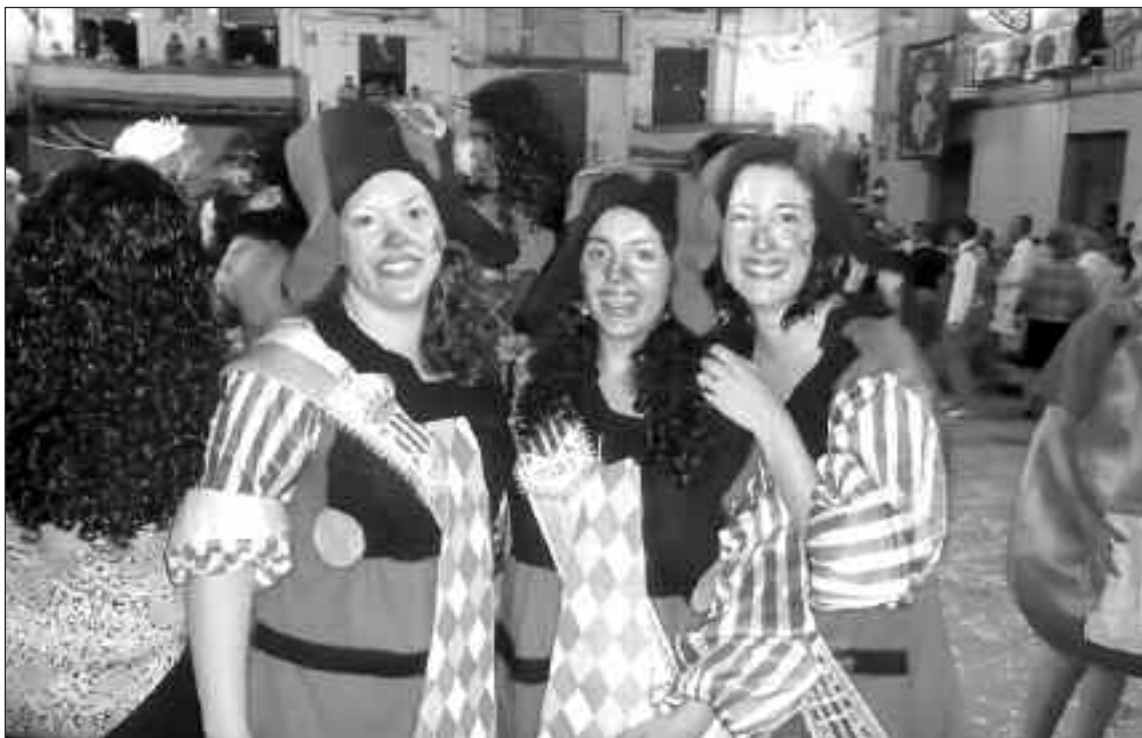
Reina y damas en el desfile de disfraces

La localidad tibera finalizaba el viernes 25 de julio sus fiestas patronales, que han registrado este año un gran número de visitantes. Precisamente, el viernes se superaban todas las expectativas de público en los actos organizados. Entre ellos, el colorido desfile de disfraces con la participación de todas las peñas y la gran mascletá nocturna. El programa concluía con una nueva suelta de vacas y la verbena popular, a las tres de la madrugada.