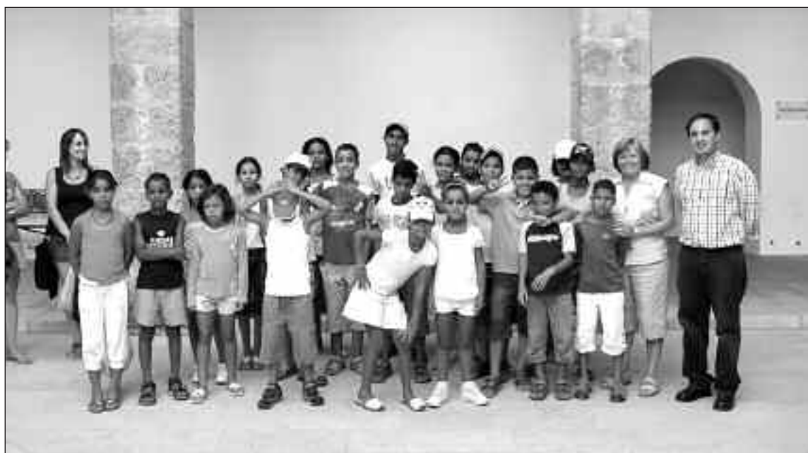
Grupo de niños saharauis, durante su visita al Ayuntamiento de Onil