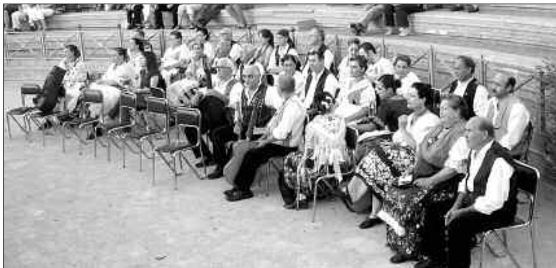
El grupo Raíces Huertanas de la Peña El Pimiento, de Nonduermas (Murcia), esperando su turno para actuar