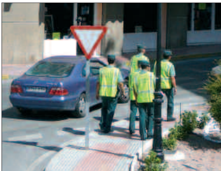
Desde el 28 de julio se han incrementado las patrullas diarias por las calles