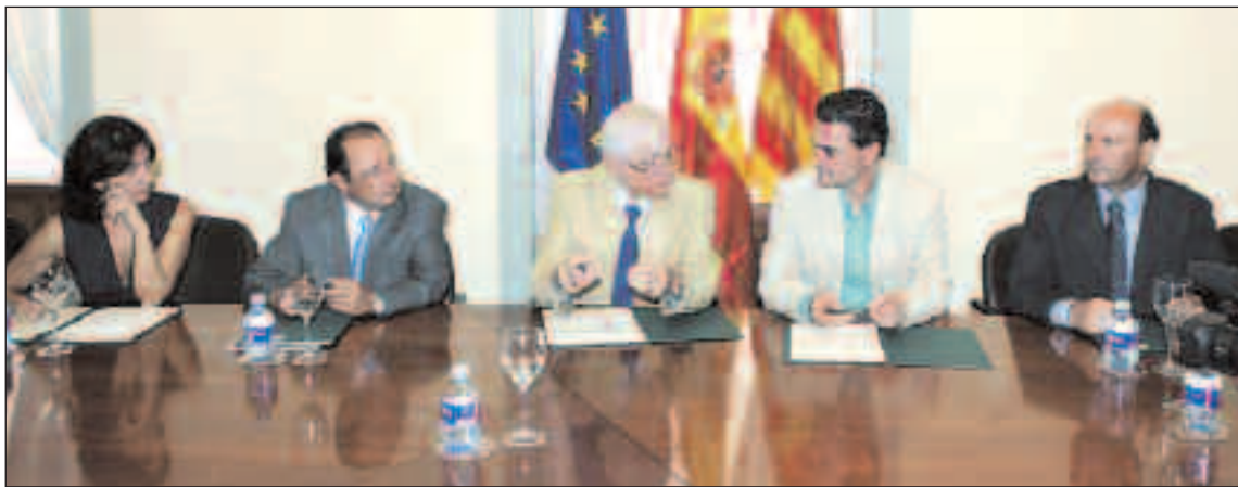
Varios alcaldes, entre ellos el de Castalla, flanquean al conseller de Vivienda, José Ramón García Antón

La portavoz socialista, Maite Gimeno, no pudo explicar, durante el Pleno de julio, la moción del PSOE que solicitaba la regulación de las actuaciones musicales en bares y pubs de la localidad, a raíz del caso 'Pellikana'. El PP desestimó la urgencia de la moción.