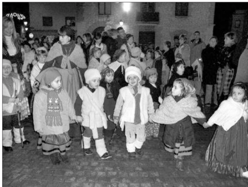
En la Cabalgata participan numerosos niños vestidos de pastores