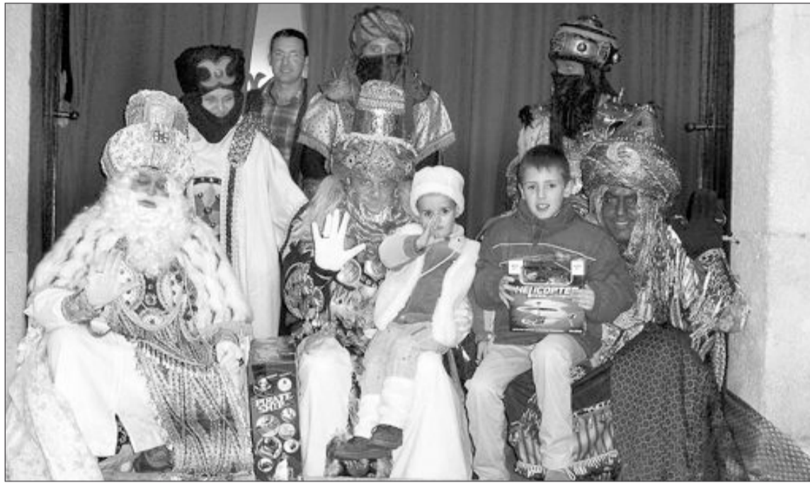
Los Reyes Magos finalizan la Cabalgata en el Ayuntamiento, donde reparten los juguetes a los niños

Más de 500 regalos repartieron Sus Majestades a los niños biarenses.