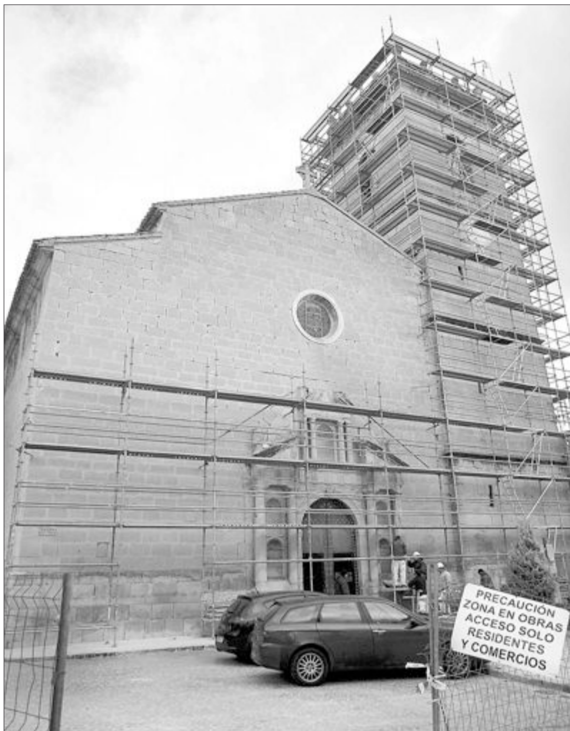
La fachada y la torre del campanario se encuentran recubiertas por andamios para proceder a su restauración