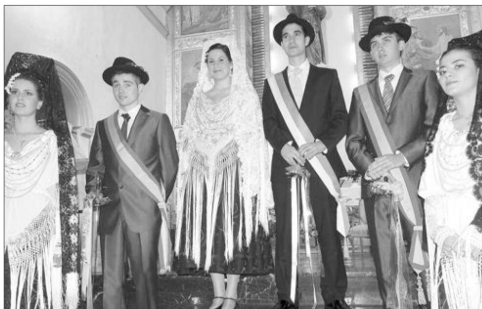
Las tres parejas de jóvenes componentes del Reinado Cristiano de este año