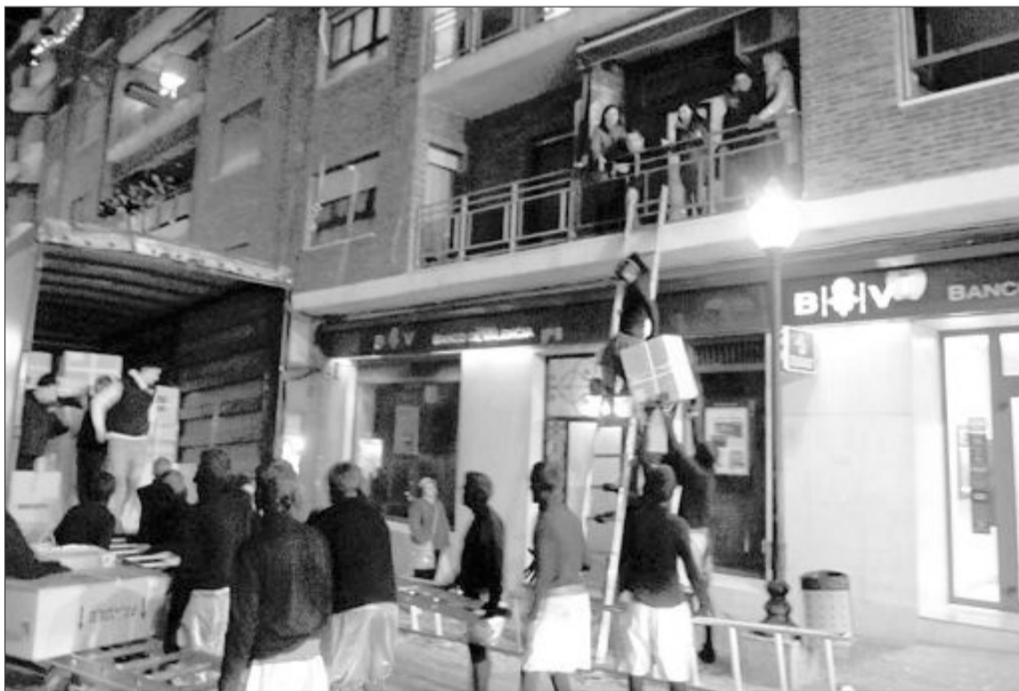
Tras el paso de los Reyes Magos, los paqueteros inician el reparto de los regalos por las casas

Cruz Roja también agradece a los voluntarios sí participaron en esta actividad.