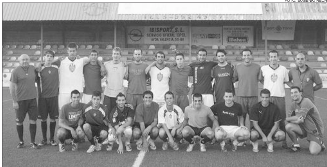
Miembros del Rayo Ibense durante la pretemporada 2010-2011 (archivo)