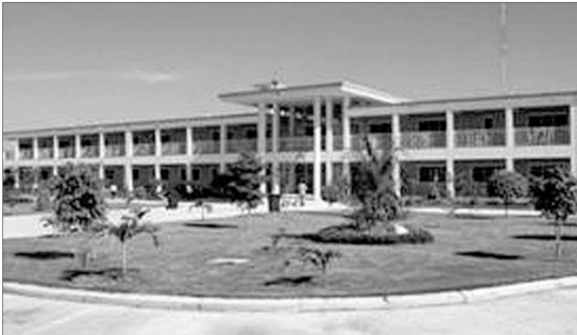
Hospital en Haití de la Fundación Internacional Nuestro Pequeños Hermanos donde se enviarán los juguetes

La Fundación Internacional Nuestros Pequeños Hermanos, con sede en Barcelona, será la encargada, cuando llegue el momento, de enviar los juguetes donados desde Ibi.