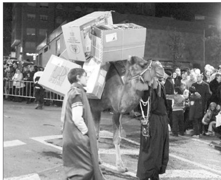
Un paje con un camello cargado de regalos fue el nuevo personaje de la Cabalgata de este año

Una de las novedades más destacadas, introducida por la nueva Asociación, se produjo en la entrega de cartas. Se amplió el número de pajes, seis en total, y se colocaron a los pies del monumento de los Reyes Magos, consiguiendo que el acto ganara en rapidez y vistosidad. El presidente explicaba el elevado grado de aceptación que tuvieron entre la gente esos cambios y anunciaba que el objetivo es seguir mejorando la fiesta. Vicente Martín felicita a todos los socios, entidades, empresas y asociaciones por su colaboración.