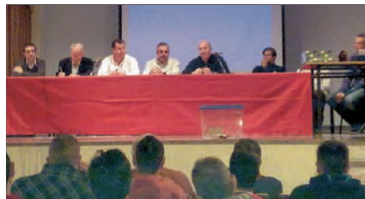
La asamblea se celebró en el Teatro de Tibi el pasado 17 de diciembre

Aun así, gracias a las aportaciones de quienes sí decidieron desafiar al frío y las donaciones de los transeúntes que se solidarizaron con esta causa, finalmente se pudieron recaudar 152 euros, que fueron recibidos de buen grado por parte de la presidenta de AFA, quien agradeció el gesto "como si se tratara de millones de euros".