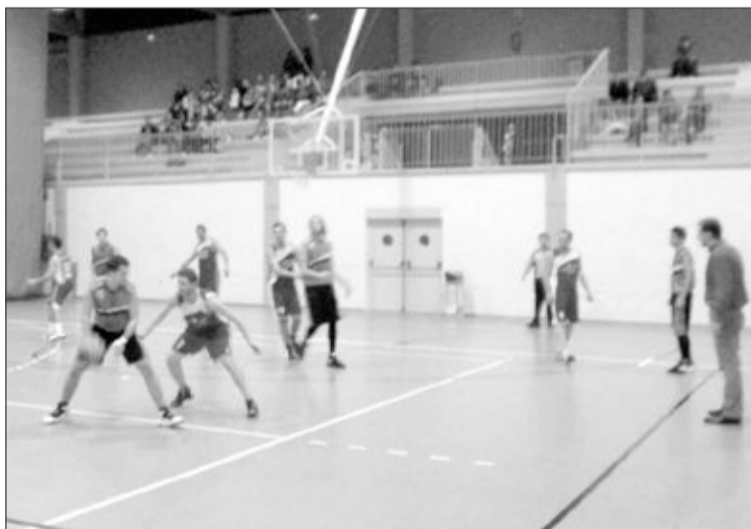
Momento del partido disputado la pasada jornada en Elche

El partido comenzó muy igualado, un primer cuarto