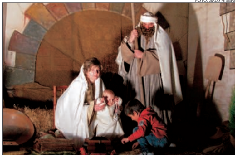
La Virgen María, San José y el Niño Jesús