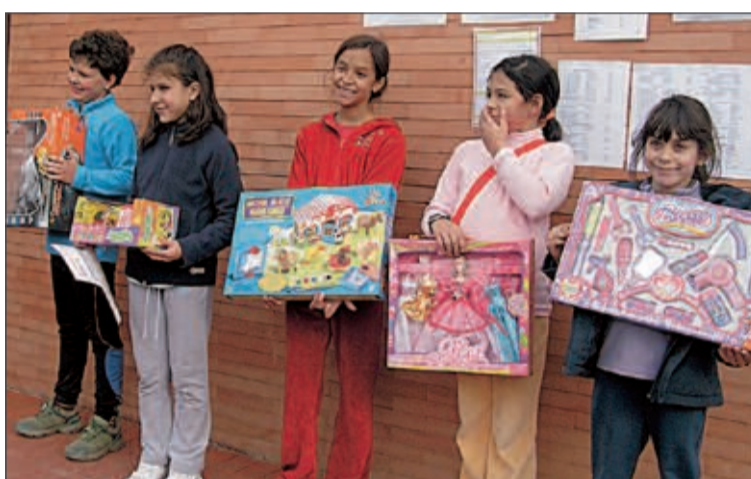
Arriba, llegada a la meta de unos participantes. Abajo, entrega de premios