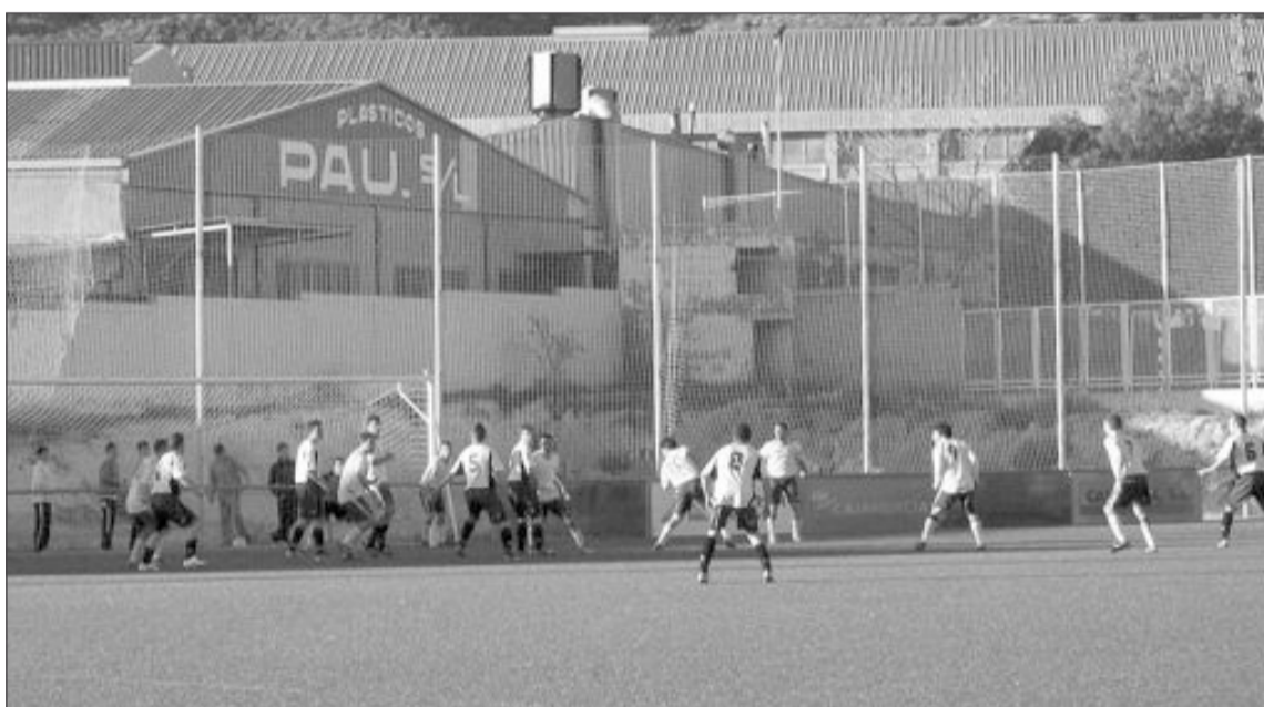
La Peña Madridista de Ibi se enfrentó al Aiello de Malferit en el Estadio Vilaplana Mariel