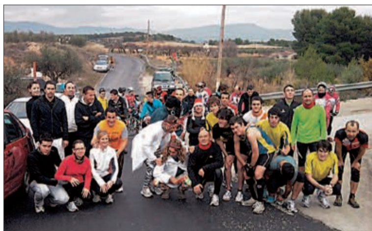
A la izquierda, participantes de Castalla, y a la derecha los de Onil, todos dispuestos a participar en una divertida carrera de San Silvestre