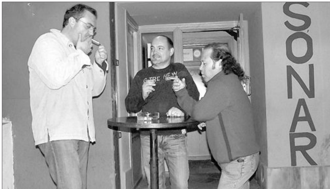
La ley antitabaco obliga a los consumidores a salir a fumar a la puerta de los locales

La ordenanza municipal permite pedir licencia por un periodo de seis meses y solicitar su renovación para los seis meses restantes, lo que a todos los efectos, explica el teniente