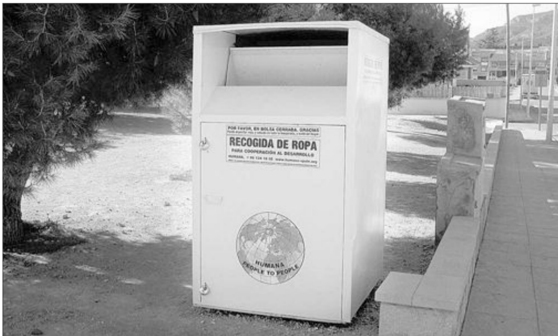
Uno de los cinco contenedores de la ONG Humana está instalado cerca del colegio San Jaime