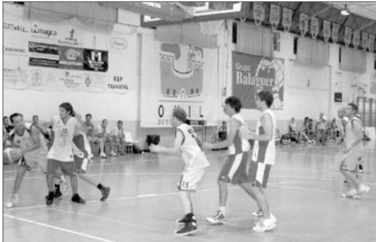
El CD Onil Sénior 'A' durante un partido en casa

Sénior 'B' se impuso claramente al Nou Bàsket Alcoi por 90-61.