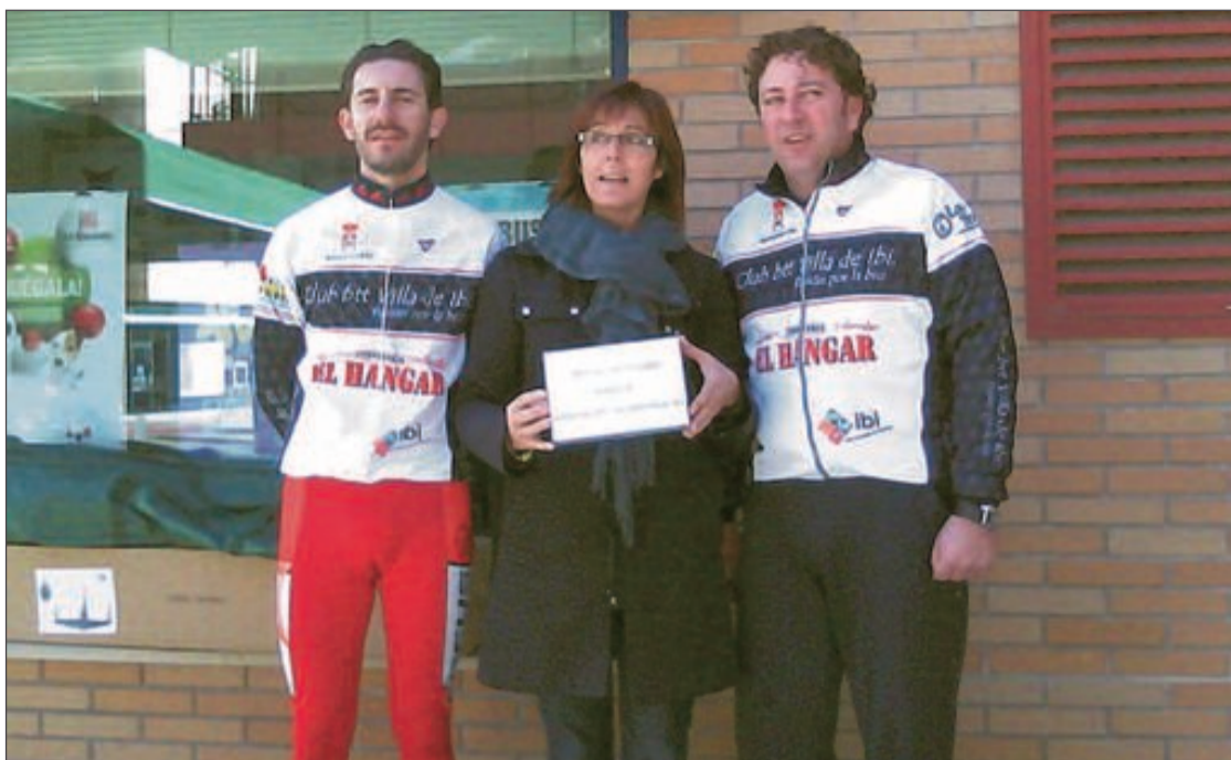
Los organizadores de la prueba, del Club BTT Neolux, junto a la presidenta de la Asociación de Alzheimer de Ibi