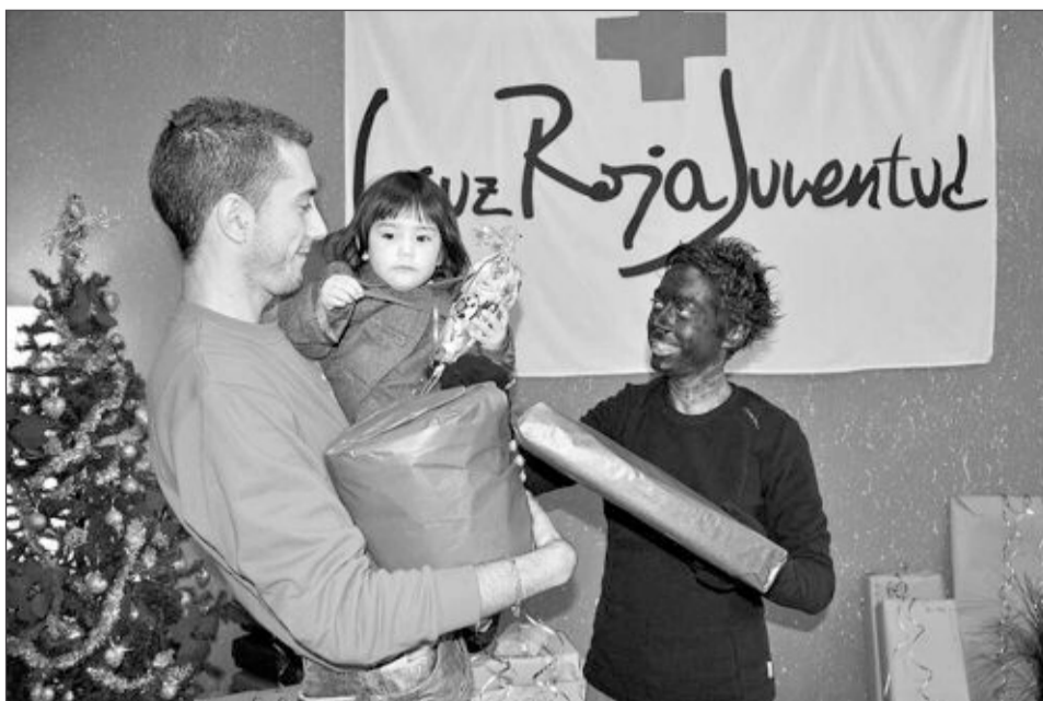
El programa de ayuda contra la pobreza se inició en el mes de octubre