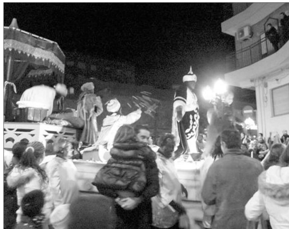
Carroza del Rey Baltasar, una de las más concurridas durante toda la Cabalgata