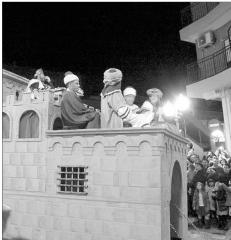
El Club de Atletismo Teixereta se hizo cargo de la comitiva del rey Herodes y Amics de les Muntanyes, del nacimiento y los pastores