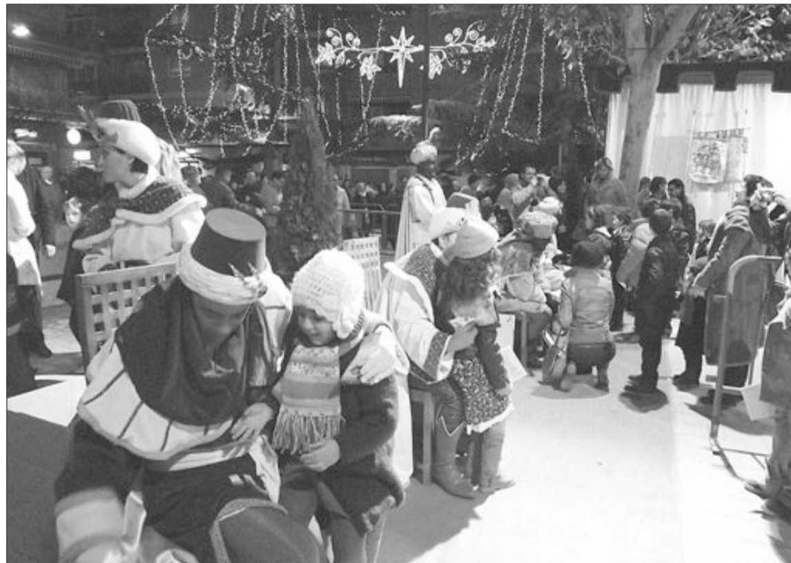
La Asociación amplió este año el número de pajes para la recogida de cartas, que se situaron junto al monumento