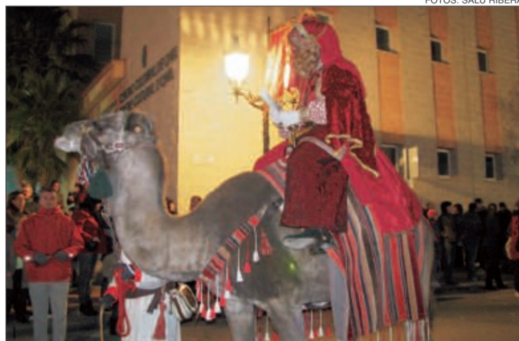
El Heraldo recogió las cartas de los niños el 4 de enero (Día del Paje)