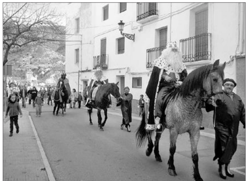
Son recibidos por la mañana para recoger las cartas de los pequeños