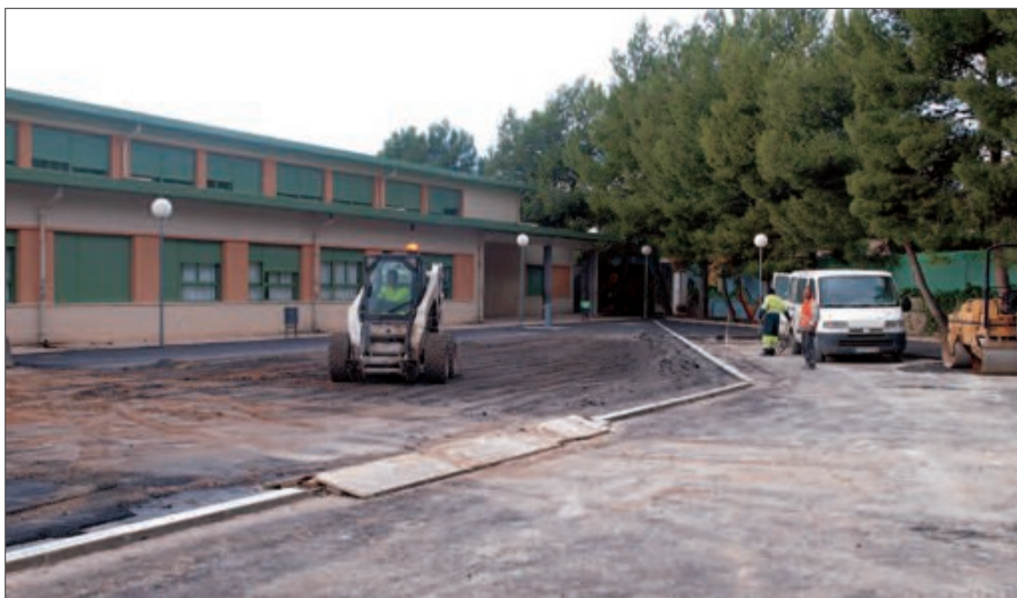
Las obras de canalización y asfaltado evitarán los charcos de agua y placas de hielo que se formaban

La Conselleria ha invertido cerca de tres millones de euros en este centro escolar, el más antiguo de la localidad con 75 años de existencia, adecuándolo a las nuevas normativas educativas.