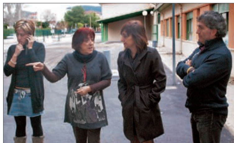
La alcaldesa y la concejal de Educación visitaban esta semana las obras

Finalmente, el proyecto que se está ejecutando, a petición de los padres de alumnos, es el de un sistema de recogida de agua por debajo del patio. Se abrió una zanja para colocar los tubos que canalizarán toda el agua de lluvia que caiga en el patio y que la llevará directamente a las alcantarillas. Ahora se está procediendo al asfaltado del patio para evitar definitivamente los charcos de agua y las placas de hielo que se formaban en el patio del centro.