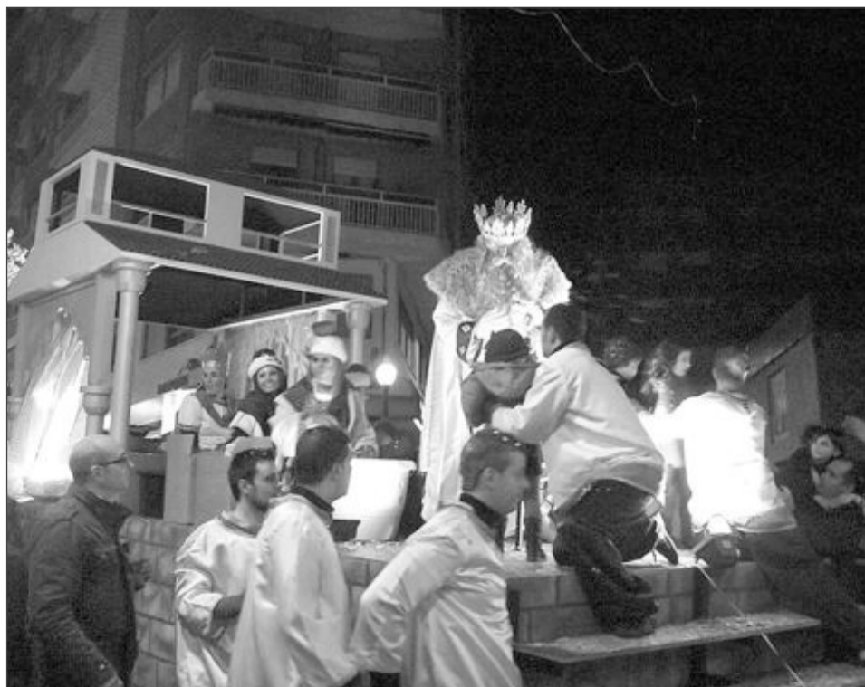
Carroza del Rey Gaspar, que estuvo acompañado por familiares y amigos