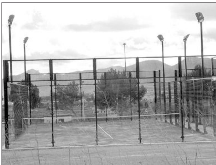
Las dos pistas de pádel se encuentran en la zona deportiva

Ya han acabado las obras de construcción de dos pistas de pádel en la zona deportiva, que podrán comenzar a ser usadas a partir del viernes día 14. El concejal de Deportes, Salvador Vila, explicó a ESCAPARATE que para reservar alguna de las pistas hay que llamar al conserje con un día de antelación. El número de teléfono está en el Polideportivo y en la zona deportiva.