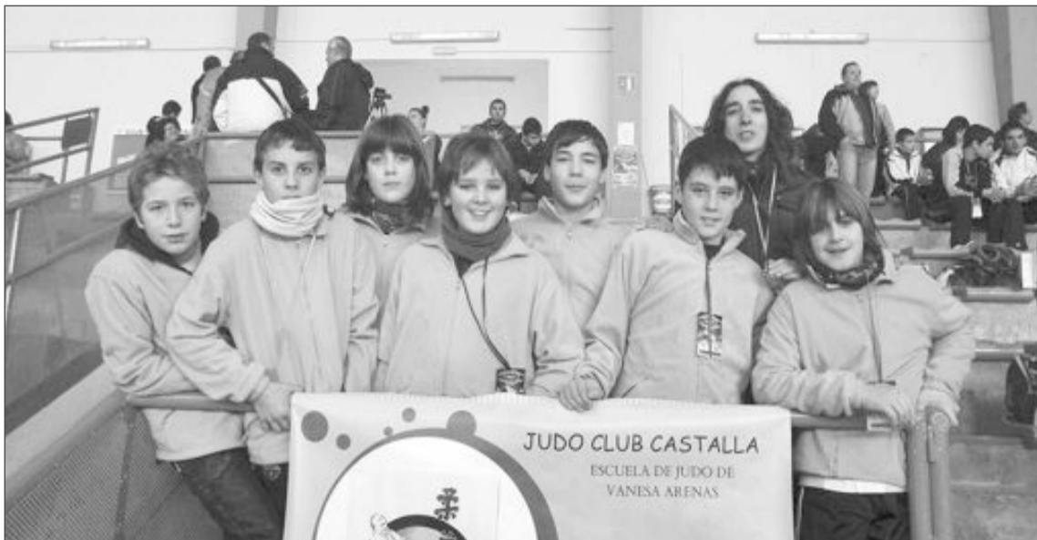
Los alumnos del Judo Club Castalla que participaron el 8 de enero en la Copa de España, junto a su entrenadora

IBI: Domingo 16 de enero.- Respira Natura: DE SANTET EN SANTET. Salida: La Tartana, a las 8'30 h.