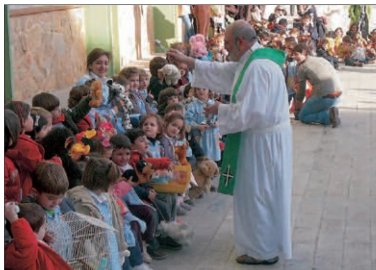
Un sacerdote bendice las mascotas de los escolares