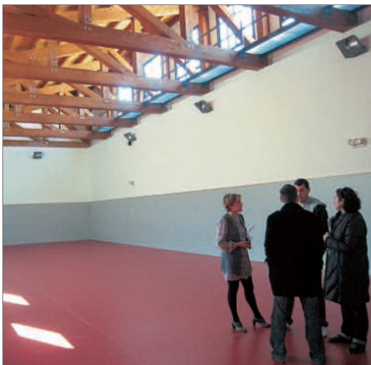
Se ha construido un gimnasio, aulas de Infantil y una pista deportiva