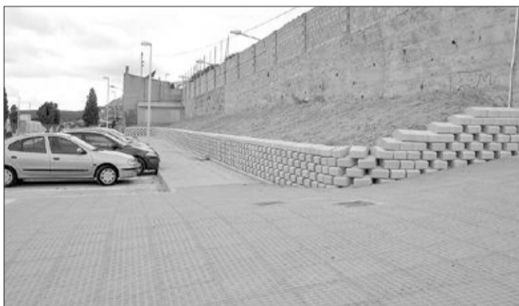
Arriba, los operarios rematan el módulo de vestuarios en el campo de fútbol. Abajo, las aceras que bordean este recinto deportivo, ya terminadas