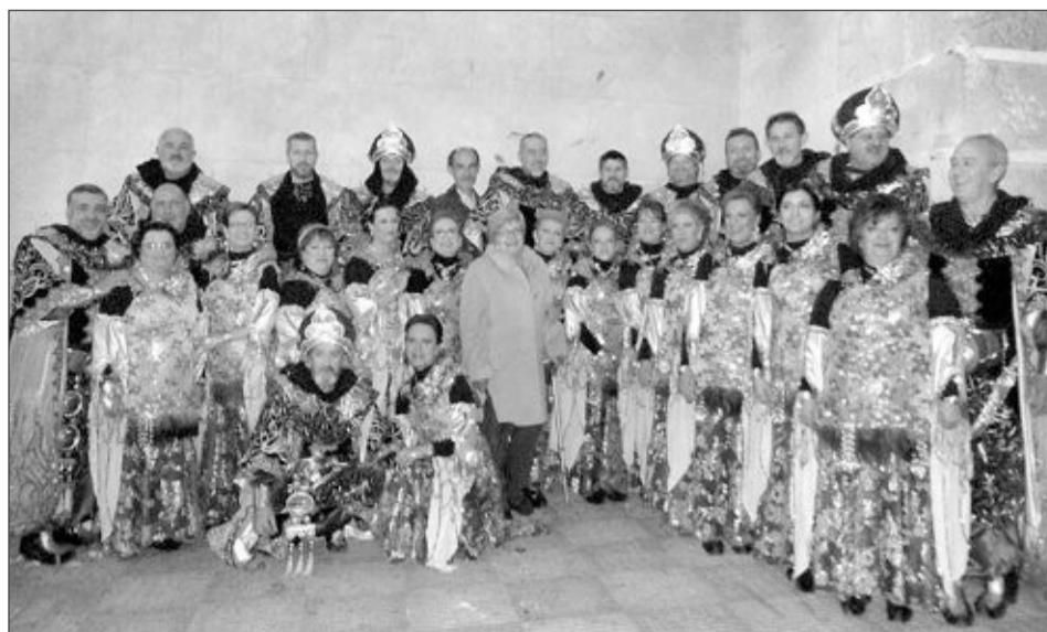
Catorce parejas integraron el Reinado Moro de este año