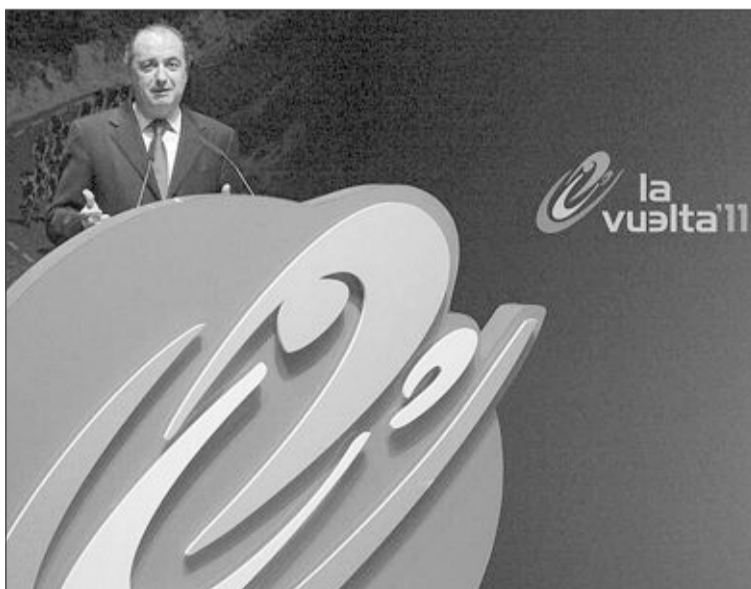
El presidente de la Diputación, José Joaquín Ripoll, durante la presentación

La ciudad de Benidorm acogerá, por tercera vez en su historia, la salida oficial de la ronda española con una contrarreloj por equipos. La carrera vuelve a la localidad alicantina con una etapa de 16 kilómetros.