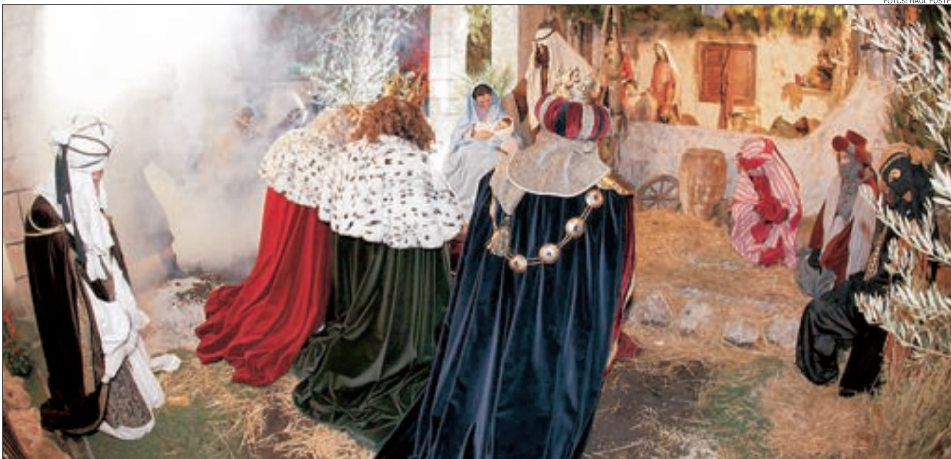
Los tres Reyes Magos adoraron al Niño Jesús en el pesebre instalado en la plaza de la Font Vella