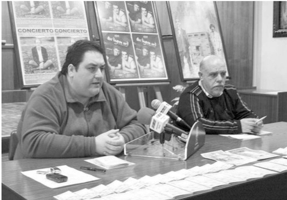
Trimestralmente, el concejal de Cultura de Ibi y el coordinador del Centro Cultural presentan la programación