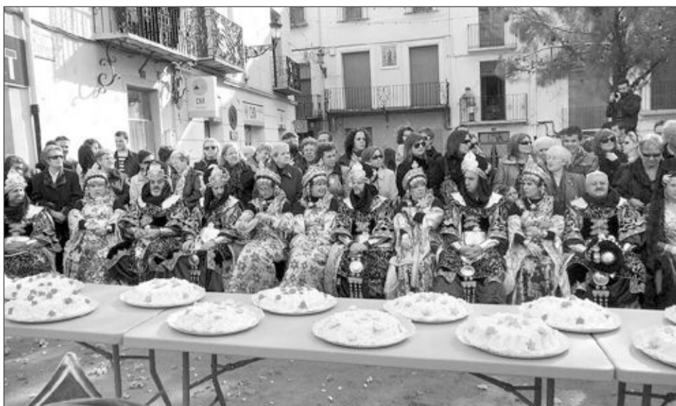
Subasta de tonyes del Reinado Moro