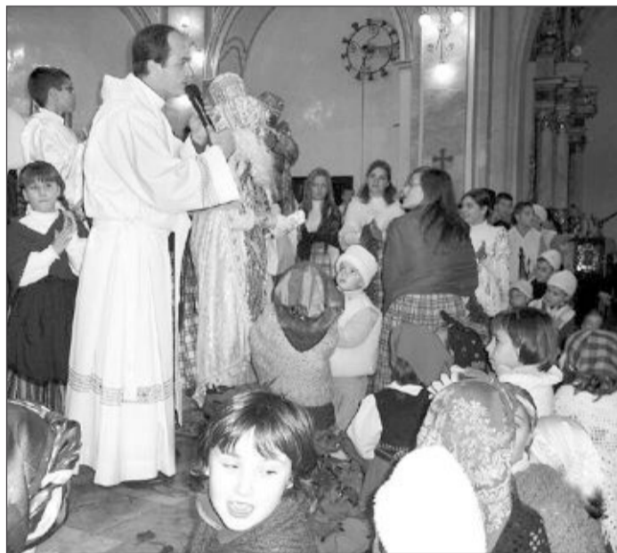
En la Iglesia, los Reyes Magos celebran la Adoración al Niño