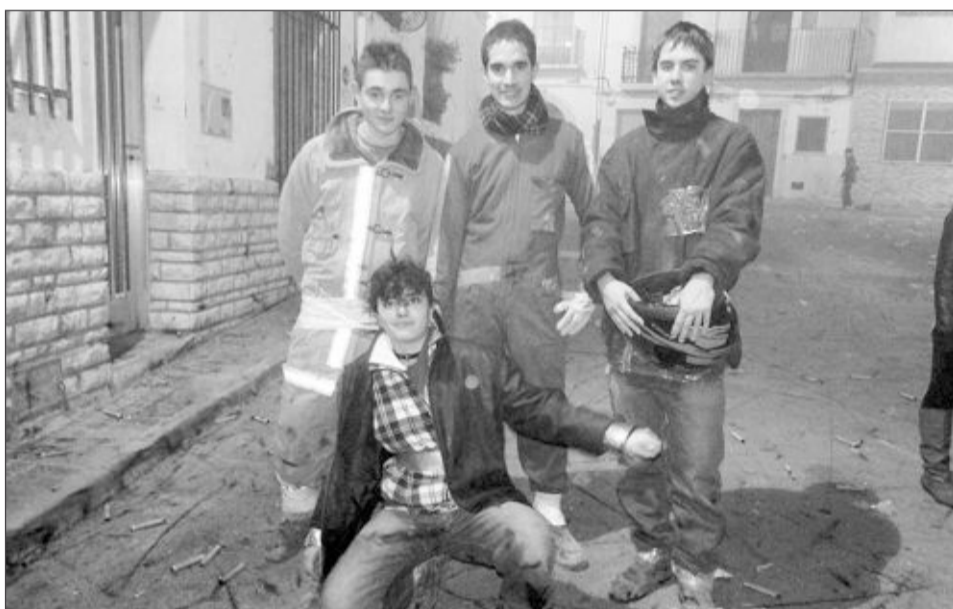
Integrantes del Reinado Cristiano en el acto del Pregón