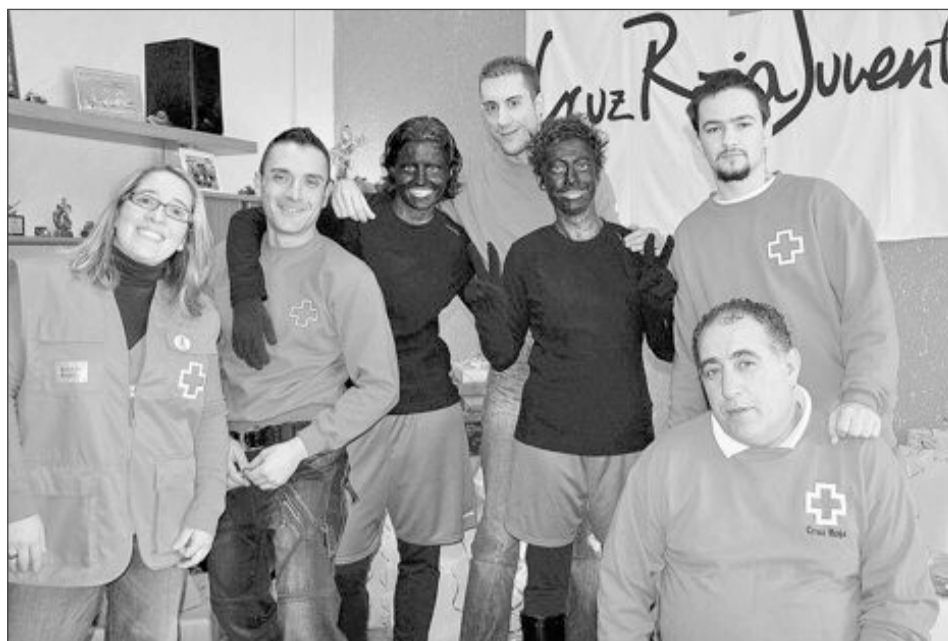
Han participado varias empresas jugueteras y los voluntarios de la asamblea local